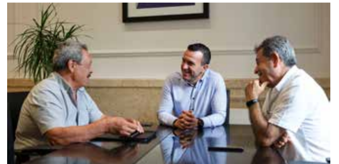
Reunión en la Diputación de Valencia.