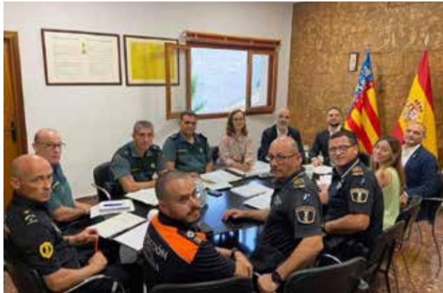
Junta Local de Seguretat de Nàquera.

Durant la reunió, es va realitzar una anàlisi detallada de la situació de seguretat en el municipi, incloent-hi l'evolució de la delinqüència i els tipus de delictes més freqüents. L'estudi va perme-