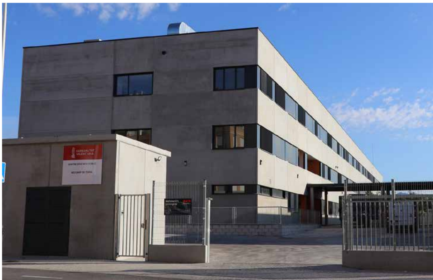
El nou Institut Camp de Túria va obrir les seues portes el passat 9 de setembre.

No obstant això, el procés no ha sigut senzill. La