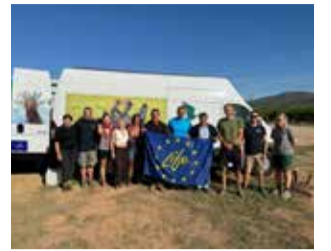
Waldrappteam. / EPDA