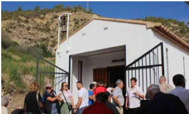
Inauguración de la Ermita de la Santa Cruz.

Tras la bendición de la nueva ermita, decenas de asistentes disfrutaron de la exquisita interpretación de una saeta