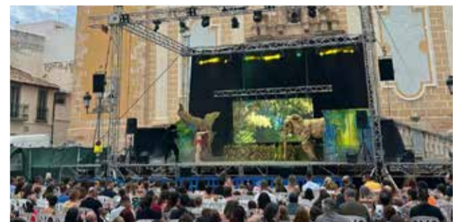
Diferentes actos de las Fiestas Patronales de Benaguasil 2024.