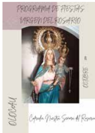
Portada del programa.

En paraules de l'alcalde, Antonio Roperó, la celebració de les Festes en honor a la Patrona d'Olocau "és un dels moments més especials i sentits de l'any en la nostra localitat i, des de