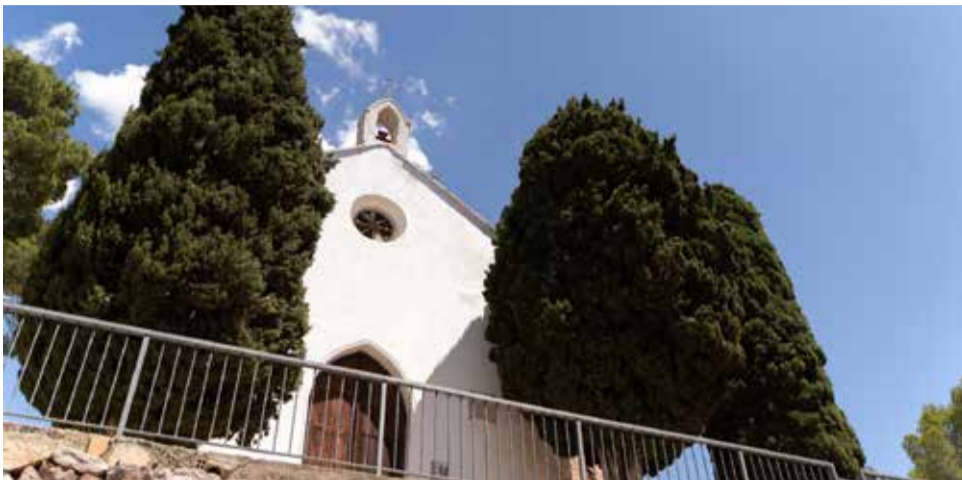
Ermita de Sant Josep i la Creu de Serra.