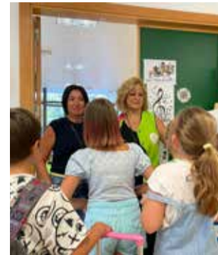
Escola matiner.