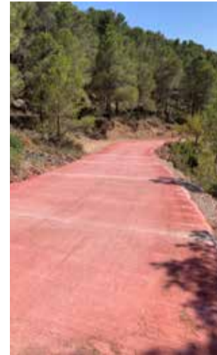
Camí de Sentig.

Quant a la prevenció d'incendis forestals, s'ha construït una llosa de formigó en un tram de pendent del Camí de Sentig i s'ha dut a terme la