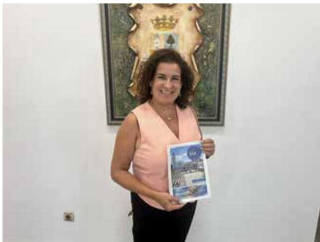
L'alcalde presenta el núm. 1 del BIM SAB.

Durant la temporada estival, prop de 5.000 exemplars han sigut distribuïts mitjançant bustiada en els