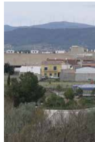
Vista de Casinos.

La creació d'un cos de Protecció Civil és totalment nova a Casinos, i això supo-