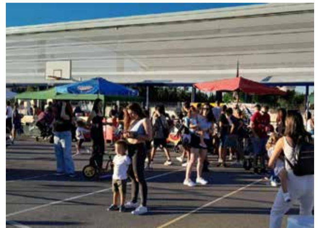
Edició anterior de la Festa de la Creïlla.

Així mateix, els assistents podran disfrutar de punts de venda amb productes artesanals i xiringuitos amb