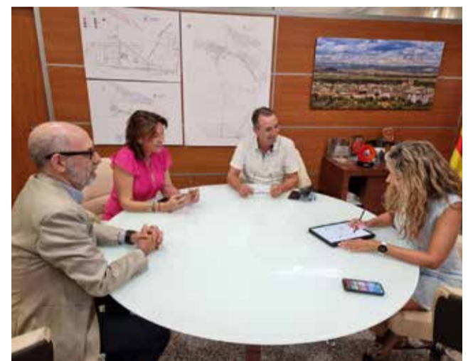
Un instante durante la firma del convenio.

En 2023 un total de 313.808 usuarios y usuarias utilizaron el servicio público municipal de transporte; tanto el Arribabús como las líneas de Conecta Metro, del casco y urbanizaciones, que facilita diariamente el acceso a las diferentes estaciones de Metrovalencia con comunicación con la ciudad de Valencia y su área metropolitana.