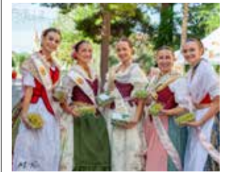
Reina i Cort. / EPDA