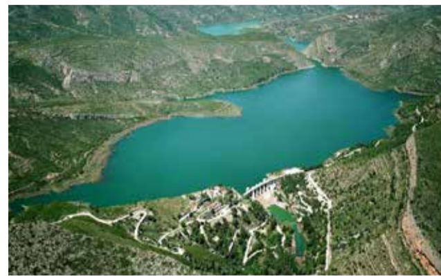
Vista aérea del Pantano de Loriguilla.