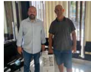
Nou contenidor.