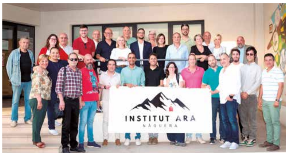
Plataforma 'Institut Ara' de Nàquera i Serra.