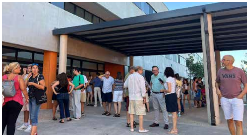
Jornada de portes obertes al nou IES Camp de Túria.

ubicació del nou institut en una zona arqueològica de gran valor històric ha suposat un repte addicional en les obres, que s'han allargat més del que es preveu. No obstant això, malgrat els contratemps, el nou institut ha pogut complir amb els