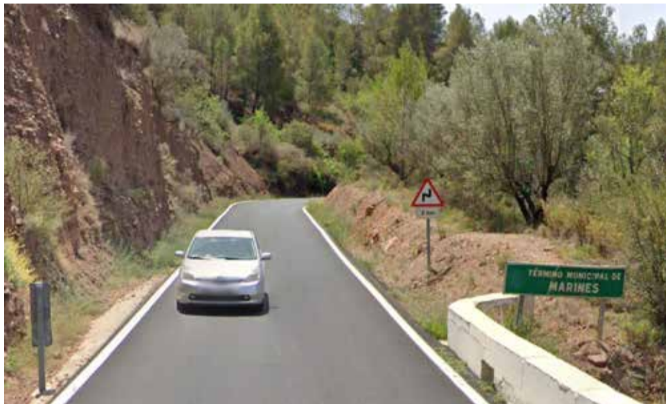
Un vehículo circula por la CV-25 entre Marines y Gátova.

El presidente de la Diputación de Valencia, Vicent Mompó, indica que "favorecer la movilidad entre municipios rurales es clave para fijar población, especialmente en comarcas en las