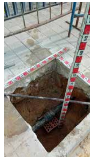
Treballs.