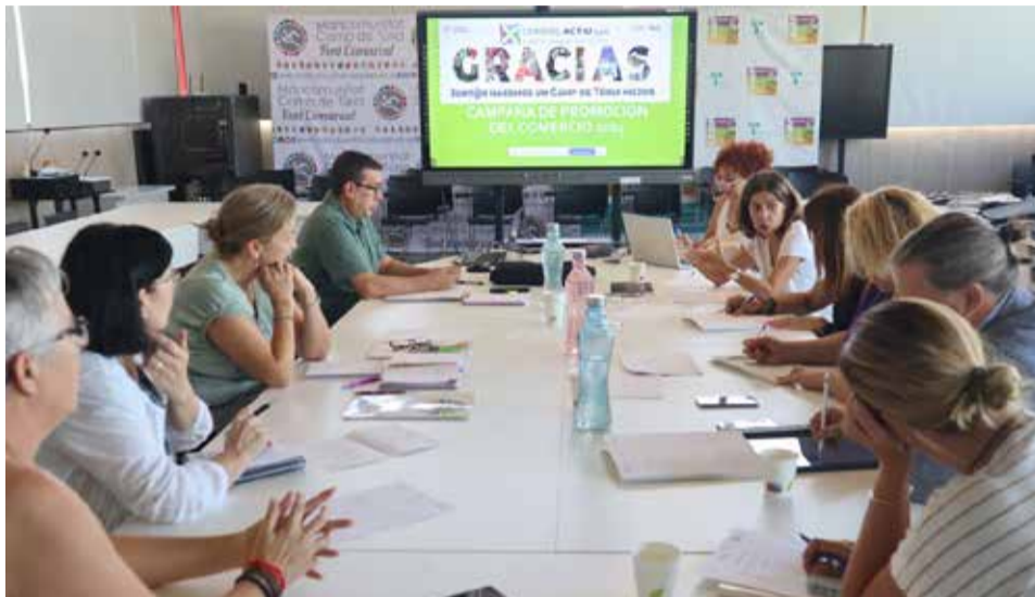
Reunió entre el PACTE Camp de Túria i Comerç Actiu en la mancomunitat.

L'objectiu de la reunió va ser conèixer de primera mà les necessitats del sector comercial de la comarca, així com preparar les pròximes accions de màrqueting que es duran a terme gràcies a les subvencions rebudes per la Generalitat i AFIC. Durant la