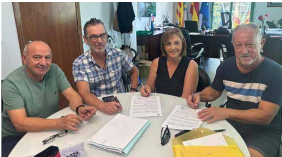
Un instante durante la firma del convenio en el Ayuntamiento de Marines.