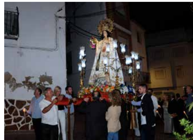
Procesión en honor a la Virgen de la Merced 2023.

La programación para las fiestas incluye actividades tradicionales y nuevas incorporaciones que aseguran diversión y entretenimiento para todas las edades. Los eventos destacados incluyen la tradicional puesta de banderas a lo largo del recorrido de la procesión, concursos variados, y un programa