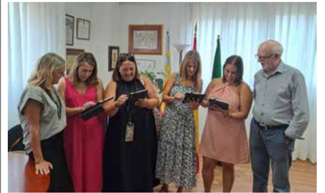
Entrega de las tablets a las escoletas.