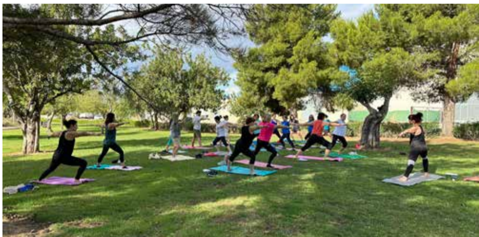
Edición anterior de 'Salut al teu barri' en el parque del polígono Les Eres.