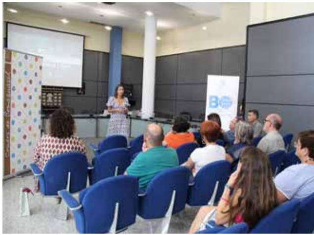
Presentación de la campaña de bonos comerciales.

Esta iniciativa comercial pondrá en circulación bonos por importe de 10, 20, 50 y 100 euros, que se podrán gas-