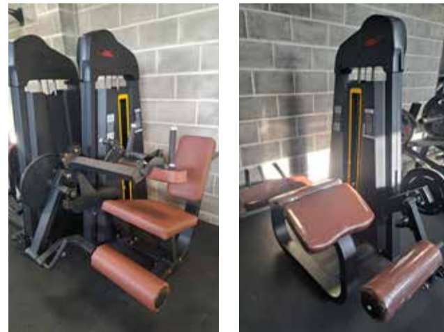
Nuevas máquinas en el gimnasio de Loriguilla.

Entre las nuevas adquisiciones se encuentran una máquina de cuádriceps, una de press vertical, una para deltoides, máquina de femoral sentado y dos nuevas cintas de correr. Además de las nuevas incorporaciones, el Ayuntamiento ha aprovechado para ajustar y reparar la máquina multipower, una de las más populares entre los usuarios.