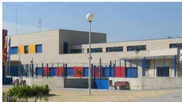
CEIP de Benissanó. / EPDA