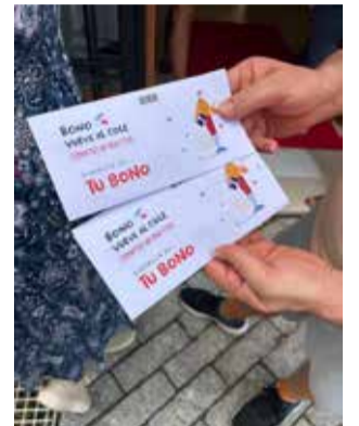
Bo comercial.

L'Ajuntament de Riba-roja de Túria ha implementat una important iniciativa per a fer costat a les famílies amb xiquets i xiquetes, especialment en Educació Infantil, Primària i Secundària, en la compra de material escolar. Les famílies s'han beneficiat del nou "Bono Torna al Col·le amb el Comerç de Riba-roja", una targeta amb un valor de 65 euros, que pot ser utilitzada en comerços locals fins al 31 d'octubre de 2024. Esta mesura, que substitueix a l'antic "col·le xec", ha simplificat el procés de tramitació per a les famílies i a més beneficia directament als comerciants locals permetent rebre l'import gastat directament en els seus establiments a través del pagament amb targeta. Amb 165.000 euros de pressupost municipal, el bo s'ha desenvolupat a través de les àrees d'Educació i Comerç,