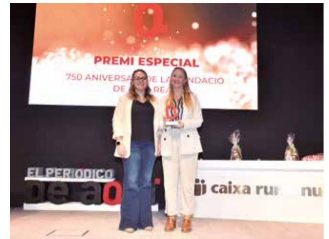
Premi Especial a l'Ajuntament de Vila-real. / P.G.