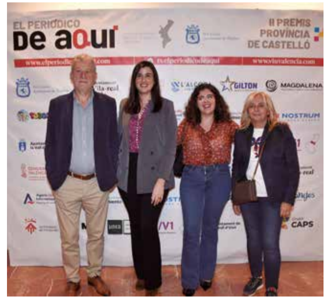
Diferents instants del 'photocall' dels II Premis de El Periódico de Aquí Província de Castelló.