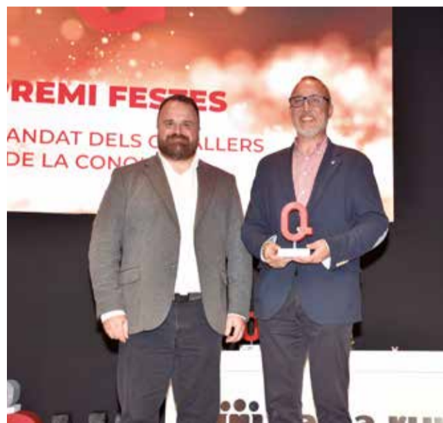
Premi Festes als Cavallers de la Conquesta. / P.G.