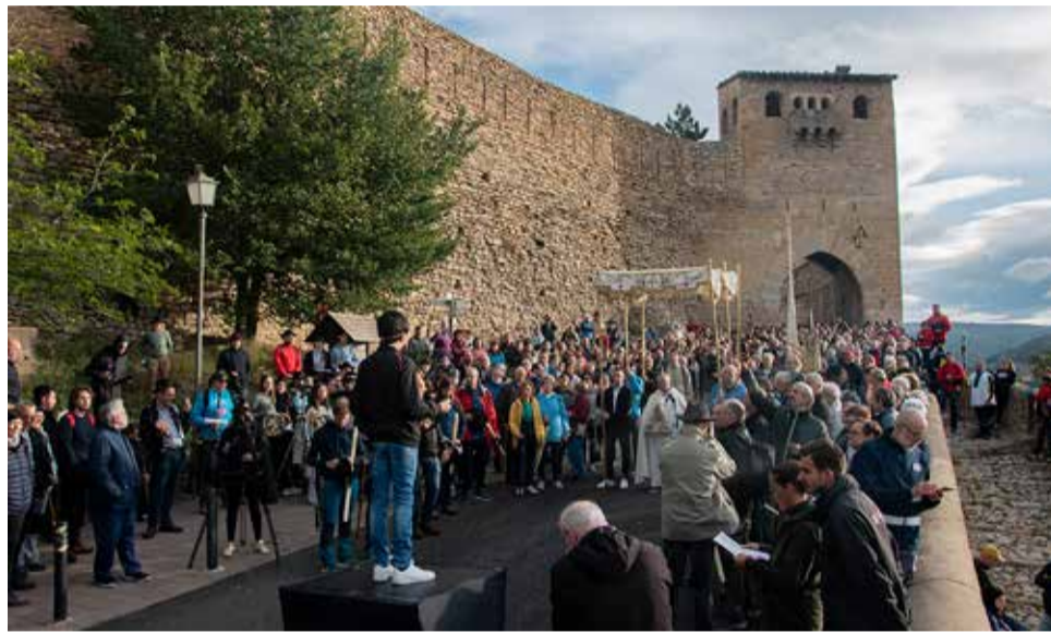
Rogativa de baixada de la Mare de Déu de Vallivana de Morella.