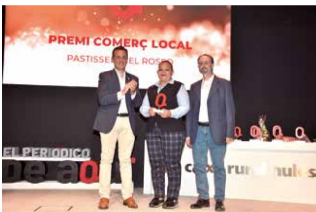
Premi Comerç Local a la Pastisseria El Rosso.