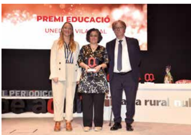
Premi Educació a la UNED Vila-real.