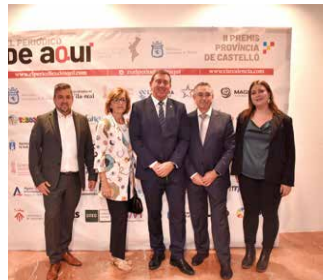
Diferents instants del 'photocall' dels II Premis de El Periódico de Aquí Província de Castelló.