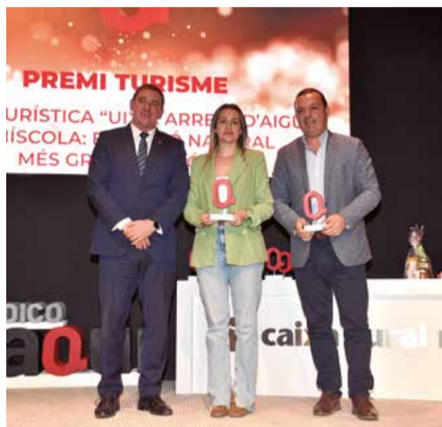
Premi Turisme a la Vall d'Uixó i Peníscola.