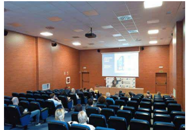
Jornada sobre intel·ligència artificial.