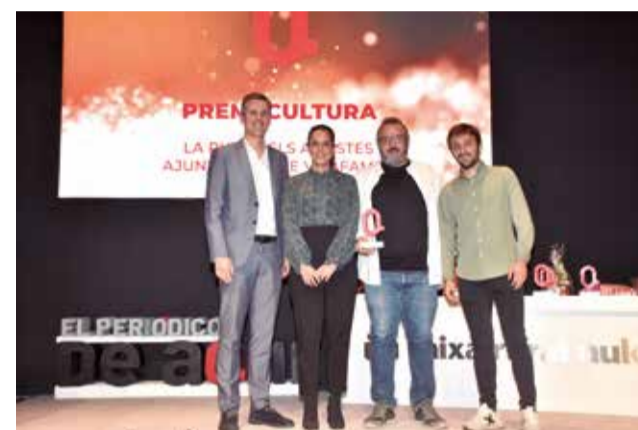
Premi Cultura a l'Ajuntament de Vilafamés.