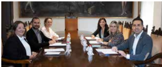
Reunions amb els partits de l'oposició.

te tema, en els comptes provincials, que es troben en plena elaboració, es veuran reflectides partides destinades a reforçar l'atenció directa a les persones, a continuar impulsant els municipis, a la dinamització del territori, a gene-