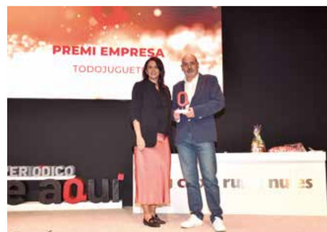
Premi Empresa per a Todojuguete. / P.G.