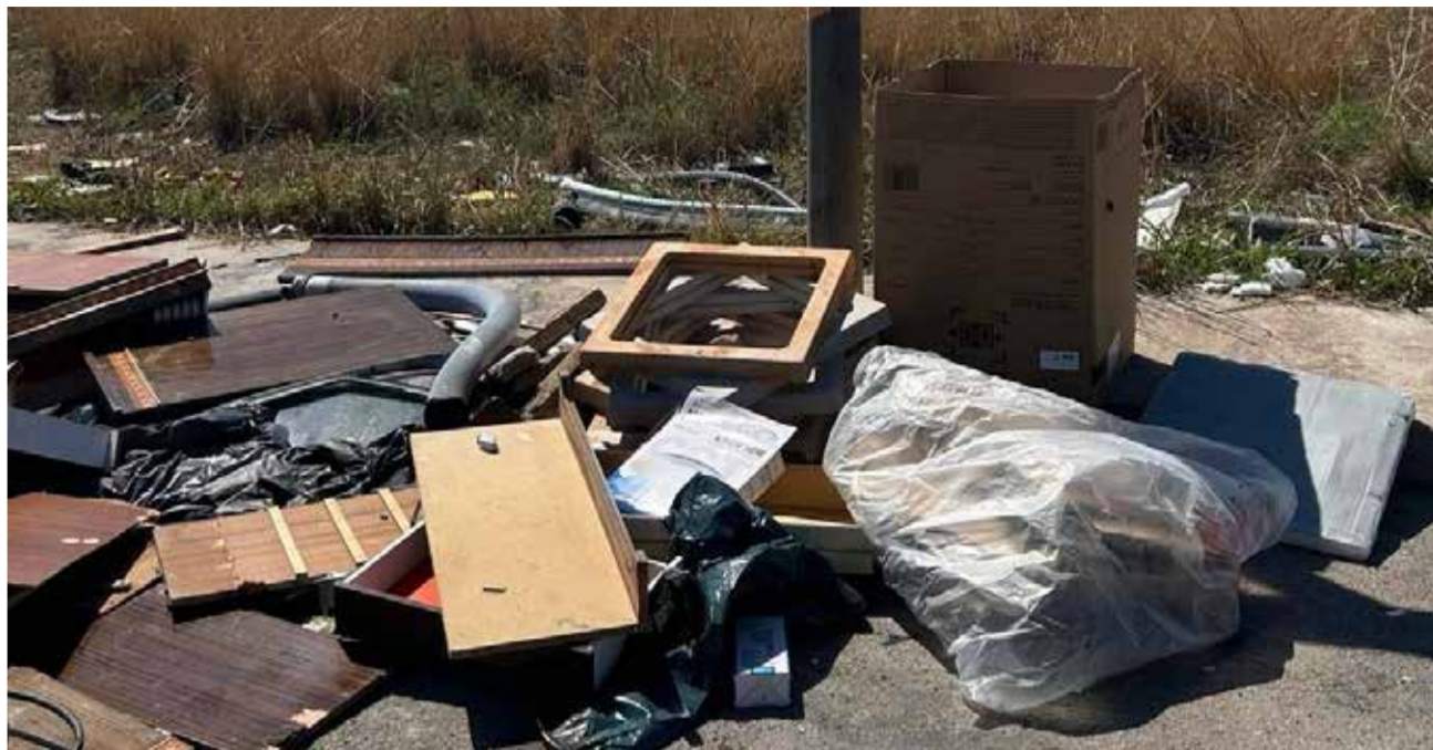
Vertedero ilegal en una zona de las afueras de la ciudad de Castelló de la Plana.

Un ejemplo es la utilización de los tres drones con los que cuenta la Unidad de Protección Medioambiental y Animal de la Policía Local (Uproma), drones "que hay que recordar fueron adquiridos por el anterior gobierno socialista". Lainez ha señalado que "hemos reclamado durante meses un informe sobre el uso que se está dando a