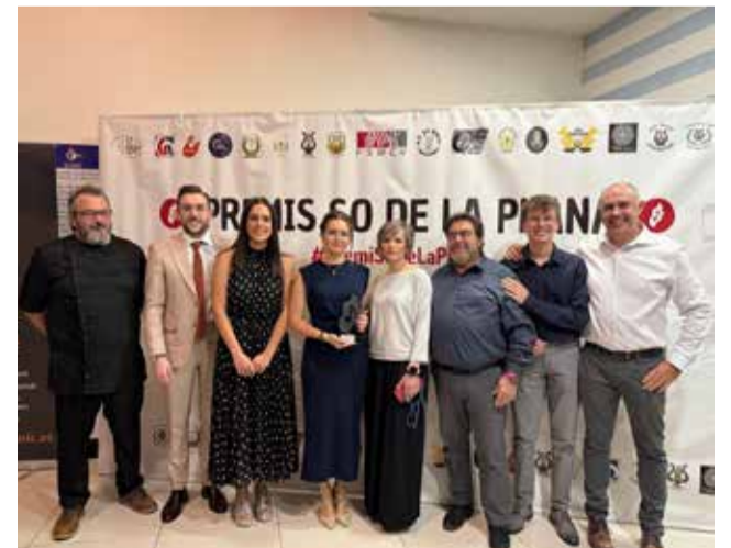
Representantes de Vilafamés y la Lira.

La formación musical centenaria, que pertenece a la Asociación Cultural La Roca, forma parte de los principales actos festivos y lúdicos del año en el municipio.