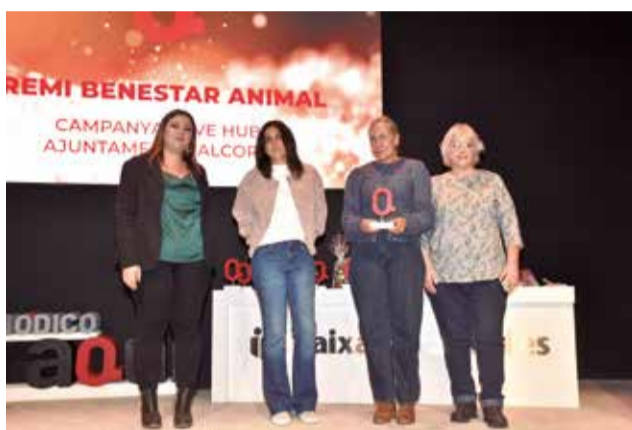
Premi Benestar Animal a l'Ajuntament de l'Alcora. / P.G.