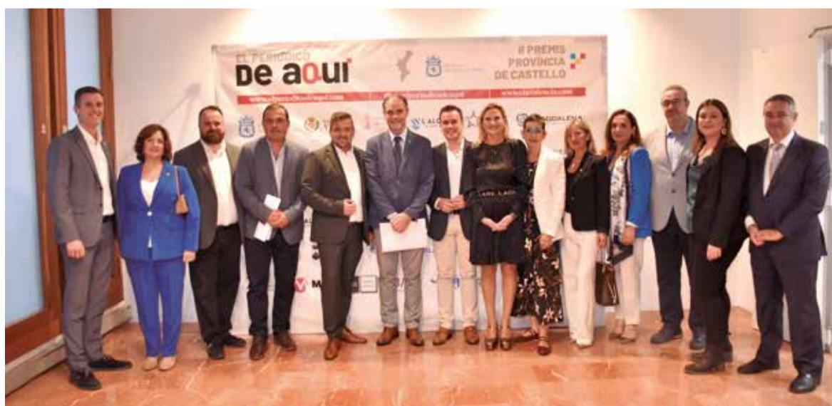
Diferents instants del 'photocall' dels II Premis de El Periódico de Aquí Província de Castelló.