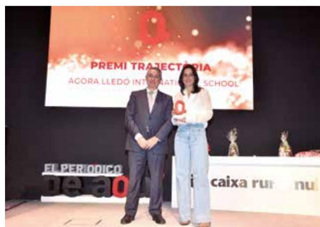
Premi Educació al Ágora Lledó International School.