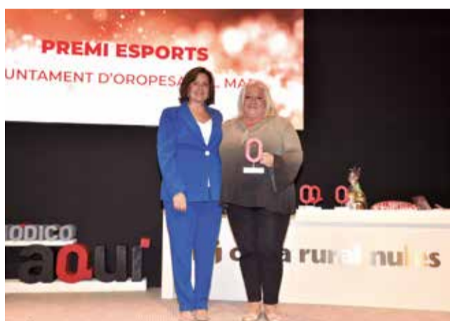
Premi Esports a l'Ajuntament d'Orpesa. / P.G.