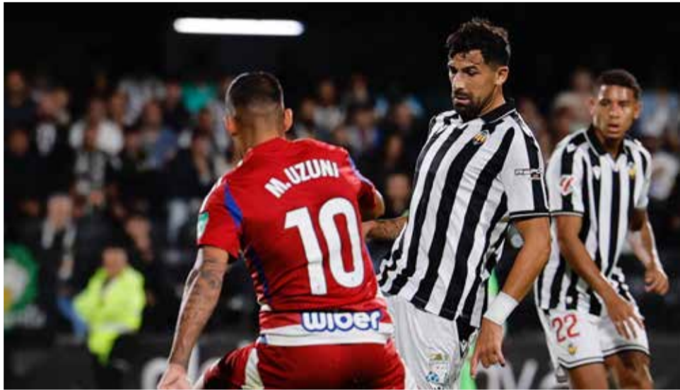
Imagen de archivo de un partido en el SkyFi Castalia.

La parte defensiva, que no únicamente es tarea de la defensa, porque el Castellón cuando defiende lo suele hacer en bloque bajo y acompañando con alguno de los centrocampistas. Pero el equipo de