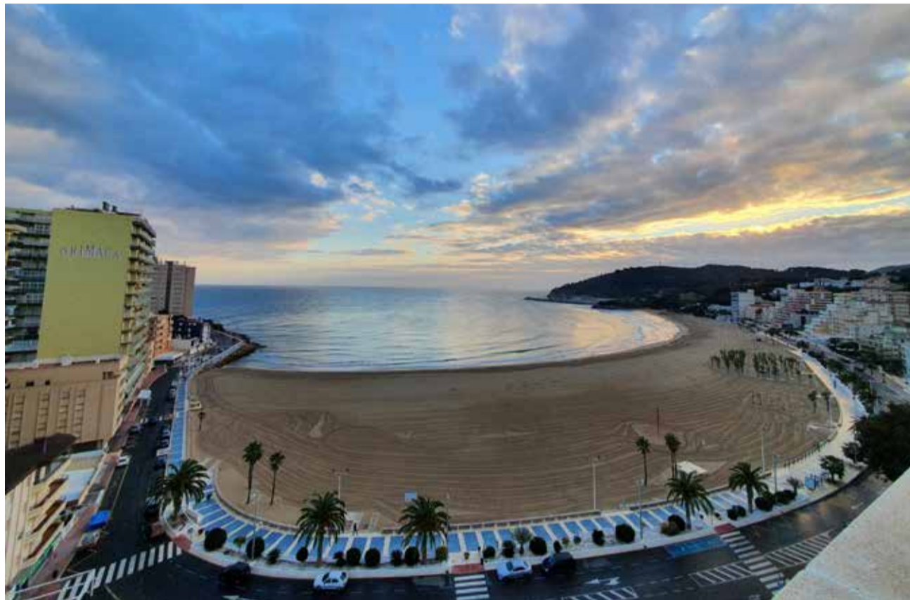
Una playa de Oropesa del Mar.

Con el objetivo de mejorar la seguridad en sus playas, el Ayuntamiento de Oropesa del Mar ha decidido llevar a cabo la elaboración de un proyecto técnico que incluirá la dirección facultativa y la coordinación de la seguridad y salud para la instalación de un total de postas de salvamento y cinco torres fi-