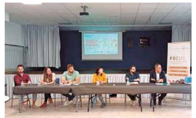
Un instante durante la jornada en Cirat.