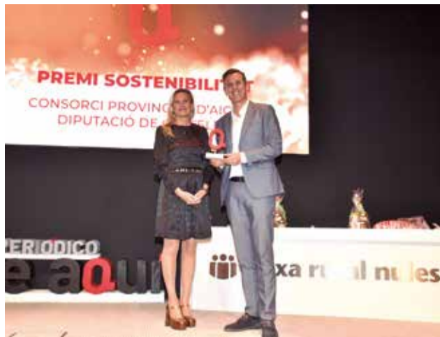
Premi Sostenibilitat a la Diputació de Castelló.

La gala va finalitzar amb una actuació del cantant Serafín Zubiri, gentilesa d'Espectacles Gilton, que va posar a tot el públic a cantar diferents temes mítics, especialment de Nino Bravo. Després d'esta musical pausa, El Periódico de Aquí va sortejar, en col·laboració amb el balneari de Montanejos, Airnostrum, l'Associació Nuleta i la Pastisseria El Rosso, diferents lots de productes, així com dos bons per al balneari i un vol per a dos persones. En finalitzar l'acte, els assistents van disfrutar, a més, d'un vi d'honor, gentilesa de l'Ajuntament de Nules.