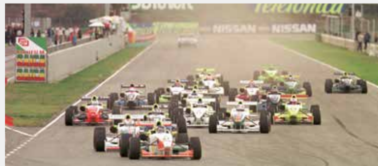
Imágenes para la historia del circuito.