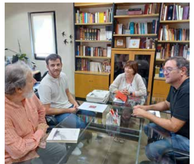
Un instante durante la reunión.

El Ayuntamiento mantiene una reunión de trabajo con la presidenta de la institución