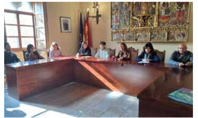
Inauguració de la trobada.