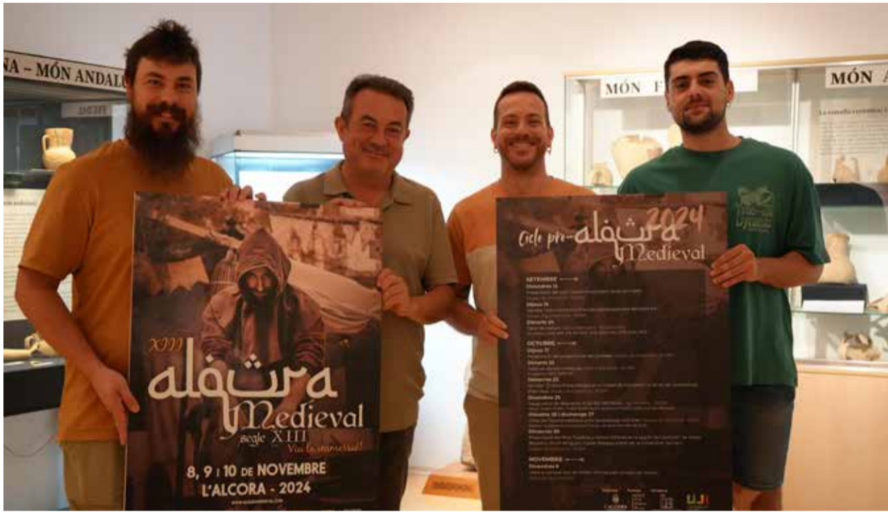
Presentació del cartell de les jornades Al-qūra Medieval. / EPDA