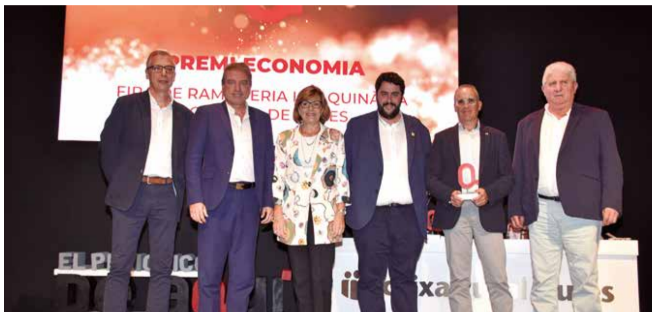
Premi Economia a la Fira de Ramaderia i Maquinària Agrícola de Nules.