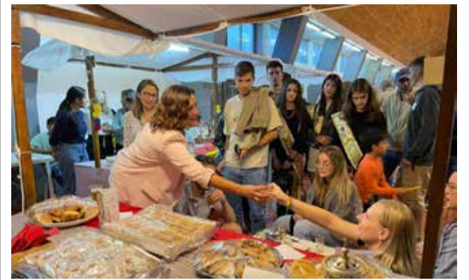
Fira de l'Ametla d'Albocàsser.