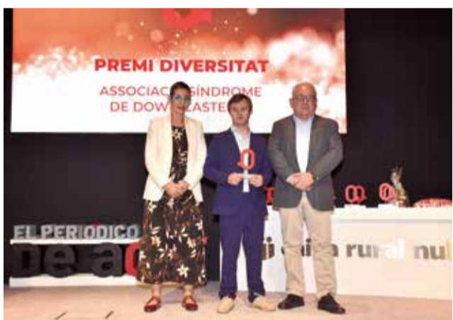
Premi Diversitat a Síndrome de Down Castellón.