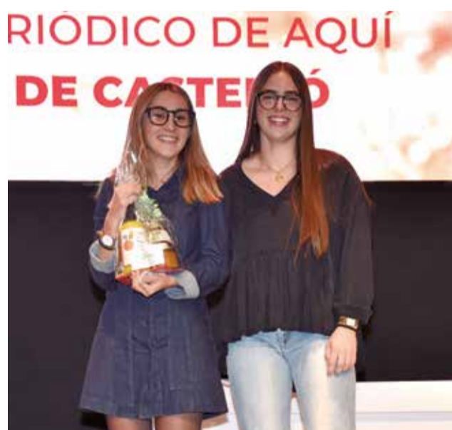
Guanyadors de la rifa, en col·laboració amb Airnostrum, el Balneari de Montanejos, l'Associació Nuleta i la pastisseria El Rosso de Nules. / P.G.