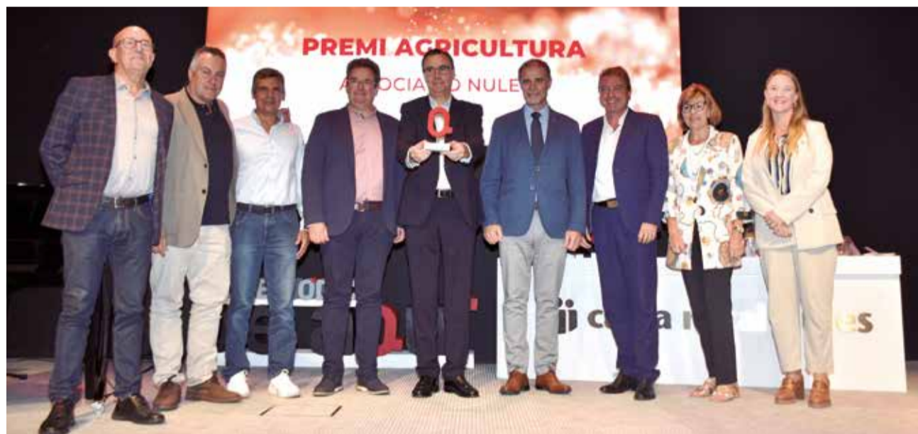
Premi Agricultura a l'Associació Nuleta. / P.G.