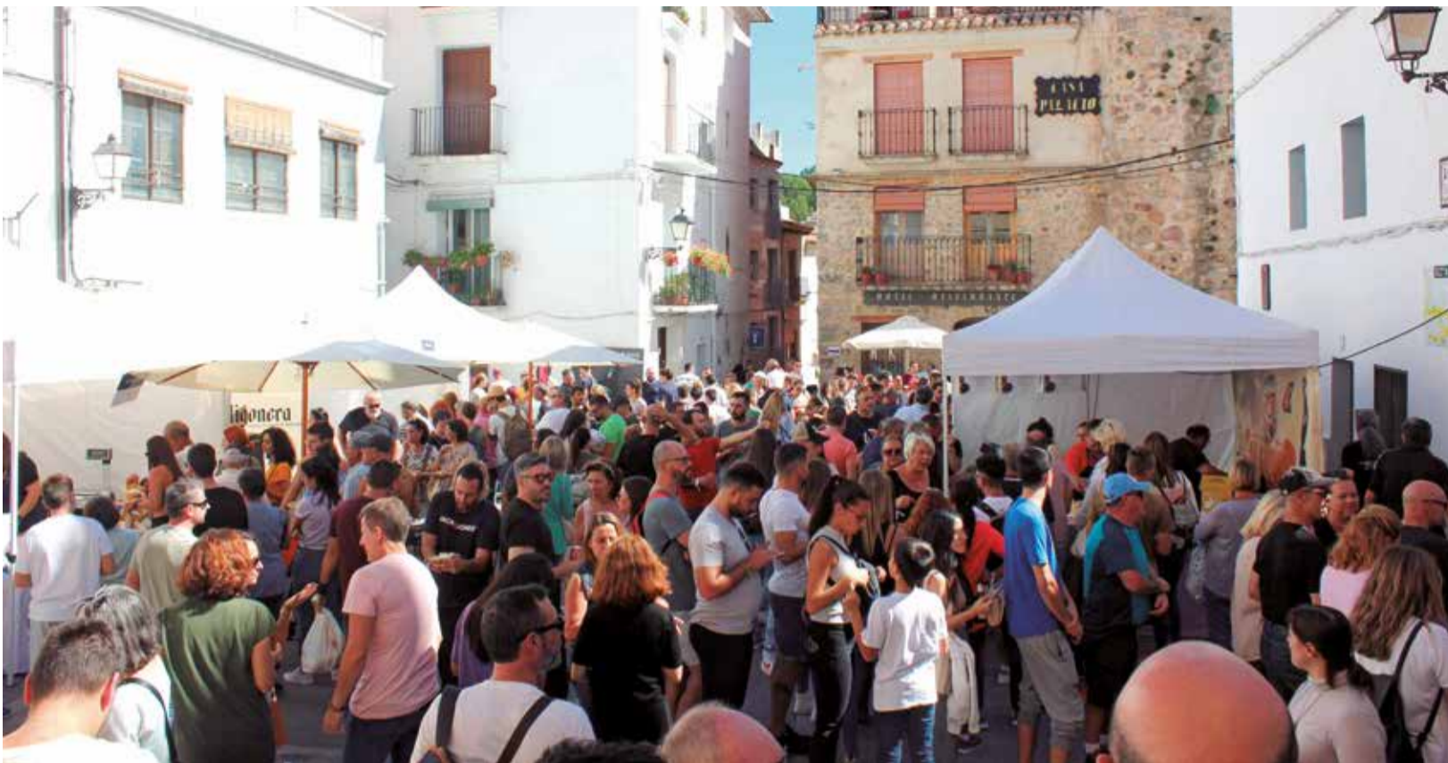
Imagen de la jornada en Montanejos.

■ MÁS DE 8.000 PERSONAS ASISTIERON A LA TRADICIONAL FERIA CELEBRADA EN LA LOCALIDAD DEL ALTO MIJARES