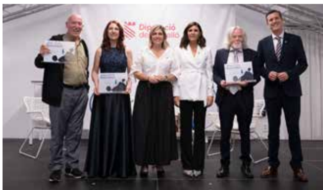
Entrega de guardons al Moll Costa del Grau.