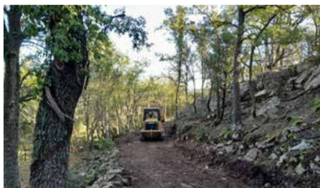
Treballs en les pistes forestals de Morella.

La primera actuació ha consistit a arreglar la pista que va des de la carretera de Morella - Vallibona, la CV-111, al mas Basseta, fins al mas Jovaní en direcció al camí rural de Palos. Per un altre costat, es connectaran actuacions passades en la Torre Enguaita amb la zona de la Carcellera per la protecció d'este enclavament