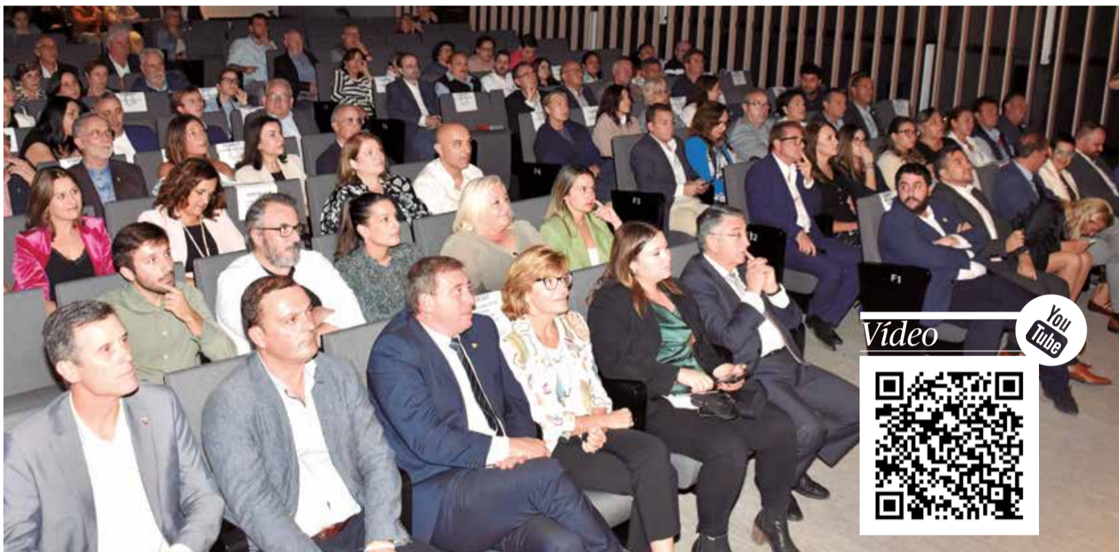
Autoritats i públic en la segona edició dels Premis Província de Castelló de El Periódico de Aquí, celebrats a Nules.

EL SALÓ D'ACTES DE LA CAIXA RURAL DEL MUNICIPI VA ACOLLIR LA CITA, EN LA QUAL ES VA FER ENTREGA DE 17 GUARDONS EN DIFERENTS CATEGORIES A INSTITUCIONS, ENTITATS, ASSOCIACIONS I EMPRESSES DE LES DISTINTES COMARQUES