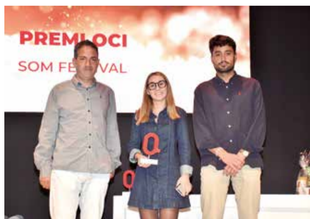
Premi Oci al SOM Festival. / P.G.