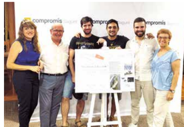
Membres de Compromís per Sagunt.