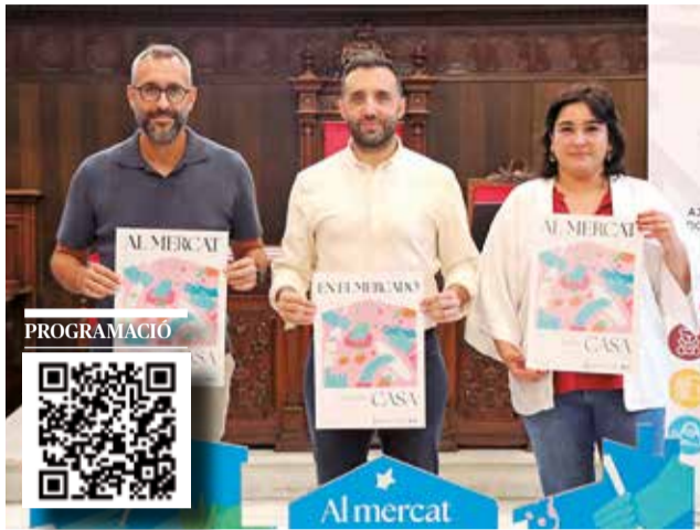
Presentació de la iniciativa.

La campanya 'Al mercat com a casa' compta amb la col·laboració de SUC Estudio i inclou tallers i activitats per als xiquets i xiquetes de la ciutat. Per als més menuts, s'han organitzat activitats com el Taller CreActiu per a xiquets i xiquetes de 4 a 10 anys, que se celebrarà en diferents dates tant al mercat interior de Sagunt com al del Port de Sagunt. Aquest taller ofereix una proposta manipulativa en la qual es treballarà amb productes de