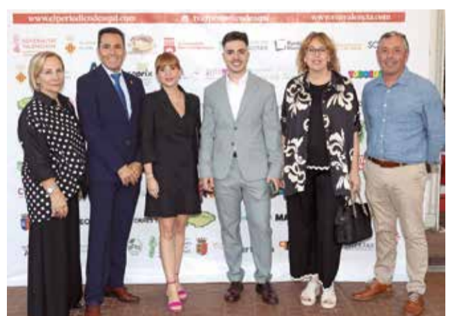
Diversos instants del 'photocall' dels XIII Premis d' El Periódico de Aquí en el Camp de Morvedre.