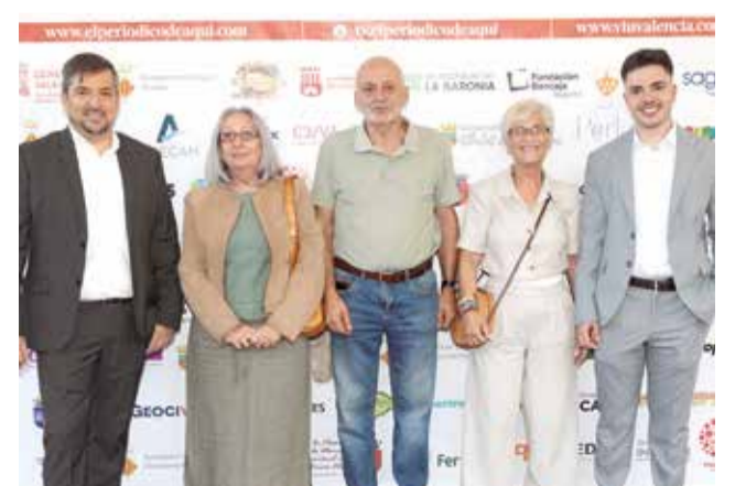
Diversos instants del 'photocall' dels XIII Premis d' El Periódico de Aquí en el Camp de Morvedre.