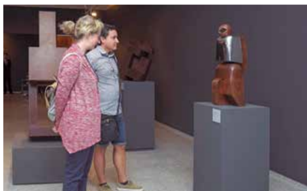
Inauguración de la exposición.

búsqueda de la originalidad y la innovación están en el origen de su introspección simbolista, tratando de revelar el universo de lo imaginario.