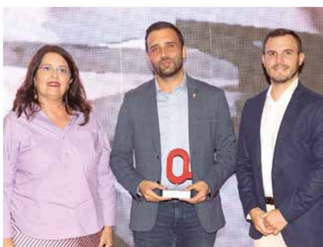
Premiats en els XIII Premis del Camp de Morvedre.

miat en la categoria ESPECIAL. Este projecte no sols revitalitza una zona emblemàtica, sinó que també revalorat la història industrial de Sagunt. El nou espai combina oci, cultura i patrimoni, creant un entorn atractiu per a ciutadans i visitants. Amb una aposta per la sostenibilitat i la integració comunitària, este passeig es presenta com un símbol de la nova etapa que viurà la ciutat.