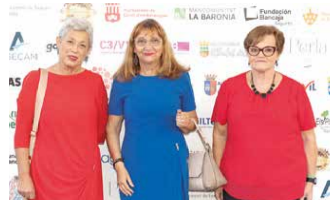
Diversos instants del 'photocall', la gala i la 'picaeta' dels XIII Premis d' El Periódico de Aquí en el Camp de Morvedre.