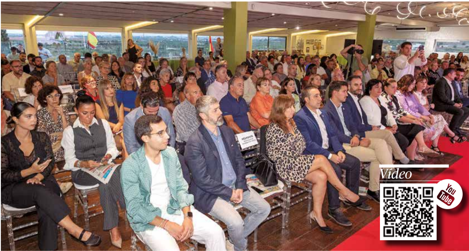
Part del públic assistent als XIII premis d'El Periódico de Aquí al Camp de Morvedre, celebrats en el restaurant el Mirador de Sagunt.

EL MITJÀ DE COMUNICACIÓ VA REUNIR EN EL RESTAURANT EL MIRADOR DE SAGUNT REPRESENTANTS DE TOTS ELS MUNICIPIS DE LA COMARCA EN UNA EXITOSA TRETENA EDICIÓ D'UNS PREMIS QUE VAREN COMPTAR AMB MÉS DE 200 ASSISTENS