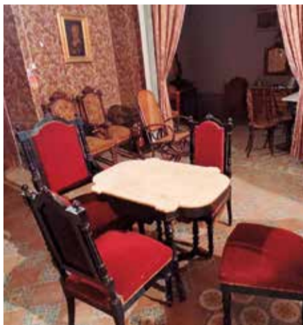
Interior del Castell Palau d'Albalat dels Tarongers.

El Grup de Cronistes i Investigadors de la comarca va fer allí la seua xvii Trobada l'any 2021. Hi va reivindicar, a través d'un manifest, la seua recuperació. Contemplàrem la riquesa de les sales, de tot el que es veu i dels secrets que s'amaguen en les parets. Han pas-