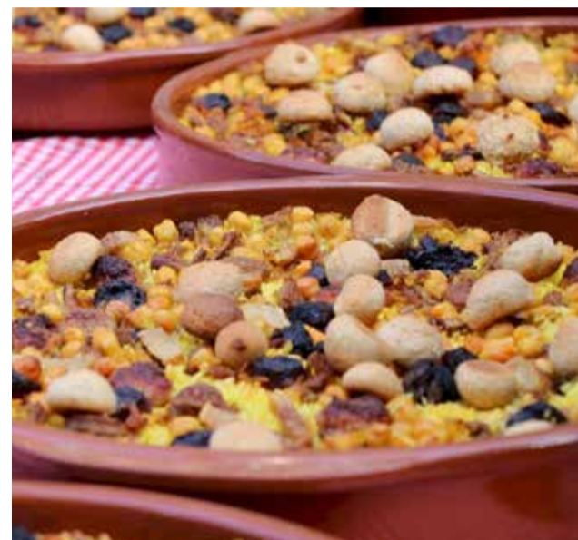
Rossejat torrentí.

► CAMP DE MORVEDRE. La corona saguntina és un dels dolços més emblemàtics i la seua joia és la taronja i l'aigua de flor del taronger.