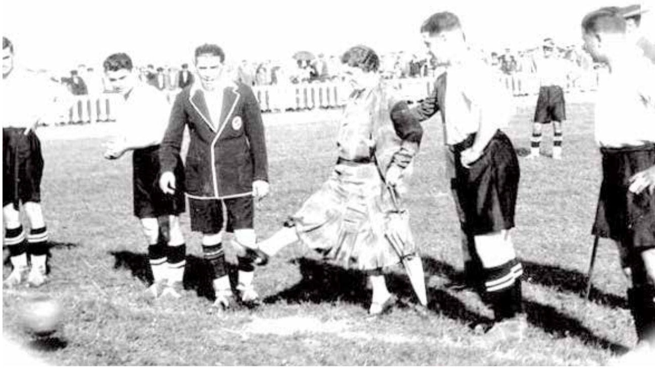
Saque de honor en la inauguración del estadio, en 1929.