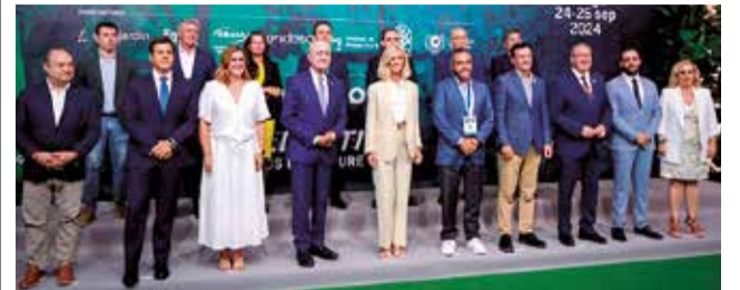
Autoridades en el foro de Málaga.