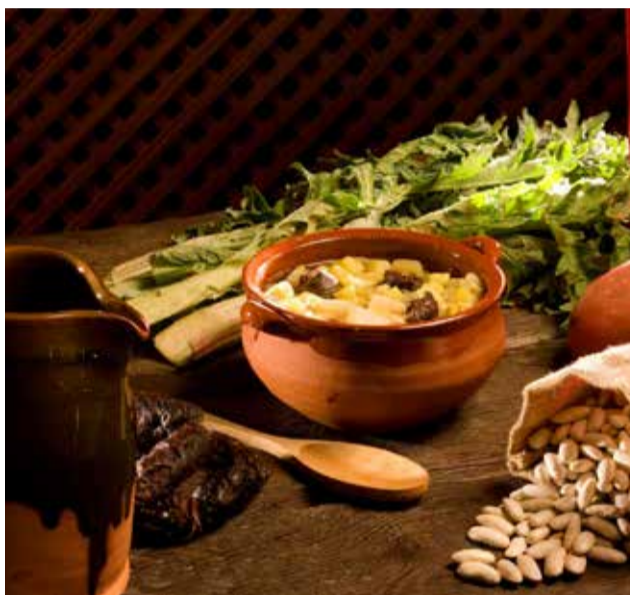
Olla segorbina.

► LA RIBERA. L'arnadí és un dels dolços més tradicionals, especialment popular en èpoques com la Quaresma i Pasqua.