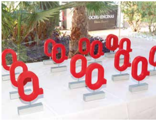
Els guardos.