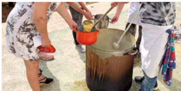
Un 9 d'octubre a Petrés.

amb un concert del grup infantil "Els Ramonets" a la plaça de l'Església, dirigit a un públic familiar. A les 14h, la jornada culminarà amb un dinar popular d'olla a la mateixa plaça. Els interessats poden adquirir els tiquets per al dinar a l'Ajuntament, del 30 de setembre al 7 d'octubre, per un preu de 3 euros.