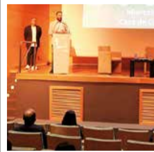
El foro.