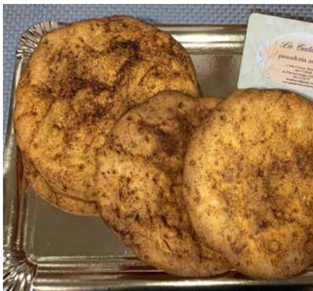
Tortas de Colorao del forn 'La Catalineta'.

► ALT PALÀNCIA. Un dels forns més coneguts per a poder disfrutar de la gastronomia típica de la zona és el forn 'La Catalineta' de Segorbe.