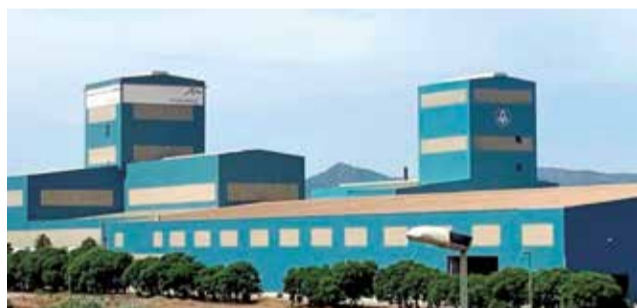
Planta de Galmed en Sagunt.

La empresa interesada es NSR, siglas de Network Steel Resources (NSR), un conglomerado en el acero que ya tiene presencia en la ciudad de Sagunt a través de Ibersteel, una empresa situada en el polígono Sepes que se encuentra entre Sagunt y Port. Esta compañía, además, ha recibido hace poco la entrada en su capital de un grupo más grande, la acerera japonesa Marubeni-Itochu Steel (Misi) que ha muestra-