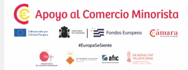
Presentación de la campaña.