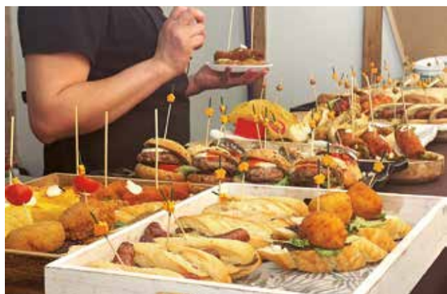
Menja't Solla en otra edición.