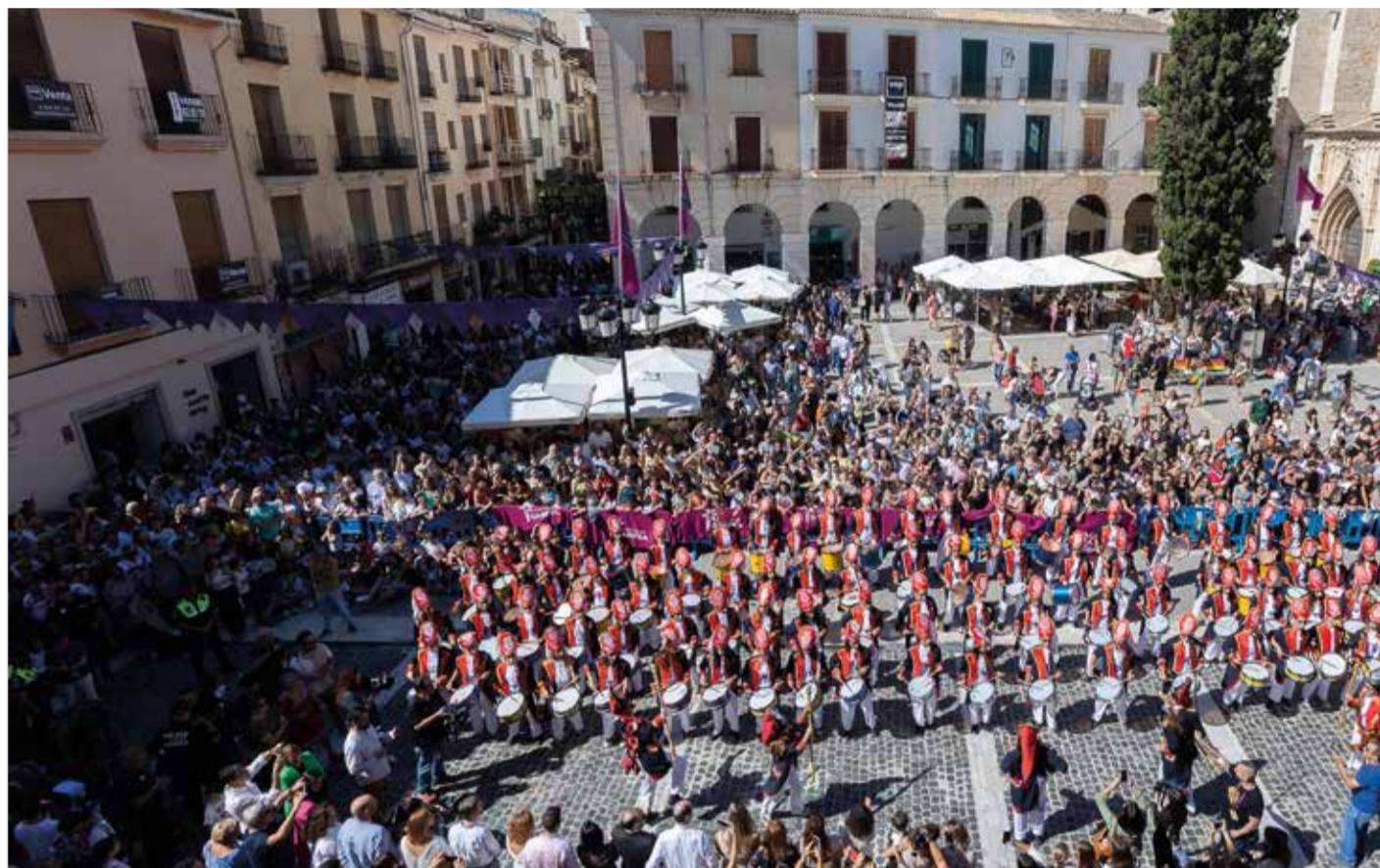
Concentració del Tío de la Porra a la Plaça de l'Ajuntament.

00.00 h - Institut María Enríquez. Revetla amb BACARRÀ ON TOUR. Entrada gratuïta.