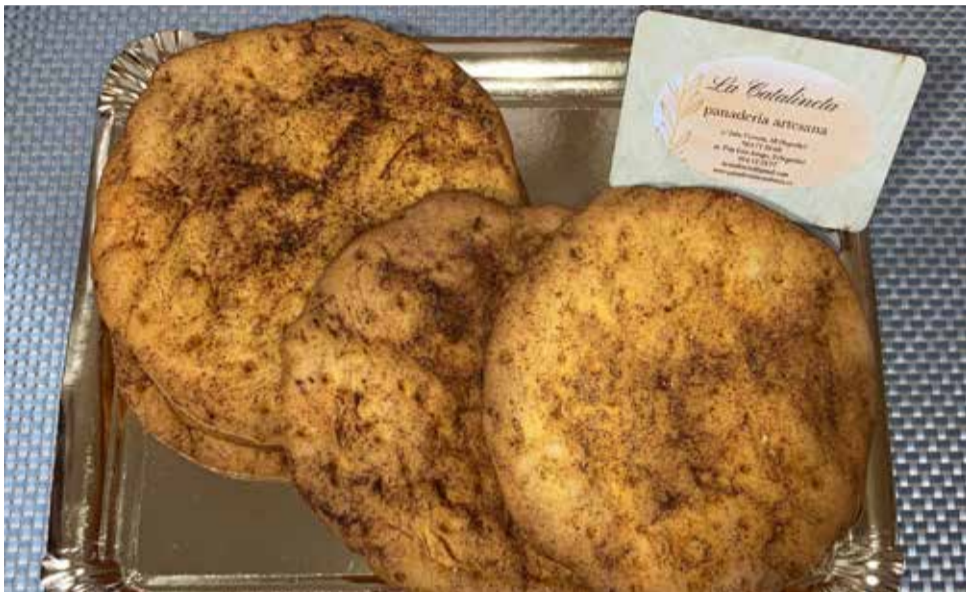
Tortas de Colorao del forn 'La Catalineta' ubicat a Segorbe.

► CAMP DE MORVEDRE. La corona saguntina és un dels dolços més emblemàtics i la seua joia és la taronja i l'aigua de flor del taronger.