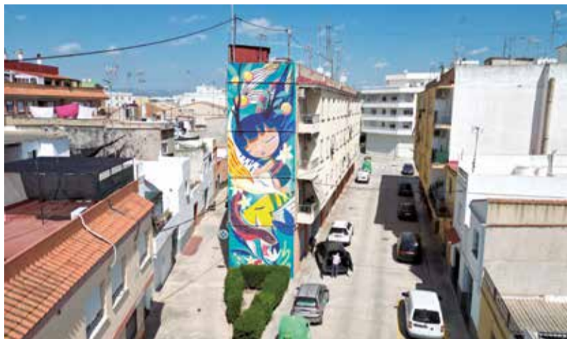
Algunes obres que es poden contemplar al municipi d'Alberic.

■ EL MUNICIPI ACULL LA QUARTA EDICIÓ D'ARTALBERIC DE LA MA DE RECONEGUTS ARTISTES DE REFERÈNCIA MUNDIAL