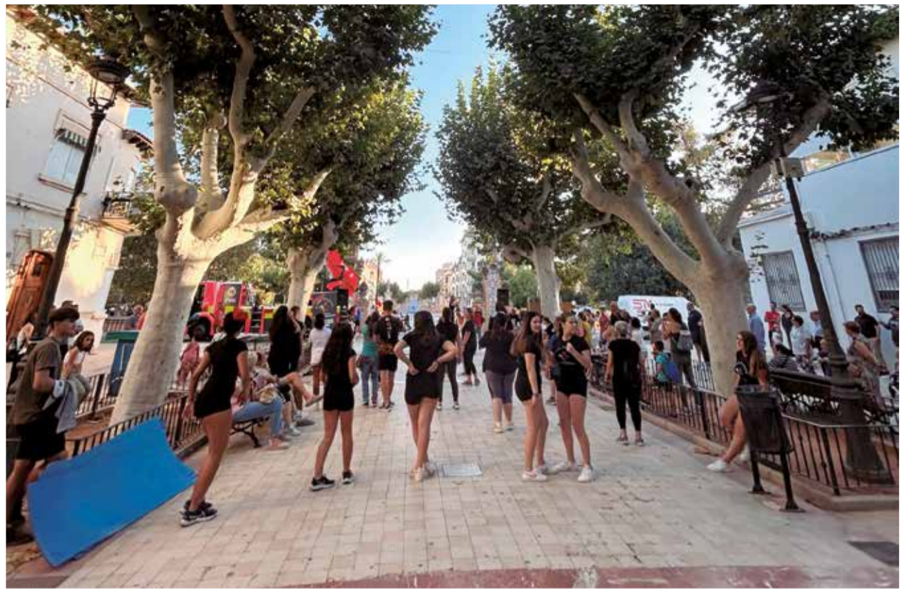
Un instant de la jornada d'esport celebrada a Carcaixent.

Les activitats, que varen tindre lloc en el Parc Navarro Daràs, reuniren desenes de veïns