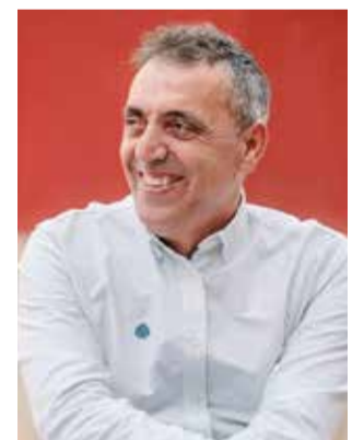
Pep Gimeno. / EPDA

El concert tindrà lloc a les 20 hores a l'Àgora del Parc Central, amb entrada lliure per a tots els assistents. Ja ve l'Aire és un recull de cançons de magatzem en clau femenina, adaptades i revisades, que ha sigut molt ben acollit tant per la crítica com pel públic. El mateix espectacle ha valgut a Pep Gimeno nombrosos reconeixements al llarg de 2023, entre els quals destaquen el Premi En-