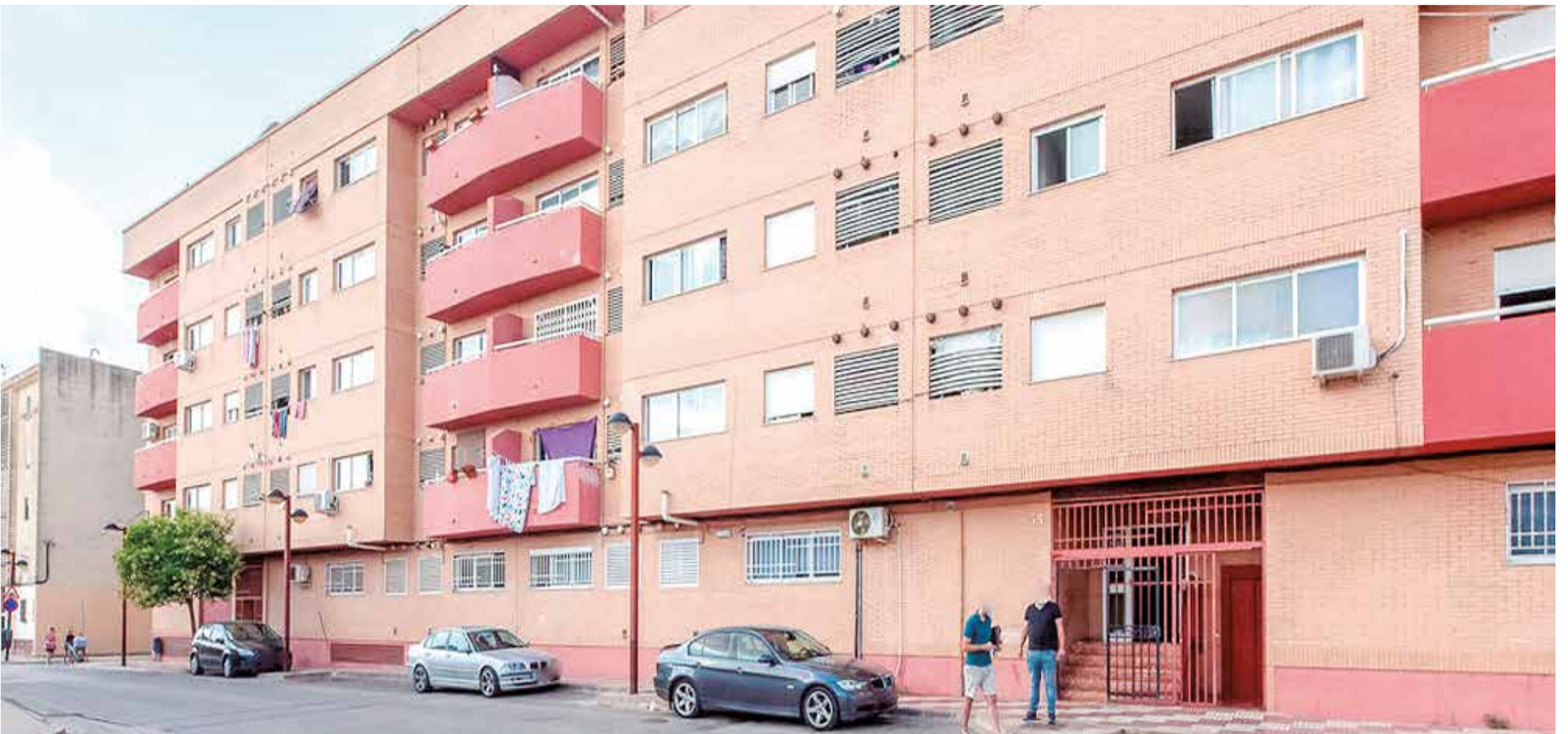
Una vivienda en venta en el municipio de Algemesí.