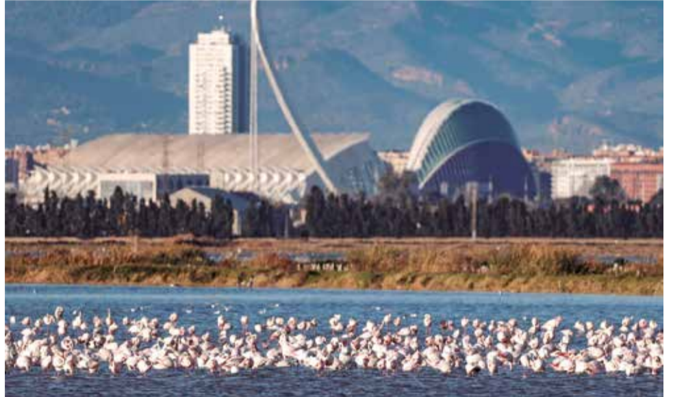
Flamencs en el Parc Natural de l'Albufera amb la ciutat de València al fons.

La candidatura de l'Albufera com a Reserva de la Biosfera compta amb el suport del jurat dels Premis Rei Jaume I i és un dels objectius principals de València com a Capital Verda Europea 2024