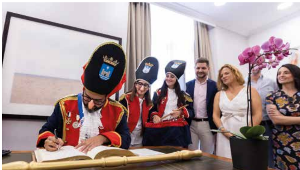
Signatura inaugurant de la Fira i Festes.

01.00 h - Parc de la Festa. FESTA COCO LOCO. Parc Ausiàs March.