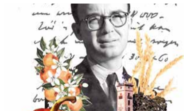
Cartell de la Festa Estellés.

Els amants del teatre també podran gaudir de la XVII Mostra de Teatre Amateur, que tindrà lloc els dies 5, 12, 19 i 27 d'octubre, a les 20.00 hores, al Teatre Modern. Aquesta mostra està organitzada pel grup de tea-