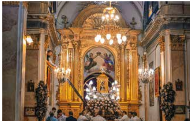
La Mare de Déu de la Font, patrona de Villalonga.