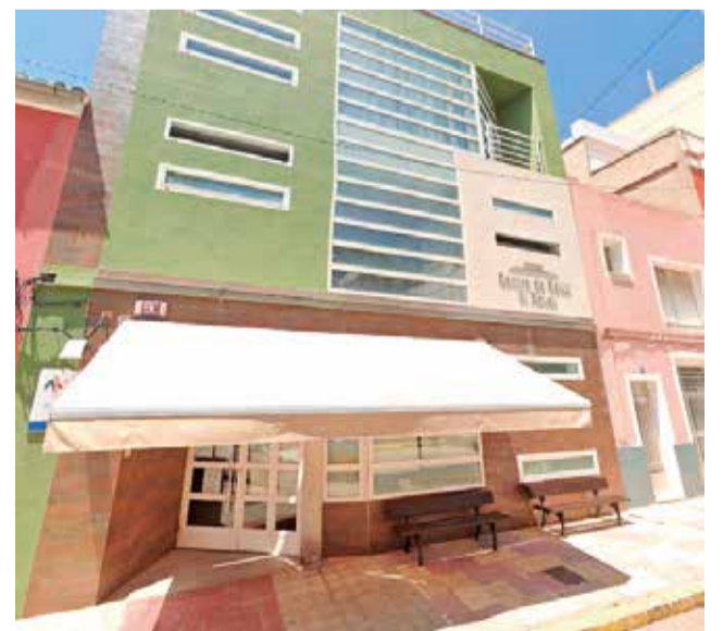
Centre de Salut del Raval.

El PP assegura que seguirà treballant per assegurar una “gestió honesta i responsable”.