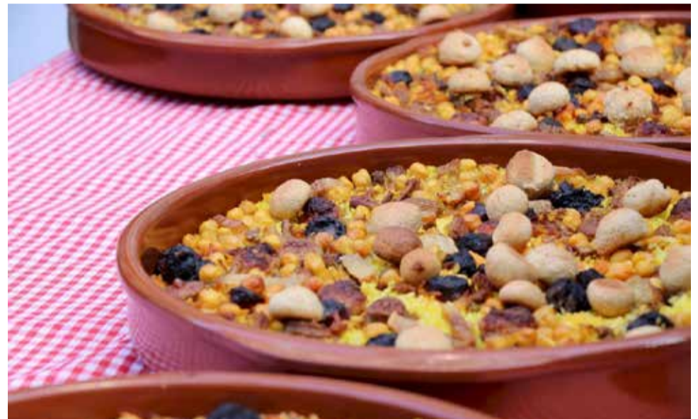
Rossejat torrentí.

de manera diària són els seus pans artesans amb massa mare, pa d'aigua, rústic, d'oli, espelta, pans de motle tant tendres com torrats, entre altres. A més, compten amb servei de rebosteria, pastisseria i servei de servei d'àpats. Tant en el seu forn al Carrer Julio Cervera, 18 com en el local de cafeteria i pastisseria situada en l'Avinguda Fra Luis Amigó 3 els atendran gustosament.