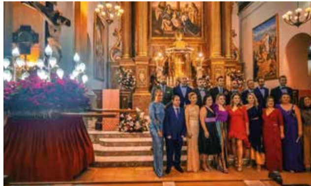
Església de Villalonga.

A les 11:00 h. Acompanyats pel tabalet i la dolçaina, eixirà la processó cívica des de la Casa de la Cultura fins a l'Ajuntament, on tindrà lloc l'Acte Institucional del Dia de la Comunitat Valenciana. Es farà el Pregó de Festes.