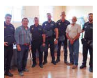
Policies. / EPDA