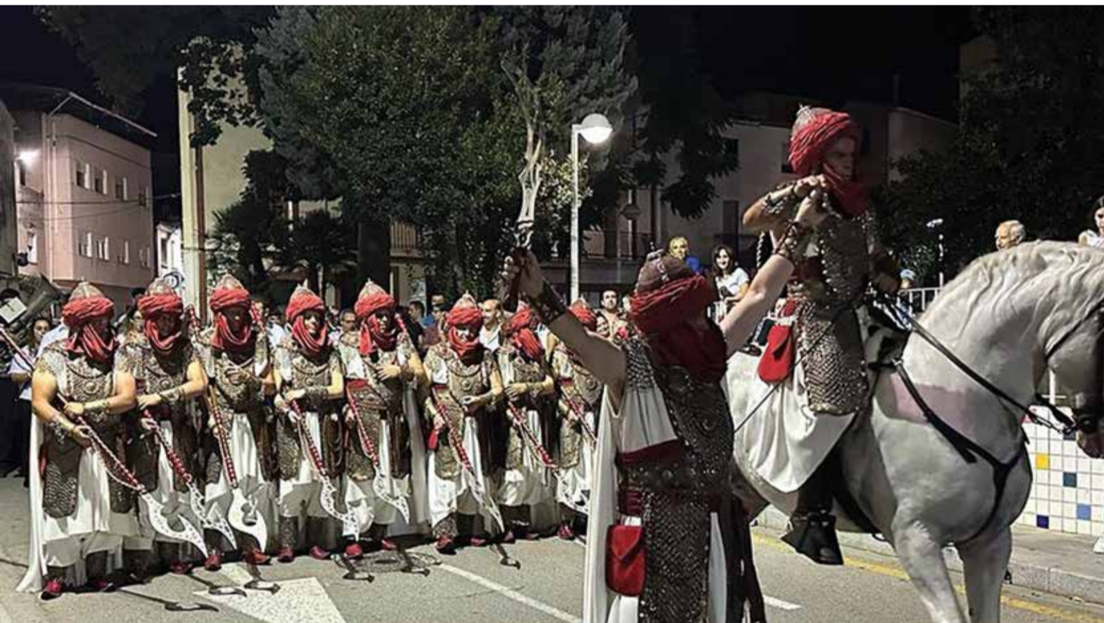
Desfilada dels Moros i Cristians.

A les 12:45 h. Solemne missa en honor a la Divina Aurora.