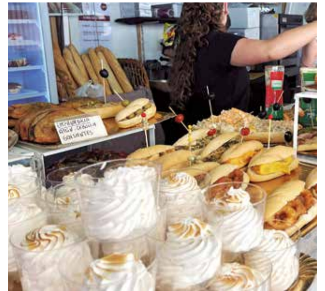
Diferentes platos de una edición anterior del evento gastronómico.