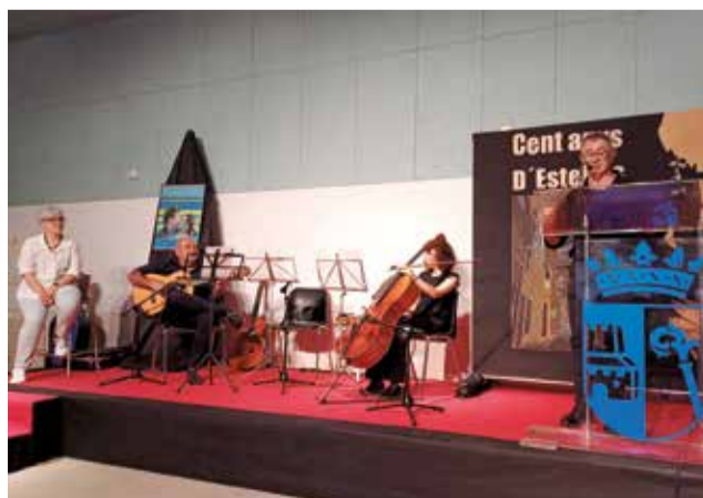
Diversos instants de l'homenatge.