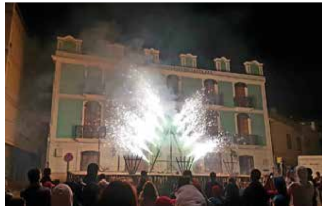
Espectacle pirotècnic. / EPDA

A les 17:00 h del dimecres. Contacontes: Nifunifa contacontes representarà "El Menjacontes" a l'Auditori. (Activitat subvencionada pel SARC de la Diputació de València)