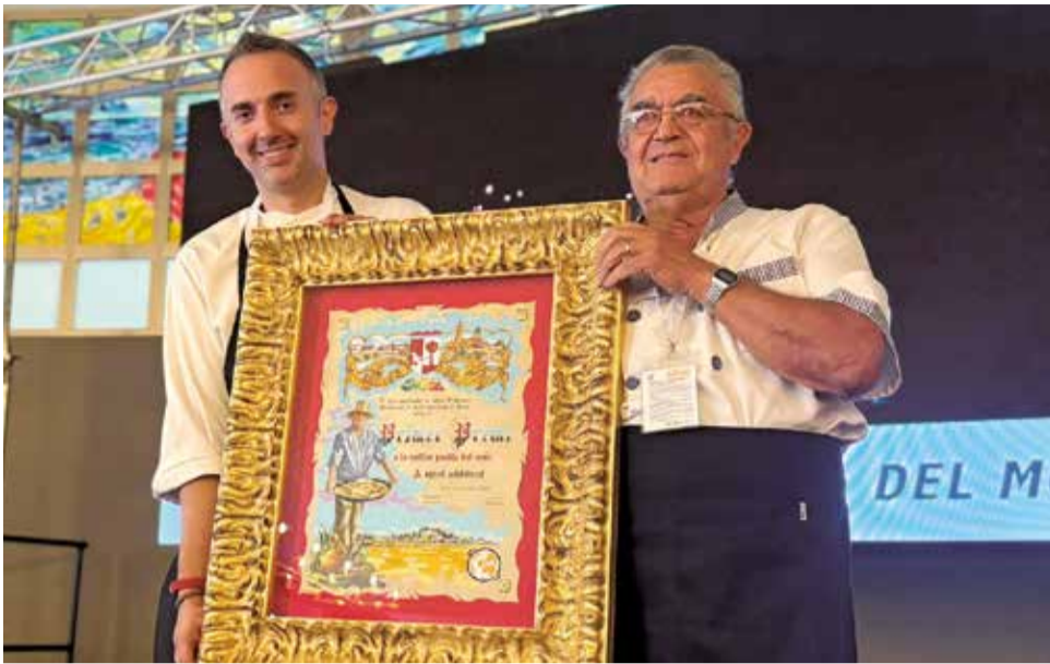
Els guanyadors del restaurant 'Miguel y Juani', amb el guardó.