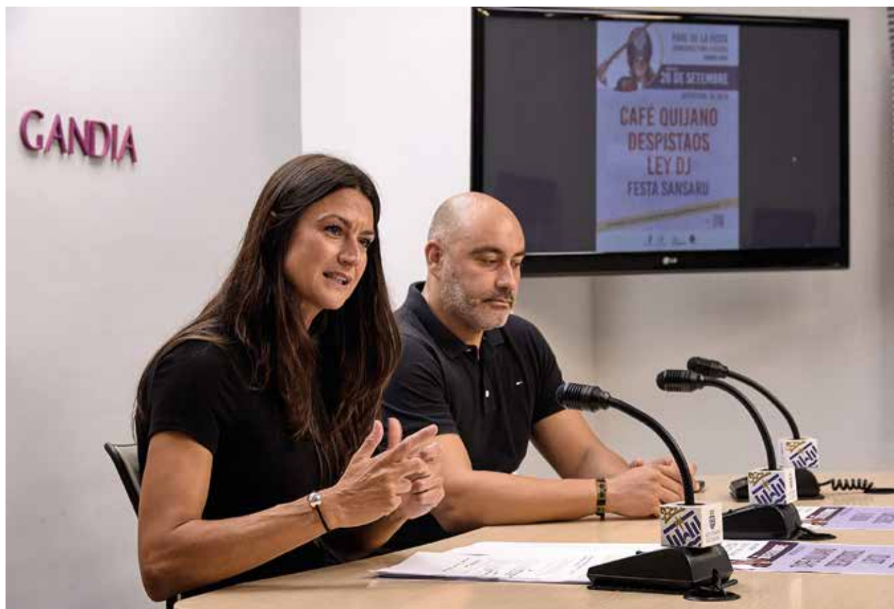
Presentació dels concerts .