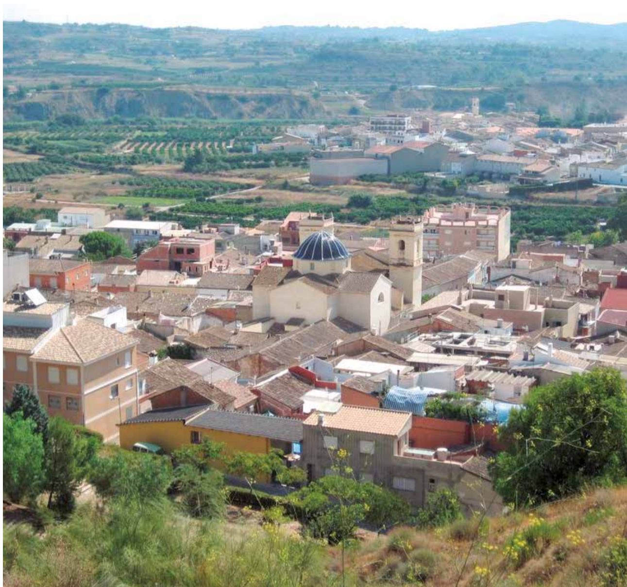
Vista del municipi de Montroi, a la Ribera Alta, el municipi que més quantia ha rebut de la comarca.

El president de la Diputació de València, Vicent Mompó, indica que "afavorir la mobilitat entre municipis rurals és clau per a fixar població, especialment en comarques en les quals hi ha servicis mancomunats". En este sentit, ha apuntat que l'estratègia per a combatre la despoblació "ha de facilitar les sinergies per territoris" i subratlla que "l'accés a qual-sevol producte o servici, la vi-