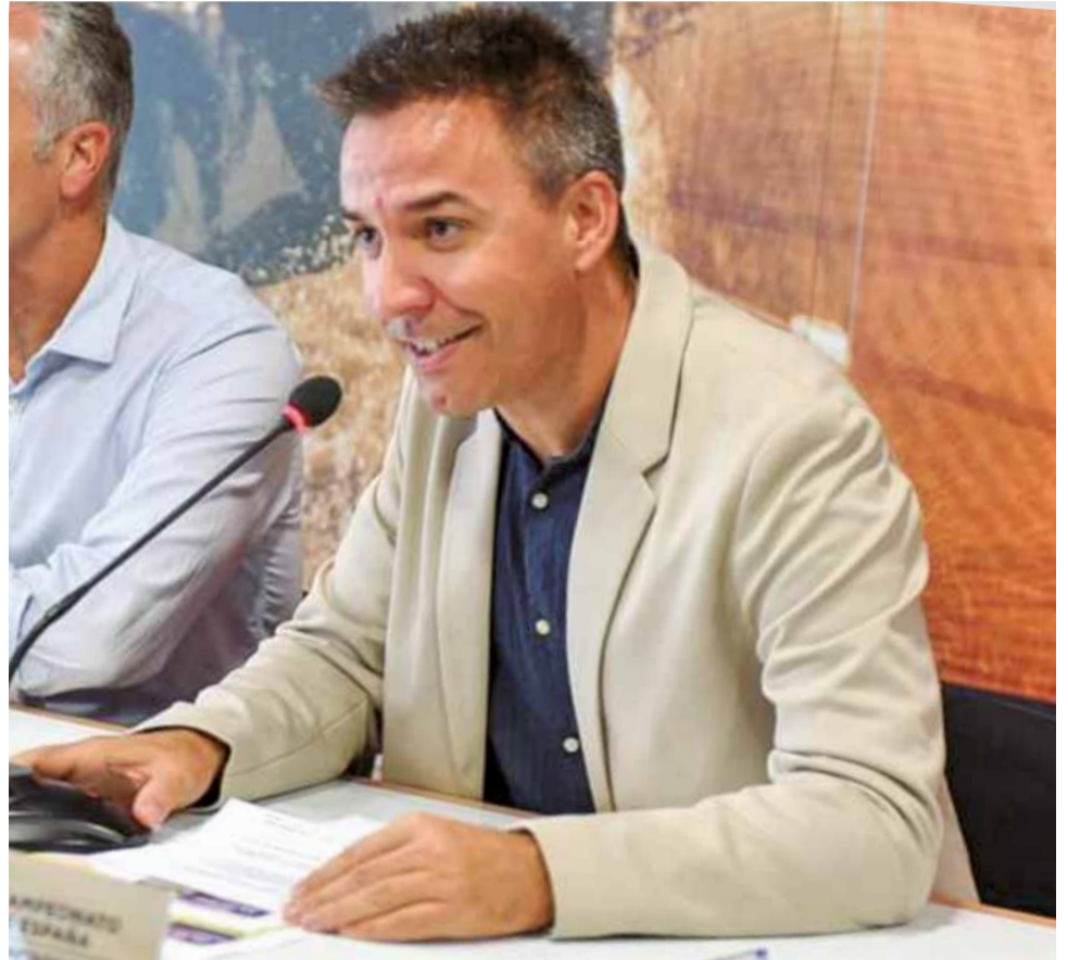
El primer edil de la capital de la Ribera Baixa.

► El primer mes a l'alcaldia l'hem dedicat a apagar focs. Hem abordat i reconduït assumptes relacionats amb la carretera, hem parlat amb persones i col·lectius als qui no se'ls havia tingut en compte, pel que fa a les Festes hem modificat despeses que ens semblaven innecessàries i hem acabat de tancar moltes coses que no estaven concretades, també ens hem posat les piles per a que el curs escolar poguera començar amb normalitat actuant sobretot al col·legi públic Cervantes que