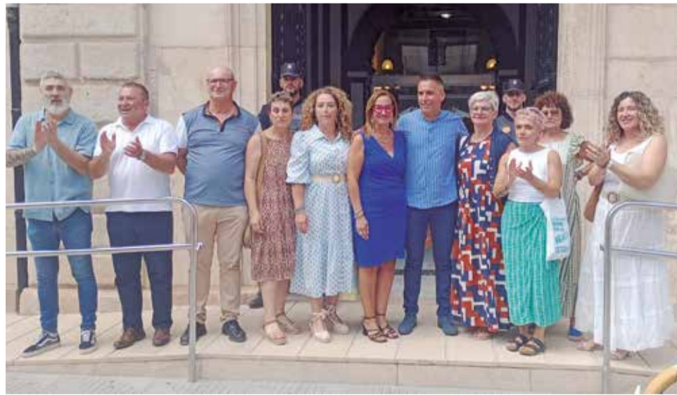
Edils dels diferents partits que han permés la moció de censura.