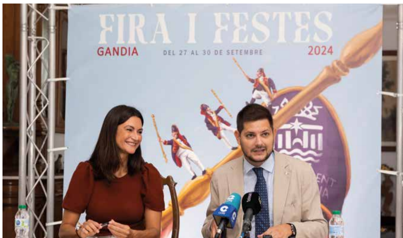
Presentació del programa de Fira i Festes.

Un dels elements centrals d'esta edició és la commemoració del 550è aniversari