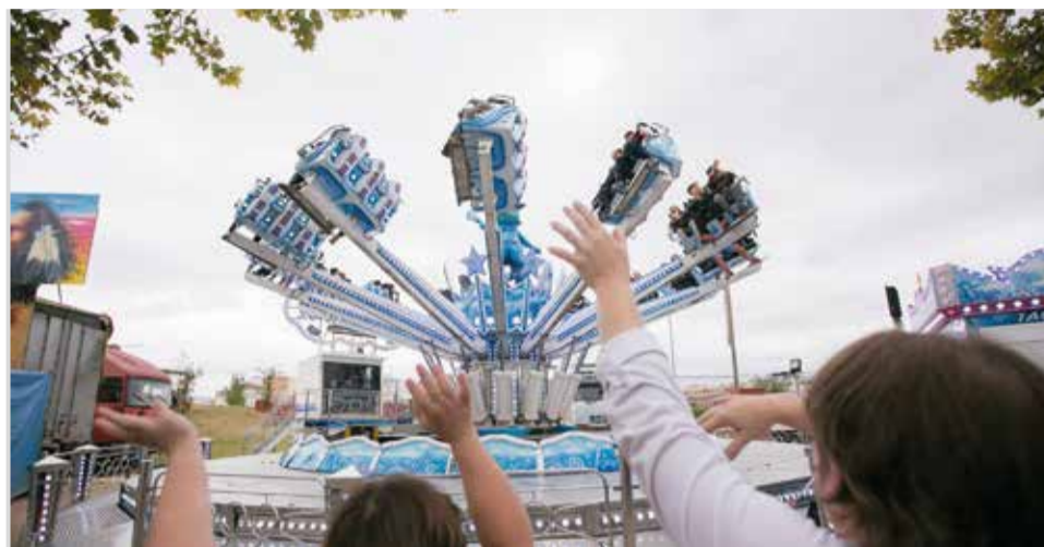
Atraccions de la fira.

11.00 a 14.00 h i de 18.00 a 21.00 h - Claustre Col·legi Escoles Pies. Plaça Escoles Pies. XXXV MOSTRA DE BONSÀIS DE LA COMUNITAT VALENCIANA. Organitza: