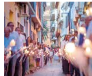
Processó. / EPDA