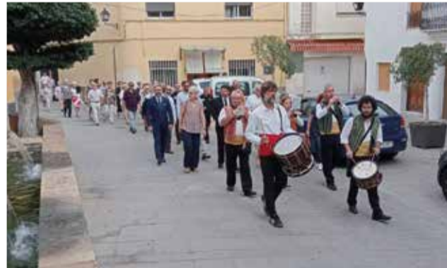
Passacarrer del Villalonga.

A les 19:30 h. Des del balcó de l'Ajuntament es farà el Pregó de Festes. A continuació, "Enramà de la murta", a càrrec dels festers.