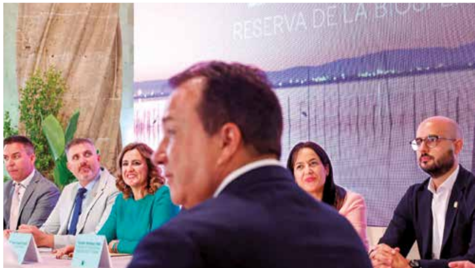
Un instant de la reunió entre els primers edils dels municipis riberecs.

apuntar Catalá, per a qui amb la declaració institucional "se segella un acord històric després d'una dècada, en el qual tretze poblacions i més d'un milió de persones" es donen la mà per a protegir l'Albufera i construir el seu "llegat", i amb el qual demostren que són "capaços d'acordar, per damunt d'ideologies".