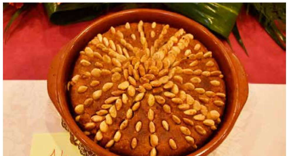
L'arnadí, dolç típic de la Ribera.

Hui dia, les pastisseries de tota la Comunitat Valenciana s'omplien d'acolorits masapans durant esta època, i els enamorats valencians regalen estes dolces figures a les seues parelles, simbolitzant el seu amor i compromís. Comencem el nostre recorregut pels dolços de Castelló i València esmentant l'omnipresent coca de llanda, una coca que rep tants noms com pugues imaginar i que té una variant espectacular realitzada amb