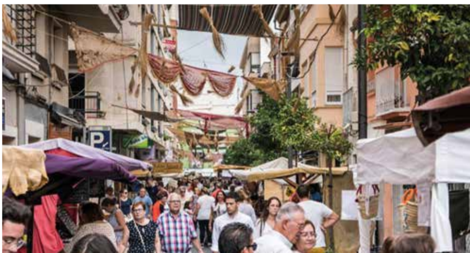
Mercat medieval de Gandia.