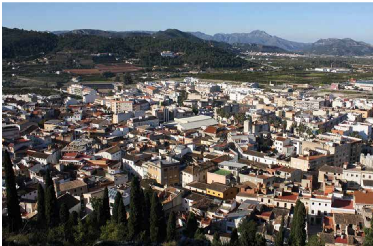
Vista aèria de Villalonga.

Dimecres, 9 d'octubre - Dia de la Comunitat Valenciana