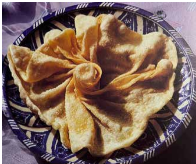
Orelletes, dolç típic al Camp de Túria.

Estos professionals són un grup heterogeni, que guarden receptes ancestrals o innoven amb l'avantguarda per bandera. De xicotets establiments familiars a restaurants als quals se'ls han atorgat prestigiosos