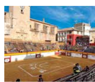
Plaça d'Algemesí.