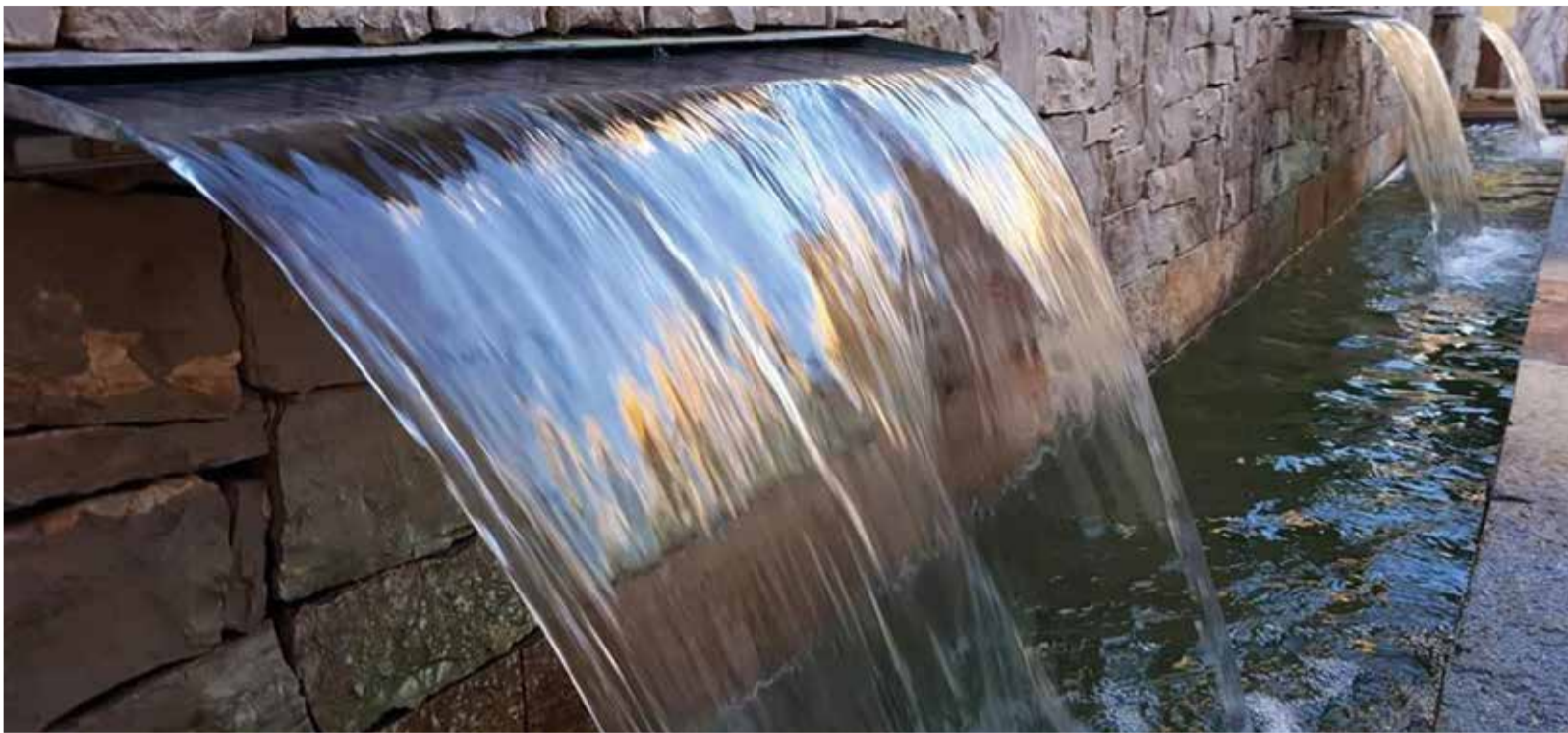
El moviment de l'aigua de la Font de la Mare de Déu.