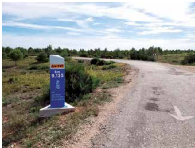
Un punt de la carretera.

Mazzolari indica que "amb esta inversió, la qual supera el mig milió d'euros, es dona continuïtat a l'actuació que es va dur a terme en 2023 en un altre tram de la mateixa ca-