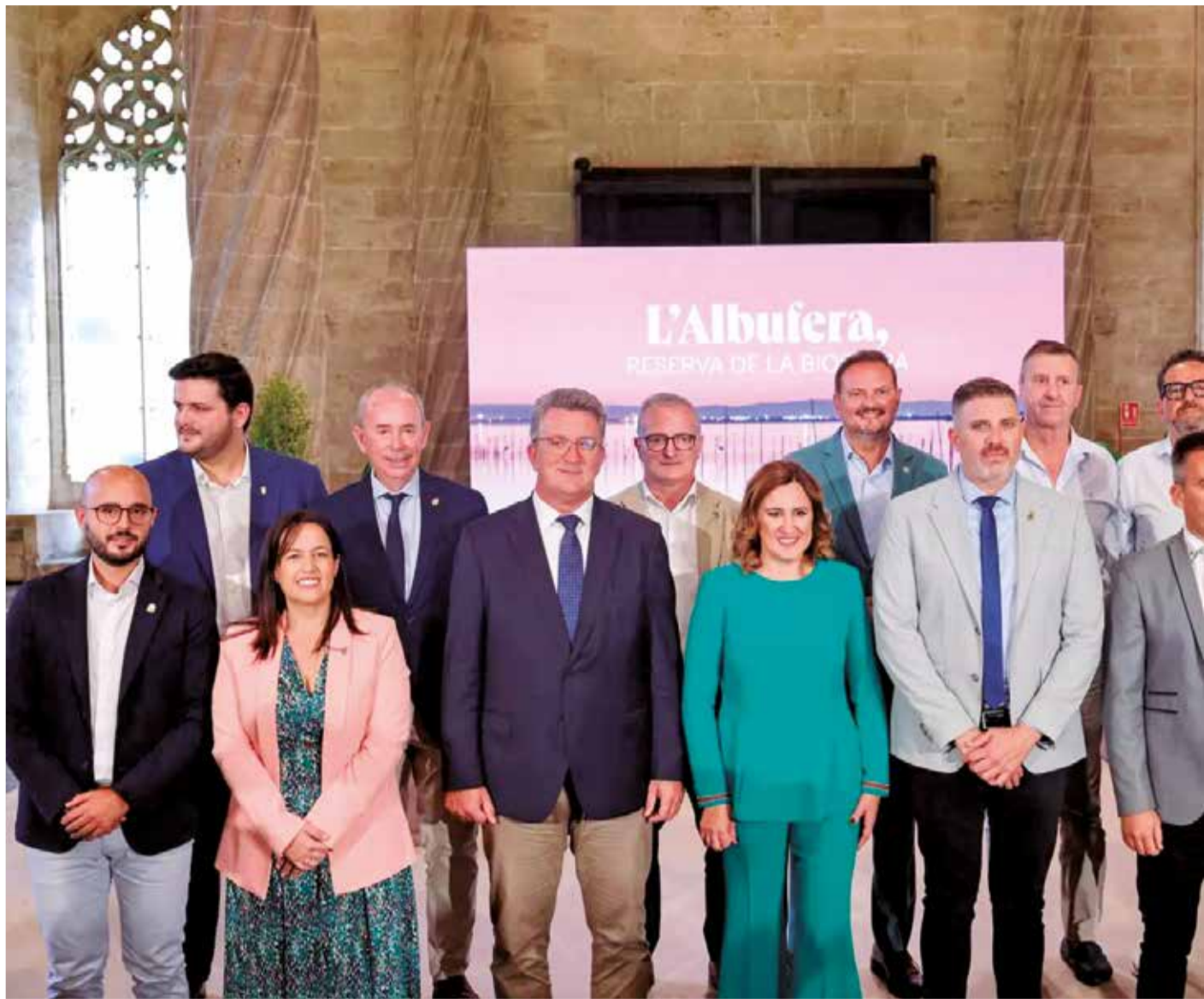
Els alcaldes i alcaldesses dels municipis banyats per l'Albufera.

"Hui llancem un missatge molt potent, de consens, d'unitat d'acció i de posar per davant el bé comú", va