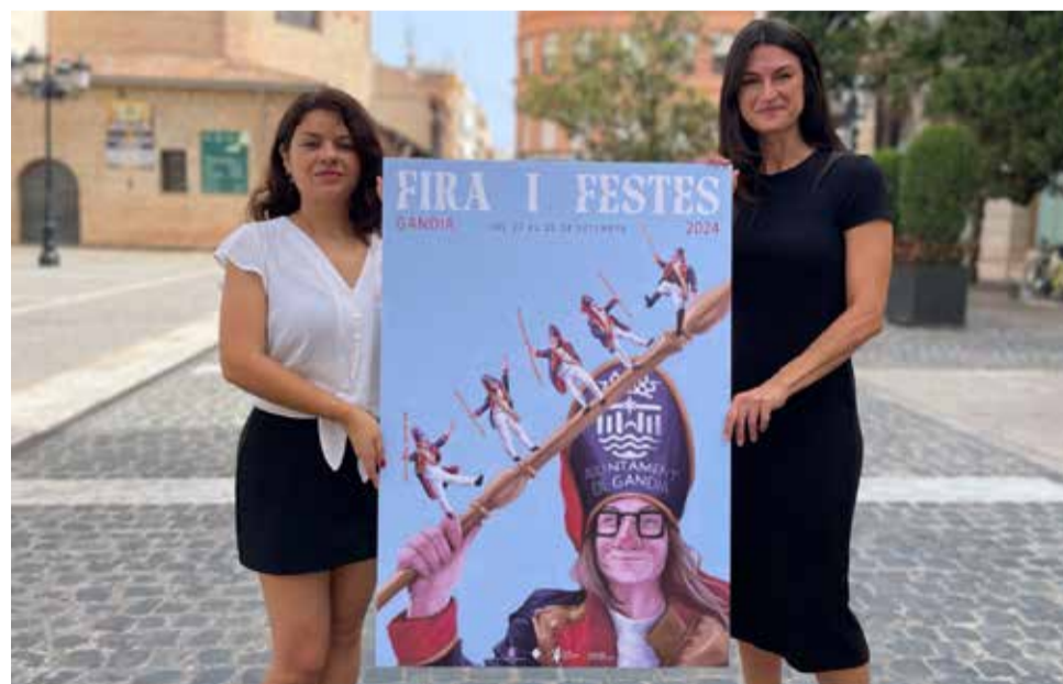
Presentació del cartell de Fira i Festes.

El 29 de setembre, al Parc de la Festa, tindrà lloc l'esperada actuació gratuïta de Juan Magán, DJ i productor reconegut internacionalment, que compta amb mül-