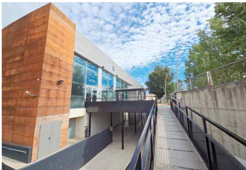
Exterior del pavelló multiús de Vilamarxant on se celebrarà la cita.

Pel que fa a l'àmbit educatiu , la Plataforma INSTITUT ARA de Nàquera i Serra serà reconeguda per la seua incansable lluita per obtenir un institut propi per a estos