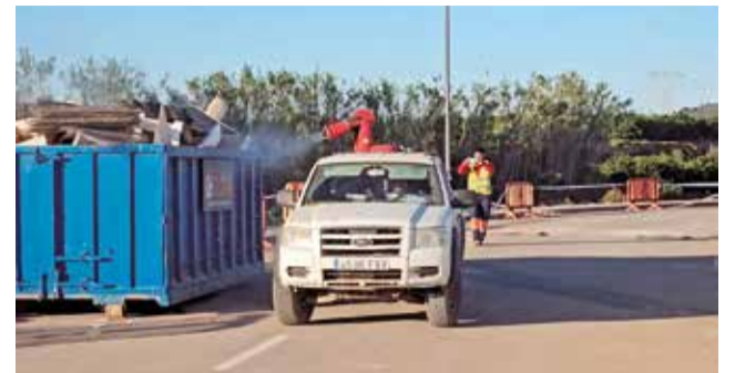
Trabajos de desinfección en Loriguilla.