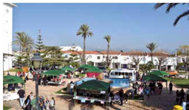
Carpas instaladas en la Plaza del Ayuntamiento.