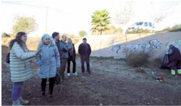
Visita a los trabajos del canal del Carraixet.

Este canal artificial forma parte del desvío de las aguas pluviales al barranco del Carraixet, que se ejecutó en los años 80, como protección de inundaciones al casco urbano, de ahí el interés del Consistorio por su limpieza. “Vamos a seguir reivindicando y exigiendo a los organismos supranacionales la correcta adecuación de las infraestructuras hidráulicas de Bétera”, ha subrayado la primera edil.