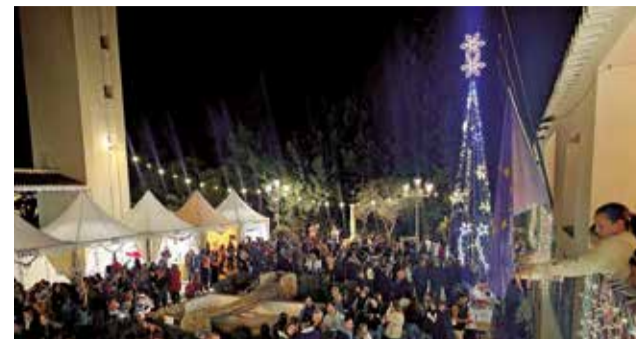
Apertura del Mercado Navideño de Loriguilla.

los más pequeños del municipio; o la ya tradicional Cabalgata de Reyes el 5 de enero.