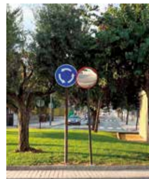
Espejo panorámico.

Los espejos panorámicos han sido colocados en zonas estratégicas y en puntos donde la visibilidad era reducida, especialmente en cruces donde los conductores encontraban dificultades para evaluar el tráfico. Concretamente, algunos de los equipamientos se han instalado en las calles de los Abetos, Llebeig, Bidasoa, Fuente Algezar, Xuquer, del Pou, Segura y Sequer, entre otras.