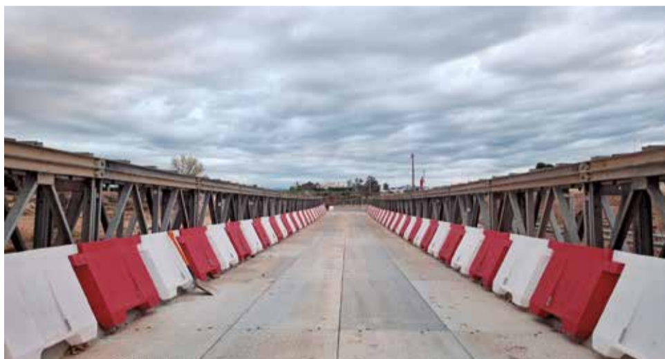
Nuevo puente provisional de conexión con la zona norte de Riba-roja.