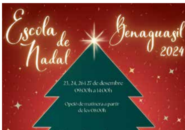
Cartel de la Escuela de Navidad de Benaguasil.

Este servicio, que se realizará durante los días 23, 24, 26 y 27 de diciembre en las instalaciones del CEIP Luis Vives, está