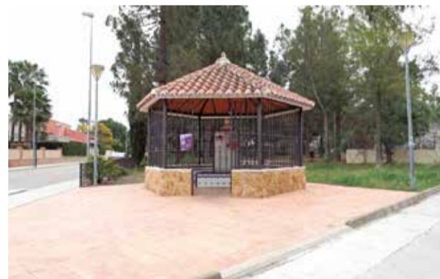
Fuente de osmosis en la calle Terrerola.