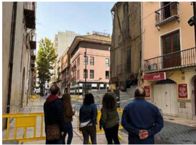
Edifici d'enfront del Palau Ducal / EPDA

El deteriorament d'estos edificis, com la casa Wilson i la finca annexa davant del Palau Ducal, reflectix la urgència d'un pla de manteniment i restauració que incloga tant edificis públics com privats. La situació actual del patrimoni arquitectònic de Gandia és un recordatori de la responsabilitat compartida entre les institucions públiques i els propietaris privats per garantir la preservació d'este llegat.