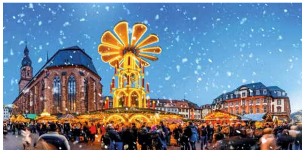
Mercats nadalencs d'Heidelberg.

certs de nades i espectacles de llums fins a patinatge sobre gel i tallers d'artesanía, les opcions són tan variades com els destins mateixos. "El Nadal a Europa es viu en comunitat, en família i gaudint de la tradició", destaca Richard, convidant les persones a aprofitar cada moment de la seua visita.