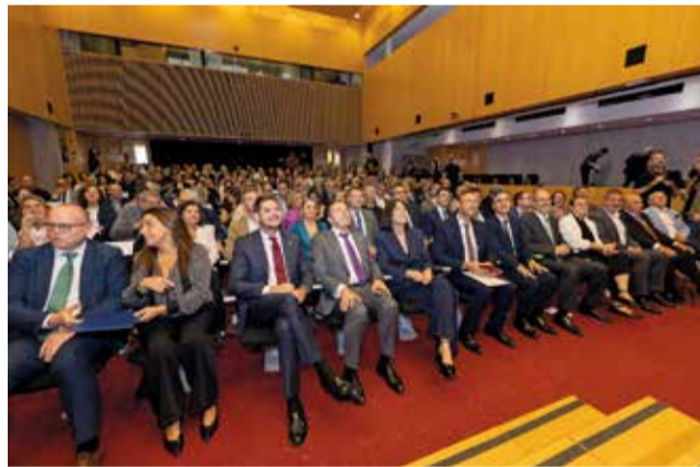
L'Aula Magna del centre universitari.