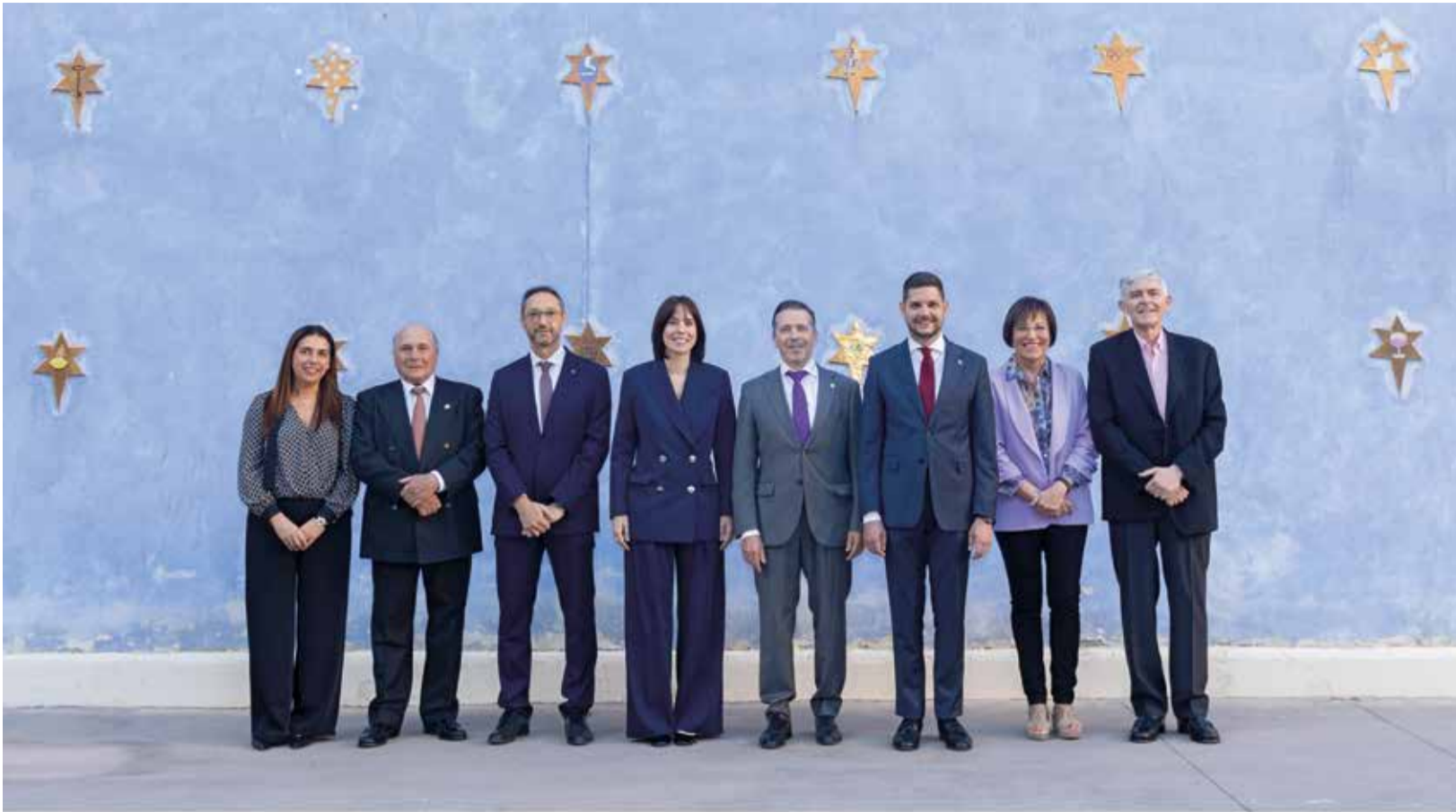
Personalitats destacades de l'esdeveniment.

■ L'ESDEVENIMENT VA COMPTAR AMB LA PRESÈNCIA DE LA MINISTRA DE CIÈNCIA, INNOVACIÓ I UNIVERSITATS, DIANA MORANT