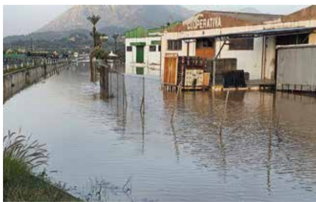
Desbordament del riu Xúquer.

s'han examinat detalladament les zones més afectades. Com a resultat, s'ha posat en marxa un pla d'acció coordinat amb l'objectiu de minimitzar els efectes de futures emergències, assegurant que els recursos estiguen a punt per a qualsevol eventualitat imminent.