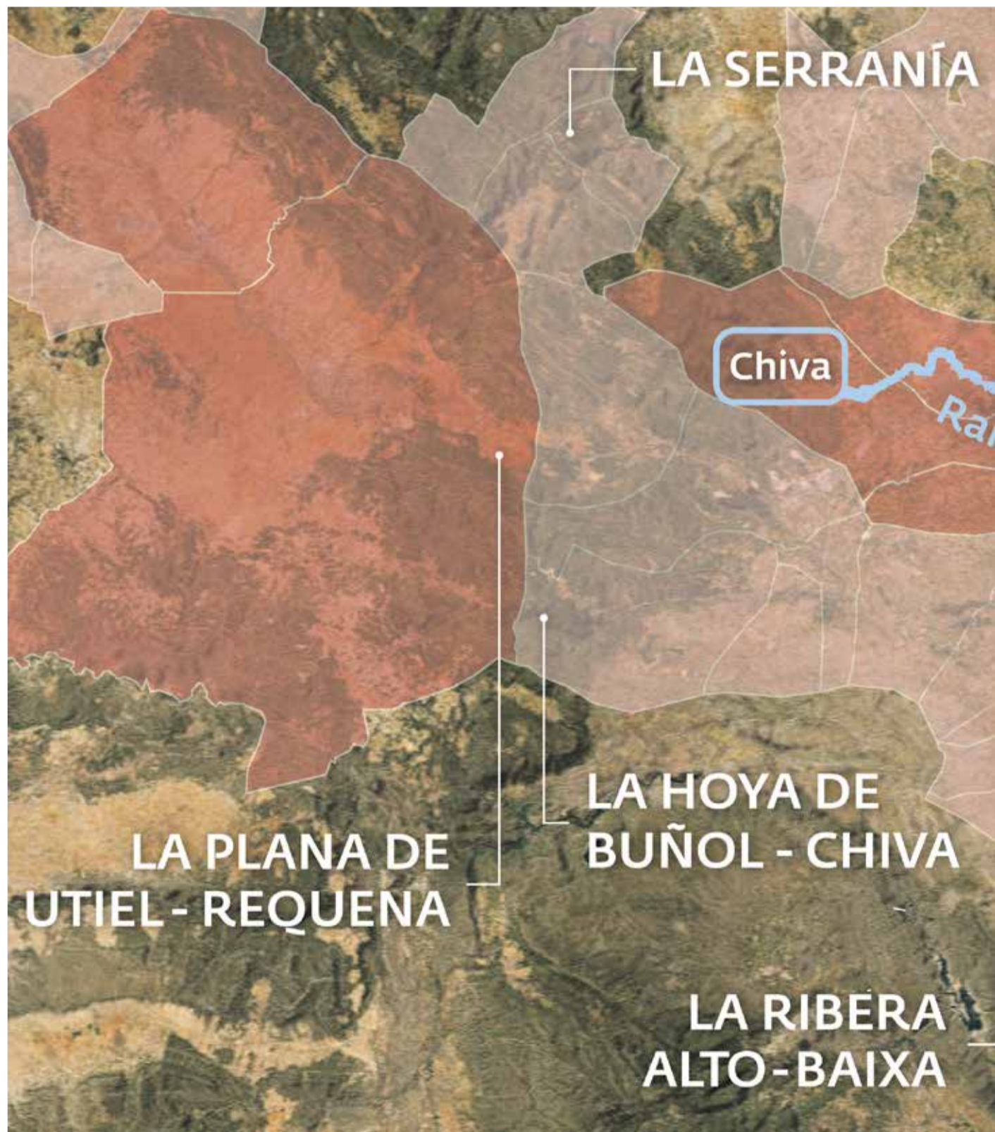
Mapa con todas las localidades afectadas por la gran riada del 29 de octubre en la provincia de Valencia con la señalización

Las personas fallecidas en la provincia de Valencia que ya han sido plenamente identificadas por los forenses y los especialistas de la Guardia Civil y la Policía Nacional ascienden a 111, según el último balance actualizado del