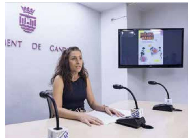
Presentació del projecte 'Infància als barris'.

Finalment, el 29 de novembre la Cia No Somos Monstruos oferirà un taller de teatre a la plaça de Sant Josep. Mitjançant aquesta activitat, els més menuts i menudes