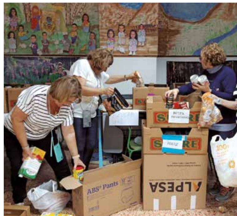
Diferentes momentos durante la recogida solidaria en Gandia, Xeraco, Tavernes de la Vallidigna y Oliva en los espacios habilitados por los ayuntamientos.

Otra muestra de la solidaridad es la aportación de la Confederació d'Empresaris del comerç, servicis i autònoms de la Comunitat Valenciana (Confecomerc). Recogieron a través de la red solidaria que ha creado conjuntamente con sus asociaciones de comerciantes, gremios y mercados de Alicante, Castellón y Valencia toneladas de alimentos y productos de limpieza y maquinarias para los pueblos afectados por la dana que ha asolado la provincia de Valencia.