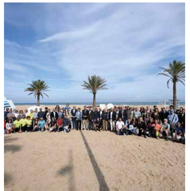
Reunió en la platja de Gandia