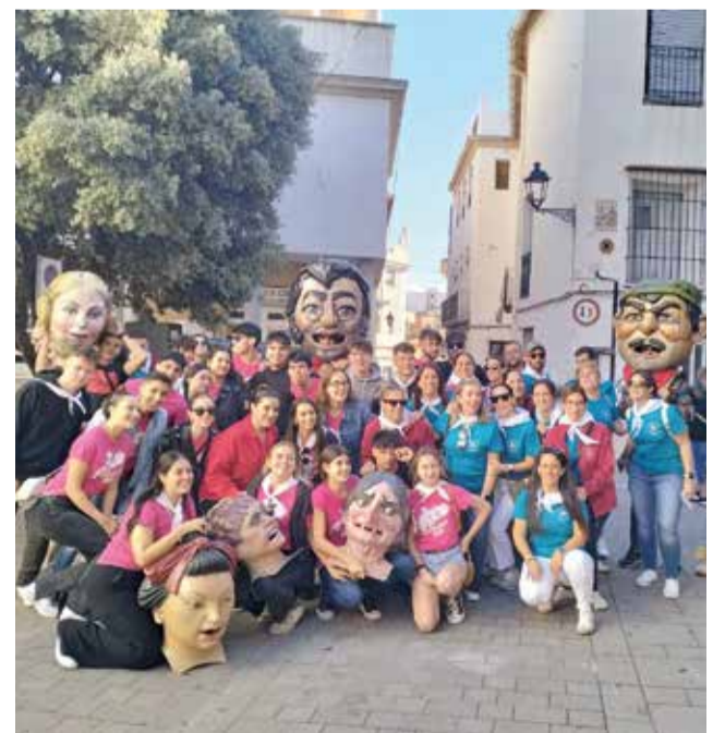
Passeig dels 'Cabeçuts' de Villalonga.

Amb això, Villalonga ha viscut unes festes plenes d'alegria, tradició i molta participació, consolidant-se com una cita ineludible per a veïns i visitants que volen gaudir de la cultura i la festa del poble.