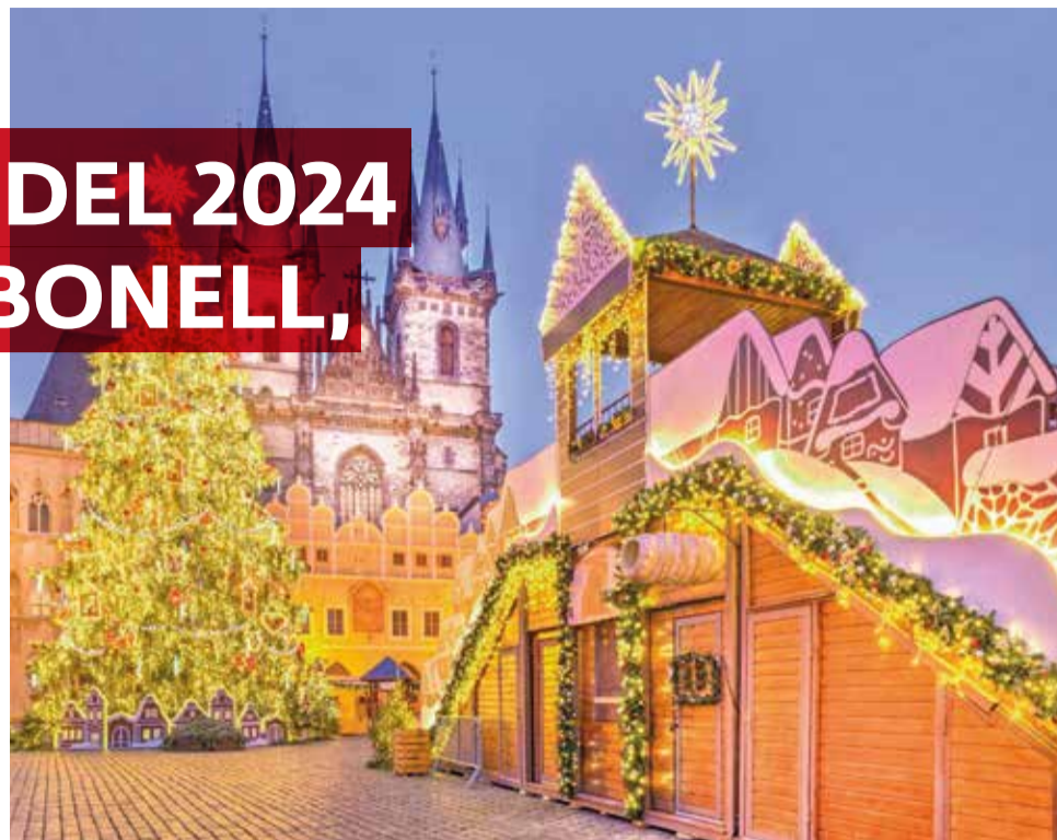
Praga en Nadal.

Per a Richard, cada mercat ofereix activitats especials que el converteixen en una experiència completa. Des de con-