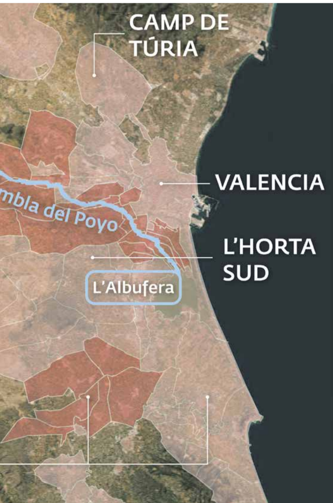
Mapa del recorrido del desbordamiento del barranco del Poyo. / JAIME SORIANO

► AYUDAS PÚBLICAS. El Gobierno ha aprobado ayudas urgentes por un importe de 10.600 millones para particulares, empresas e instituciones.