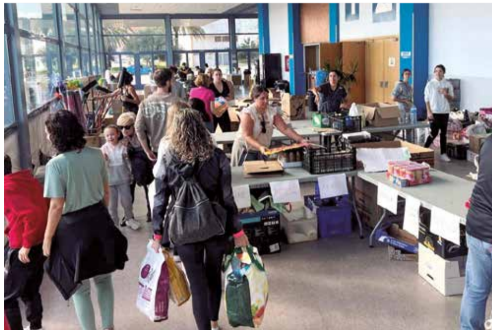
Centros para que la población deposite materiales y comida, entre otros.

La Generalitat anuncia ayudas iniciales de 250 millones de euros para ayudar a los afectados. El presidente del Gobierno, Pedro Sánchez, garantiza en Valencia la colaboración “por tierra, mar y aire”, y el líder del PP, Alberto Núñez Feijóo, afirma, también en Valencia, que se trata de una “emergencia nacional”.