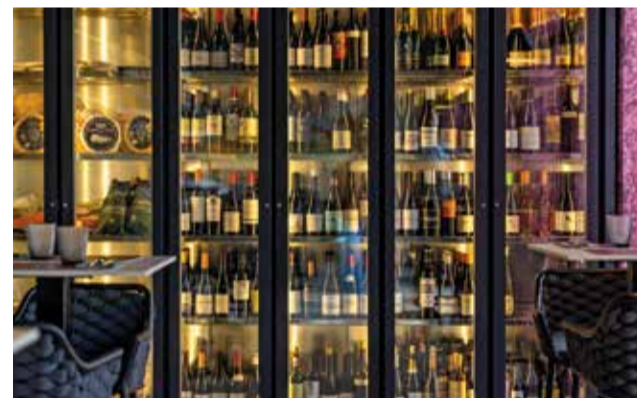
Selecció de vins. / OLIVA NOVA

La intenció del nou responsable gastronòmic és atraure tant el públic de localitats properes com al de ciutats dins d'un radi que va des d'Alacant fins a València. «Amb els espais que tenim i la proposta de cuina, crec que tenim qua-