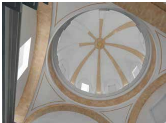
Restauració de la Capella de l'Assumpció / EPDA