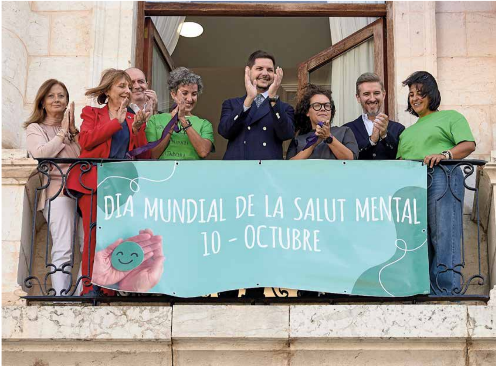
Membres de l'equip de govern de Gandia en l'acte pel Dia de la Salut Mental.