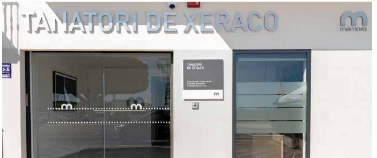
El nou tanatori de Mémora al municipi de Xeraco.

El Tanatori Mémora Xeraco es troba estratègicament ubicat al nucli urbà, a Ronda Bruguieres, en una zona accessible i pròxima al cementiri local i a la Parròquia de Nostra Senyora de l'Encarnació. Les modernes instal·lacions inclouen dues sales de vetlla dissenyades per oferir un ambient càlid i respectuós, garantint que les famílies puguin acomiadar els seus éssers estimats en un espai adequat i confortable. A més, el tanatori ofereix serveis tant per a inhumacions com per a cremacions, adaptant-se a les preferències de cada famí-