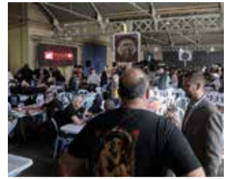
Festival Solidari