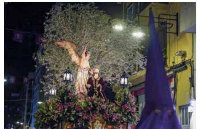
Processó de Setmana Santa.