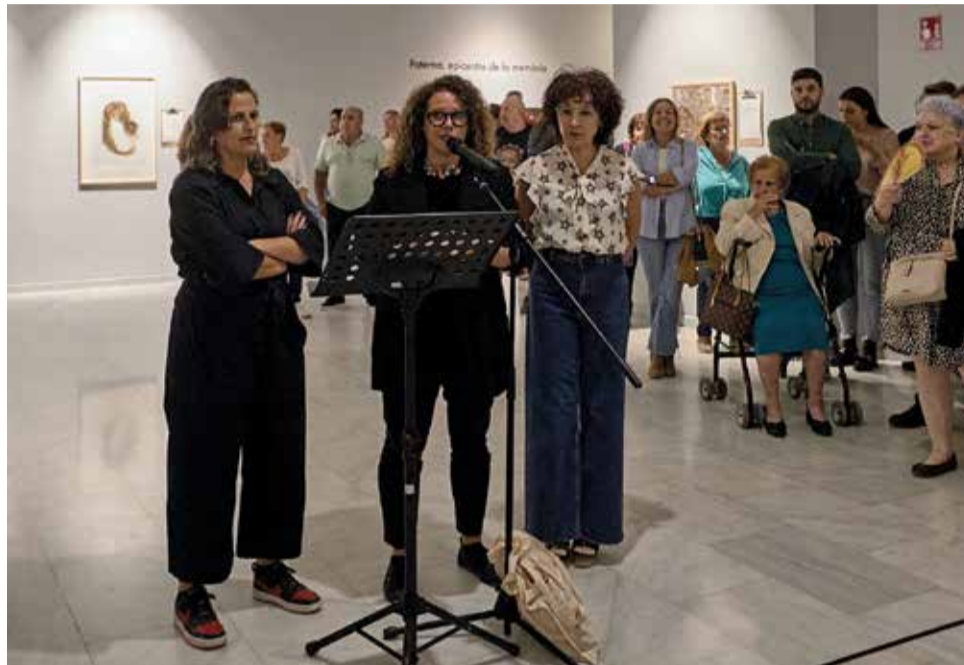
Presentació de 'Memòria de l'oblit. La repressió franquista a la Safor'.

L'exposició està formada per més d'un centenar de fotografies d'Eva Mániz, que ens acosten a les històries de mig centenar de veïns i veïnes represaliats durant el franquisme, que ens contenen sense ira ni nostàlgia les seues històries familiars que revelen com van ser aquells anys de sospita i silenci marcats per la fam, la repressió i el nacionalcatolicisme. Des de les fosses de Paterna o Gandia fins a les històries de l'estraperlo, exilis, presó, les rapades o la repressió sexual. Un exercici de memòria democràtica per a recuperar 40 històries