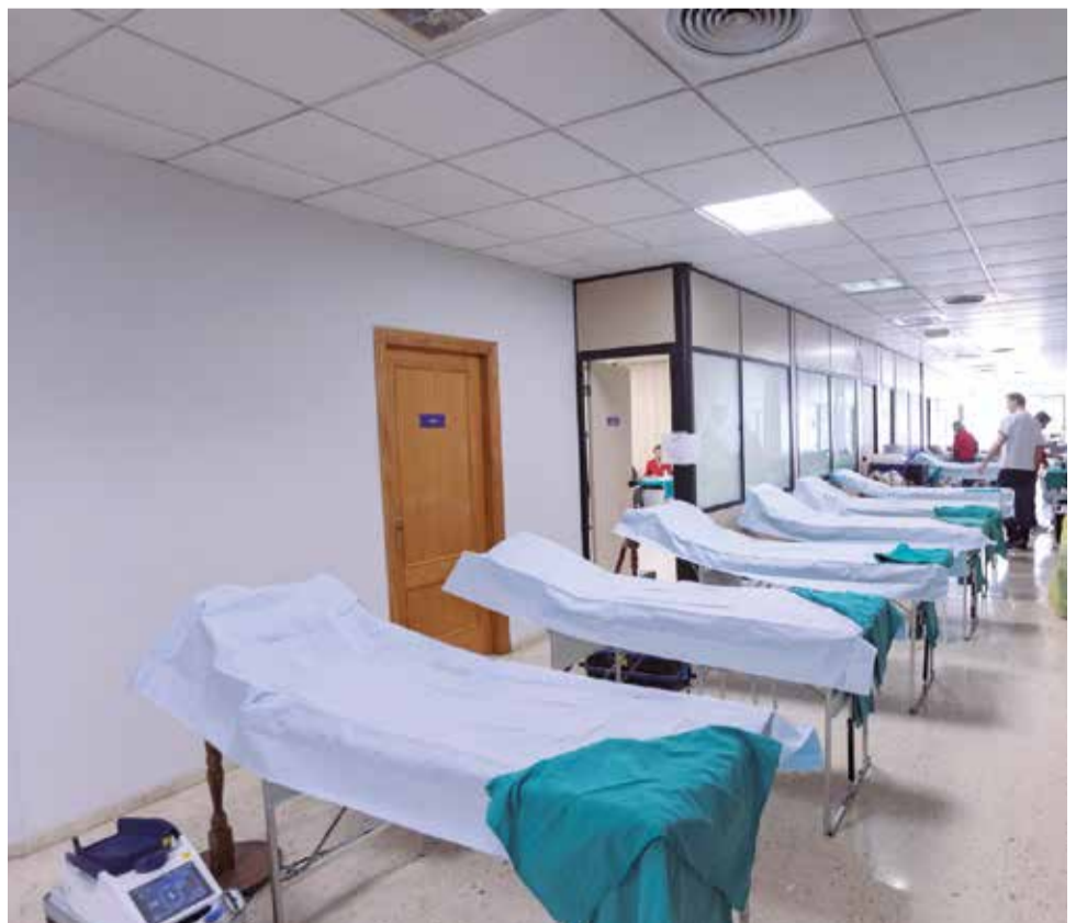
Centre de Transfusió.

Amb aquesta iniciativa, el Centre de Transfusió, la Generalitat i l'Ajuntament de Gandia volen agrair la implicació dels ciutadans en aquest acte de solidaritat que té un impacte directe en la vida de moltes persones i famílies.