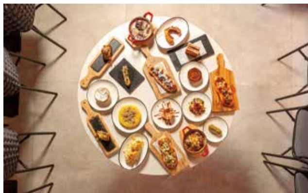
Gastronomia d'Oliva Nova. / OLIVA NOVA

que esperava i amb el qual es troba còmode, com ell mateix afirma: «He tingut la sort de trobar-me amb professionals ben formats, amb experiència, i que m'han donat suport des del primer moment».