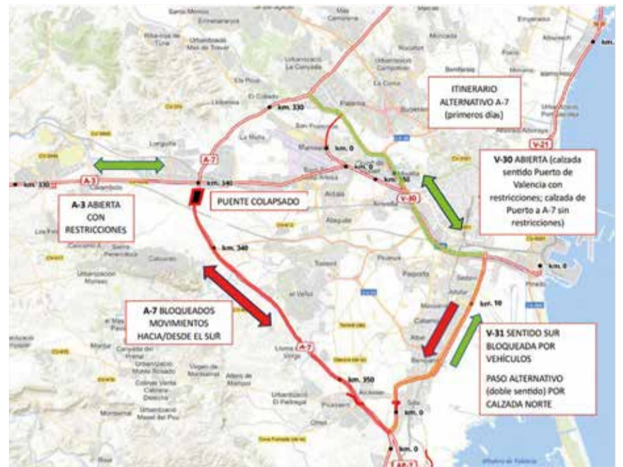
Mapa de vies afectades. / EPDA

de diversos accessos viaris. La A-7 ha patit danys greus, amb un pont en la zona de Quart de Poblet que ha quedat afectat, provocant el tancament de la via. El ministre de Transport, Óscar Puente, ha avançat que, mentre es realitzen les reparacions, s'implementaran solucions alternatives en la mateixa autovia. Això ha obligat a redi-