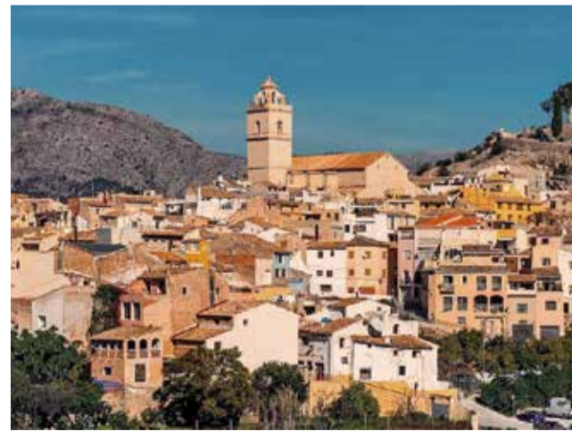
Vista del municipi de Beniflà.

“No devem res als bancs, tenim un pressupost inicial de 491.104,40 € que sumat a les ajudes i subvencions es tancarà en 1.588.389,40 €”, ha conclòs el primer edil de Beniflà.