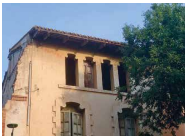
Escola infantil municipal Wilson que cau a trossos