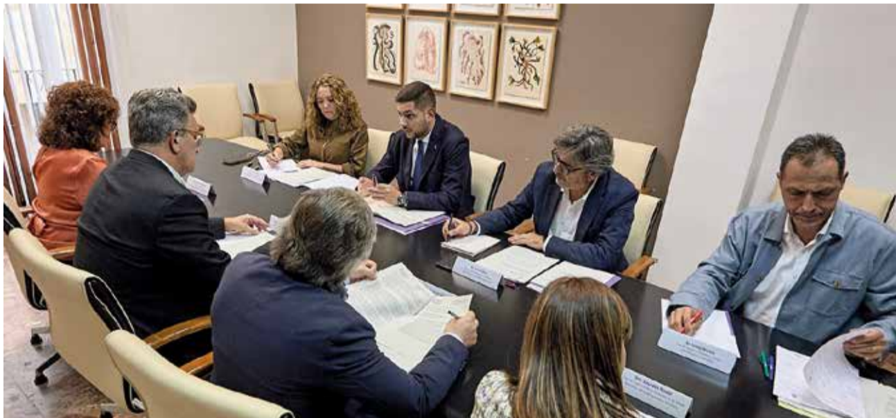
Un instant de la trobada entre l'Ajuntament de Gandia i la Conselleria de Medi Ambient.

Durant la reunió, el conseller ha informat que ja s'ha iniciat el procés de licitació de la redacció del tram de Palma de Gandia-Gandia de la CV-60. D'aquesta manera, tots els trams d'aquesta via transversal de la xarxa de carreteres autonòmica que connecta, d'oest a est, les comarques de l'Alcoià, el