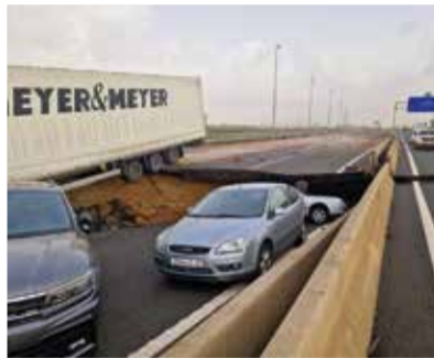
Destrosses de la DANA.

València i Madrid ha estat també suspesa, així com els serveis de llarg i mitjà recorregut que unixen València amb Alacant, Múrcia, Albacete i Teruel.