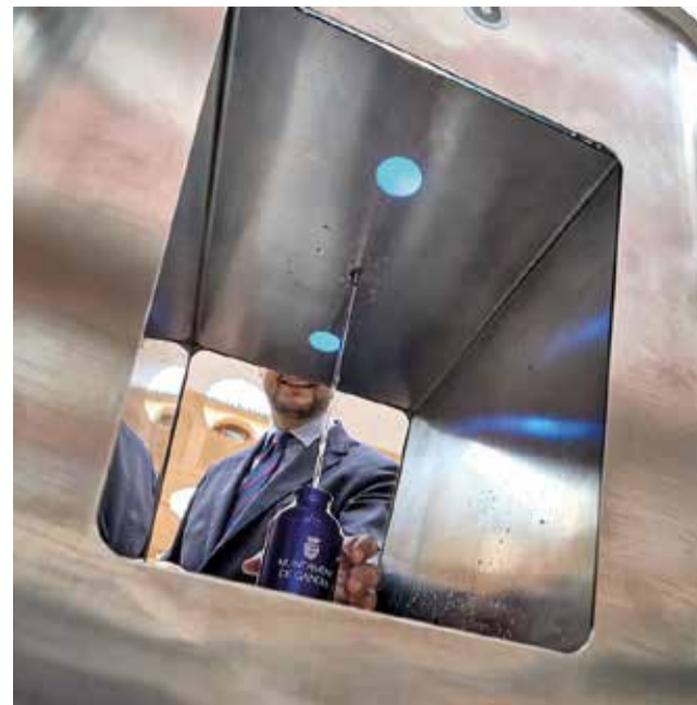
Font pública d'aigua en la plaça Rei Jaume I.