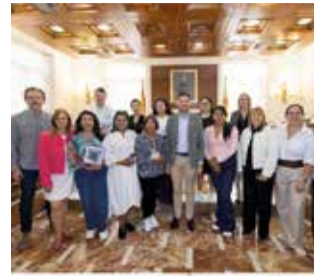
Reunió en Gandia.