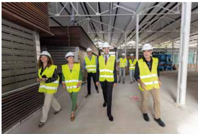
Visita institucional a les obres del mercat.

La reforma del Mercat del Prado està enfocada a la modernització i millora de la competitivitat. Es preveu l'ampliació del nombre de locals, que passen de 9 a 13, i s'incorporen tecnologies que ajudaran a crear un espai més humà i vivible. Així mateix, s'ha millorat l'eficiència energètica i s'ha instal·lat un nou sistema de climatització