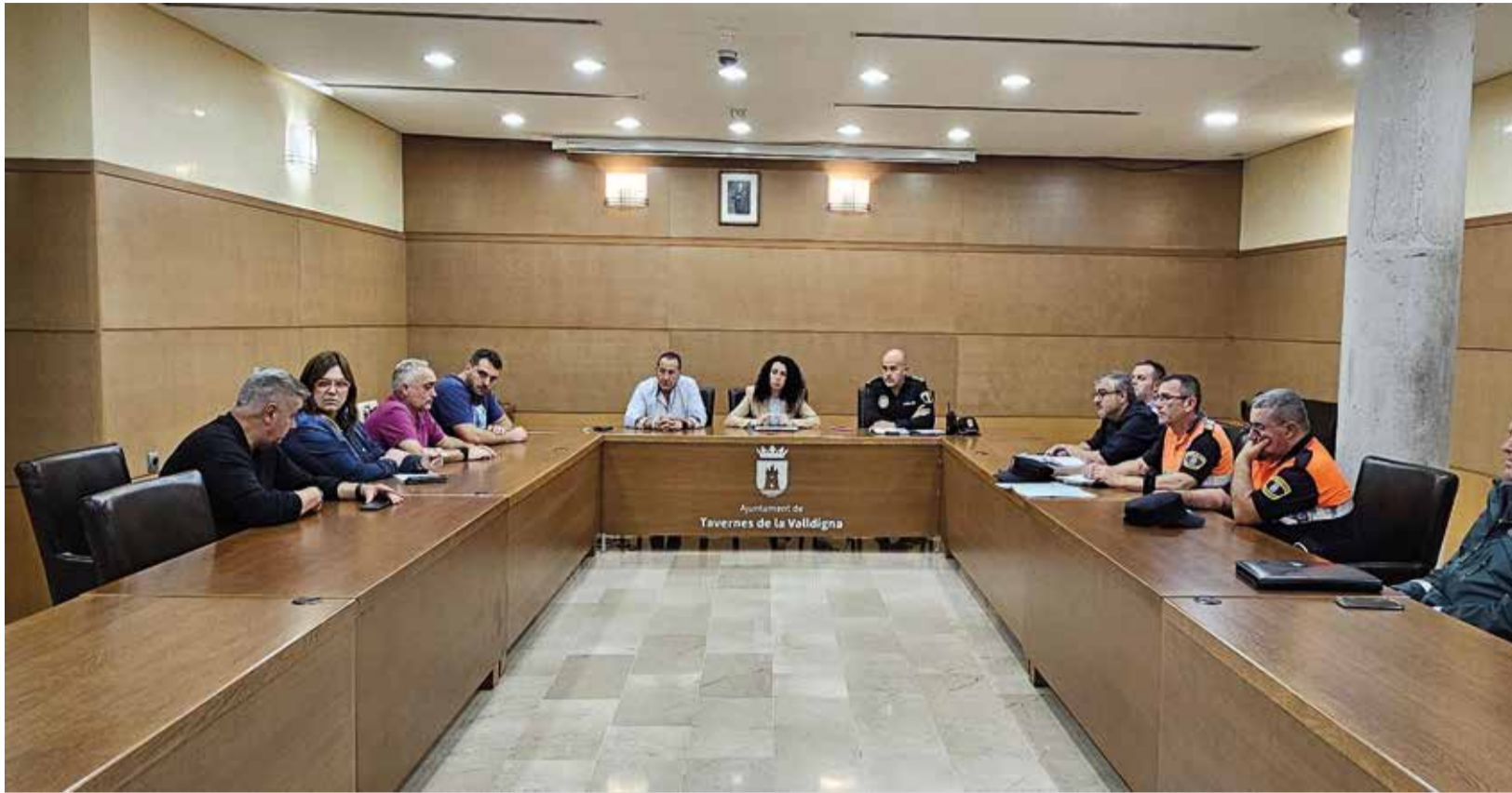
Reunió extraordinària de la Junta de Seguretat Local de l'Ajuntament de Tavernes.