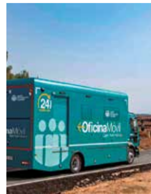
Oficina móvil.

La oficina bancaria móvil no solo dispondrá de un cajero automático, sino que tam-