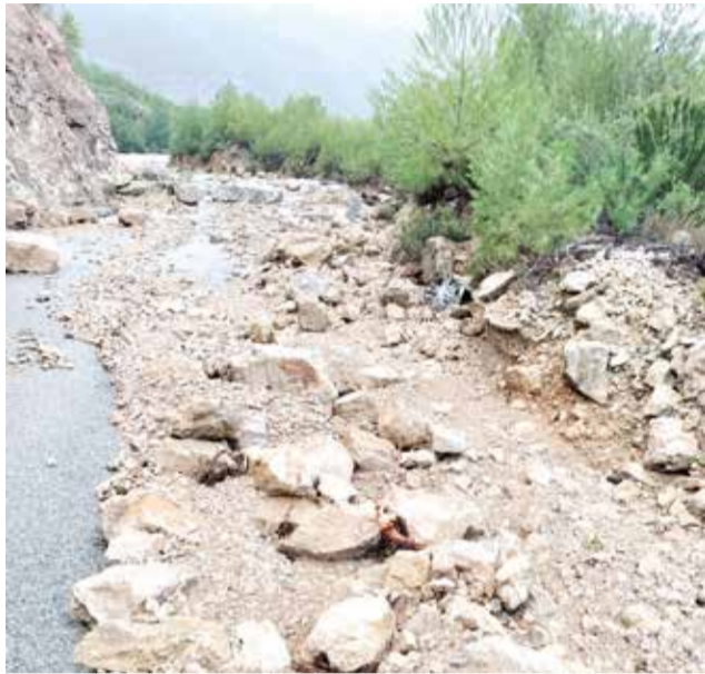
Carretera a Benagéber desde Tuéjar.

Durante el temporal, se registraron entre 360 y 380 litros por metro cuadrado de precipitación, lo que provocó deslizamientos de tierra y socavones. La carretera CV-390, que conecta Tuéjar con Benagéber, tuvo que ser cerrada en el kilómetro 13 debido a estos problemas. A pesar de la situación crítica, la Conselleria ha comen-