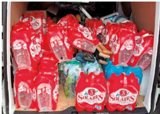
Vehículo cargado con agua y herramientas.

A lo largo de la primera semana tras la tragedia,