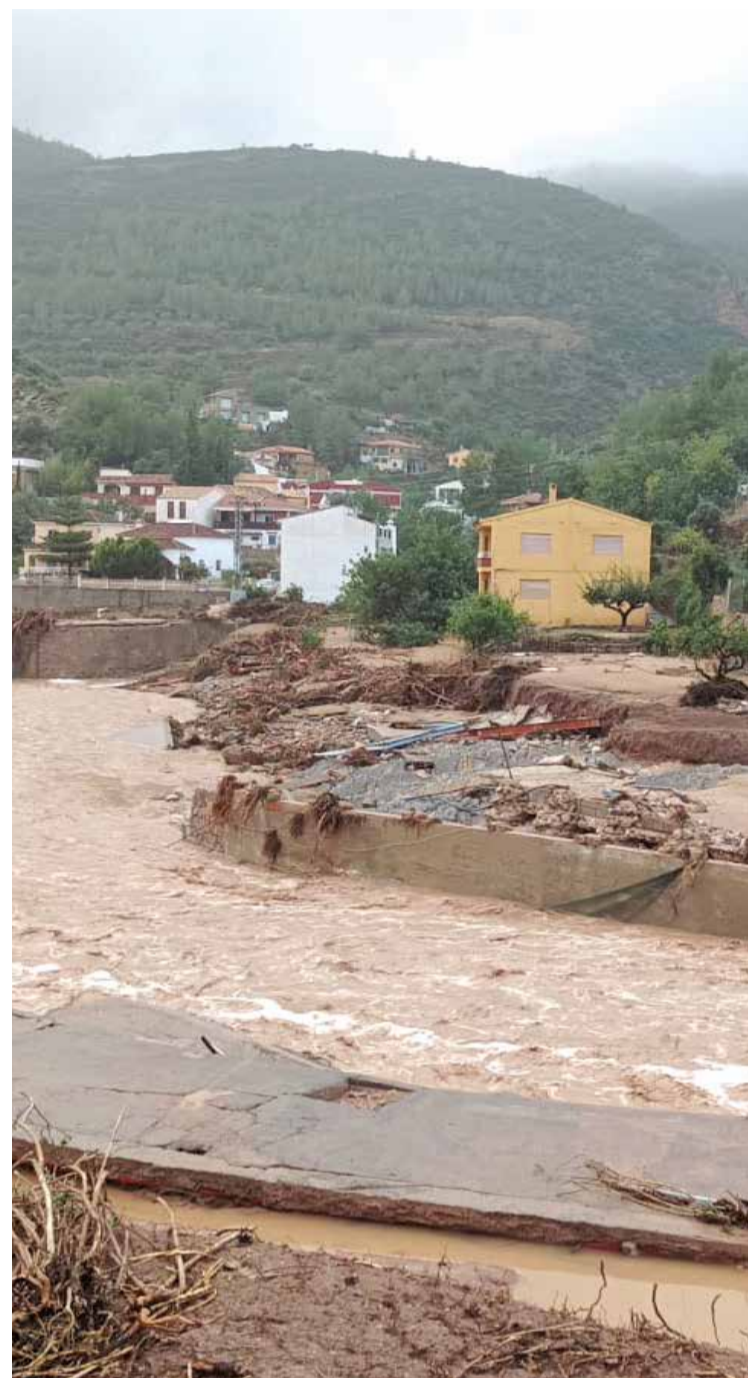
Consecuencias de la DANA en Sot de Chera.