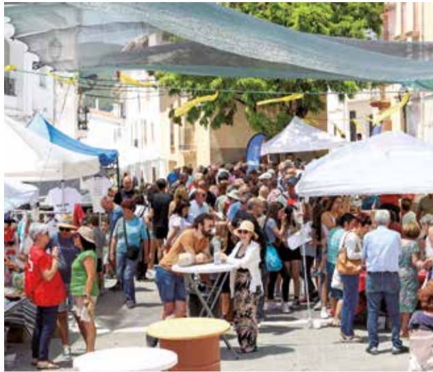
El nuevo equipo local pone en marcha mejoras en las diferentes áreas del municipio.

Asimismo, se ha restaurado el agua en la histórica fuente