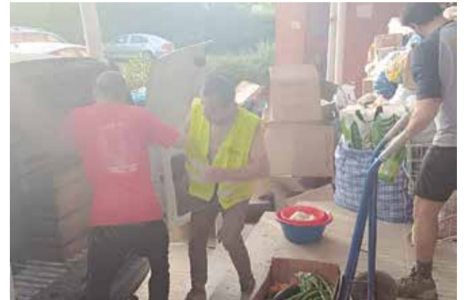
Vecinos y voluntarios cargan una furgoneta.

Una vez recuperados, los vecinos y vecinas de Bugarra convirtieron el municipio en un centro de ayuda para otras localidades más afectadas por la DANA.