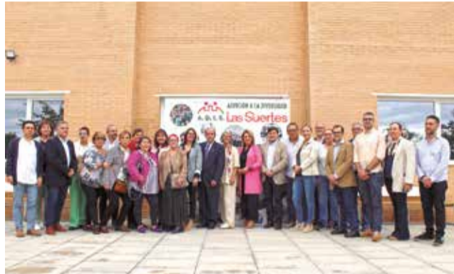
Autoridades en el acto inaugural.

El nuevo edificio consta de dos plantas, con una superficie construida de 1.849,11 metros cuadrados. En la planta baja se ubican cuatro aulas-taller, un