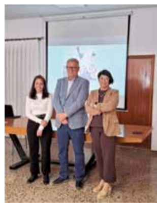
Presentación.