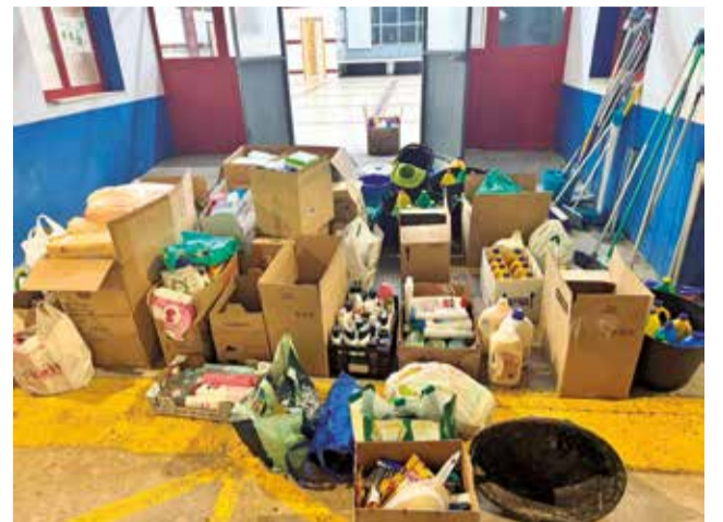
Enseres recogidos en Tuéjar.

La solidaridad de Tuéjar se hizo evidente desde el inicio, ayudando a municipios cercanos como Sot de Chera, y ha continuado de manera ininterrumpida durante el segundo fin de semana de noviembre hasta localidades más distantes de l'Horta Sud. En estas zonas, se ha trasladado toda la ayuda recolectada por el Ayuntamiento y diversas asociaciones locales. Además, varios vehículos to-