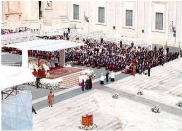
Un instante durante el acto en El Vaticano.

Unos 60 peregrinos, entre ellos la alcaldesa, procedentes de Alpuente, municipio al que pertenece la 'Aldea del Chopo' donde nació el beato Francisco Pinazo Peñalver, y la de la ciudad de Valencia, que lleva su nombre, viajaron a Roma para asistir al acto de canonización.