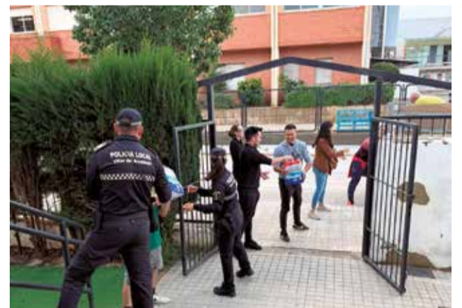
Recogida de enseres.

Una vez identificadas las necesidades de los pueblos de la comarca, tras reuniones de coordinación con los alcaldes y alcaldesas de las zonas afectadas, se les ha hecho llegar en primer lugar y de manera urgente maquinaria, tanto municipal como de particulares, a Bugarra y Pedralba para actuar en la limpieza de calles enfangadas. También se ha enviado la comida recogida a las poblaciones de Gestalgar y Pedralba,