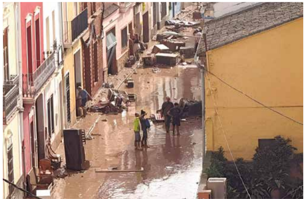
Vecinos en la calle de la Acequia de Pedralba tras la riada.

Cuando llegó la UME, nos decían que no había ningún municipio tan organizado; desde el Ayuntamiento aprovechamos la oleada de solidaridad, si no a día de hoy seguimos con el agua al cuello”