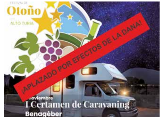
Cartel informativo.

El Festival de Otoño del Alto Turia es un esfuerzo innovador para desestacionar el turismo, destacando los atractivos culturales, gastronómicos y naturales de los cinco municipios que in-