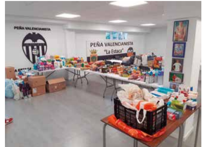
Recogida solidaria en Higueruelas.

Gracias al esfuerzo conjunto, varios vehículos llenos de alimentos y productos de primera necesidad fueron enviados a distintas zonas de la provincia, contribuyendo a aliviar las necesidades de aquellos que lo han perdido todo a causa del temporal. Los ciudadanos de Higueruelas han respondido con generosidad a la convocatoria, haciendo llegar una gran cantidad de donacio-