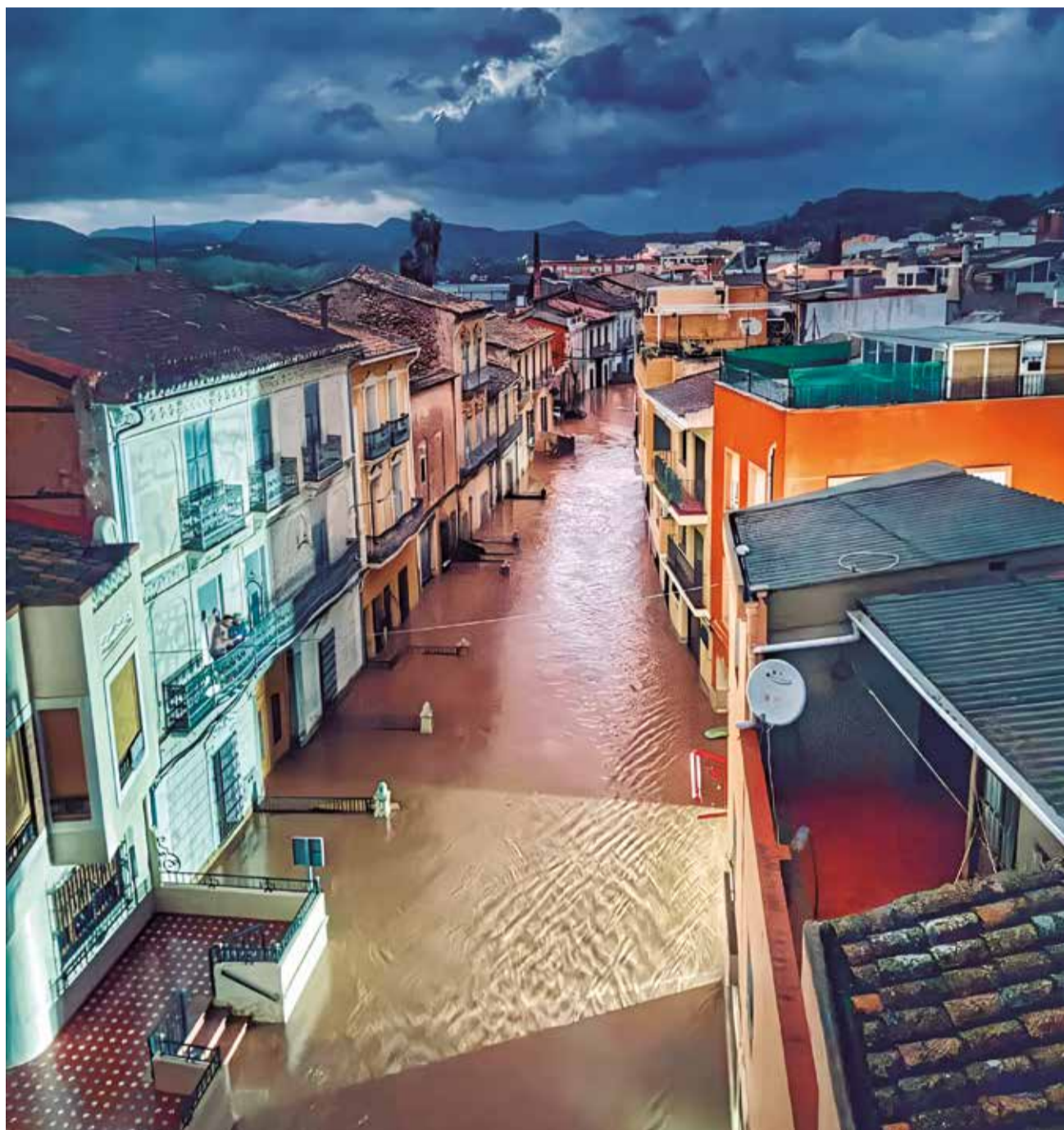
La calle de la Acequia de Pedralba tras la riada del pasado 29 de octubre.