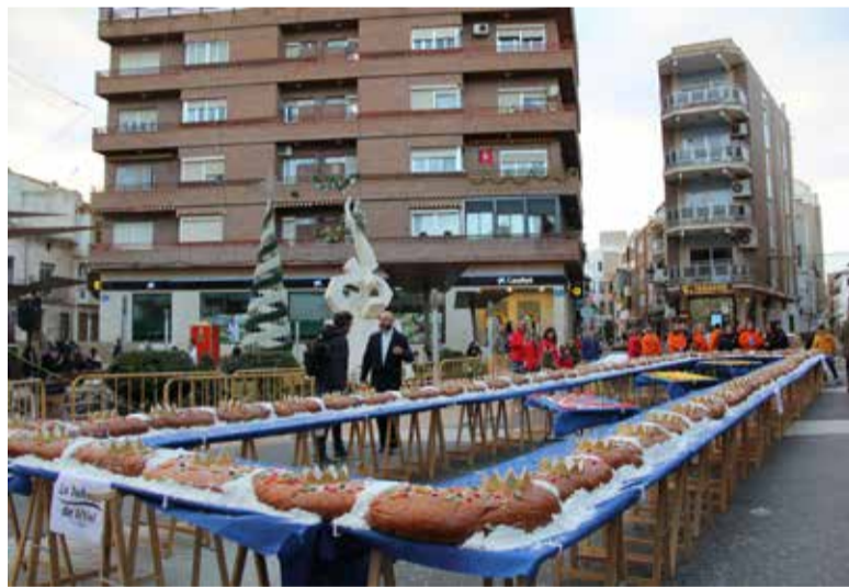
Roscó gegant d'Utiel.

D'altra banda, la Fira d'Artesania de la Comunitat Valenciana, instal·lada en la Plaça de la Reina a València, és el lloc ideal per als qui busquen productes fets a mà, des de ceràmica fins a joguets de fusta. En molts municipis, els