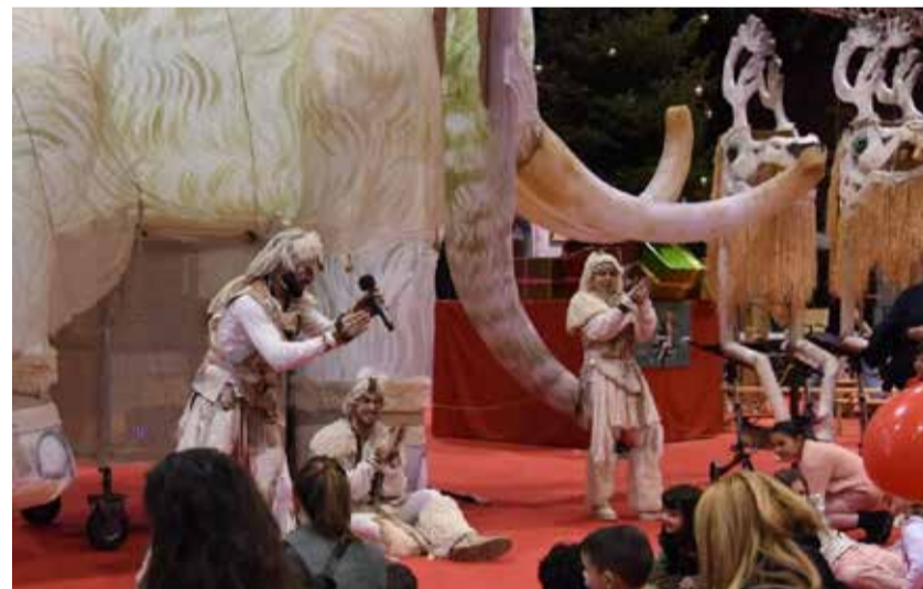
Expojove de València.

En Any Nou, no pot faltar el ritual del raïm, i en Reis, el Roscò de Reis, decorat amb fruites confitades, posa el fermall d'or a les celebracions.