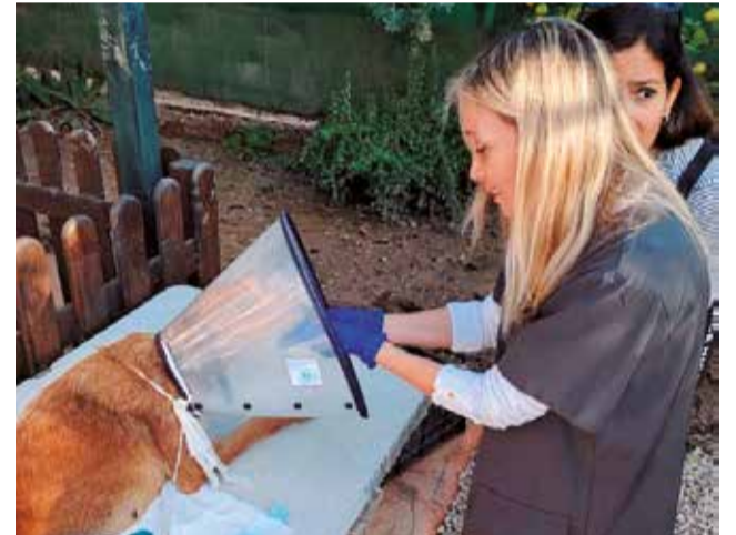
Atención a los animales.