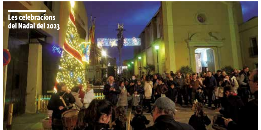
Les celebracions del Nadal del 2023

Els més menuts gaudiran d'una matinal infantil amb jocs tradicionals i la visita del Pare Noel a partir de les 10:30 hores a la carpa de l'Avinguda Blasco Ibáñez.