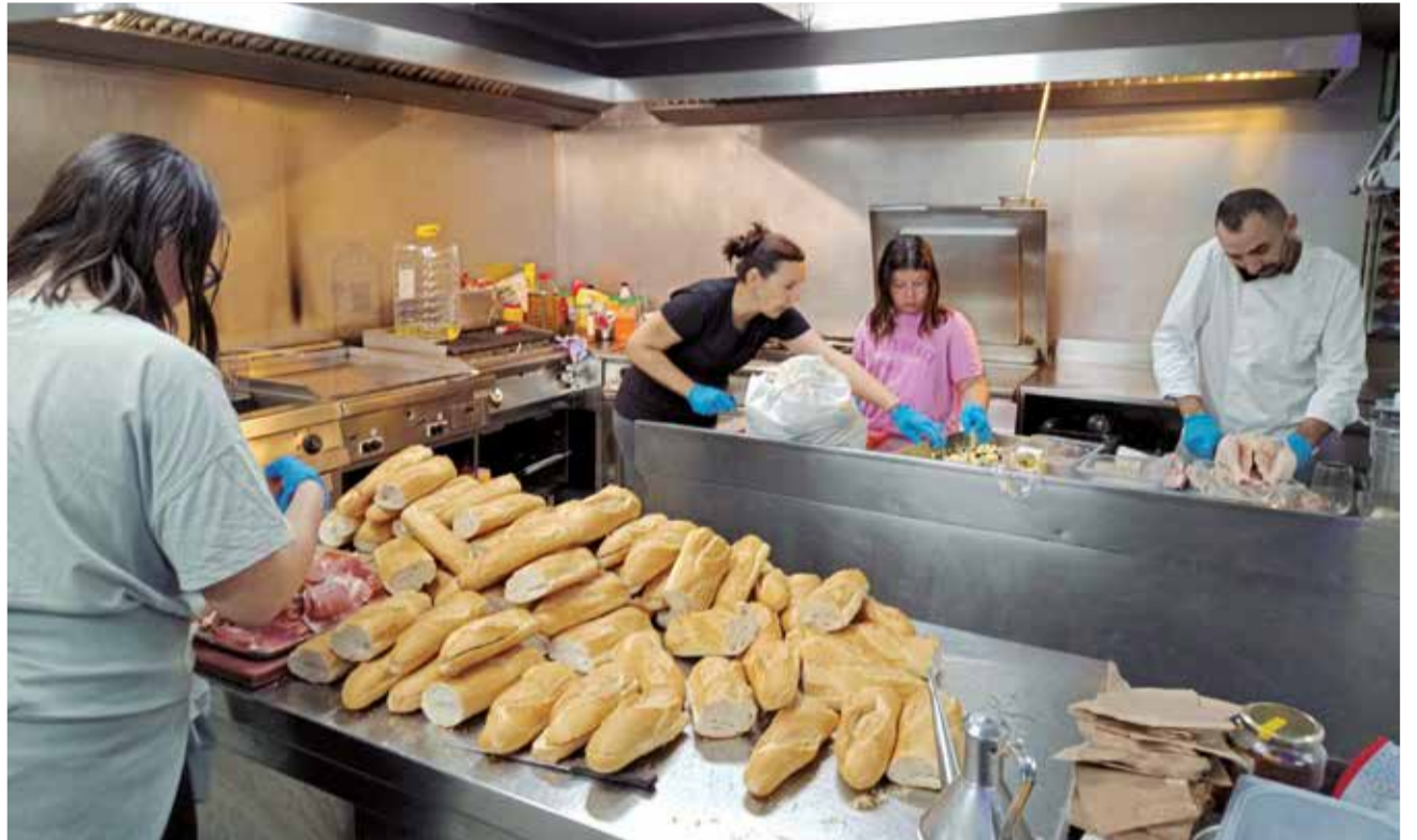
Voluntarios de El Puig elaboran bocadillos para repartir entre los afectados.

Por su parte, el Ayuntamiento de Albuixech sigue recogiendo bicicletas para cubrir necesidades de movi-