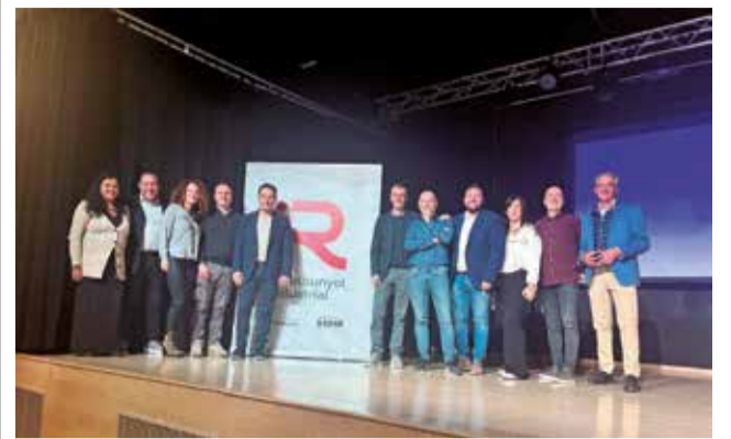
Empresarios y autoridades.