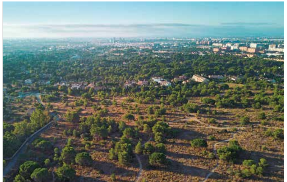
Una vista aèria de Godella.

La Comunitat Valenciana es posiciona com la sisena autonomia amb menors oportunitats de renda de tota Espanya