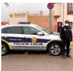
Un policía local.

Tras las denuncias recibidas por el robo de dinero, joyas y diferentes enseres personales en viviendas