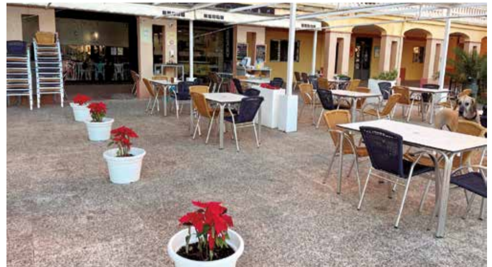
La decoració nadalenca en Enclave de Mar.

La capital de l'Horta Sud, Torrent, tindrà este any una ca-