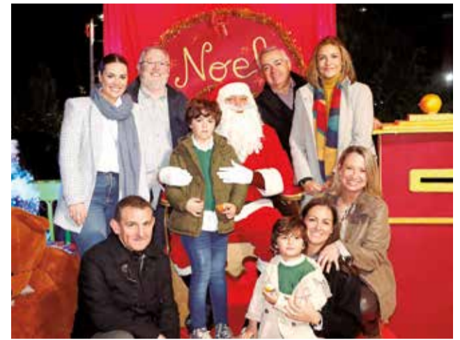
La visita de Papá Noel el año pasado.

No te pierdas esta cita imprescindible con la magia de la Navidad. Acércate los días 14 y 15 de diciembre a la avenida Mancomunitat de l'Horta Nord y vive un fin de semana inolvidable junto a Papá Noel y todo el espíritu navideño que Puçol tiene preparado para ti.