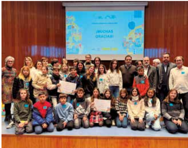
El alcalde de Paterna, con el Consell de la Infancia.