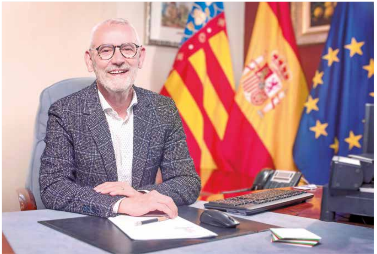
El primer edil de Alboraya en su despacho.

► Estamos trabajando mucho para que La Patacona consiga deshacerse del polígono industrial abandonado y en su lugar se ubique un eco-barrio puntero en sostenibilidad y que cubra las principales demandas del núcleo: viviendas protegidas, comer-