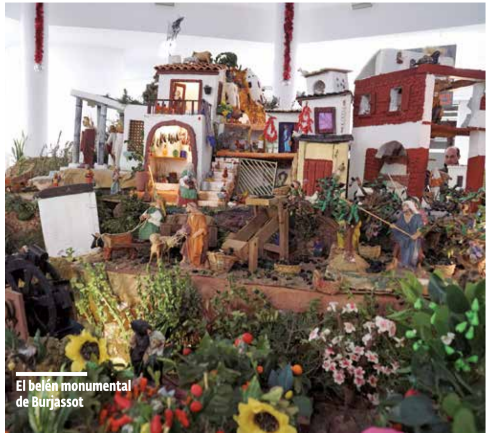
El belén monumental de Burjassot

A todas estas actividades se unen las Rutas Culturales a Los Silos y el cine de Navidad que, de seguro, también ofrecerá grandes estrenos cinematográficos. Todo, sin necesidad de salir de Burjassot.