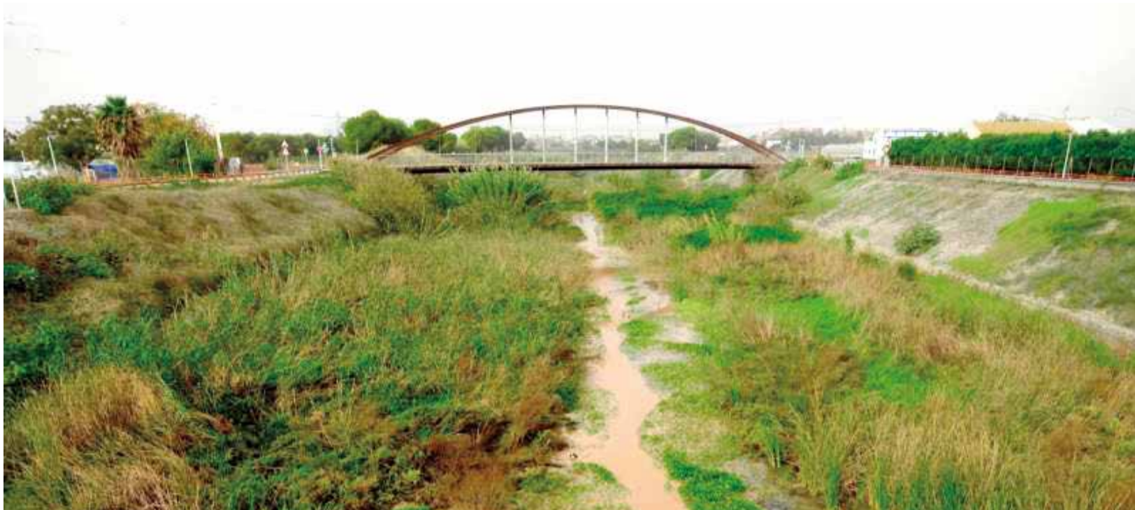
El cauce del barranco del Carraixet a su paso por el término municipal de Alboraya.

LOS ALCALDES REIVINDICAN ANTE LA CHJ UN MANTENIMIENTO ADECUADO DEL CAUCE PARA EVITAR INUNDACIONES