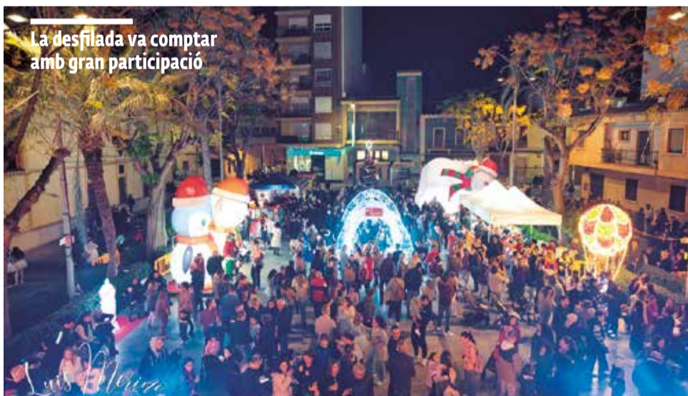
La desfilada va comptar amb gran participació

L'ESDEVENIMENT VA OMLIR DE FESTA ELS CARRERS DEL CENTRE URBÀ I DE LA PLATJA