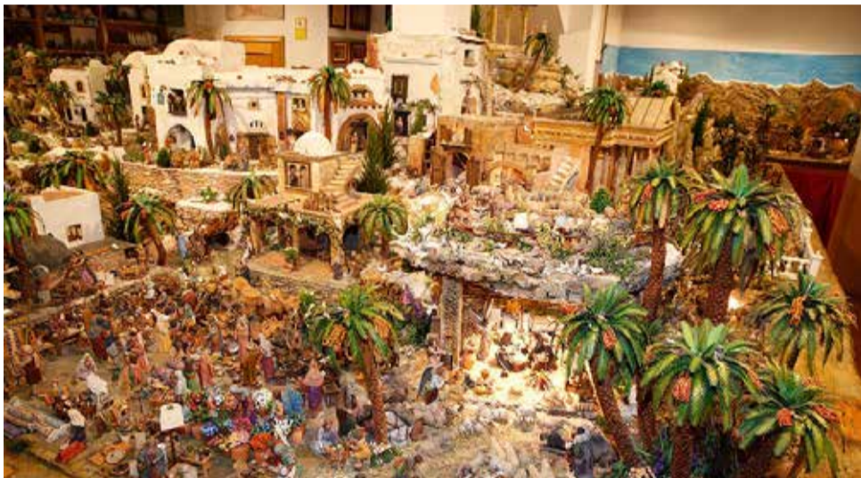
Betlem de Meliana.

► MERCATS NADALENCs. Un dels primers indicis de l'arribada de Nadal són els mercats que florisquen en places i carrers.