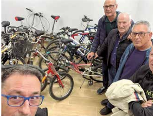
Recogida de bicis en Albuixech.