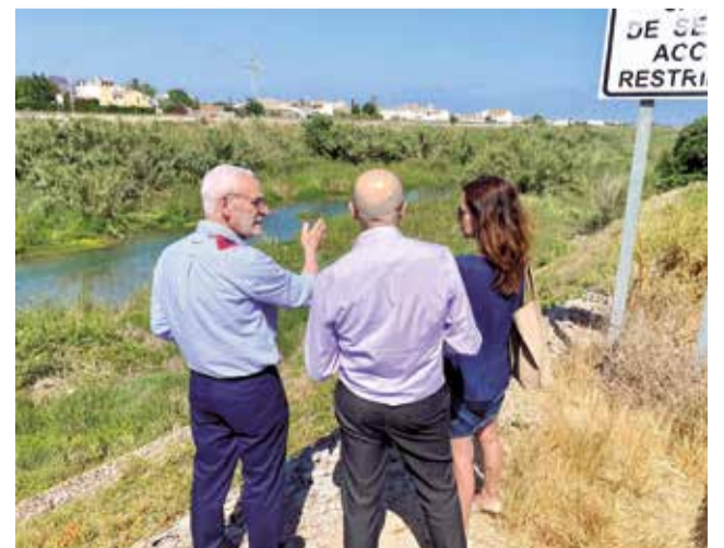
El alcalde se reúne con la CHJ. / EPDA

Debido a que no se han vuelto a retomar y a no disponer de una fecha, el consistorio continúa emitiendo las peticiones particulares y, ahora, la conjunta.