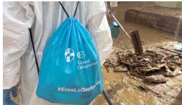
Algunos de los voluntarios colaborando en municipios afectados por la DANA.