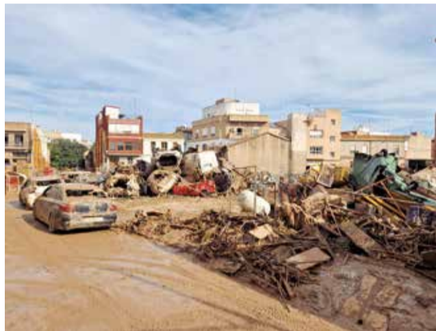
Diferentes actuaciones de limpieza en las calles arrasadas por la riada en Albal.

acto muy emotivo, en el que gran parte de las personas que han participado en la limpieza y reconstrucción del centro han recibido, en-