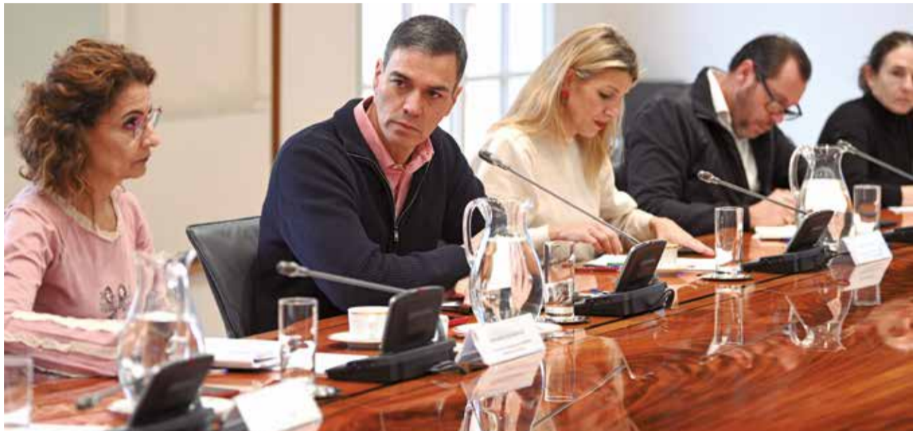
El Gobierno de España durante la reunión del comité de crisis para el seguimiento de los efectos de la DANA.

de la actividad de empresas afectadas por la dana.