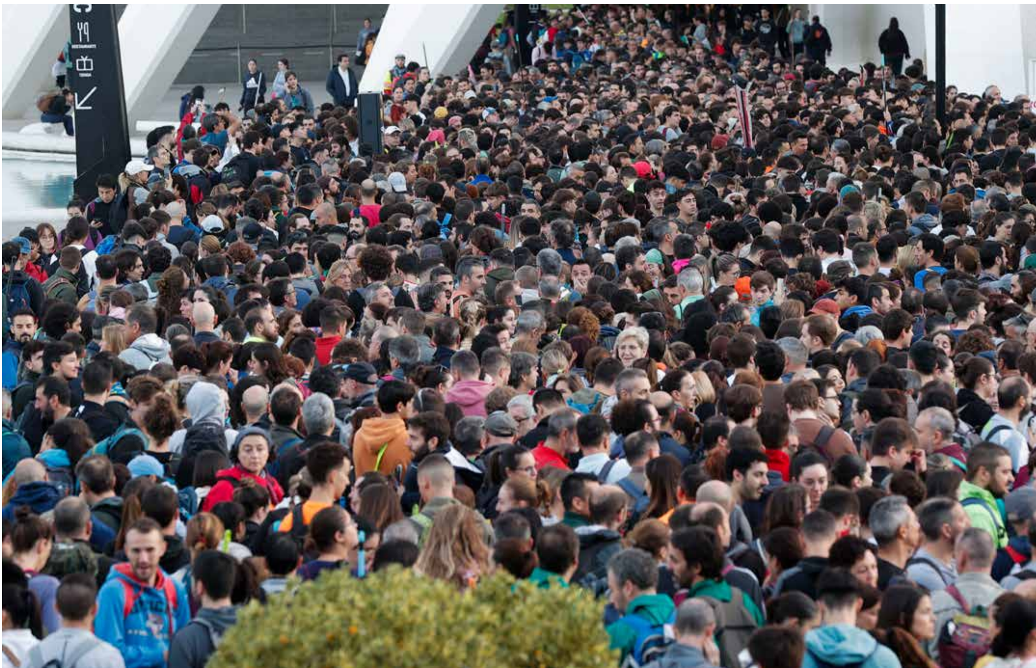
Una marea de voluntarios organizados desde la Ciudad de las Artes y las Ciencias esperando los autobuses de la Generalitat Valenciana.