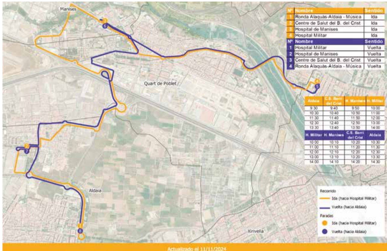
Línea de bus especial para acudir al Centro de Especialidades de Mislata desde Aldaia.

Además, se han suprimido temporalmente las restricciones para acceder a medicamentos sin la tarjeta SIP, permitiendo la dispensación con recetas en papel. Los tratamientos crónicos se prolongarán automáticamente, y las recetas oficiales seguirán siendo válidas para la prescripción de me-