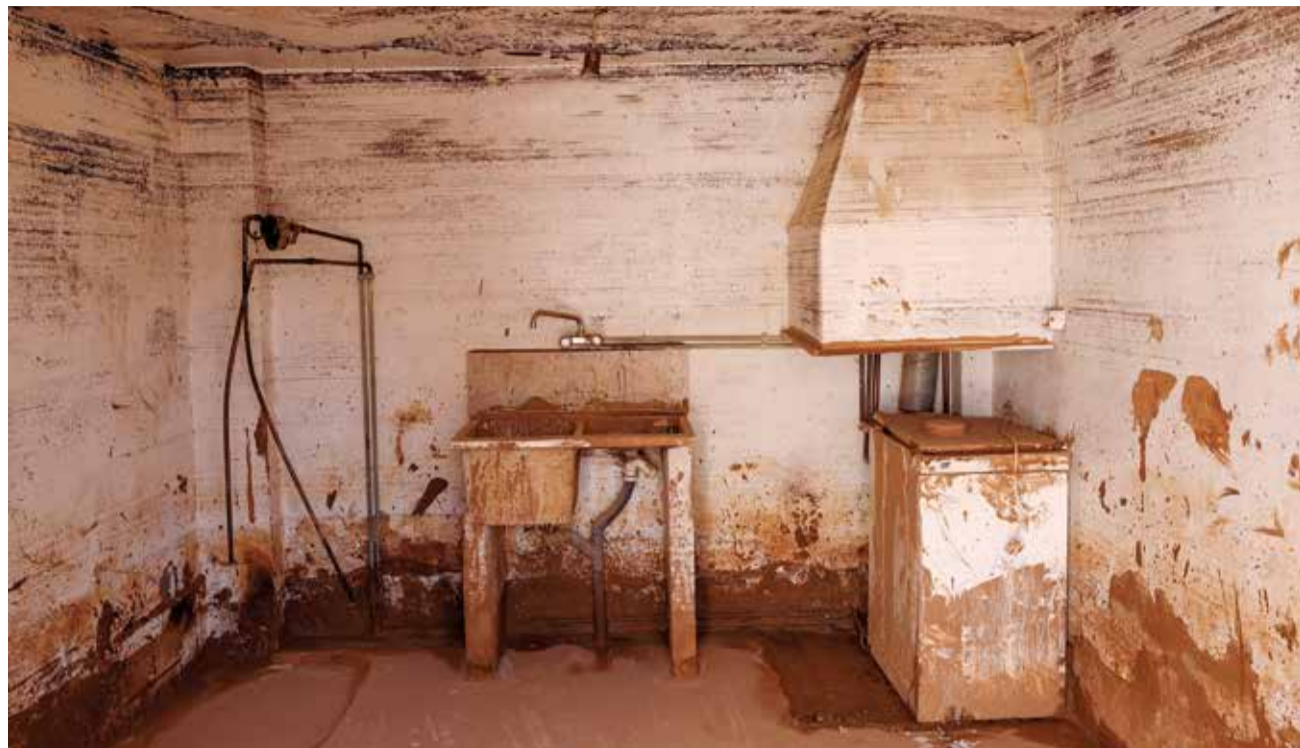
El interior de una vivienda afectada tras el paso de la riada en unos de los municipios de la zona cero

La labor de los arquitectos técnicos en estas inspecciones es crucial para identificar los problemas, clasificarlos según su gravedad y establecer las prioridades de actuación. Este trabajo garantiza la seguridad de los afectados y proporciona a las administraciones un diagnóstico detallado para coordinar las ayudas