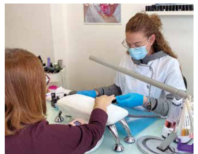
Algunos de los municipios de Aldaia que pudieron levantar la persiana tras varias semanas de ayuda.