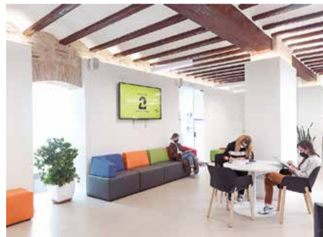
Centre Gent Jove de Aldaia. / EPDA