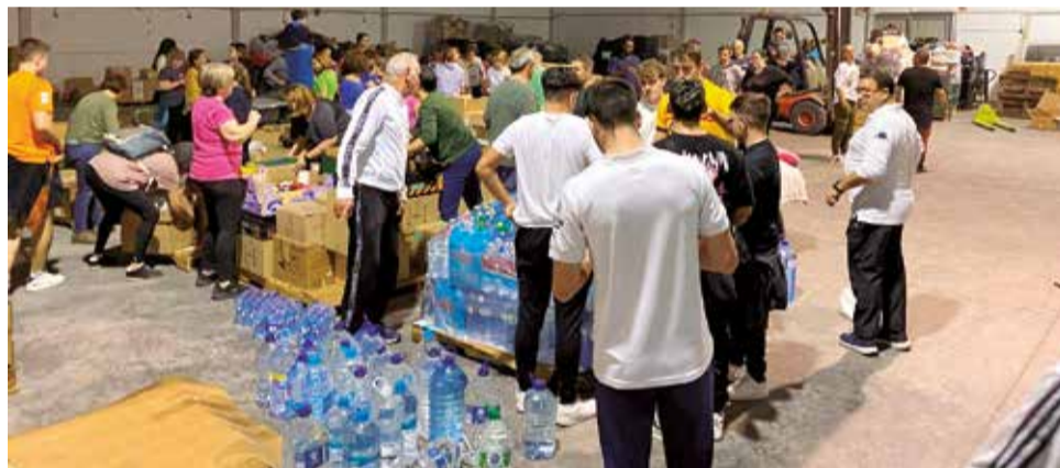
Voluntaris arreplegant menjar i material per als damnificats per la DANA.