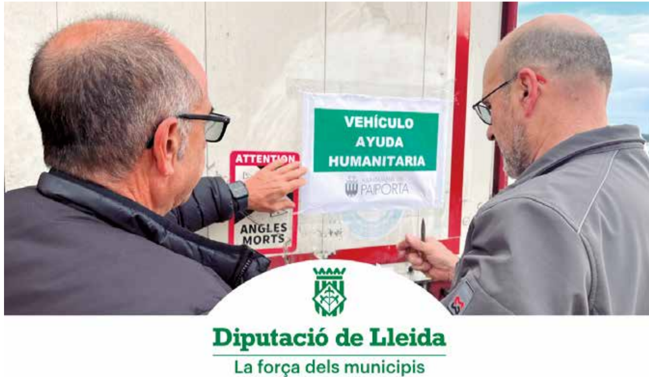
Un dels camions amb ajuda humanitària destinada a diferents municipis afectats.

La Diputació de Lleida ha canalitzat la solidaritat dels municipis de les Terres de Lleida amb les persones afectades per la DANA gràcies als ajuntaments d'Aitona, Albatarrec, Albesa, Alcoletge, Almacelles, Almatret, Alfés, Artesa de Lleida, Aspa, Bellguarda, Bellpuig, Benavent del Segrià, Butsènit d'Urgell, Cervera, Corbins, Fuliola, Gimènells, Granyena, Ivars de Noguera, Juncosa, la Granadella, les Avellanés i Santa Linya, Llardecans, Menàrguens, Montgai, Montoliu de Lleida, Preixana, Seròs,