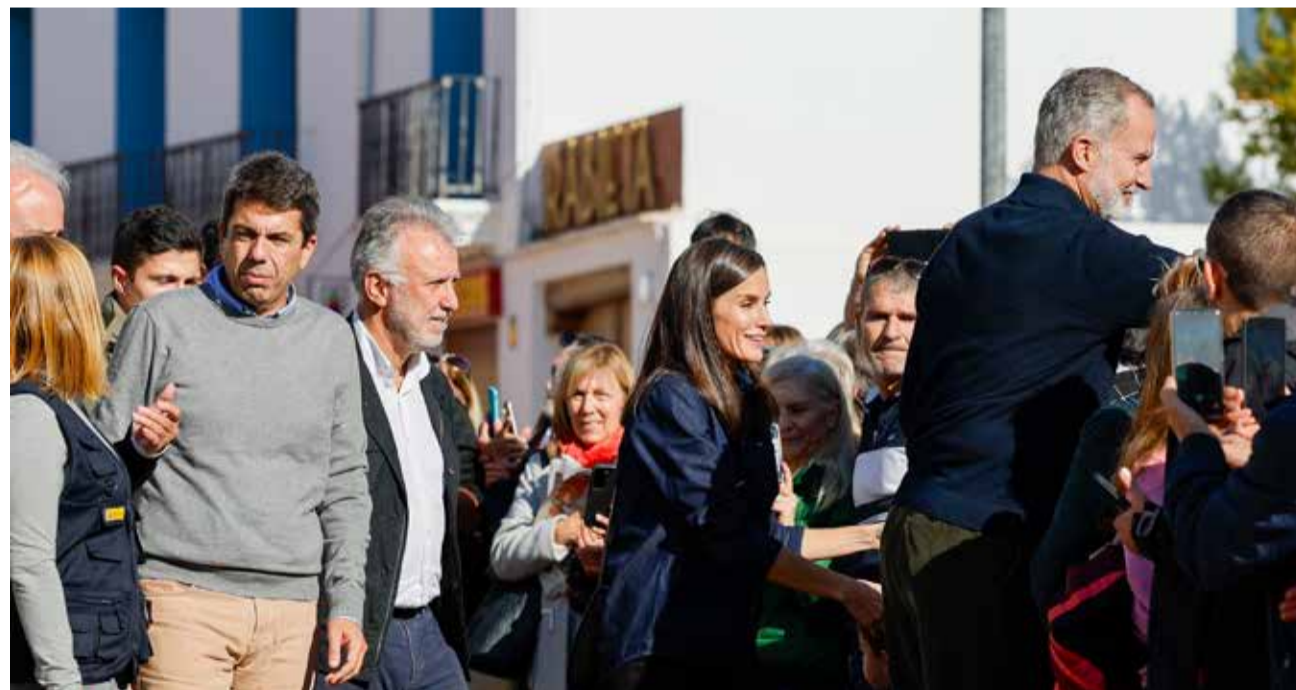
Público saluda a los Reyes de España en su visita a Utiel, a la que asiste Carlos Mazón.

para turismos, furgonetas y otros vehículos ligeros, y 400 millones de euros para vehículos pesados.