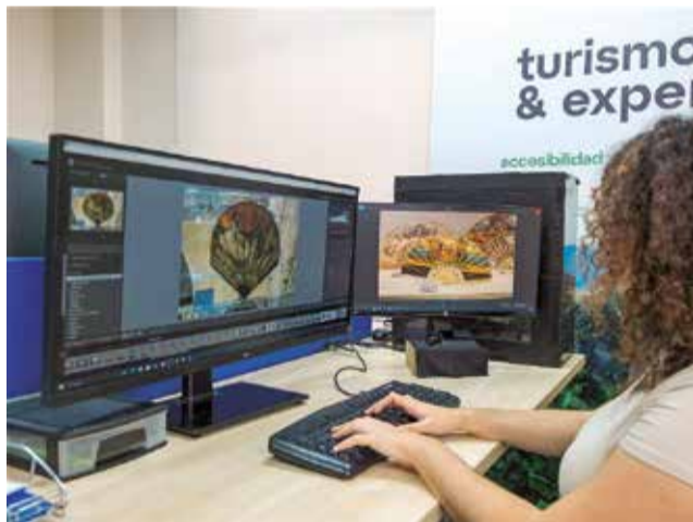
Treballadora al Museu Comarcal.

El MUPA, la Rajoleria i l'Alqueria del Pi formaven part del projecte de digitalització