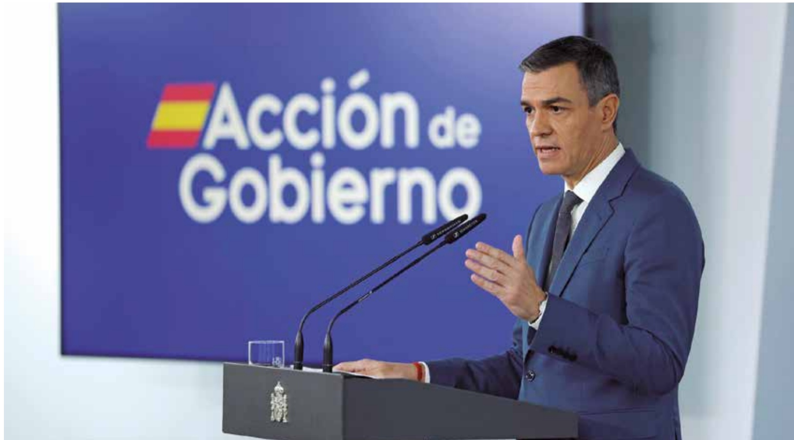
El presidente del Gobierno anunciando las ayudas económicas destinadas a los municipios afectados por la DANA.

Esta última se enfocará a la transformación necesaria pa-