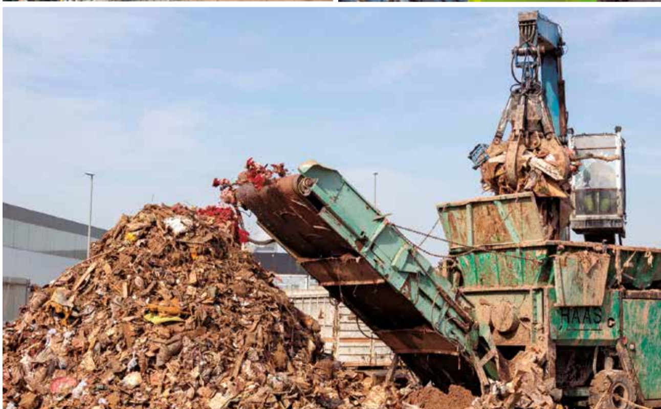
La EMTRE está realizando el mayor dispositivo de gestión de residuos de su historia.