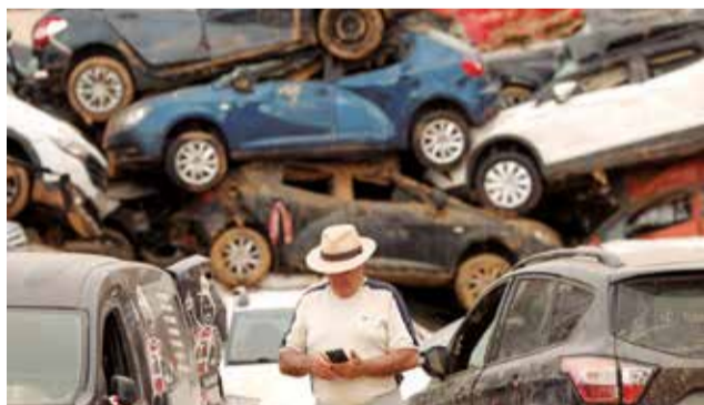
Coches amontonados en Benetússer.