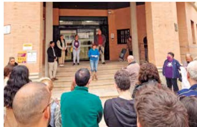
Albal alza la voz en el 25N.