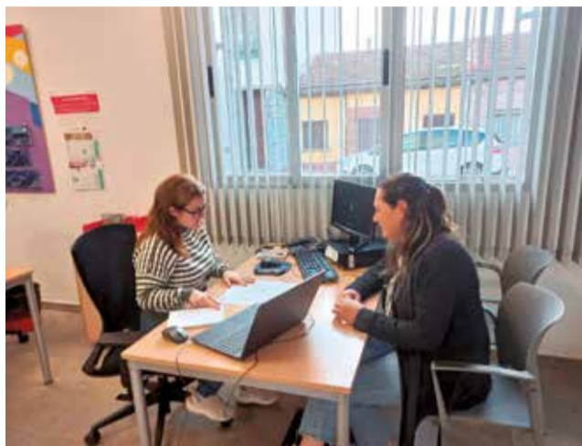
Les oficines de la Mancomunitat de l'Horta Sud.

Així, l'àrea de Negoci de la Mancomunitat està desenvolupant una intensa acció d'informació a comerços, empreses i persones autònomes dels tràmits que han de realitzar per a obtenir ajudes. A més de l'atenció directa i presencial en la seu de la institució (ubicada en el carrer Cervantes, 19, de Torrent), des del dia 19 de novembre, un equip de sis persones es desplaça a diari als municipis que han demanat el suport per a aju-