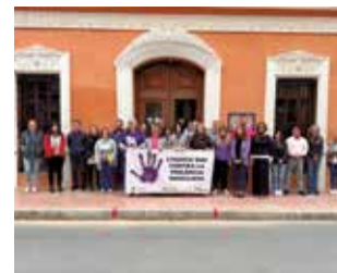
Concentració 25N.