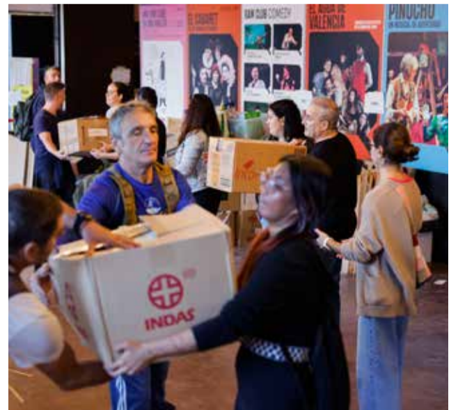
Los voluntarios ayudan en todo tipo de tareas: reparto de enseres, limpieza de lodo, cocinado, cortes de pelo...