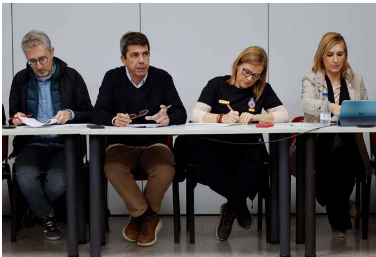
Reunión del Centro de Coordinación Operativa Integrada (Cecopi).

Así, Mazón ha recordado que los Presupuestos Generales del Estado -que ascienden a 583.000 millones de euros- ha dedicado en ayudas directas a afectados por las riadas 3.600 millones, mien-