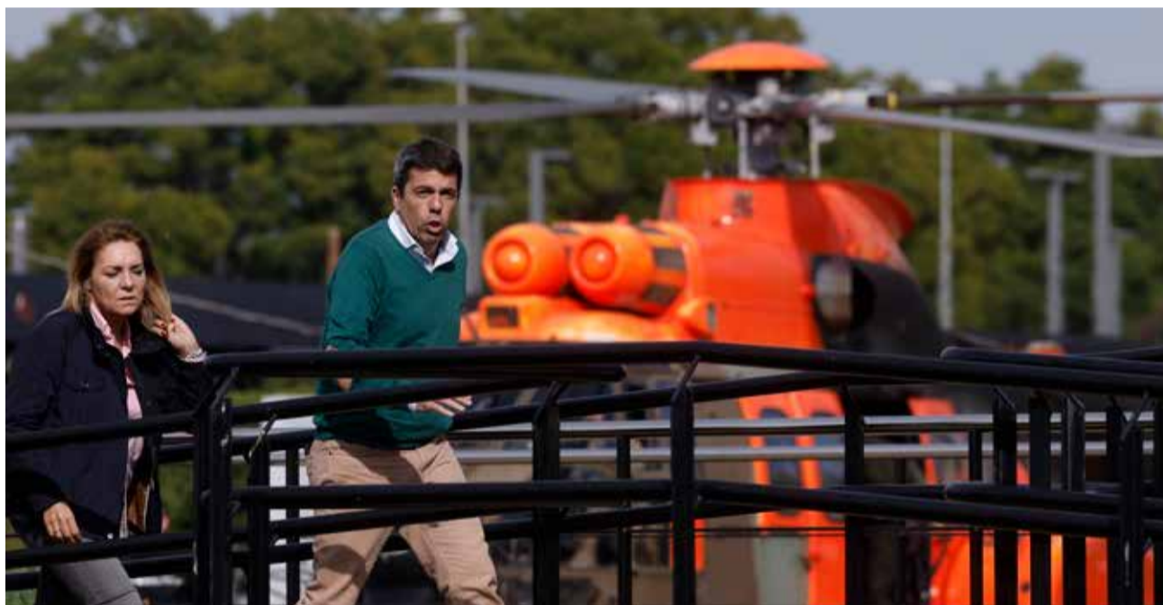
Mazón llega en helicóptero al centro de Coordinación de Emergencias.

El Gobierno valenciano va a poner en marcha una línea de ayudas a fondo perdido para el sector festivo afectado