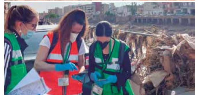
Los Servicios Sociales de esta entidad comarcal.