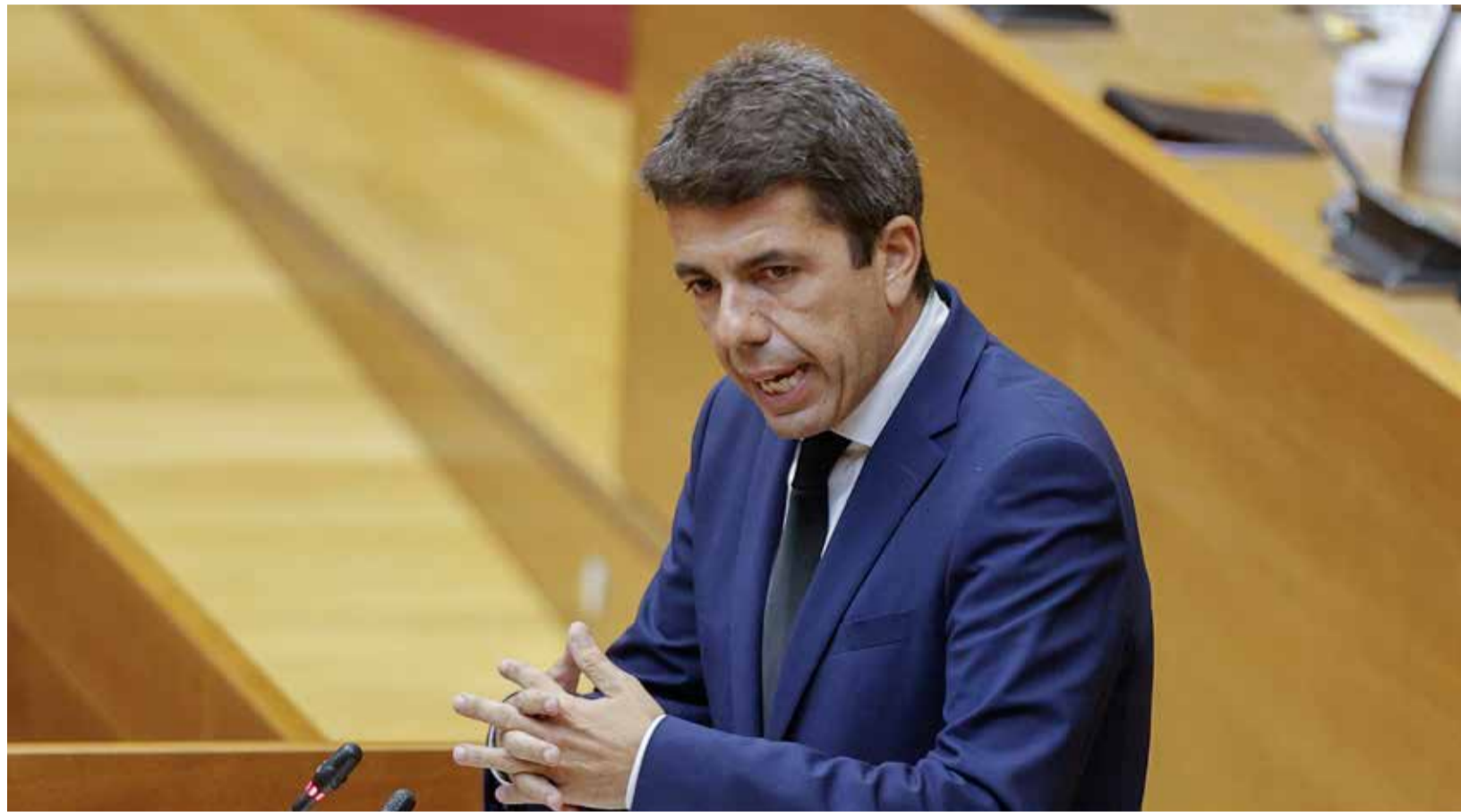
El president de la Generalitat, en les Corts Valencianes.

En materia de movilidad, también se ha requerido al Gobierno central la puesta en marcha de un Plan Renove para los vehículos de uso comercial y privado afectados, con una inversión de 864 millones de euros