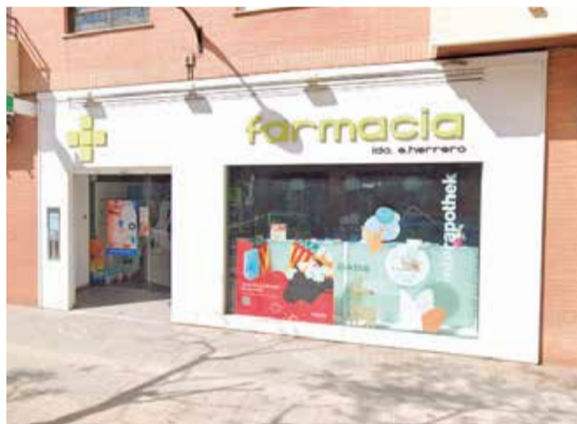
Una de las farmacias abiertas en Aldaia.