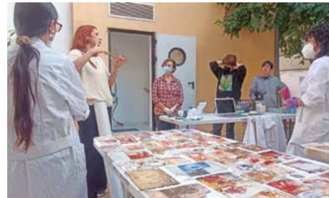
Projecte de digitalització. / EPDA

Des de la setmana passada, el pati del Museu i algunes altres instal·lacions són l'espai en el qual professionals i voluntariat comencen a rebre caixes de fotografies proporcionades per persones de l'Horta Sud que han patit a les seues cases els efectes del desbordament dels barrancs de la conca del Poio. En tot just dos o tres dies, ja són més de 3.000 les imatges que han arribat al museu, d'unes 25 famílies de la zona. En el projecte, que va impul-