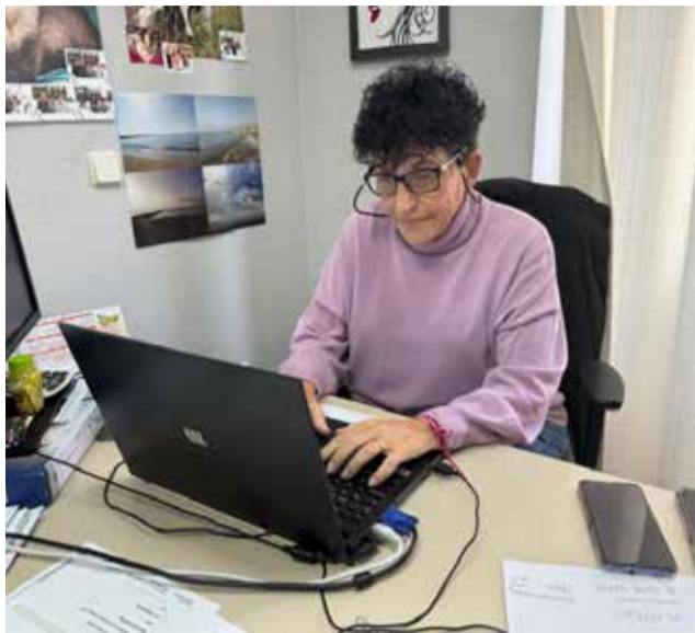
Treballadors municipals.

Entre les mesures adoptades, l'Ajuntament ha contractat a un segon treballador social, a més d'establir la figura d'un coordinador que supervisarà i optimitzarà els processos interns del departament. També s'han incorporat una nova auxiliar i una educadora social, amb la finalitat de reforçar la capacitat de resposta davant la creixent demanda dels ciutadans.