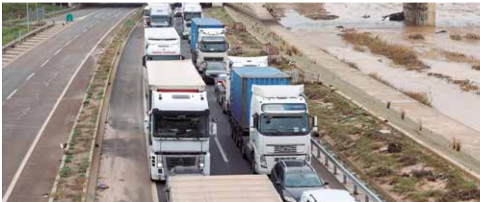
Camiones parados en la V-30.

En este sentido, el cierre de ecoparques y la suspensión