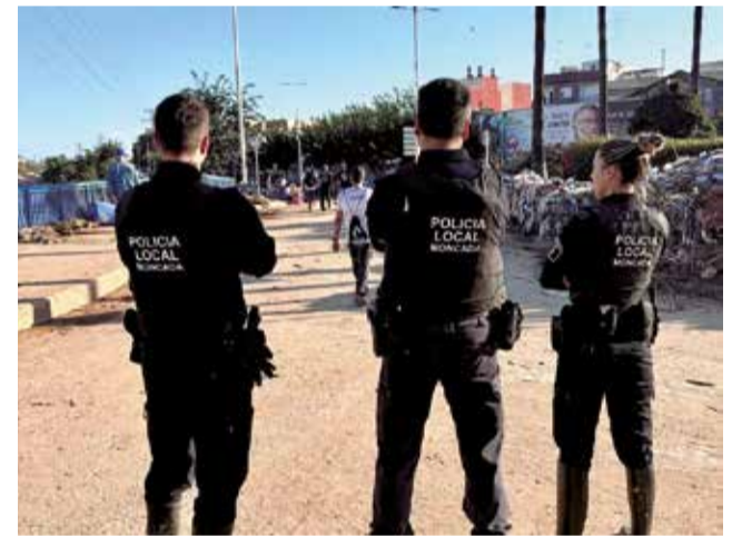
enta, autobuses con voluntarios y envío de tractores y efectivos policiales para limpiar la zona.

cogida de enseres, donde se han concentrado víveres, ropa y otros suministros esenciales.