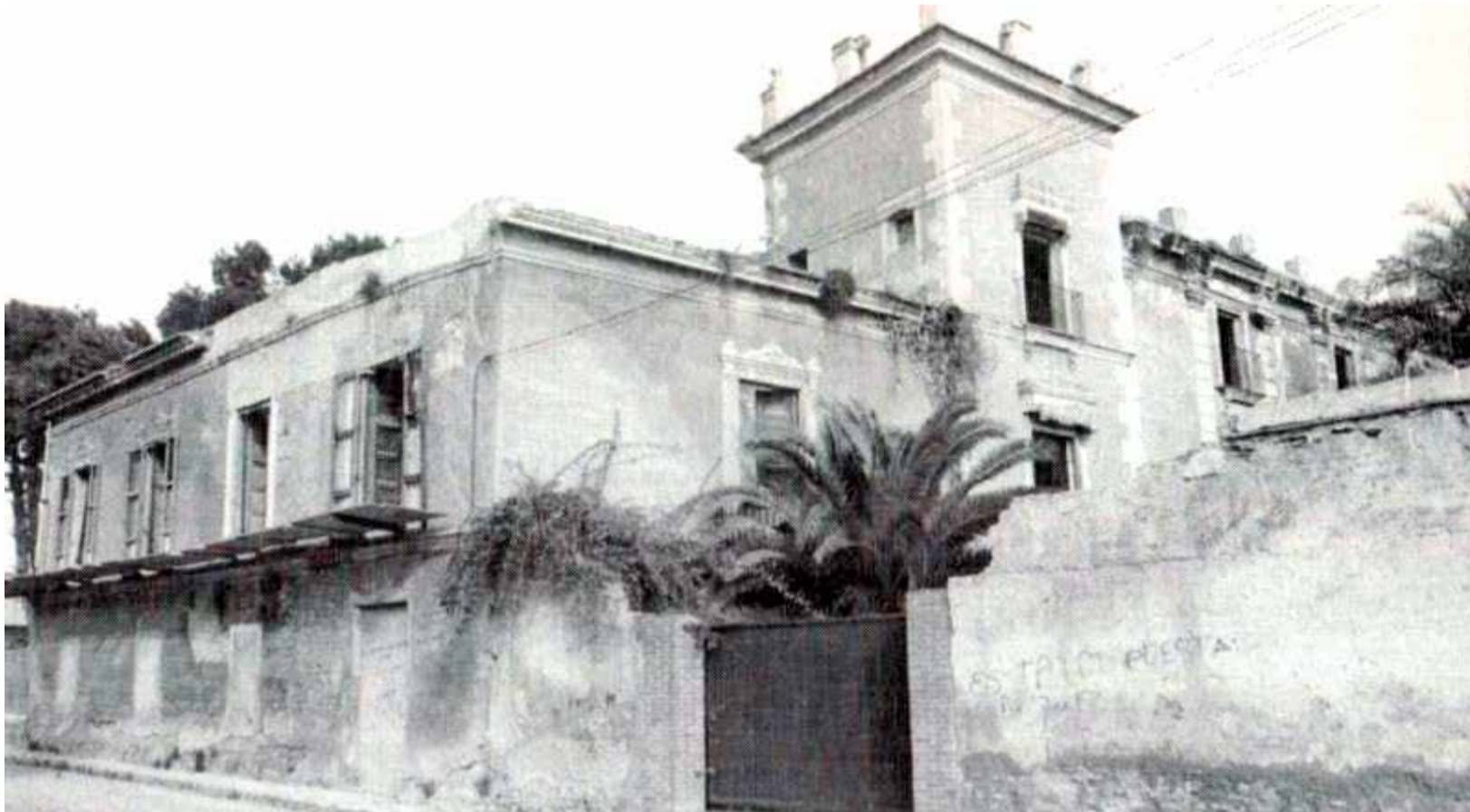
El Ayuntamiento de Moncada, antes de su rehabilitación, en una imagen de archivo.

■ EN EL EDIFICIO, QUE FUE UN ANTIGUO PSIQUIÁTRICO, SE SUCEDEN FENÓMENOS PARANORMALES COMO RUIDOS Y GRITOS