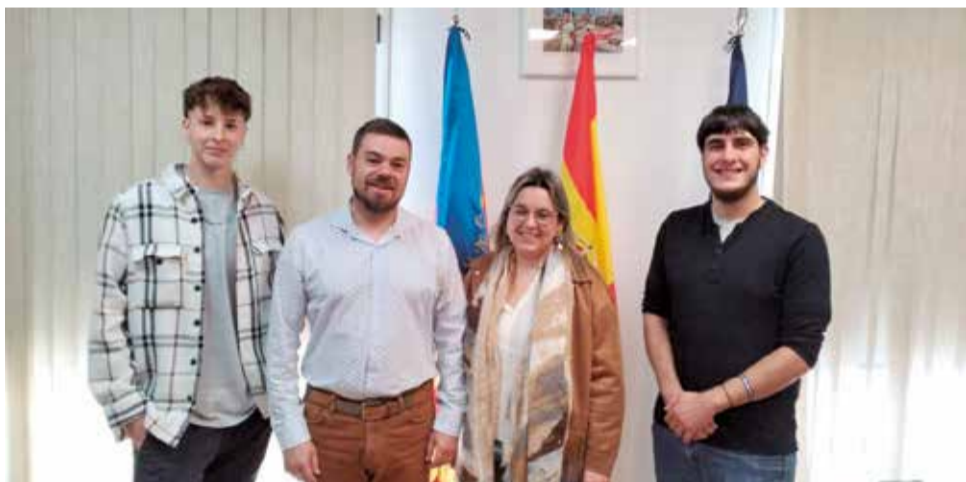
Joves contractats a través del programa EMPUJU 2024. / EPDA