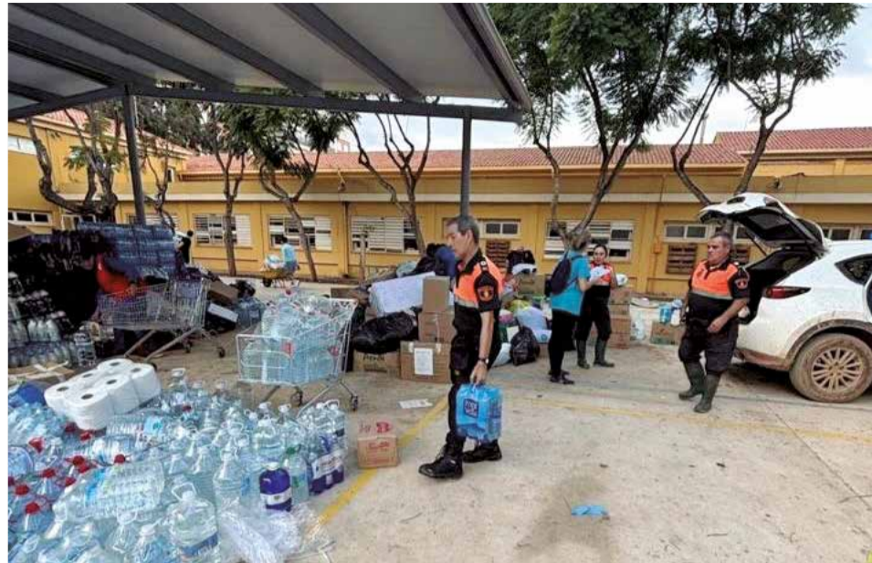
Recogida de agua en Massamagrell.

Ejemplo de ello es también el pueblo de Massamagrell, en el que desde el primer momento se coordinaron asociaciones, comercios, empresas, clubs deportivos, centros escolares, el IES Massamagrell, etc. con el Ayuntamiento de Massamagrell para enviar todos los recursos que fueran posibles. El primer día ya se contaba con tres puntos de recogida diferentes para que todo el vecindario pudiera