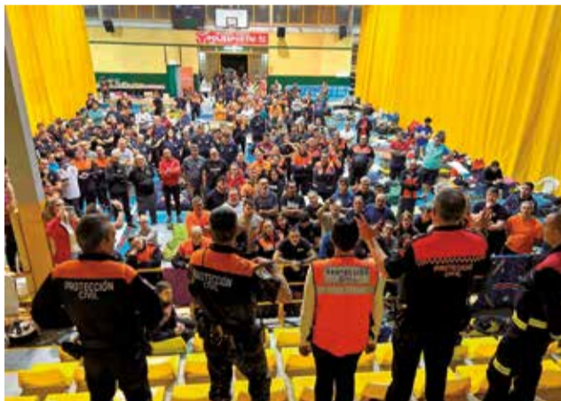
Protección Civil en Moncada.

El ofrecimiento de la alcaldesa de Moncada para desplegar una base operativa que en pocas horas desbordó las previsiones iniciales con la llegada de agrupaciones de todos los rincones de España. Cataluña, Anda-