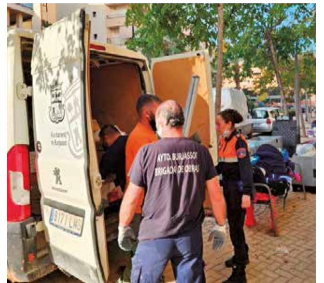
Personal municipal de Burjassot.

Brigada Municipal i Protecció Civil juntament amb els voluntaris de la nostra ciutat han dut a terme també la recollida en el Pavelló Municipal i en l'edifici de la Brigada Municipal de tones de material, des de roba i aliments, passant per materials més específics i maquinària que ens han estat demandant els Ajuntaments afectats amb els quals Burjassot està en comunicació diària.