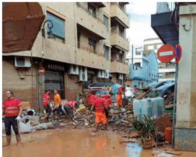
Operarios de Alboraya en la zona 0.

Ante la alerta por lluvias intensas y el aumento de