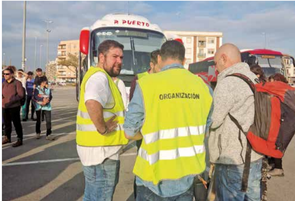
L'alcalde de Rafelbunyol amb voluntaris per la DANA.

► La Diputació és partidària d'absorbir serveis