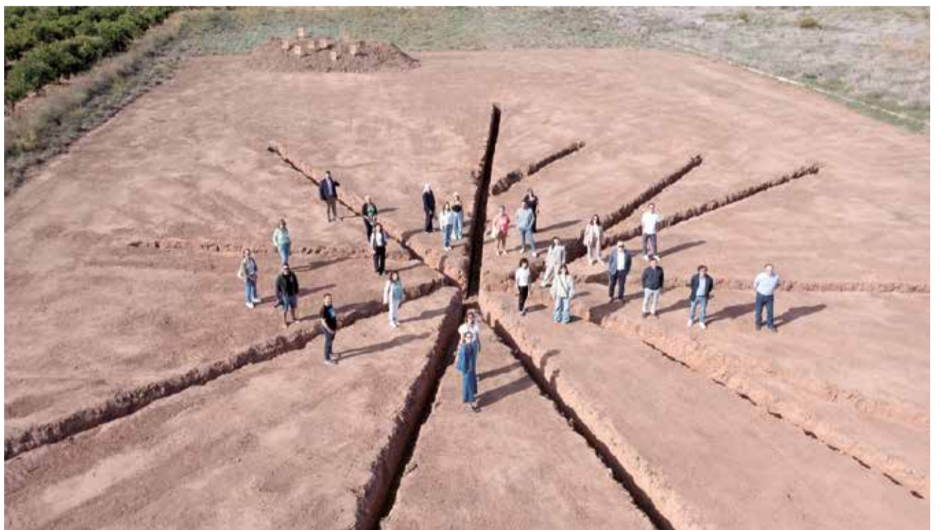
Les obres es van distribuir per localitats com Alfara del Patriarca, Albalat dels Sorells o Foios.