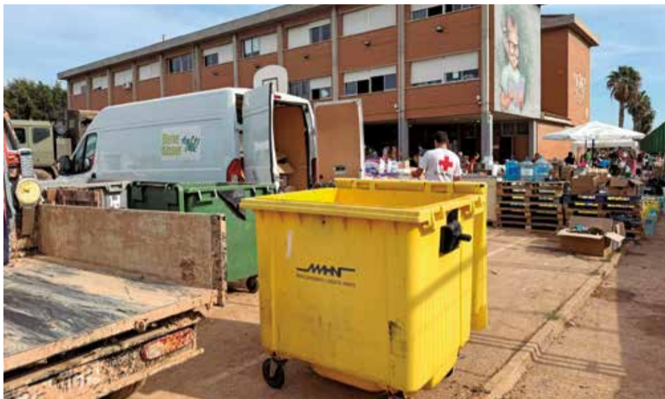
Uno de los contenedores cedidos a l'Horta Sud.

En concreto, se han distribuido 88 contenedores amarillos en Algemesí, 72 en Benetússer y 196 en Paiporta,