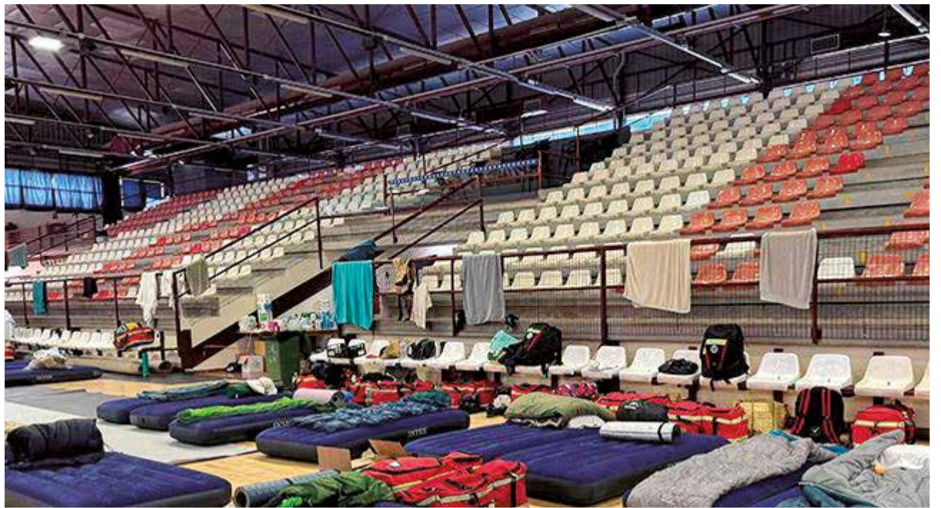
Pavelló equipat a Paterna.

El primer edil ha indicat que les instal·lacions municipals, dotades de dutxes i lavabos, s'han equipat amb taules, cadires, kätchers per a llevar-se el fang i matalassos donats per l'Associació Valenciana de Comerciants Xinesos de la Comunitat