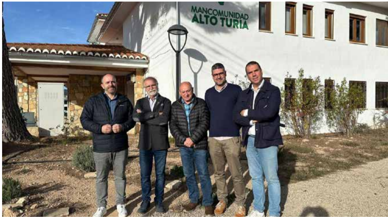
Los alcaldes del Alto Turia frente a la mancomunidad.

Las áreas recreativas, como Molino Puerto y el Camino del Morté, también sufrieron destrozos considerables por valor de 314.000 euros. Las pedanías de Villar de Tejas y El Cerrito quedaron prácticamente aisladas debido a la