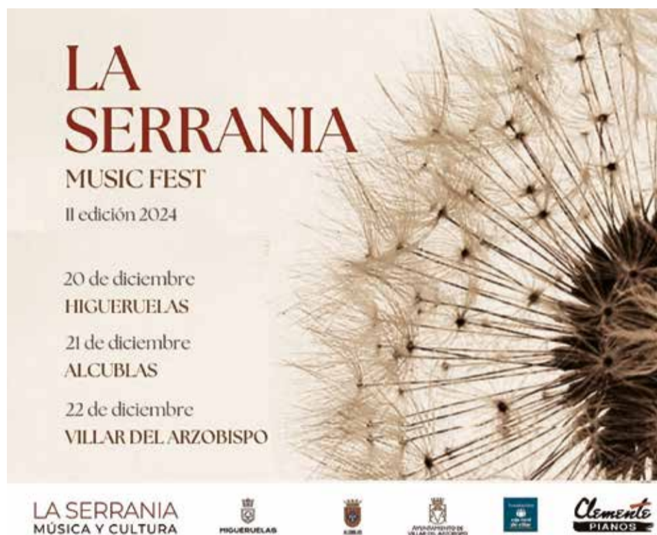
Cartel de la II edición de La Serranía Music Fest.

La Serranía Music Fest, que cuenta con el patrocinio de los ayuntamientos de Higueruelas, Alcublas y Villar del Arzobispo y la colaboración de entidades y empresas como la Fundación Caja Rural de Villar o Clemente Pianos, continuará