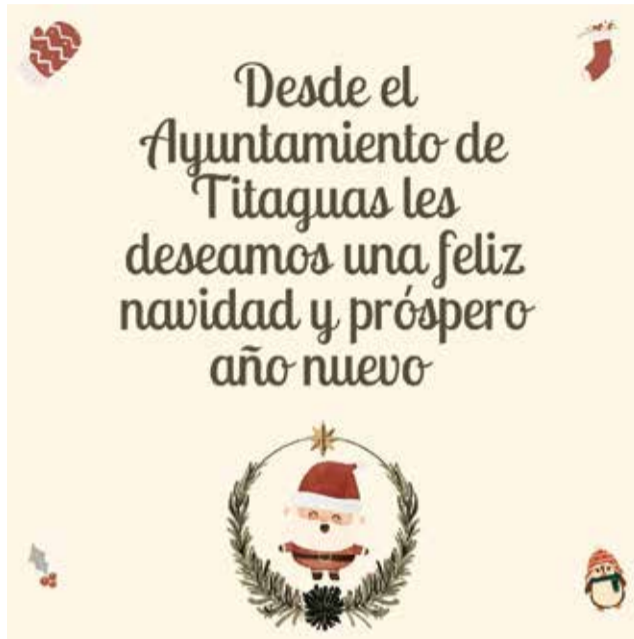
Felicitación navideña de Titaguas.

La cabalgata de Reyes recorrerá las calles del municipio el día 5 de enero, con la llegada de Sus Majestades los Re-