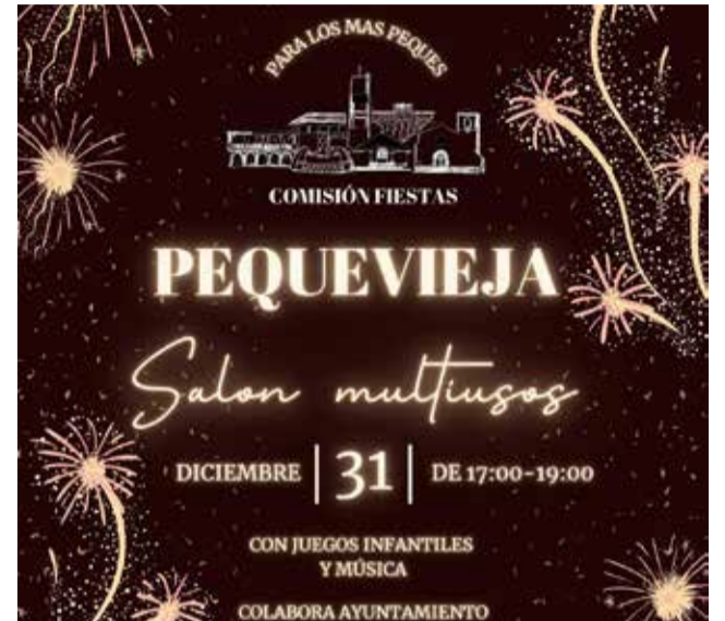
Cartel de la Pequevieja de Benagéber.

Esta iniciativa permite que los niños vivan el espíritu de la Nochevieja con activida-