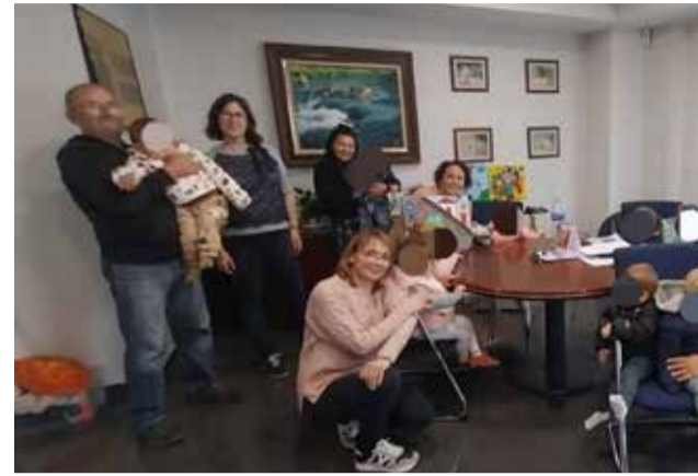
Un instante durante la entrega del cuadro.