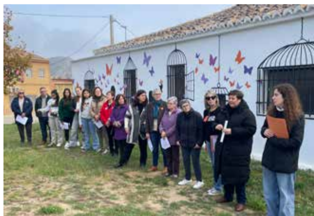
Lectura del manifiesto por el 25N en Villar.

Después se presentó el resultado de la iniciativa 'Alzando el vuelo. Banderas de resistencia por la paz', organizada por la Comisión Ciudadana de