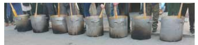
Fiestas de San Antón en Alcublas.

bendición de animales, con un detalle para los participantes. A las 14:00, mascletà en el polideportivo. Por la tarde, a las 18:30, procesión en honor al patrón y, al finalizar, castillo de fuegos artificiales. La jornada culminará con la actuación de la orquesta People Band a las 00:00.