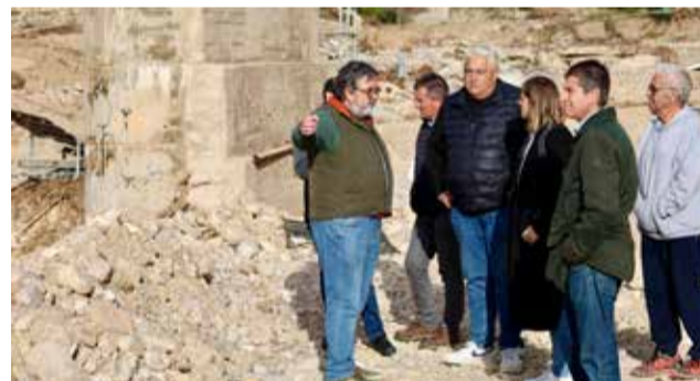
Visita a Sot de Chera.

Tuéjar es el municipio con la cifra de daños más alta, con una estimación de 2.484.520 euros. La red de 155 kilómetros de caminos rurales quedó