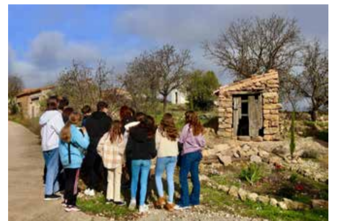
Alumnos del Instituto de Alpuente.

de La Almeza, un pequeño edificio donde se guardaba la caja comunal de la aldea con la que llevaban antiguamente, a través de un sistema de tandas, a los difuntos hasta el cementerio de la aldea de Corcolilla.