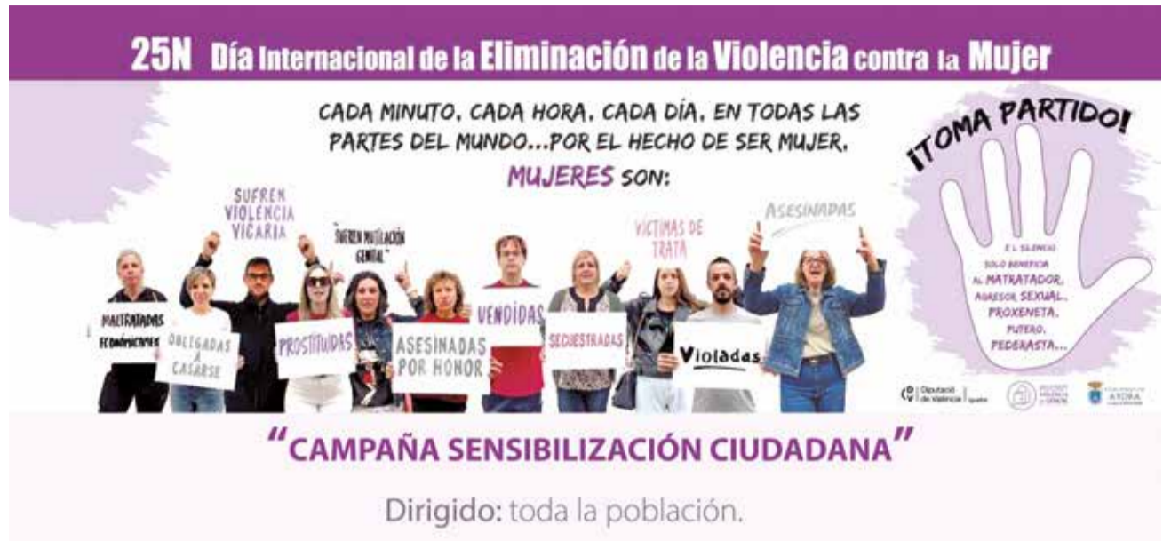
Instantánea de la campaña de sensibilización del Ayuntamiento de Ayora con motivo del 25N.

llamada de atención que nos recuerda que el machismo sigue siendo una amenaza cotidiana. Solo a través de la acción colectiva, la educación y el compromiso político será posible alcanzar una sociedad libre de violencia contra las mujeres. Reivindicar este día es, en definitiva, un acto de resistencia y esperanza.