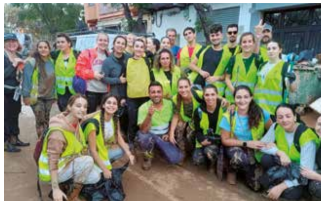
Voluntariado de Nàquera.