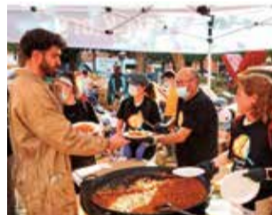
Plats solidaris.