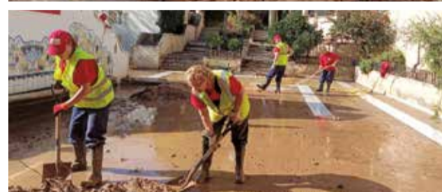
Diferentes momentos de labores de limpieza en Caudete de las Fuentes.

equipos de emergencia. Entre las infraestructuras más afectadas se encuentran el puente principal de acceso al municipio, que quedó inutilizable, y varios caminos rurales que