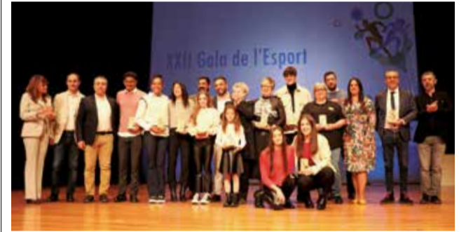
Gala de l'any passat.

presentar en una de les 10 categories establertes, com ara millor esportista masculí i femení, millor entitat esportiva local, i guardons per la trajectòria esportiva i els valors humans. Els interessats han de presentar les propostes a través del correu galadeporte@aytosagunto.es, amb la justificació i dades de contacte. El regidor d'Activitat Física, Salut i Esports, Javier Timón, ha destacat la importància d'aquesta fase per reconèixer els èxits de l'esport local i ha animat a presentar les candidatures amb la documentació més completa possible per facilitar la seua avaluació.