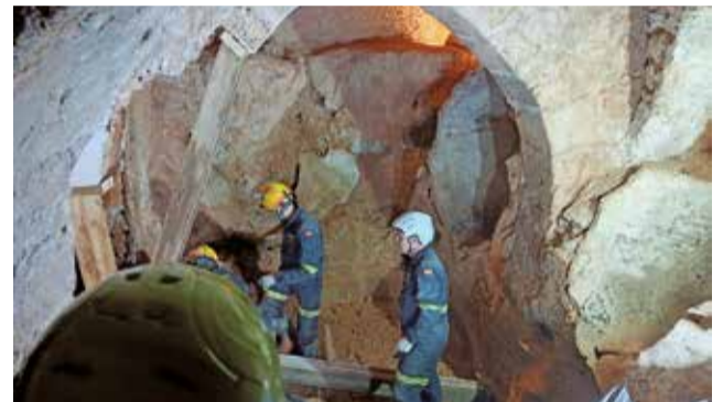
Bomberos apuntalando las bodegas de Utiel.

Las Bodegas Subterráneas son un espacio de un valor patrimonial incalculable para Utiel, con siglos de historia y uno de sus grandes reclamos turísticos y culturales debido a su singularidad, siendo