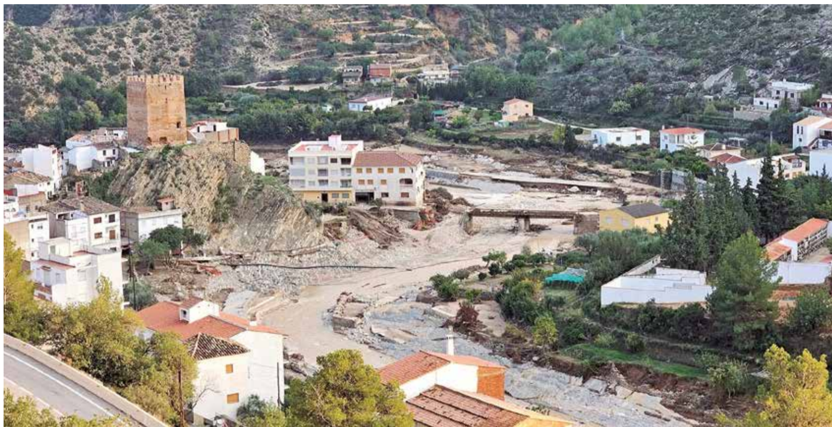
Vista aérea de Sot de Chera tras la riada que azotó al municipio el pasado 29 de octubre.

Además, la conselleria de Agricultura ha adjudicado, por vía de emergencia, la contratación de las obras y servicios necesarios para garantizar la estabilidad de la presa de Buseo con una inversión de 4,7 millones y en un plazo de ejecución de 12 meses para reparar los daños producidos por la DANA.