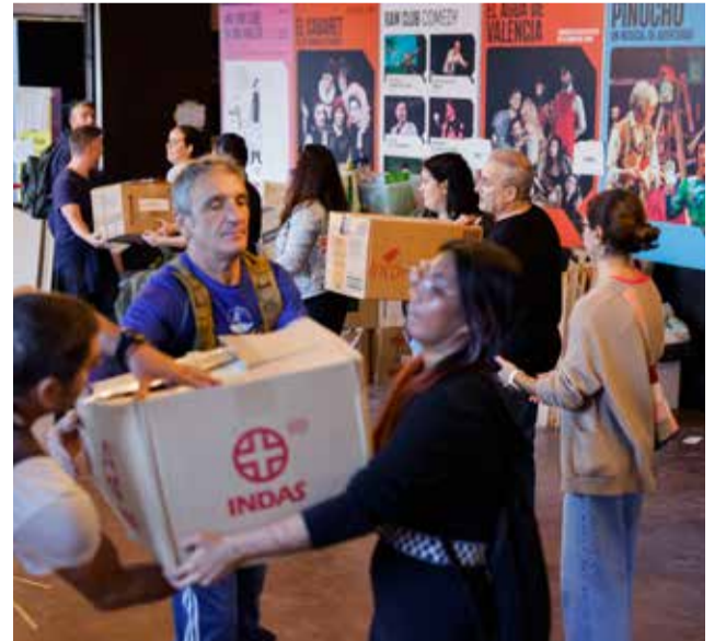
Los voluntarios ayudan en todo tipo de tareas: reparto de enseres, limpieza de lodo, cocinado, cortes de pelo...