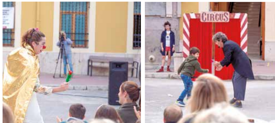
La iniciativa solidaria de 'Emergencia de la risa' en Cheste.

Este espectáculo se ha programado en colaboración con el Ayuntamiento en el marco de la iniciativa Emergencia de la Risa en Va-