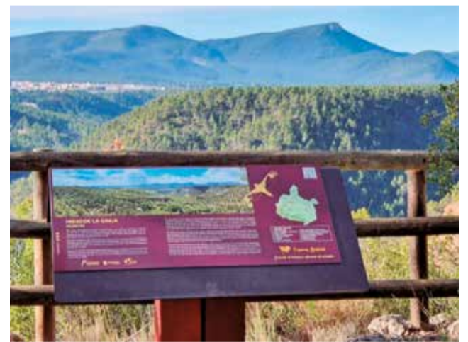
Mirador La Graja, en Sinarcas.

Ahora, gracias al Plan de Sostenibilidad Turística en Destino, Tierra Bobal contará con una ruta con estos miradores que integra paisaje, calidad del cielo y naturaleza al