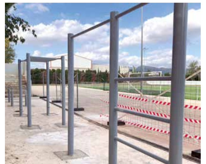
Nova pista de cal·listènia a Benifairó.

ritzontal, una estació de dominades i una bicicleta estàtica. A més, el paviment de la zona serà de cautxú, per evitar lesions en cas de caigudes. Les obres també inclouen la instal·lació d'un sistema de desaigüe per a l'evacuació d'aigües pluvials, la demolició parcial del mur perimetral per habilitar un accés per a persones amb mobilitat reduïda, així com la pavimentació del nou accés creat a la zona esportiva.