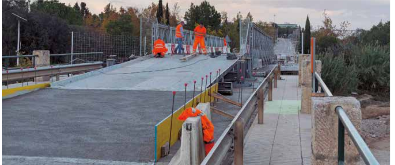
El puente de la CV-50 derrumbado tras la DANA del 29 de octubre.

Con este puente provisional en marcha, Cheste recuperará el acceso a la A3 para vehículos pesados, possibilitando el restablecimiento del transporte público en la localidad a través de autobús y facilitando el acceso a transportistas. La circulación a través de la pasarela será en ambos sentidos, pero a través de un solo carril, por lo que el paso se regulará con semáforos. Así, la co-