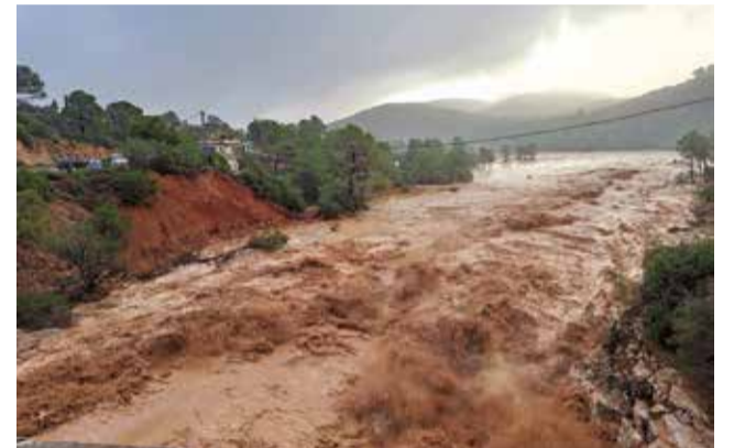
Diferentes instantáneas durante la reconstrucción del puente de la CV-425 a su paso por Macastre.

ba abierto de manera provisional gracias a la estructura prefabricada instalada por la UME. Este acceso provisional permitía el transporte de vehículos de hasta 80 toneladas. “Tanto el trabajo del