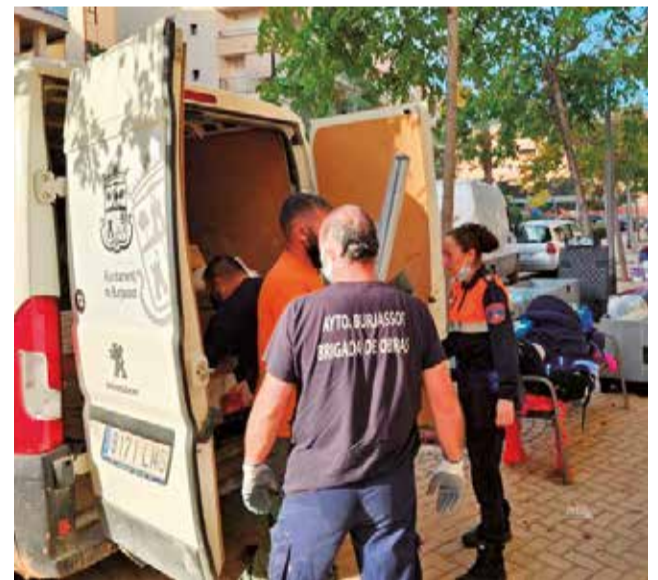
Personal municipal de Burjassot.

Brigada Municipal i Protecció Civil juntament amb els voluntaris de la nostra ciutat han dut a terme també la recollida en el Pavelló Municipal i en l'edifici de la Brigada Municipal de tones de material, des de roba i aliments, passant per materials més específics i maquinària que ens han estat demandant els Ajuntaments afectats amb els quals Burjassot està en comunicació diària.