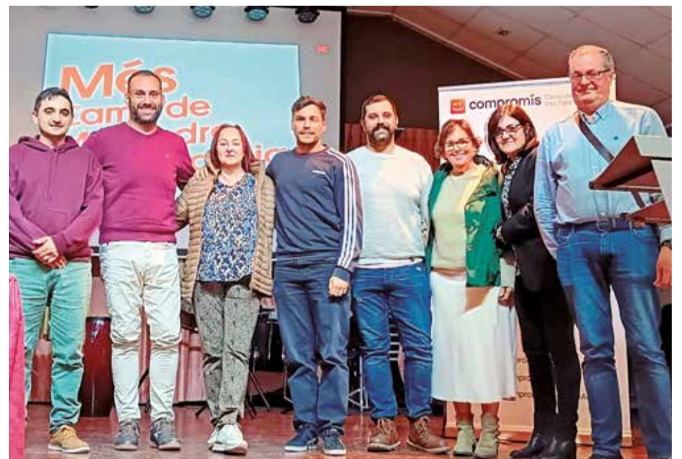
Càrrecs de l'executiva comarcal de Compromís.