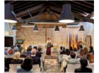
Actuació. / EPDA