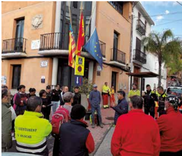
Voluntariat d'Olocau pels afectats per la DANA.

I en la jornada del dimarts 5, es va realitzar un desplaçament a Alaquàs