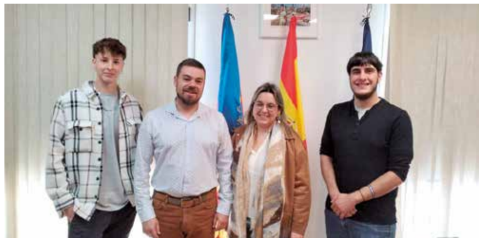
Joves contractats a través del programa EMPUJU 2024.