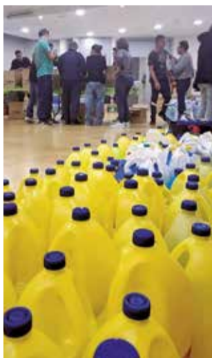
Voluntaris. / EPDA

L'organització d'esta iniciativa solidària, fou gestionada per l'Ajuntament de Benissanó que comptà amb la inestimable col·laboració de l'empresa Grupo Sanz encarregada d'emmagatzemar