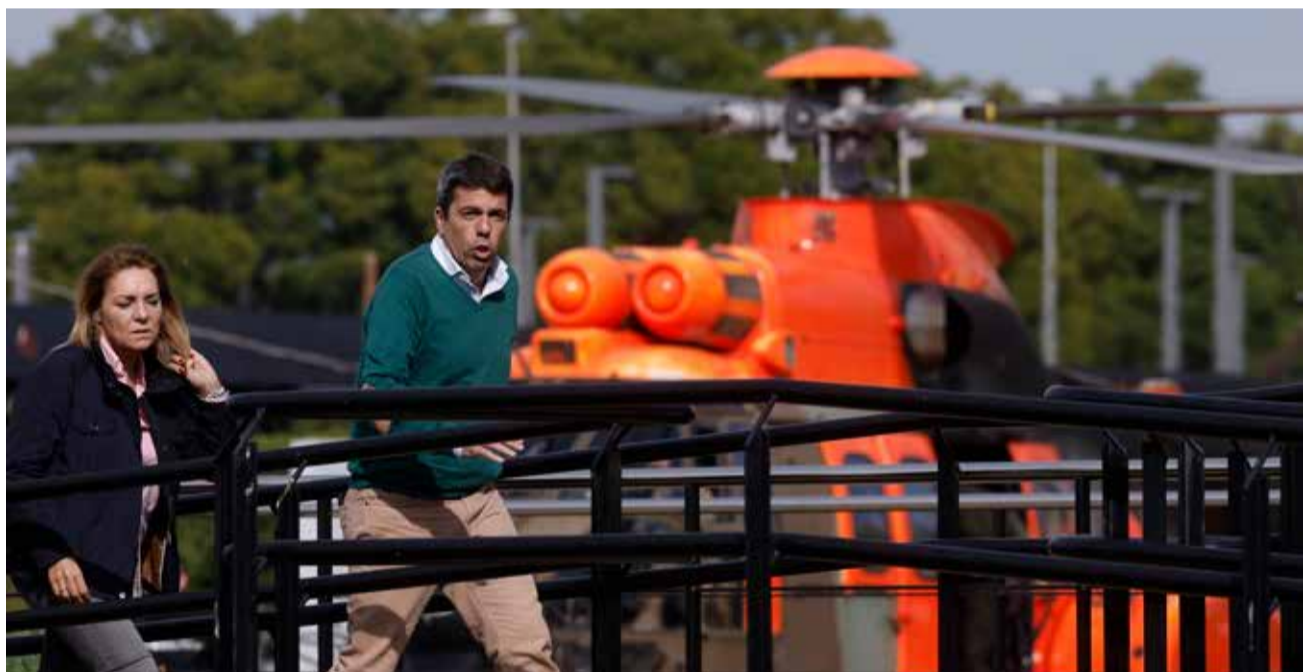
Mazón llega en helicóptero al centro de Coordinación de Emergencias.

El Gobierno valenciano va a poner en marcha una línea de ayudas a fondo perdido para el sector festivo afectado