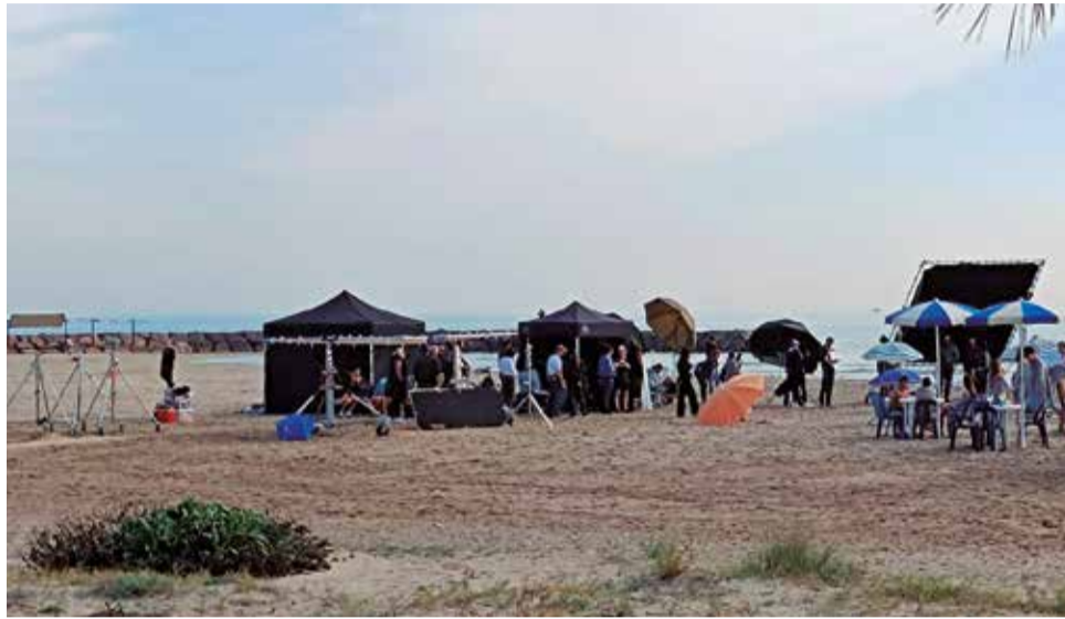
Rodatge recent a la platja del Port de Sagunt.