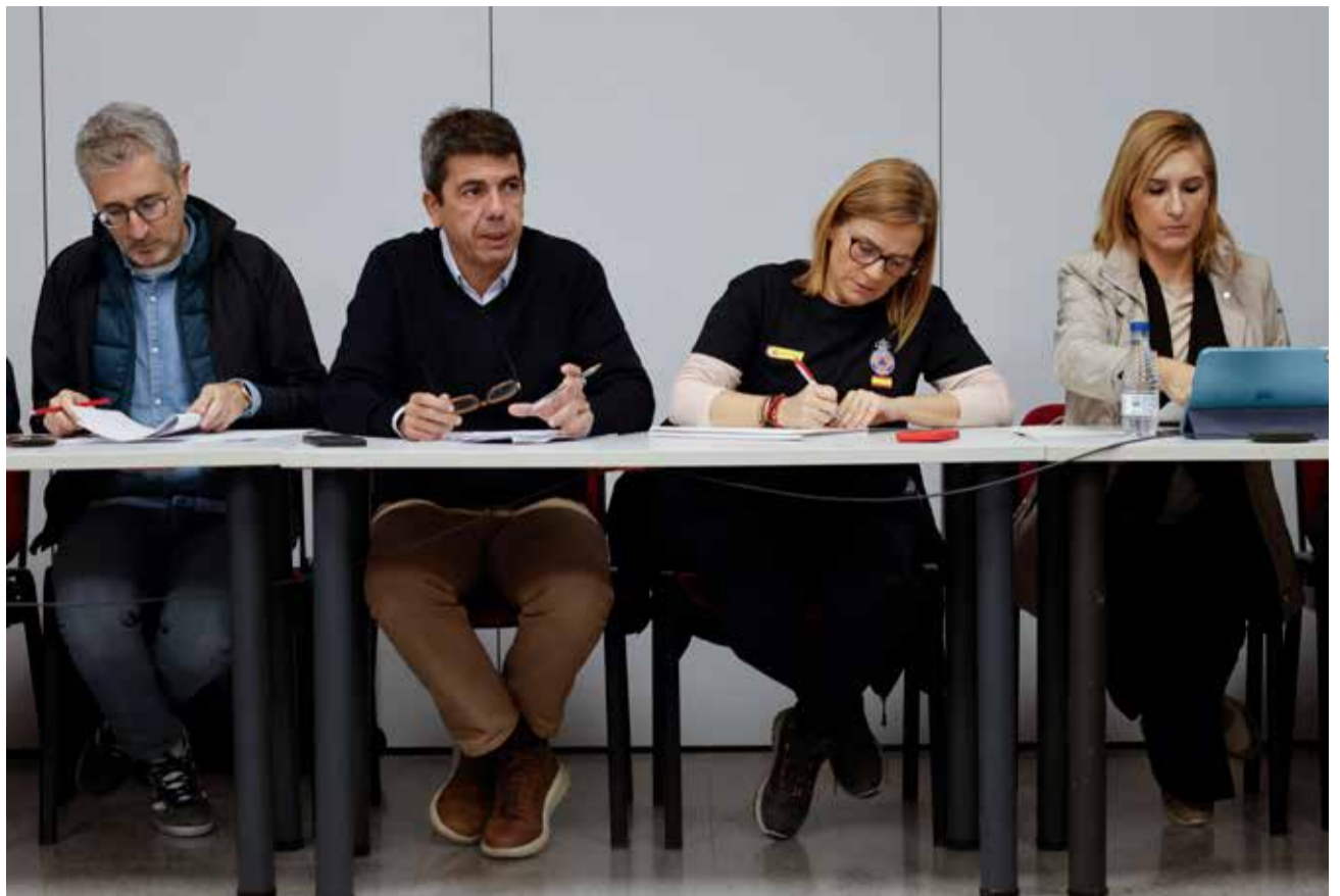
Reunión del Centro de Coordinación Operativa Integrada (Cecopi).

Así, Mazón ha recordado que los Presupuestos Generales del Estado -que ascienden a 583.000 millones de euros- ha dedicado en ayudas directas a afectados por las riadas 3.600 millones, mien-