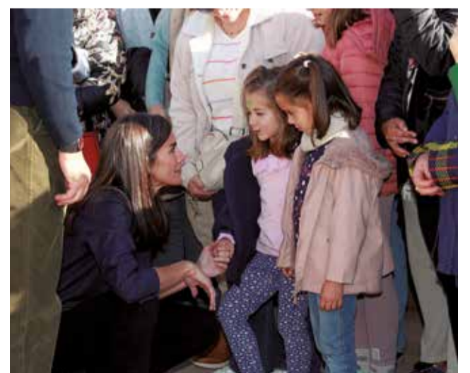
Diferentes instantáneas de los reyes de España en su visita a la ciudad de Utiel.