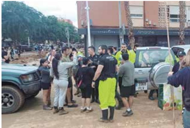
Agentes de Tavernes en la zona o.

El Consistorio reconoce especialmente la colaboración de los comercios locales y asociaciones de Tavernes Blanques, que con su apoyo han hecho posible que estas