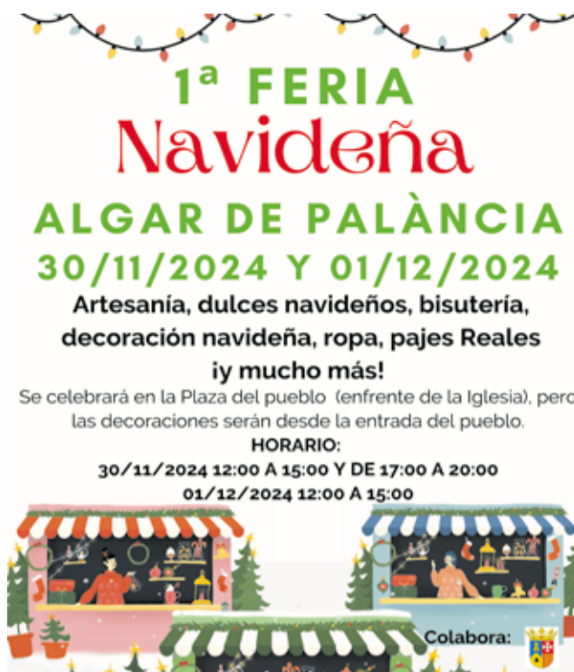
Cartell de la fira.

L'esdeveniment començarà el dissabte 30 de novembre a les 12.00 hores, amb la inauguració oficial de la fira. Poc després, a les 13.00, s'espera l'arribada dels Patges Reals d'Orient, els qui repartiran cartes reals als assistents i arplegaran els desitjos dels més xicotets, en un moment que promet emoció i màgia per als xiquets del municipi i els seus voltants. A continuació, a les