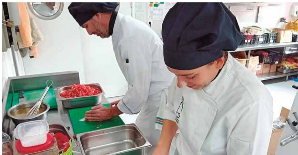
Alumnes del centre educatiu de la Poble de Farnals.