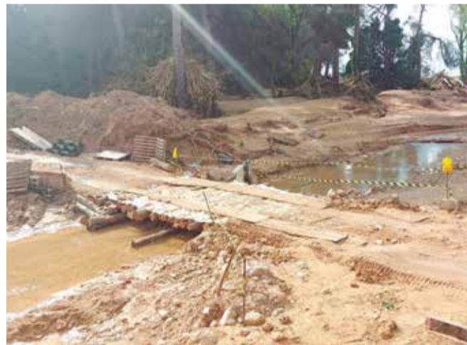
Las consecuencias de la DANA en este municipio de la Hoya de Buñol-Chiva.

En estas semanas, diferentes autoridades de la Diputación de Valencia han visitado el municipio para evaluar de manera directa los daños ocasionados por las intensas lluvias y el consecuente desbordamiento del barranco,