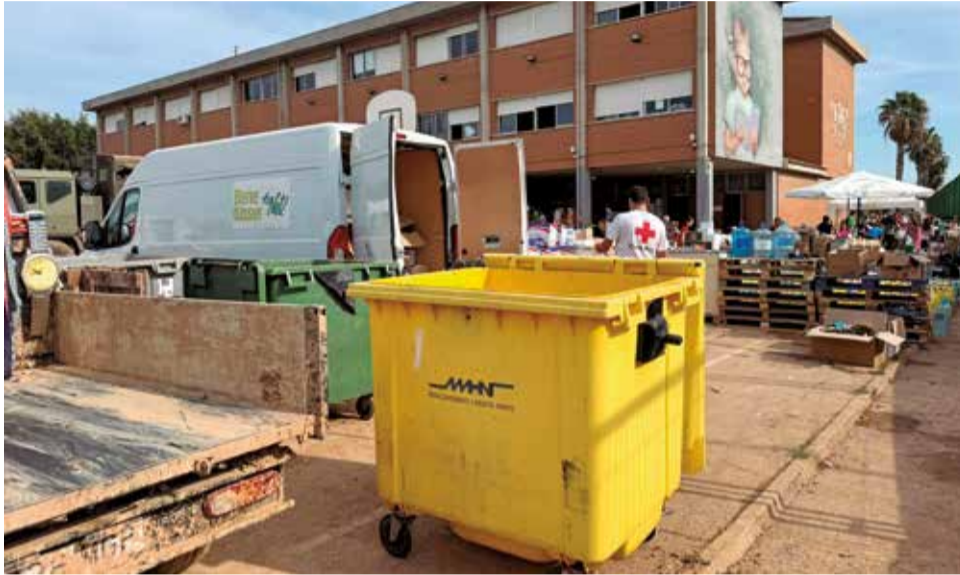
Uno de los contenedores cedidos a l'Horta Sud.

En concreto, se han distribuido 88 contenedores amarillos en Algemesí, 72 en Benetússer y 196 en Paiporta,