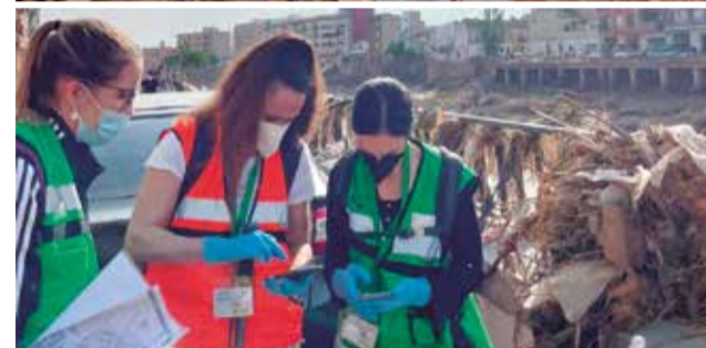
Los Servicios Sociales de esta entidad comarcal.