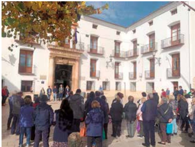
Acto de concentración del 25N en Utiel.

Con motivo del Día Internacional de la Eliminación de la Violencia contra la Mujer, el Ayuntamiento de Utiel celebró el pasado 25 de noviembre el acto de concentración y lectura de la declaración institucional de este día tan señalado y se guardó un minuto de silencio por todas las víctimas en la plaza consistorial.