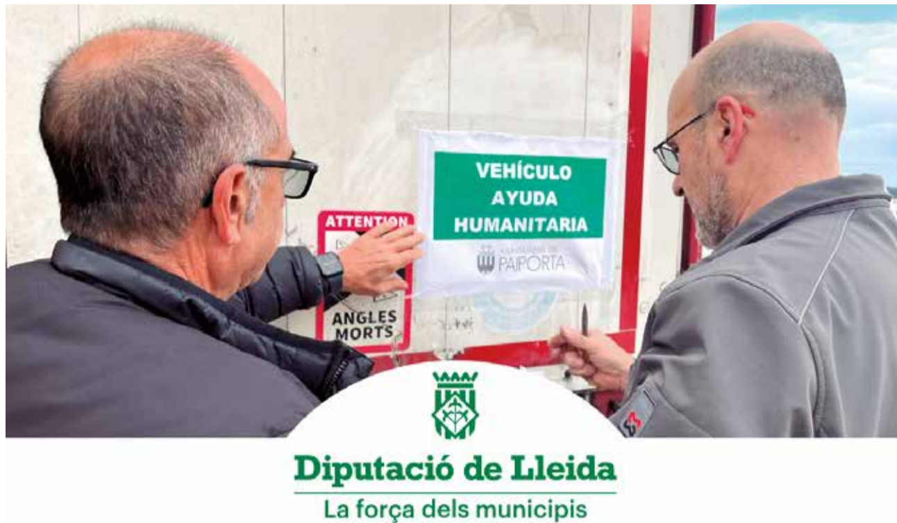
Un dels camions amb ajuda humanitària destinada a diferents municipis afectats.

La Diputació de Lleida ha canalitzat la solidaritat dels municipis de les Terres de Lleida amb les persones afectades per la DANA gràcies als ajuntaments d'Aitona, Albatarrec, Albesa, Alcoletge, Almacelles, Almatret, Alfés, Artesa de Lleida, Aspa, Bellguarda, Bellpuig, Benavent del Segrià, Butsènit d'Urgell, Cervera, Corbins, Fuliola, Gimènells, Granyena, Ivars de Noguera, Juncosa, la Granadella, les Avellanés i Santa Linya, Llardecans, Menàrguens, Montgai, Montoliu de Lleida, Preixana, Seròs,