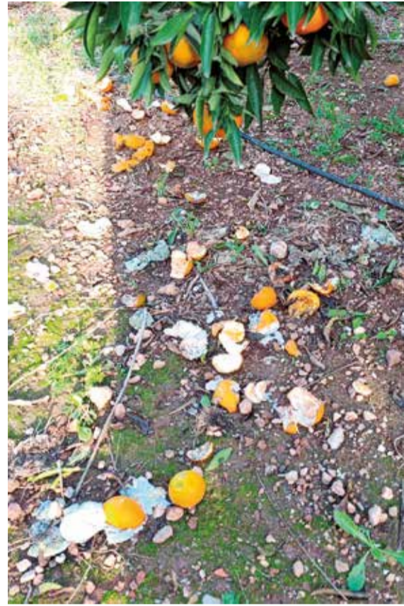
Conseqüències recents de la sobrepoblació de javalins en els camps de cultiu del Camp de Morvedre.