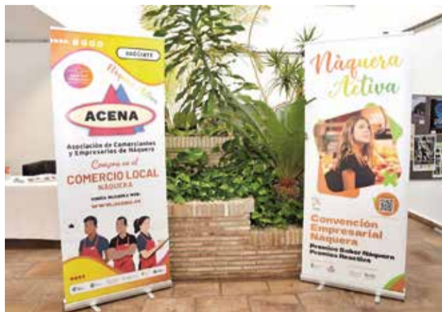
Imagen del evento 'Nàquera Activa'.

El Ayuntamiento premió a los ganadores de la última edición de 'Sabor a Nàquera' en sus dos variantes, Ru-