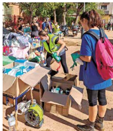
Recollida a Canet d'en Berenguer.