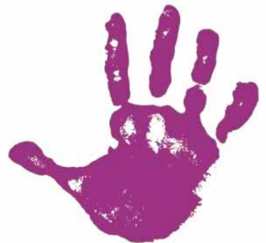
Un símbol de la lluita feminista.

Amb aquests actes, Estivella reafirma el seu compromís en la lluita contra la violència de gènere i la promoció de la igualtat.