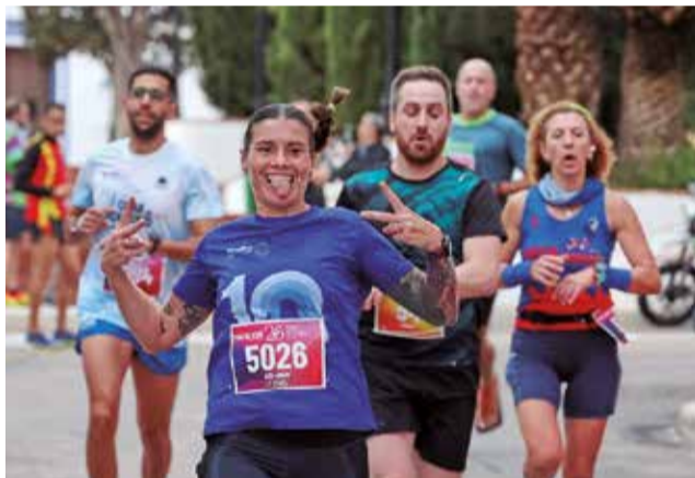
Diversos instants de la 10k del dissabte, 16 de novembre, als municipis de Les Valls.