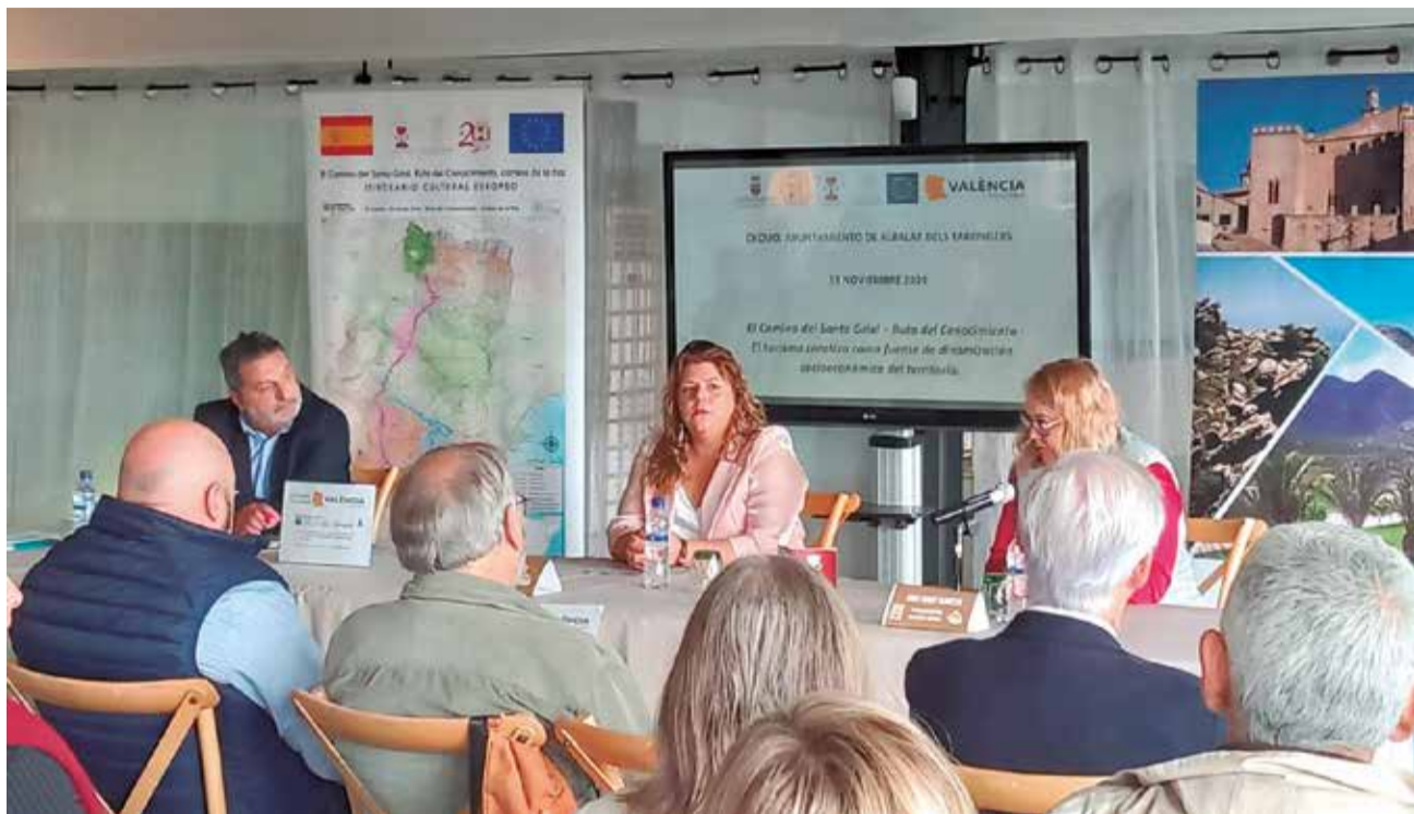
Presentació del pla estratègic en l'Espai Les Panses d'Albalat dels Tarongers. / EPDA