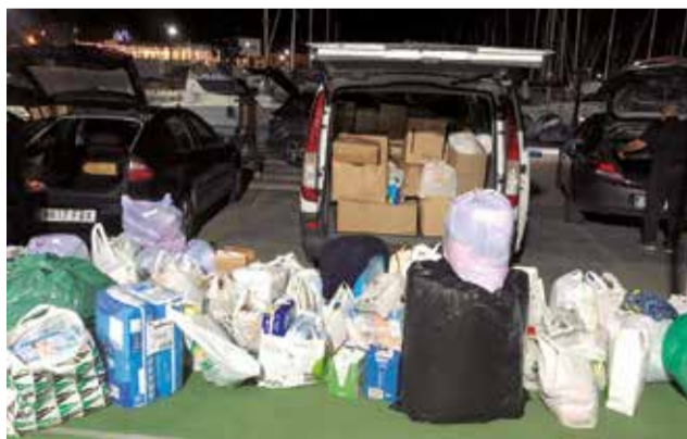
Productes a Benifairó de les Valls.