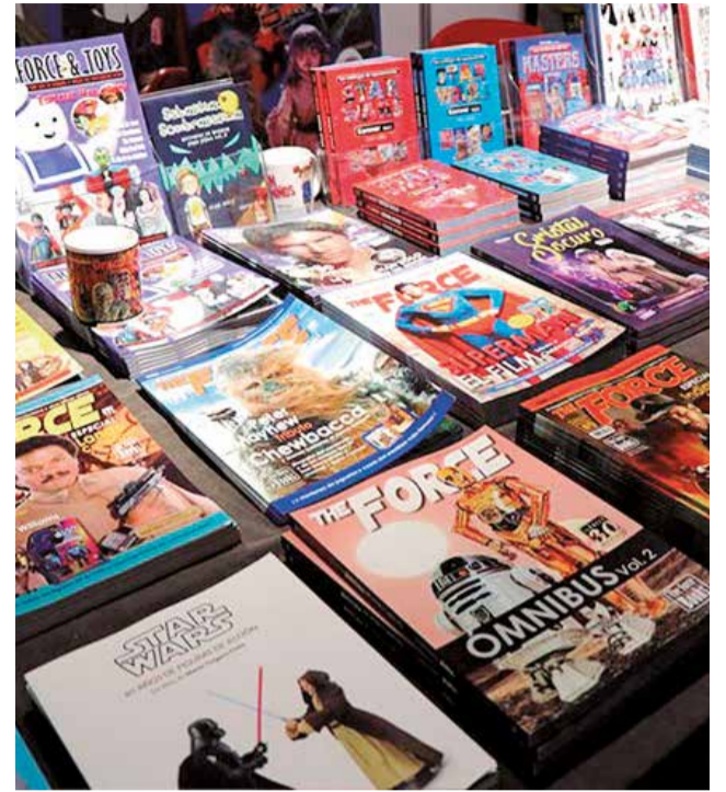
Còmics en el Festival Splash de Sagunt.

mode d'andanes. L'obertura central queda lliure en tota la seua altura, l'obertura sud disposa d'un forjat de formigó a sis metres d'altura, mentre que l'obertura nord disposa de tres forjats, amb una altura lliure entre ells de 2,20 metres. A més, en el mur nord existix un cos annex d'una única planta i 34 metres de longitud, distribuït en diferents dependències. Després del tancament d'Alts Hornos del Mediterráneo en 1984, l'edifici va ser salvat de l'enderrocament amb el propòsit de crear un museu que relatara l'origen i desenvolupament de la ciutat factoria del Port de Sagunt.