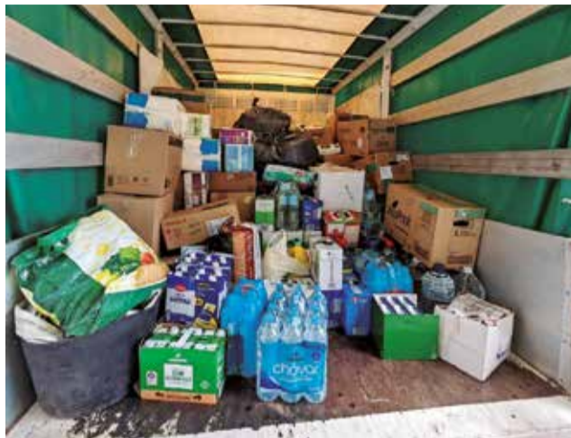
Alguns productes a Canet.

El Periódico de Aquí també ha organitzat una campanya de recollida de productes de primera necessitat. Més informació en www.elperiodico-deaqui.com .