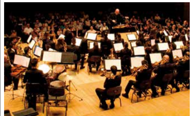
Societat Unió Musical de Canet.