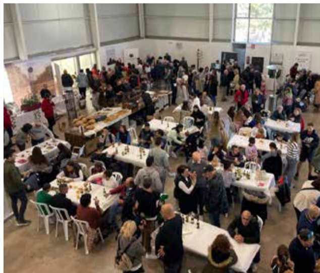
Celebració de la fira en una edició anterior.

El certamen "demostra eixe múscul creixent" que "des de l'ajuntament tracitem de secundar i empoderar amb cada projecte, amb cada inversió". I per aquest