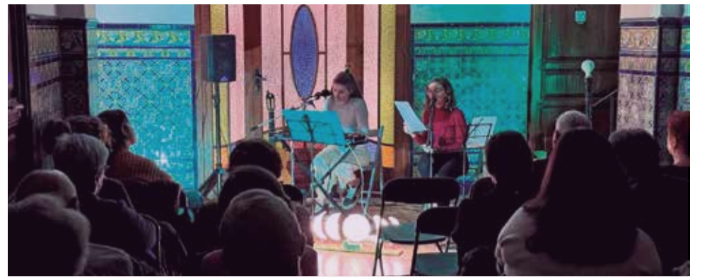
Un instant de l'espectacle 'Lluació' a Faura.

Aquesta completa programació s'havia d'iniciar amb una trobada amb l'escriptora Rosario Raro, originàriament programada per al 4 de novembre, que va haver de ser suspesa a causa de la DANA que va assotar la província de València el passat 29 d'octubre.