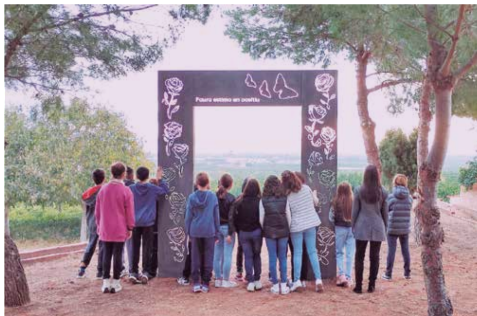
Estudiants de Faura. / EPDA