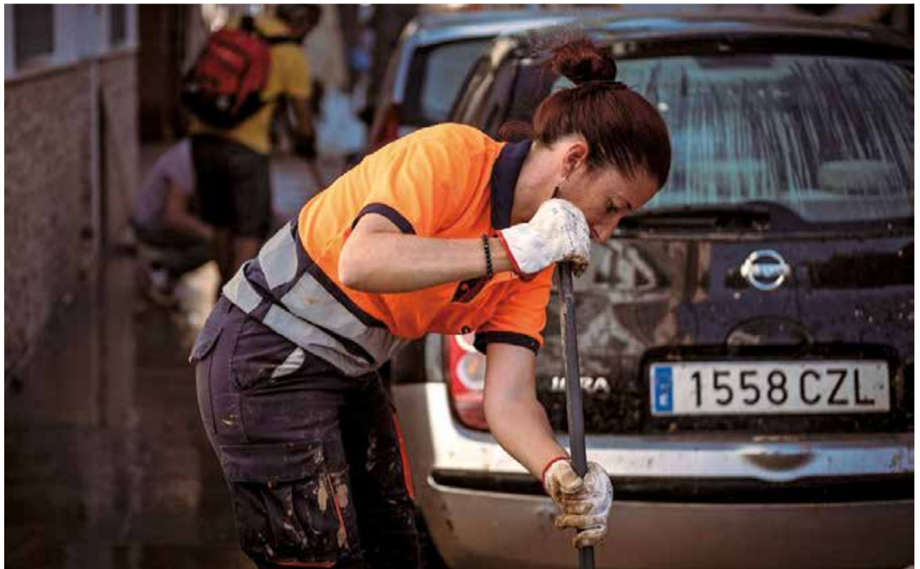
Una treballadora de Sagunt, ajudant a la neteja en una de les zones afectades per les inundacions.