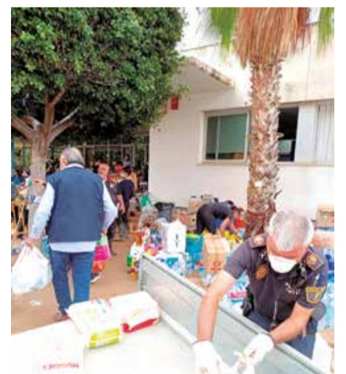
Recollida a Albalat dels Tarongers.