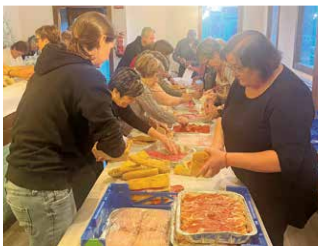
Preparació d'entrepans a Gilet.