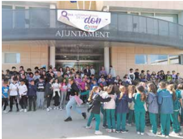
Una activitat del 8M a Canet.

El 25 de novembre , Dia Internacional de l'Eliminació de la Violència contra la Dona, serà la jornada central de la Setmana contra la Violència de Gènere a Canet d'en Berenguer. Les activitats començaran a les 9.00 hores en la Plaça de l'Ajuntament, en un acte organitzat pel Col·lectiu Dones Canet, on participaran diferents centres educatius. Els més xicotets presentaran curtmetratges realitzats per estudiants de 5é i 6é de Primària, i re-