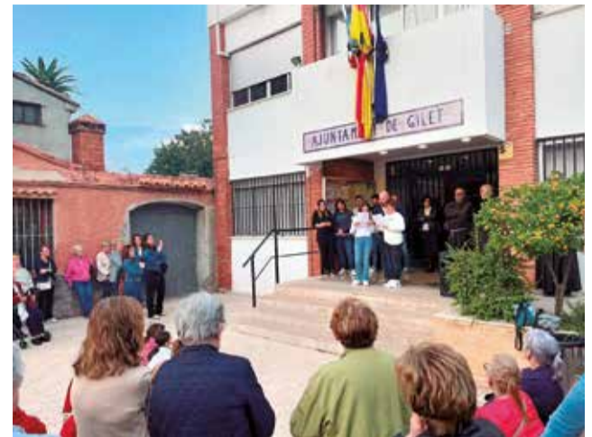
Lectura d'un manifest a Gilet.