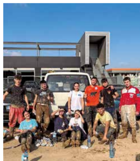
Majorals d'Algar de Palància.