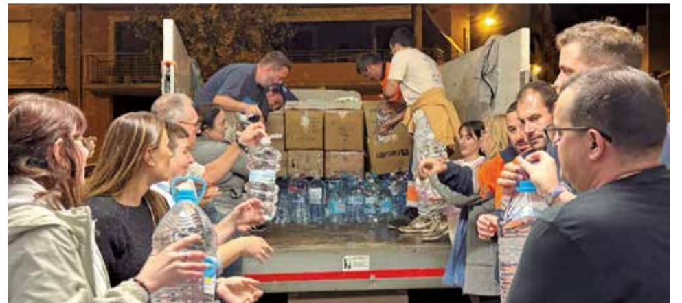
Voluntaris carreguen els productes recopilats a Sagunt.