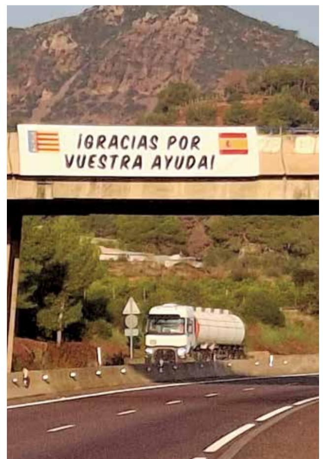
Cartell penjat a l'Autovia Mudéjar, en Gilet.