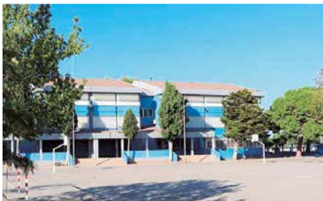
Un centre educatiu de Sagunt.