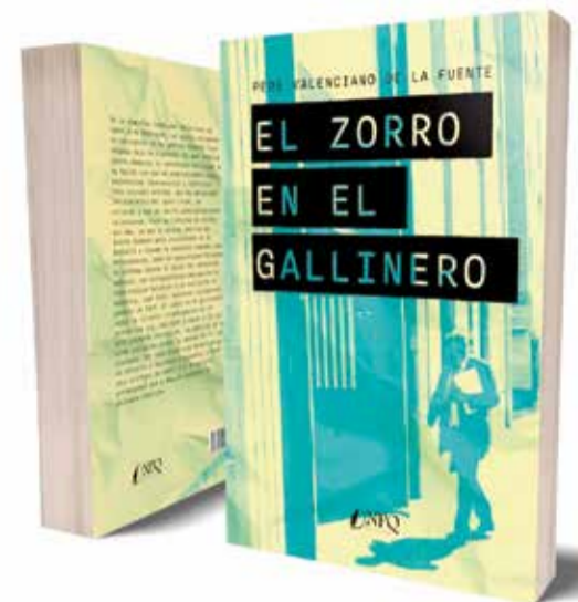
El autor del libro y presidente del Grupo El Periódico de Aquí y la portada del libro.