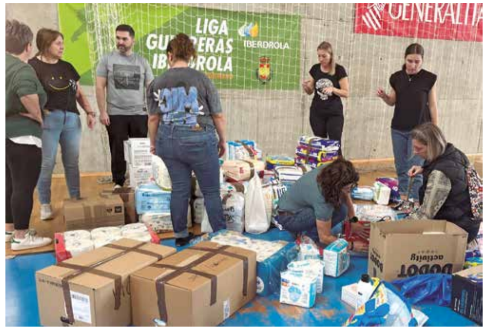
Organització i classificació de productes recollits en la comarca.

Els pavellons René Marigil i José Veral, habilitats com a punts de recollida de materials, han sigut clau per a la tasca de recollida i distribució de donatius. Allí, la ciutadania s'ha organitzat per classificar i empaquetar els produc-