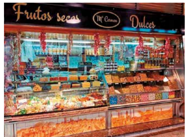
Aparador guanyador en un altra edició.

La regidoria de Comerç i Mercats premiarà els tres millors dissenys d'aparadorisme nadalenc amb 300, 200 i 100 euros, respectivament. Així mateix, també reconeixeran el millor decorat dels mercats municipals amb una dotació de 300 euros. Els aparadors dels negocis participants hau-