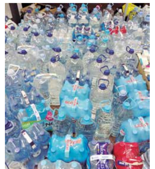
Aigua donada a Estivella.

collida de mantes, tovalloles, i altres productes, amb l'ajuda de la Federació Junta Fallera i el departament de Serveis Socials de l'Ajuntament. La ciutadania va fer un esforç col·lectiu, i les empreses locals varen proporcionar el transport necessari per dur a terme els enviaments a les zones més afectades de la Ribera i l'Horta Sud.