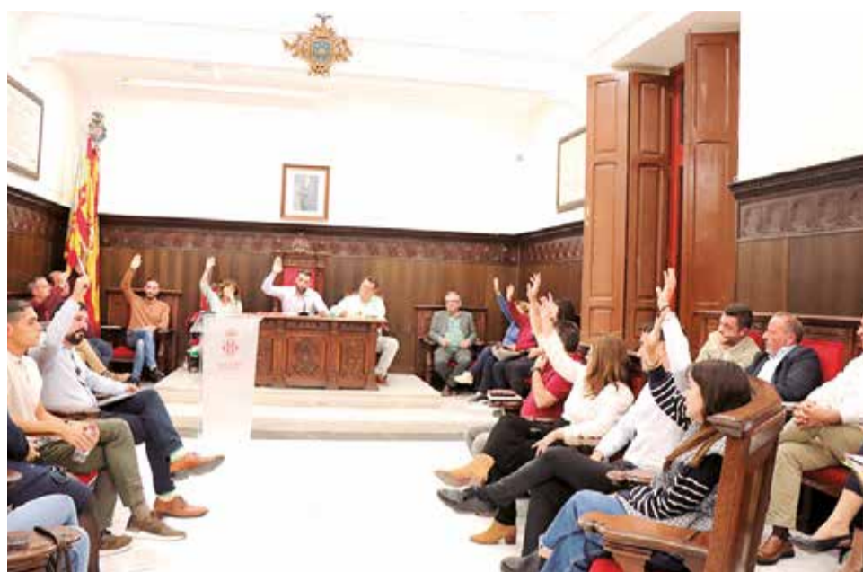
El ple de Sagunt vota l'aprovació dels pressupostos.

El Consistori saguntí també va donar llum verda a una declaració institucional, recolzada per unanimitat, en la qual va expressar el seu suport als municipis afectats i el seu compromís de contribuir a la recuperació. Encara que es va mani-