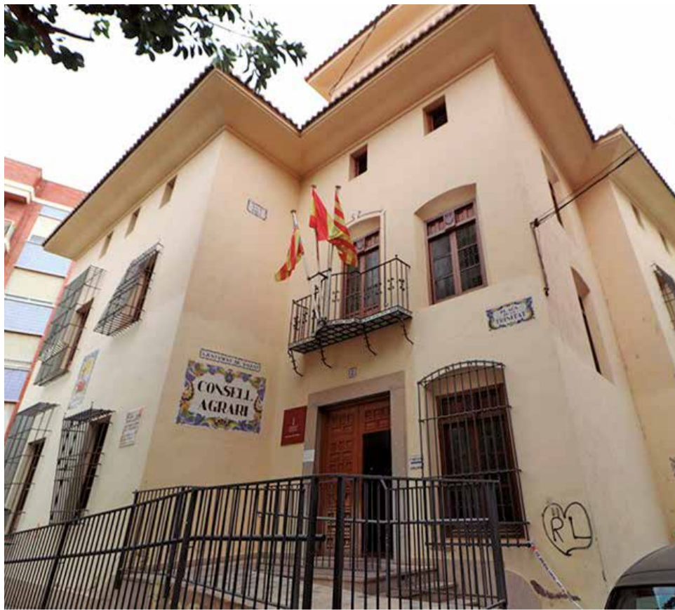
Façana del Consell Local Agrari de Sagunt.

Segons Gil, la desaparició de la partida per a la reparació de camins rurals en el pressupost municipal de 2025 és una clara evidència de les intencions del govern municipal, que busca restar capacitat de decisió al sector i minvar la dedicació als serveis agrícoles essencials per al manteniment de les infraestructures rurals. Així mateix, ha criticat l'absència de convocatòries del Consell Rector Agrari durant els últims mesos, fet que ha dificultat la comunicació i la informació entre