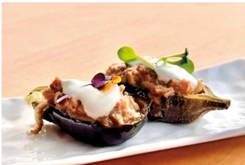
Una de les tapes proposades pel restaurant La Perla.

Este esdeveniment, que s'ha consolidat com un dels més esperats del calendari gastronòmic de Canet, no només fomenta la cultura culinària del municipi, sinó que també impulsa