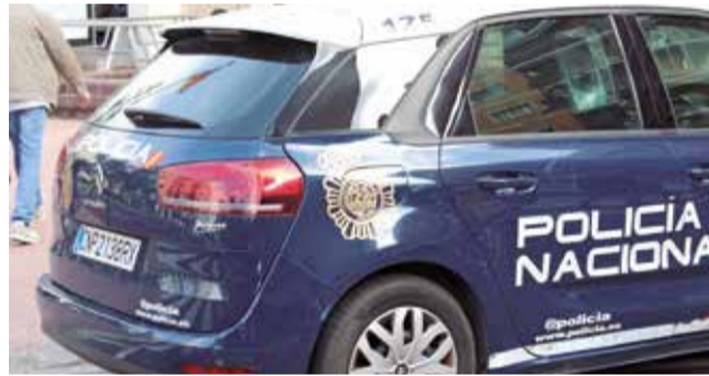
Cotxe de la Policia Nacional.

La dona va intentar demanar ajuda, però no va poder defensar-se de l'atac sorpresa