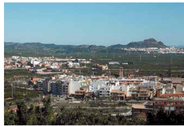
Vista dels municipis de Les Valls.

A més, diversos municipis de Les Valls també han rebut una subvenció similar de 6.000 euros per al desenvolupament de projectes Erasmus+ independents, contribuint així a la col·laboració intermunicipal i optimitzant els recursos per a generar sinergies entre les localitats. La iniciativa Erasmus+ KA153 contempla la col·laboració amb institucions educatives europees i la creació d'un pla que fomenti un entorn més sostenible i inclusiu per a la joventut de Les Valls.