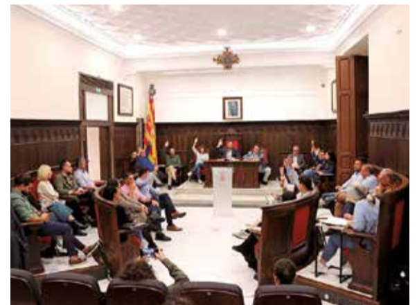
El ple vota la dissolució del Consell.