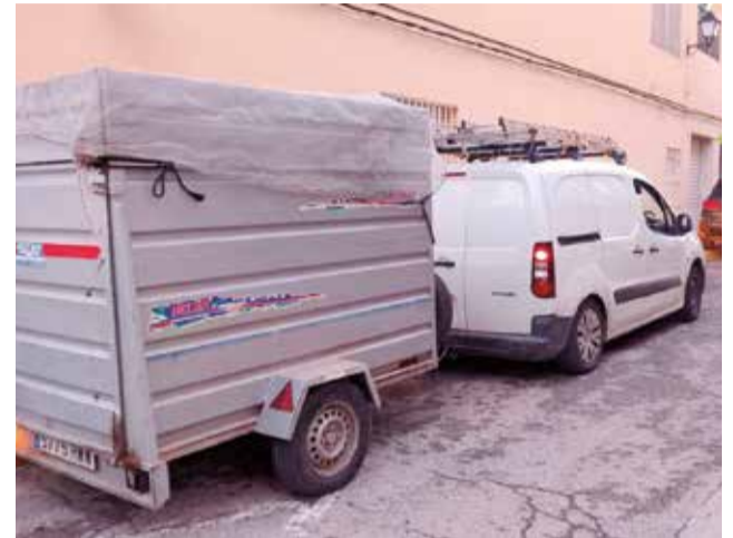
Vehicle carregat d'ajuda.

La recaptació de recursos s'anava actualitzant a mesura que els pobles afectats ho requerien. Aigua, roba, ali-