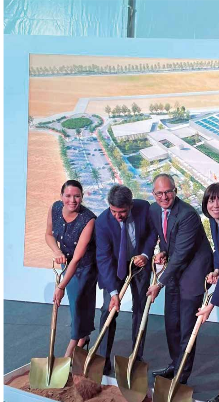
Las autoridades ponen la primera piedra de la fábrica de válvulas