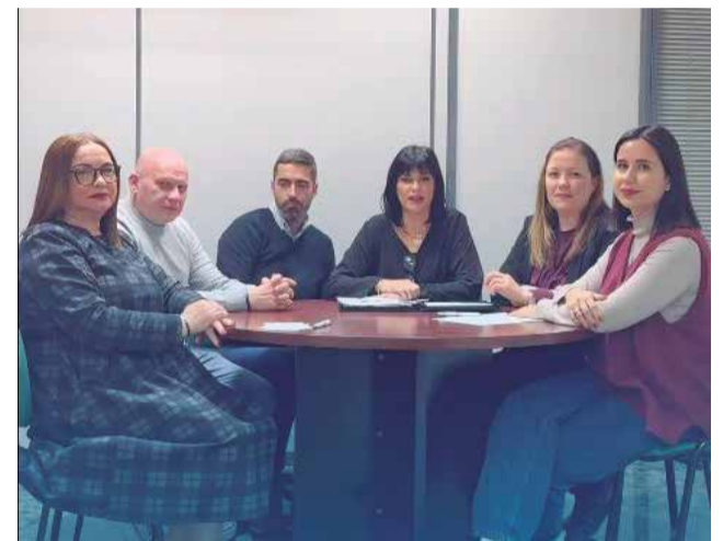
Los concejales del PP de Moncada.

Respecto a 2025, los populares no auguran muchos cambios ni mejoras, "sin presupuestos ni habilitados nacionales".