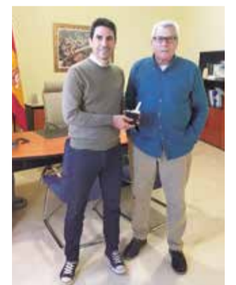
La presentació.

La millora arrancarà en breu amb la instal·lació en totes les vivendes i indústries de Vinalesa de comptadors intel·ligents de nova generació que emetran, mitjançant radiofreqüència, informació exacta