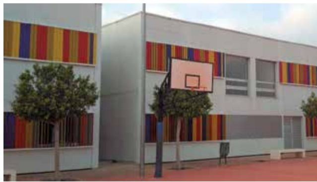
Las instalaciones del IES El Puig.

La reunión se produjo tras la cancelación de varias citas que tuvieron que suspenderse a petición del departamento, una a principios de octubre por cuestiones de agenda y otra en noviembre debido a