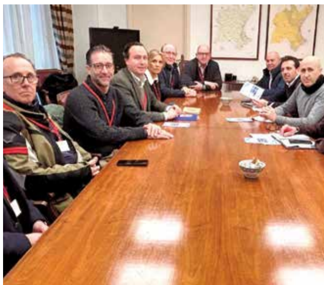
Trobada dels empresaris amb la CHX.