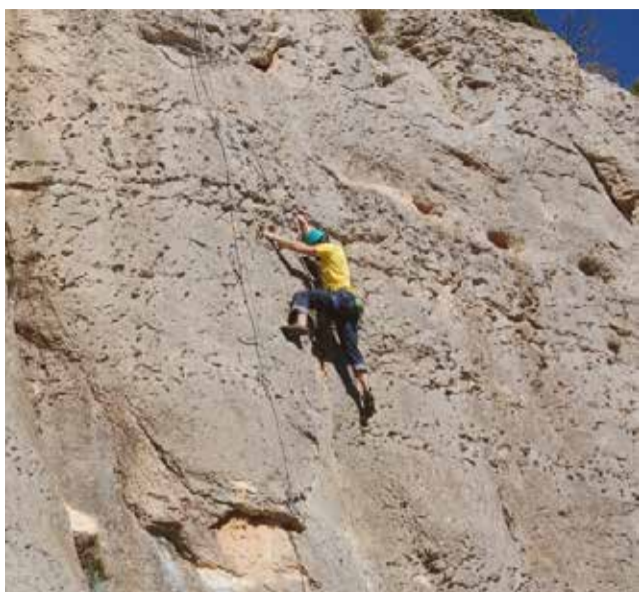
Escalada a Chera.