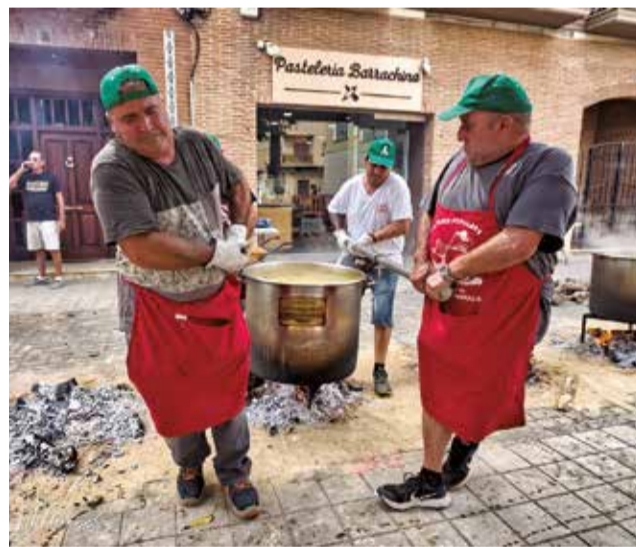
Els cuiners porten una caldera.

Un dels actes més esperats i tradicionals de les Festes de Sant Antoni Abat a La Pobla de Farnals és el repartiment de les Calderes Populars, un plat típic que reuneix a tota la localitat en la plaça Generalitat per a arrellegar la tan esperada caldera. Un menjar elaborat segons la recepta tradicional del municipi. Aquest esdeveniment, que tindrà lloc el diumenge 19 de gener a les 14.00 hores, és un