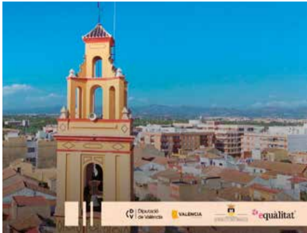
La imatge de la web. / EPDA

Entre les accions més destacades es troba un shooting fotogràfic professional, concebut per a capturar l'essència del municipi. Esta sessió ha permès generar un arxiu d'imatges d'alta qualitat que ressalten els racons més emblemàtics d'Albalat dels Sorells, contribuint a reforçar la seua identitat visual com a destí turístic únic.