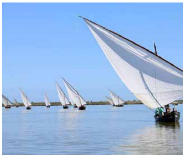
Vela latina a l'Albufera. / EPDA