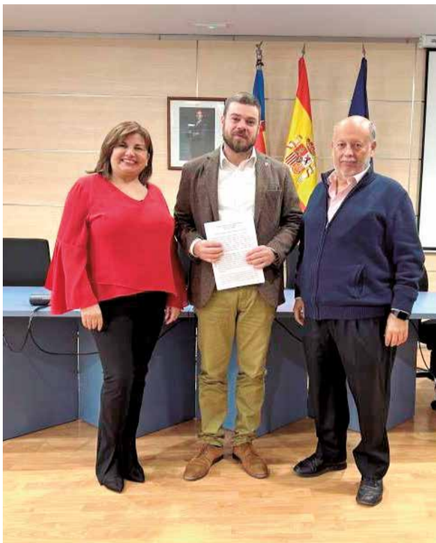
L'alcalde, la portaveu del PSPV i el de Compromís.

El pacte inclou principis de funcionament com la transparència, la rendició de comptes anual i la cerca del consens en la presa de decisions. La coordinació entre totes dues formacions s'aplicarà en totes les àrees municipals per a garantir el compliment dels objectius fixats.