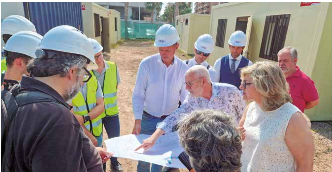
La pasarela de La Pobla (arriba) y el inicio de las obras del IES La Patacona en Alboraya.