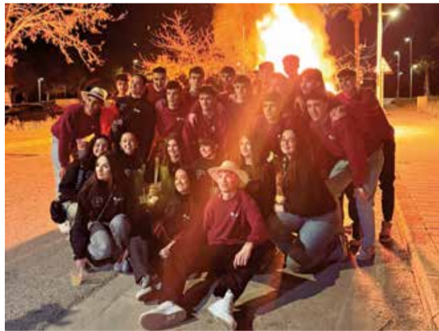
Els Quints en la foguera de Sant Antoni.

Com és habitual, la localitat ha comptat amb la tradicional 'arplegà' de trastos, la foguera al carrer Jeroni Montalt i orquestra el mateix divendres. El dissabte 11 va arribar un dels actes clau de la programació: el repartiment de les calderes, guisades per Tisarra en el pàrquing del Sector Sud, i posteriorment es va realitzar el trasllat de la imatge de Sant Antoni des de l'Església fins a la casa del fester major. Una altra orquestra va posar el toc musical a la jornada.