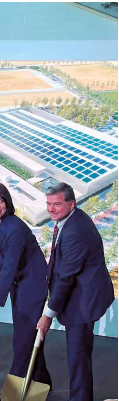
Obras en Moncada.

en El Empalme, tras la urbanización que se ha realizado en la zona, después del soterramiento de las vías del metro. Un espacio para el disfrute de los vecinos y visitantes que el municipio ha recuperado.