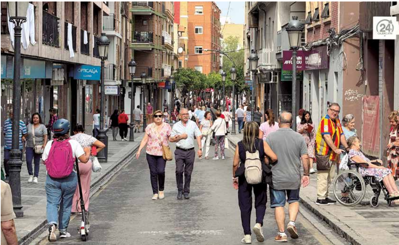
Los viandantes recorren un tramo de la calle Mayor.