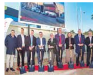
La primera piedra. / EPDA