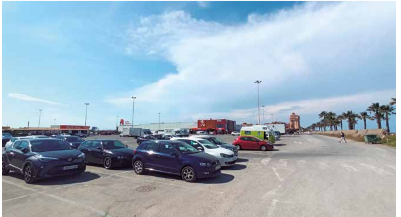
Los terrenos del aparcamiento de Port Saplaya.

¿Qué hubiera pasado de no haber llegado a tiempo? Sobrepassar el plazo conllevaría, en primer lugar, el mencionado incremento de los intereses, "alcanzando la barbaridad de destinar 100.000 euros al mes a ello que se deben usar para otros servicios", explica el