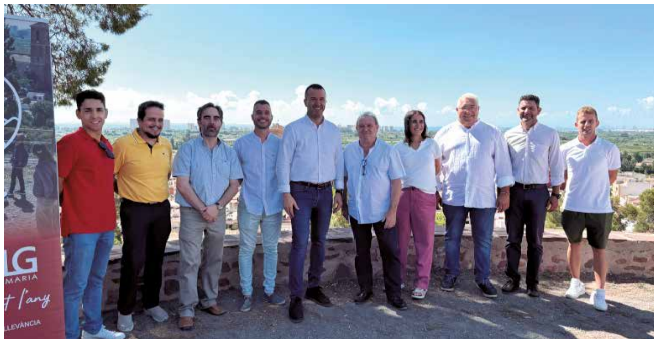
El Museu de la Fàbrica de la Seda de Moncada (arriba) y la recuperación del Castell de El Puig (abajo).

traído cola y será uno de los temas recurrentes en este 2025. La polémica se ha extendido por la capital de l'Horta Nord, Paterna, con la peatonalización de la calle Mayor, a la que se oponen los vecinos. Tampoco ha sido muy popular el intento del Ayuntamiento de Moncada de hacer lo mismo con su calle Mayor, ni el de Rafelbunyol que