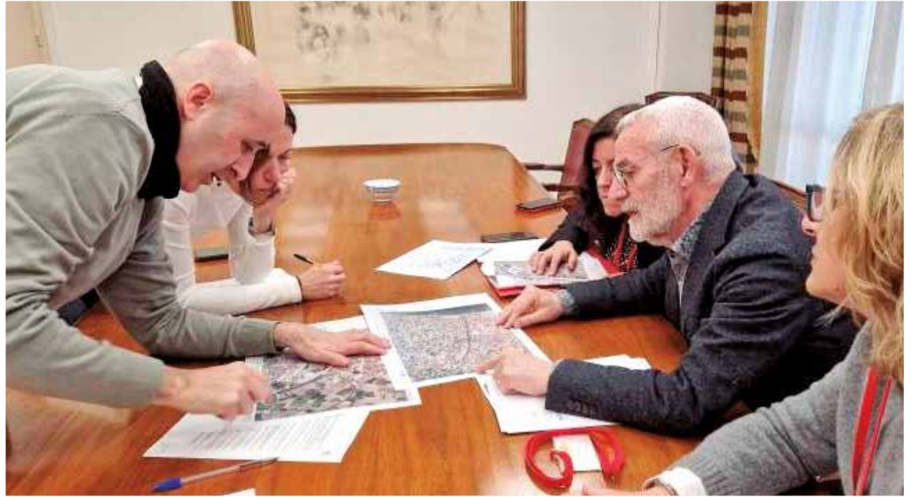
La reunió entre la CHX i l'Ajuntament d'Alboraia.

En la reunió, la Confederació s'ha compromès a visitar en els pròxims dies l'entorn natural per a estu-