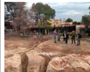
Visita a la zona.