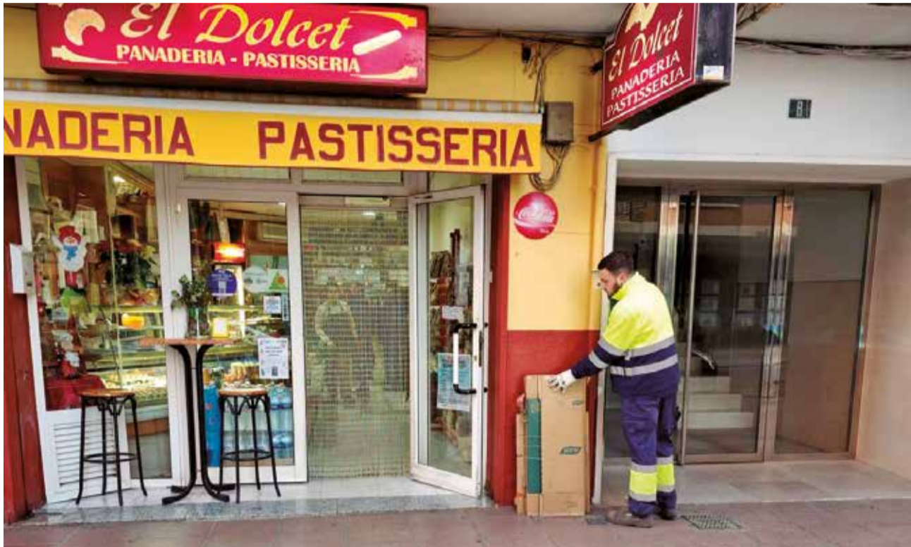
Un operario recoge el cartón depositado por un establecimiento.

Un total de 225 comercios del municipio se han adherido a la campaña en la que la empresa responsable, FCC, recoge el cartón en el propio establecimiento, reduciendo así el que se deposita en los contenedores específicos para facilitar que la ciudadanía pueda echar el que genera en sus domicilios.