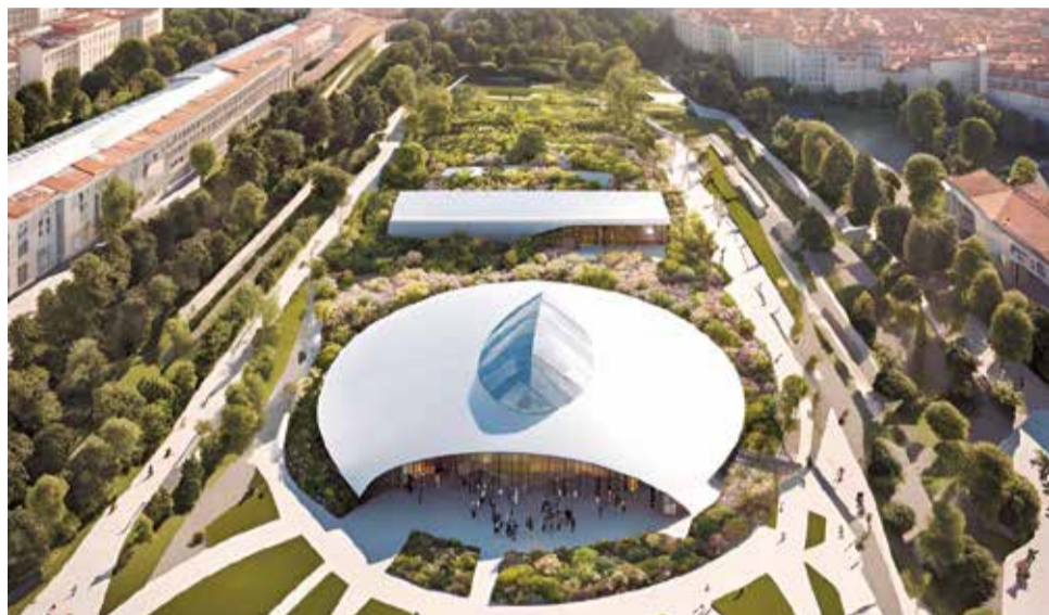
El recinto ferial propuesto por los populares.

El Grupo Popular destaca que un recinto ferial sería una infraestructura clave para fortalecer el tejido asociativo, promover la participación ciudadana