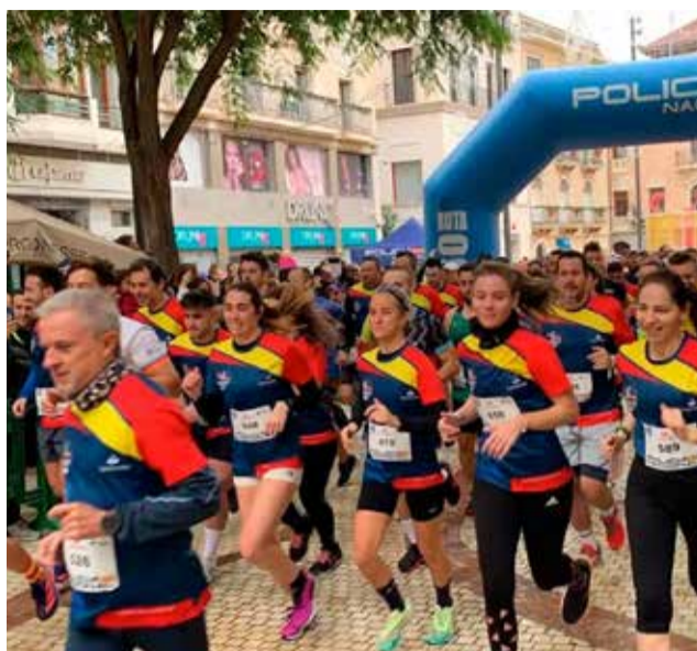
Una carrera a la ciutat de València.