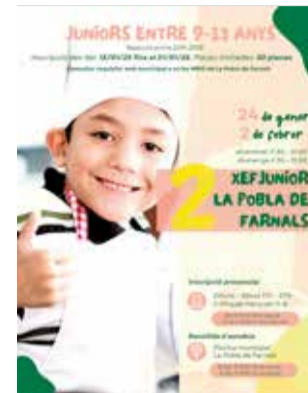
El cartell anunciador.

La primera jornada, que se celebrarà el divendres 24 de gener, de 17.30 a 21.00 hores, estarà dedicada a una classe magistral de cuina impartida per xefs professionals, en la qual els participants aprendran tècniques bàsiques i consells pràctics abans de posar-se a la feina.