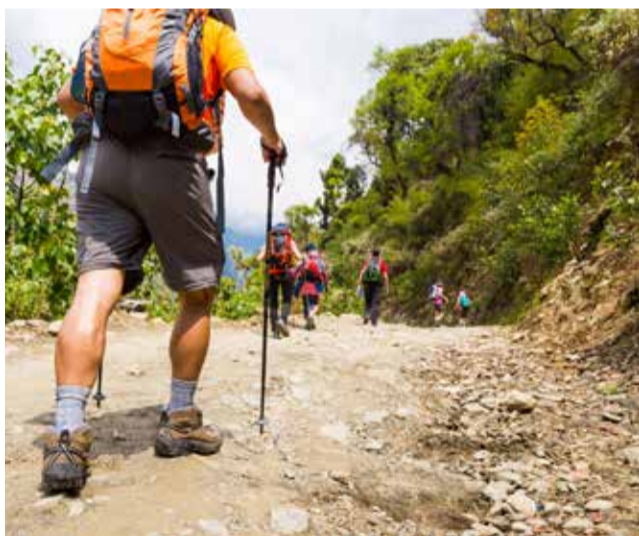
Senderisme a la Serra Calderona.

El Club Voleibol Gandia, fundat en 1996, ha sigut un pilar fonamental per a consolidar esta pràctica a la comarca. Amb equips que competixen en diverses categories i tornejos, el club fomenta la participació i el desenvolupament de talents locals, a més de promoure la pràctica del voleibol com una activitat recreativa accessible per a tots. Així, Gandia es reafirma com un destí que combina esport, naturalesa i qualitat de vida, fins i tot en els mesos més freds.