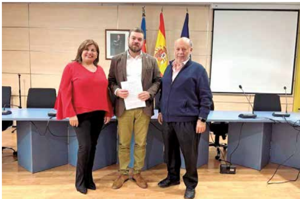
El último pacto firmado en l'Horta Nord en La Pobla de Farnals.