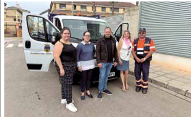
L'alcalde i regidores amb el nou vehicle.