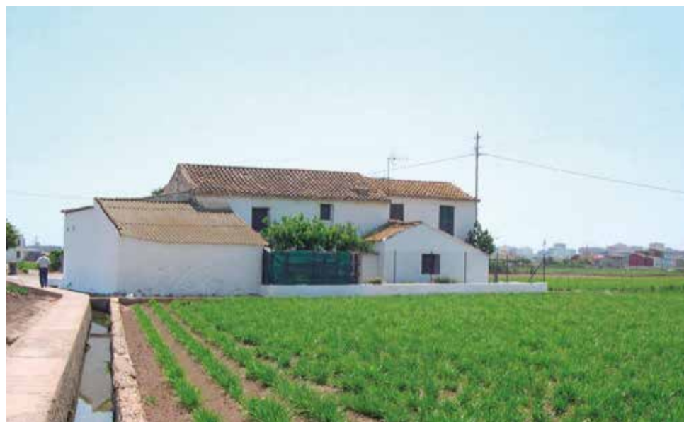
Un campo de cultivo en l'Horta Nord.

Entre 2.000 y 3.000 hectáreas de las 50.000 afectadas por la DANA, se restan definitivamente para cultivo, con lo que la plusmarca de abandono se incrementa