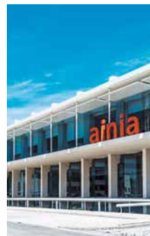
La sede del centro.

En concreto, Ivace+i cederá el uso de cuatro parcelas de 9.264 metros cuadrados en el Parque Tecnológico de Paterna, con una superficie construida de 6.570 metros cuadrados, por un periodo de 99 años. A cambio, el centro tecnológico abonará un total de 5,98 millones de euros a tra-