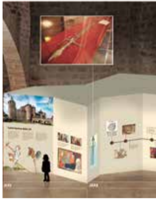
El centro.

El Centro de Interpretación Jaume I tendrá como propósito principal acercar a los visitantes a momentos clave de