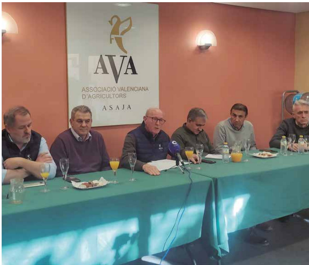
Los representantes de la asociación hacen balance del año.

Los cultivos de hortalizas, con cebolla, patatas, pimienta, alcachofa, pepino, berenjena o sandía a la cabeza, también sufren recaídas, como el caqui de la Ribera, con un 60% menos de producción;