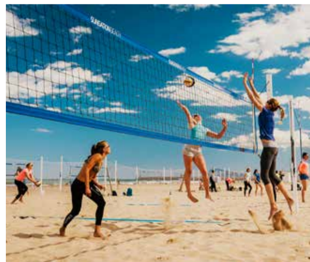
Voleibol a la platja de Gandia.