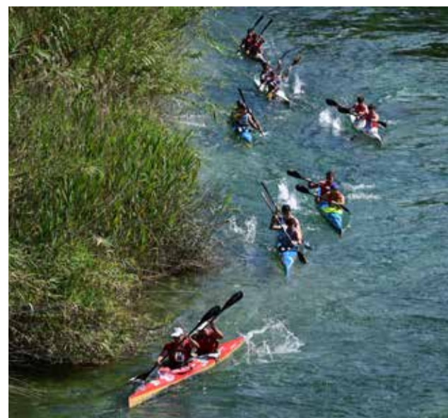
Piragüisme al riu Xúquer.

pinos y flautas; i en el sector Antenas està dividit en dos sectors, el primer d'ells compta amb 12 vies i l'altre amb 11 i la seua orientació és sud-est. Ambdós sectors estan ubicats en un enclavament natural amb molt d'encant, envoltat de gran natura i unes vistes privilegiades. És la destinació idònia per als amants d'este esport i es troba a 50 minuts de València, en el municipi pertanyent a la Plana d'Utiel-Requena.