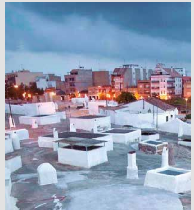
Las casas cueva de Paterna.

Y es que como explica el primer edil "para nosotros las personas mayores son un pilar fundamental de nuestra ciudad y de nuestra sociedad, son muy activos en la vida municipal y están totalmente volcados en cualquier actividad que organizamos".