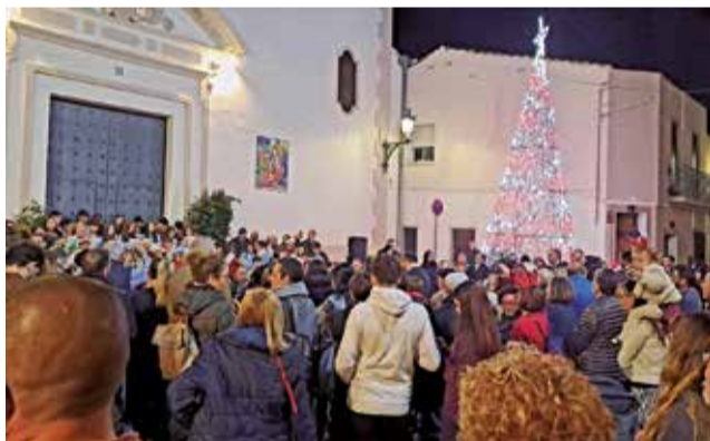
Encesa de llums a Benissanó.