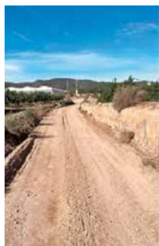
Cabeço Castellar. / EPDA

Els treballs s'han realitzats en trams dels camins de Pla de Calvo, Cabeço Castellar, Entre dos Cerros, Puntal del Motxo i Bibel, dos camins des de El Mas d'Agustín a l'Alt del Rotxero, camí Corral de l'Horta en Collados, dos camins des dels Collados al Cerro la Clotxa, dos camins des dels Collados a Olivera del Raig, camí del Calderón als