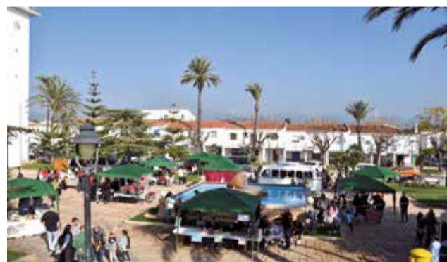
Carpas instaladas en la Plaza del Ayuntamiento.