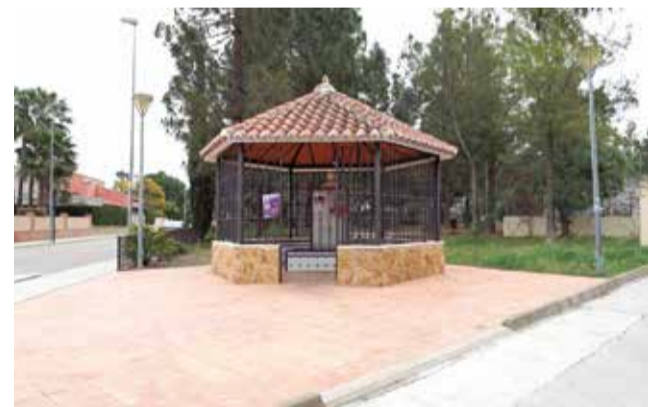
Fuente de osmosis en la calle Terrerola.