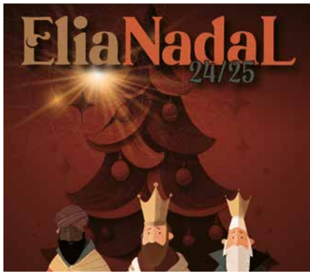
Cartel de 'EliaNadal' 2024-25.

Entre los platos fuertes destacan los conciertos navideños de la Unió Musical de l'Eliana (UME) o la celebración de la Feria del Comercio el fin de semana del 14 y 15 de diciembre. Actuaciones culturales tampoco faltarán como la de l'al teatro 'War baby' para todos los públicos,