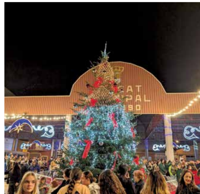
Encendido de las luces de Navidad en la Pobla.

Desde el área de Cultura y Fiestas también se ha vuelto a convocar el tradicional Concurso de Belenes, el concurso de Cartas Reyes de Oriente y el Concurso de iluminación decorativa navideña. Los plazos para participar en las diferentes modalidades ya están abiertos y se pueden consultar en la página web del Ayuntamiento.