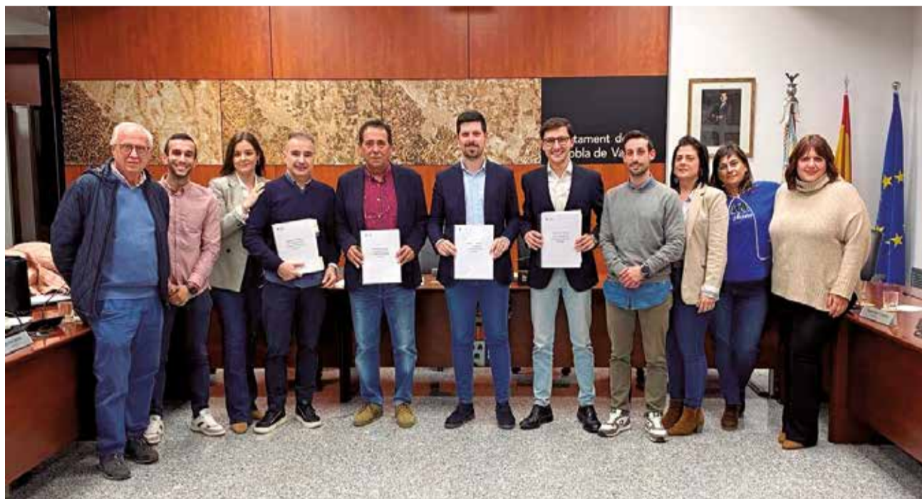
Un instante tras el pleno de aprobación de presupuestos del Ayuntamiento de la Pobla de Vallbona.

Y es que la partida de inversiones reales prevista para el próximo año superará los 12 millones de euros, lo cual representa un aumento del 28,93% respecto a 2024. “Es un presupuesto que ofrece la mayor cantidad de inversión nunca antes vista en la Pobla de Vallbona y que representa la muestra de los avances en los proyectos que venimos desarrollando desde la llegada del nuevo equipo de gobierno el cual sigue avanzando gracias a estos presu-