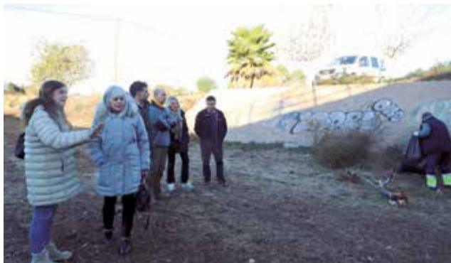
Visita a los trabajos del canal del Carraixet.

Este canal artificial forma parte del desvío de las aguas pluviales al barranco del Carraixet, que se ejecutó en los años 80, como protección de inundaciones al casco urbano, de ahí el interés del Consistorio por su limpieza. “Vamos a seguir reivindicando y exigiendo a los organismos supranacionales la correcta adecuación de las infraestructuras hidráulicas de Bétera”, ha subrayado la primera edil.