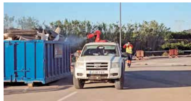
Trabajos de desinfección en Loriguilla.