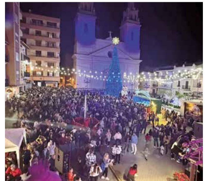
Encesa de llums a Riba-roja de Túria.

La programació nadalenca conclourà amb l'arribada dels Reis Mags. El 3 i 4 de gener, els patges reals estaran en la Plaça de la Torre per a arreplegar les cartes. Finalment, el 5 de gener, la Cavalcada de Reis recorrerà els carrers del municipi des del Parc de la Pinada, en l'avinguda de la Pau. En arribar a la Plaça de l'Ajuntament, els xiquets i xiquetes podran saludar personalment a Ses Majestats.