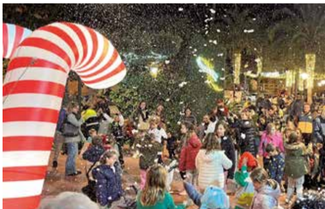
Encendido de las luces de Navidad en Nàquera.