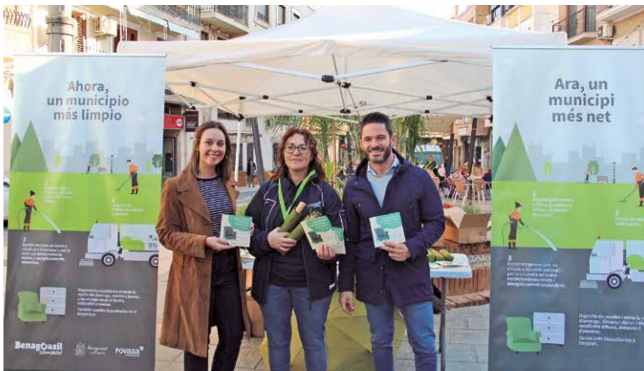
Presentación de la campaña 'Ahora, un municipio más limpio' de Benaguasil.