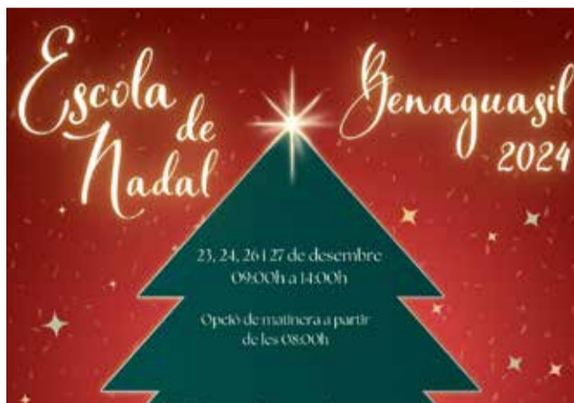
Cartel de la Escuela de Navidad de Benaguasil.

Este servicio, que se realizará durante los días 23, 24, 26 y 27 de diciembre en las instalaciones del CEIP Luis Vives, está