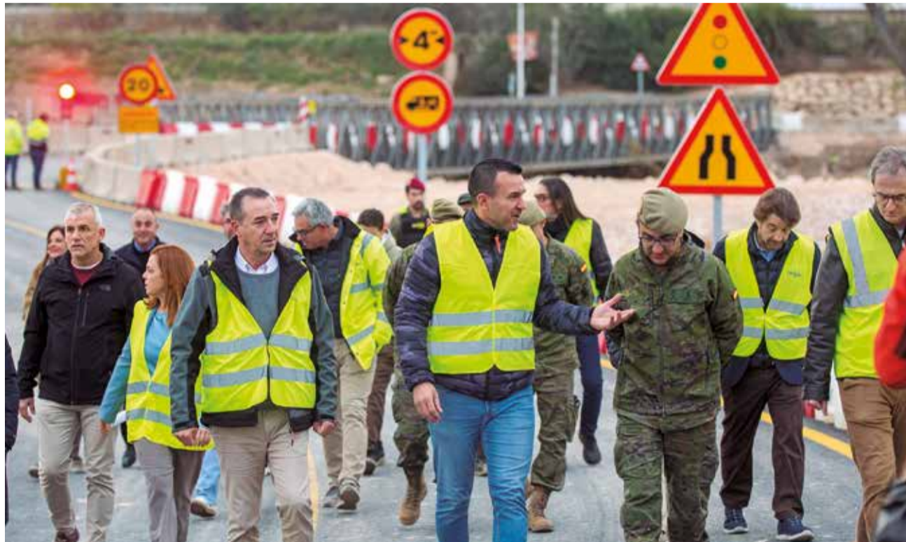
Autoridades en el acto de apertura del puente provisional sobre el río Túria en Riba-roja.

La estructura provisional de tipo Mabey tiene una capacidad de 30 toneladas y está regulada por semáforos, es de un solo carril y dispone de un paso peatonal para facilitar el tránsito de personas. A pesar de su resistencia, el tráfico estará restringido a camiones de más de 3'5 toneladas y solo se permitirá el paso de un autobús a la vez.