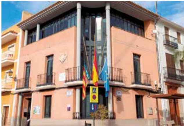
Edifici consistorial d'Olocau.

Es tracta d'uns pressupostos en els quals se segueix la premissa de presentar un equilibri entre els ingressos i les despeses, i en els quals el capítol de funcionament ordinari dels serveis a la ciutadania té un pes significatiu. Així mateix, cal assenyalar la importància de les partides destinades a manteniment i conservació d'instal·lacions i infraes-