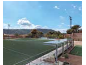
Nova marquesina.