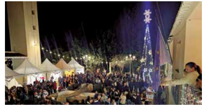
Apertura del Mercado Navideño de Loriguilla.

los más pequeños del municipio; o la ya tradicional Cabalgata de Reyes el 5 de enero.