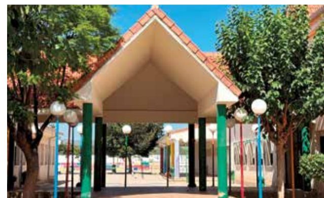
El CEIP Castillo del Real de Marines.

Así, se destinarán 695.419,58 euros a distintas actuaciones que adecuarán el centro a las nuevas necesidades y mejorarán la eficiencia energética de las instalaciones. "Para Marines es una gran noticia que el próximo año, en los meses de verano, podamos realizar todas estas actuaciones. Los niños y niñas de nuestro pueblo tendrán un edificio mejor preparado y más comprometido con el medio ambiente", ha