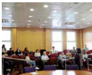
Sessió formativa./ EPDA