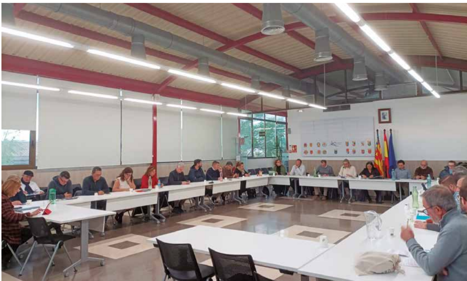
Un instant durant la sessió plenària de desembre de la Mancomunitat Camp de Túria.

■ ELS PRESSUPOSTOS DE LA ENTITAT DEL CAMP DE TÚRIA PER AL PRÒXIM ANY REPRESENTEN UNA CONTINUÏTAT ALS DE 2024