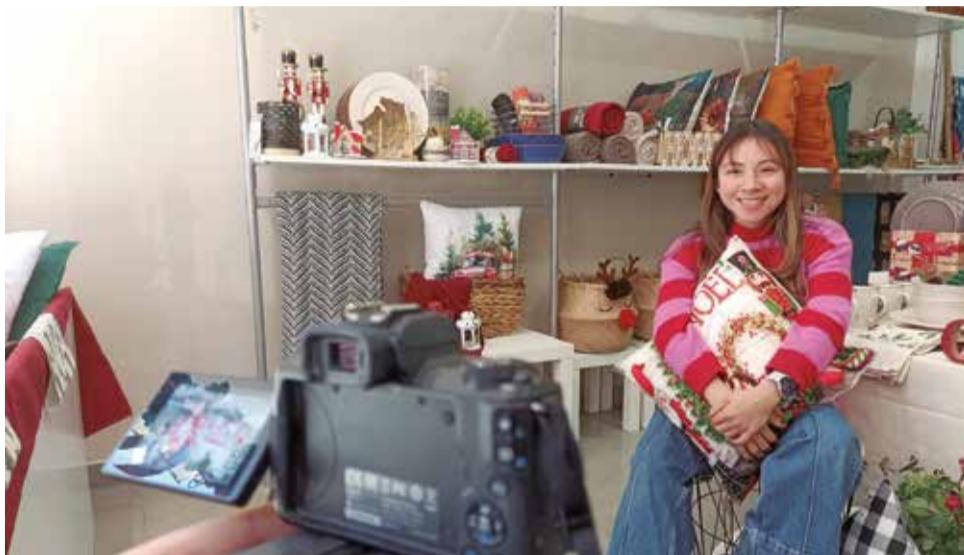
Un instant durant una gravació.

Esta acció s'emmarca dins de les diferents línies de treball del Pacte Camp de Túria, un projecte que és finançat per GVA-LABORA i el Ministeri de Treball i Eco-