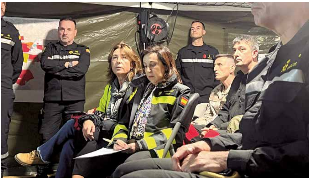
Autoridades y efectivos en el Puesto de Mando Avanzado de Riba-roja de Túria.