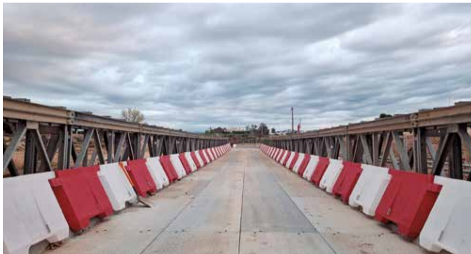
Nuevo puente provisional de conexión con la zona norte de Riba-roja.