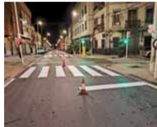
Avinguda. / EPDA