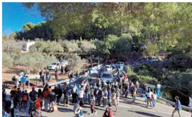
Edició anterior de la Pujada al Garbí.

En paraules de l'alcalde, Alicia Tusón: "Es complixen les bodes d'or de la Pujada al Garbí, prova degana de l'automobilisme de muntanya valencià. Una edició inigualable que estem preparant juntament amb l'escuderia Ben-