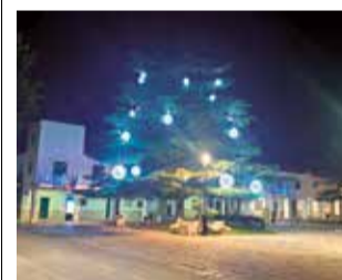
Encendido de luces.