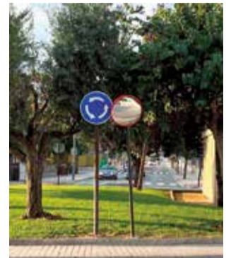
Espejo panorámico.

Los espejos panorámicos han sido colocados en zonas estratégicas y en puntos donde la visibilidad era reducida, especialmente en cruces donde los conductores encontraban dificultades para evaluar el tráfico. Concretamente, algunos de los equipamientos se han instalado en las calles de los Abetos, Llebeig, Bidasoa, Fuente Algezar, Xuquer, del Pou, Segura y Sequer, entre otras.