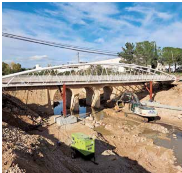
Infraestructuras dañadas tras el paso de la DANA en Vilamarxant.