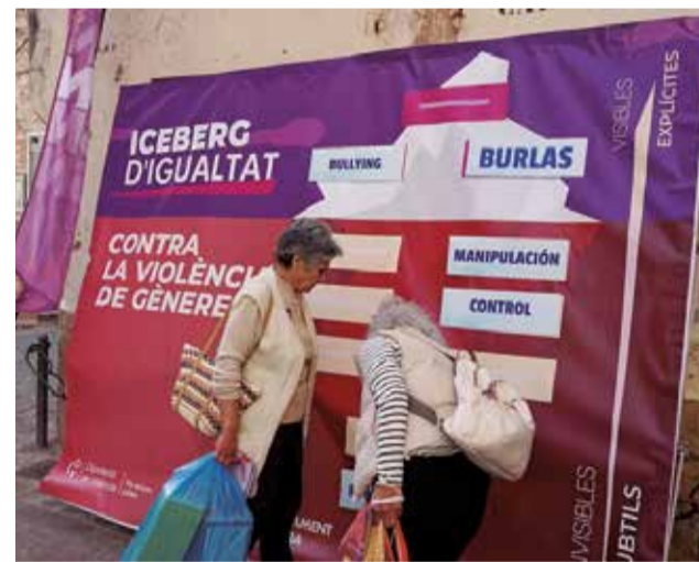
Dos dones participen en l'iceberg d'igualtat.

A través de la campanya s'ha elaborat un fullet explicatiu on es proporciona un protocol d'actuació davant situacions de violèn-