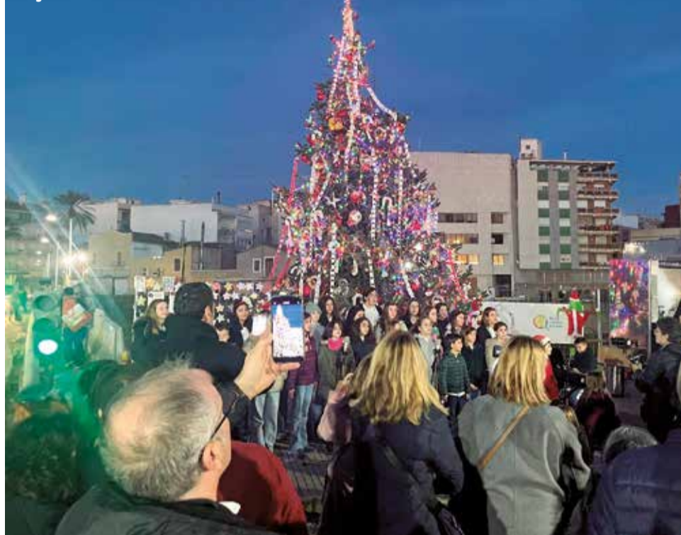
L'arbre de Nadal plantat a l'ajuntament