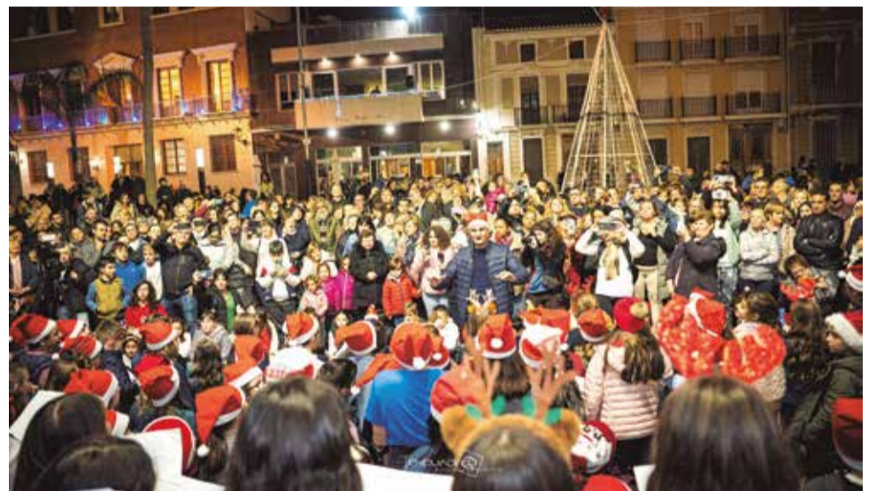
El coro formado por niñas y niños.