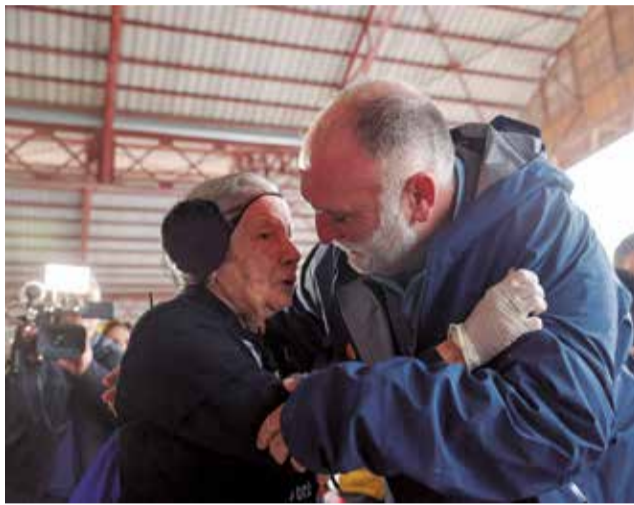
El chef José Andrés saluda a una voluntaria.

Los equipos de emergencia de WCK llegaron a Valencia la misma noche del 29 de oc-