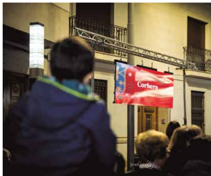
Un recuerdo para los pueblos afectados por la DANA.