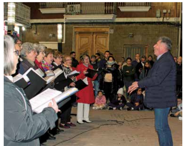
Los participantes en el acto.