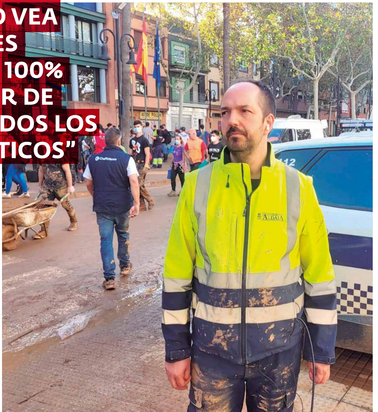
El alcalde de Aldaia, Guillermo Luján, colabora en los trabajos de limpieza.

► Durante las horas posteriores al tsunami del 29 de octubre, vivimos una situación lamentable. Cuando se filtró en los medios de comunicación un documento en el que se decía que Aldaia era