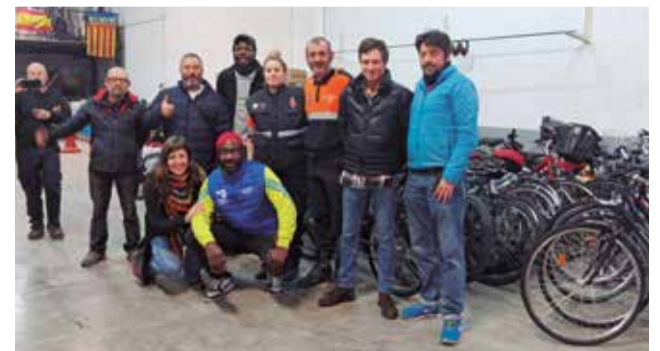
Els participants en la iniciativa.

En la campanya han col·laborat les associacions Biraka i Zirkodomoa (Barakaldo), Recicle (Iruña), Bizikleteroak (Gasteiz), Bizifam (Amorebieta) i l'associació ciclista d'Amorebieta, Ekologistak Martxan, i la coordinadora estatal Conbici, a més dels ajuntaments de Bilbao, Barakaldo, Vitòria-Gasteiz i Pamplona-Iruña.