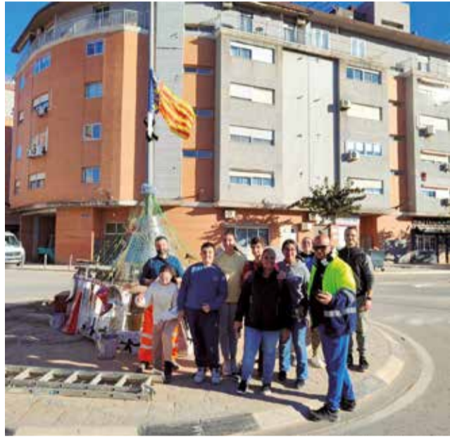
L'arbre disenyat pels veïns.

Ses Majestats d'Orient, amb una mirada solidària, treballen per a dur la il·lusió a la població. D'esta manera, les