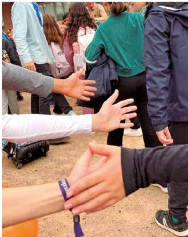
La benvinguda als alumnes.

Els alcaldes d'Alaquàs i Aldaia estagueren presents en la recepció i mostraren la seua satisfacció per aquesta acollida que mostra una ve-