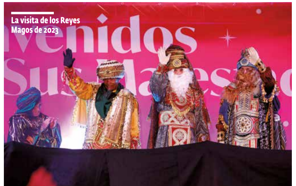
La visita de los Reyes Magos de 2023

Y uno de los momentos más esperados de las Navidades en Mislata será la celebración de la Cabalgata de Reyes, el día 5 de enero por la tarde. Este evento cuenta con la participación en el desfile de cerca de un millar de personas, pertenecientes a asociaciones de la localidad, comisiones falleras y entidades, que trabajan juntas para llenar las calles del municipio de color, música alegría y emoción. Este es uno de los eventos donde