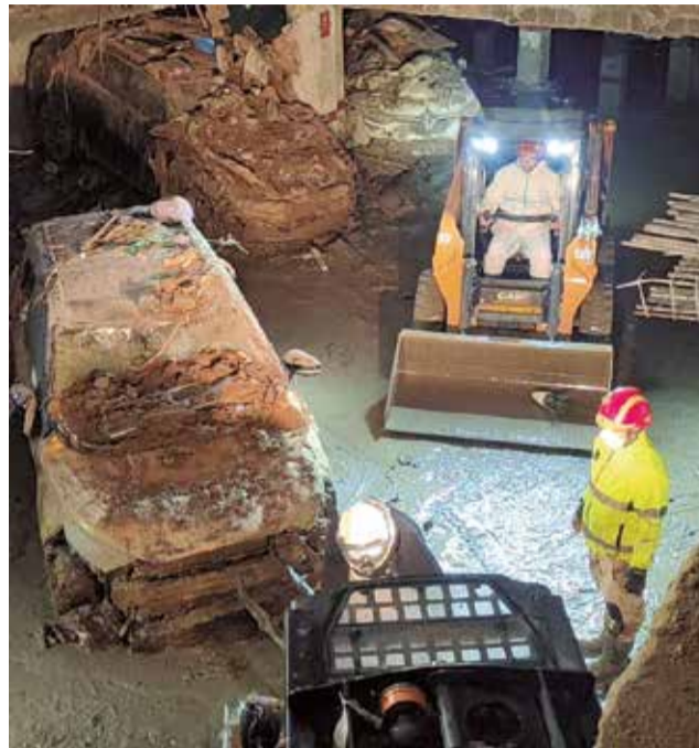
Els efectius netegen un garatge.

Respecte als garatges, prossequixen les tasques amb la col·laboració de la UME, bom-