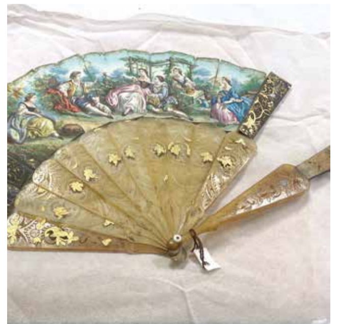
Un dels palmitos del MUPA.

En el marc d'ajudar als municipis afectats en la seua reconstrucció després de la catàstrofe, inclos l'àmbit cultural, els tècnics de l'ETNO han posat en marxa el seu pla per a oferir ajuda i suport tècnic als 32 museus que formen l'Etnoxarxa. El Museu del Palmito és un dels museus d'esta xarxa etnològica de la corporació provincial.