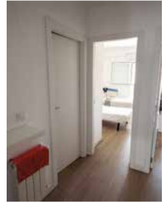
Uno de los pisos.

Estas casas son una extensión del Proyecto Fénix que tiene la Asociación, que cons-