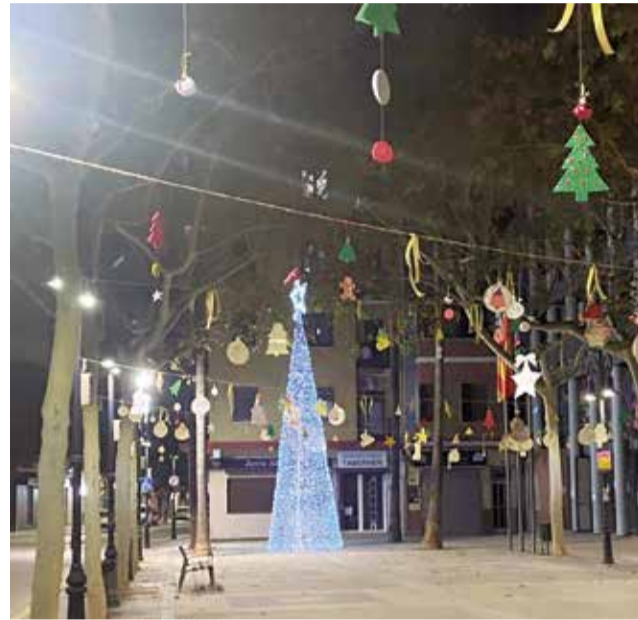
L'arbre solidari de l'ajuntament.

famílies podran triar el regal dels seus fills i filles, omplint un formulari i triant el regal que més s'adapte a elles i ells. Melcior, Gaspar i Baltasar confirmen que venen cap al poble carregats de màgia.