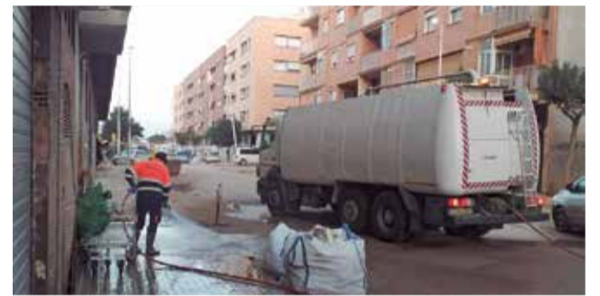
La retirada de vehicles i l'aigualeig de carrers.

res en l'avinguda Murcia i el reforç de material a punts de distribució oficials.