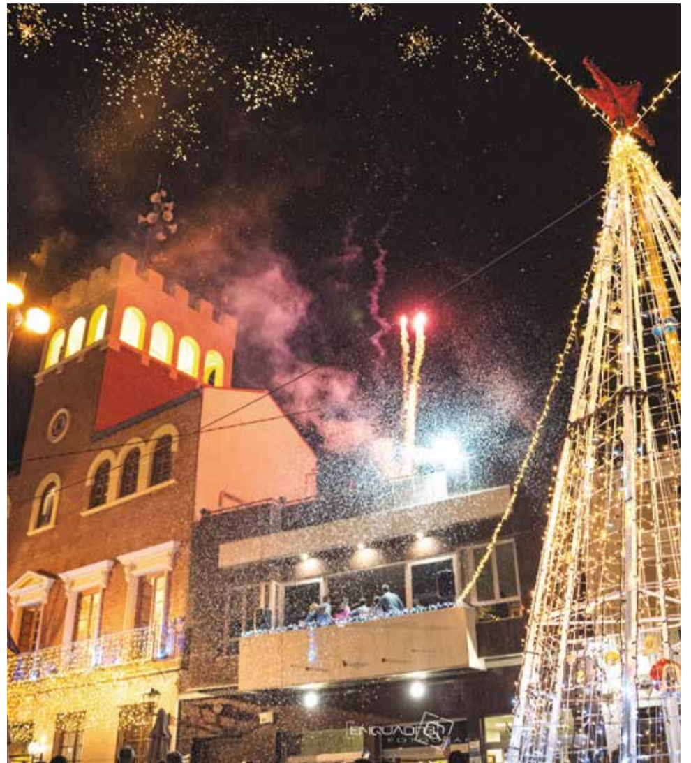
Los vecinos dan la bienvenida a la Navidad en la Plaza del Castell.

Además, también se ha preparado una programación especial para la visita de los Reyes Magos de Oriente, que contará con la ya tradicional Recogida de Cartas en la plaza del Castell el viernes 27 de diciembre. Los pequeños podrán disfrutar del Campamento Real con la colaboración de Guardians de la Torre la tarde del 3 de enero y sin duda el momento más esperado, la gran Cabalgata de Reyes que tendrá lugar la tarde del 5 de enero a partir de las 18 horas para repartir la ilusión.