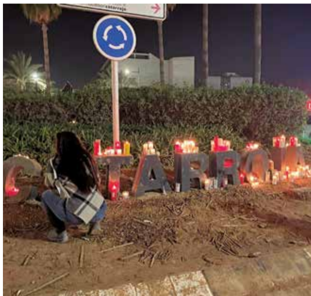
Un pequeño homenaje en Catarroja.