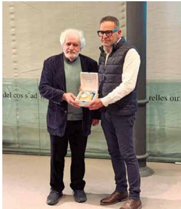
El president rep el premi 'Pont'.

Una de les accions més potents que la Mancomunitat