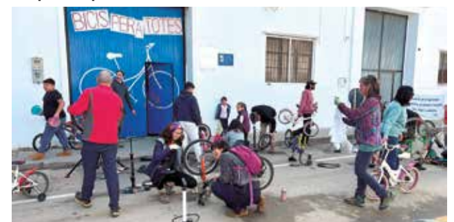
La jornada de reparació de bicis.