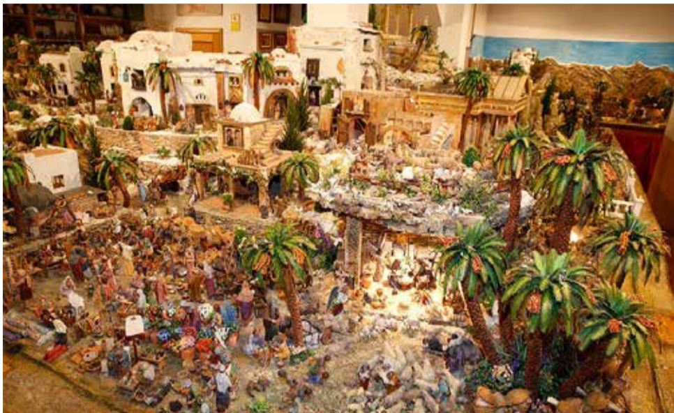
Betlem de Meliana.

► MERCATS NADALENCs. Un dels primers indicis de l'arribada de Nadal són els mercats que florisquen en places i carrers.