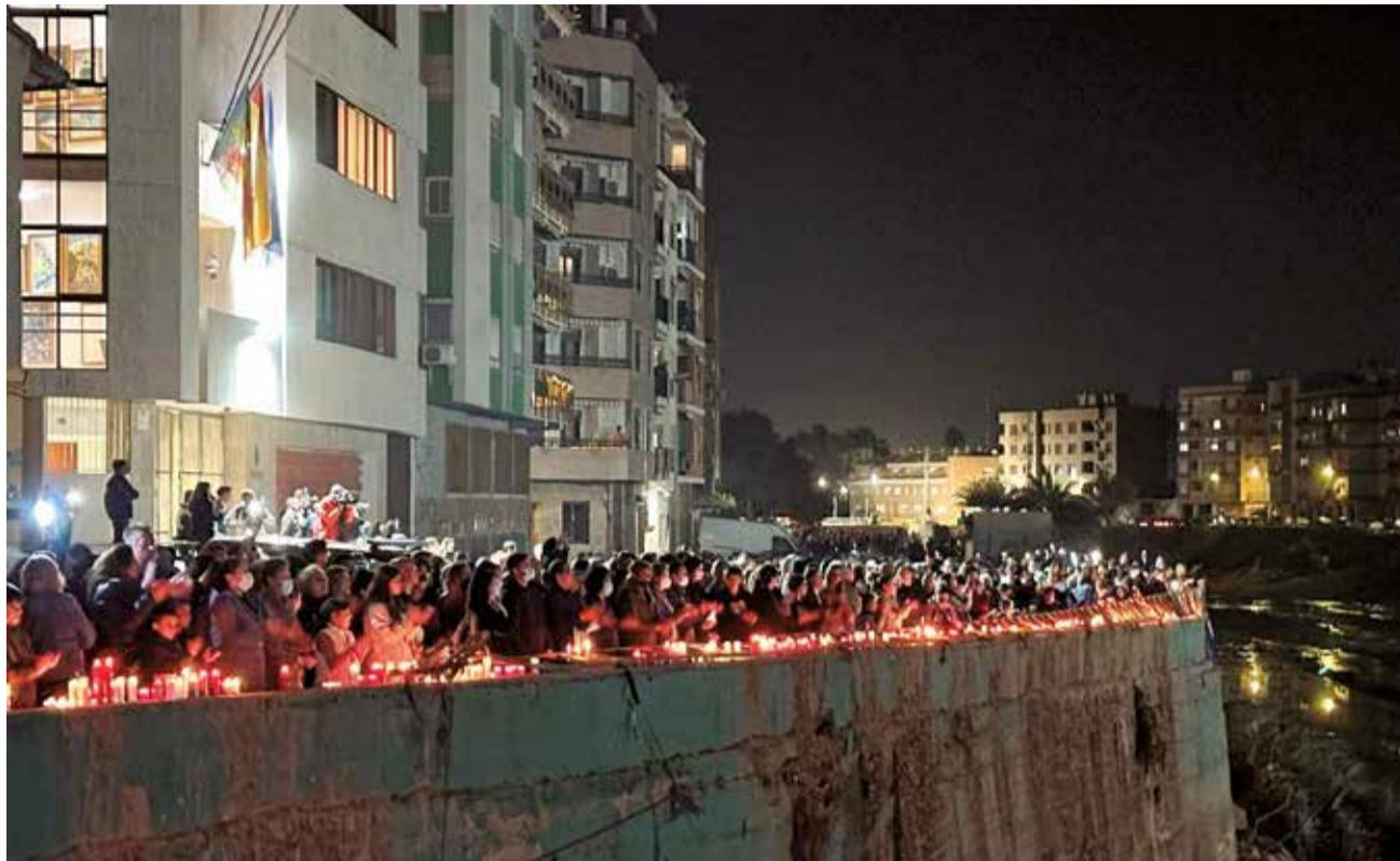
La concentración de los vecinos en Paiporta.

El silencio fue la tónica general, con vítores por los voluntarios que tanto bien han hecho y caras compungidas