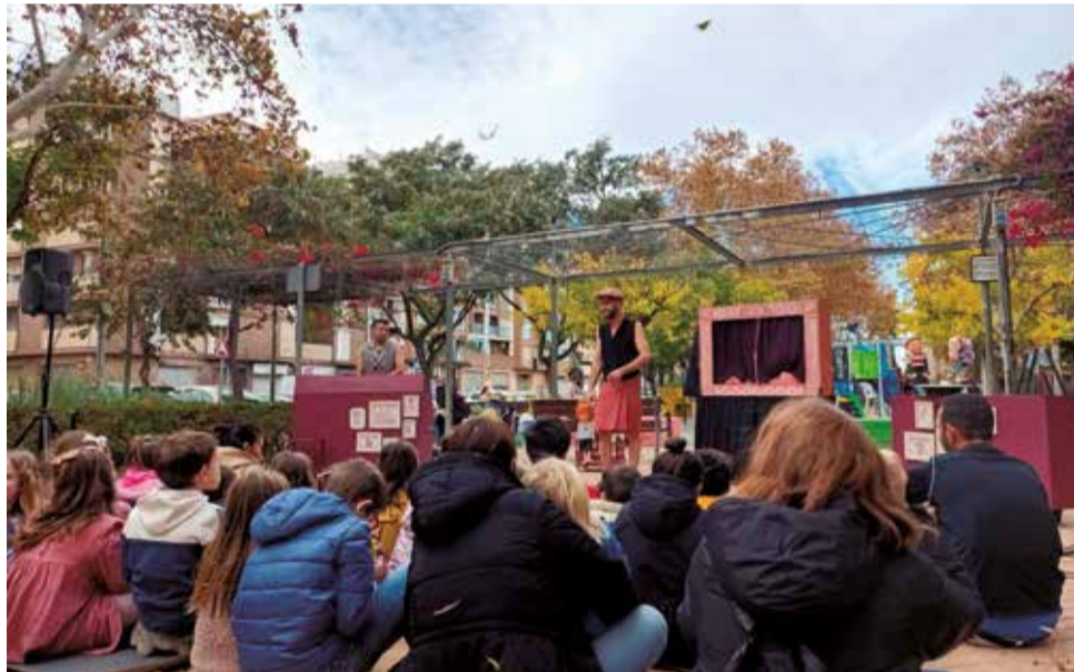
Una activitat per als xiquets i xiquetes.

Un altre exemple de solidaritat és el del ciclista Daniel Sanz, amb la seua iniciativa "Road to Lapònia" que consistix a anar en bicicleta des d'Aldaia fins a Lapònia per arribar a temps a entregar les cartes amb els desitjos dels xiquets i xiquetes al Pare Noel el 24 de desembre. A més, un altre dels objectius és recaptar 30.000 euros para poder donar a les zones més afectades per la DANA i ajudar a la reconstrucció.