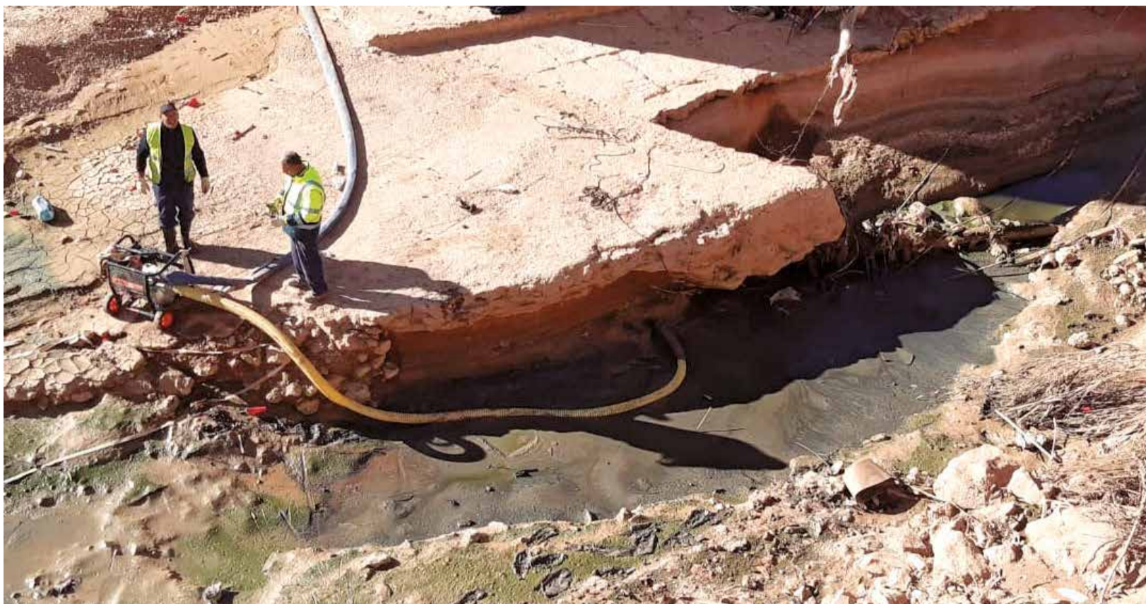
Los trabajos de drenaje de la CHJ en el barranco del Poyo a la altura de Paiporta.

EL MINISTERIO PREVÉ LICITAR LAS OBRAS DEL ENCAUZAMIENTO DE LA SALETA EN 2025 Y EL RESTO, EN LA MAYOR BREVEDAD