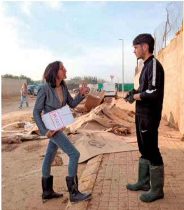
La Mancomunitat aten a les empreses.

"Som conscients dels valors que tenim a la comarca de l'Horta Sud, del potencial que tenen les nostres empreses, del talent que té la nostra gent. Som conscients també de l'ajuda que hem rebut de voluntariats de tot l'Estat espanyol, cossos de seguretat i especialitzats, empreses i altres. Tot això ho agraïm, però queda moltíssima feina per a