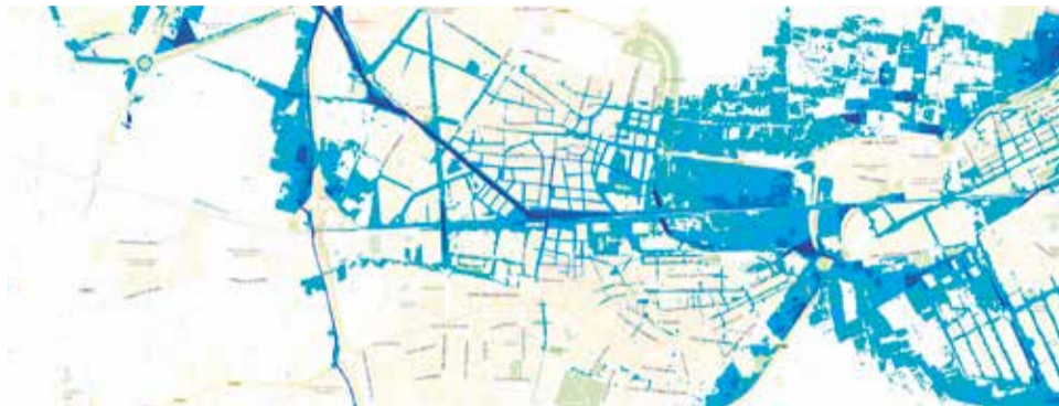
Zonas de Aldaia con riesgo de inundación.

Sobre la cuenca del barranco del Poyo se aprobó el 24 de abril de 1995 un primer proyecto básico de «Restitución y adaptación de los cauces naturales de los barran-