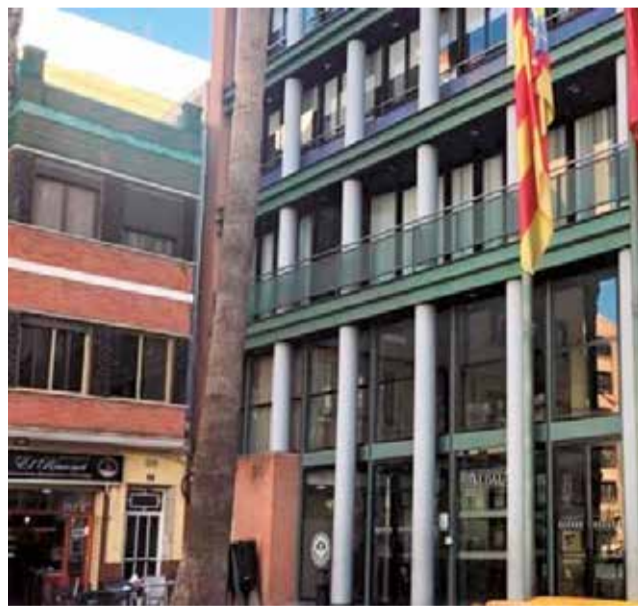
La façana de l'ajuntament.

L'activitat es realitzarà concretament, els dies 23,