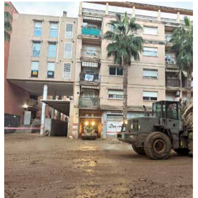
Los trabajos en un garaje en Catarroja.

de números para la reconstrucción y la cifra en 100 millones de euros en infraestructuras, caminos rurales, taludes y edificios municipales. “Torrent necesita respuestas y acciones contundentes. Hemos hecho un esfuerzo enorme para paliar los daños, pero necesitamos más recursos y el compromiso de todas las administraciones. No podemos permitir que las familias afectadas sigan esperando soluciones, ni que infraestructuras críticas queden desatendidas, porque el vecino no entiende de competencias y reclama soluciones”, así lo trasladó al conseller de Emergencias e Interior, Juan Carlos Valderrama, en una reciente reunión de trabajo.