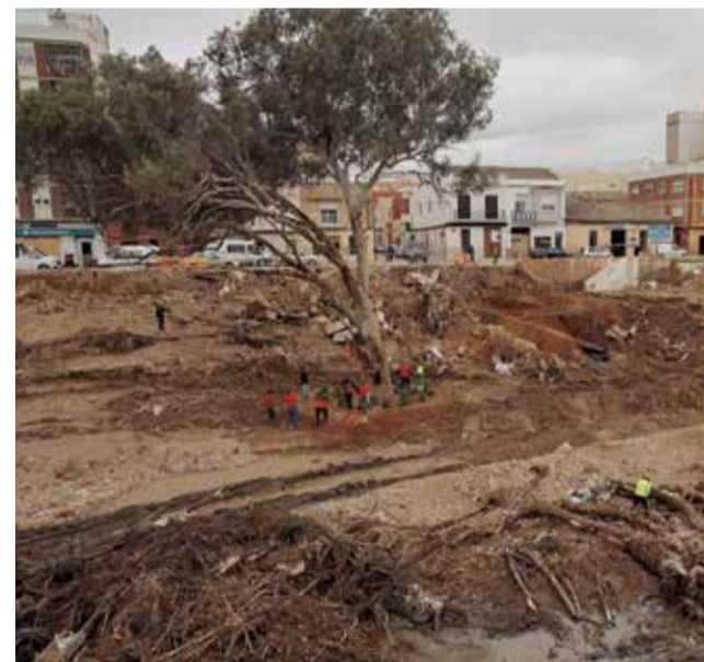
El eucalipto, símbolo en Paiporta.

con mucha emoción contenida que salió a raudales cuando se cantó el himno de la Comunitat Valenciana de forma espontánea. Carteles en memoria de los fallecidos y una gran Senyera con la frase "El pueblo no olvida" quedó para el recuerdo en la valla que quedó en pie. En las noches siguientes,