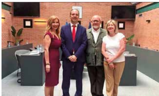
Los cuatro alcaldes juntos.

“Desde hace más de 40 años, junto a nuestros vecinos y vecinas de todos los colores políticos, hemos demandado a todas las instituciones competentes, de to-