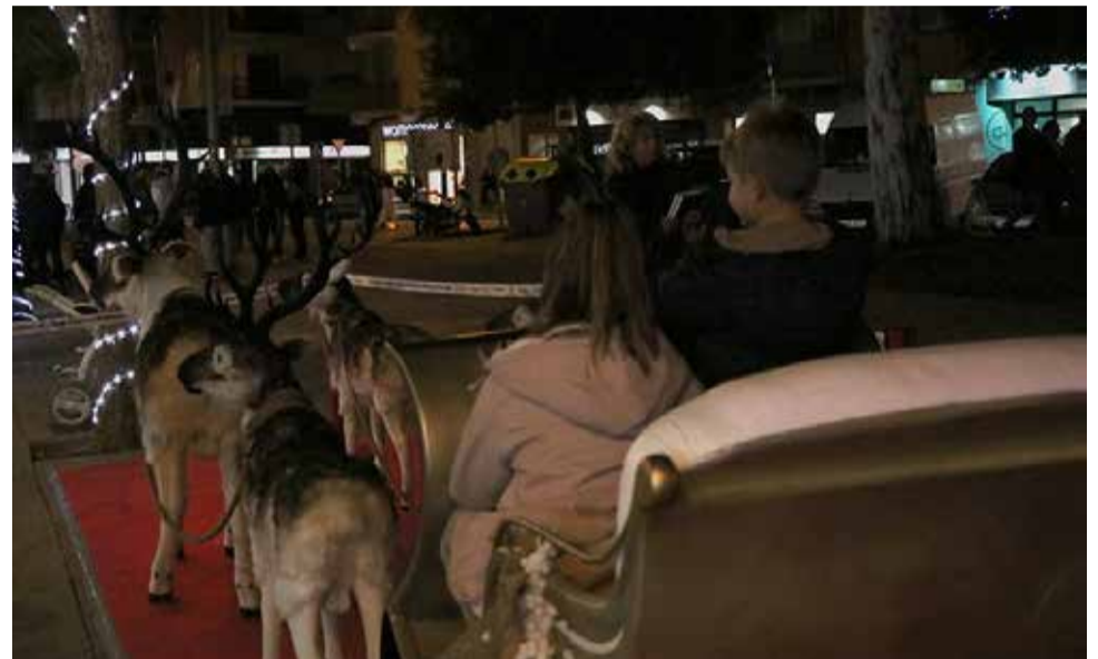
Mercat nadalenc a Sagunt.

embre en la plaça Cronista Chabret, oferint una àmplia varietat de productes artesanals, decoració de Nadal i propostes gastronòmiques típiques de la temporada. Este esdeveniment busca atraure tant a veïns com visitants, impulsant a més el comerç local.