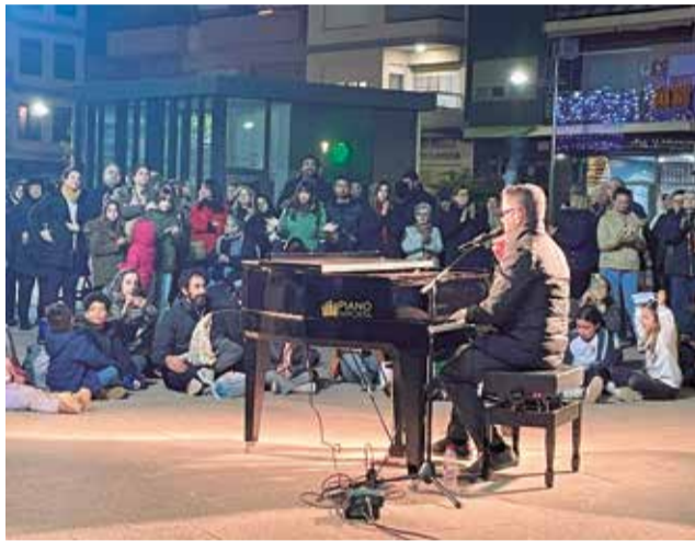
Un momento de la actuación.

En un evento completamente inesperado, un piano apareció sobre las baldosas de la plaza, el mismo lugar que 45 días antes había sido testigo de la devastación, con coches apilados y hogares arrasados por la riada. La comunidad, aún en proceso de recuperación, vivió un momento inolvidable cuando el cantante y pianista de talla internacional Serafin Zubiri se sentó al piano para ofrecer un concierto altruista lleno de emoción y solidaridad.