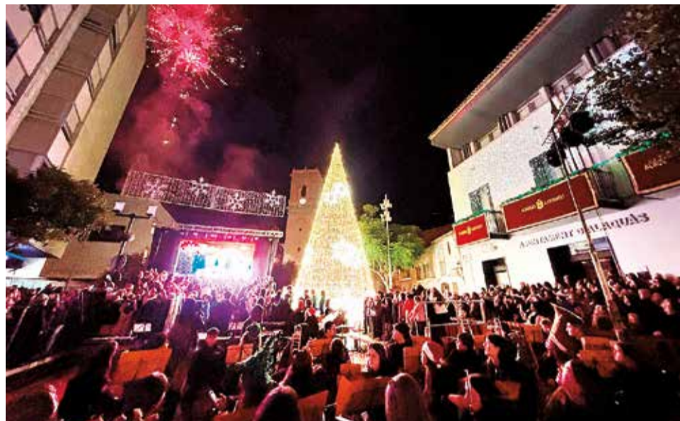
L'acte d'encesa de l'arbre que va tindre un caràcter solidari.

Ja en gener, esperarem l'arribada del Reis Mags d'Orient al nostre Castell, amb els pregoners reials i la cercavila del dissabte dia 4, a les 18:30 hores, i la gran cavalcada dels Reis Mags que arribaran a Alaquàs en la nit màgica del diumenge 5 a partir de les 18 hores, i que en acabar rebrán a tots els menuts i menudes al Castell per a fer-lis entrega d'un obsequi.