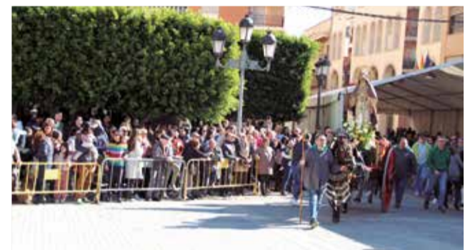
Actos en honor a San Antón en Benaguasil.