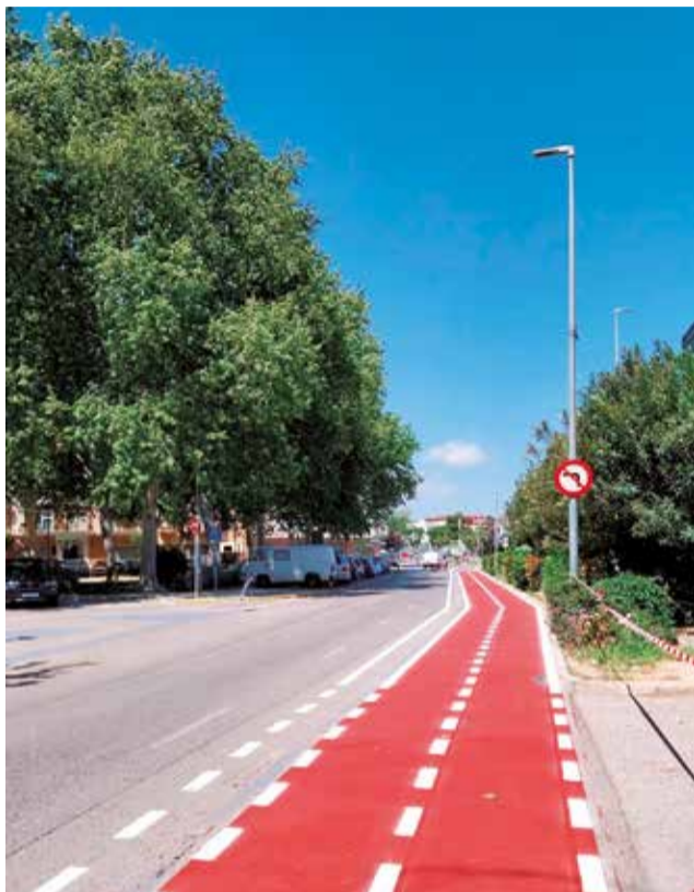
Un tram de carril bici a Casinos.

El projecte està finançat parcialment amb les ajudes de la Diputació Reacciona 2023, segons ha explicat Navarré, grà-