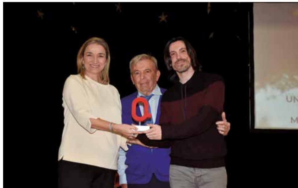
Premi Salut a la UPCCA de la Mancomunitat Camp de Túria. / P.G.