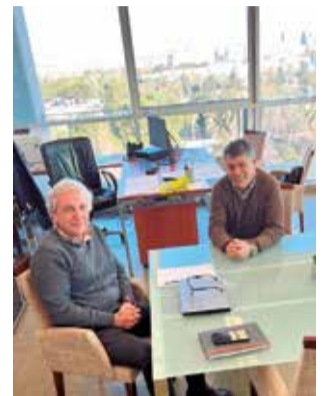
Reunió a València.

Entre altres temes, es va parlar sobre el projecte 'Els Puntals' (un pla aprovat al febrer del 2021 per unanimitat en les Corts, que promou la recuperació d'antics bancals i cultius, i el seu ús per a controlar l'extensió de pi i per a realitzar una labor de tallafocs) i sobre l'aposta per la instal·lació de càmeres tèrmiques, uns dis-