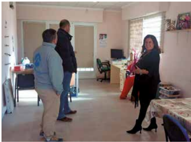
La alcaldesa supervisa los trabajos.

Otra de las actuaciones clave ha sido el cambio del calentador de agua, el cual se había estropeado, un elemen-