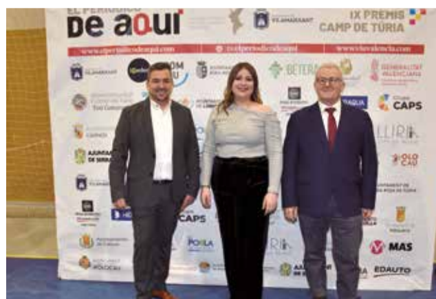
Diversos instants del 'photocall' dels IX Premis de El Periódico de Aquí en el Camp de Túria.