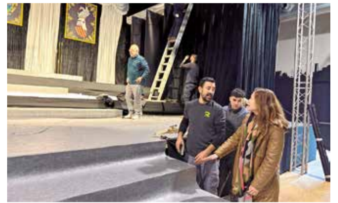
La edil de Fiestas supervisa los trabajos.