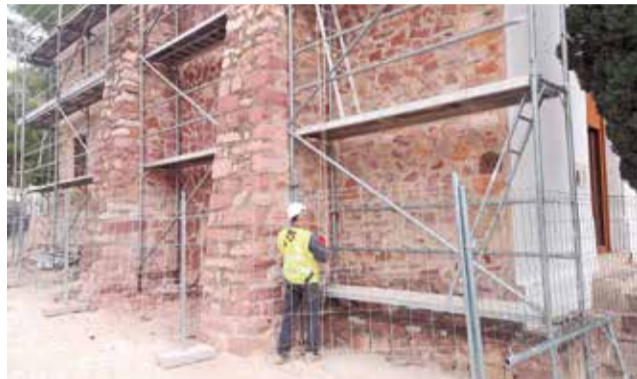
Un operari durant les obres a l'ermita.

En paraules de l'alcalde, d'Alicia Tusón: "Restaurar l'ermita és un compromís adquirit amb la ciutadania