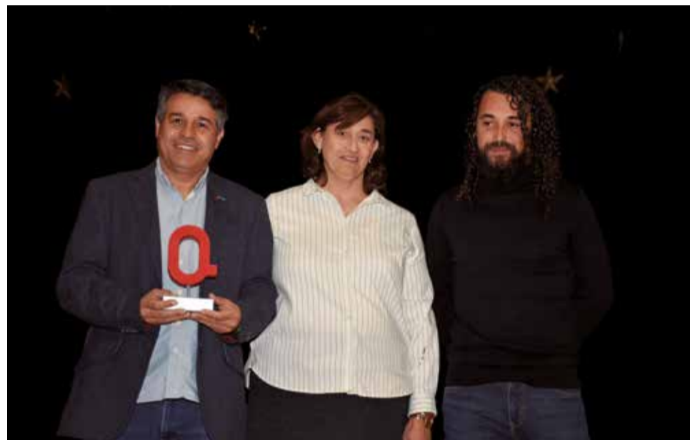
Premi Inclusió per a Olocau i Turisme Adaptat V3. / P.G.