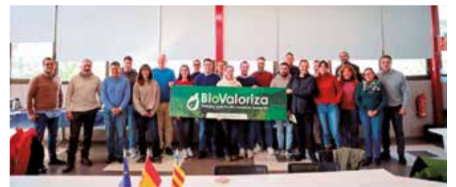
Taller participatiu de 'Valencia BioValoriza'.

Esta sessió de treball es va organitzar amb l'objectiu d'analitzar la possible creació d'un sistema eficient i rendible per a aprofitar els residus de fusta, resultat dels tractaments necessaris per a conservar i protegir els boscos de Camp de Túria (biomassa), com a font d'energia. Això inclou analitzar tots els passos necessaris: des de com s'obtenen estos residus, com es processen i com s'utilitzen