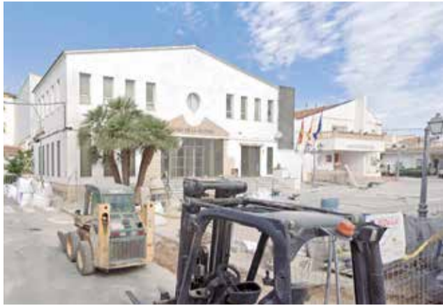
Casa de la Cultura de Loriguilla.

El objetivo de esta intervención es garantizar que