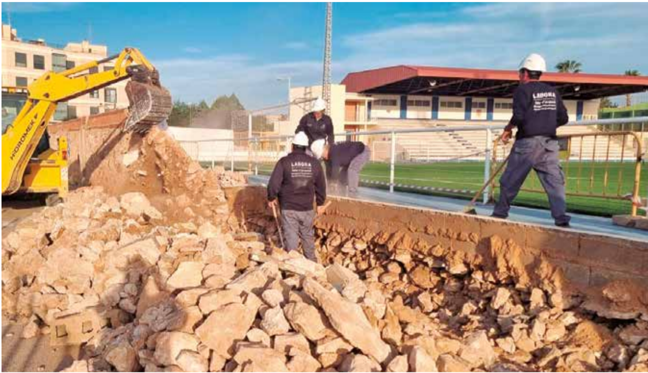
Varios operarios municipales en el polideportivo municipal de Benaguasil.