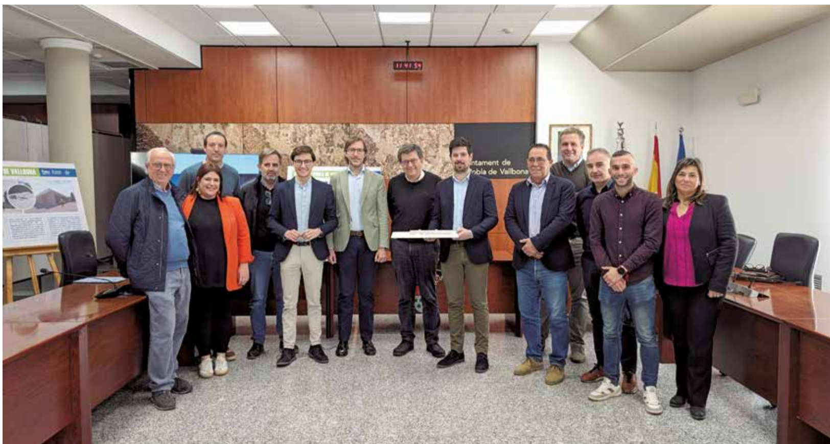
Visita del director general d'Infraestructures Educatives, José María Larena, a l'ajuntament de la Poble de Vallbona. / EPDA

■ EL NOU CENTRE, AMB CAPACITAT PER A MÉS DE 800 ALUMNES, COMPTA AMB UNA INVERSIÓ DE MÉS DE 14 MILIONS D'EUROS