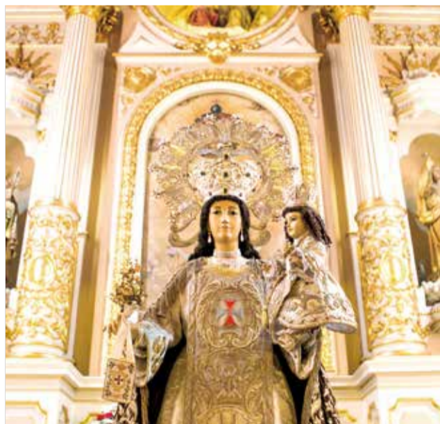
Camarín de la Virgen de la Iglesia del Remedio.