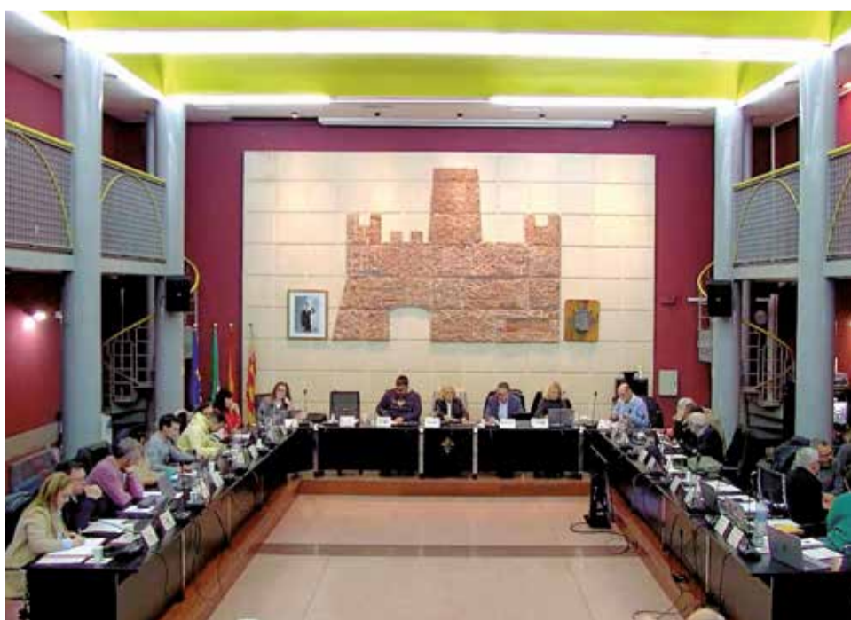
Pleno ordinario de enero del Ayuntamiento de Bétera.

Desde Compromís por Bétera han exigido responsabilidades y explicaciones por parte del equipo de gobierno, reclamando que situaciones como esta no se vuelven a repetir en el futuro. De momento, el ejecutivo local no ha emitido una respuesta de-