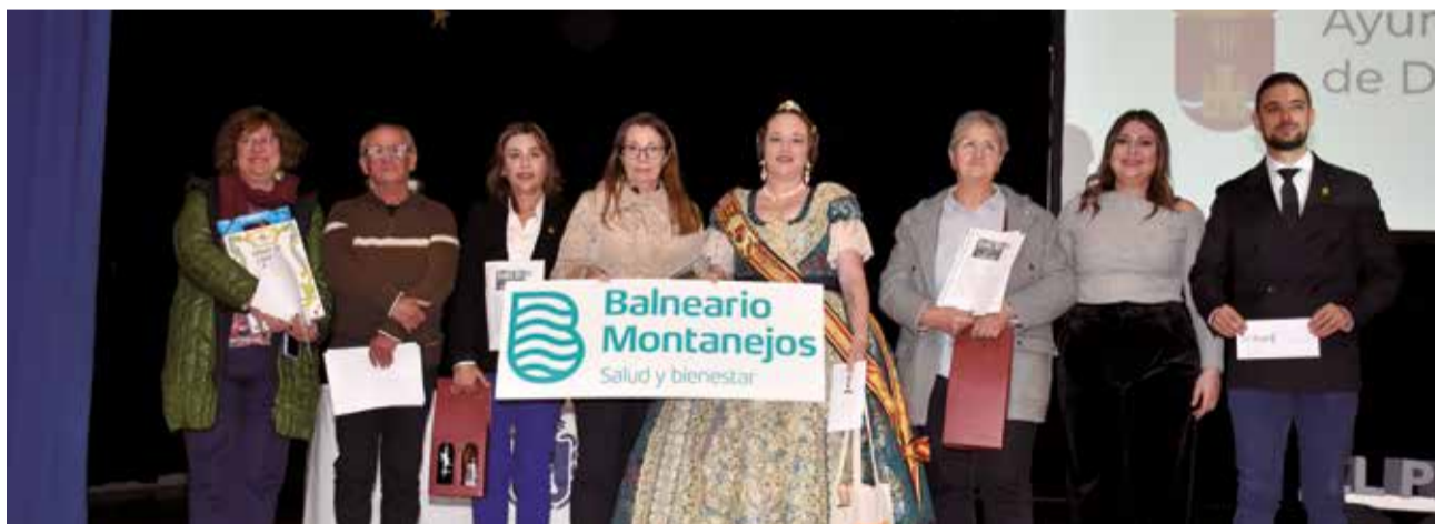
Guanyadors dels sortejos durant la gala d'entrega de premis.

Un Vi d'Honor va posar fi a una emotiva gala, en la qual tot el teixit de la comarca del Camp de Túria es va poder retrobar en una cita a les portes de les festes nadalengues.