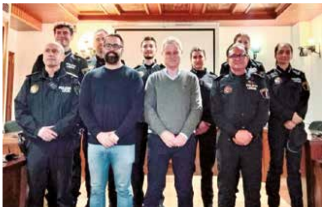
Presa de possessió dels nous policies locals.