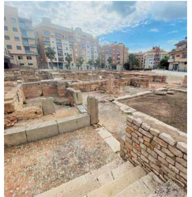
Termas romanas de Mura.

lidad de asistir a los conciertos, festivales y evento musicales que se celebran a lo largo de todo año en el municipio. Lliria, como Ciudad Creativa de la Música por la UNESCO, ofrece una potente y variada programación. No te puedes perder los festivales eMe (música antigua), El DesenJazz (jazz y música contemporánea) y el LLUM Fest (Lliria Universal Music), EdetArts, o el Concierto de las Bandas como referente de