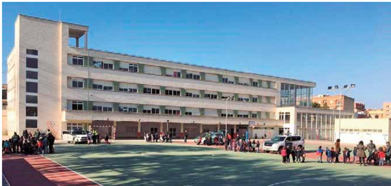
Centro de Educación Infantil y Primaria Horta Major de Vilamarxant.

Esta noticia llega tras la reunión que se produjo el pasado mes de octubre entre el ayuntamiento y la Dirección General de Infraestructuras Educativas. En este encuentro, el alcalde y la concejala de Educación ya pusieron en conocimiento de la Conselleria los problemas que los centros de Vilamarxant estaban experimentando y solicitaron que se estudiara la posibilidad para construir uno nuevo.