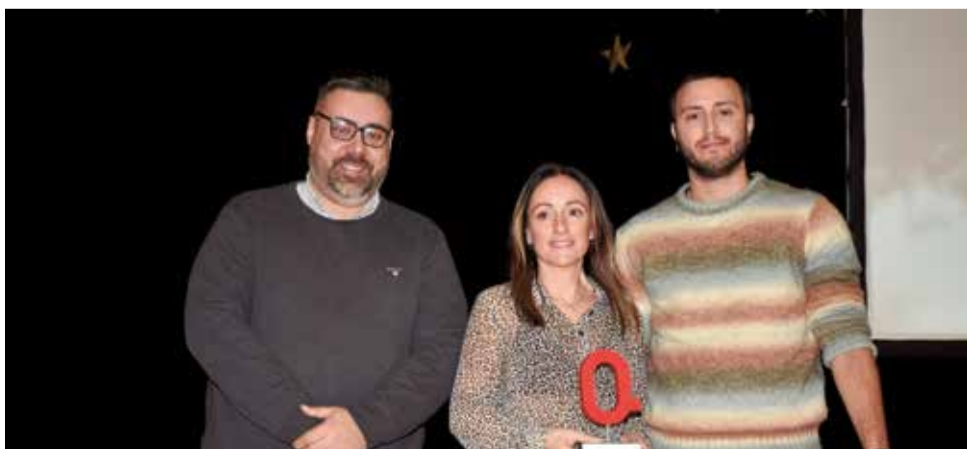
Premi Tradició per a l'Aljama de Bétera.