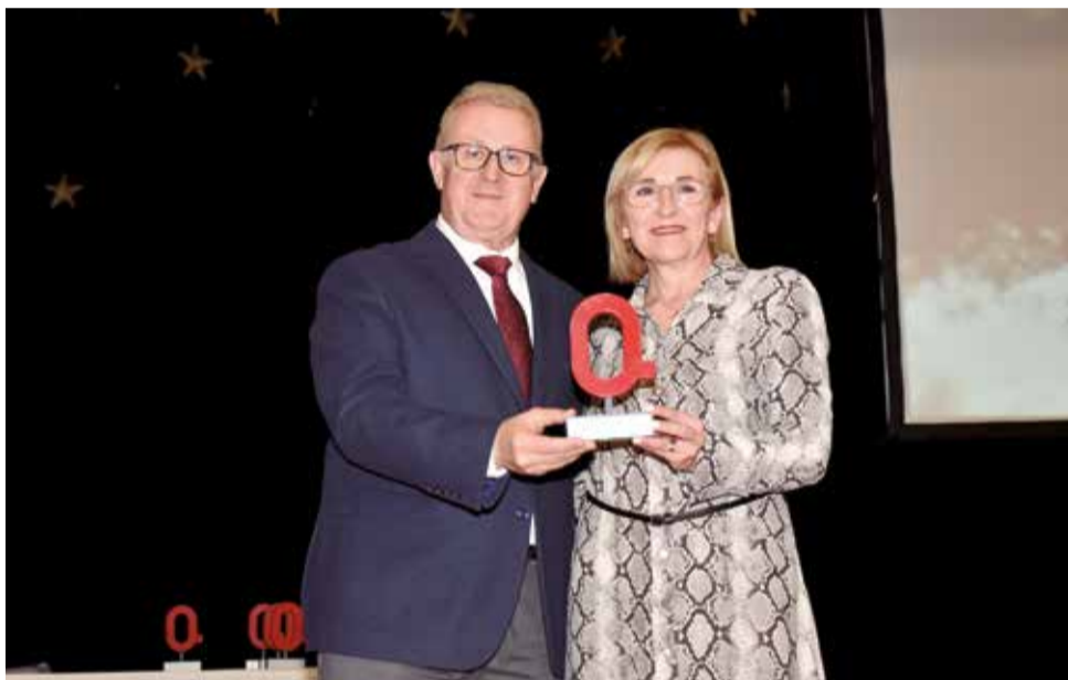
Premi Gastronomia a les Jornades de Serra.

Vilamarxant va rebre el guardó en la categoria Sostenibilitat pel projecte 'Vilamarxant a Europa', que forma part de la seua agenda urbana