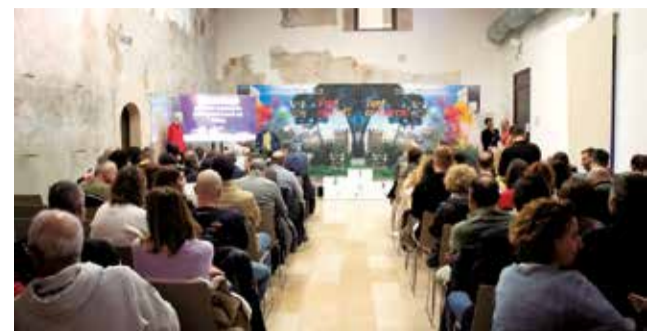
Presentació d'una edició anterior del circuit.