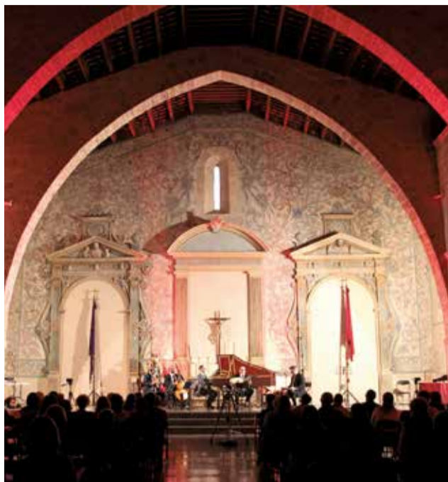
Festival eMe en la Iglesia de la Sangre.

El paseo por sus calles también permite contemplar la majestuosidad de la fachada