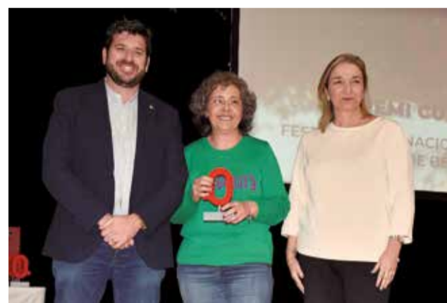
Premi Cultura al Festival de Música de Benissanó. / PG.