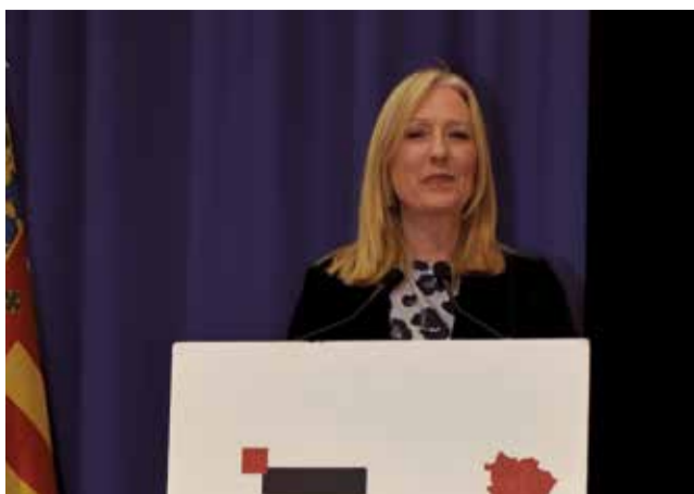
La presentadora, Sylvia Costa. / PG