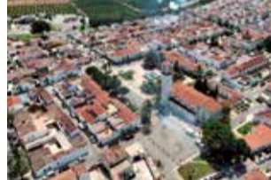
Vista de Marines.