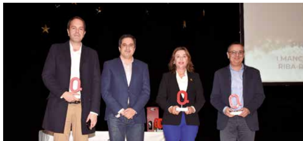
Premi Economia a la Mancomunitat Industrial A3. / P.G.