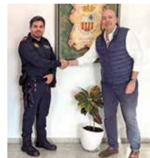
Bienvenida. / EPDA

Del mismo modo, desde la Concejalía de Policía Local se han realizado oposiciones al