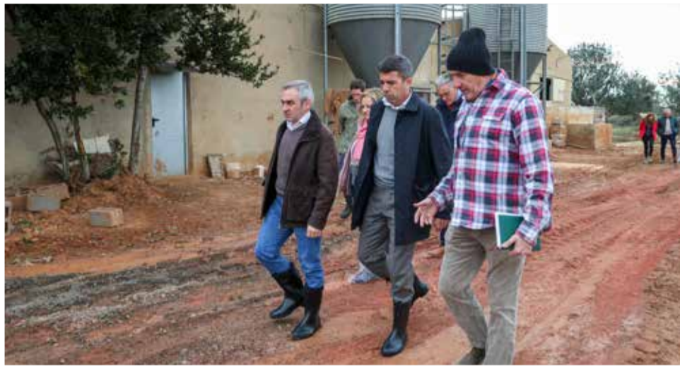
Un instante durante la visita a la explotación SAT Gaviga en Riba-roja.