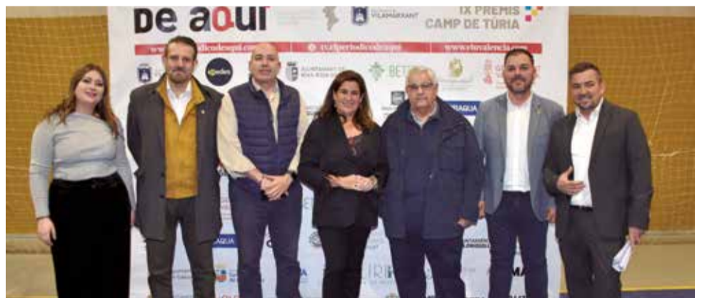
Diversos instants del 'photocall' dels IX Premis de El Periòdic de Aquí en el Camp de Túria.