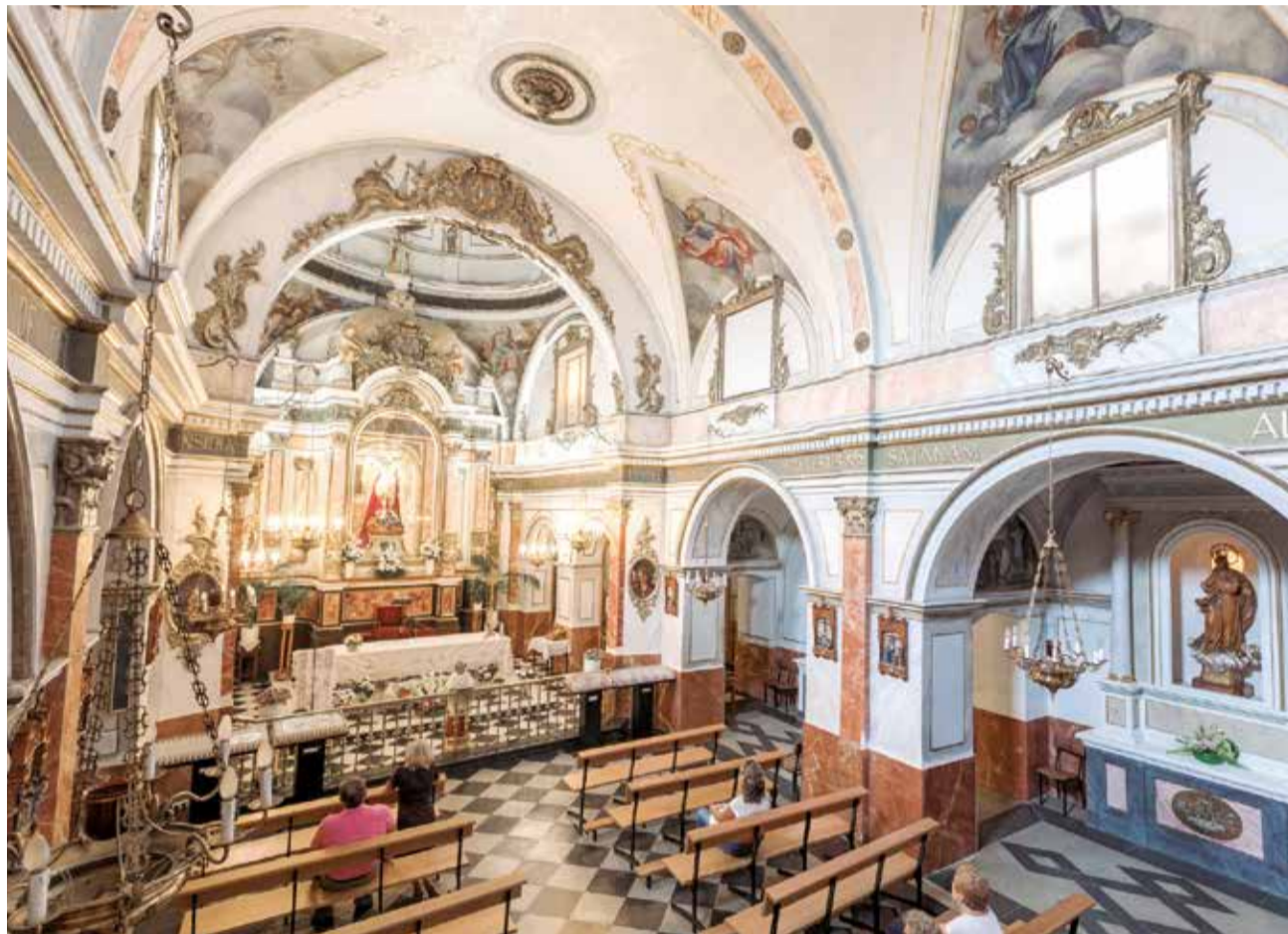
Interior del Monasterio de San Miguel de Lliria.

Otra intervención destacada es la restauración de la Iglesia de San Miguel Arcángel de El Collado, que incluye la fachada, el campanario y el antiguo reloj del templo de esta aldea de Alpuente. La Diputación aportará 166.000 euros para la realización de estos trabajos. Además, la restauración de la torre-campanario de la iglesia de San Miguel de Massalavés contará con otros 70.000 euros de financiación provincial, que en el primer año de las nuevas ayudas para patrimonio eclesiástico completa las solicitudes aprobadas en Benavites, donde el Arzobispado dispone de