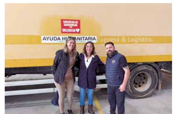
La alcaldesa recibe la ayuda de San Lúcar.

nal. Muchos voluntarios han trabajado sin descanso para ofrecer apoyo a los damnificados, demostrando que la solidaridad no entiende de distancias. Desde Loriguilla, este hermanamiento será una forma de agradecer y fortalecer una relación que nació en un momento difícil.