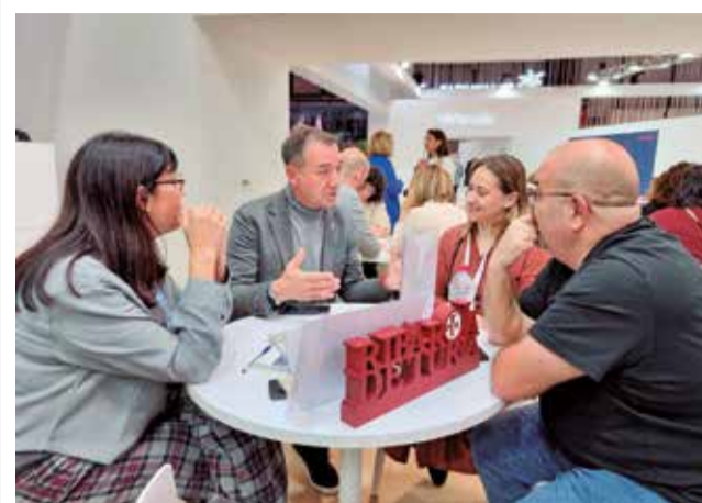
Un instante durante una reunión en Fitur.