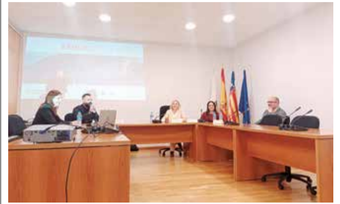
Un instant durant la presentació del pla. / EPDA