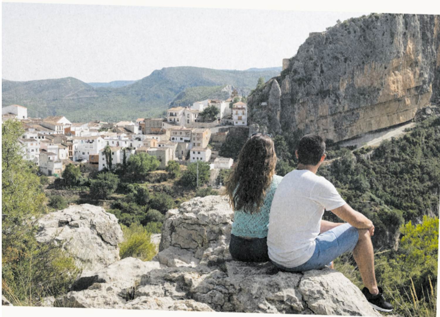
Pueblos del interior VALENCIA