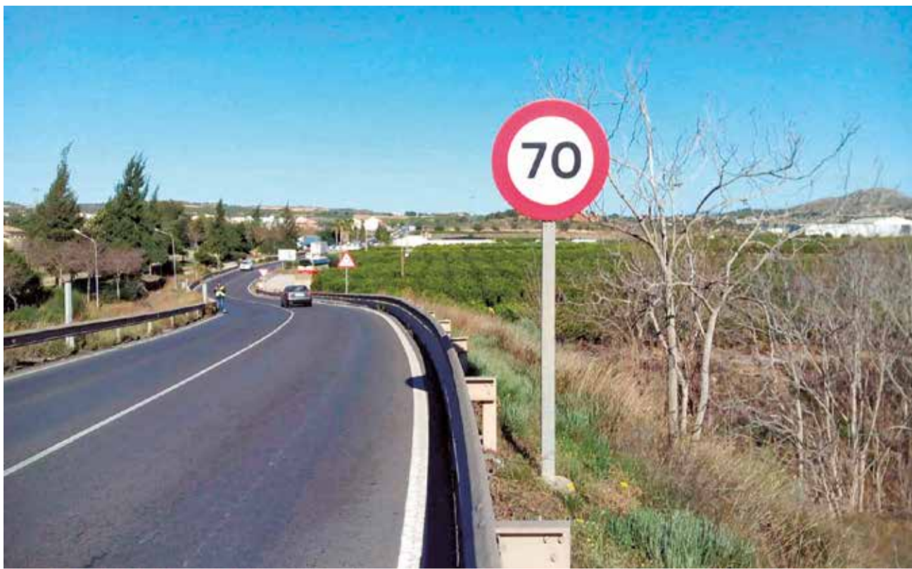
Carretera CV-374 entre el polígono y la urbanización la Reva y Loriguilla.