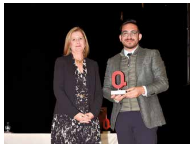
Premi Sostenibilitat per a Vilamarxant. / P.G.