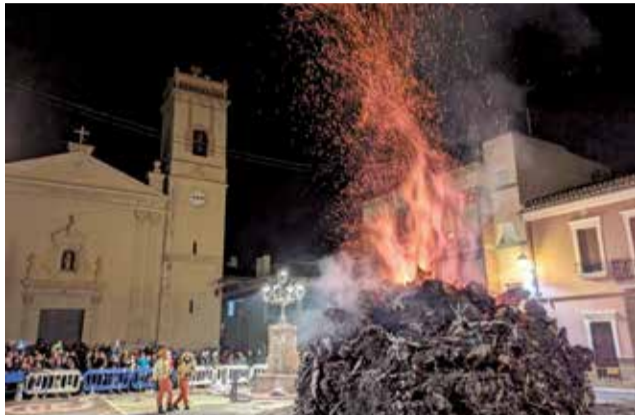
Foguera de Sant Antoni a Olocau.

A continuació, el Dinar de Germanor d'arròs amb fesols i naps al carrer Major va tor-