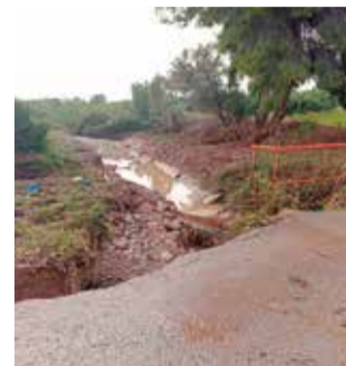
Estat actual del pont.

LES OBRES ARRANCARAN D'URGÈNCIA QUAN LA CONFEDERACIÓ DONE EL VISTIPLAU AL PROJECTE