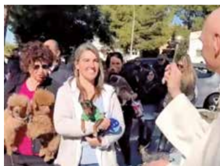
Actos de la festividad de San Antón en Loriguilla.