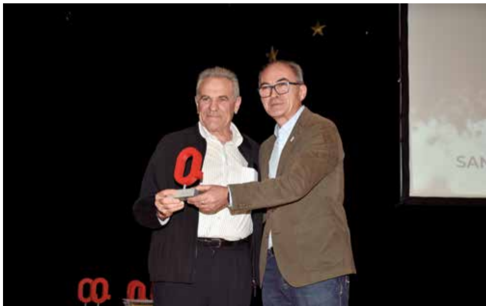
Premi Agricultura a la Cooperativa Rural Sant Vicent.