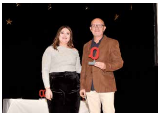
Premi Educació a la plataforma 'Institut Ara'. / PG.