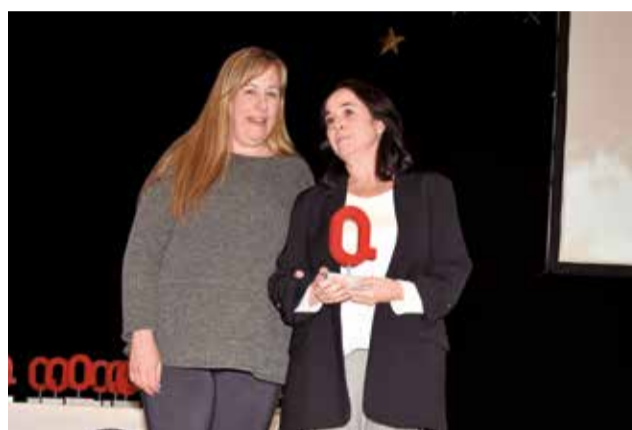
Premi Empresa a MBE Túria. / PG.