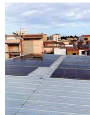
Plaques solars. / EPDA

En este projecte, s'han instal·lat un total de 128 mòduls fotovoltaïcs connectats a través de huit strings amb 16 panells. La instal·lació fotovoltaica abastirà d'energia elèctrica els edificis municipals de la Policia local, l'escoleta infantil, les pistes esportives del mateix recinte, el centre metge i l'ajuntament.