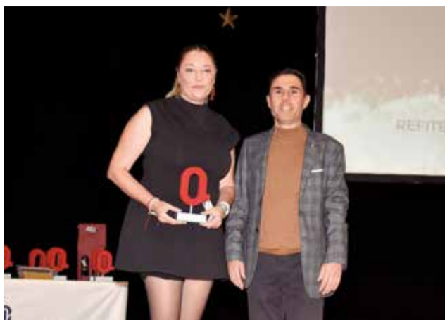
Premi Esports al Refitel Nadunet Bàsquet Lliria. / PG