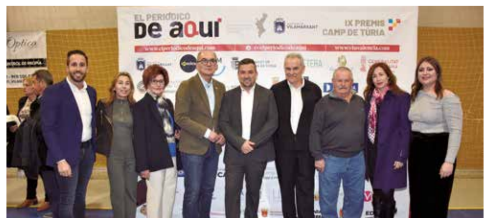
Diversos instants del 'photocall' dels IX Premis de El Periódico de Aquí en el Camp de Túria.