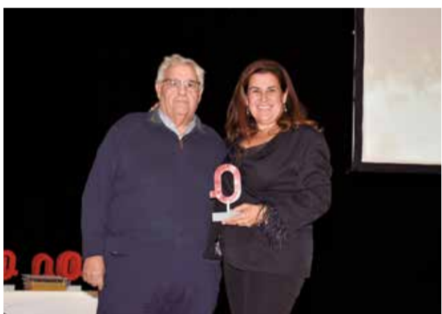
Premi Transparència a Sant Antoni de Benaixeve. / PG.