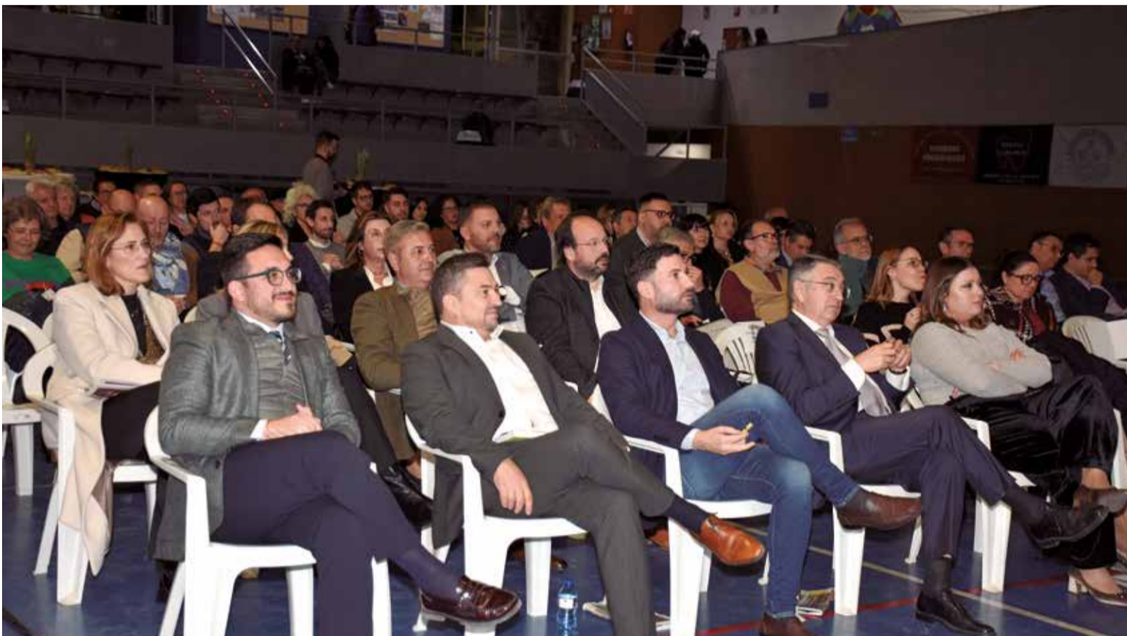
Autoritats i públic de la IX edició dels premis de El Periódico de Aquí en el Camp de Túria, celebrats a Vilamarxant.

EL PAVELLÓ MUNICIPAL DE VILAMARXANT VA ACOLLIR LA CITA, EN LA QUAL ES VA RETRE HOMENATGE ALS AFECTATS PER LA DANA DEL PASSAT MES D'OCTUBRE I ES VA FER ENTREGA D'UN TOTAL DE 17 GUARDONS EN 16 CATEGORIES