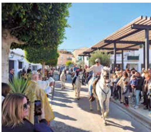
Actos de la festividad de San Antón en San Antonio de Benagéber.