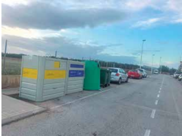
Isla de contenedores en Marines.

El Ayuntamiento de Marines continúa trabajando en su apuesta por el reciclaje, por eso, en estos momentos se están licitando los conte-