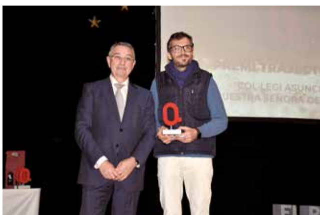
Premi Trajectòria al Col·legi Asunción de Ntra. Sra. / PG.