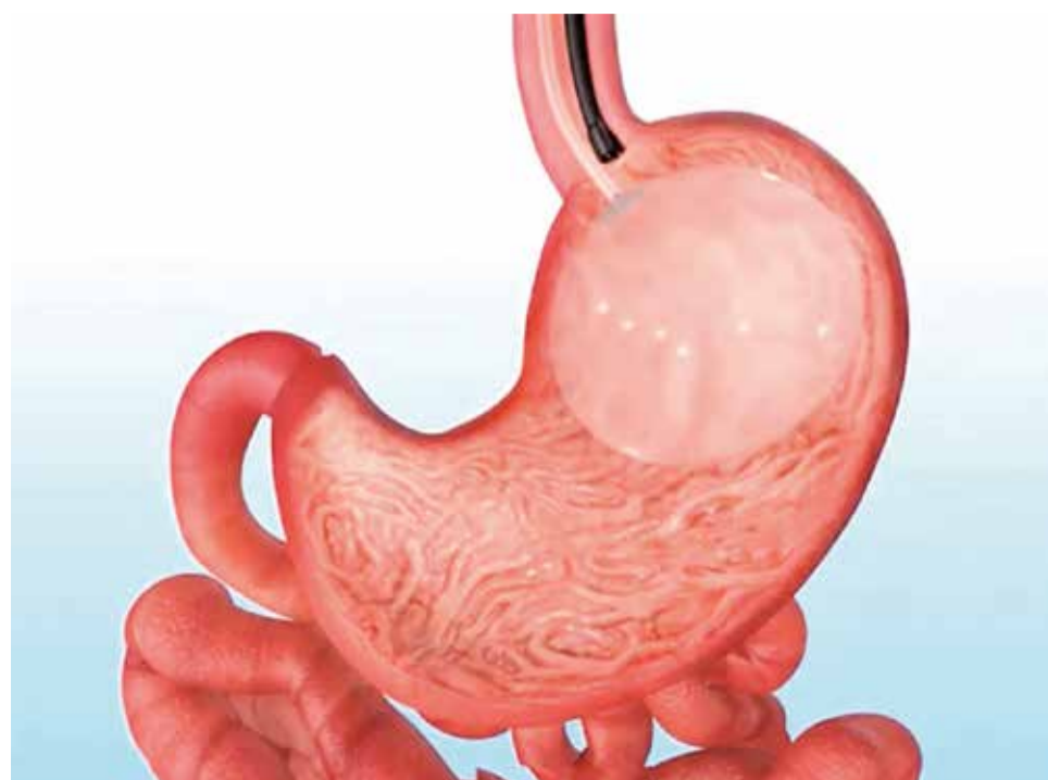
Balón intragástrico.

El Dr. Moreno explica que "el paciente debería de conti-