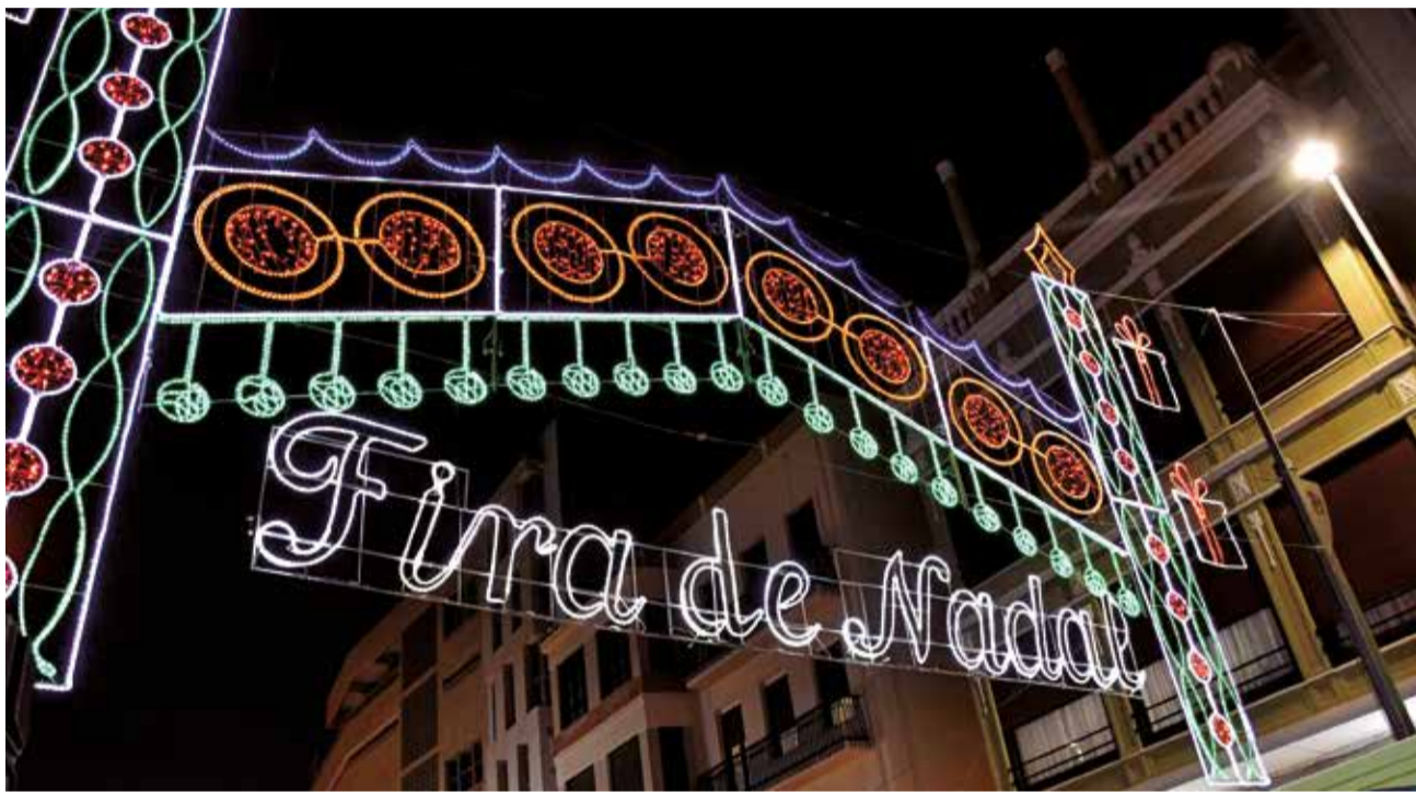
Llums de l'edició de la Fira de Nadal de Vila-real del 2023.