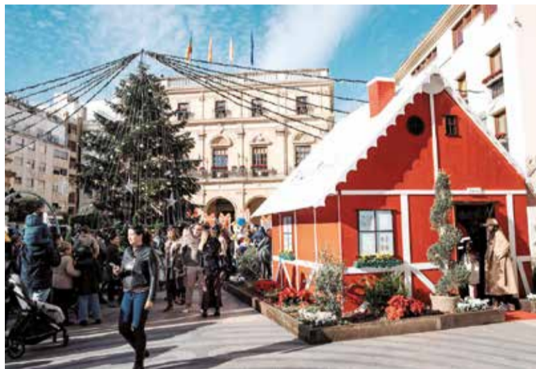
Mercat Nadalenc Artesà de Castelló de la Plana.

El Nadal no estaria complet sense els sabors típics de la regió. El torró de Xixona i Alacant és el rei indiscutible de les taules nadalencques, jun-