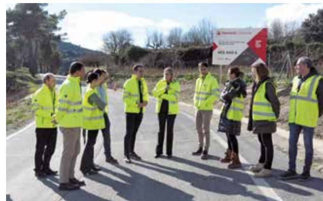
Visita a les obres de la CV-167.