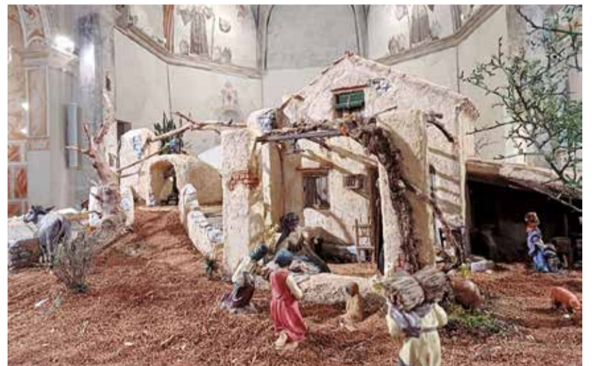
Pessebre de Benicarló de 2023 a la capella del Mucbe.

En la comarca de la Plana Baixa, la localitat de Vila-real s'ompli cada any d'esperit nadalenc amb la seua Fira de Nadal. L'avinguda de la Murà es convertirà en un gran espai d'oci nadalenc del 20 de desembre al 3 de gener i que tornarà a comptar amb pista de gel, atraccions i una variada oferta d'oci adreça-