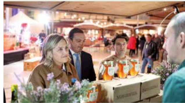
► La Diputació de Castelló enaltix el producte de proximitat i de qualitat que ofereix la V Fira de Nadal Castelló Ruta de Sabor instal·lada fins el passat 15 de desembre a la plaça de Les Aules, amb els millors sabors de la província de Castelló.