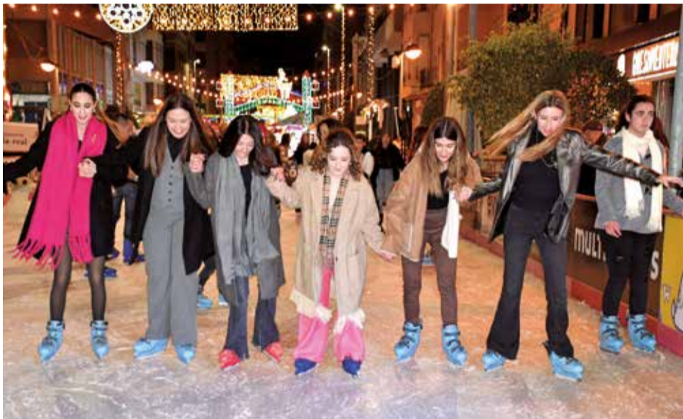
Pista de gel a la Fira de Nadal de Vila-real.

► MERCATS NADALENCs. Un dels primers indicis de l'arribada de Nadal són els mercats que florisquen en places i carrers.