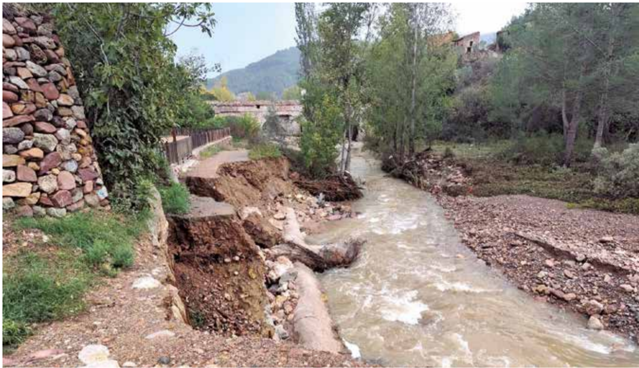
Desperfectes provocats per la DANA al municipi de Montanejos.