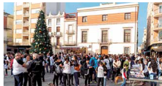
Activitats nadalencues a Nules.

nostre municipi no només entre el nostre veïnat també entre el d'altres poblacions pròximes".