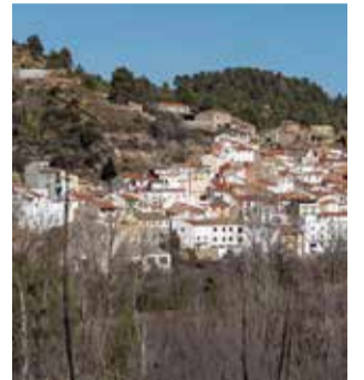
Vista de Teresa.

Este almacén, ubicado en la calle Era Colás número 5, será derribado en su totalidad