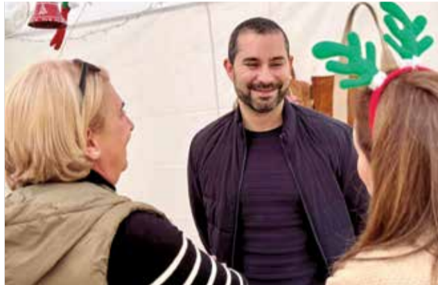
Fira de Nadal de l'Alcora./ EPDA

Orquestres i discomòbils amenitzaran la celebració de les dates més assenyalades, com la nit de sopars d'empresa, la Nit de Nadal, Cap d'Any i la Nit de Reis. Els més joves podran gaudir, a més, d'altres activitats inno-