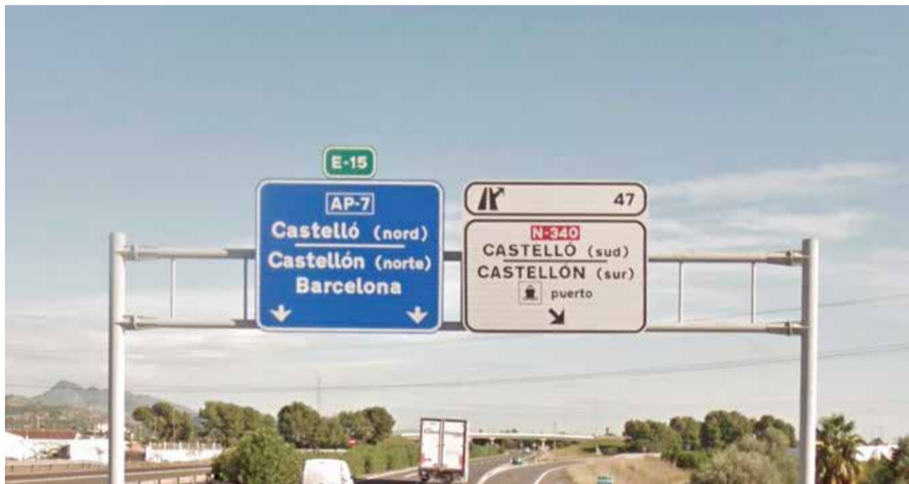
Cartel con el topónimo bilingüe de Castelló en una salida de la AP-7 en 2018.

La alcaldesa de Castelló de la Plana, Begoña Carrasco, ha valorado de forma muy positiva la aprobación.