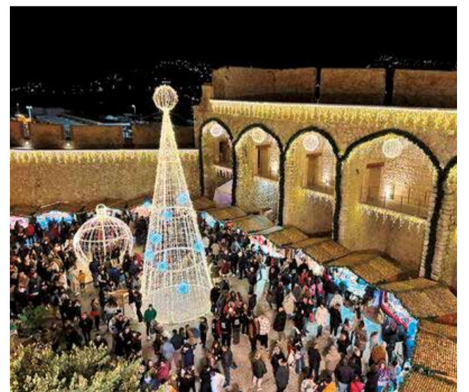
Mercat de Nadal de Peníscola.

La programació continua a Peníscola amb l'expectativa de continuar sostenint l'activitat econòmica durant les dates nadalencques, "període que podem considerar pràcticament ja com una altra Setmana Santa quant a activitat turística, en la nostra població", ha conclòs Simó.