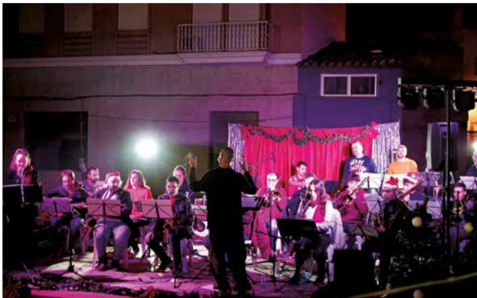
Actuació musical 'Albaes amb swing' de l'Alcora Secret Society.

La 'carrera ciclista del pavo' (14 de desembre) rendirà