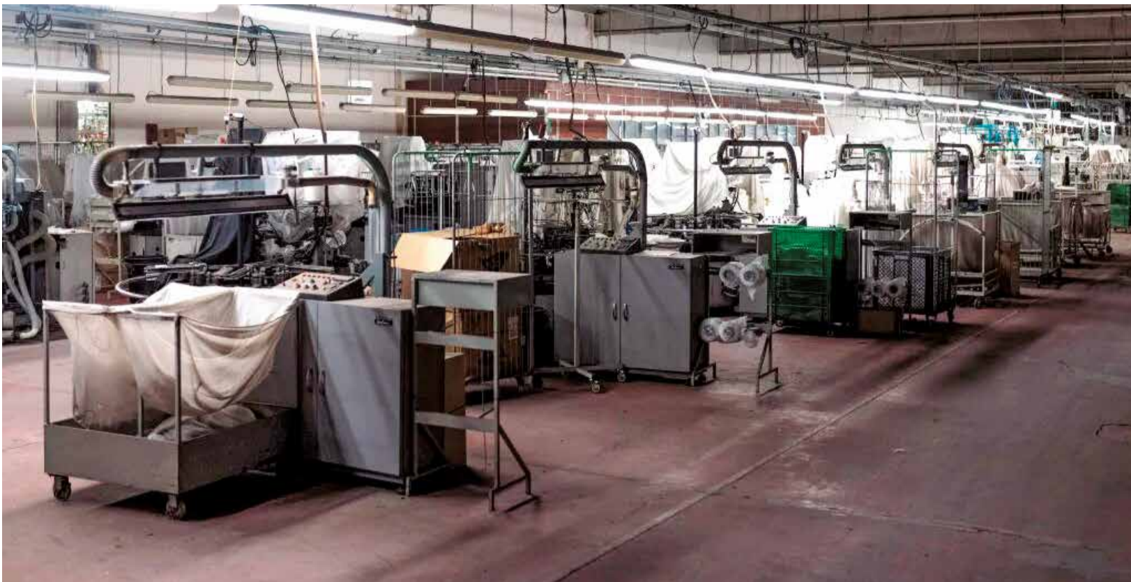
Instalaciones de la empresa textil Marie Claire.

LA VENTA FUE AUTORIZADA A FOR MEN SA EN AGOSTO POR 250.000 EUROS, QUE SE DEBERÍAN HABER ABONADO EL 1 DE OCTUBRE