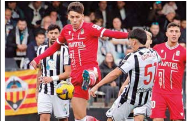
Un instante del partido contra el Cartagena.