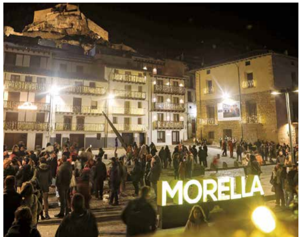
Encesa de llums a Morella.

A la comarca de l'Alcalatén, els diferents municipis que l'integren han organitzat activitats per a tots els públics. En la capital, la programació omplirà el municipi de llum, música i activitats pensades per a tots els públics, assegurant que ningú es quede sense disfrutar en estes dates tan especials. Com no podia ser d'una altra manera, els xiquets i xiquetes tindran un espai destacat dins de la programació, amb nombrosos actes pensats per a ells: unflables, tallers, musical, circ, cinema, lliurament de cartes al Pare Noel i als patges reials, etc. Tampoc faltarà la pista de gel, un espai que estarà disponible del 23 de desembre al 3 de gener a la plaça de l'Ajuntament per a grans i xicotets, oferint una activitat lúdica i diferent per a viure l'esperit nadalenc.