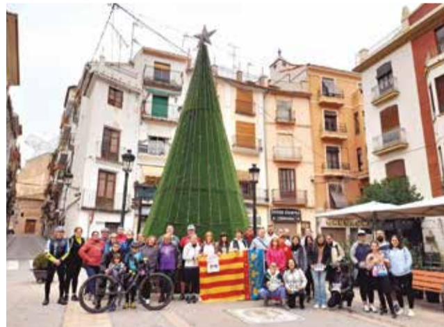
Los participantes tras la prueba.

La marcha, que se ha convertido en una cita anual de gran relevancia, ha contado con la participación activa de vecinos y visitantes de todas las edades, quienes han demostrado su compromiso con