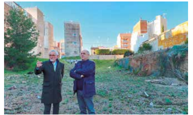
Visita al solar.