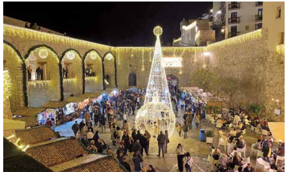
Encesa de llums i mercat de Nadal a Peníscola.

da sobretot als més xicotets. L'objectiu és que esta iniciativa contribuísca també a donar més vida al comerç i per això els establiments adherits a la Unió de Comerç de Vila-real (Ucovi) comptaran amb 1.500 tiquets de la fira, que repartiran entre els seus clients. La cita tindrà també un escenari enfront de l'Auditori per a les actuacions de música i teatre, així com per als tallers i altres activitats. Tots els dies hi haurà programació en diferents horaris i la fira conclourà el 3 de gener per a reobrir de nou l'avinguda de la Murà per al pas de la Cavalcada de Reis, una cita imprescindible també del Nadal a Vila-real.