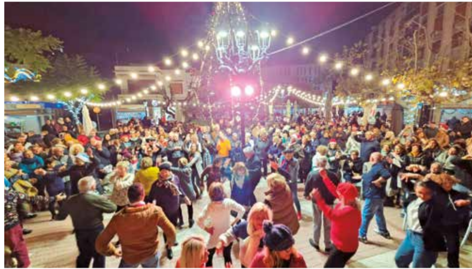
Mercado navideño de Oropesa del Mar.

El municipio oropesino también contará con el concierto del grupo local L'Antina en la Parroquia San Jaime tras la misa del domingo 22 de diciembre y con una Zambomba Navideña, en el Espai Cultural, a cargo de la Asociación local La Posada de Avelino, el sá-