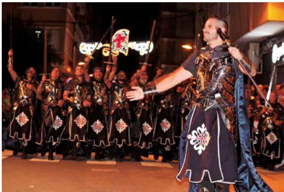
Diversos instants de la Gran Entrada de Moros i Cristians de Sagunt.