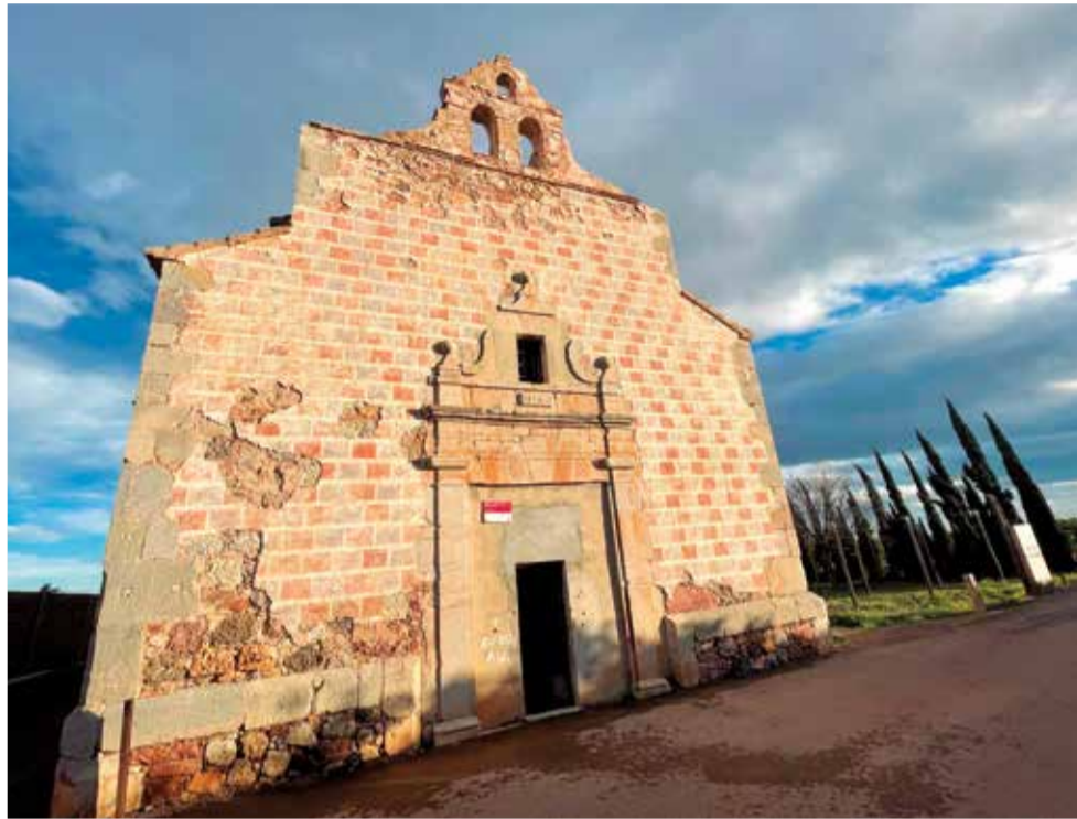
Façana de l'ermita de Benicalaf (Benavites).