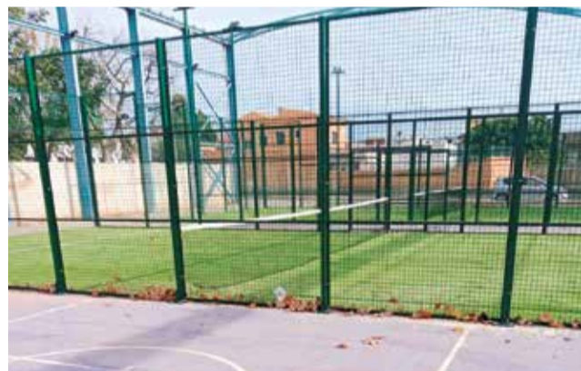
Pistes de pàdel de Benavites.