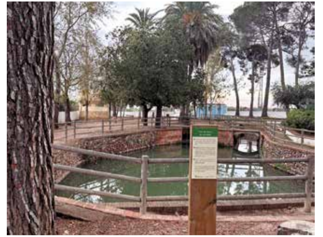
Cartelleria en la Font de Quart.