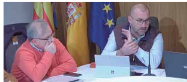
El PP de Faura presenta la proposta.

La proposta demana que tots els municipis tinguin accés a ajudes estatals