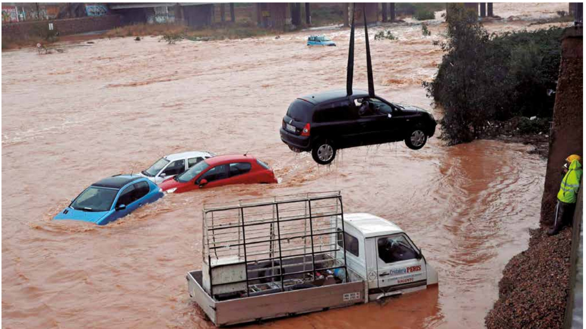
Crescoda del riu Palància durant un episodi de pluges torrencials fa dos anys, quan es va desbordar en alguns trams del Port de Sagunt.

EL PLE MUNICIPAL APROVA UN PLA INTEGRAL PER A PREVINDRE INUNDACIONS AMB LIMITACIONS URBANÍSTIQUES I ESTUDIS HIDROGRÀFICS