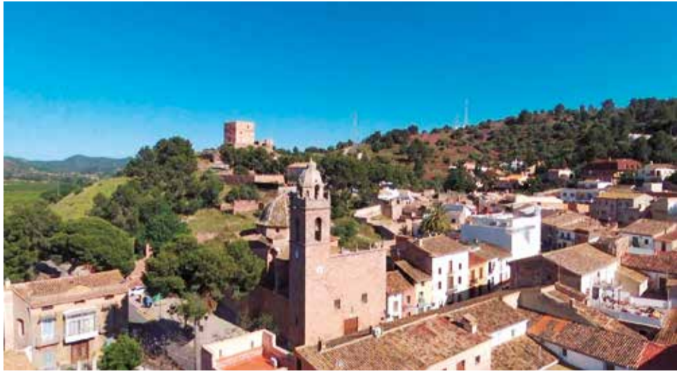
Vista del municipi de Torres Torres.