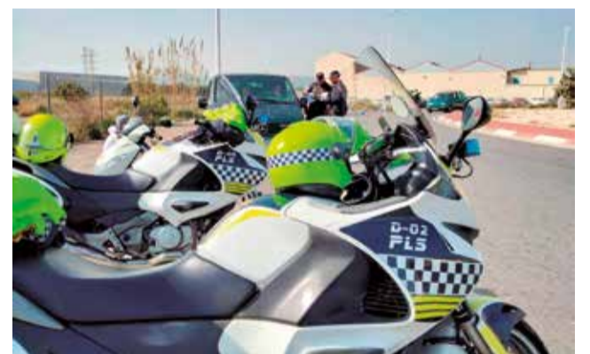
Un control de la Policia Local a Sagunt.

L'assegurança obligatòria d'automòbils és un requisit exigit legalment pel Reial Decret Legislatiu 8/2004 i inclou les cobertures bàsiques que permeten al propietari del vehicle desplaçar-se amb el seu vehicle, cobrint exclusivament els danys causats a tercers en cas de sinistre. Este és el més elemental i econòmic, encara que també és el que menys cobertures contempla.