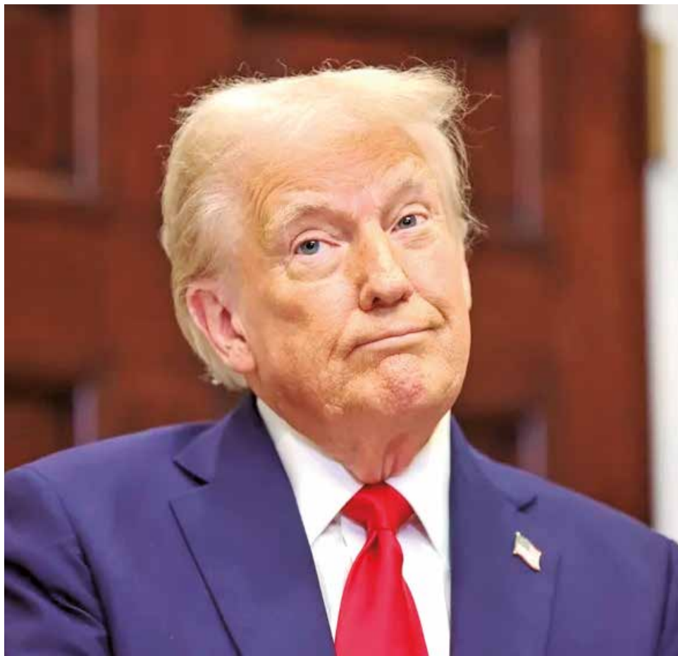
El president dels Estats Units, Donald Trump.

D'altra banda, Gonvarri, un centre de servei d'acer que realitza tractaments superficials i corts de bobines, també es veuria impactada, ja que molts dels seus processos depenen de la importació de materials que podrien encarir-se amb les noves tarifes. A més, Thyssenkrupp Galmed, que produïx productes de ferro i acer mitjançant el tracta-