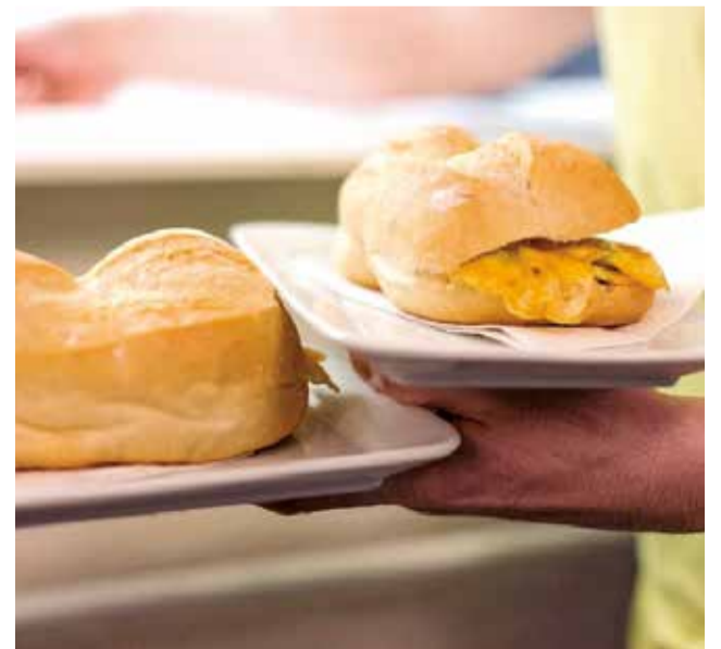
Pataqueta del Dijous de Berenar.

La moció aprovada inclou el compromís de promoure i donar suport a activitats que fomenten la preservació i difusió dels Dijous de Berenar, així com instar les autoritats competents a garantir els recursos necessaris per assegurar-ne la continuïtat.