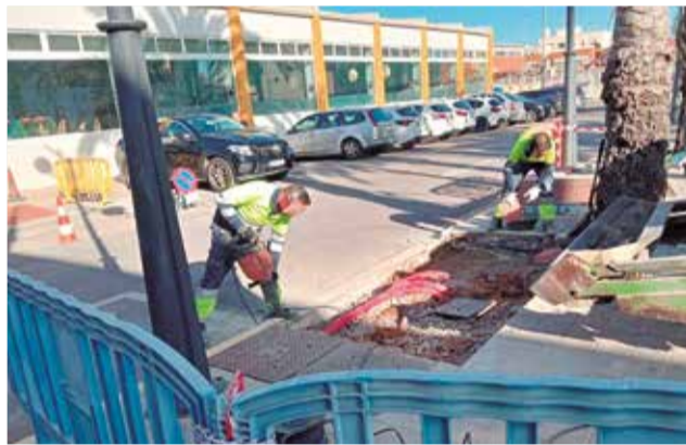
Operaris ultimant les actuacions.

avançades. La seua importància radica en el fet que faciliten, no sols, l'accés al consistori, sinó també a la piscina municipal.