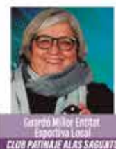
Guardó Millor Entitat Esportiva Local CLUB PATINAJE ALAS SAGUNTO