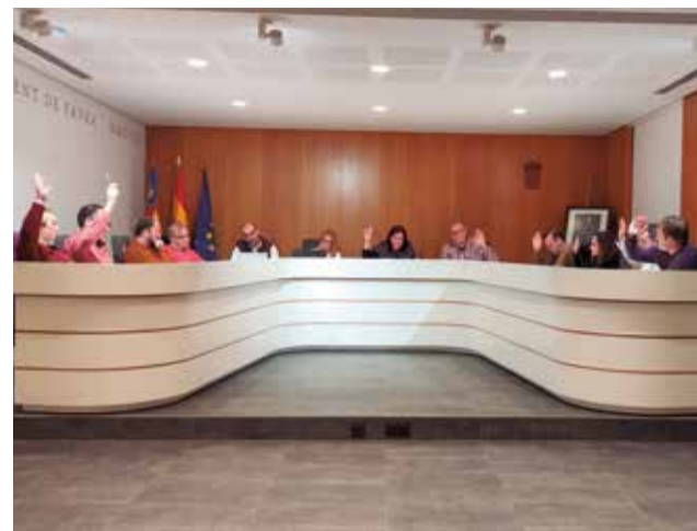
Ple de l'Ajuntament de Faura, en votació.