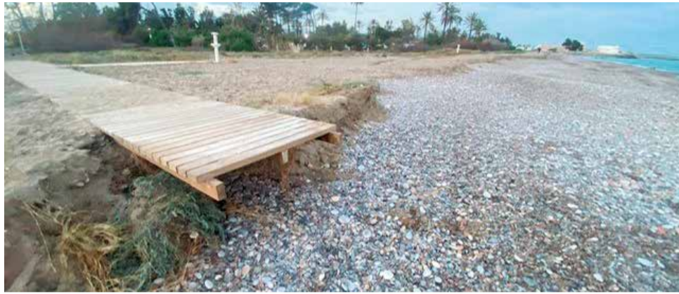
Escalón en una playa de Morvedre.

Los vecinos han denunciado que las playas del norte de Sagunt y Canet d'en Berenguer están expuestas a inundaciones desde dos frentes: los temporales marítimos y las lluvias torrenciales. La falta de protección costera debido a intervenciones previas de Costas ha agravado la situación, dejándolos indefensos ante la fuerza del mar. Además, expresan, la posible instalación de huertos solares en Montíber “podría incrementar el riesgo de inundaciones