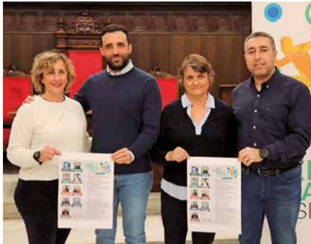
Presentació de la programació. / EPDA

El diumenge 16, a les 12 hores es realitzarà una jornada de visibilització anomenada 'En guàrdia: estratègia i elegància en l'art de l'esgrima', a càrrec del Club Esgrima Morvedre al gimnàs del Poliesportiu Municipal (internuclis). El dia 17, a