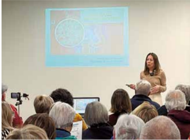
Un instant de la xarrada.

Durant la xarrada, l'experta va compartir recomanacions