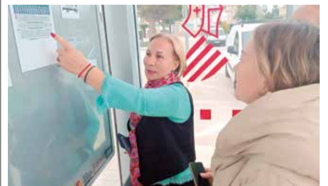
La regidora explica els horaris a una veïna.

Pel que fa a la línia C2, el servei és més freqüent, però els horaris no estan adaptats a les necessitats reals. Un exemple clar és el cas dels estudiants de Batxillerat que es desplacen fins a l'institut del Port de Sagunt. "L'autobús passa a les 8.50 h i les classes comencen a les 9.00 h", explica la regidora.