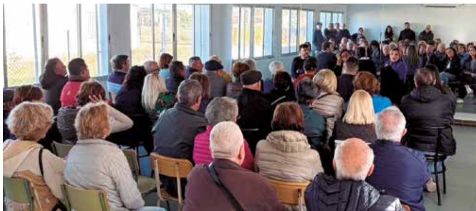
Última reunión vecinal.

al impermeabilizar grandes superficies de terreno, impidiendo la filtración del agua y redirigiéndola hacia zonas habitadas”.