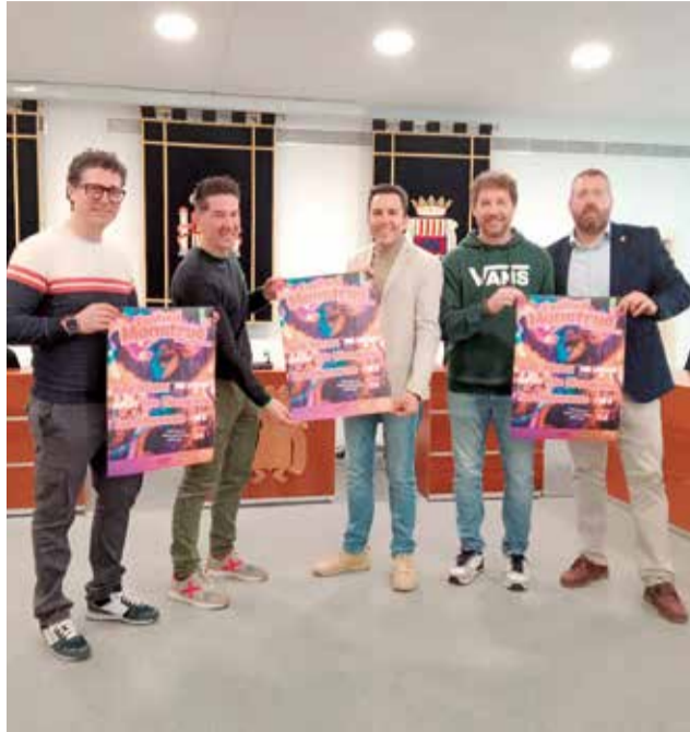
Presentació del 'Festival Monstruo' i imatge d'arxiu del Canet Remember Fest