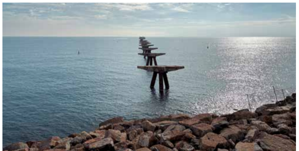
El Pantalán del Port de Sagunt.

Desde Iniciativa Porteña han dejado claro que no cesarán en su lucha para que la rehabilitación del Pantalán se lleve a cabo en su totalidad, con la inclusión del tramo de 300 metros que lo convertiría en un atractivo singular para el litoral español.