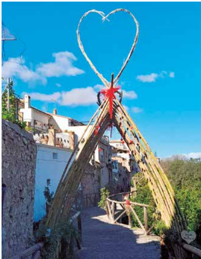
La 'Ruta de l'Amor' d'Algar de Palància.