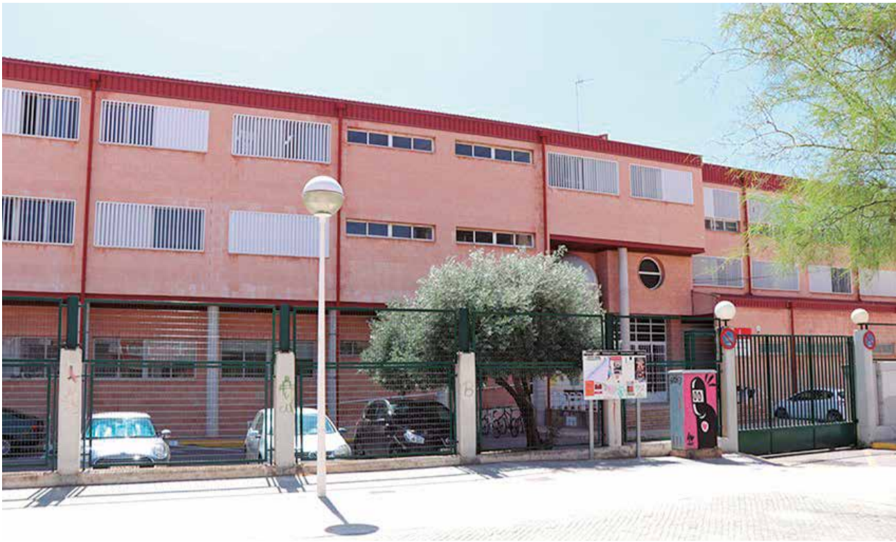
IES Maria Moliner del Port de Sagunt.