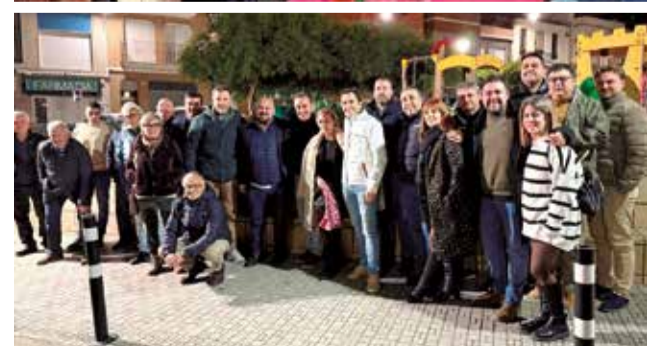
Trobada de Raga a Gilet. / EPDA