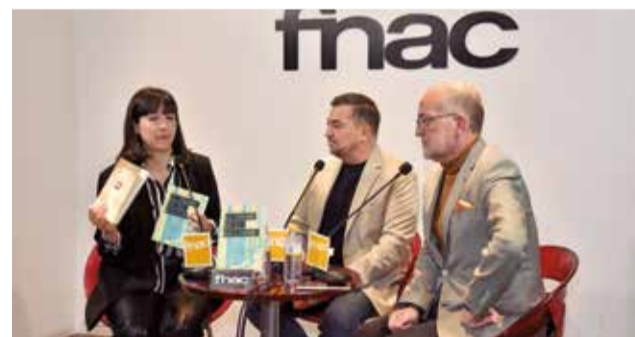
Reciente presentación en la FNAC.

da será libre y al finalizar el autor firmará ejemplares de esta obra. La misma podrá adquirirse allí por un precio de 16.90 euros.