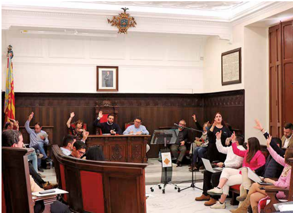
Ple de l'Ajuntament de Sagunt.

Vila va assegurar que les mocions aprovades sovint