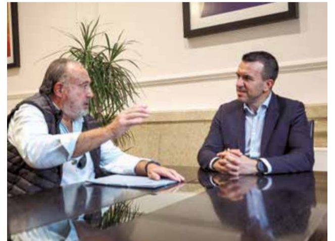
L'alcalde amb el president de la Diputació.

La depuradora d'El Tochar és una de les principals obres que l'Ajuntament de Torres Torres finançarà amb els prop de 800.000 euros assignats al municipi dins del Pla Obert de la Diputació, un programa d'inversions que permet als ajuntaments planificar i executar projectes sense la pressió de terminis ajustats. "Amb la renovació de l'enllumenat ja en marxa, desinarem la resta del Pla Obert