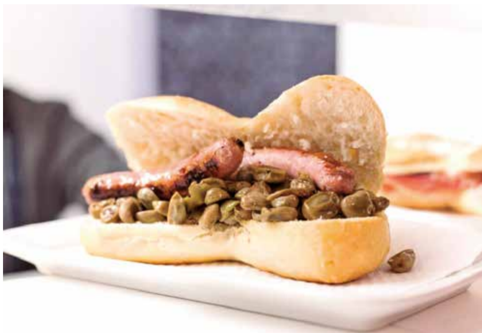
Dos pataquetes típiques dels 'Dijous de Berenar'.