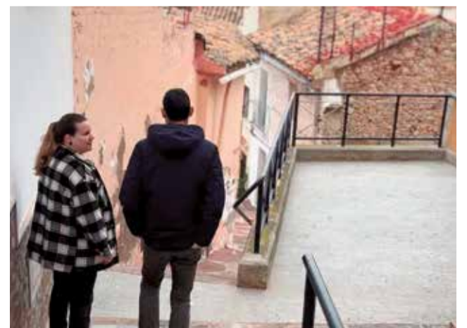
El portaveu del PP i la presidenta.