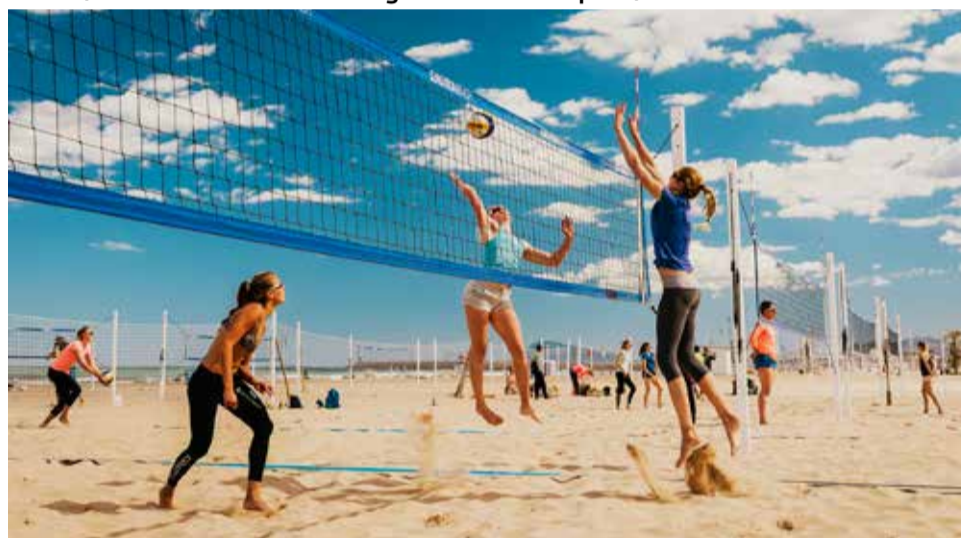
Voleibol a la platja de Gandia.

El Club Voleibol Gandia, fundat en 1996, ha sigut un pilar fonamental per a consolidar esta pràctica a la comarca. Amb equips que competixen en diverses categories i tornejos, el club fomenta la participació i el desenvolupament de talents locals, a més de promoure la pràctica del voleibol com una activitat recreativa accessible per a tots. Així, Gandia es reafirma com un destí que combina esport, naturalesa i qualitat de vida, fins i tot en els mesos més freds.