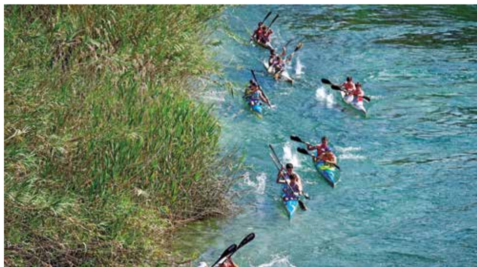
Piragüisme pel riu Xúquer.