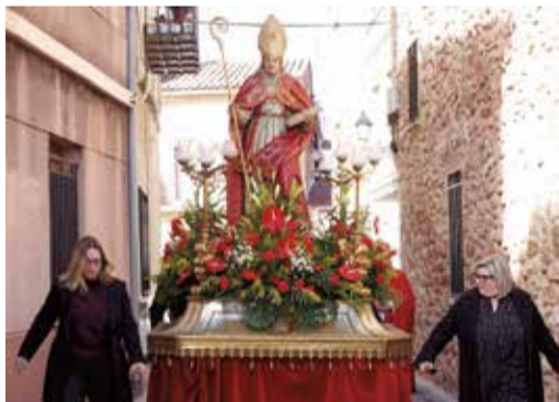
Sant Blai a Estivella.

En el seu moment, vaig descobrir en l'arxiu municipal un llibre de comptes de 1726 de Josep Blasco, quan era alcalde Joan B. Obrer (Economia i Hisenda, caixa 24, document 14). Allí es diu que es va pagar per "las festividades de los señores San Juan y San Blas... que este comun haze todos los años según costumbre memorial". La pista és un referent cabdal. És a dir, l'any que ve en farà tres segles, encara que sabem que quasi segur que es festejaria ja a partir de 1675, quan es va beneir el temple. La seua capella s'acabaria també abans de 1740, data en la qual les obres en l'interior de l'església quedaren enllestides.