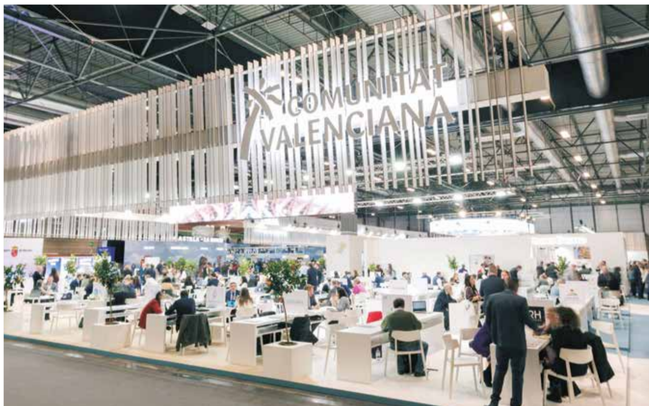
L'estand general de la Comunitat Valenciana en la Fira Internacional de Turisme.

Un dels moments més aclamats va ser el showcooking del restaurant Le Fou, dirigit