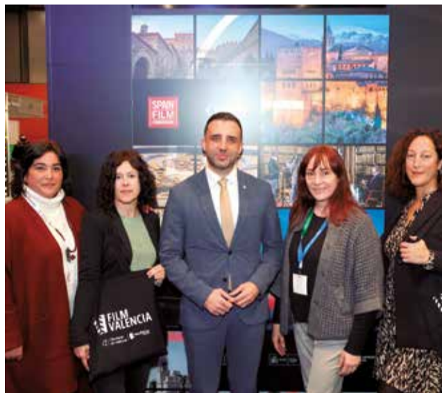
Sagunt Film Office. / EPDA