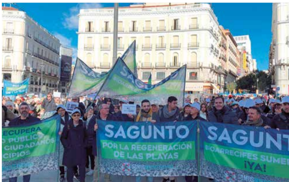
Escalón generado por el último temporal (sup.) y manifestación en Madrid (inf.)

nos. Además, la ausencia de un plan de protección costera integral, que aborde de manera global la seguridad y sostenibilidad del litoral, ha sido una de las principales críticas de la comunidad. La Asociación Vecinal exige, por tanto, que se aceleren los trámites administrativos y se destinen los recursos necesarios para proteger de forma efectiva estas playas.