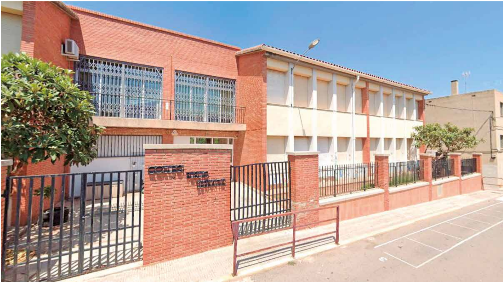
Col·legi públic l'Ermita de Benifairó de les Valls.