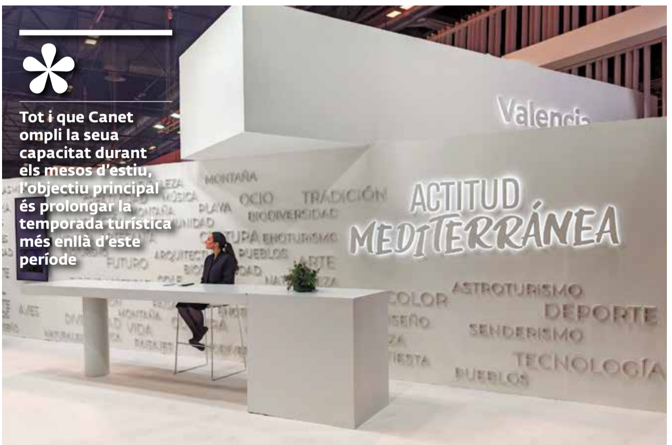
Mostrador d'informació dels municipis de la Comunitat Valenciana.

pòsit de tempestes que ajudarà a evitar inundacions i reutilitzarà l'aigua per al regadiu. “Espanya s'està secant, i des de Canet volem aportar el nostre gra d'arena per a gestionar millor els recursos hídrics i demostrar que es pot fer”, va concloure.