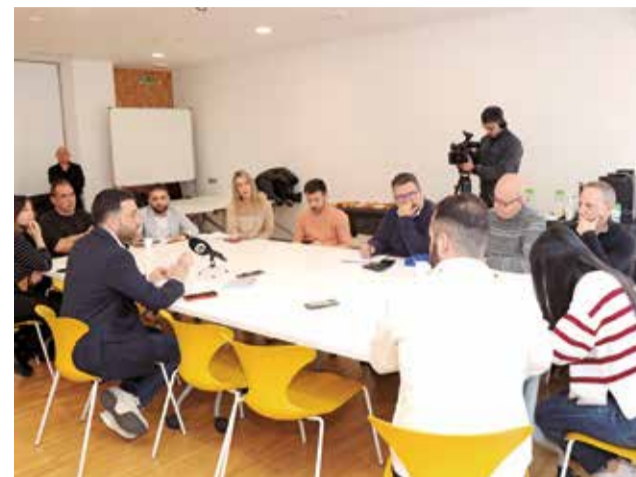
Reunió amb periodistes on es va anunciar.

El procés per aconseguir este estatus inclou una aprovació autonòmica i una decisió final del Govern d'Espanya. Segons More-