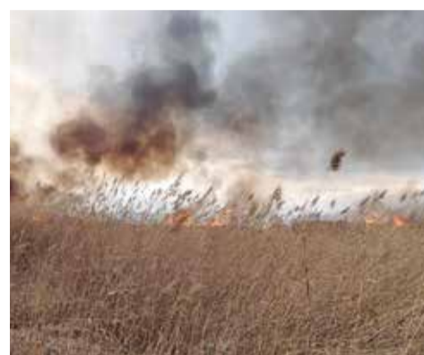
Diversos instants de l'extinció de l'incendi en la Marjal dels Moros.