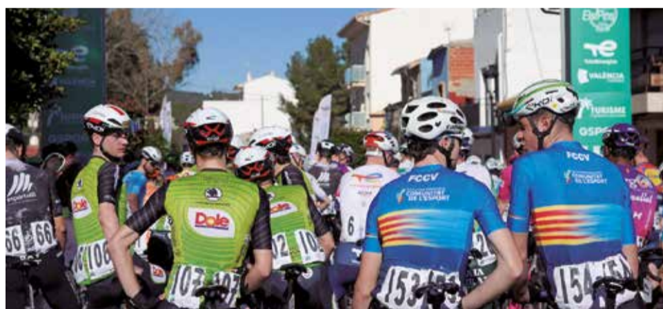
Diversos instants del dia de la carrera. / EPDA