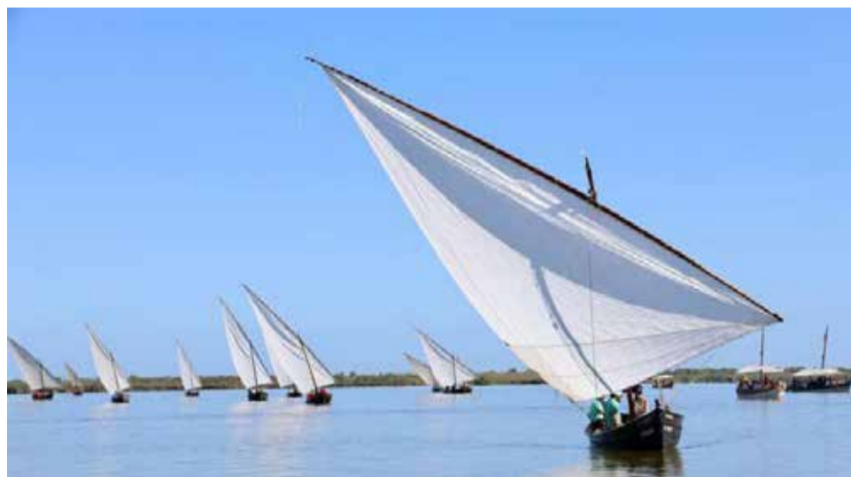
Vela llatina a l'Albufera.