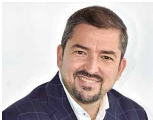
L'autor del llibre.

El llibre ja està a la venda a Amazon i a través de NPQ Edi-