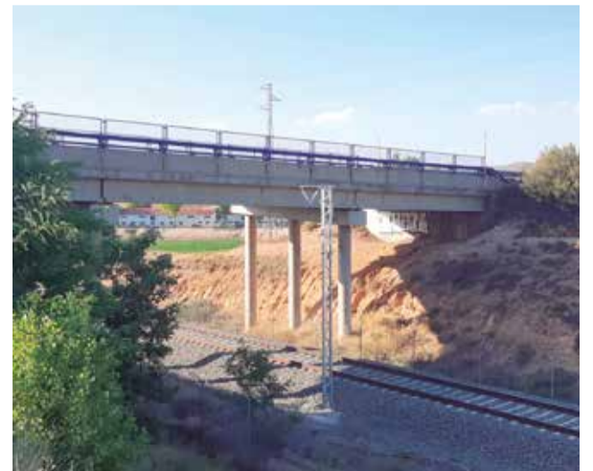
Un tram de la línia.

La modificació dels horaris habituals i les noves parades adaptades per als autobusos seran comunicades als viatgers a través de cartells informatius.