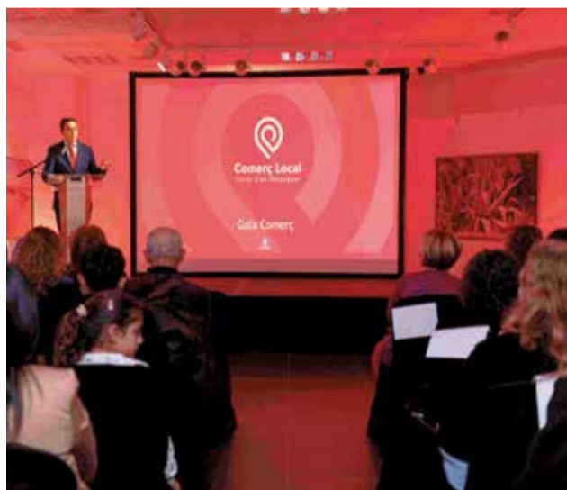
L'alcalde intervé en la Gala del Comerç Local.