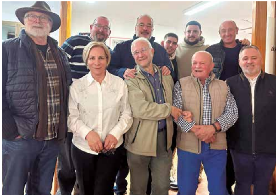
Reunió de la regidora amb membres d'AVA-ASAJA i regants.

Segons va assenyalar la regidora, "l'Ajuntament mai ha donat l'esquena a l'agricultura, però és cert que el sector ha anat perdent pes en l'economia local, un fenomen que no és exclusiu de Canet