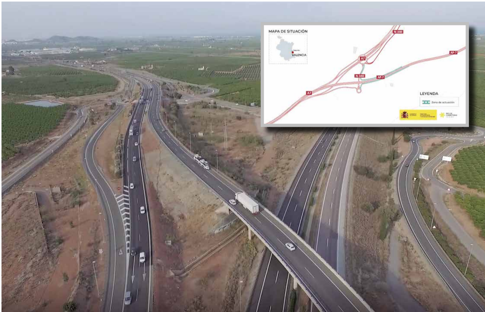
Vista aèria de la connexió actual i el projecte aprovat pel Ministeri de Transports.

EL PROJECTE SUPOSARÀ UNA INVERSIÓ DE QUASI 2,5 MILIONS D'EUROS I INCLOU LA CREACIÓ DE DOS NOUS RAMALS