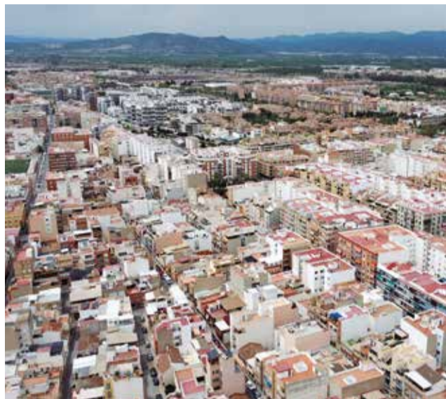
Vista del Port de Sagunt.

A partir d'aquest 2025, s'aplicarà un recàrrec d'IBI a aquells grans tenidors que no posen els seus pisos al mercat, per evitar l'especulació immobiliària. A