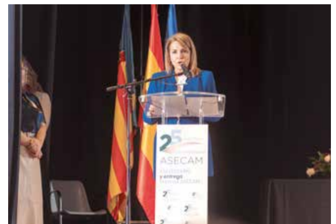
Varios instantes del evento.

tuaria de Valencia, ESEI Servicios Informáticos, ENCAMINA, Oleo-Hidráulica LEJ, Profiltek, Saggas, Transportes y Excavaciones Pérez Plumed, ASCOSA - AVA Sagunt, Caixa Popular, Unión de Mutuas y Digital Inter-fax.