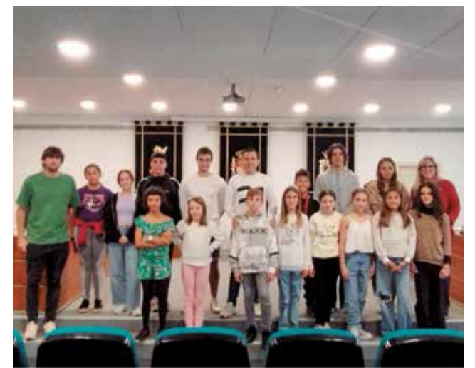
Membres del Consell amb l'alcalde i el regidor.

Després d'un procés de selecció, ja s'han elegit els 15 primers membres del CLIA, que en les seues primeres reunions han posat sobre la taula preocupacions com la il·luminació, la neteja del municipi i l'estat de les fonts. En els pròxims dies es reuniran amb els responsables municipals per traslladar-los les seues propostes i també col·laboraran en el disseny de la Cavalcada de Reis de 2026.