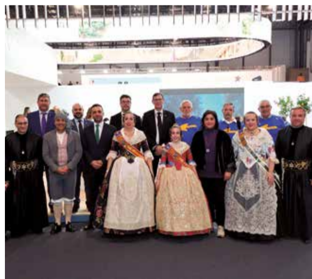
Representants de les festes de Sagunt a Fitur.