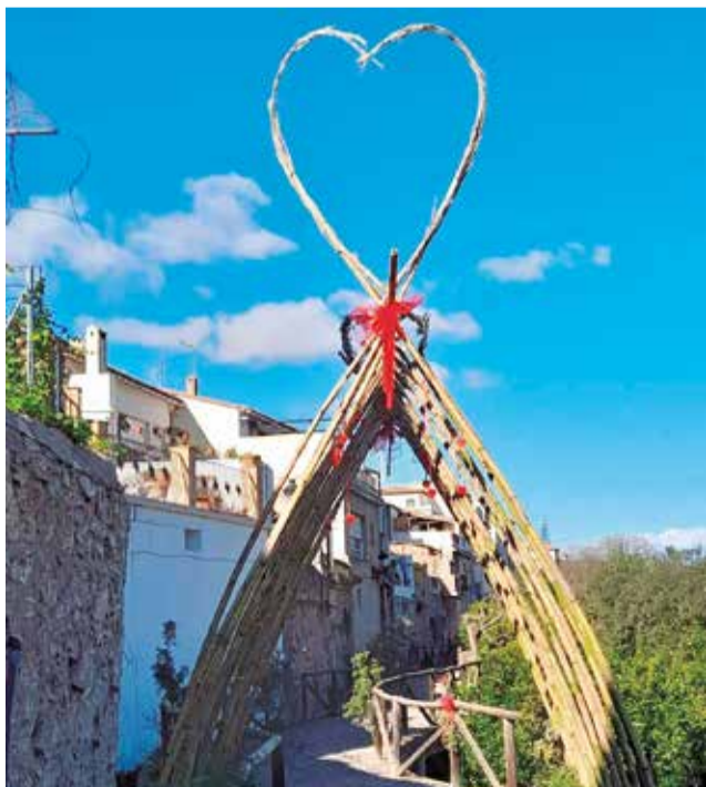
El Paseo del Amor de Algar.