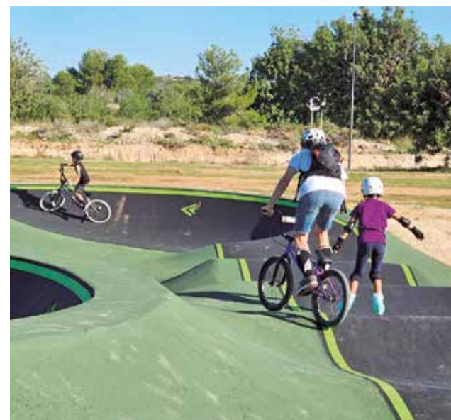
Piragüisme al riu Xúquer.

piragüisme i caiac. Localitats com Alzira, Sueca o Algemés ofereixen rutes que combinen trams tranquils ideals per a principiants amb zones més emocionants per als qui busquen desafiaments. Estos esports permeten gaudir de l'entorn natural, millorar la forma física i viure una experiència diferent en plena naturalesa. A més, la comarca compta amb empreses que lloguen material i organitzen eixides guiades, fent d'esta activitat una opció accessible i atractiva per a tots els públics. La Ribera es consolida com un destí clau per al turisme actiu.