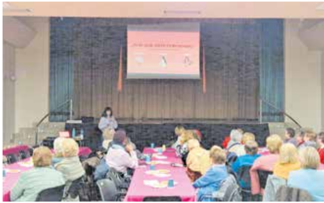
Charla sobre la menopausia en Alcublas.

El sábado 1 de marzo, la Casa de la Cultura acogió una tarde de convivencia con una