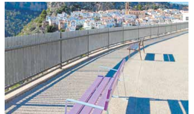
Mobiliario conmemorativo en Chulilla.

Entre las actividades organizadas en colaboración con la Mancomunidad de La Se-