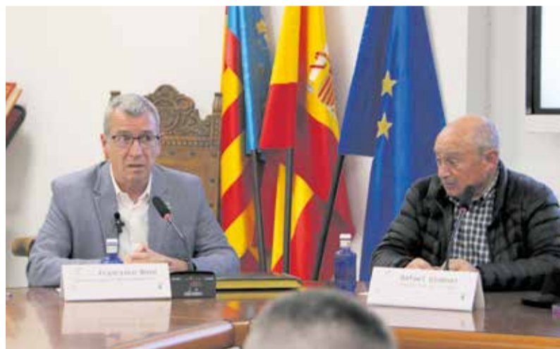
Firma del Protocolo en la Diputación (arriba) y presentación del proyecto en el ayuntamiento de Aras de los Olmos (abajo).