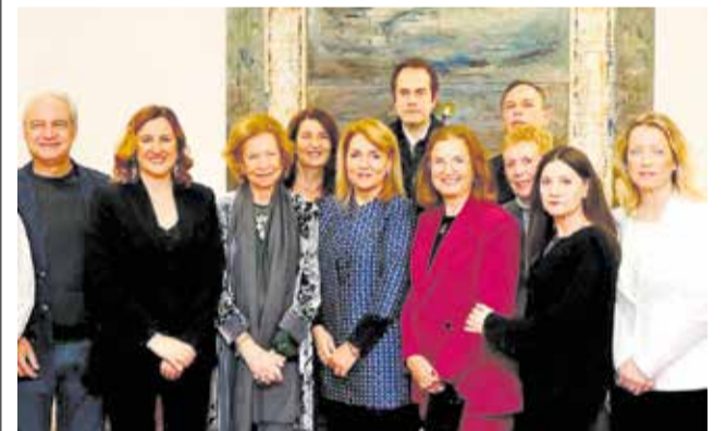
Autoridades en el concierto solidario.