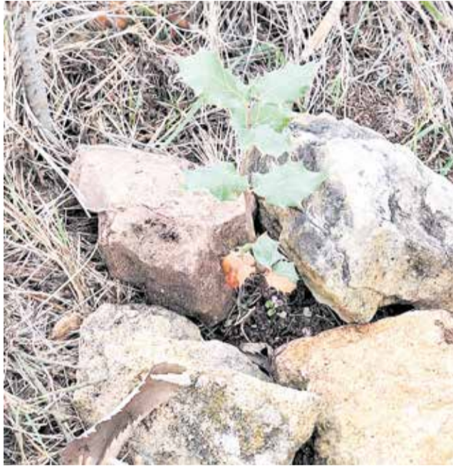
Varios instantes durante la celebración del Día del Árbol en Aras de los Olmos.

Para facilitar la plantación, el Ayuntamiento de Aras de los Olmos preparó