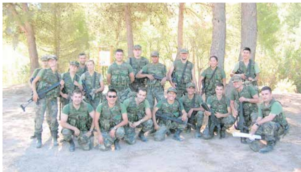
El equipo militar celebrando tras completar el recorrido de la Ruta del Agua.