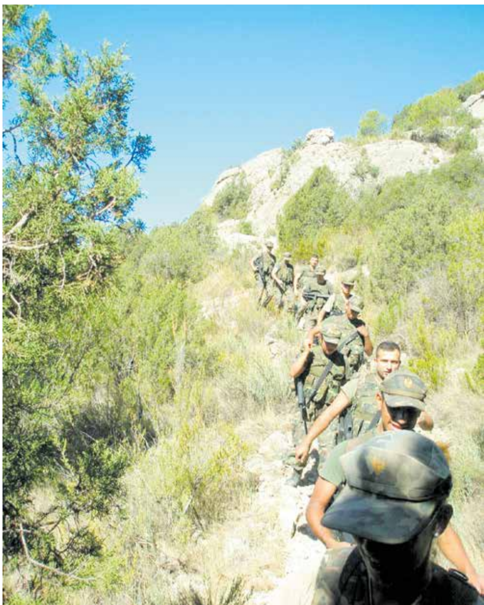
Soldados avanzando por los caminos de la Ruta del Agua.

manos. Fue un instante que nos hizo reflexionar sobre la grandeza de lo que teníamos delante y el legado que ha resistido al tiempo.