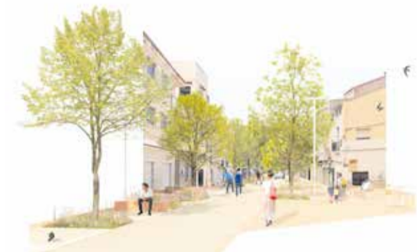
Recreación del proyecto de la calle Las Cruces.

Antes del inicio de las obras, se llevó a cabo una reunión informativa con el vecindario, comerciantes y hosteleros afectados, en la que el equipo redactor del proyecto y la empresa adjudicataria explicaron los detalles del plan de trabajo y el cronograma de ejecución.