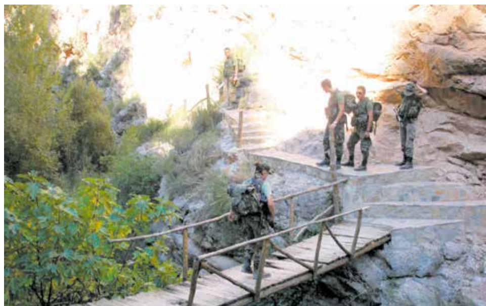
El puente de madera, uno de los tramos más espectaculares de la Ruta.

De igual modo, nos sentimos de algún modo depositarios, como militares, de