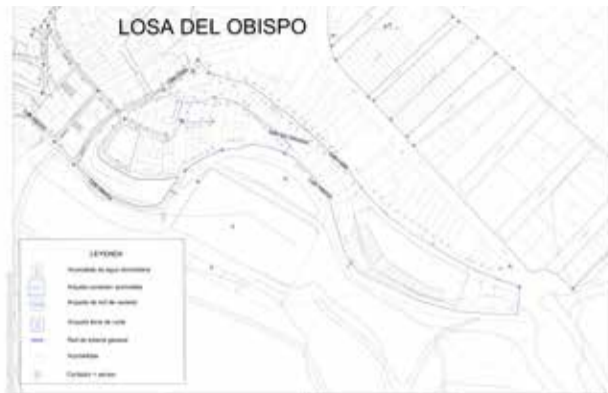
Plano con la zona afectada por las obras.

Estas mejoras están alineadas con las iniciativas