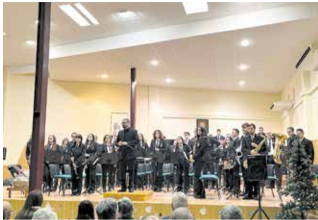
Integrantes de la Unión Musical de Higuieruelas en diferentes actuaciones.

La banda de Higuieruelas competirá en la tercera sección, destinada a agrupaciones de hasta 50 componentes, repitiendo así su presencia en esta categoría. En esta edición, la obra obligada para todas las bandas de la sección será "Cleopatra", compuesta por la valenciana afincada en Boston y directora en el Berklee College of Music.