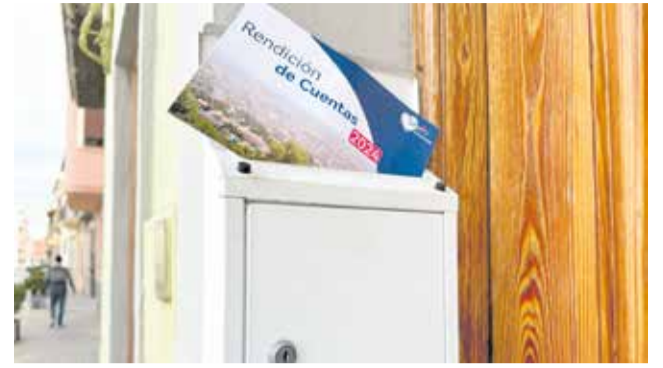
Guía de rendición de cuentas en un buzón.