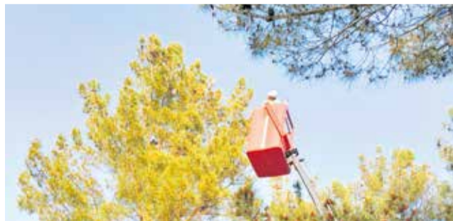
Trabajos de retirada de nidos de procesionaria.

Las actuaciones se han llevado a cabo en las zonas verdes donde abundan los pinares como en el polígono Les Eres, Mariano Ben-