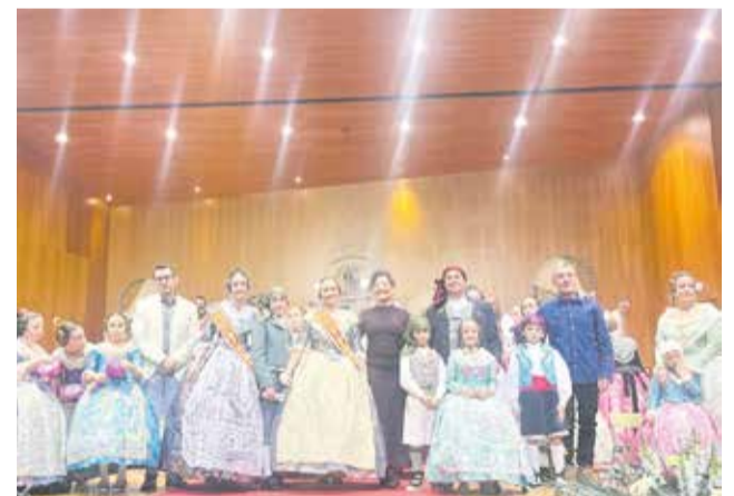
Exaltación de la Falla Pensat i Fet.

El domingo día 2 de marzo empezó el calendario fallero que ha presentado la Falla Pensat i Fet de Casinos, que siempre inunda la población con su simpatía y actos lúdicos.