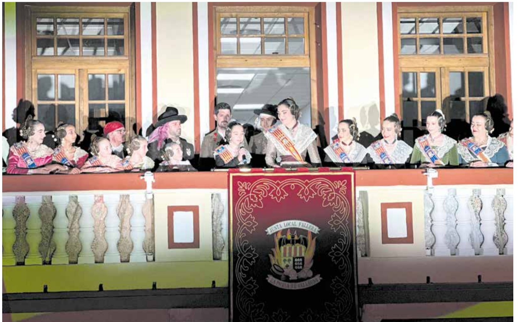
Las Falleras Mayores de la Pobla de Vallbona dan la bienvenida a las Fallas 2025 desde el balcón del ayuntamiento.

La semana grande de las fallas comenzará con la plantà, el viernes 14 de marzo, día en el que todas las comisiones del municipio darán los