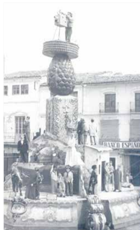
Alguns dels primers monuments plantats a Benaguasil. / EPDA

La inauguració de l'Antiga Estació com a Museu Faller serà un dels moments més emocionants de l'any; un edifici de senyes d'identitat, no només per a fallers, sinó per a tots els veïns de Benaguasil”