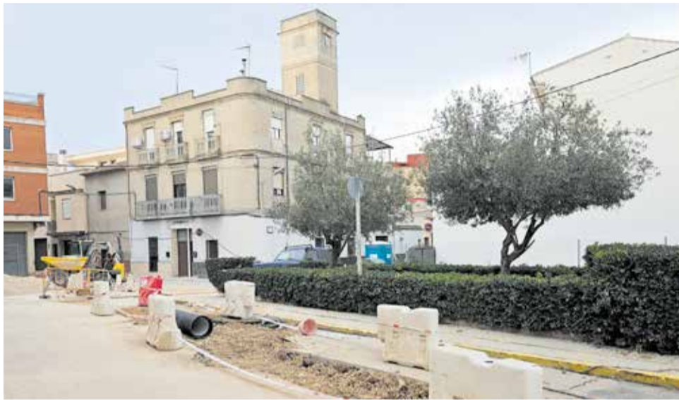
Trabajos en marcha en la Plaza de la Calle de Llíria.

En segundo lugar, y tras décadas de intentos, el Ayunta-