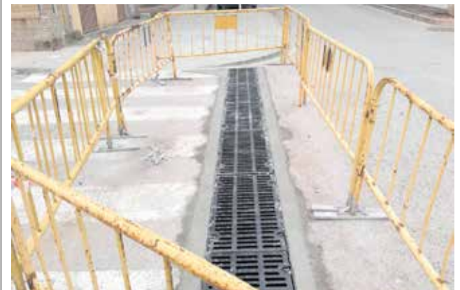
Obras en la Avenida Constitución.