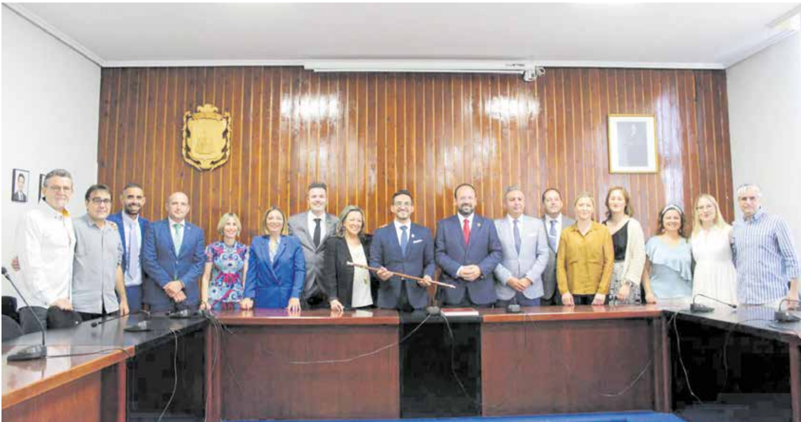
El gobierno municipal de Vilamarxant durante la toma de posesión en junio de 2023.

EL POPULAR HÉCTOR TROYANO DESTITUYE A DOS CONCEJALES DE CS POR "PRESUNTAS IRREGULARIDADES" Y "DESLEALTADES"