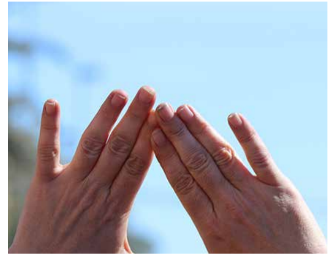
Símbol feminista en una manifestació.

màxima representant. Cada any el seu tret constitueix una mescla de reivindicació de la igualtat i de l'exaltació del poder femení. També s'encarrega de l'espectacle pirotècnic nocturn d'eixa data en la plaça de l'Ajuntament.