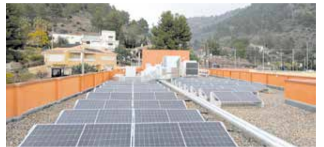
Plaques solars a la coberta del col·legi d'Olocau.