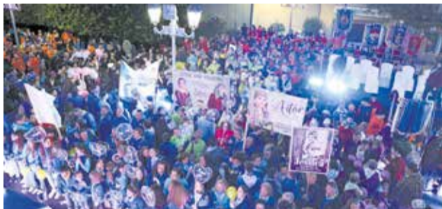
Varios instantes durante la Crida de Benaguasil.

proyección sobre los 100 años de Fallas que se cumplen este año en Benaguasil y en la que personas relevantes de la fiesta felicitaron al colectivo fallero por este hito.