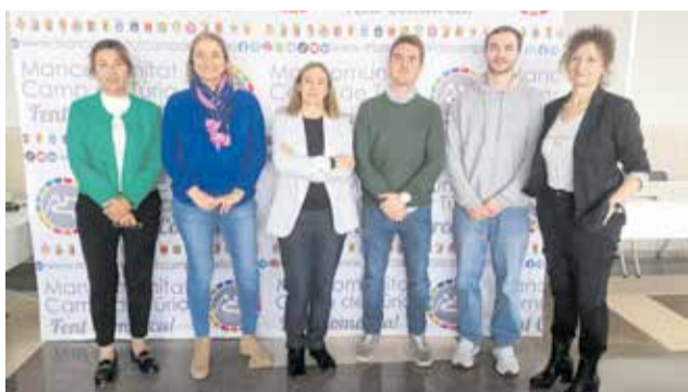
Reunión del proyecto Mobintelligent.

Con la instalación de los últimos radares de Mobintelligent, uno en cada localidad, el proyecto finaliza su primera fase con la monitorización de la movilidad en algunos municipios de la Mancomunitat de Camp de Túria, en concreto en Loriguilla, Riba-roja de Túria y Vilamarxant. Estos radares, conectados a redes 5G, permiten obtener datos clave sobre