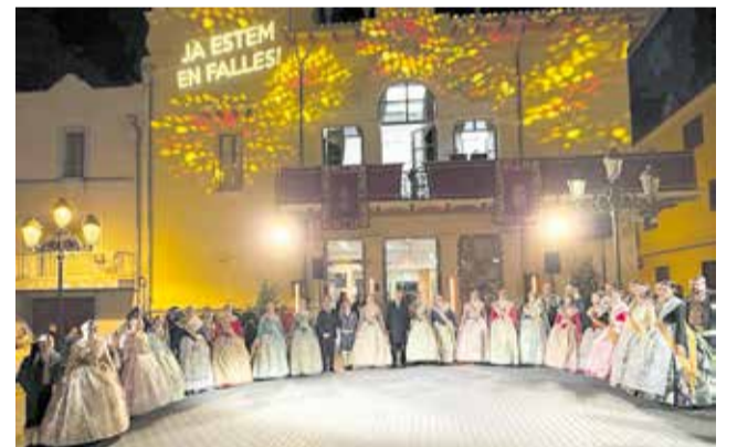
Crida de las Fallas 2025 en Riba-roja de Túria.

Con este impulso, Riba-roja da la bienvenida a su fiesta grande, que seguirá el 8 de marzo con la tradicional visita a la Basílica de la Mare