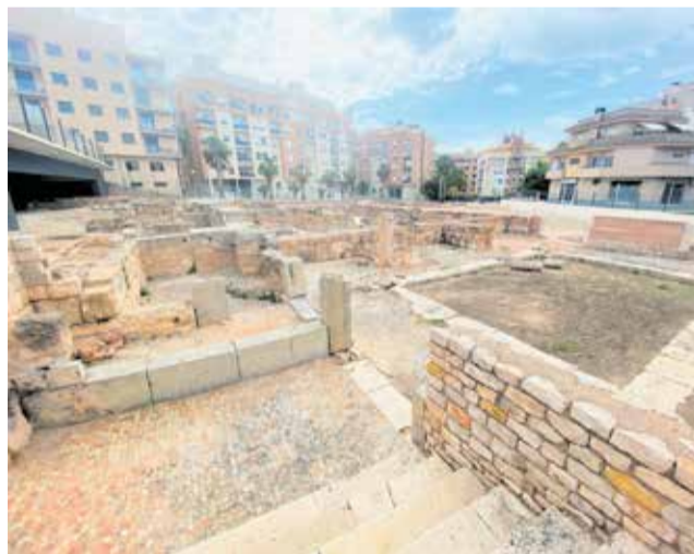
Termas Romanas de Mura en Llíria.

De hecho, con la finalidad de ir avanzando en la supervisión de las actuaciones a realizar, se ha programado una visita la próxima semana por parte de la Dirección General de Cultura a la localidad de Llíria, para