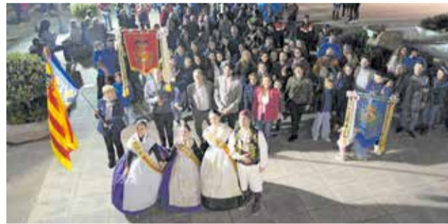
Diferentes instantes durante la Crida y los playbacks de la A. C. Falla de Loriguilla.