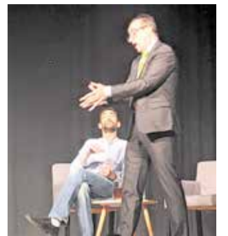
Representació. / EPDA