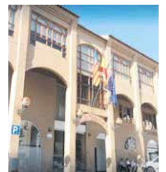
Ayuntamiento de Llíria. / EPDA

Los perfiles solicitados son peones y oficiales de jardines, obras y caminos, así como personal técnico