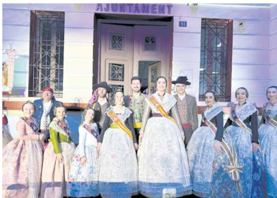
Autoridades a las puertas del ayuntamiento de la Pobla en la Crida.

últimos retoques a sus monumentos y 'ninots' para la visita del jurado. El sábado 15 de marzo, a las 18.30 horas, se hará entrega de los premios a las diferentes comisiones en el ayuntamiento.