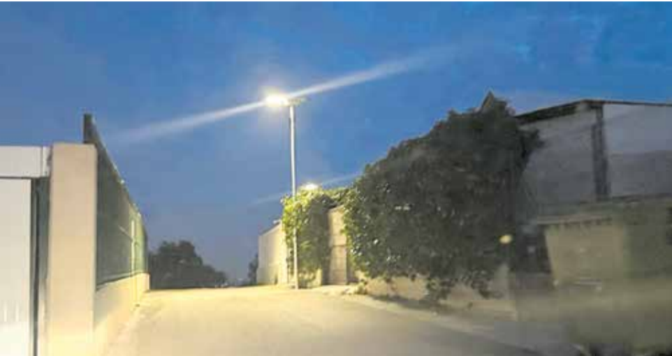
Un dels fanals solars instal·lats al camí de la Foieta de Benissanó..