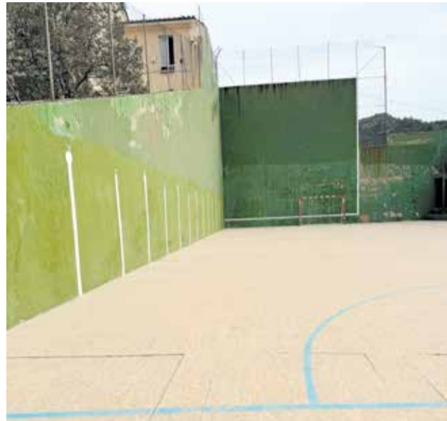
Frontón municipal de Gátova.

El alcalde ha subrayado esta visión de futuro en sus declaraciones: “El Ayuntamiento de Gátova sigue apostando por inversiones necesarias y adaptadas a la realidad del municipio. La renovación del frontón no solo beneficiará a los deportistas, sino que permitirá a los alumnos del CRA Alt Carraixet y a los jóvenes del