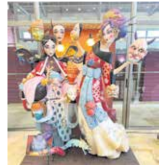
Ninot indultado.

Antes de conocer el veredicto del jurado, el alcalde felicitó a todas las fallas por el nivel de los ninots que hacen presagiar unos sensacionales monumen-