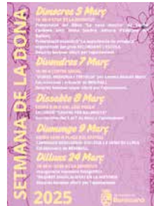
Cartell.