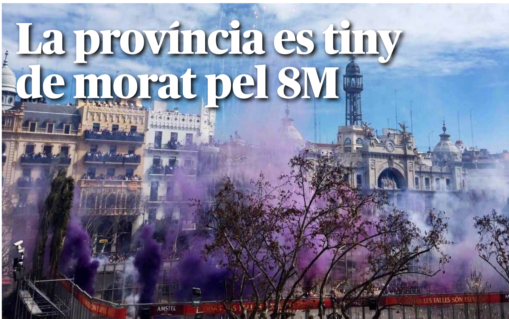
La masquetà de València del dia 8 de març acostuma a sorprendre amb tons morats amb motiu del Dia de la Dona.

FEM UN RECORREGUT PER ALGUNS DELS DIFERENTS ACTES QUE TINDRAN LLOC A LES COMARQUES VALENCIANES EN EL MES DE LA DONA