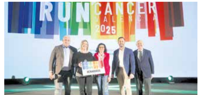
Entrega del cartel oficial.