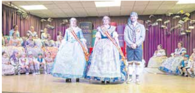
Representantes 2025 de las dos comisiones falleras de Nàquera.

23:30 h en el casal de la Falla L'Encarnació.