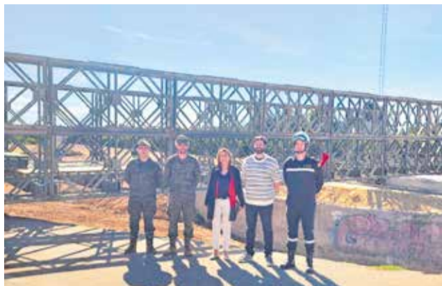
Puente provisional sobre el barranco de Pozalet.

La alcaldesa de Loriguilla, Montserrat Cervera, explicó que el temporal dejó sin acceso directo a los agricultores y a infraestructuras municipales esenciales, como el pozo de agua y viviendas diseminadas. Ante esta situación, el 12 de diciembre contactó con la ministra de Defensa, Margarita Robles, para solicitar la intervención de la UME con un puente provisional. La respuesta fue inmediata: al día siguiente, un equipo de pontoneros se desplazó al municipio para estudiar la vi-