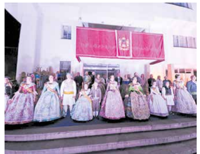
Crida de les Falles 2025 en Vilamarxant.

La fi de festa arribarà el dimecres 19 de març, dia en què l'església Santa Catalina Màrtir acollirà a les 12 de migdia la missa en honor a Sant Josep. Eixe mateix dia, Vilamarxant celebrarà el seu Tren Faller, un esdeveniment únic que s'ha convertit en una parada obligada per a centenars de visitants d'altres pobles que s'acosten a presenciar una desfilada molt especial, on destaquen la passió de les comissions participants, la creativitat de les disfresses i, per descomptat, l'humor i la diversió.