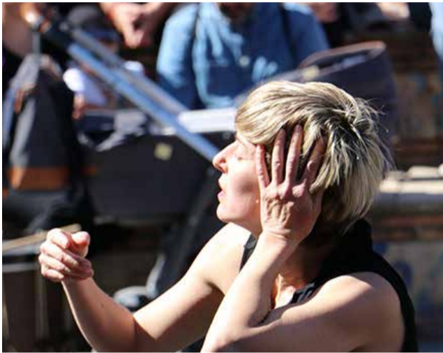
Una activitat pel 8M a Sagunt.

► SAGUNT. La capital del Camp de Morvedre presenta una proposta amb exposicions, xarrades, presentacions de llibres i projeccions de documentals, així com la seua sempre multitudinària manifestació.