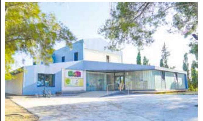
Casa de la Juventud de San Antonio de Benagéber.