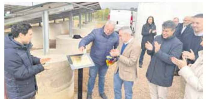
Un instant durant la inauguració.

A més a més, suposa un estalvi d'energia de 400 megavats a l'any i la reducció d'emissions de CO 2 de 100 tones a l'any.