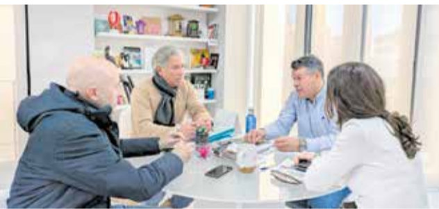
Un instant durant la trobada. / EPDA