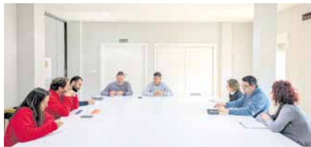
Primera reunió de la Comissió Iberfesta.