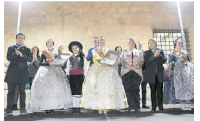
Crida de las Fallas 2025 en Lliria.

El día 15, con la plantà, se entrará en la recta final de las fiestas. En esta jornada, el Grup de Danses i Rondalla "El Tossal" visitará los casales en la Ronda d'Albaes Falleres. La tarde del 16 estará reservada para el acto de entrega de premios a los mejores monumentos de 2025, los de Ingenio y Gracia, y Ninots, así como los galardono-