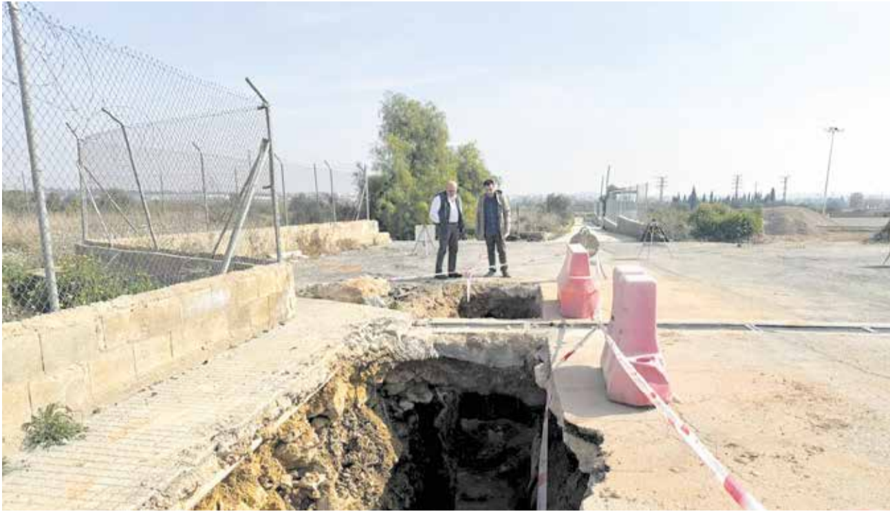
Obras de mejora del drenaje de aguas pluviales en Benaguasil.