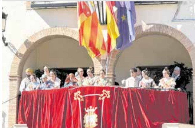
Crida des del balcó de l'Ajuntament de l'Eliana.

El dissabte 22 va tindre lloc l'esperada Cridà, on els màxims representants fallers van anunciar des del balcó de l'Ajuntament que ja estem en Falles. La jornada va continuar amb la Gala Fallera i exhibició de playbacks a l'Auditori, seguida d'una revetla en la plaça del País Valencià, amb la col·laboració dels clavaris de la Mare de Déu del Carme i l'orquestra People Band. El diumenge, les comissions van gaudir de les tradicionals paelles.