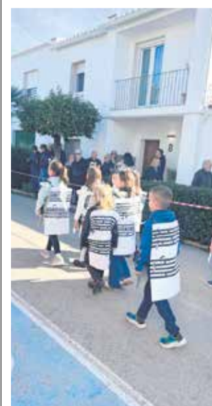
Disfraces durante las fiestas de San Antón.