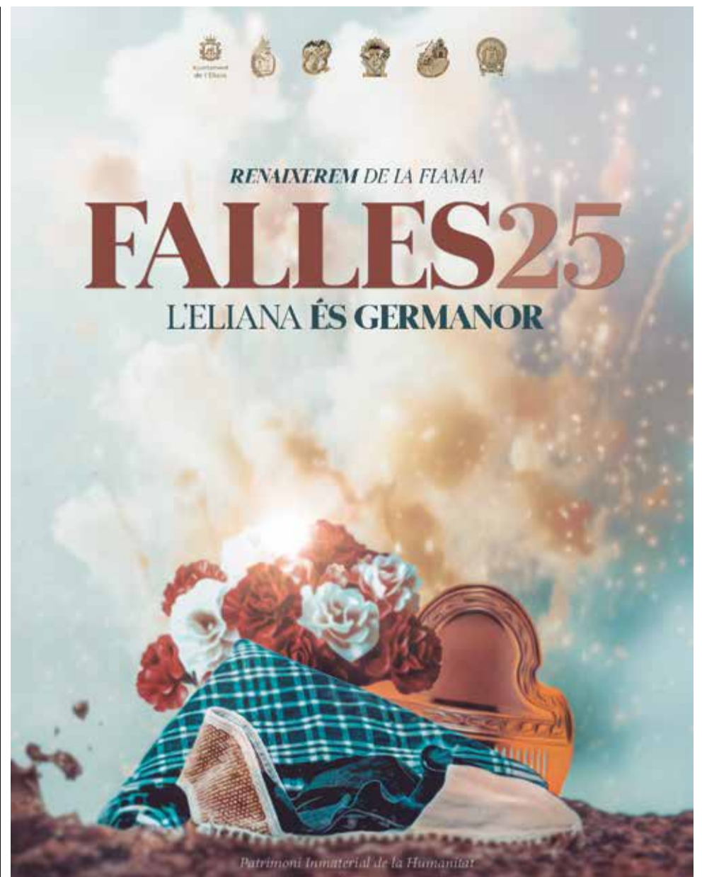
Patrimoni Inmaterial de la Humanitat

El 19 de març, dia de Sant Josep, se celebrarà la missa major seguida d'una gran cercavila amb totes les comissions. La nit culminarà amb els correfocs a les 19.00 hores, la cremà de les falles infantils a les 20.00 hores i, finalment, la cremà dels monuments grans a les 22.30 hores, posant el fermall d'or a unes Falles plenes d'emoció i tradició.