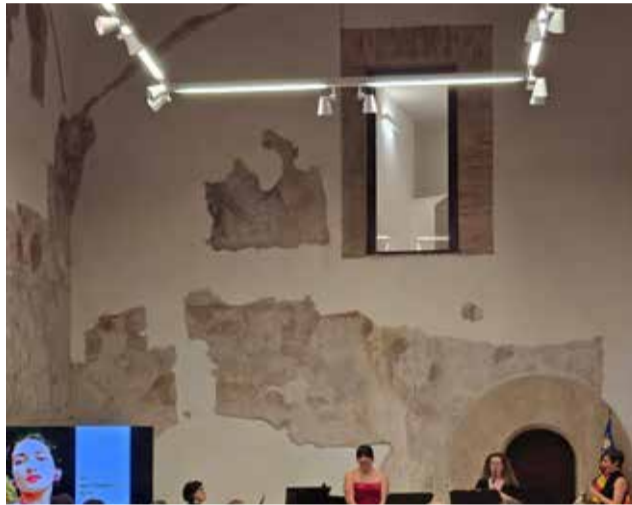
Una proposta a Riba-roja de Túria.