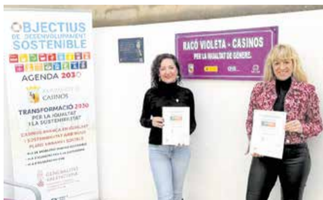
Presentación del Plan de Igualdad.