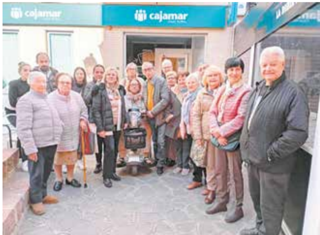
Ajuntament i veïns es concentren a l'oficina.

L'oficina, que anys enre va passar a dependre de Nàquera i posteriorment