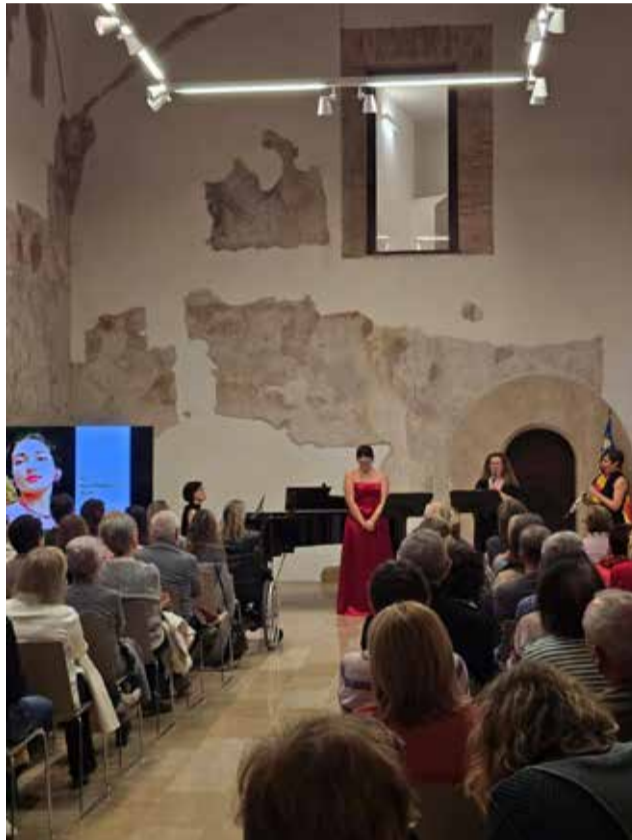
Una proposta a Riba-roja de Túria.