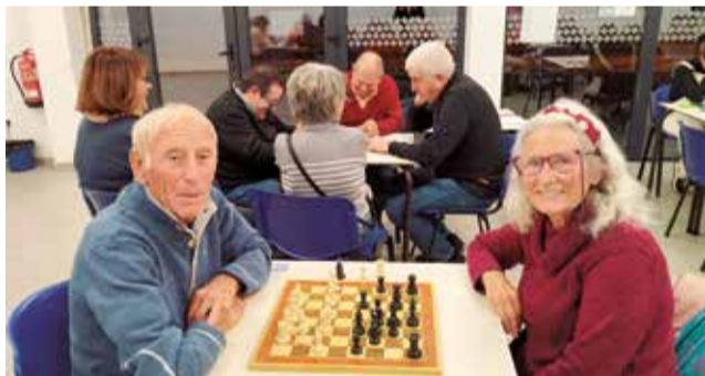
Balcó al Mar de Canet. / EPDA