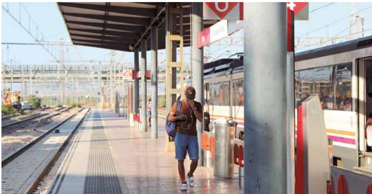
Estació de tren de Sagunt.