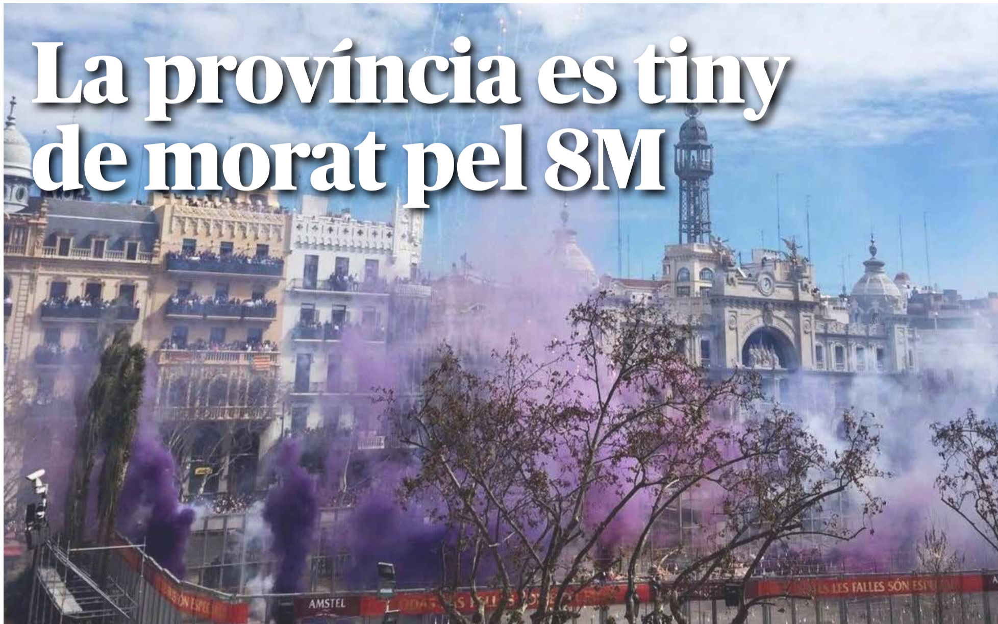
La mascletà de València del dia 8 de març acostuma a sorprendre amb tons morats amb motiu del Dia de la Dona.

FEM UN RECORREGUT PER ALGUNS DELS DIFERENTS ACTES QUE TINDRAN LLOC A LES COMARQUES VALENCIANES EN EL MES DE LA DONA