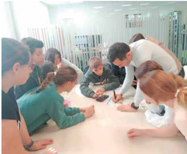
Pequeños de Canet con el alcalde.

Otro de los temas abordados fue el estado de las fuentes públicas, denunciando el mal sabor del agua en algu-