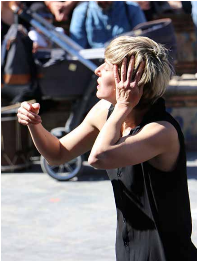
Una activitat pel 8M a Sagunt.

► SAGUNT. La capital del Camp de Morvedre presenta una proposta amb exposicions, xarrades, presentacions de llibres i projeccions de documentals, així com la seua sempre multitudinària manifestació.