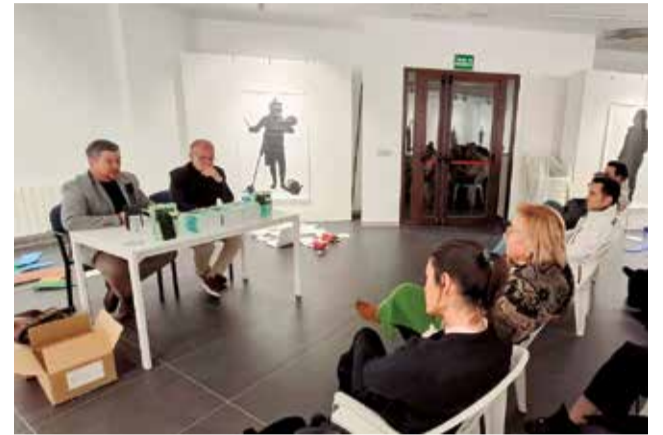
Un momento de la presentación.