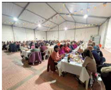
Activitats pel 8M a Gilet.