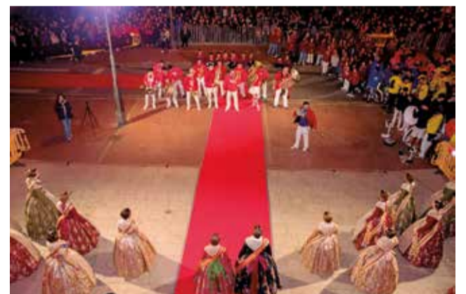
Diversos instants del dia de la Crida.

el Camp de Morvedre ja està immers en l'esperit faller, preparat per viure unes festes plenes de tradició, germanor i alegria.