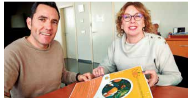
El alcalde y la concejala de Comercio.