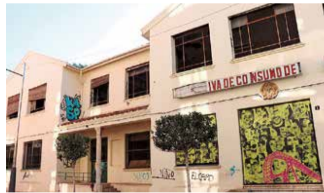
L'Economat, abans de la rehabilitació.

Respecte al CEAM, en la planta primera, les obres donaran lloc a una àrea de tractaments i cures, podologia, psicologia i rehabilitació; i una àrea de teràpia i activitats, amb sales d'usos múltiples. Així mateix, es construiran espais de serveis generals, a més de lavabos.