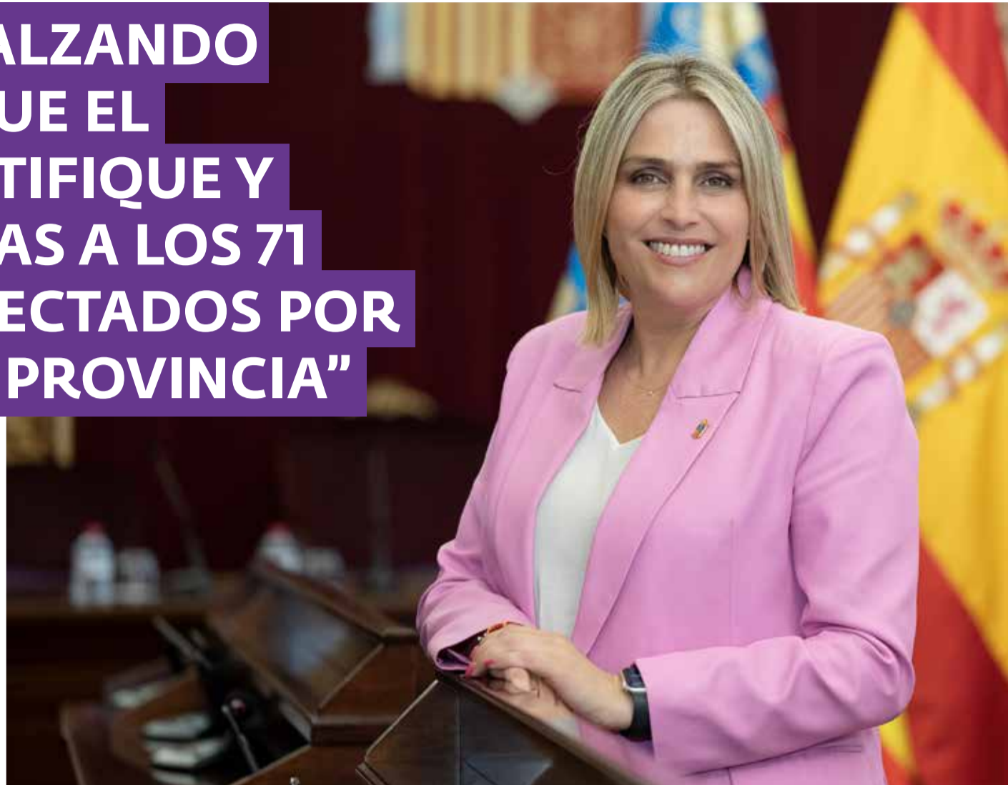
La presidenta de la Diputación de Castellón, Marta Barrachina, durante la entrevista concedida a El Periódico de Aquí en la institución.

► Dijimos que esta iba a ser la legislatura del agua y lo estamos cumpliendo con hechos. La puesta en marcha del Consorcio Provincial de Aguas es solo una medida de todas las que estamos llevando a cabo desde la Diputación para ayudar a salir del mapa rojo de la sequía a muchos de nuestros pueblos que, lamentablemente, sufrieron el año pasado uno