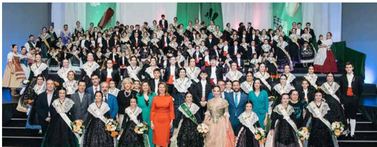
Homenatge a les comissions de sector (dalt) i a les comissions infantils (baix) de la Magdalena.

va realitzar la tradicional descoberta de la rajola commemorativa amb els noms de les reines a l'exterior del Palau de la Festa. La cerimònia va estar carregada d'emotivitat, destacant-se l'esperit de germanor que caracteritza la Magdalena