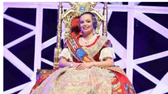
Reines Falleres de Burriana 2025.