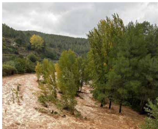
Desbordamiento del Río Mijares.