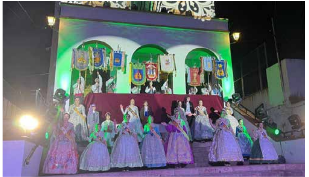
Crida fallera a la Capella de la Mare de Déu dels Desemparats de la Vall d'Uixó.

L'ambient festiu ja es respira en cada racó de la Vall d'Uixó, on les casals fallers han obert les seues portes a la ciutadania.