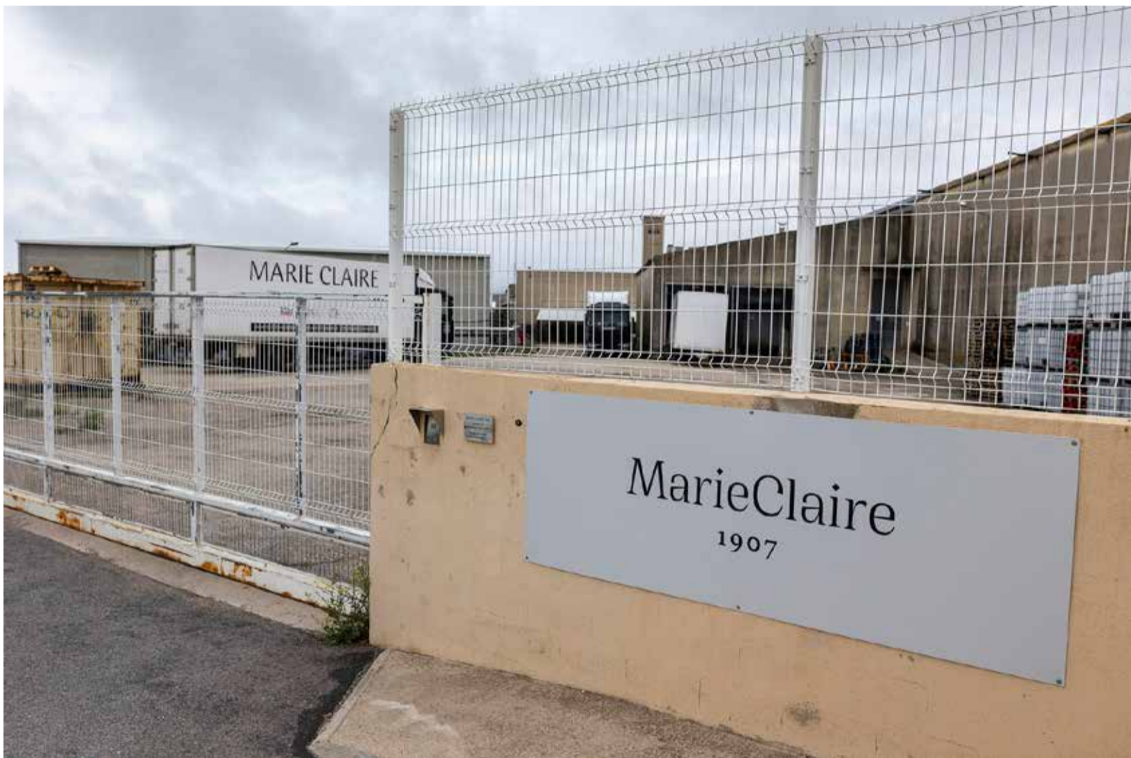
Puerta de acceso a la fábrica de Vilafranca del Cid.

LA EMPRESA FOR MEN S.A. RESUELVE EL CONTRATO DE COMPRA TRAS EL EMBARGO JUDICIAL DE SUS CUENTAS POR IMPAGO