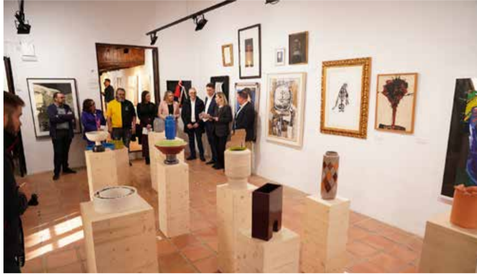
Exposició ceràmica de Colorobbia a la Casa Abadia de Vilafamés.