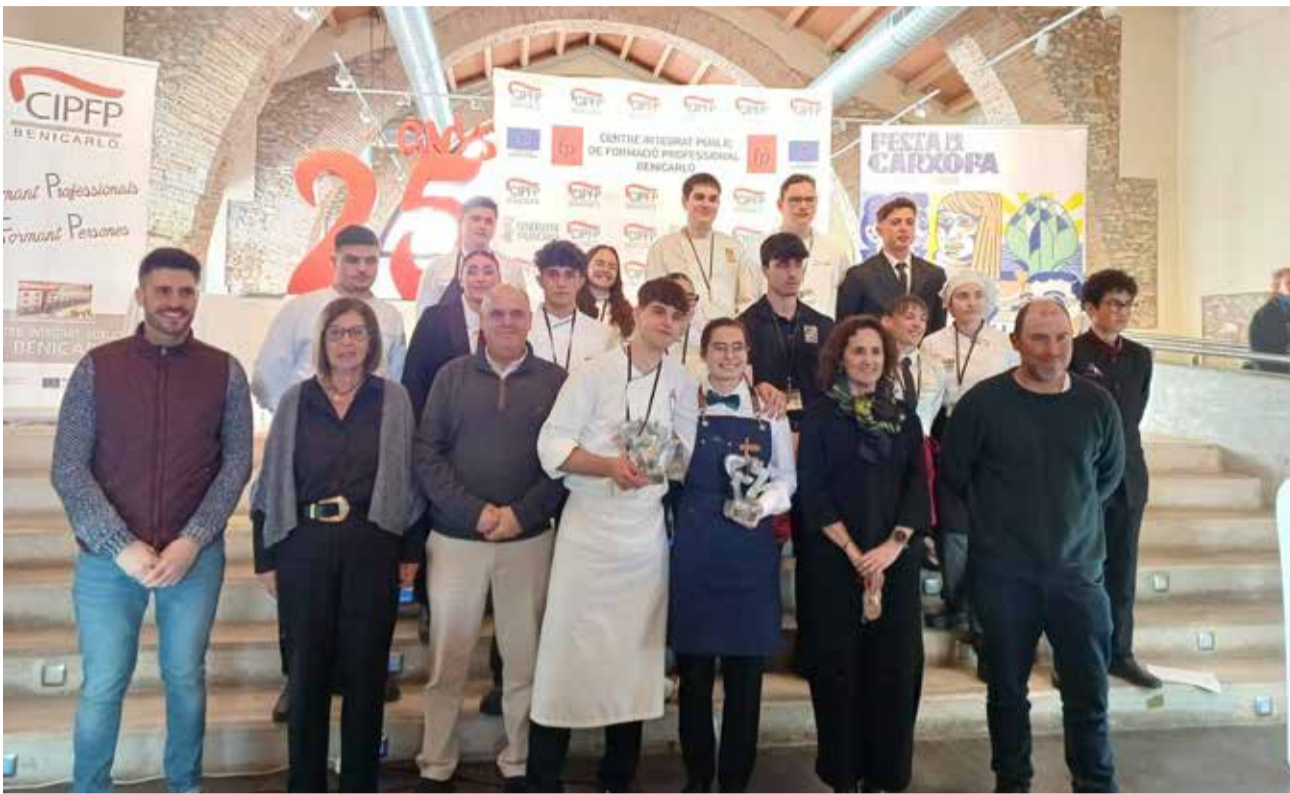
Entrega de premis del Concurs Gastronòmic de la Carxofa 2025 de Benicarló.