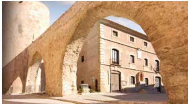
Casco antiguo de la localidad

Las obras de mejora del patrimonio histórico de la ciudad, cuentan con un presupuesto de 2.247.333 euros y es concedida por el Ministerio de Industria, Comercio y Turismo.