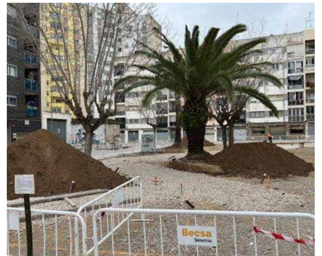
Treballs a la plaça de Sant Andreu de Vinaròs.

dels més evidents símptomes de la irresponsabilitat del govern del Partit Socialista". El vicecalde insistia "que van decidir aixecar una plaça obviant que no tenien pressupost per a poder escometre la reforma de la mateixa i tot això va derivar en què durant gairebé dos anys, els veïns han hagut de suportar com la plaça estava aixecada sense que s'actués en ella".