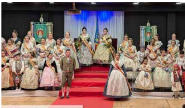
Exaltació de la Falla El Compromís.