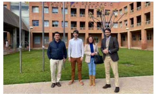
Reunió en la Conselleria d'Educació.