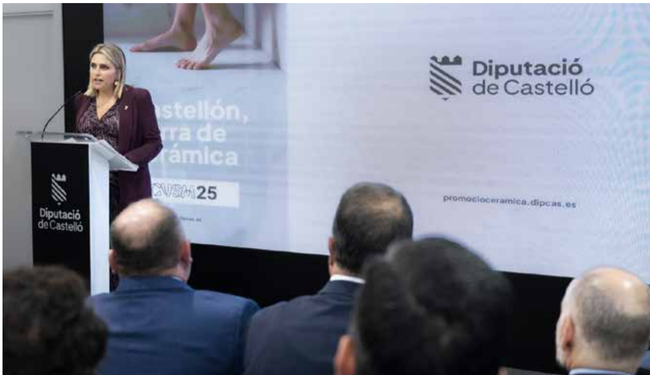
La presidenta de la Diputació de Castelló durant la inauguració de Cervisama 2025.