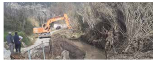
Daños causados por la DANA en la comarca.

depuradoras de Arañuel, Cirat, Fuente la Reina, Montán, Montanejos y Toga, con una inversión de 211.685,63 euros, así como en la puesta a punto de los caminos rurales de diez poblaciones, con una inversión que supera los 100.000 euros y que ha destinado la Diputación de Castellón.