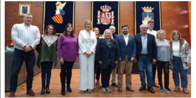
Jornada informativa en el salón de plenos.