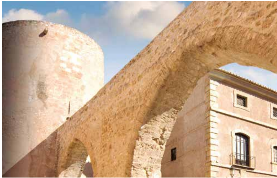
Muralla centenaria que rodea Segorbe