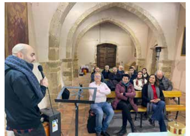
Una de les activitats de la Dictada Occitana.