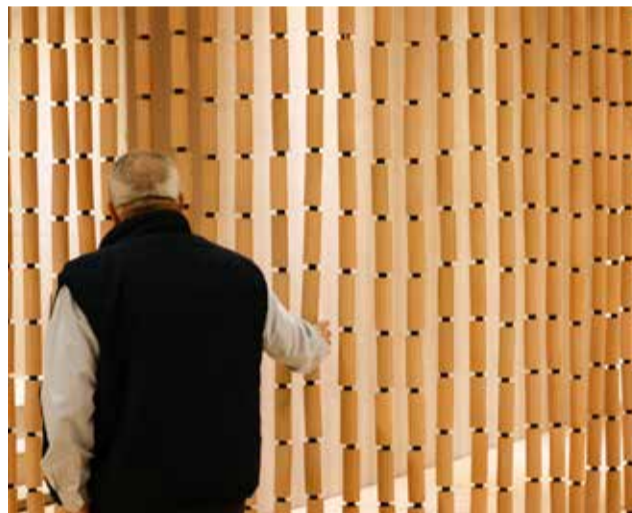
Varias personas recorren stands de la feria cerámica Cevisama 2025.

EE. UU., y otros como Grecia o República Dominicana, la tendencia es positiva pero las medidas arancelarias de la administración Trump hacen estar “muy vigilante” y “expectante” a la industria española.