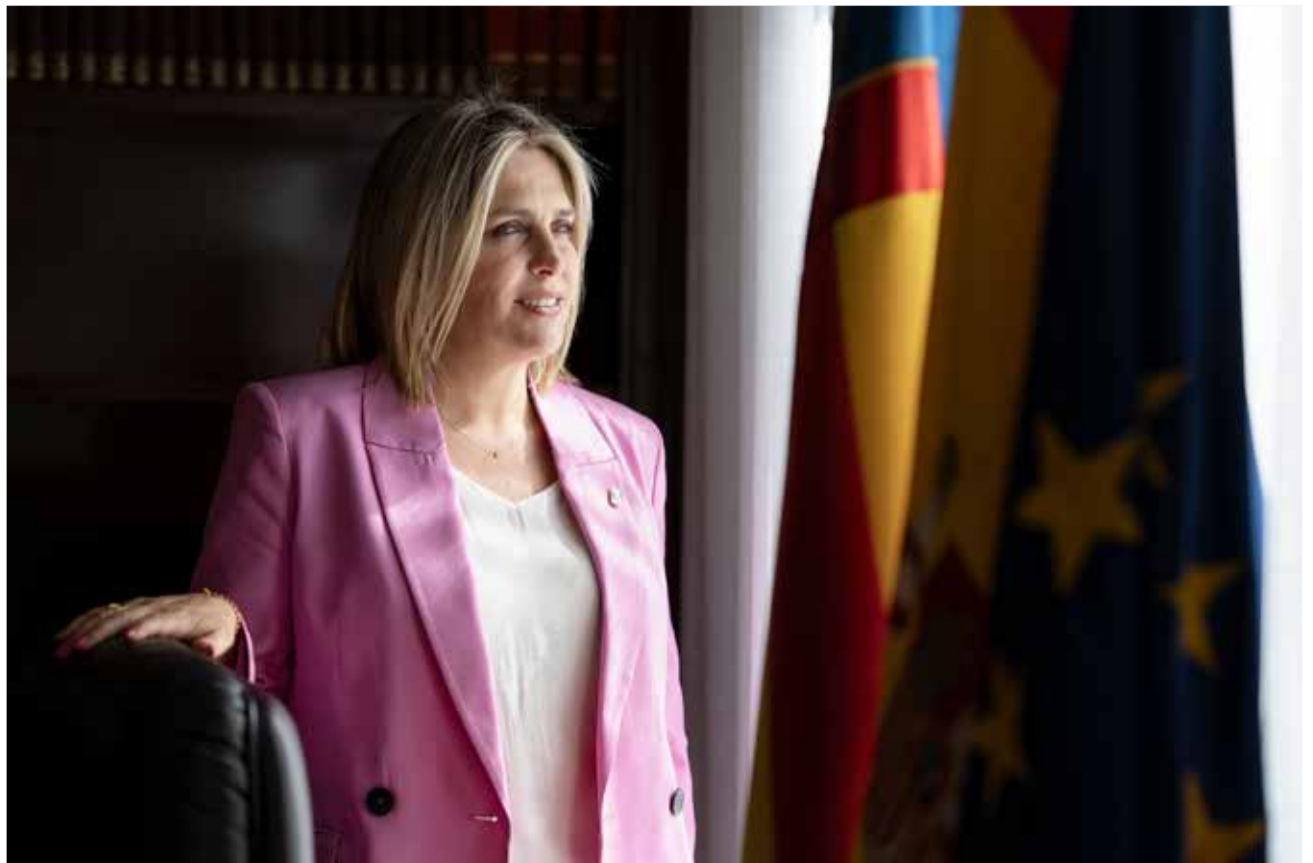
Barrachina durante la entrevista para El Periódico de Aquí.

La provincia tiene ahora una mejor calidad asistencial, pero hay que seguir invirtiendo y trabajando para que los castellonenses tengan la sanidad que merecen"