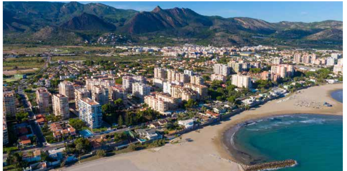
Vista aèria de Benicàssim.

"Apostem per dinamitzar i diversificar l'oferta d'oci, sol i platja a través d'una competitiva oferta de serveis que permeten seguir a Benicàssim com a platja preferent per a molts dels de