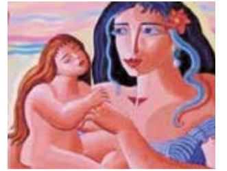
Arte en Segorbe