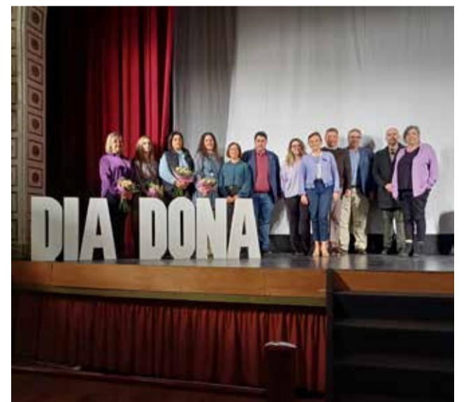
Homenatge pel 8M en 2024.

Després d'este emotiu homenatge, es procedirà a la