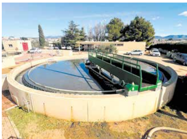
Depuradora de Utiel.

Según ha explicado el conseller, en lo que respecta a la reparación de la EDAR de Utiel, se están realizando la-