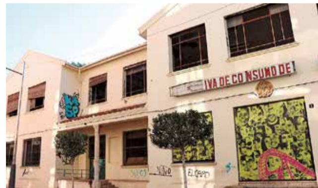
L'Economat, abans de la rehabilitació.

Respecte al CEAM, en la planta primera, les obres donaran lloc a una àrea de tractaments i cures, podologia, psicologia i rehabilitació; i una àrea de teràpia i activitats, amb sales d'usos múltiples. Així mateix, es construiran espais de serveis generals, a més de lavabos.