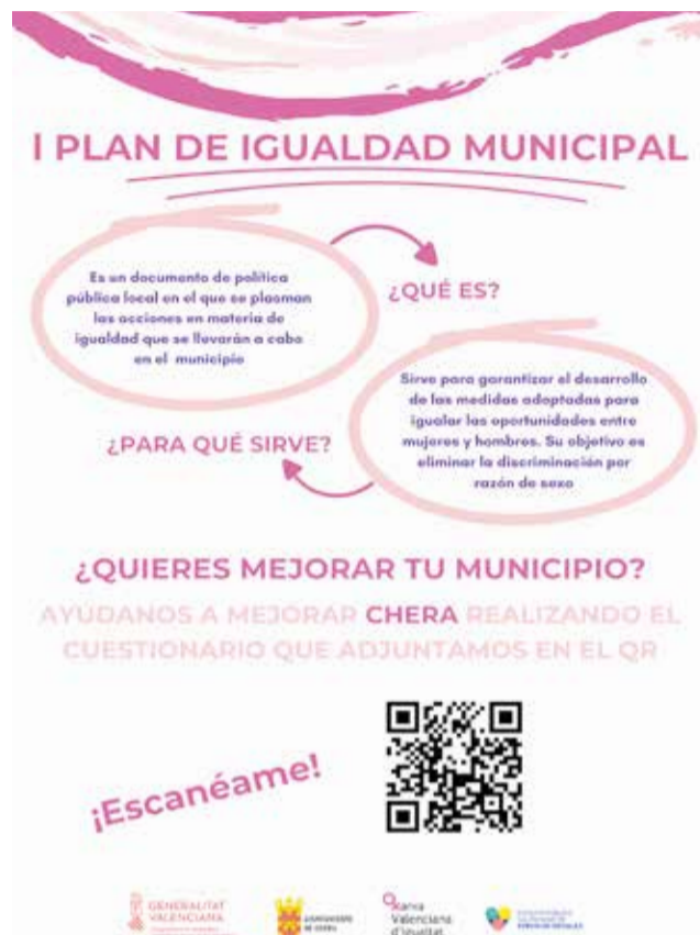
Cartel del primer plan de Igualdad de Chera.

Para garantizar la participación ciudadana en la elaboración de este plan, el Ayuntamiento ha puesto en marcha una encuesta que permitirá recopilar opiniones y necesidades de la población. Los