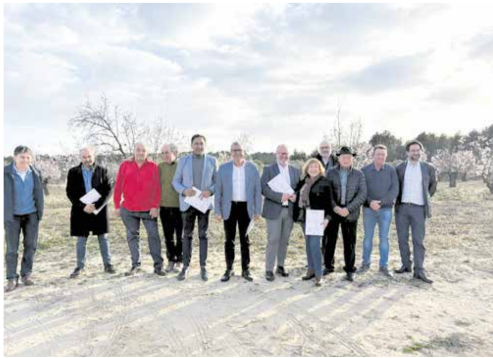
Visita técnica a la aldea de Casas del Rey, perteneciente a Venta del Moro.