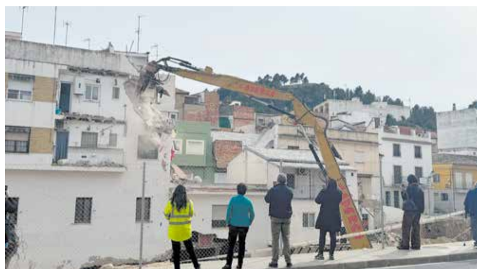
Los trabajos de derribo de las casas afectadas por la riada.

Sobre el realojo de los vecinos afectados por las inundaciones, el Ayuntamiento trabaja para que puedan disponer de una vivienda definitiva, ya sea en la parcela o solar donde estaba la afectada por la riada o en otra ubicación, para que tengan "una tranquilidad y una estabilidad", explicó.