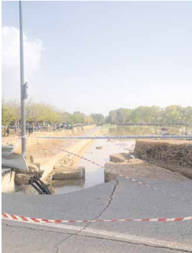
Instantáneas del paso de la riada en Utiel.