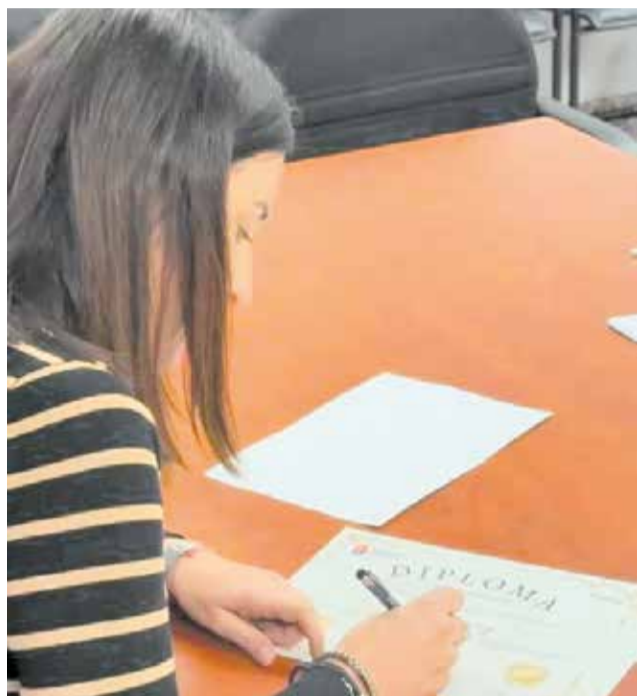
La alcaldesa Vanesa López Guijarro.

Desde el Consistorio han destacado que esta iniciativa refuerza el compromiso con los derechos de la infan-