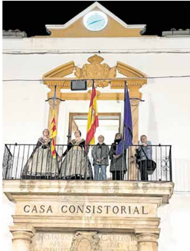
Diferentes momentos durante la Crida y los actos falleros de Utiel.