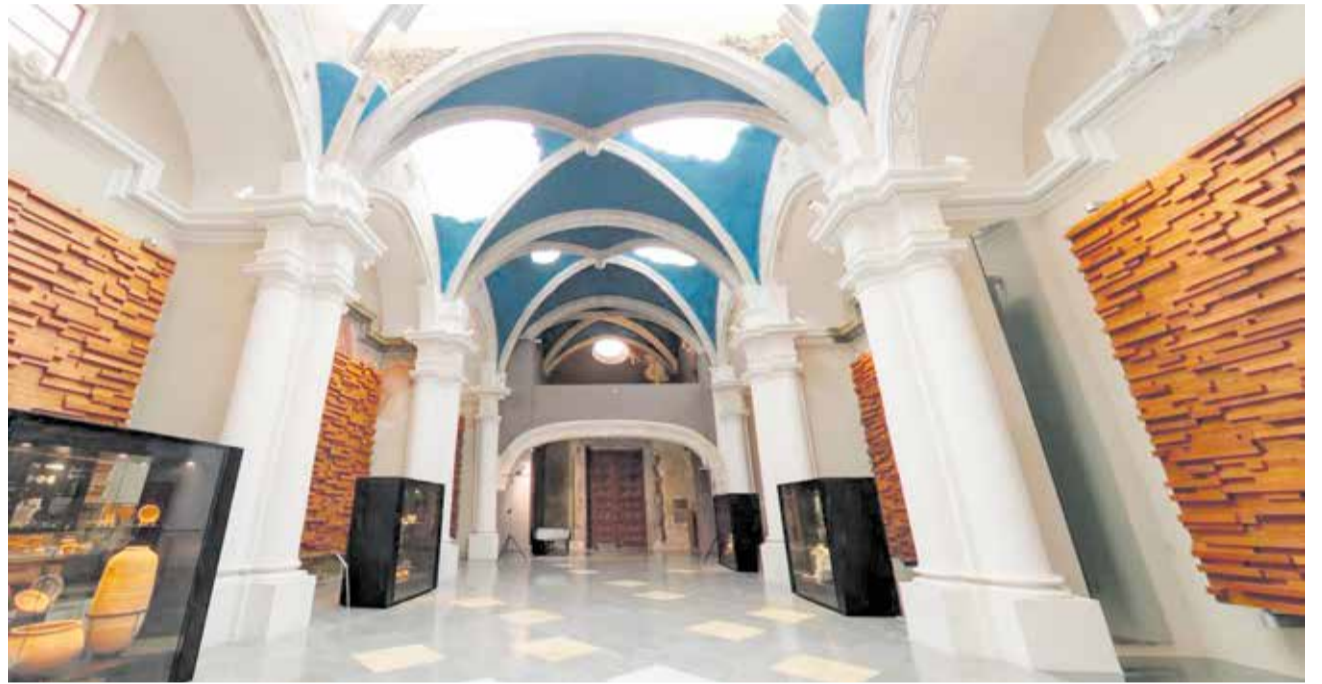
Interior de la Iglesia de San Nicolás de Requena.