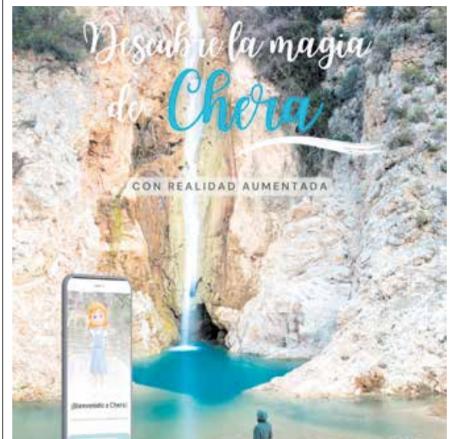
Cartel campaña turismo de Chera.