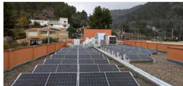
Plaques solars a la coberta del col·legi d'Olocau.