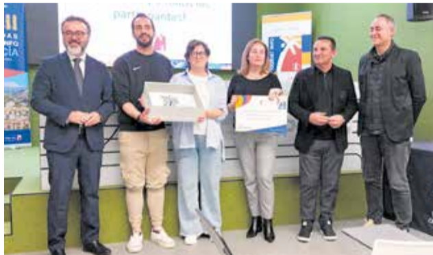
Momento de la recogida del premio.

De este modo, la oficina Tourist Info Ayora da respuesta al problema de acceso a estos recursos: ¿Cómo ver una colmena y sus procesos por dentro?, y ¿Cómo favorecer la visita del castillo de una manera flexible y segura? Así, se ha hecho posible contemplar una colmena de abejas melíferas desde dentro y, además, se ha