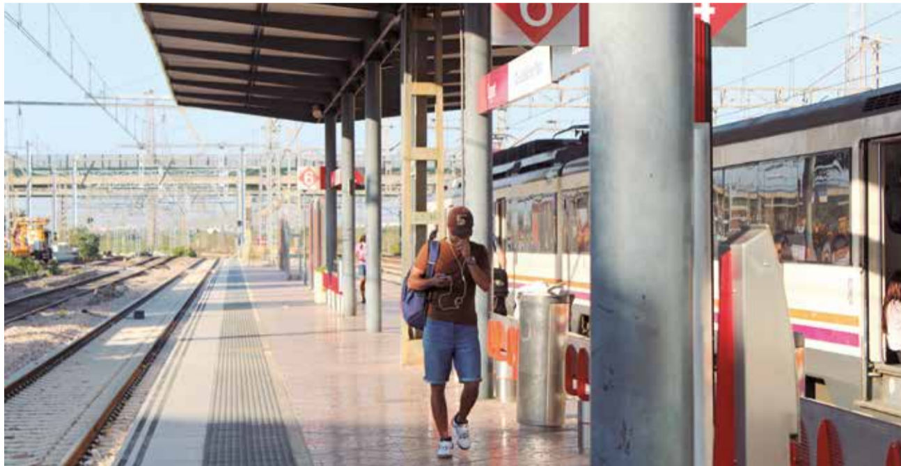
Estació de tren de Sagunt.