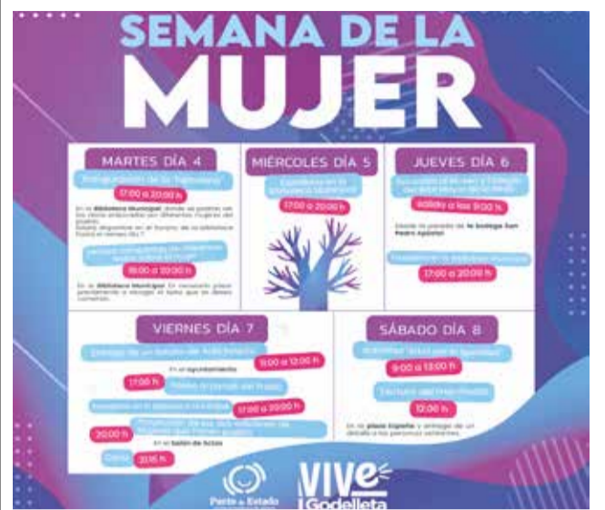
Cartel de la Semana de la Mujer en Godelleta.