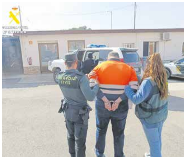
Uno de los detenidos.

En uno de los robos perpetrado en la localidad de Lliria el pasado mes de agosto, se consiguieron imágenes de las cámaras de seguridad en las que se pudo observar a un hombre corpulento que ocultaba su rostro con una