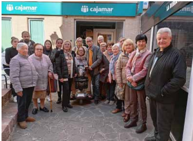
Ajuntament i veïns es concentren a l'oficina.

L'oficina, que anys enre va passar a dependre de Nàquera i posteriorment