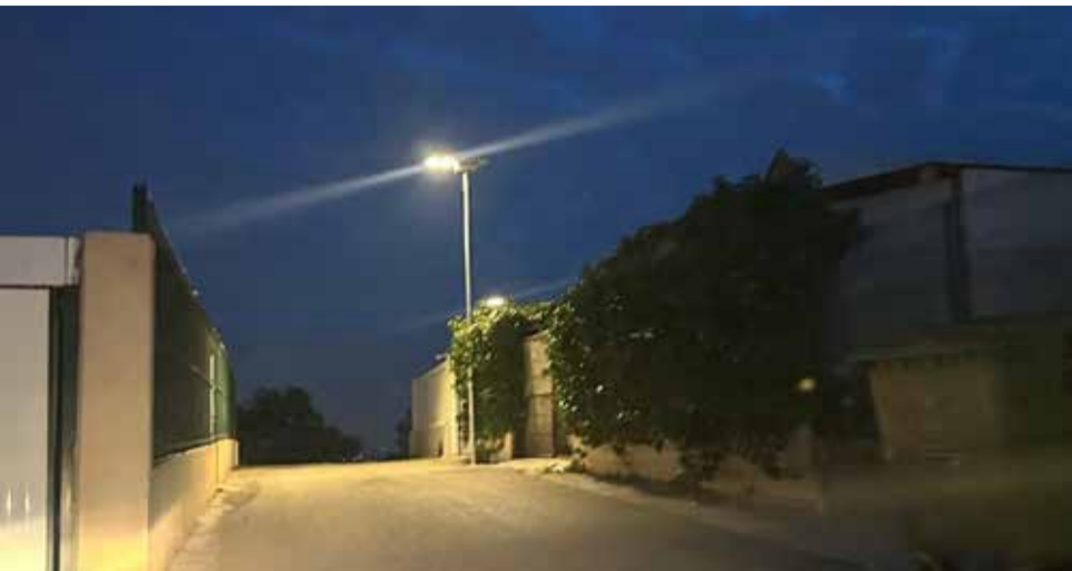
Un dels fanals solars instal·lats al camí de la Foieta de Benissanó..