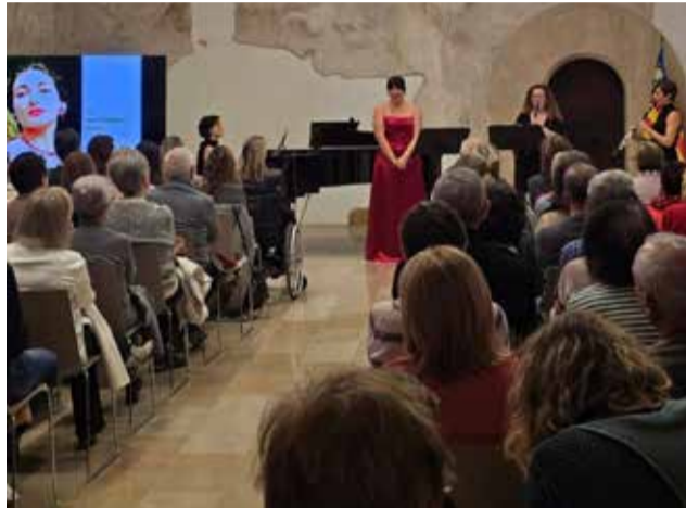
Una propuesta en Riba-roja de Túria.

► RIBA-ROJA. Este municipio del Camp de Túria ha preparado un programa cuyo lema es 'Resilients', que incluye, entre otras actividades, una actuación musical con un mensaje sobre la violencia de género.