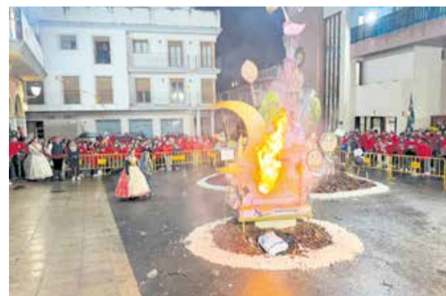
Diferentes momentos durante las Fallas de Godelleta.

lleva al frente de esta entidad desde 2017.