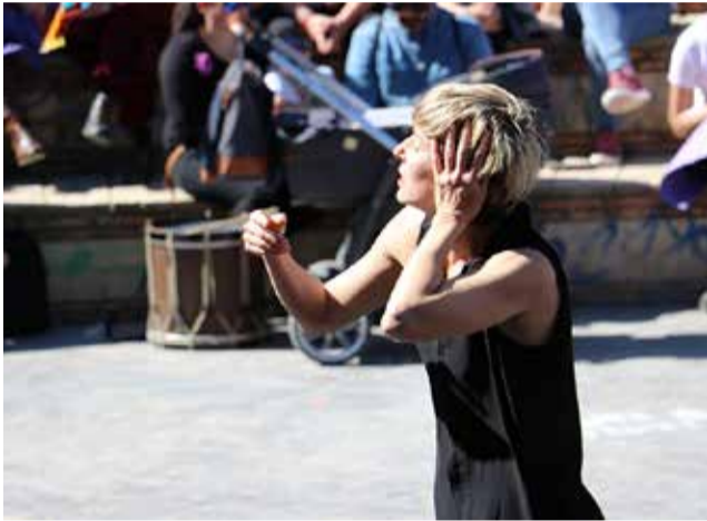
Una actividad por el 8M en Sagunt.

► VALENCIA. La capital pone el foco en la mujer y la ciencia, con un acto de reconocimiento a figuras destacadas en este campo. Además, los espectáculos pirotécnicos tendrán sello femenino.