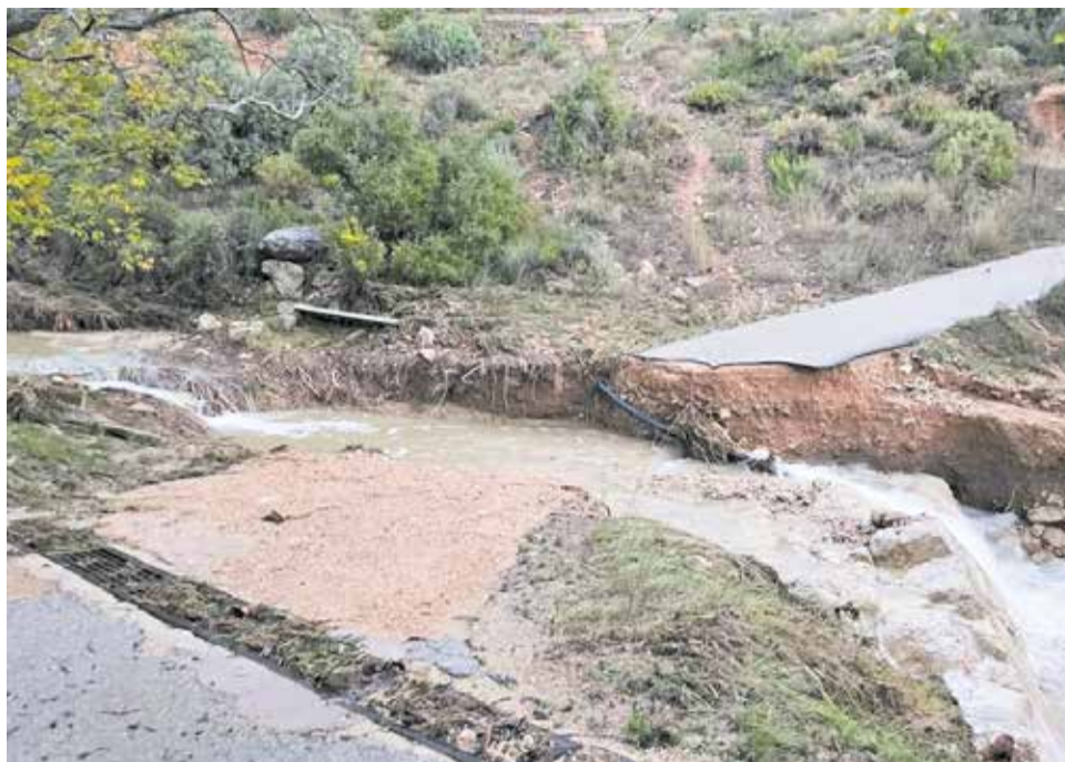
Una de las carreteras afectadas en Chera tras la riada del 29 de octubre.

En este caso, el importe de las actuaciones asciende