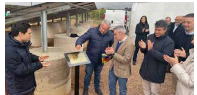
Un instant durant la inauguració.

A més a més, suposa un estalvi d'energia de 400 megavats a l'any i la reducció d'emissions de CO 2 de 100 tones a l'any.