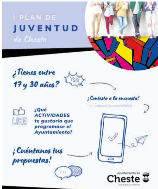
Cartel del primer Plan de Juventud de Cheste.

Las y los jóvenes de 12 a 16 años han contestado al for-