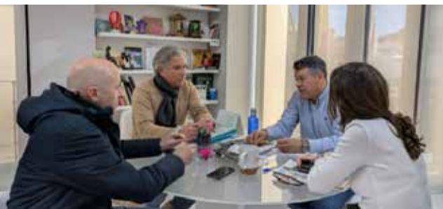
Un instant durant la trobada. / EPDA