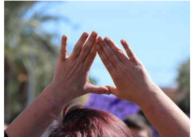
Símbolo feminista en una manifestación.

► SAGUNT. La capital del Camp de Morvedre presenta una propuesta con exposiciones, charlas, presentaciones de libros y proyecciones de documentales, así como su siempre multitudinaria manifestación.