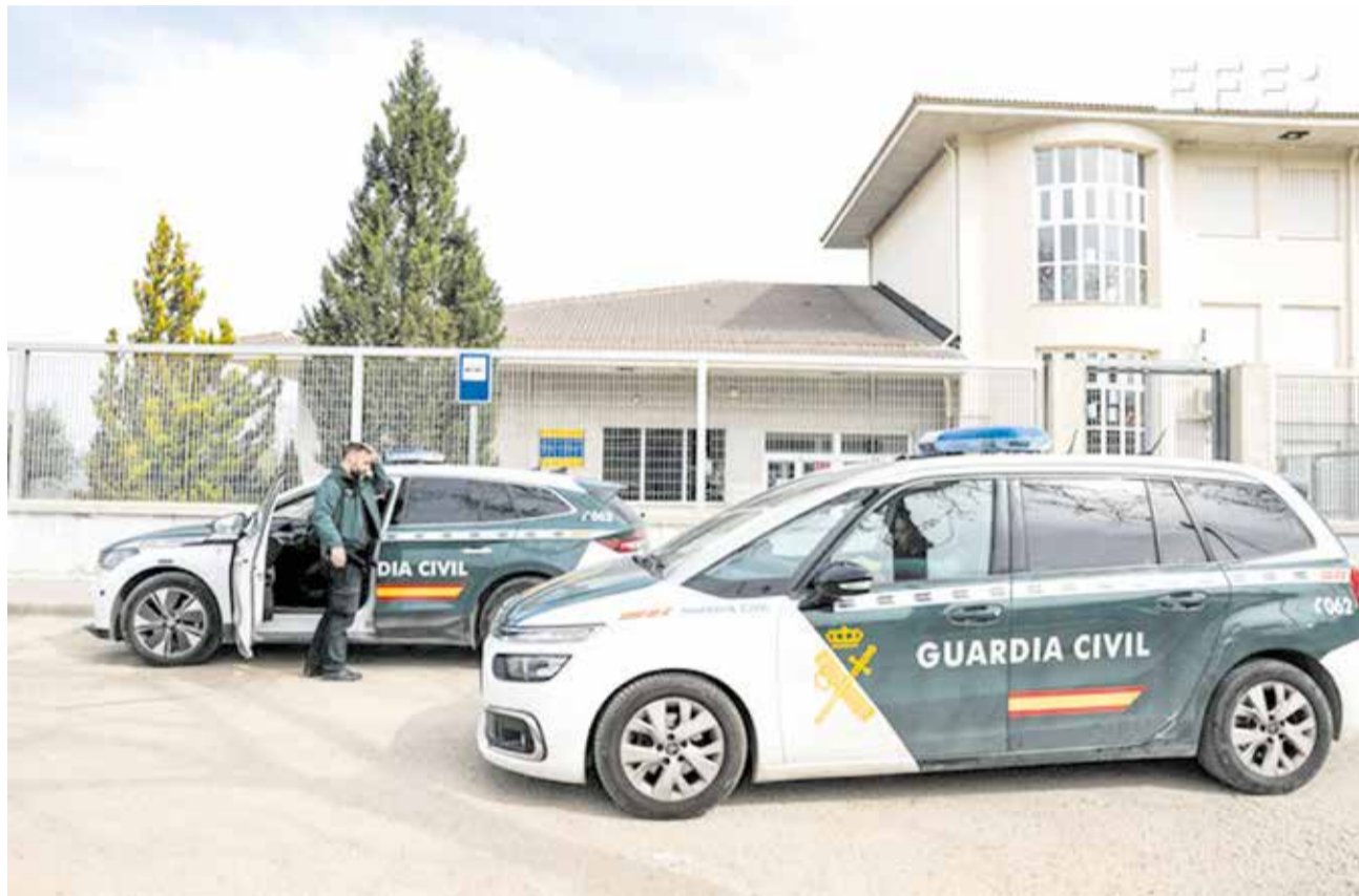
IES Marjana, en Chiva, uno de los centros escolares desalojados tras la amenaza.

El hombre aseguraba que iría armado "con varias armas de fuego" y se identificaba como miembro "de un grupo en línea conocido como 764", según el texto al que ha tenido acceso EFE.