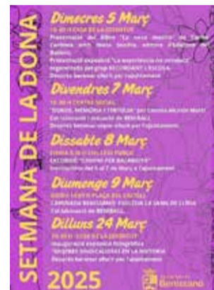
Cartell.