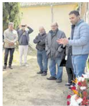
Durante el homenaje.