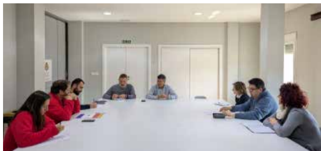
Primera reunió de la Comissió Iberfesta.