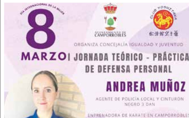
Cartel de la jornada de defensa personal. / EPDA