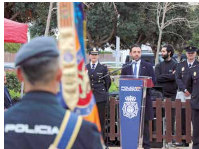
Un instant de l'acte d'homenatge.

L'acte va concloure amb un homenatge als agents caiguts en el deure i una ofrena floral a les víctimes de la DANA.