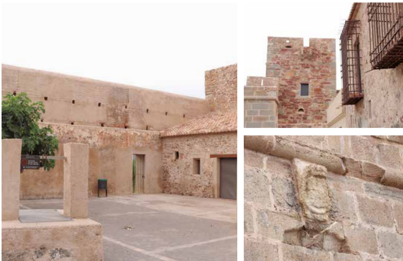
Diversos racons de la fortificació del Grau Vell de Sagunt.