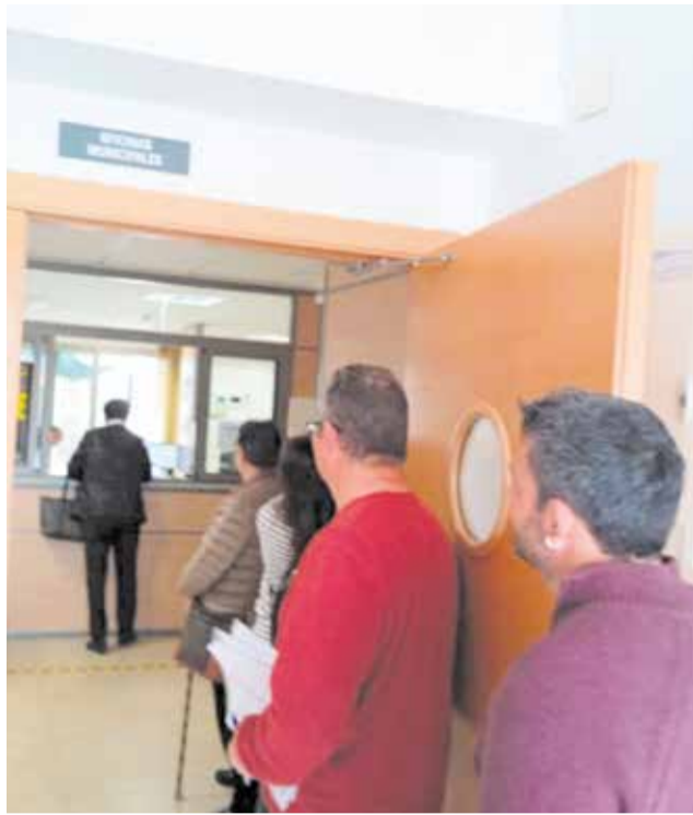
Tarjeta de transporte gratuito 'Recuperem València'.