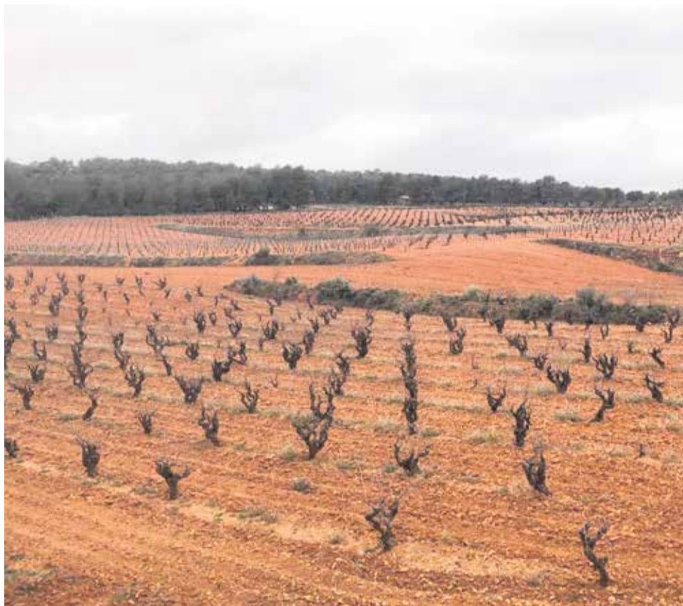
Un viñedo en la comarca de la Plana de Utiel-Requena.

agua está siendo bien recibida, especialmente en zonas del interior como el Alto Palancia, el Alto Mijares, Els Ports, los Serranos, Utiel-Requena, el Valle de Ayora-Cofrentes y la Hoya de Buñol, entre otras. En estas comarcas, donde la sequía del año pasado y de las últimas semanas ha venido castigando con dureza a los cultivos y pastos, las lluvias están contribuyendo a