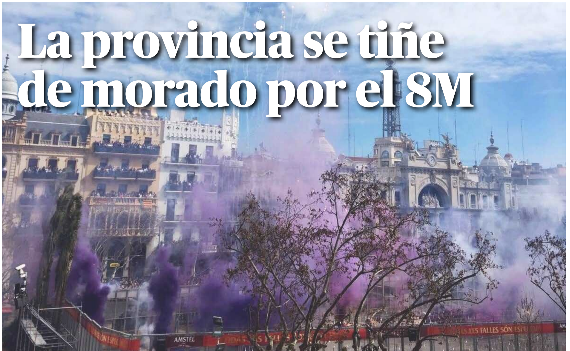
La masquetà de Valencia del día 8 de marzo acostumbra a sorprender con tonos morados con motivo del Día de la Mujer.

HACEMOS UN RECORRIDO POR ALGUNOS DE LOS DIFERENTES ACTOS QUE TENDRÁN LUGAR EN LAS COMARCAS VALENCIANAS EN EL MES DE LA MUJER