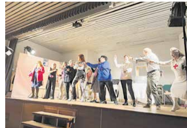
La Casa de la Cultura de Macastre se rinde ante la obra de teatro/ EPDA