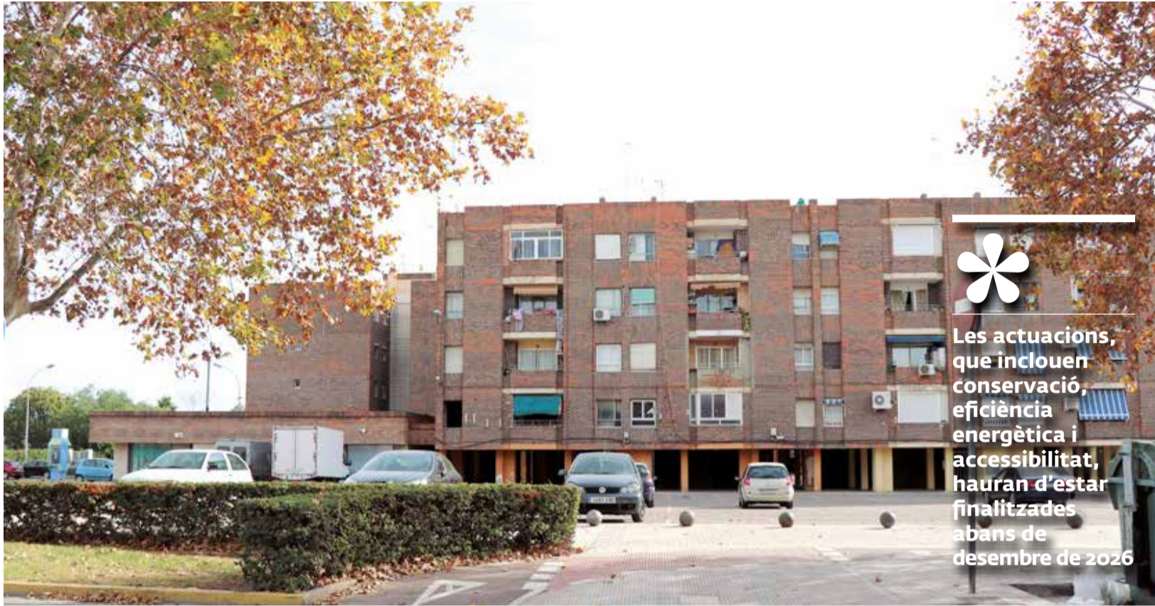
Barri de Baladre.