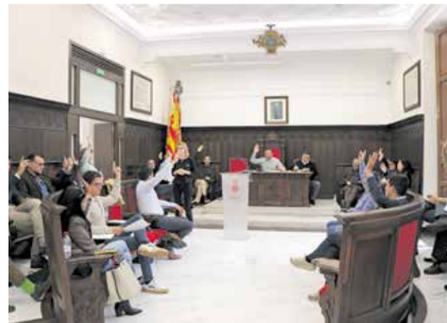
Una votació en el ple de l'ajuntament.

A més, es proposen altres mesures com la creació d'un Centre de Recuperació i Inclusió Social i Sociolaboral (CRE-SOL) per a persones amb problemes de salut mental, obres d'accessibilitat en els centres educatius, i la prolongació de la via verda fins a la mar. A nivell de transport, es demana l'ampliació de la línia 3 del metro de València fins al Port de Sagunt, així com altres millo-