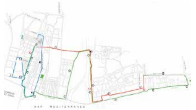
El recorregut de la carrera.