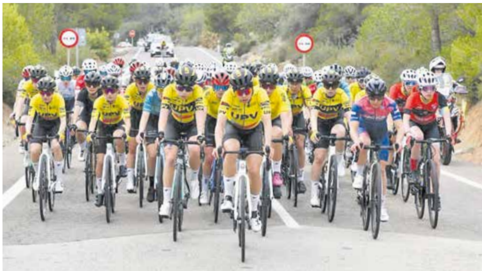
La I Clàssica del Camp de Morvedre celebrada l'any passat.