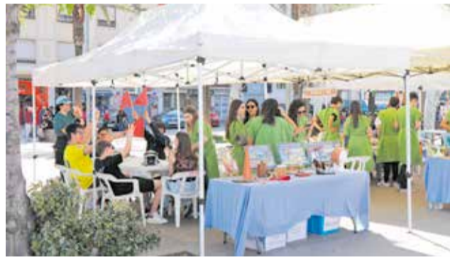
Tallers i teatre grecollatí.

Bohemia de l'IES Menéndez Pidal de La Corunya. Al llarg de la setmana es varen representar altres clàssics com Las Troyanas, Euménides, La Ilíada