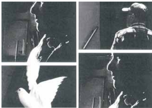
Fotografia guanyadora d'una altra edició.