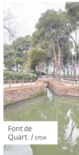
Font de Quart. / EPDA