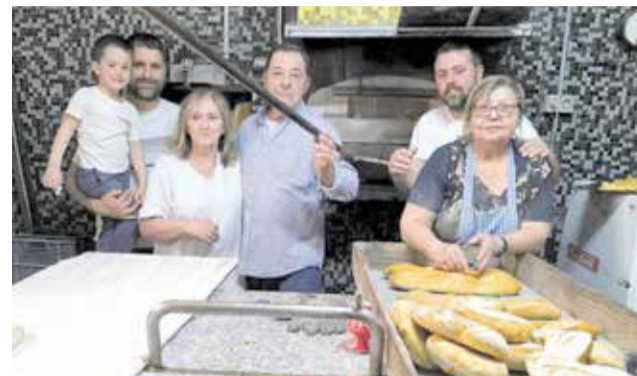
Propietaris i família del Forn Nelo.

El tancament marca el final d'una etapa de treball dur i dedicació familiar, com ha expressat el propietari, qui agraïx a la seua família per ensenyar-li l'art de "guanyar-se el pa" i a tots els