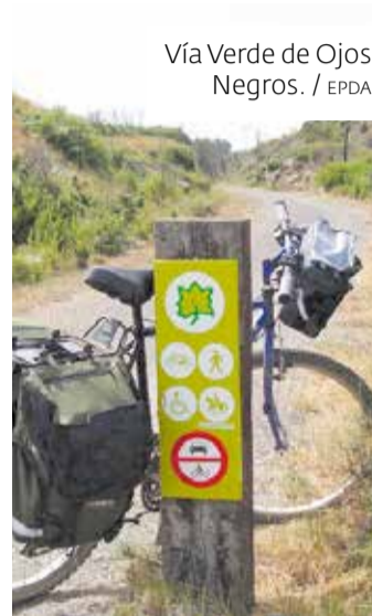
Vía Verde de Ojos Negros.