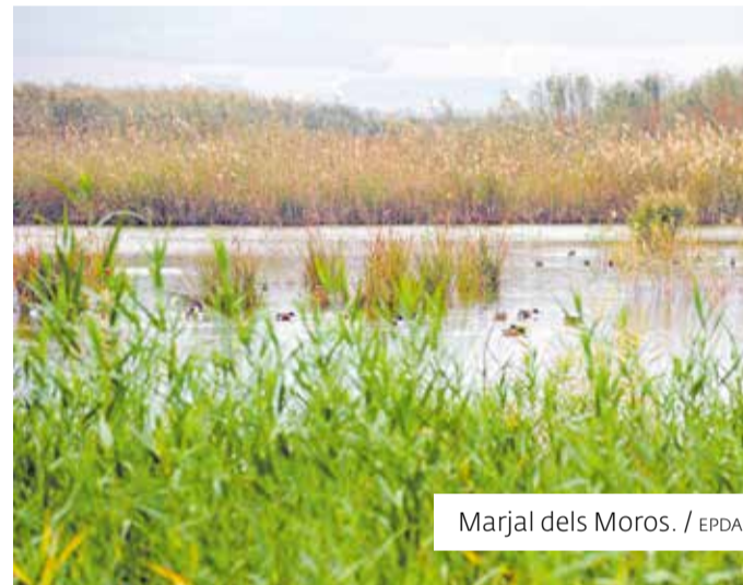
Marjal dels Moros.

do sigue el antiguo trazado del ferrocarril minero que operó entre 1907 y 1972, siendo una opción perfecta para ciclistas y senderistas.