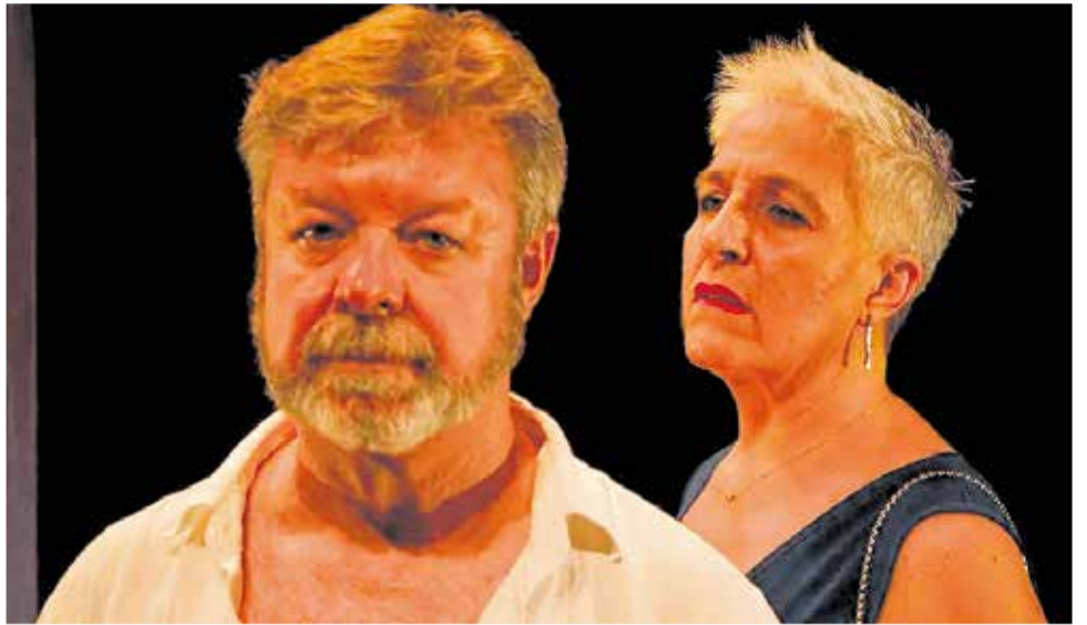
'Una carretera sense arbres', la funció del dia 30 de març a Quartell.

les principals fortaleses culturals de Quartell. Un èxit que es veurà reafirmat en esta nova edició de la Primavera de Teatre, que, sens dubte, tornarà a ser una cita ineludible per als amants del teatre en la nostra llengua.