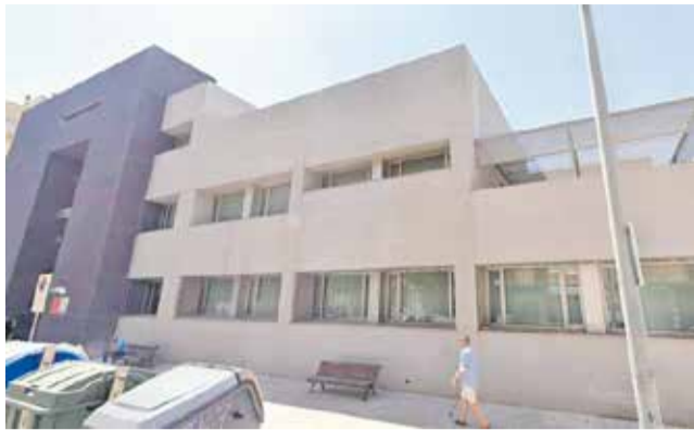
Centre de Salut II del Port de Sagunt.