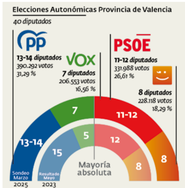
Estimación de resultado en Valencia.