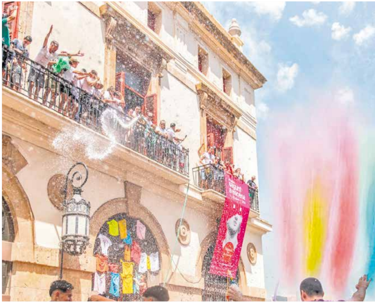
La 'xopà', un dels actes centrals de la programació de les festes patronals de Sagunt.

La festivitat té un profund arrelament cultural a la ciutat, sent un clar exemple de la seua identitat. A més, es tracta d'un conjunt de tradicions que integren música, dansa, bous, gastronomia i altres expressions artístiques que escenifiquen la riquesa cultural i patrimonial del municipi. Es tracta d'una festa que és una