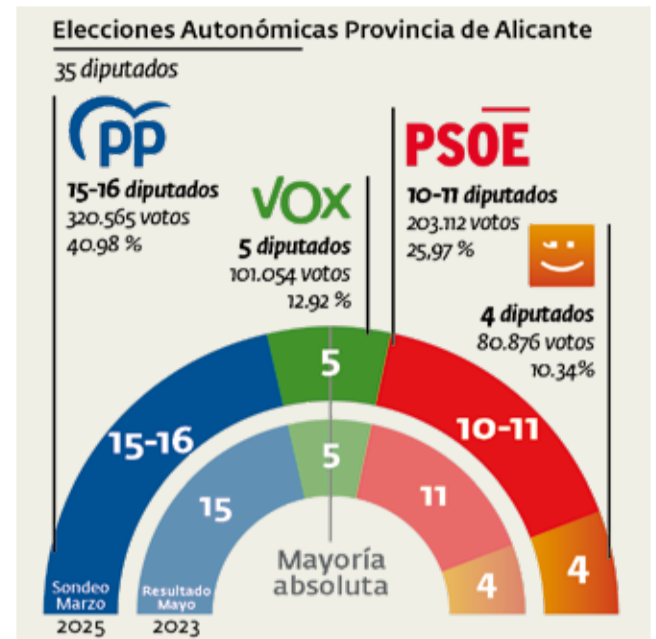
Estimación de resultado en Alicante.

fónica asistida por ordenador y panel online, con un muestreo aleatorio estratificado por sexo, edad y población, con un margen de error máximo del 3'46% y un nivel de confianza del 95'45%. El PP está mejor posicionado que en Valencia. Según esta encuesta, el PP lograría 320.565 votos (40,98%), que se traduciría en 15-16 di-