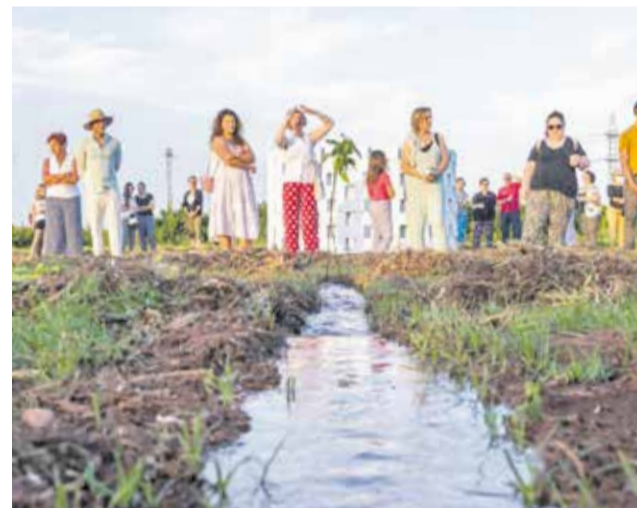
Una proposta semblant.

La Vall de Segó es converteix en l'escenari d'un espectacle únic de dansa amb Dansa València, que proposa un passeig coreogràfic pels pobles de Faura, Quartell i Quart de les Valls. L'acte té lloc el 12 d'abril. L'esdeveniment forma part de la proposta d'Hort Art, una plataforma cultural de Faura dedicada a la investigació i difusió de les arts del cos. El recorregut inclou actuacions com Pies de gallina a l'Escorxador de Faura, Hagamos pozos al Llavaner de Faura, Site-Specific a l'Era de Quartell i Atención al vacío a la Font de Quart de les Valls.