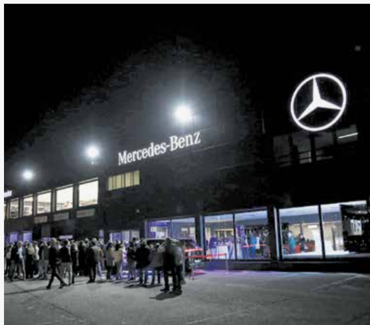
El acto de inauguración del nuevo taller autorizado.