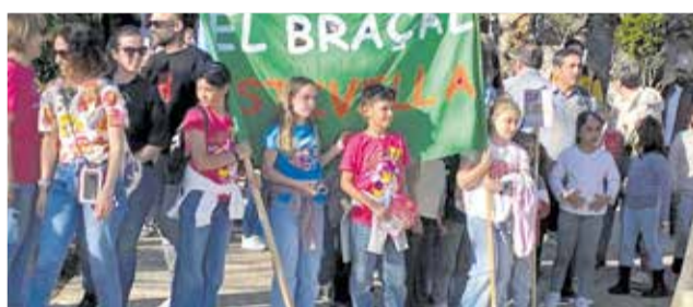
Diversos instants de les trobades.

duït per Camí de Nora i amb la participació de l'alumnat del CEIP Palància.