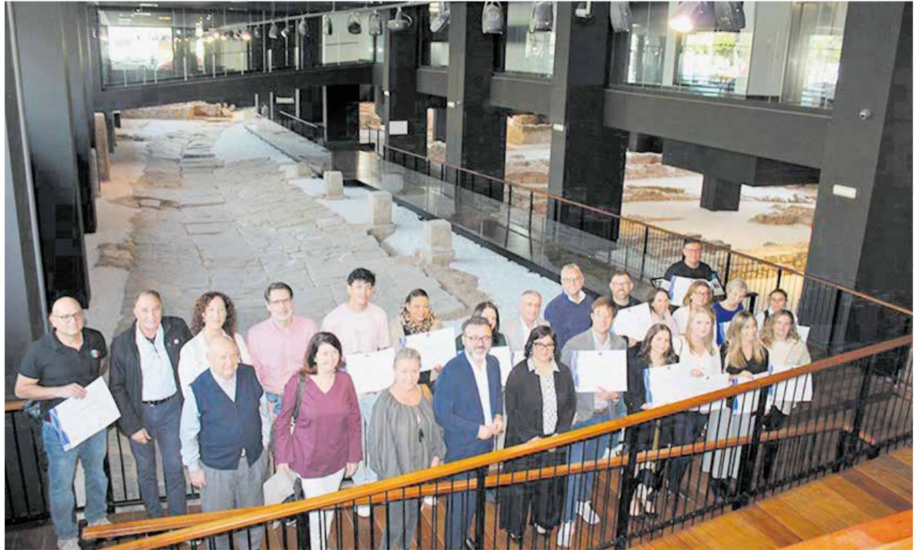
Premiats, representants i autoritats el dia de l'entrega dels premis.

Durant l'acte, Antonino va destacar que "el compromís del sector amb la qualitat és un reflex del model turístic que volem per al municipi: competitiu, sostenible i basat en l'excel·lència". També va subratllar la capacitat d'adaptació del programa: "SICTED evoluciona de la mà dels canvis en la societat i en la demanda, i això permet