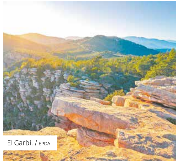
El Garbí.

La de Ojos Negros es la vía verde más larga de España, extendiéndose por aproximadamente 183 km desde Ojos Negros en Teruel hasta Albalat de Tarongers en Valencia. Este recorri-