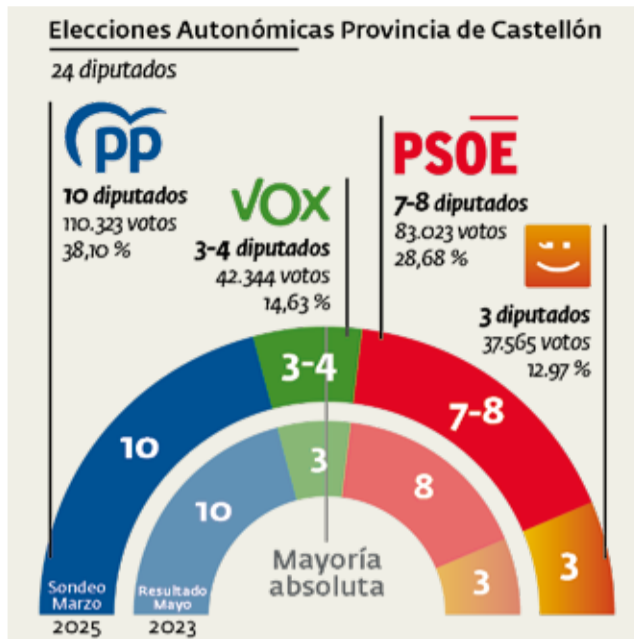
Estimación en Castellón. / JAIME SORIANO