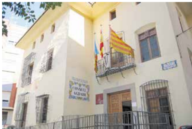
Consell Agrari, on tindrà lloc l'entrega de premis.