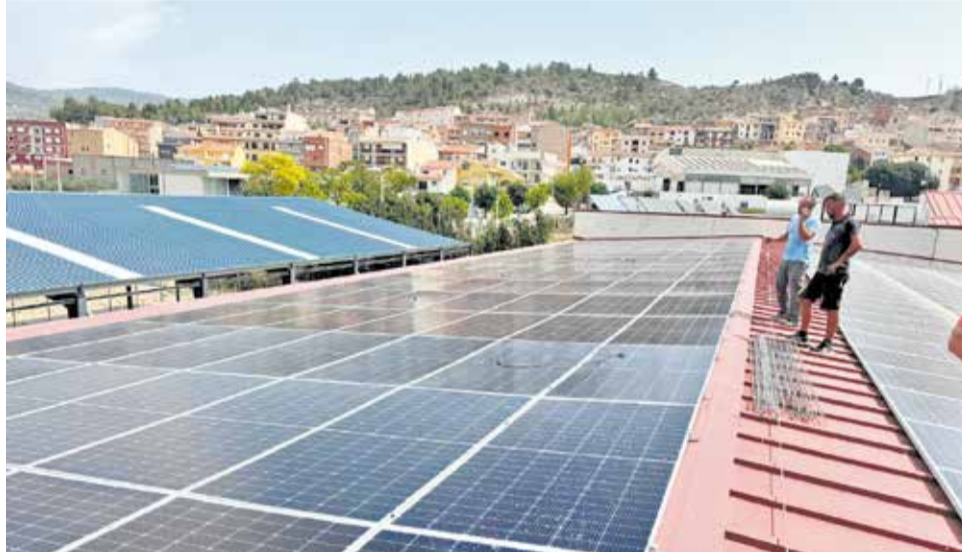
Placas solares instaladas en el polideportivo municipal de Tuéjar.

Para Tarazón, este modelo de reparto energético no solo supone una ayuda económica significativa, sino también un aliciente para fijar población en el municipio. "El objetivo del proyecto es ayudar a las familias que tienen hijos en el pueblo. También aprobamos un cheque bebé en esta línea. Atraer población y que la población joven se quede", afirma. Además, el Ayuntamiento ha garantizado la gratuidad de