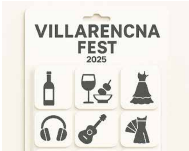
Cartel de la fiesta organizada por la Comisión.

La celebración comenzará a las 12:00 horas con la Feria de Tapas y Vinos, que se alargará hasta las 17:00 horas. Será una oportunidad perfecta para disfrutar de los mejores vinos de la comarca y de las tapas más sabrosas ofrecidas por los bares y restaurantes locales. Una propuesta gastronómica que busca poner en valor la riqueza culinaria de Villar del Arzobispo y apoyar al comercio local.