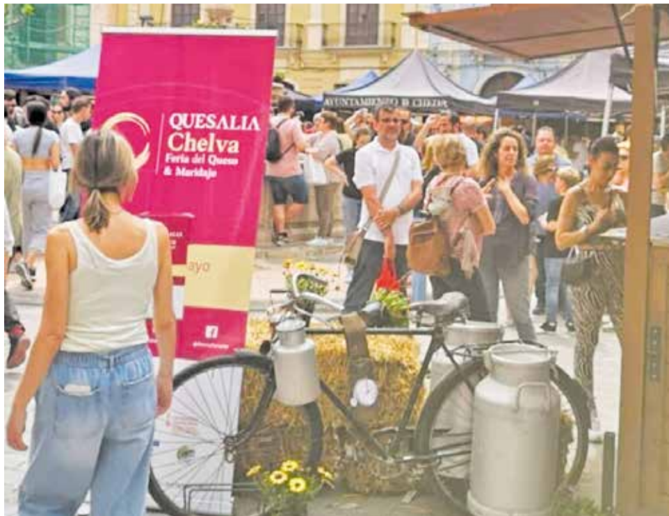
Edición anterior de la Feria del Queso de Chelva, Quesalia.

Pero Quesalia es mucho más que una feria de productos: es una experiencia. La programación paralela promete un fin de semana repleto de actividades para todos los gustos. Catas, talleres, maridajes, mesas redondas, visitas guiadas por el casco histórico, showcookings, una muestra literaria gastro-