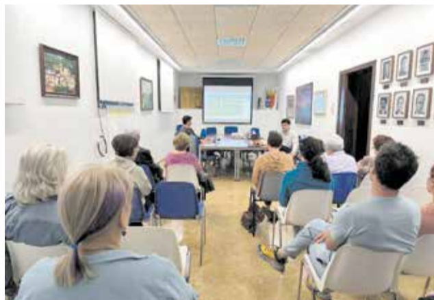
Encuentro participativo en Pedralba.

El pasado 1 de abril se celebraron en el salón de plenos del Ayuntamiento los dos primeros encuentros participativos, una jornada que marca el arranque de un proceso que busca diseñar el futuro del municipio desde una perspectiva sostenible, integrada y participativa. Durante la mañana, se desarrolló una reunión con el equipo de gobierno y personal técnico del Consistorio, mientras que por la tarde fue el turno de la ciu-