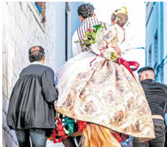
Diferentes actos de la fiesta de la Enramá de Chulilla en ediciones anteriores.

A partir de ese momento, cada noche, el sonido profundo y ancestral de las caracolas comienza a resonar por las calles del pueblo. Los mayores y sus amigos se sitúan