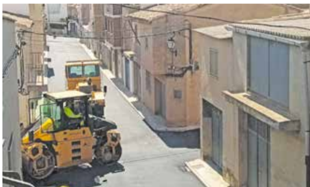
Trabajos de reasfaltado en Alcublas.