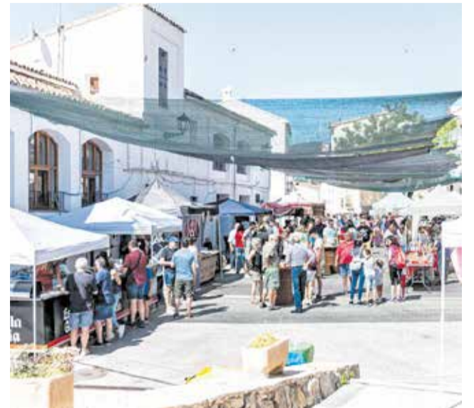
Edición anterior del Gastronomercado de Andilla.

La plaza de la Muralla de Andilla, volverá a ser el centro neurálgico de la feria andillana con una nueva edición del Gastronomercado, donde se podrán degustar y adquirir todo tipo de productos agroalimentarios y artesanales de la localidad y la comarca (así como también de otras regiones del interior de la Comunitat Valenciana o comunidades autónomas vecinas), como por ejemplo vinos, dulces, mie-