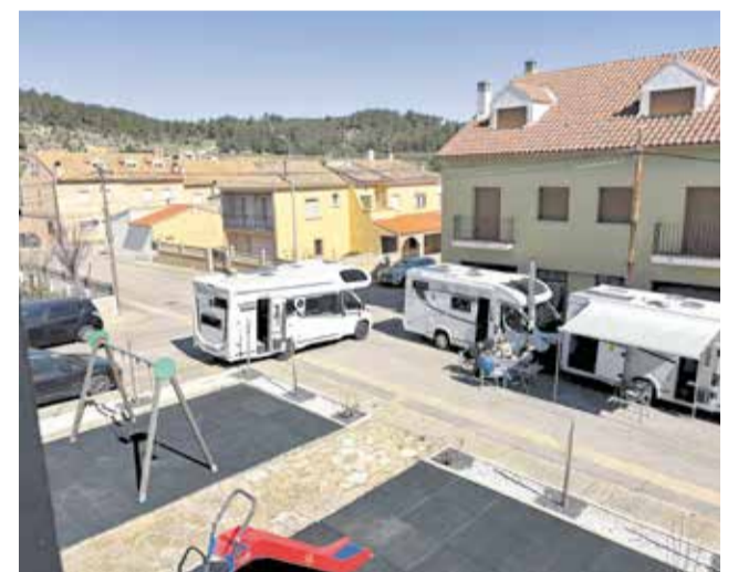
Caravanas en el certamen de Benagéber.

Durante las dos jornadas, los visitantes pudieron disfrutar de una completa programación en la que se combinaron la exposición de campers y caravanas con actividades turísticas, charlas temáticas, música, gastronomía local y un mercado de productos de empresas ubicadas en el territorio de la Reserva de la Biosfera del Alto Turia. La propuesta atrajo tanto a aficionados al caravaning como a personas que se acercaban