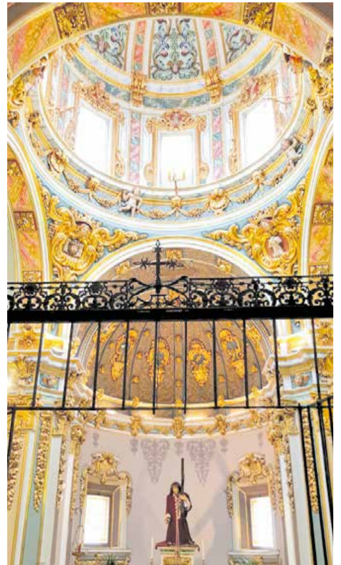
Capilla del Nazareno en Titaguas.