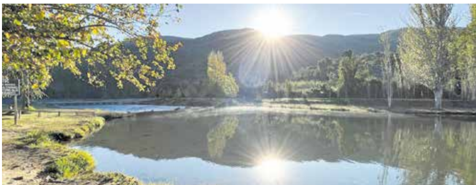
La playa fluvial de Bugarra antes (abajo) y después (arriba) de la dana.