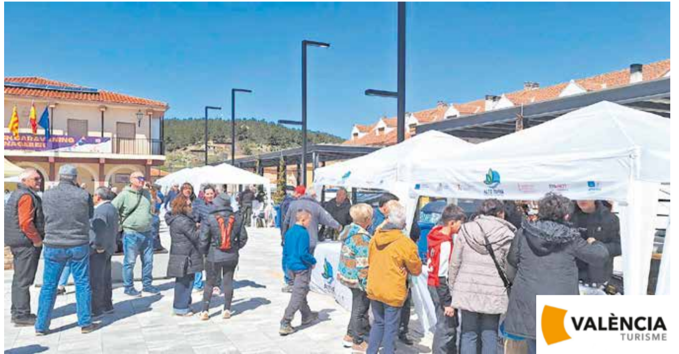
Stand de la Reserva de la Biosfera del Alto Turia en el I Certamen de Caravaning de Benagéber.

Con iniciativas como esta, la Reserva de la Biosfera del Alto Turia continúa posicionándose como un referente en la Comunidad Valenciana, destacando por su capacidad de combinar tradición, innovación y respeto por el medio ambiente.