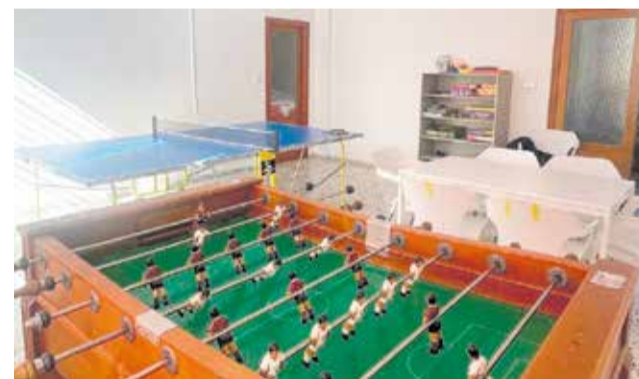
Espacio Joven de Losa del Obispo.

La adolescencia es una etapa crucial, cargada de transformaciones personales, sociales y emocionales. Por eso, disponer de un entorno seguro y estimulante no solo es una inversión en el presente, sino también en el futuro de la localidad. Los jóvenes son una pieza fundamental en la construcción del tejido social, y proporcionarles espacios adecuados permite canalizar su energía, creatividad e ideas frescas hacia iniciativas positivas.