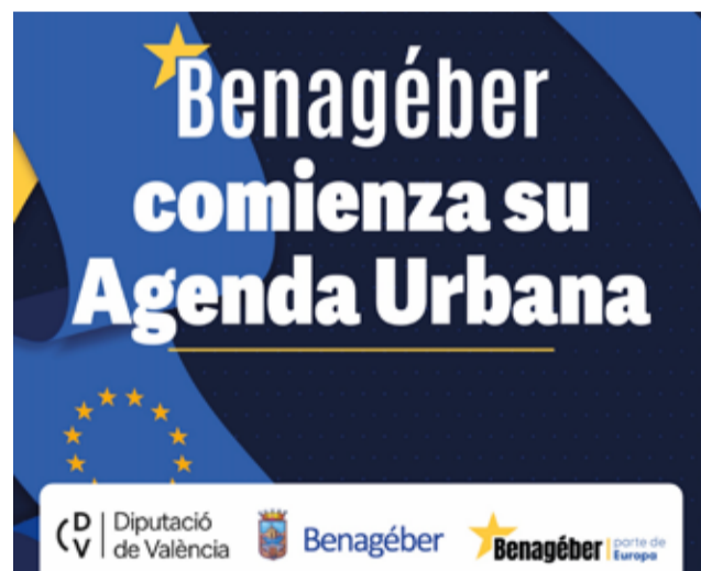
Cartel de la iniciativa.

Desde el Ayuntamiento destacan que se trata de una oportunidad para "construir un futuro que responda a las necesidades reales de nuestra comunidad", motivo por el cual se habilitarán en las