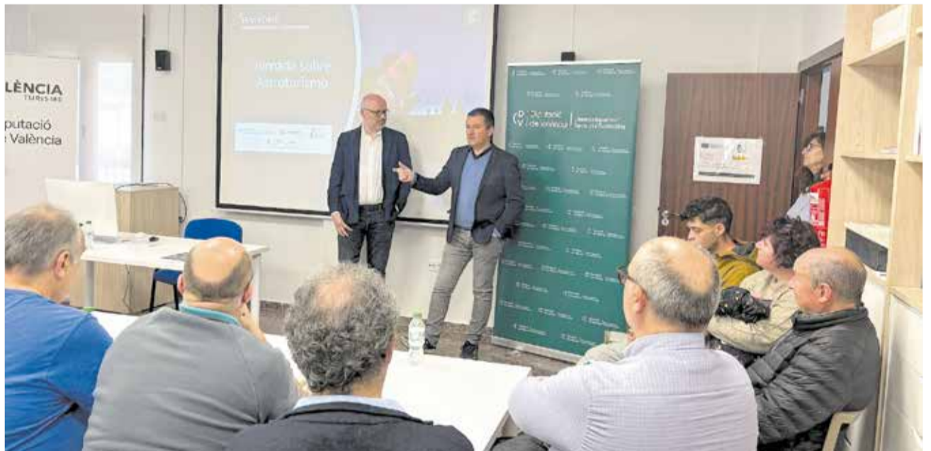
Jornada sobre astroturismo celebrada en Aras de los Olmos.

Del mismo modo, se destaca la oportunidad que representa trabajar esta iniciativa