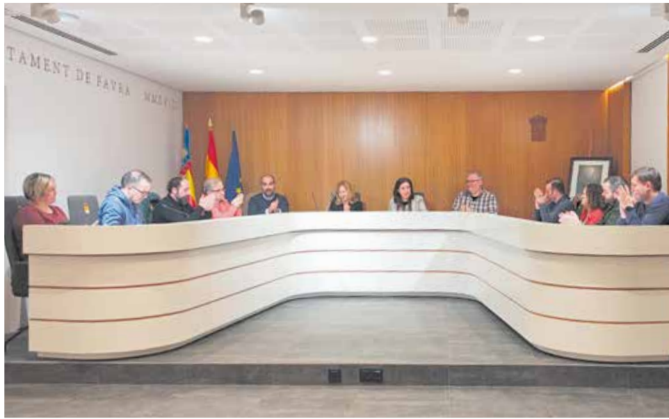
Ple de l'Ajuntament de Faura.

El document, que ha sigut acuradament adaptat per a respondre a les necessitats específiques de cada un dels departaments municipals, ha