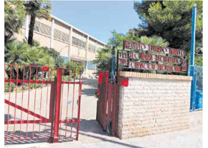
CIPFP Eduardo Merello del Port de Sagunt.