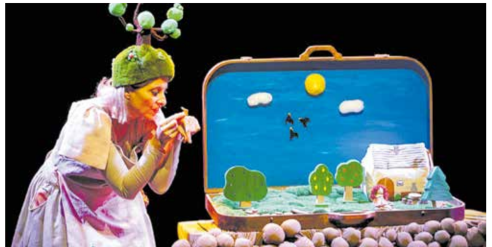
'Oreto i les formigues', una obra d'animació lectora per als més menuts.

Pel que respecta a la música, el primer dels actes organitzats és la presentació del Mapa de Creadores de la Música, escrit