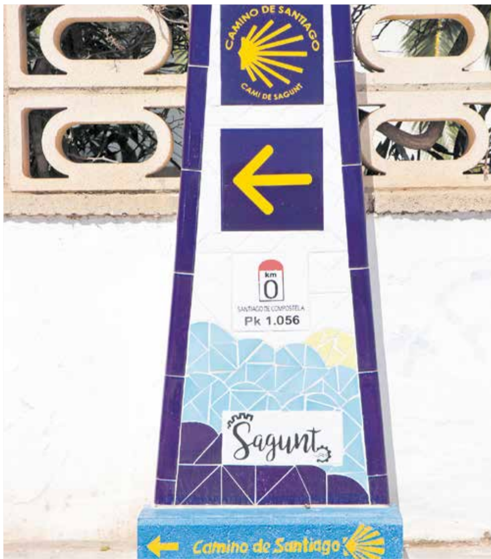
El monòlit del Camí de Santiago a Sagunt.

dos anys no pensàvem arribar ací", va manifestar.