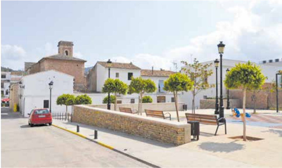
Parc de la Plaça del Poble d'Algar.

APROVADES LES MILLORES EN EL POLIESPORTIU DE CANET O LA RENOVACIÓ D'UNA PLAÇA A ALGAR