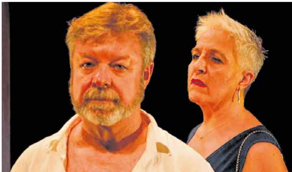
'Una carretera sense arbres', la funció del dia 30 de març a Quartell.

les principals fortaleses culturals de Quartell. Un èxit que es veurà reafirmat en esta nova edició de la Primavera de Teatre, que, sens dubte, tornarà a ser una cita ineludible per als amants del teatre en la nostra llengua.