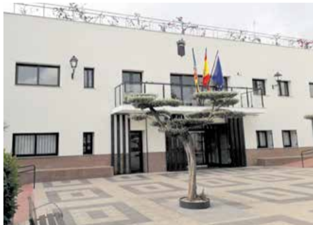
Façana de l'ajuntament de Faura. / EPDA

La mesura es planteja com una solució per gestionar de manera responsable i ètica la població felina del municipi de Les Valls, evitant possibles problemes de salut pública i assegurant el benestar dels animals. L'alcalde de Faura, Consol Duran, ha destacat la importància de la col·laboració entre els ajuntaments dels municipis veïns de la comarca: "Tots els ajuntaments ens hem posat d'acord per gestionar-ho d'igual manera, ja que els animals no coneixen de fronteres. Hem anat tots els pobles