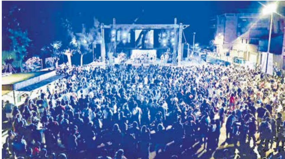
Un acte de les festes de l'any passat a Faura.

Davant la dissolució de la Comissió, l'Ajuntament ja ha començat a treballar amb els diferents col·lectius implicats per buscar la millor manera de garantir el desenvolupament de les festes i evitar que la falta de la Comissió afecte el programa festiu. Així mateix, el consistori ha demanat a la Comissió els comptes i ha explicat que els beneficis obtinguts de loteries, rifes, bingos, festes i altres activitats hauran de ser ingressats