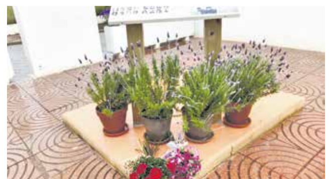
Diverses instantànies de l'acte commemoratiu.