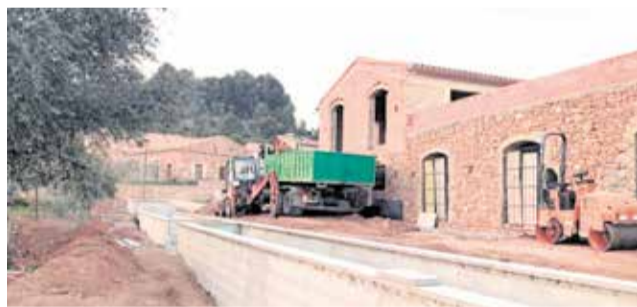
La propiedad afectada.