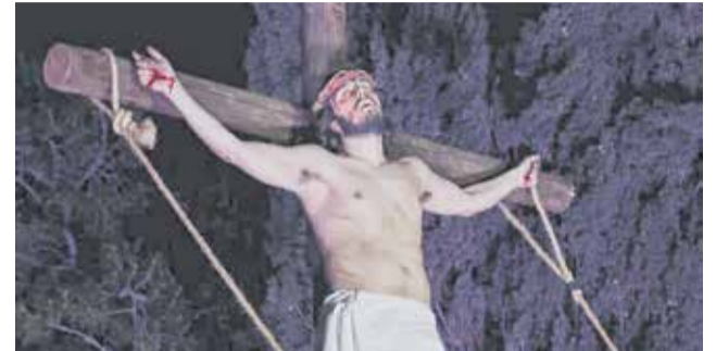
Misteri de la Passió de Moncada.

La proposta busca recuperar l'esperit de les representacions tradicionals, combinant simbolisme religiós i posada en escena en un itinerari que portarà al públic per diferents escenes dels últims moments de la vida de Jesús.