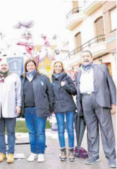
Policia Local va desplegar set patrulles amb un total de 18 agents, que van treballar conjuntament amb els Bombers per garantir la seguretat de la ciutadania.