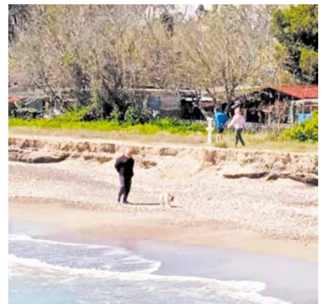
Escaló en una platja de la comarca.

acumuladas por los temporales o la mejora del acceso al mar para personas con movilidad reducida. En la playa de Malvarrosa, la regresión ha dejado expuestas viviendas y otras infraestructuras, lo que hace urgente un mantenimiento adecuado. La plataforma vecinal asegura que seguirá movilizándose para exigir soluciones efectivas y duraderas para proteger las playas.