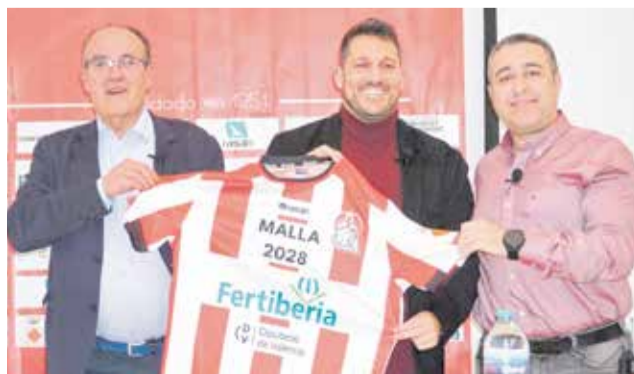
Presidente, entrenador y concejal.