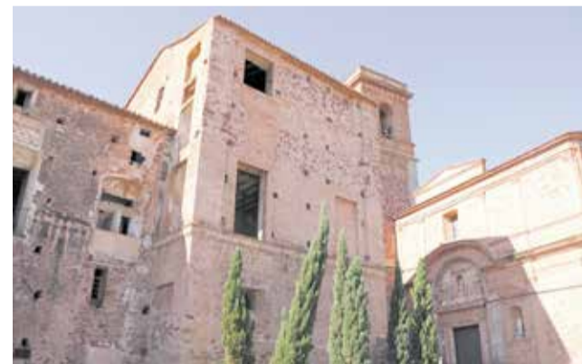
Palau Vives de Banyamàs.

El Palau Vives de Banyamàs de Benifairó de les Valls és una joia de l'arquitectura civil del Renaixement valencià. Construït a principis del segle XVII per Joan Lluís Vives de Banyamàs, qui va encarregar l'arquitecte italià Andrea Lurago i altres artistes per a la seua edició, el palau destaca per la seua planta quadrada amb pati central i torres als quatre cantons. Representa un exemple únic de l'arquitectura civil renaixentista a la Comunitat Valenciana.