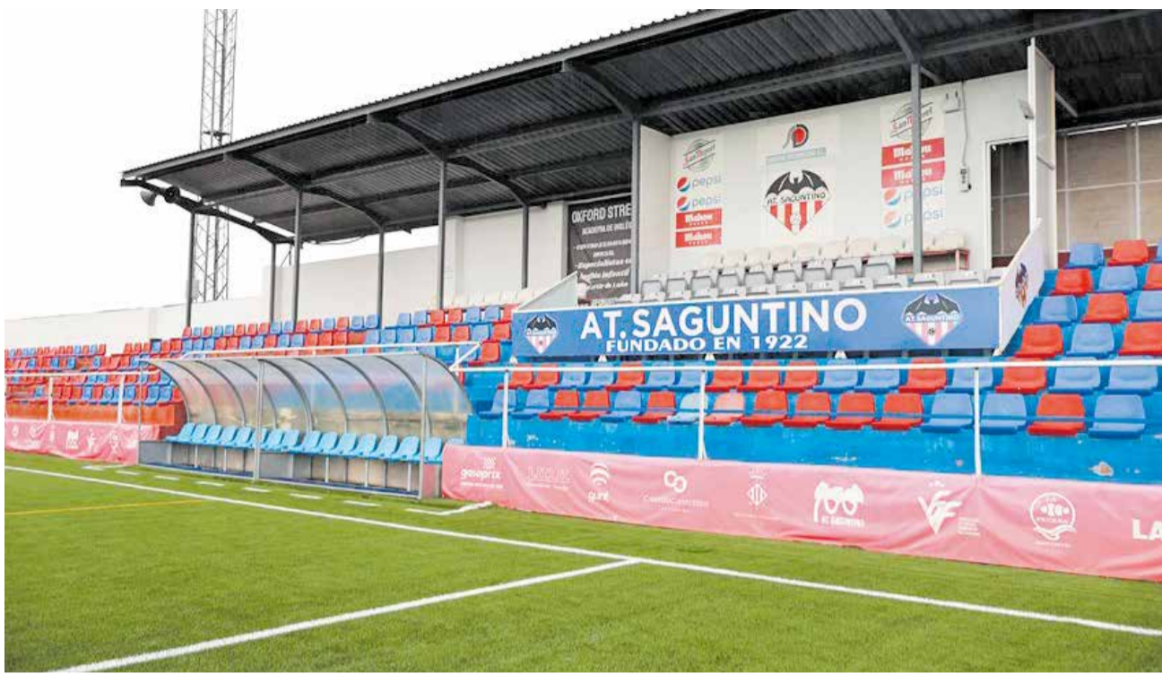
El Nou Camp de Morvedre després de les obres recents.