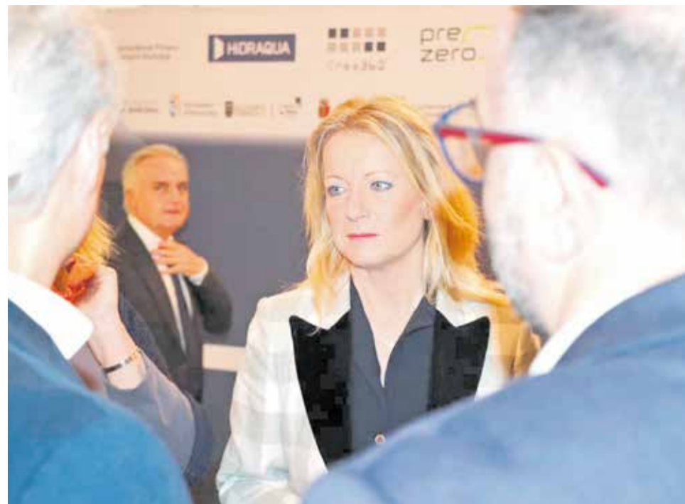
La presidenta, en un acto reciente.

► Totalmente. Tenemos claro que necesitamos una es-