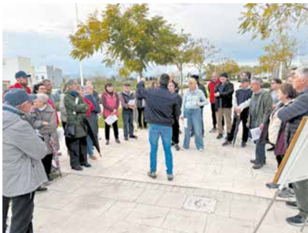
Reunión de vecinos en Ferroland esta semana.