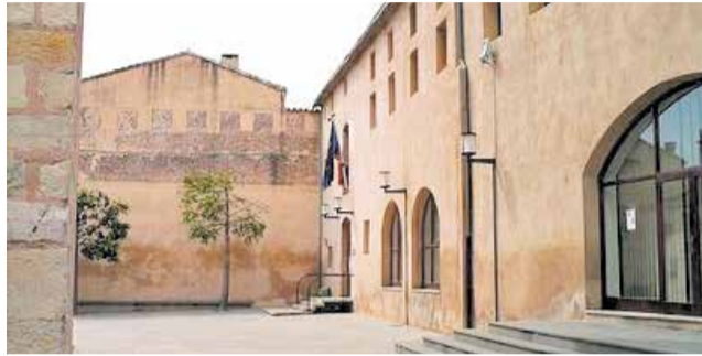
Loc on tindrà lloc l'activitat.

Durant tota la jornada, els assistents podran descobrir i participar en partides de jocs clàssics, moderns i per