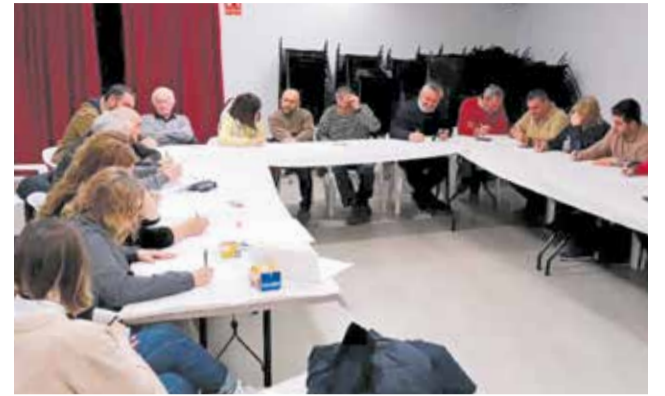
Un instant de l'encontre.