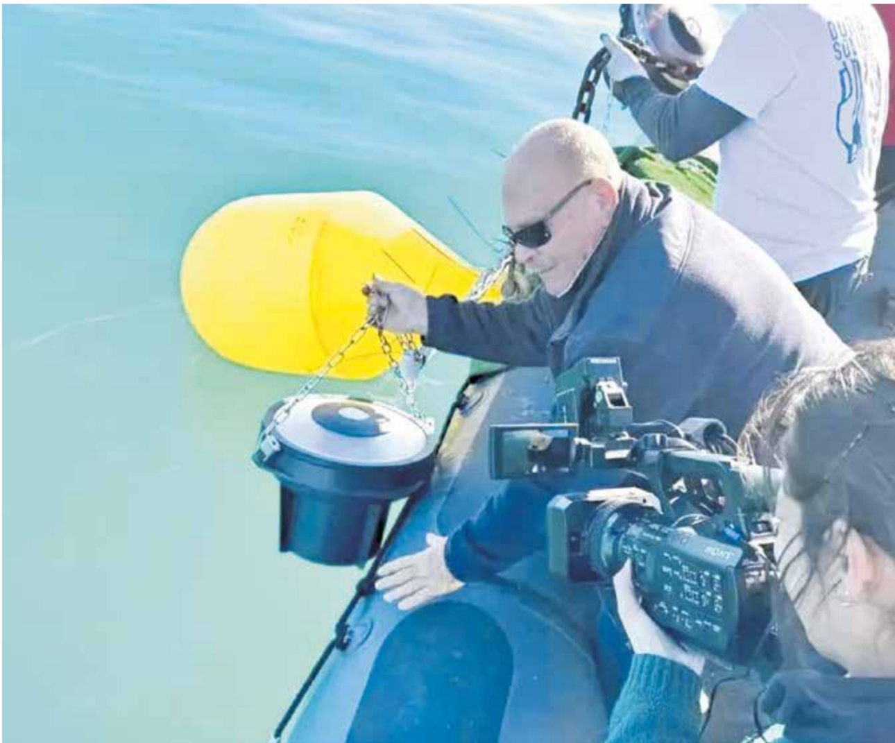
Primer lanzamiento de una boya inteligente en Canet para obtener los estudios preliminares.

El sistema que se va a implantar recoge y procesa datos sobre el fondo marino con los que generar modelos para poder analizar y predecir el impacto de temporales sobre la playa y el grado de eficacia de los arrecifes artificiales en relación con la protección del sedimento marino. Como actualmente el mercado no ofrece ningún dispositivo capaz de realizar este trabajo, el Ayuntamiento de Canet d'en Berenguer y la multinacional Satlink -que cuenta con una experiencia de más de 30 años en el desarrollo de soluciones tecnológicas para el segmento pesquero-, han desarrollado conjuntamente el software necesario.