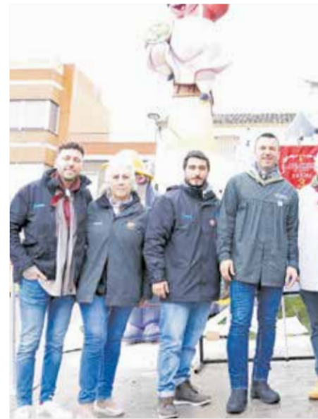
Diversos instants de les Falles del Camp de Morvedre.

La neteja durant la Nit de la Cremà va ser especialment destacada, amb l'eliminació de 12 tones de cendres i el manteniment de les infraestructures en perfectes condi-