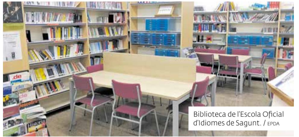
Biblioteca de l'Escola Oficial d'Idiomes de Sagunt.

Combinen metodologies actives i activitats culturals per fer de l'aprenentatge de llengües una experiència única. A més, durant aquests trenta anys, l'EOI Sagunt ha format part de projectes d'innovació com, per exemple, el projecte COEDUCA, el Portfoli Europeu de les Llengües o EOISagunt Ràdio,