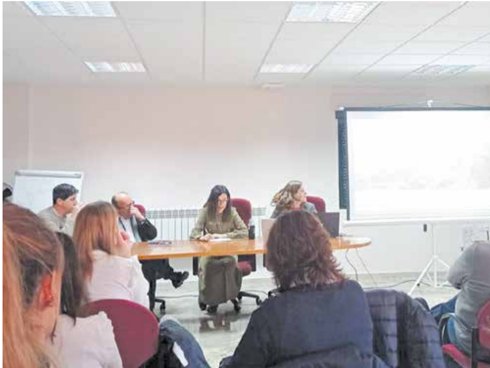
Presentación del Plan Estratégico de Turismo del Rincón de Ademuz.

La cita ha reunido a las diferentes alcaldías y representantes institucionales de la comarca, personal técnico de la Mancomunidad y parte de los asistentes que participaron en las mesas de trabajo y entrevistas para la elaboración del Plan, entre los que se encuentran representantes de asociaciones, empresarios y profesionales del turismo.