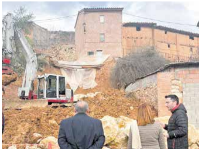
Visita a los trabajos.

Las obras se están ejecutando tras el desprendimiento del vial y del muro de contención ocurrido hace unas semanas, un incidente que provocó importantes daños estructurales aunque, por suerte, sin víctimas. Desde el