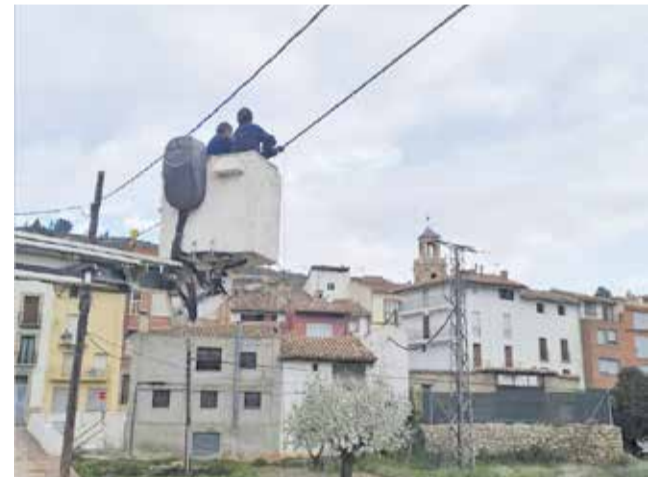
Dos técnicos en Casas Bajas.

Este mismo modelo de conectividad se está implantando durante esta semana en Ca-