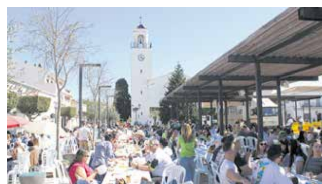
Asistentes a la tradicional paella gigante.

La jornada festiva comenzó con la primera edición de la RunCáncer en el municipio, que recaudó cerca de 2.000 euros destinados a la lucha contra el cáncer.