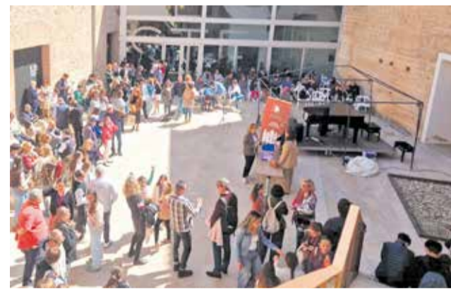
IV Pianofest a Riba-roja de Túria.

D'altra banda, l'Ajuntament de Riba-roja, a través de l'àrea de Cultura, ha posat en marxa una nova iniciativa cultural: "Un Castell de Música".