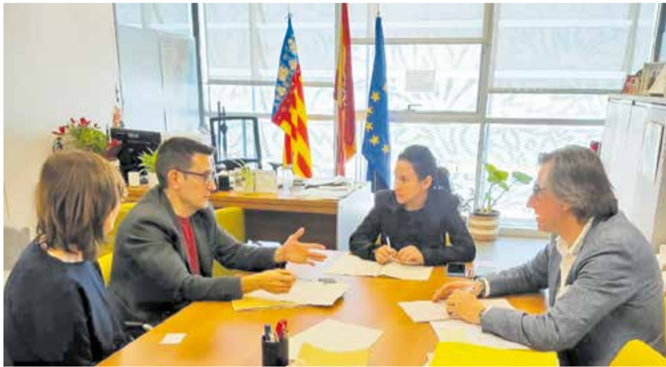
Reunión con altos cargos de la Conselleria de Servicios Sociales.

Por su parte, la Conselleria ha garantizado que concertará y financiará las 60 plazas del centro una vez esté completamente equipado y