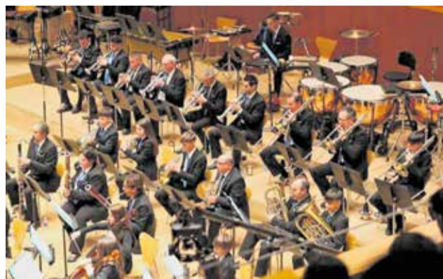
'La Familiar' al Palau de la Música de València.