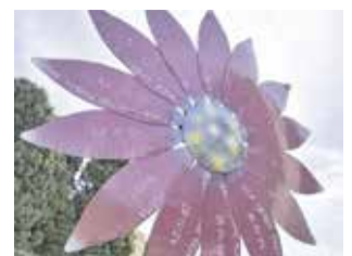
Escultura a Benissanó.