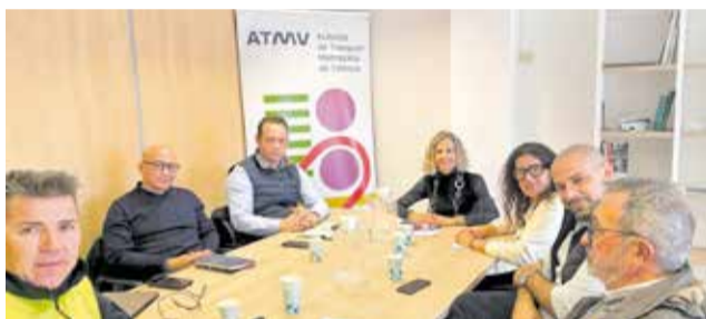
Reuniones mantenidas por el Consistorio.

tonómica debería estar terminado antes de finalizar la legislatura.