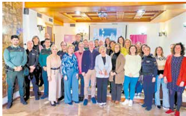
Homenatge als equips en l'ajuntament.