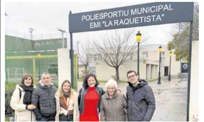
El polideportivo de Casinos luce nuevo nombre.