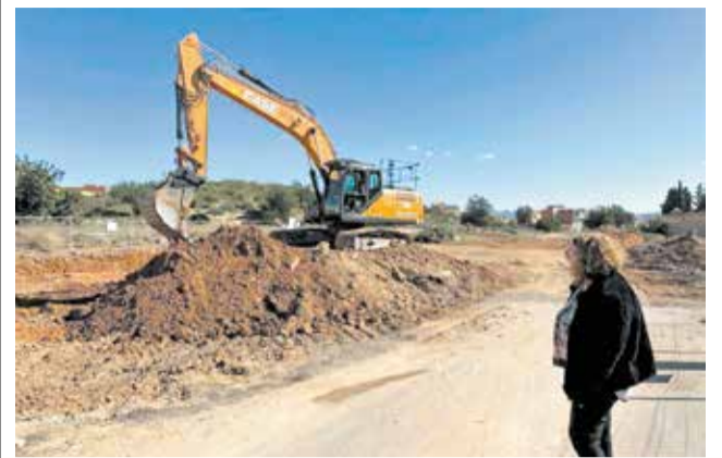
Trabajos en el cementerio de Benaguasil.