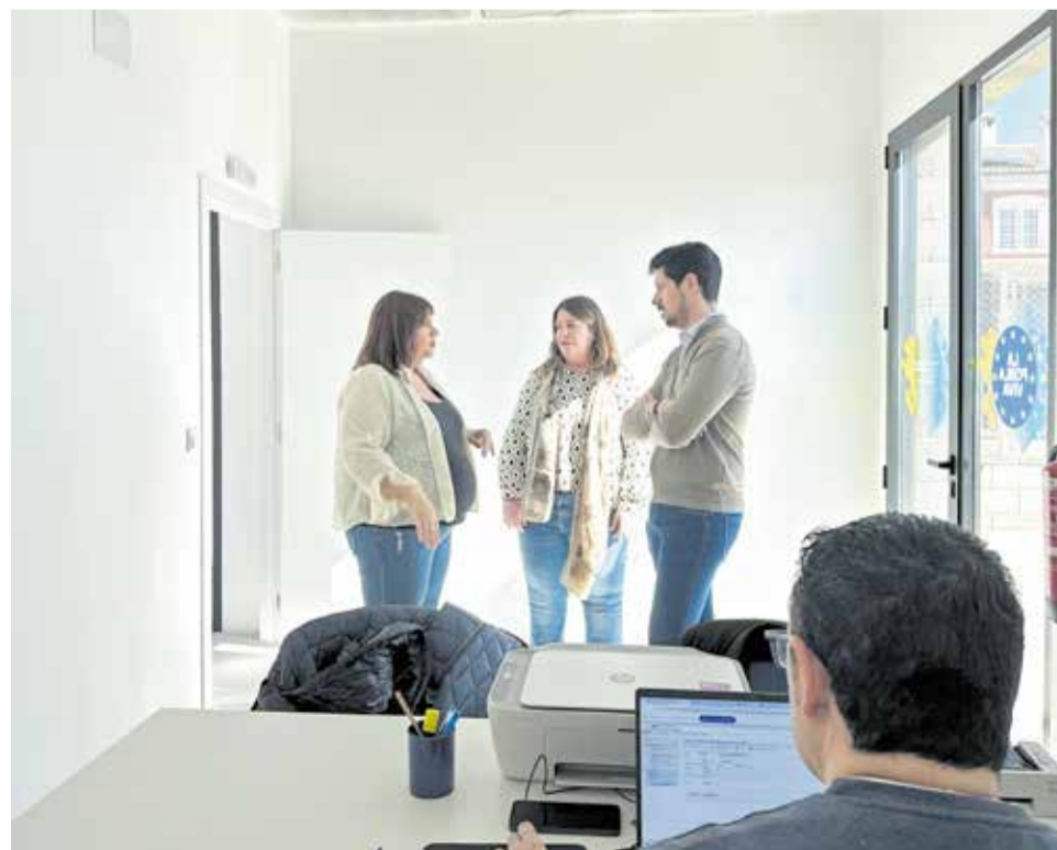
Nueva oficina móvil de atención ciudadana de la Pobla de Vallbona.

cha que hay entre el casco urbano y las urbanizaciones” y que para ello “se desplazará una persona de la OAC hasta los centros sociales, en horario de 9 a 12 horas, para que puedan hacer los mismos trámites que en el consistorio”. “Empezamos con este horario y ubicaciones, pero el servicio puede ampliarse o modificarse según la acogida que vaya teniendo” ha señalado Rubio.