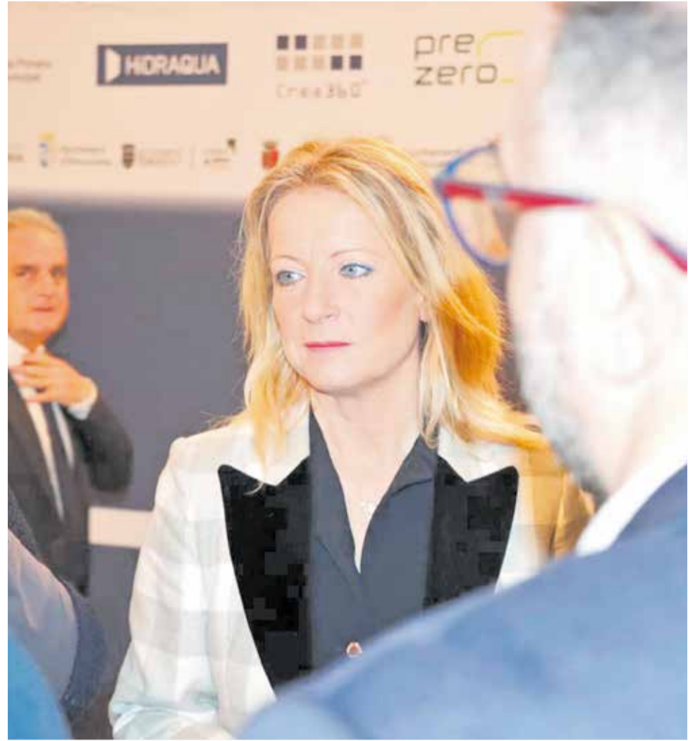
La presidenta, en un acto reciente.

► Antes le he comentado que posiblemente la FVMP no sea tan conocida entre la ciudadanía como otras instituciones. ¿Cree que es necesario acercarla más con más acciones de comunicación o con campañas divulgativas?