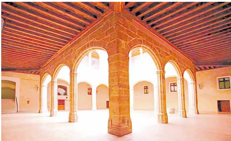
El Castell d'Alaquàs acaba de complir el centenari de la seua recuperació.

El castell de Bejis també avança amb la seua restauració. Amb la segona fase en marxa, es busca consolidar la seua estructura i millorar l'accessibilitat, assegurant el seu futur com un motor de desenvolupament turístic per a la comarca.