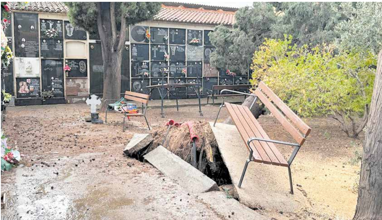
Estado del cementerio municipal de Benaguasil tras el paso de la dana del pasado 29 de octubre.