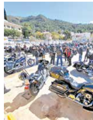
Concentración de motos.

El colofón al acto fue la actuación del mago Willy, quien