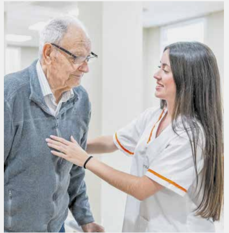
Cuidados en la residencia DomusVi Jardines de Lliria.

Desde que la persona comienza a vivir en el centro y durante toda su estancia, el acompañamiento a las familias es fundamental. "Es algo que cuidamos mucho, la cercanía, transparencia e in-