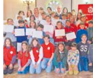
Acte de constitució. / EPDA