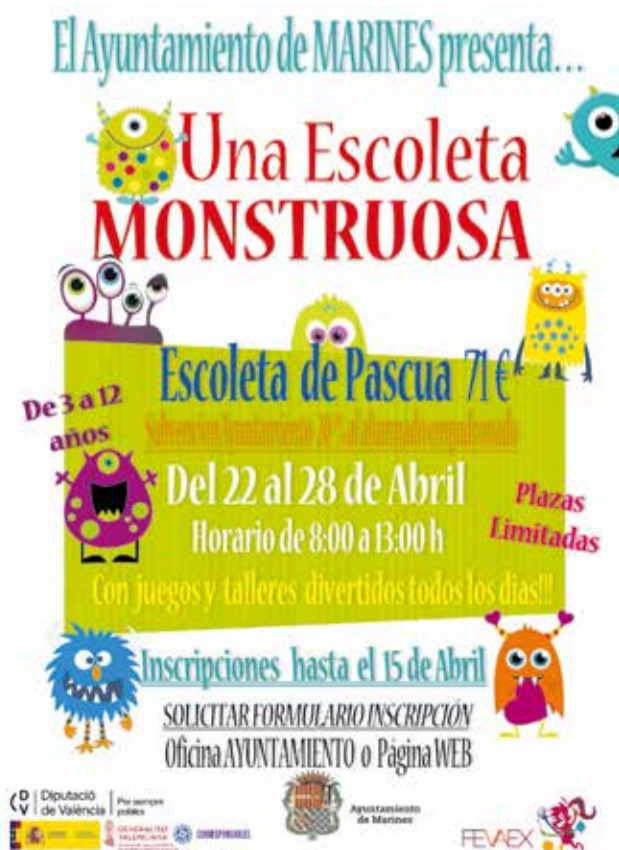
Cartel informativo de la Escoleta de Pascua.

El miedo es una emoción básica que nos acompaña desde pequeños. De nada sirve explicar desde la lógica, que no tienen que tener miedo, que no existen los fantasmas, ni los monstruos. Con esta Escoleta de Pascua, se realizarán diferentes juegos y talleres monstruosos-