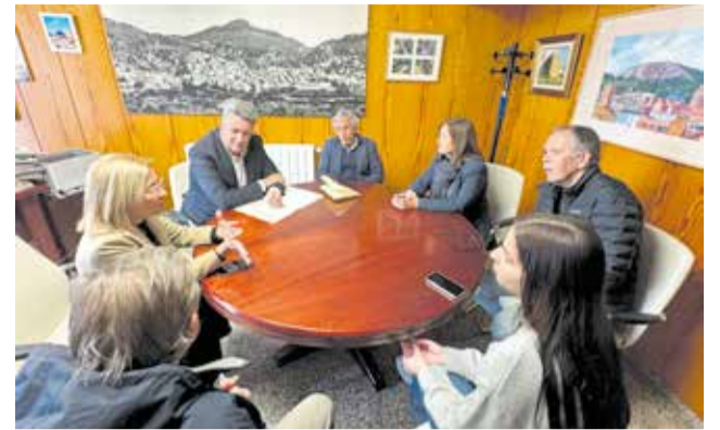
Un instant durant la reunió a l'ajuntament.