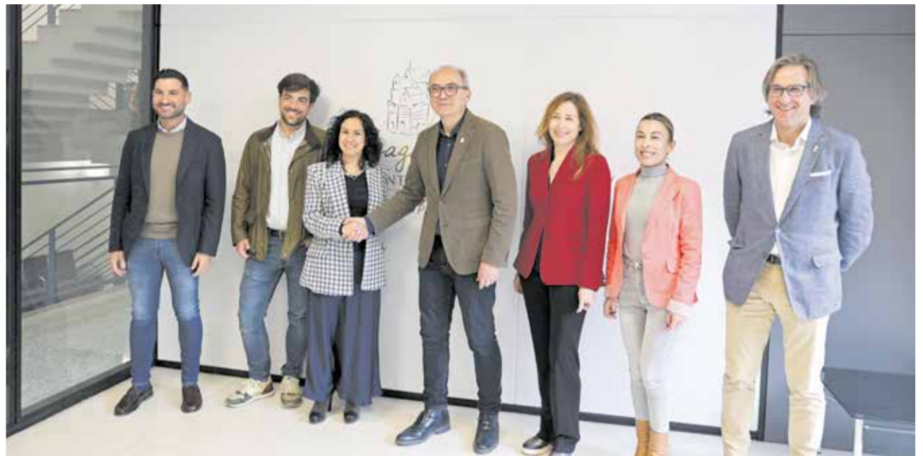
Visita de autoridades de la Generalitat en el ayuntamiento de Benaguasil.

funcionamiento cuanto antes, puesto que se trata de un servicio fundamental que venimos reclamando desde hace dos legislaturas. El Centro de Día garantiza el bienestar y la calidad de vida de las personas mayores de Benaguasil y de sus familias y la pretensión del gobierno municipal es abrirlo a finales de 2025 o principios de 2026".