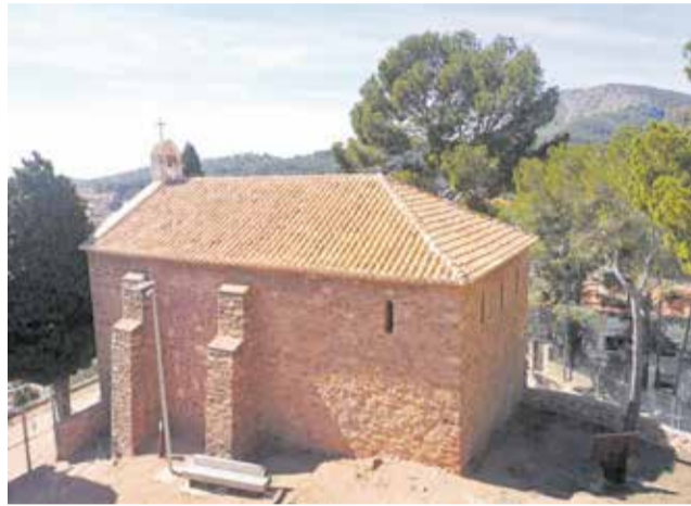
Estat de l'ermita després dels treballs.

L'alcalde de Serra, Alicia Tusón, comenta que "la restauració de l'ermita no podia esperar més, era un compromís adquirit amb la ciutadania i que sufraguem amb fons propis". L'alcaldeessa afegix que ja s'està treballant per poder escometre l'interior del temple en una segona fase que ja té consignació al pressupost. A més a més, comenta que "les intervencions són possibles gràcies al conveni