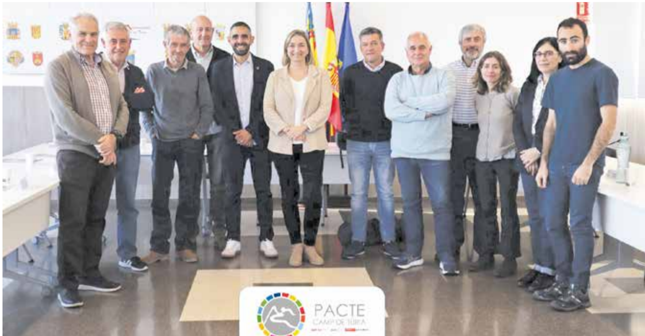
III Mesa d'Agricultura del Camp de Túrria celebrada a la seu de la Mancomunitat.

La taula de treball del sector agrari ha plantejat la necessitat que té el sector de personal qualificat i forma-