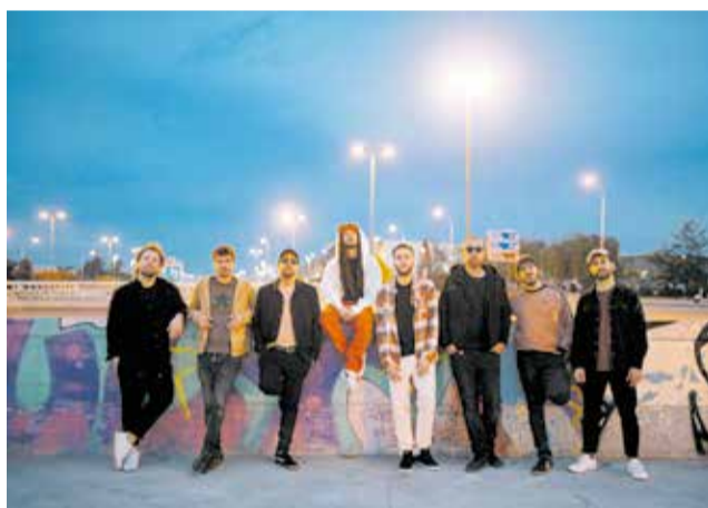
Rogativa de Sant Vicent (dalt), grup Auxili (esquerra) i espectacle 'Trash!' (dreta).

ens reunixen al voltant dels nostres costums per a compartir amb els nostres veïns i veïnes, i totes les persones que ens visiten, estes jornades d'alegria i germanor".