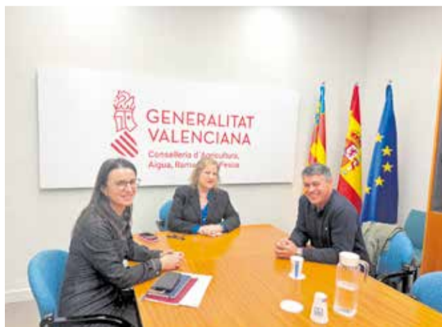
Un instant durant la reunió a la conselleria.