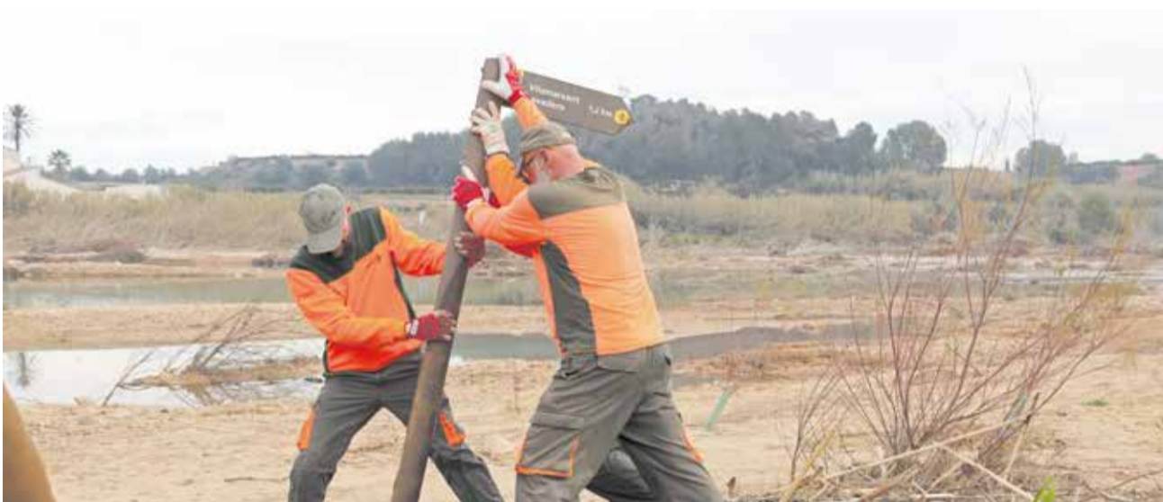
Trabajos de limpieza en el cauce del Turia en Vilamarxant.