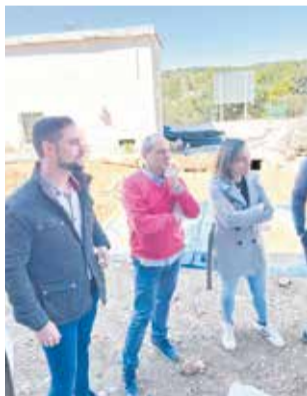
Visita a las obras.

También se está ejecutando una obra de conexión del pozo de La Forqueta con la tubería que alimenta el depósito de Mont-Ros, así como la instalación de sistemas de monitorización, control y alarma en tiempo real, en los