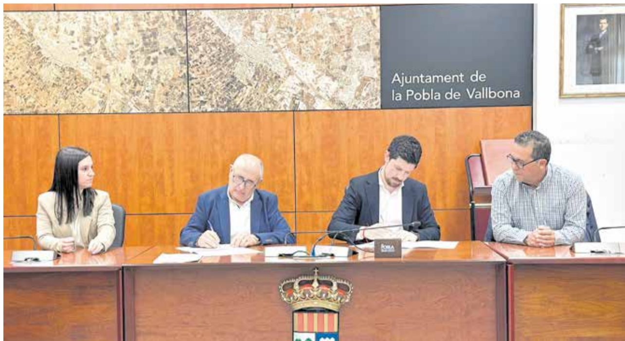
Un instante durante la firma del convenio en el ayuntamiento de la Pobla de Vallbona.

Concretamente, el plan urbanístico contempla la construcción de 434 nuevas viviendas unifamiliares, de las cuales un 30% de las mismas se destinarán a viviendas de protección oficial, es decir, alrededor de 110 viviendas. Además, se proyectarán nuevas dotaciones y zonas verdes en el municipio del Camp de Túria.