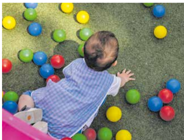
Instalaciones y actividades del Colegio Entrenaranjos International School de Riba-roja de Túria.

un arenero y zonas de césped para correr, jugar y relajarse. Además de dos piscinas para su uso en verano.