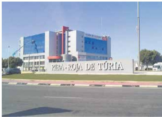
Rotonda d'accés a un polígon de Riba-roja.

Precisament, el sector dels serveis i la logística empre-