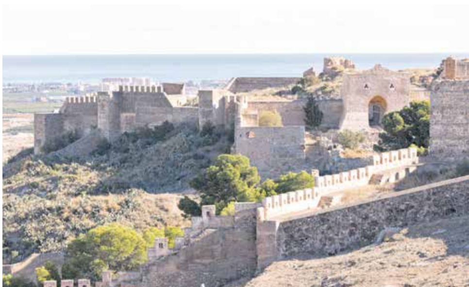
Vista del Castell de Sagunt, declarat Monument Nacional des de 1931 .

tat que el posa en valor amb rutes teatralitzades i tot tipus d'actes culturals.