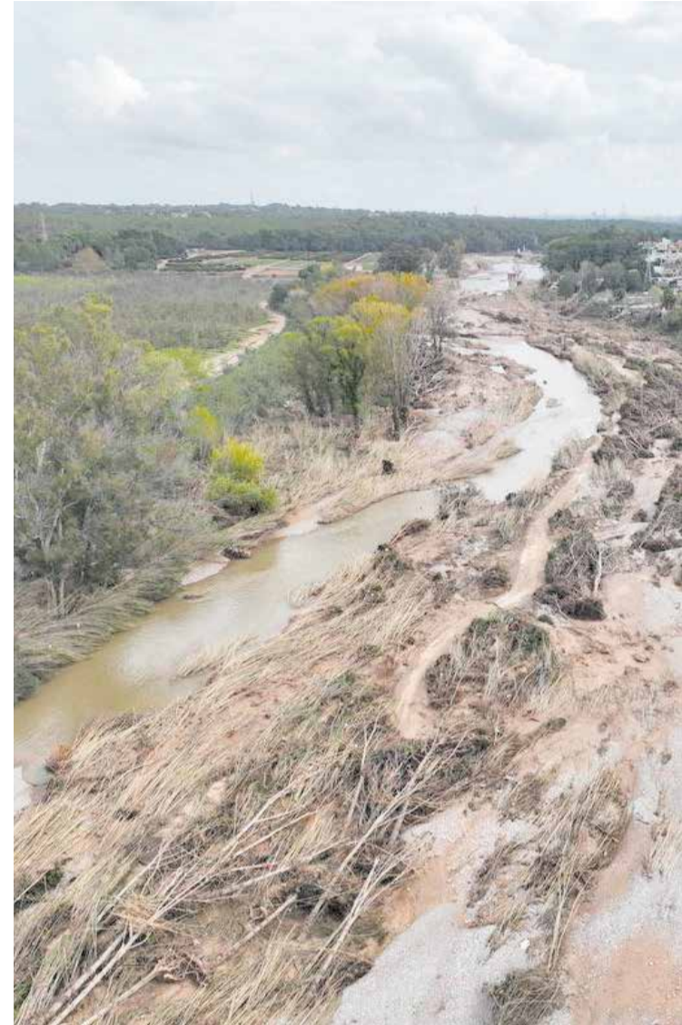
El Parque Natural del Turia tras la riada del pasado 29 de octubre