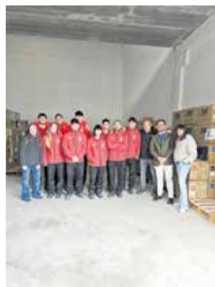
Recollida de material.