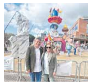
Falla de Gavà.

Roperó va pronunciar igualment un breu discurs en el qual va agrair "les mostres d'estima