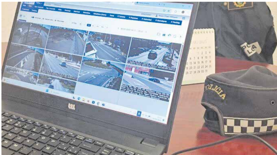
Plataforma de control de les noves càmeres de vigilància de Benissanó.