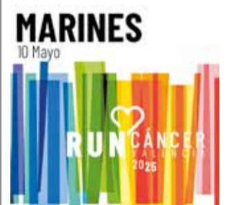
Cartel de la carrera. / EPDA