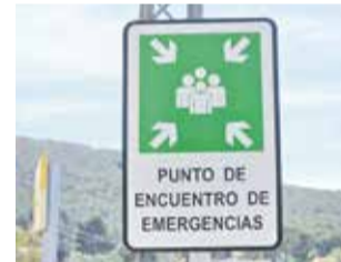
Un dels nous punts.