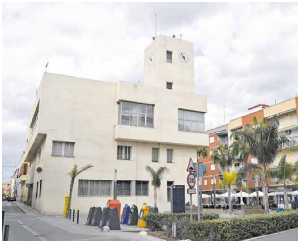
Ayuntamiento de Vilamarxant./ EPDA

Seis semanas después de la salida de los ediles de Ciudadanos, se han podido desparjar las dudas existentes entorno a estos ceses. Desde el primer momento, el Partido Popular defendió que la decisión de apartar del gobierno a los dos concejales investigados respondía a su obligación de cumplir con la legalidad y con su deber de velar y preservar tanto el patrimonio local como la integridad del ayuntamiento.