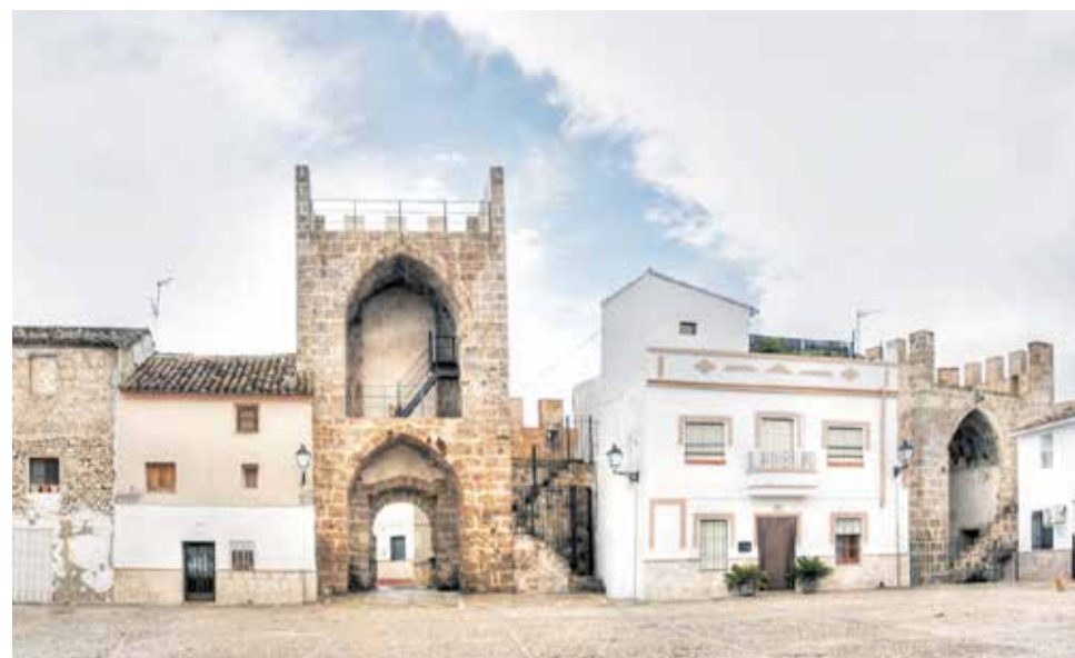
El Castell de Bunyol, dels pocs d'Espanya amb vivendes en el seu interior.

Construït entre els segles XI-XII, el Castell de Buñol és un dels més ben conservats de la Comunitat Valenciana i dels pocs a Espanya amb vivendes en el seu interior, encara habitades en l'actualitat. Accedint des de la part alta, per la torre central, trobem la Plaça d'Armes, on se situen la majoria de les vivendes enclavades entre dos torres laterals que voregen la plaça. Un pont, amb unes imponents vistes panoràmiques de la localitat, ens conduïx al recinte inferior amb al-