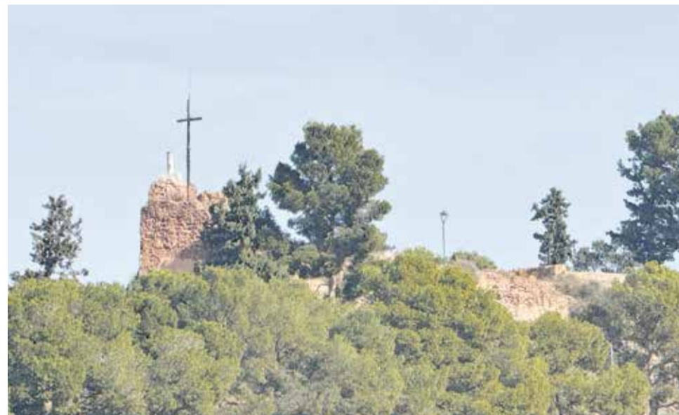
Restes del Castell del Puig de Santa Maria en la muntanya de la Patà.