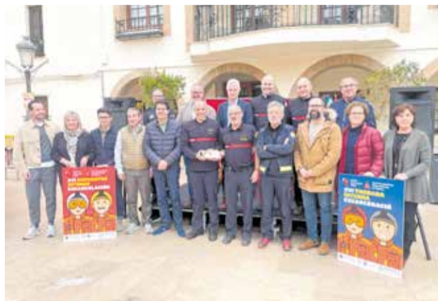
Presentació de la XVI Trobada Interna d'Excarceració.

Es tracta d'una trobada dedicada al món dels rescats en accidents de trànsit en el qual participaran 17 equips del Consorci i que tindrà lloc a la plaça d'Europa de l'Eliana amb caràcter obert al públic. Durant dues jornades este recinte serà escenari de diverses maniobres d'excerceració que simularan accidents re-