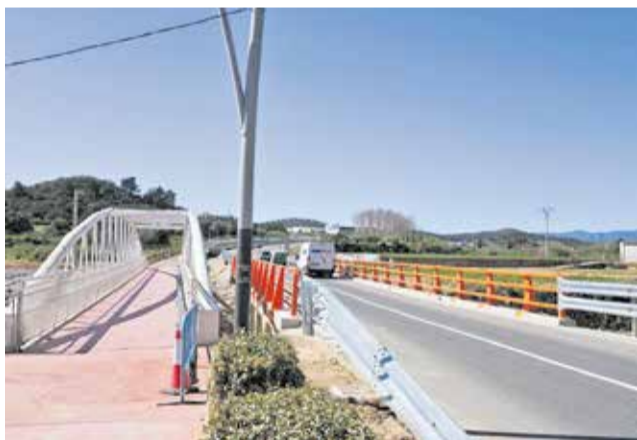
Un vehicle sobre el pont de la CV-50.