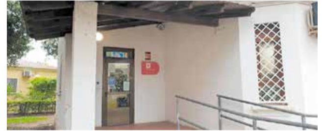
Espai de la dona en el Port de Sagunt.

La iniciativa, defensada per l'alcalde i regidor d'Igualtat,