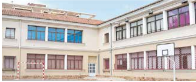
El pati del CEIP Cervantes.

Entre les actuacions, es construirà un nou accés