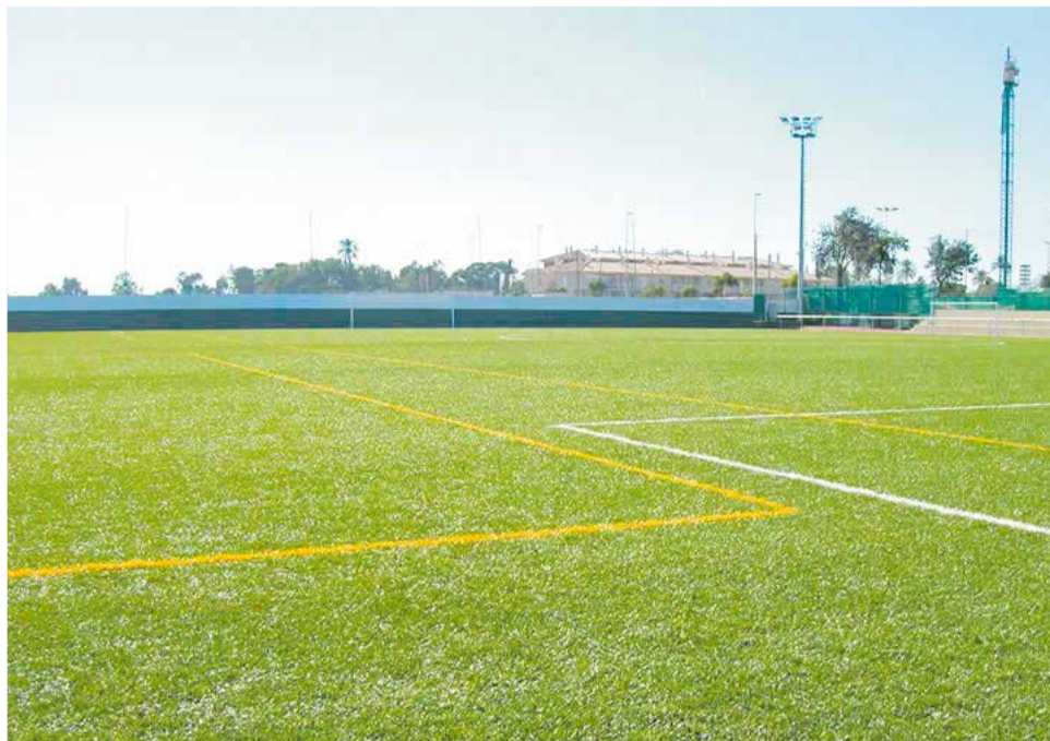
Camp de futbol de Canet d'en Berenguer.