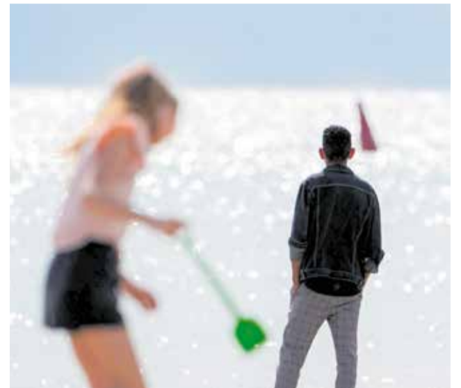
Varias personas realizan actividades en las playas del Camp de Morvedre: a la izquierda, el Port de Sagunt; a la derecha, Canet.

■ CANET D'EN BERENGUER CONSOLIDA SU LIDERAZGO TURÍSTICO Y AMBIENTAL CON EL MÁXIMO DISTINTIVO A SU COSTA POR 34º AÑO CONSECUTIVO