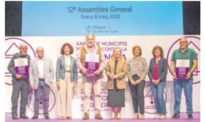
Un instant de l'assemblea.