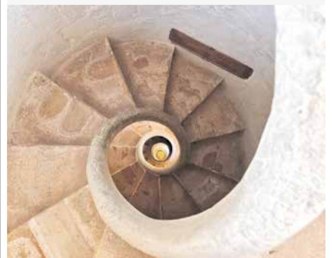
ESCALA DE CARAGOL DE LA TORRE DE BENAVIDES

► La Torre de Benavites, que amaga en el seu interior una escala de caragol, ceràmica de Manises i artesanía d'algeps en el primer pis, es pot visitar de manera gratuïta. Reserva de plaça 962 63 66 52, en horari de 08.00 a 14.00 hores (de dilluns a divendres).