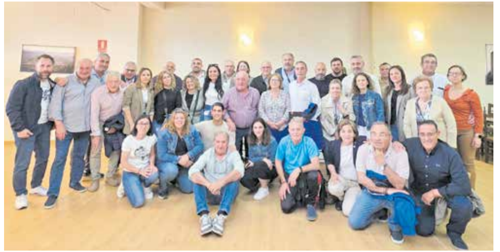
Foto de família de l'acte del PP celebrat a Quart de les Valls.