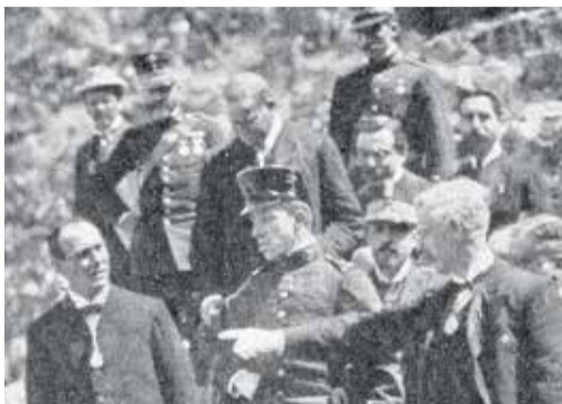
Rei Chabret al Teatre de Sagunt (1905).

L'ajuntament de Sagunt ha decidit declarar el 2025 com Any del Cronista Antonio Chabret. Tot el que es faça per a tindre present esta figura cabdal de la historiografia local de la comarca sempre és poc. L'actualitat camina molt apressa i esborra cada dia, amb més velocitat, les figures destacades del passat. Així que, qualsevol iniciativa vinculada amb la seua obra serà positiva i ajudarà a tindre'l present. De segur que la celebració comptarà amb un programa interessant. El personatge genera sortosament el suficient consens per a no ser discutit i que alhora tota la societat civil en pugua aportar alguna cosa. Però, és desitjable que entre el que es proposa es tinga especialment en compte: la trajectòria polièdrica de l'autor i la capacitat que va tindre d'unir l'estudi de les ciències i les lletres des d'una perspectiva local. No oblidem que el cronista va ser alhora metge, historiador, literat i compositor.