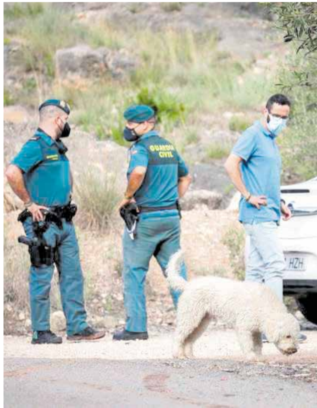
Trabajos de búsqueda tras la desaparición.