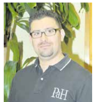
Crispín, Fernández, García y Moreno.