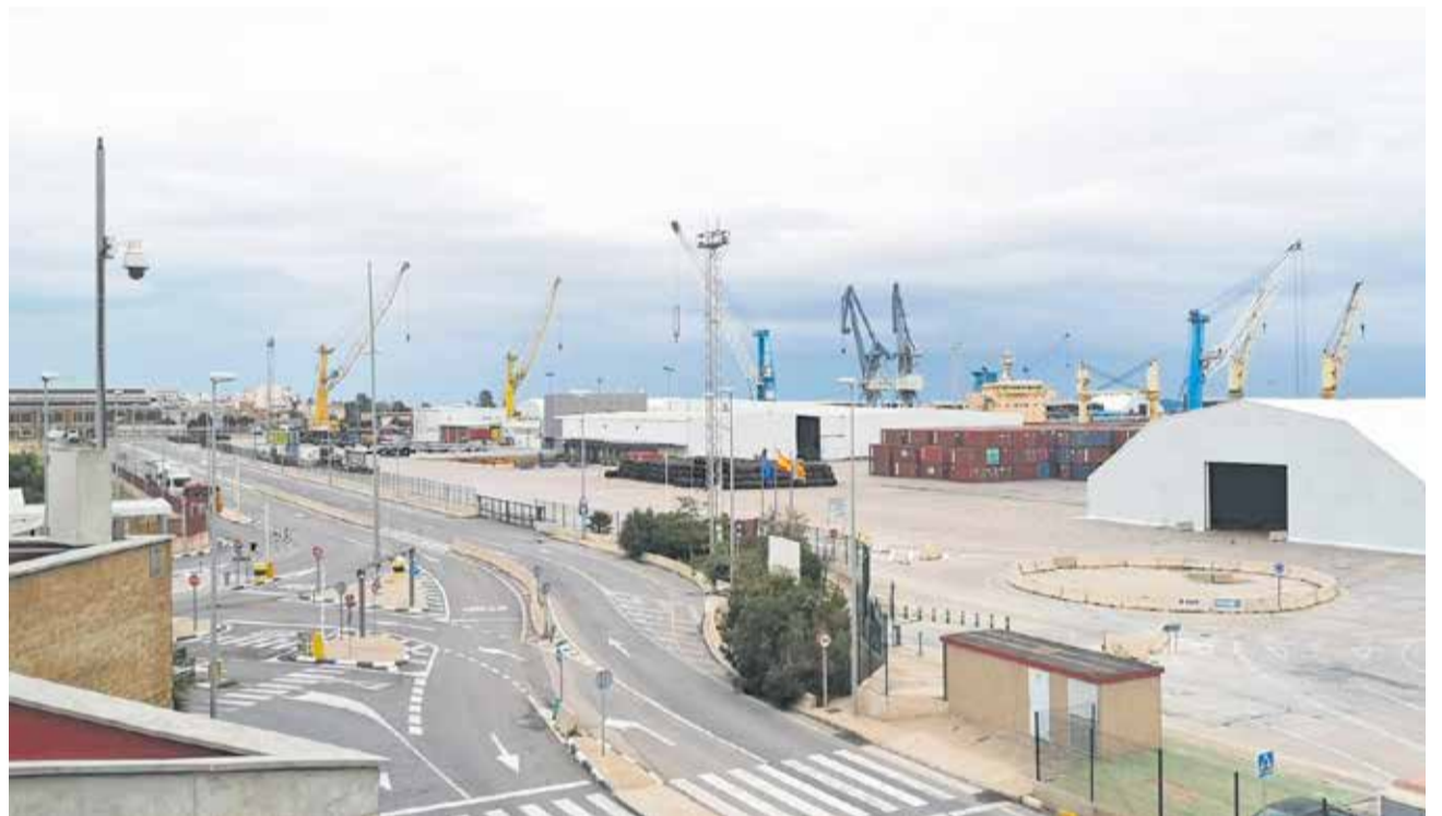
El recinto portuario de Sagunt.

construcción y explotación de una planta de procesamiento y producción de combustibles renovables en el puerto de Sagunt. Esta nueva infraestructura ocupará una parcela de aproximadamente 27.800 metros cuadrados, ubicada al sur del Muelle Sur Dos, y se concederá por un plazo de 25 años.