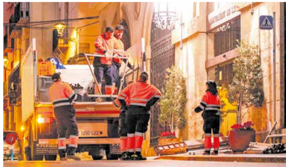
Diversos operaris treballant a Sagunt.

Des de Comissions Obres (CCOO), es valora positivament l'augment de