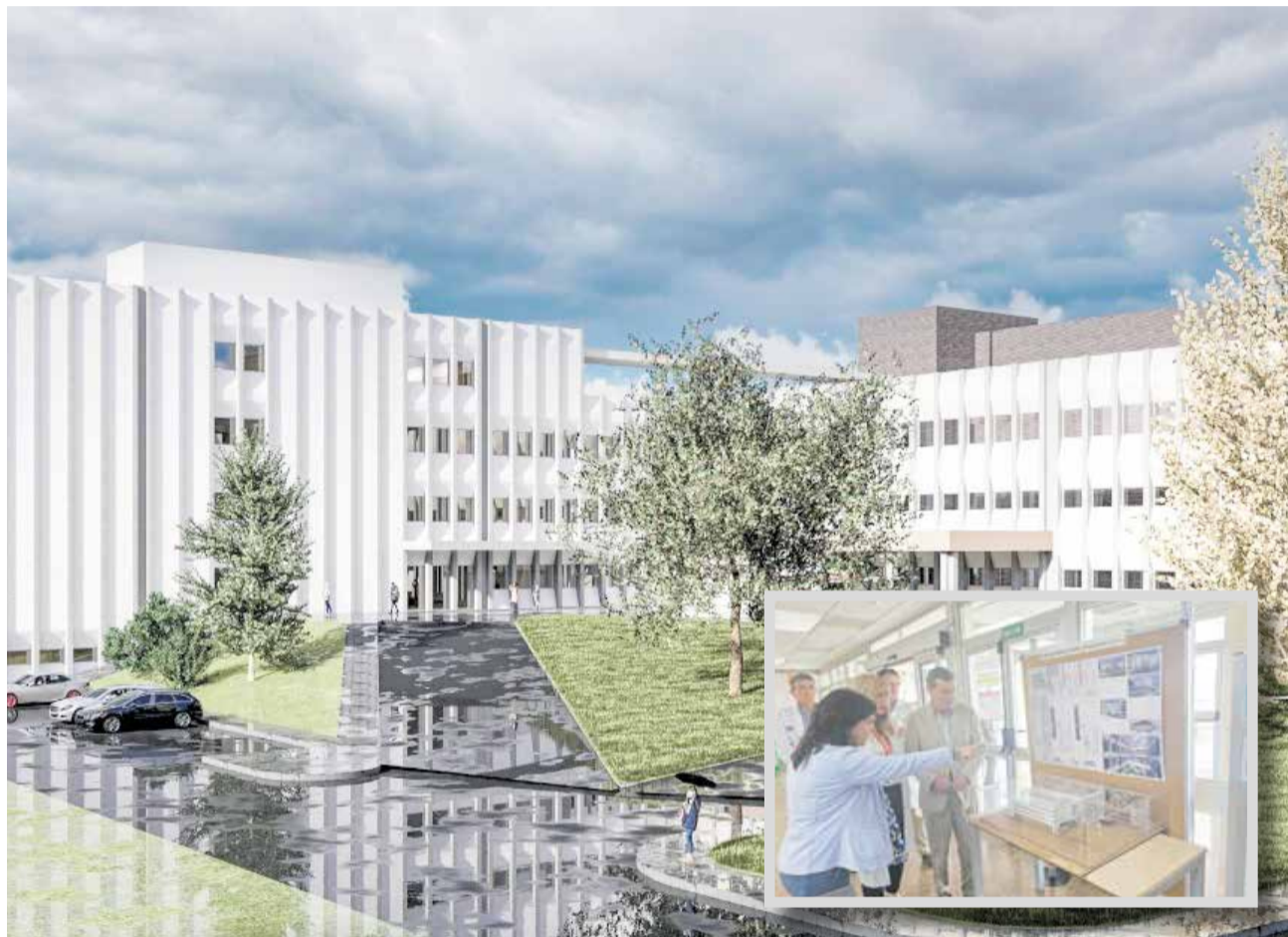
Recreación del proyecto de ampliación y visita reciente del conseller de Sanidad.

El conseller ha recordado que desde el pasado mes de febrero se están llevando a cabo las obras de amplia-