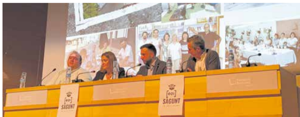
Diversos instants del dia de l'acte de celebració del 30 aniversari.

teixa manera que l'Escola Oficial d'Idiomes no es pot dividir del seu context social. Per això, aquesta celebració va incloure també una visita cultural al patrimoni industrial del Port de Sagunt i va comptar també