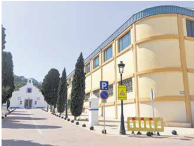
L'àrea esportiva de Faura.

L'actuació s'ha desplegat sobre una superfície de quasi 20.000 metres quadrats i ha comportat la col·locació de càmeres en punts estratègics de diversos espais d'ús públic. Concretament, s'han instal·lat dispositius de vigilància al pavelló multiús, el camp de futbol, la piscina i el cementiri. En tots estos espais, s'ha posat especial aten-