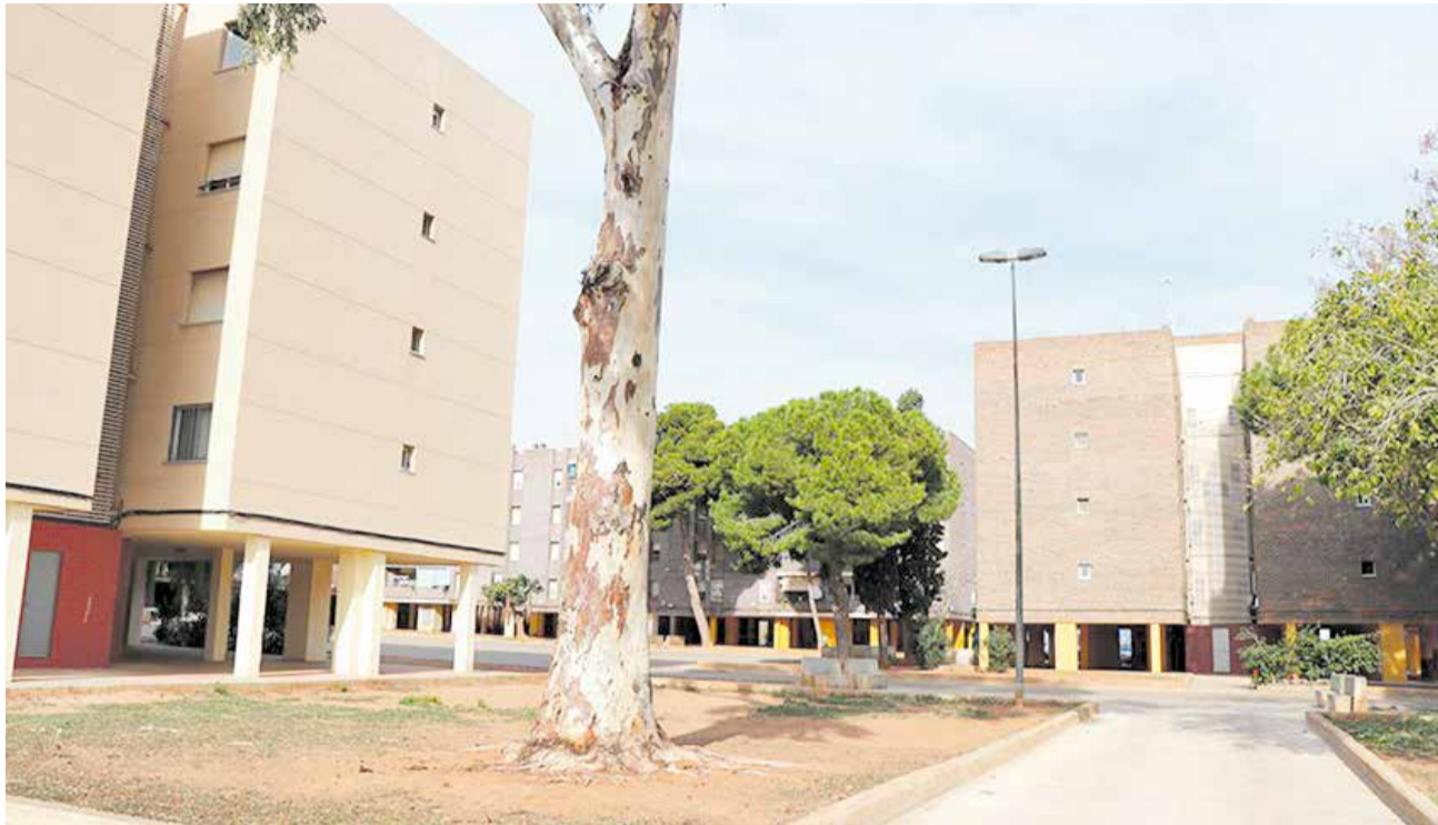
Zona del barri de Baladre on es duran a terme les actuacions.