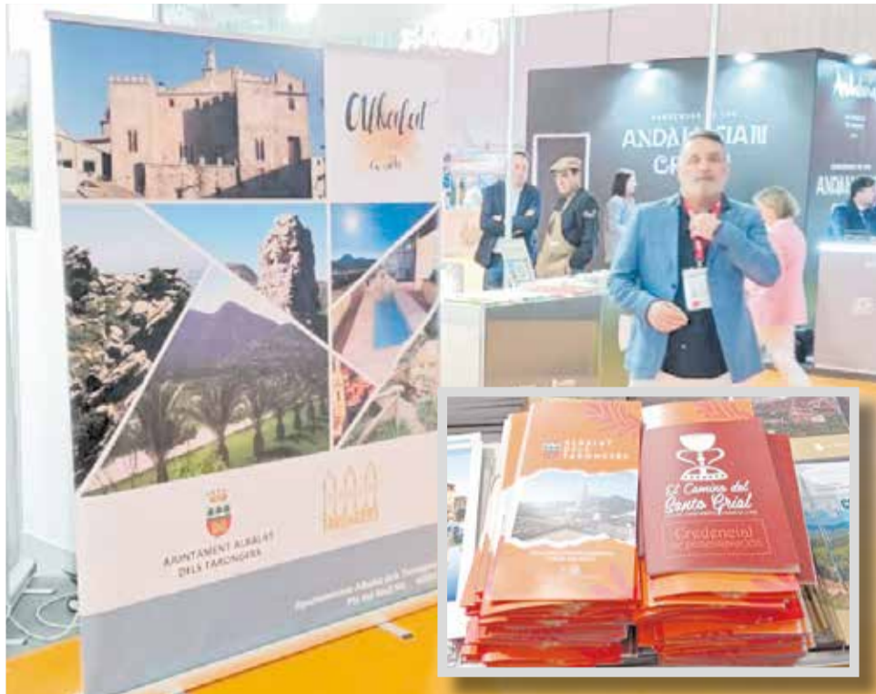
El regidor de Turisme en la fira de Bilbao.

Un dels elements més destacats de la promoció d'Albalat ha sigut la seua recent inclusió en la Ruta del Sant Grial, que el converteix en un punt de referència comarcal dins del camí de pelegrinació cap