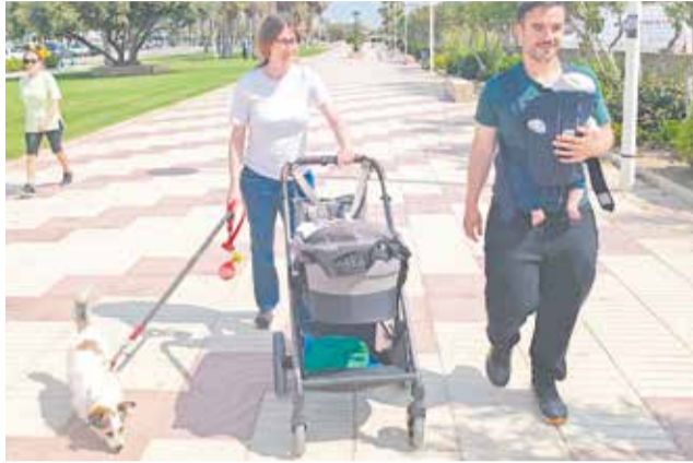
Una família passeja la seua mascota a Canet.

El plat fort serà el programa 'El Ciudadano Ejemplar',