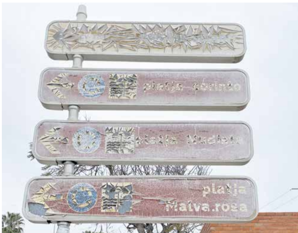
Estado del litoral de Sagunt en algunos puntos y señalética.

gestión de residuos –uno de los criterios clave para obtener la bandera azul– “brilla por su ausencia”, aseguran.