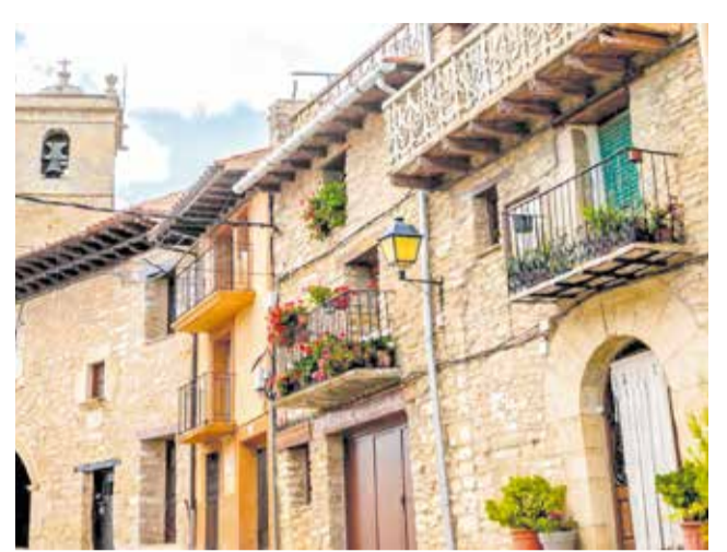
Diverses vivendes a Castellfort.