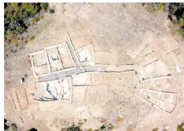
Jaciment arqueològic de la província de Castelló.

Totes estes actuacions estaran dirigides des del Servei d'Arqueologia de la institució provincial, però es duran a terme mitjançant la inestimable col·laboració dels respectius ajuntaments, així com de la Universitat Jaume I.