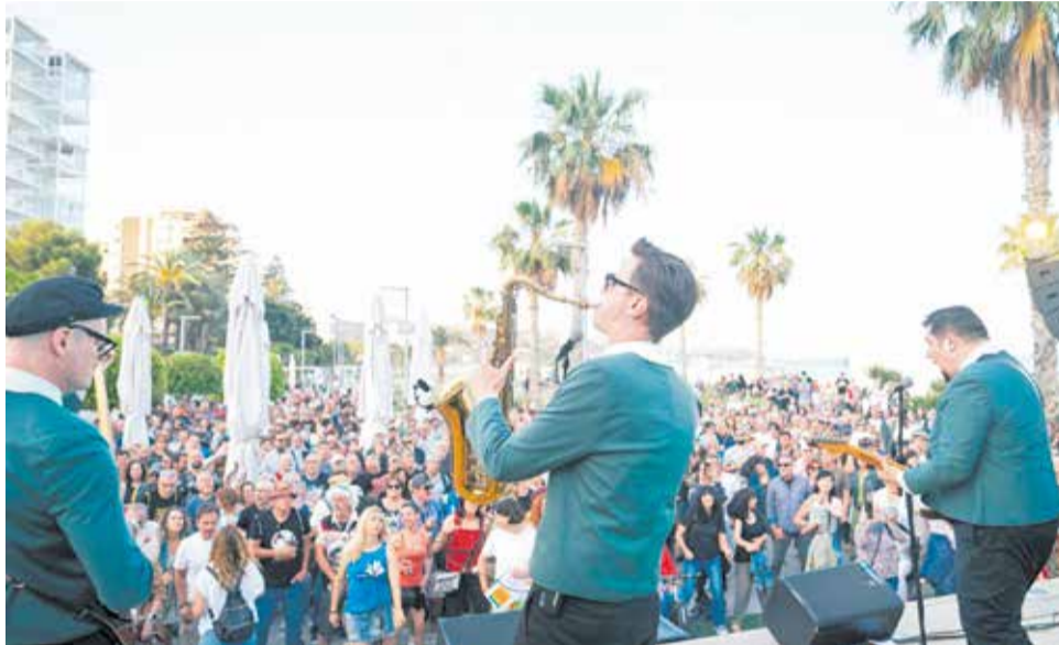
Edición anterior del Benicàssim Blues Festival.

Este evento gratuito constará de tres días de música en directo, con la presencia de