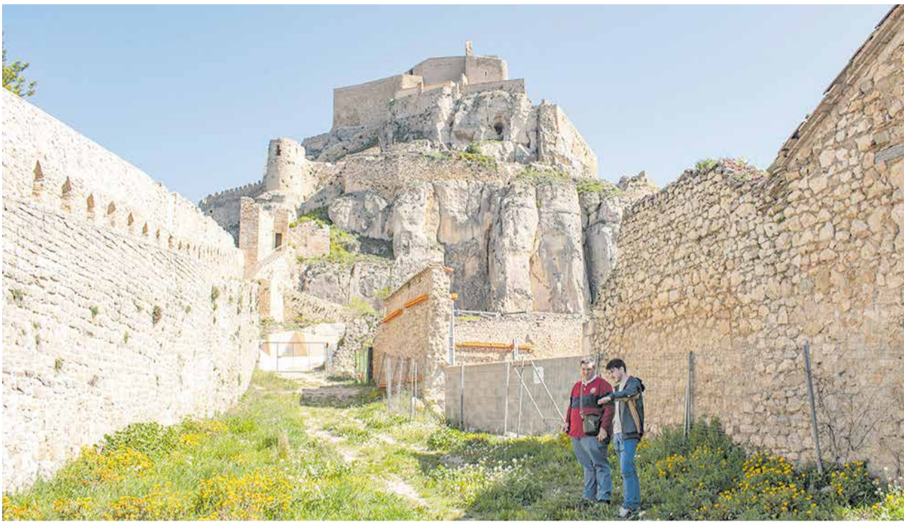
L'alcalde de Morella, Bernabé Sangüesa, durant una visita tècnica als peus del castell.