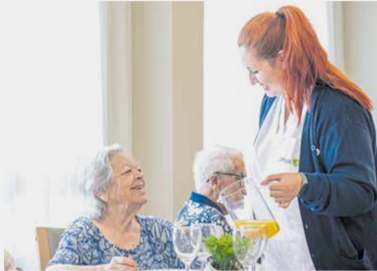
Cuidados en la residencia DomusVi de Vila-real.

Por eso, las actividades no son solo rutinas, son experiencias pensadas para conectar con lo que cada persona ha sido y sigue siendo. Desde terapias innovadoras hasta talleres muy diversos, como los de reminiscencia basados en el fútbol, una iniciativa que se lleva a cabo en colaboración con la Federación Española de Asociaciones de Futbolistas Veteranos (FE-AFV) y la Fundación LALIGA y que permite estimular y recuperar recuerdos asociados a este deporte. Desde el centro hacen hincapié en lo importante que es la búsqueda del bienestar integral de cada resi-