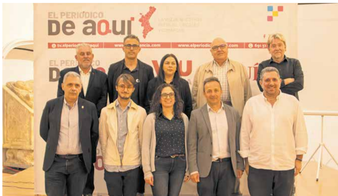
Autoridades y ponentes en las IV Jornadas de Turismo Alto Palancia-Alto Mijares en Jérica.