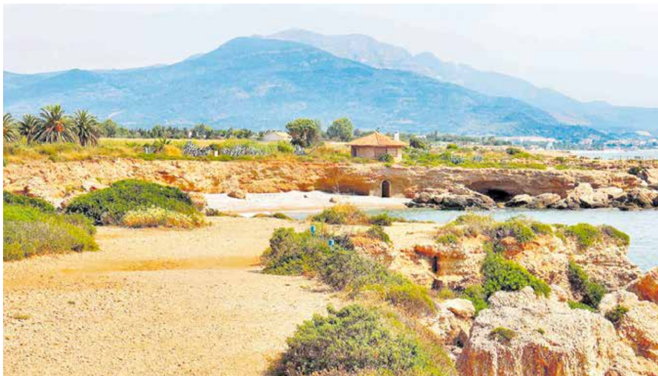
Senda del Jardí de Sòl de Riu de Vinaròs.