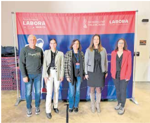
Fòrum Labora en Ruta a Albocàsser.

Durant la jornada, els assistents han pogut participar en diverses activitats dissenyades per a millorar la seua ocupabilitat, com a maratons d'entrevistes, conferències, taules rodones i tallers pràctics. "Què pot fer Labora per tu?", un taller sobre recursos per a la cerca d'ocupació o xerrades sobre l'Acord Territorial del Maestrat o les ajudes