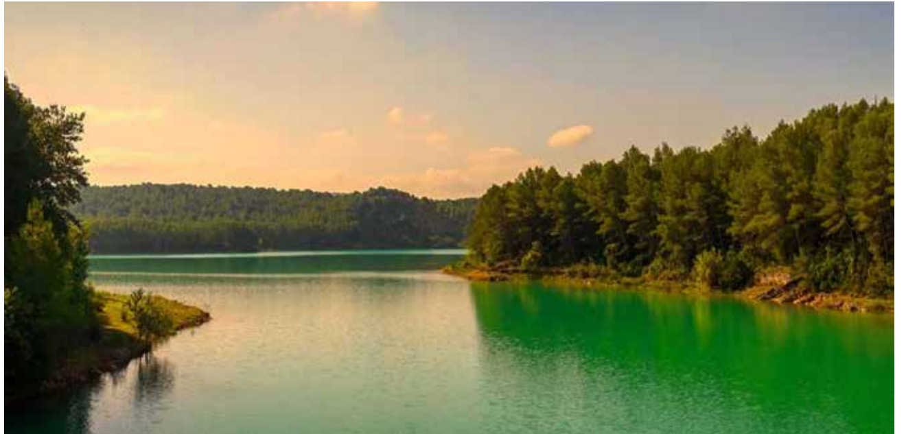
Embassament del Sitjar d'Onda, un racó en el qual contemplar la naturalesa en estat pur.