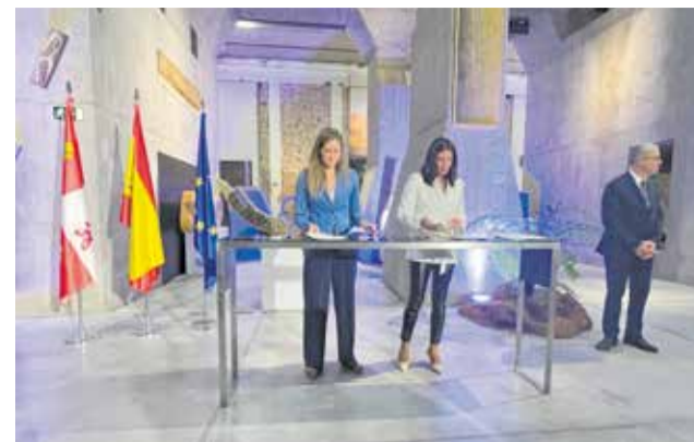
Firma del protocol de formalització del projecte.