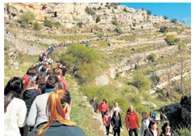
Marxa Endavant a Vilafranca.

Panaderia Ripollés, el Forn de Lupi, la Teteria, Fruitera Bordás, Bolíssim, Bar Avenida, i el Bar Camilo, de La Iglésuela del Cid. A més, hi havia una fira benèfica amb la parada del Grup d'Amigurumi de Vilafranca, amb la qual es van recaptar 1200 euros. L'empresa Shedmarks va col·laborar en la infraestructura de la marxa, mentre que el Mas Llosar va ser l'encarregat del sorteig, Arc Estudi del disseny de les samarretes, i Drons Castelló i Nobi Fec de capturar material audiovisual per immortalitzar este dia tan especial.