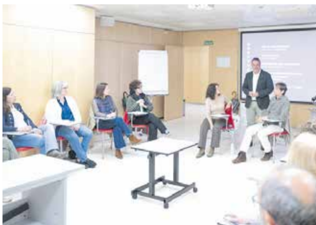
Jornada de formació de la Diputació.

Ara, este Pla Agrupat de Formació, aprovat per la Junta de Govern, està englobat dins d'un complet programa, format per 58 accions forma-