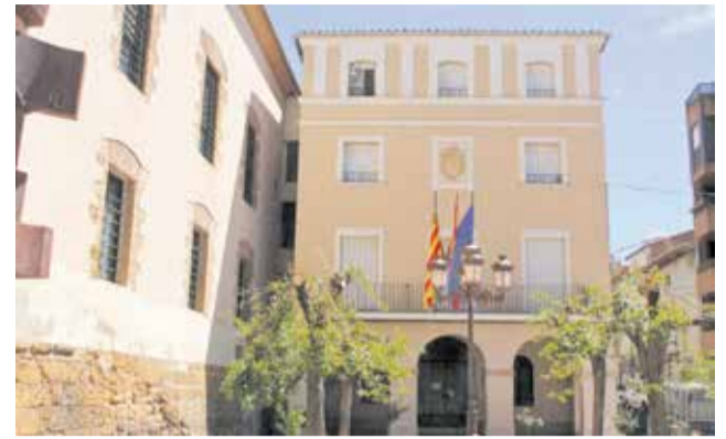
Ajuntament de Benassal. / EPDA