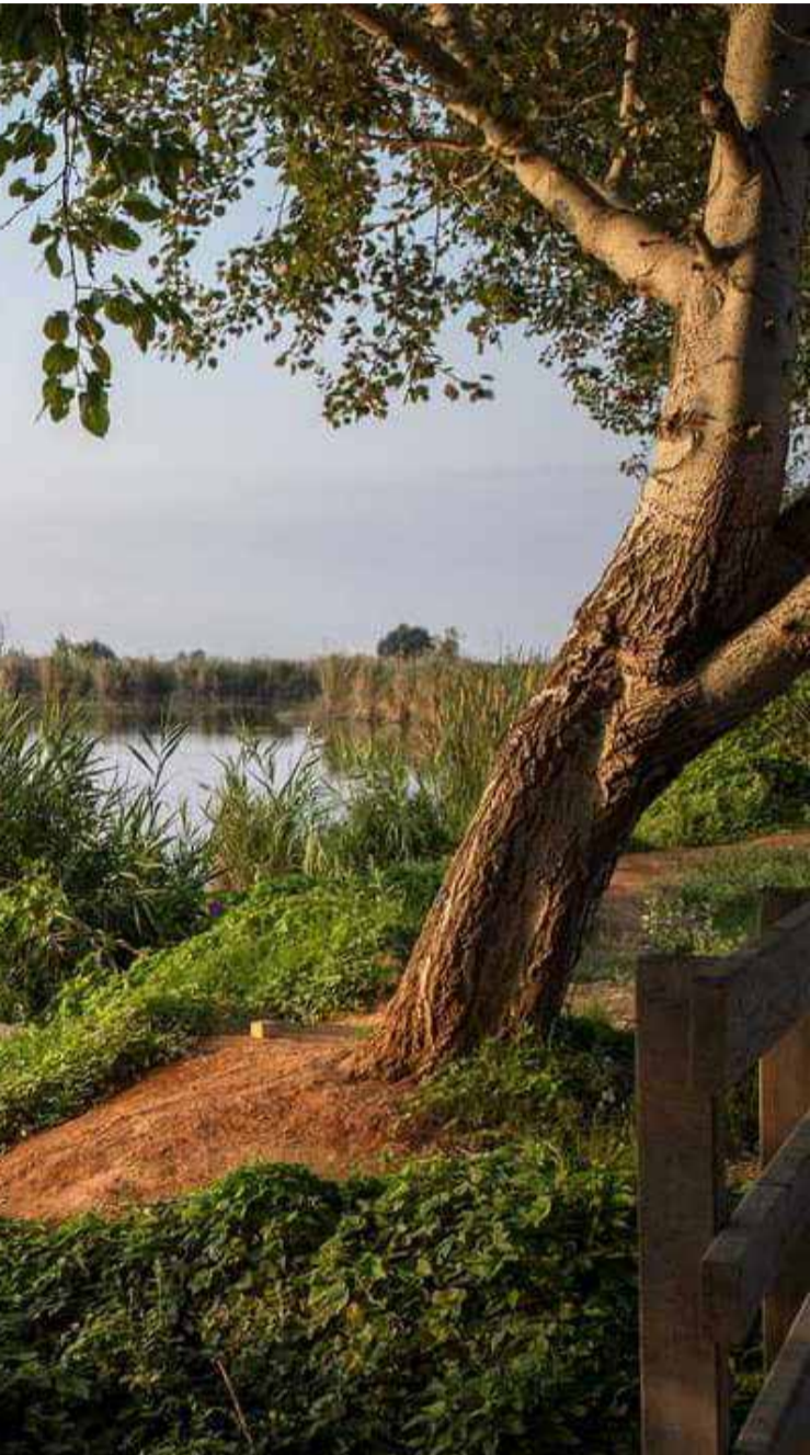
at de València.