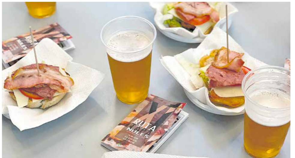
Edició anterior de la Ruta de la Tapa de Nules.

Amb tot, l'Ajuntament ha publicat les bases per als establiments, que també es poden consultar a l'ADL.