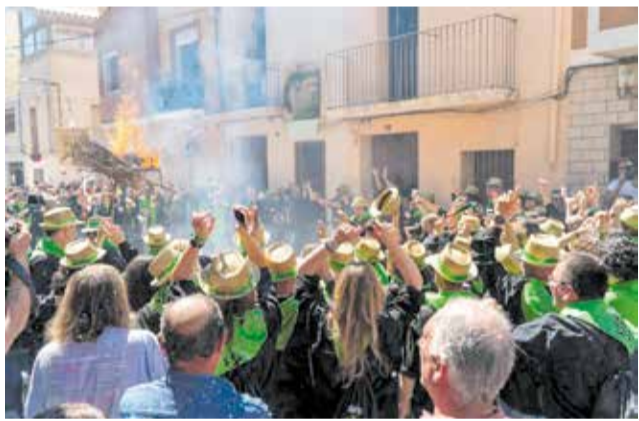
Cercavila de les quintes en la festa de Sant Vicent.