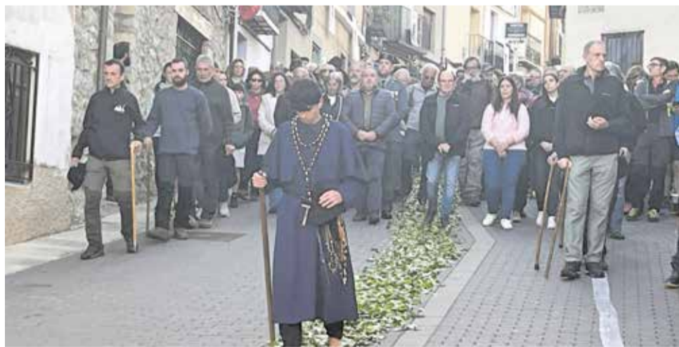
Peregrinació de Les Useres a Sant Joan de Penyagolosa.