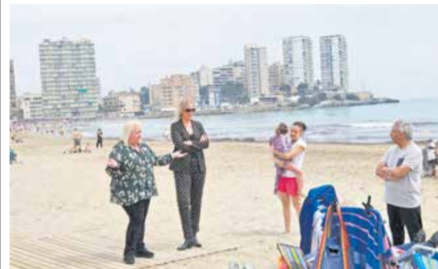
La alcaldesa y la concejala del área de Playas.