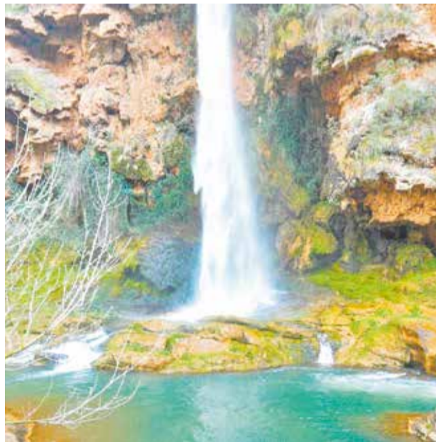
Salt de la Nòvia, al riu Palància.