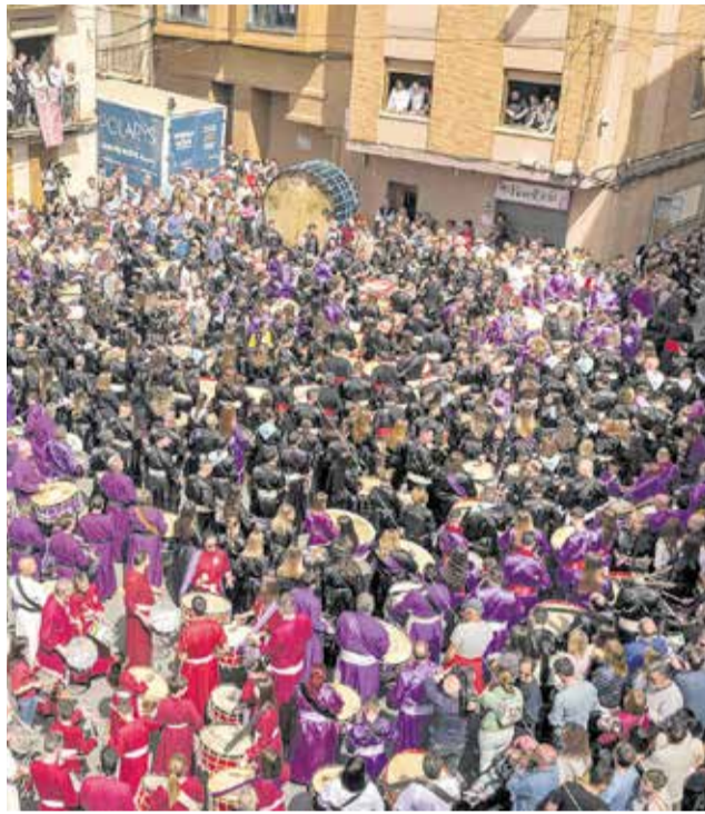
Diferents actes de Setmana Santa i Pasqua al municipi de l'Alcora.

nitat per la UNESCO, Festa d'Interés Turístic Autòmic i Bé d'Interés Cultural. La plaça Espanya es va omplir el passat Divendres Sant per a viure una experiència única, amb la participació de més de 1.000 bombos i tambors que van fer vibrar l'Alcora durant una hora. Enguany, el prestigiós músic valencià Pep Gimeno 'Botifarra' va exercir de Rompedor d'Honor, marcant amb els tradicionals quatre cops l'inici d'este emocionant acte, que també va tindre un vessant solidari: la recaptació es destinarà als municipis afectats per la DANA.