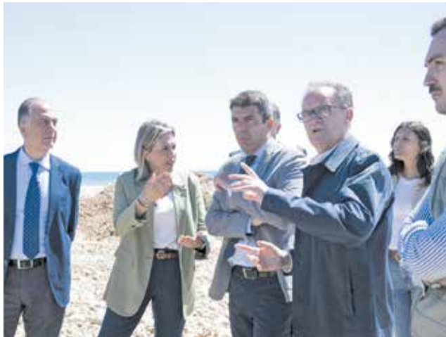
Visita a les actuacions en Alcalà-Alcossebre. / EPDA

Al respecte, després de l'anunci de la Generalitat Valenciana d'un fons econòmic per a les localitats damnificades per les fortes pluges del passat any, els municipis afectats el van aprofitar per a finançar la reconstrucció. Com va explicar el president del Consell, Carlos Mazón, "ja hem pagat més de 9,3 milions d'euros a 59 ajuntaments de la província en ajudes directes i àgils perquè puguen recuperar la normalitat com més prompte millor", al mateix temps que va assenyalar que en les pròximes dates es farà efectiu l'abonament "a la resta de consistoris que han sol·licitat esta línia".