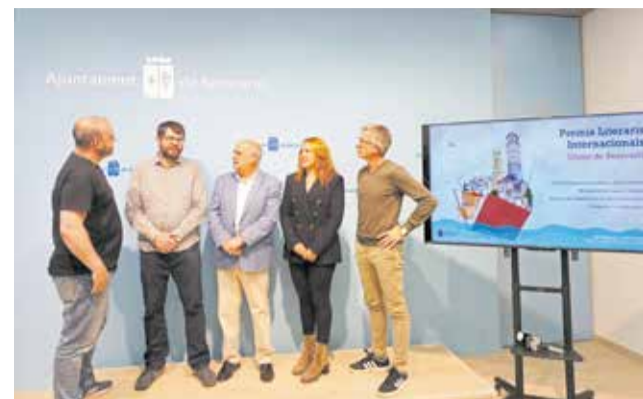
Entrega dels Premis Ciutat de Benicarló.