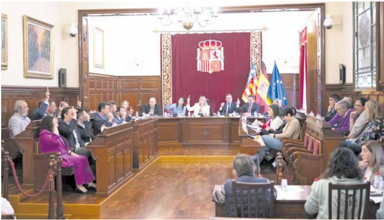
Ple ordinari del mes d'abril de la Diputació de Castelló.