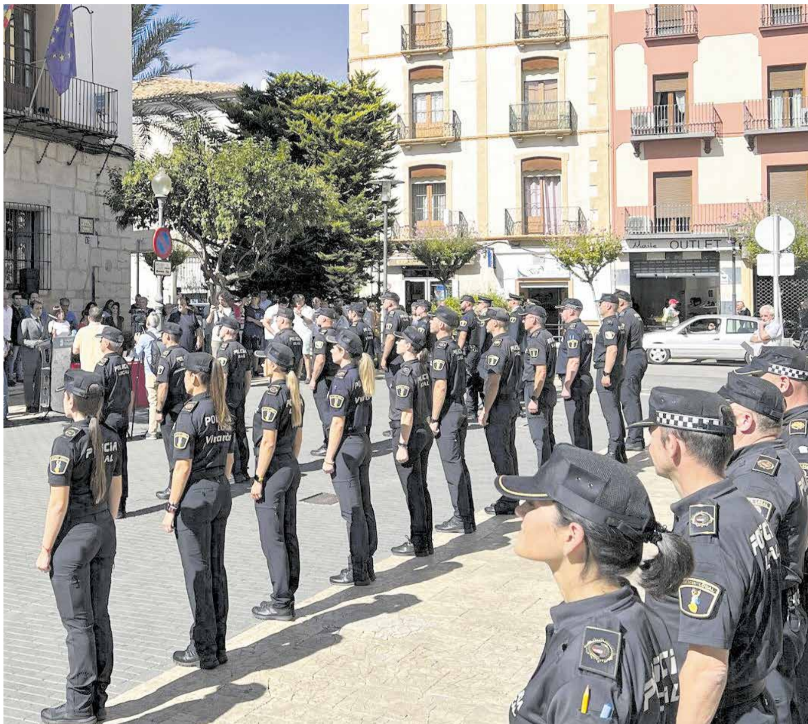
Agentes de la Policía Local de Vinaròs durante un acto institucional.

En el ámbito de la criminalidad convencional, que representa el grueso de los delitos, se contabilizaron 236.790 infracciones, un 1% menos que en 2023. No obstante, dentro de este grupo se observan subidas significativas en algunos delitos concretos, como los homicidios dolosos y asesinatos consumados, que crecieron un 64,7%. También aumentaron las agresiones sexuales con penetración en un 9,3%, con 516 casos frente a los 472 del año anterior. El