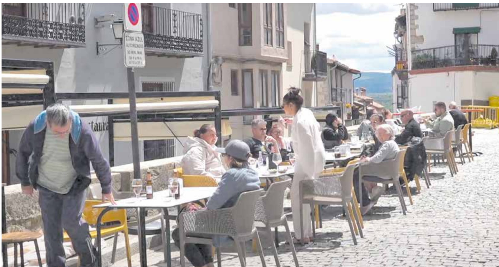
Una terraza de un restaurante de Morella durante el apagón del pasado 28 de abril.