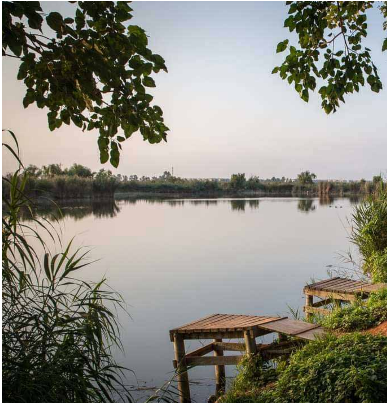
Paratge natural de la Marjal i els Estanys d'Almenara a la Plana Baixa, a només uns pocs quilòmetres de la ciutat de València.

Entre les comarques dels Ports i el Baix Maestrat, es troba el Parc Natural de la Tinença de Benifassà, que recorre un total de set municipis (Bel, El Ballestar, Boixar, Castell de Cabres, Coratxà, Fredes i La Pobla de Benifassà), units per