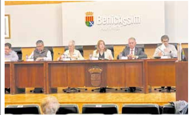
Pleno del Ayuntamiento de Benicàssim.