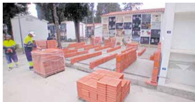
Treballs al cementeri d'Alcalà de Xivert.

Ja estan en plena execució les obres d'ampliació del cementeri municipal d'Alcalà de Xivert, amb la construcció de 56 nous nínxols. L'obra consisteix en la construcció d'un nou bloc de nínxols, amb quatre fileres de set nínxols a dues cares. Esta actuació ve a completar l'ampliació que ja es va realitzar en 2021, amb la construcció d'un bloc idèntic.