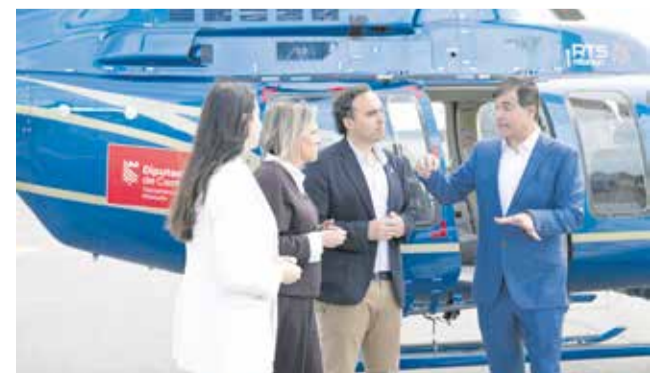
Presentació del nou servei de control de mosquits.

En el nou contracte també s'inclou la incorporació de dades en Sistema d'Informació Geogràfica (SIG), per a la millora de la gestió i transmissió d'informació, a més d'intensificar la conscienciació ciutadana. Al respecte, s'incrementa la realització de jornades informatives.