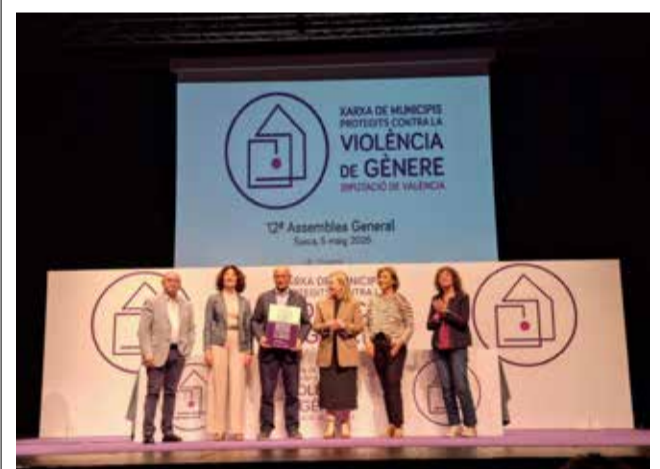
Acto de entrega del distintivo de la Diputación.