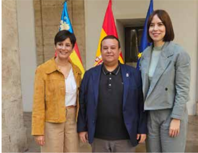
El alcalde junto a las ministras Rodríguez y Morant.

La subvención permitirá al Ayuntamiento elaborar, actualizar o ampliar su Plan de