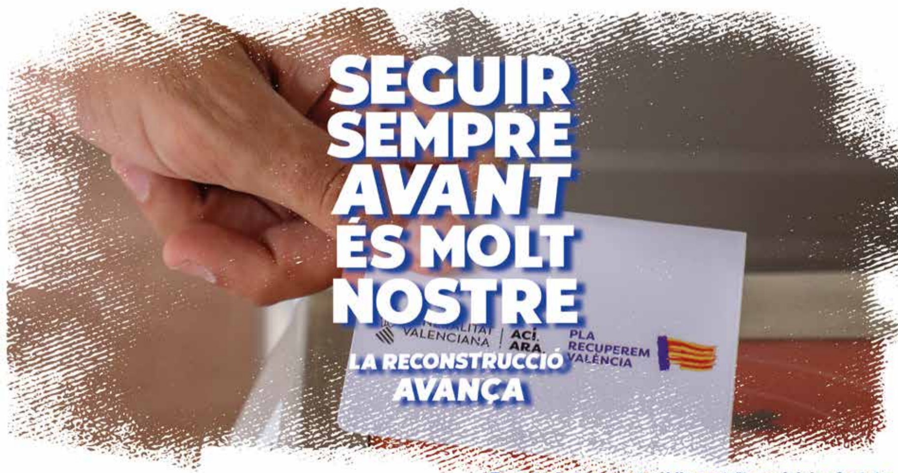
Tarjeta de transport públic gratuït municipis afectats

Consolidada ya como una cita imprescindible para los amantes del buen comer, Quesalia mira al futuro con fuerza, afianzando su papel como escaparate del producto local, motor de dinamización rural y punto de encuentro entre tradición e innovación gastronómica.