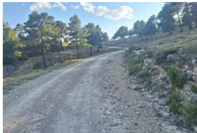
Mejoras en un camino forestal de Titaguas.

La primera de las actuaciones ha sido la mejora del camino de Canales al Alto, con una inversión de 15.281,37 euros. Este vial forestal ha sido objeto de trabajos como el desbroce de vegetación, escarificado y triturado del firme, refinado y planeado de la plataforma y la construcción de sistemas de drenaje transversal mediante caballones desviadores. Todo ello para garantizar un tránsito seguro y la correcta evacuación del agua de lluvia.