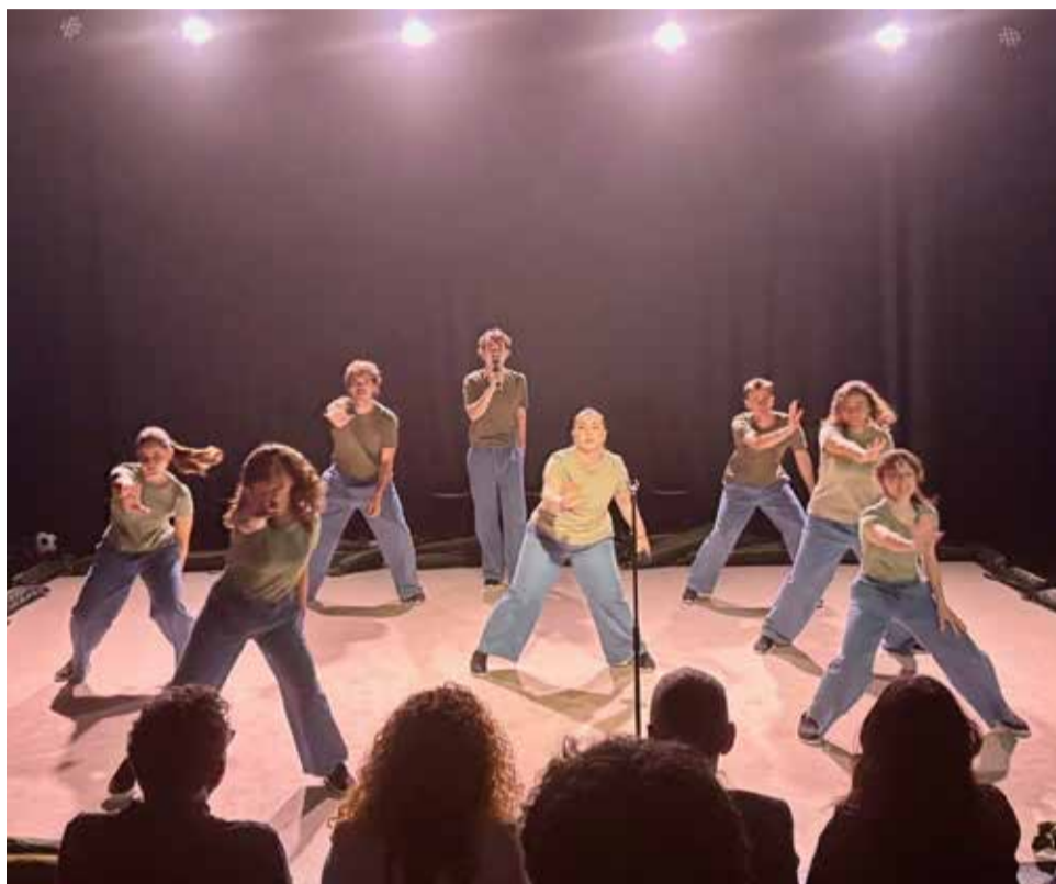
Representación de 'Un instant de belleza'.

Previamente al espectáculo teatral, que culminará con un coloquio abierto con el público, la jornada se iniciará por la mañana con una actividad en la que los alumnos del Aulario de Hi-