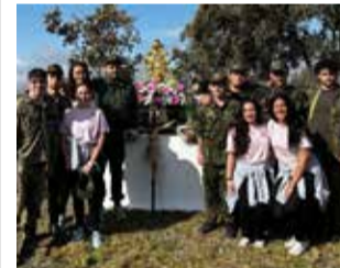
Festeros en la Romería.