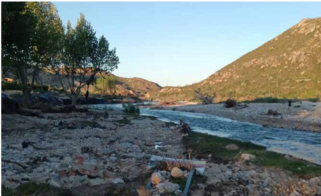
Playa fluvial de Bugarra.

La primera edil ha recordado que durante las pasadas festividades de Semana Santa, las