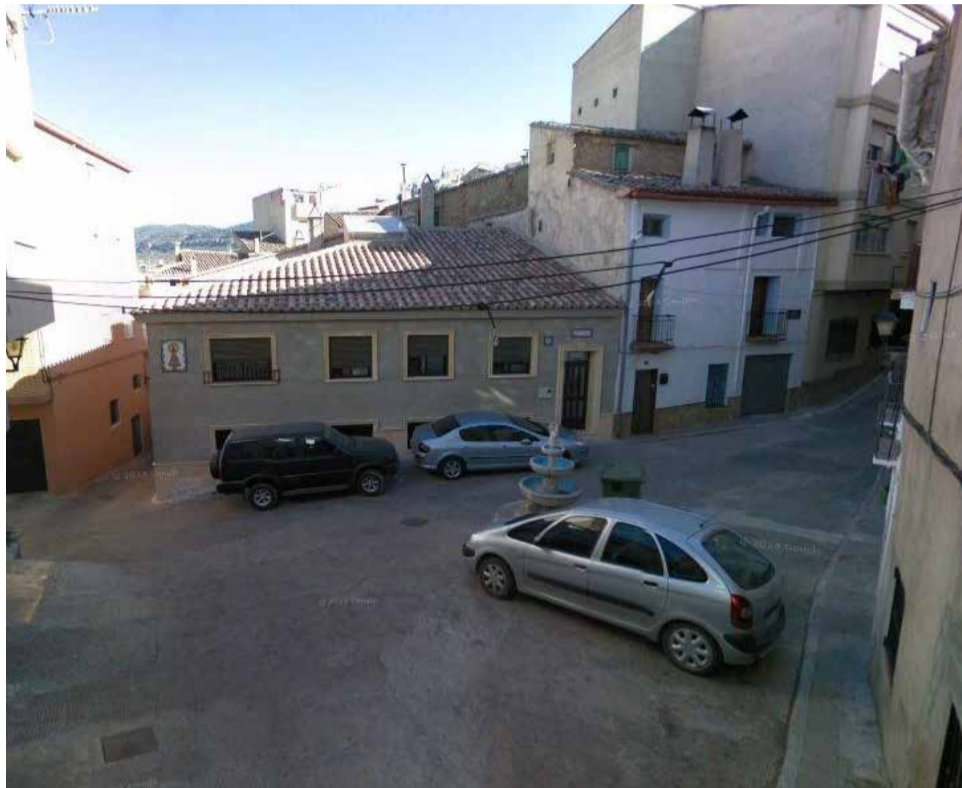
Plaza Rafael Villanueva de Tuéjar.

Esta intervención se enmarca en un plan más amplio que el Consistorio viene desarrollando en los últimos años, con el objetivo de modernizar infraestructuras básicas, embellecer el espacio público y mejorar la calidad de vida de los vecinos. En fa-