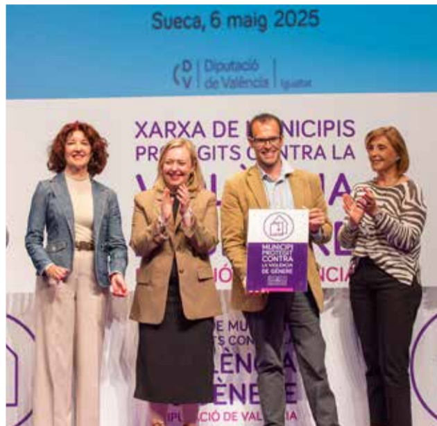
Diferentes instantes durante la asamblea de Municipios Protegidos contra la Violencia de Género.

Con esta adhesión, Chulilla se suma a un frente común que trabaja desde el ámbito local para prevenir, detectar y combatir la violencia machista, en coordinación con otras administraciones y con el respaldo técnico y económico de la Diputación. Según explican desde el consistorio, esta incorporación llega tras meses de trabajo y preparación, en los que el equipo de gobierno ha