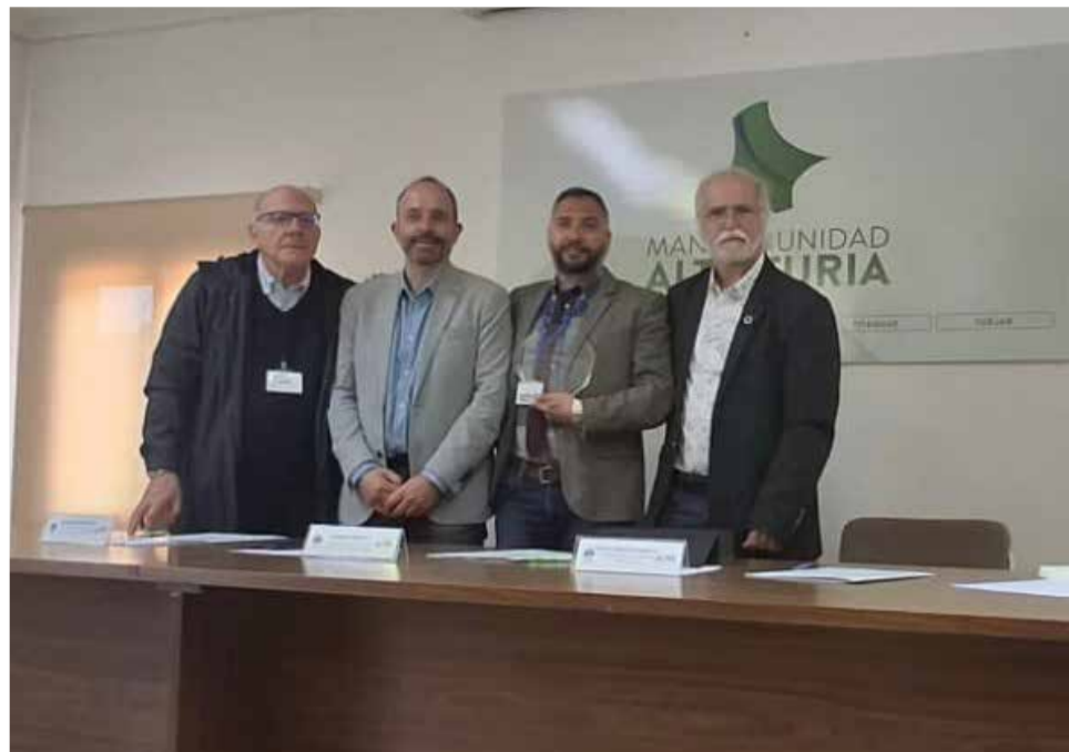
Hermanamiento entre el Alto Turia y el Collemeluccio-Montedimezzo Alto Molise ./ EPDA

Este proyecto de Hermanamiento de Ciudades lleva el título de "Citizens and Biosphere Reserves Town Twinning: exchange of good practices on biodiversity, climate change adaptation, sustainable food between local communities", está financiado por la