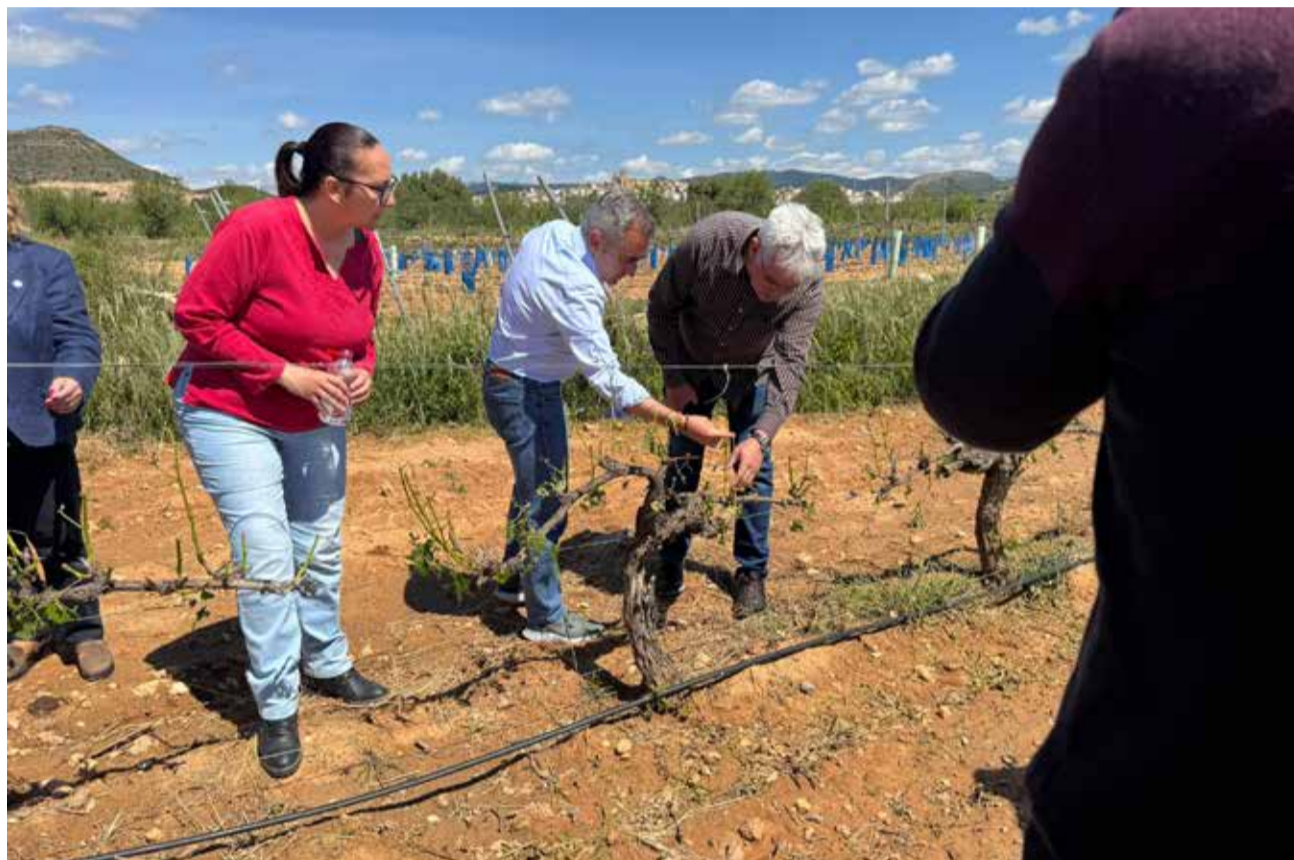
Visita del conseller de Agricultura, Miguel Barrachina, a Villar del Arzobispo.

La tormenta del 8 de mayo forma parte de un episodio meteorológico más amplio, con días consecutivos de lluvias intensas y granizo entre el 4 y el 10 de mayo, que afectó a varias comarcas del