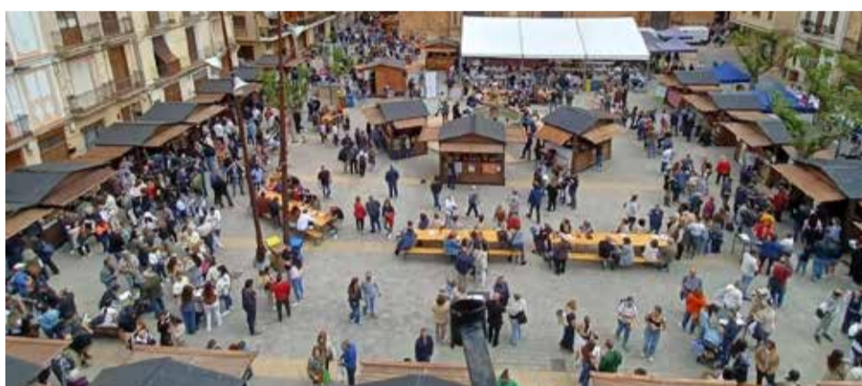
Varios instantes durante la feria Quesalia 2025 en Chelva.

una muestra literaria gastronómica y actuaciones musicales que animaron las calles del municipio y crearon una increíble atmósfera durante todo el fin de semana.