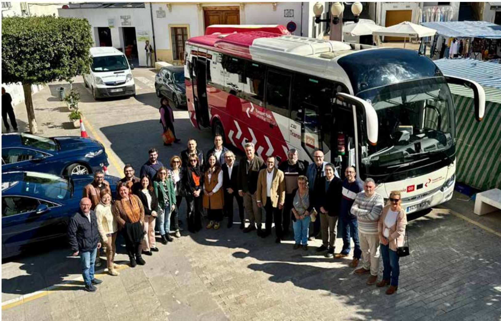
Presentación de la nueva concesión CV-101 La Serranía-Valencia en Chulilla.

■ LA NUEVA CONCESIÓN CV-101 LA SERRANÍA-VALENCIA MEJORA LAS FRECUENCIAS HASTA CASI UNA TREINTENA DIARIAS