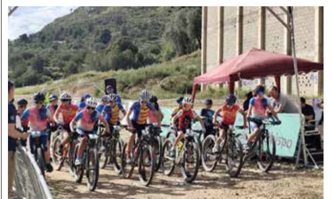
IV OPEN XCO en Losa del Obispo. / EPDA