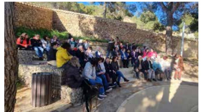
Un instante durante la inauguración.