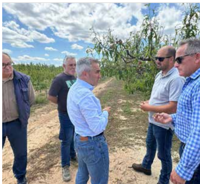
Barrachina en Losa del Obispo (izquierda) y granizada en Villar del Arzobispo (derecha).