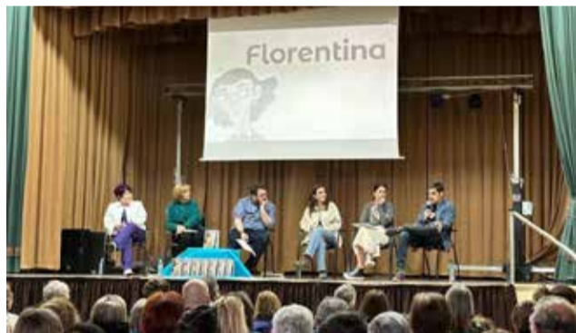
Presentación del libro 'Florentina'.

La historia dio un giro inesperado a principios de los años 80. El Ayuntamiento de Alcublas recibió una llamada desde Badalona: preguntaban por