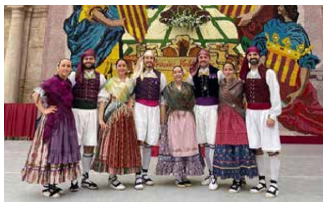
El grupo de jotas 'Aires Serranos'.