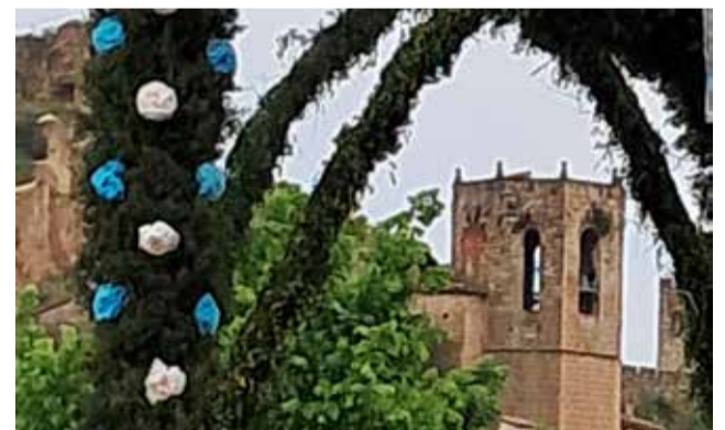
Arcos con motivo de las Fiestas Gordas.

El jueves 15, festividad de San Blas, comenzó temprano con una misa rezada y la salida en romería hacia Corcolilla. Allí se celebró una jornada completa de actividades, incluyendo almuerzo, una solemne misa, paella gigante y la procesión vespertina con la Virgen de Consolación y San Blas. La romería de regreso culminó en la Fuente de la Purísima, con un emotivo recibimiento por parte de la Banda de Tuéjar y los niños que recitaron los tradicionales "dichos", seguido de la procesión hacia la iglesia. La jornada concluyó con