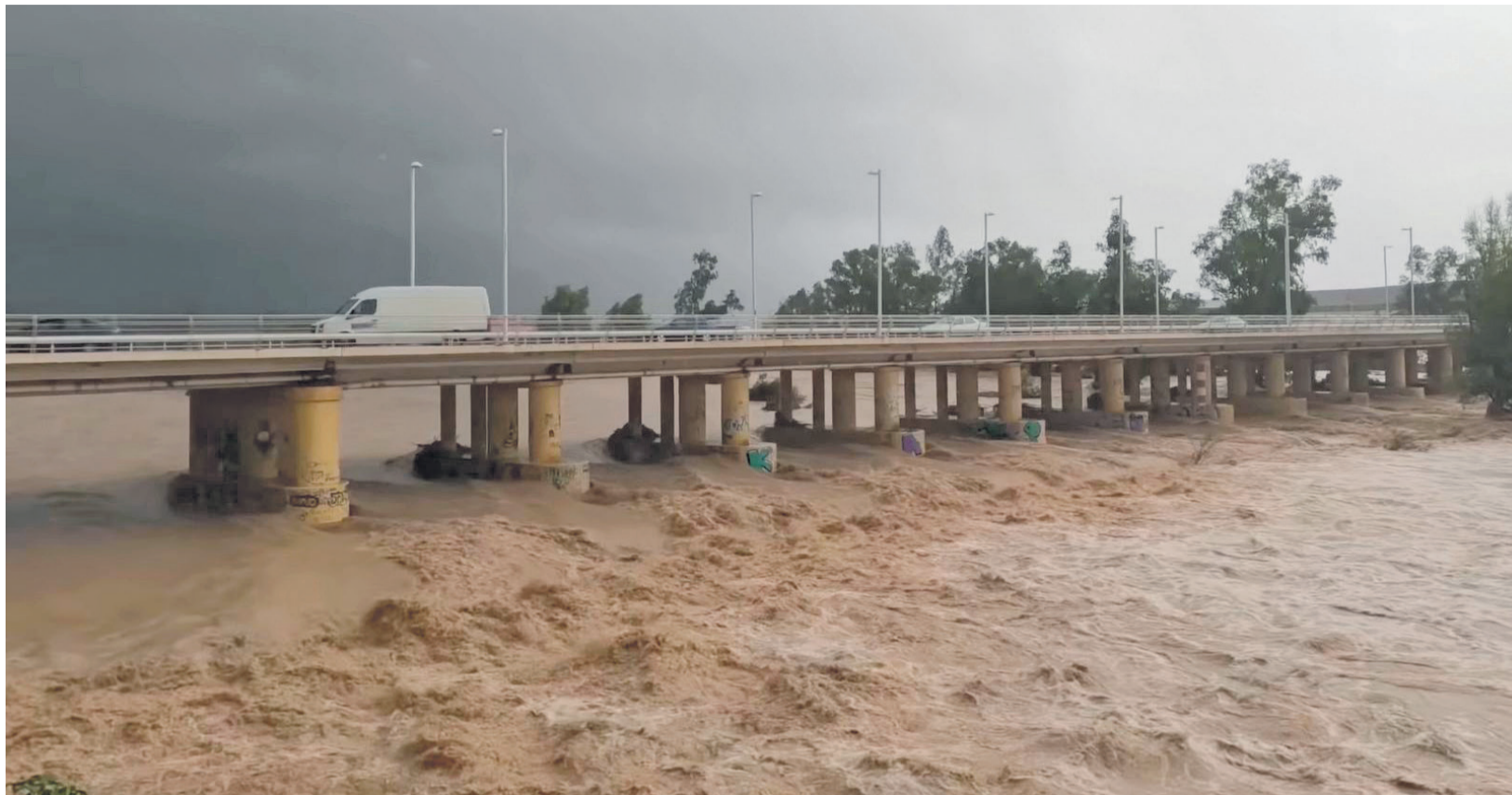
El río Magro, a su paso por Carlet, el 29 de octubre por la mañana.

LA COMARCA TODAVÍA LUCHA PARA RECUPERARSE DE UNA RIADA QUE EN ALGUNOS PUNTOS SUPERÓ LOS 4.000 M 3 POR SEGUNDO