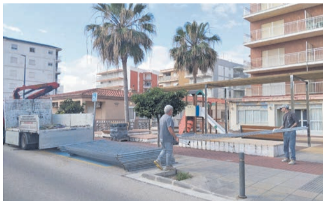
Operaris en una de les actuacions.