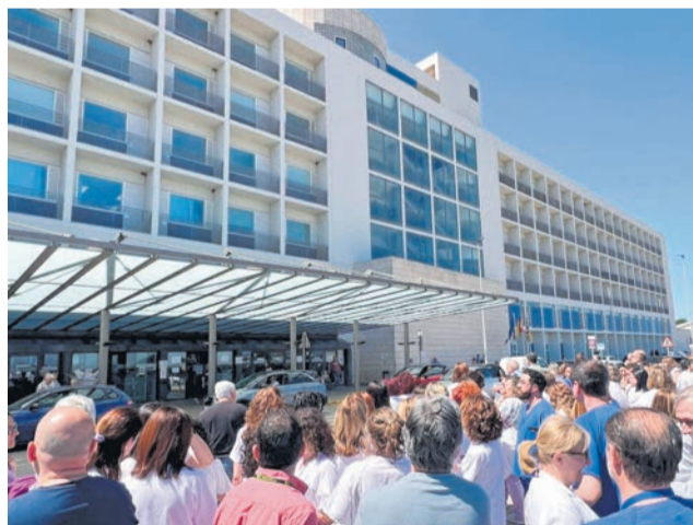
Professionals de l'Hospital de la Ribera.

El Comitè d'Empresa del personal laboral subrogat del departament ha fet una crida a la mobilització davant el que qualifica de "maltractament institucional" per part de la Conselleria de Sanitat. Segons denuncien, després de set anys des que la Generalitat assumira la gestió directa de l'Hospital de la Ribera, no sols no s'han equiparat les seues condicions amb les del personal estatutari, sinó que han empitjorat.