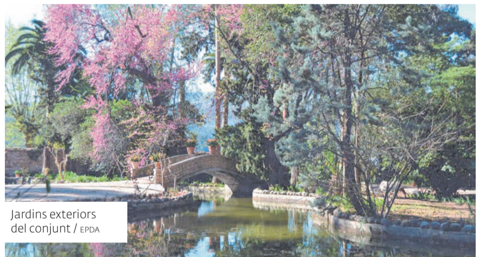
Jardins exteriors del conjunt / EPDA