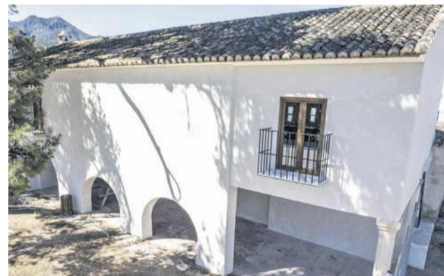
L'alqueria de la Servana, a Xeresa.