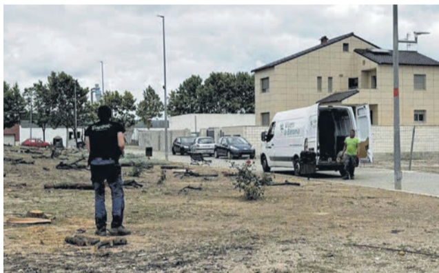
Treballs en una zona de Bellreguard.