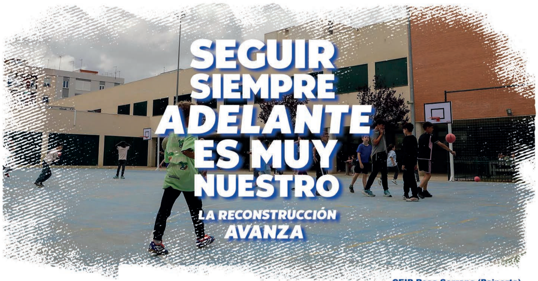
CEIP Rosa Serrano (Paiporta)

i, en l'última, formava part de l'executiva a la Safor com a secretari d'Organització. A més, des de setembre de 2023 és el president de la Mancomunitat de Municipis de la Safor, un càrrec que se li allarga dos anys, fins enguany dins d'un acord de rotació amb Compromís.