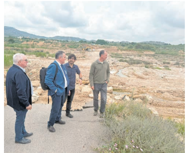
Visita del vicepresident a Alfarb i Alginet.