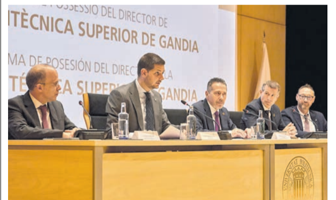
Acte de presa de possessió de la nova direcció.