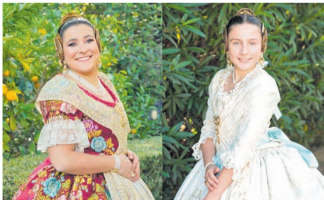
Les representants de l'any que ve.