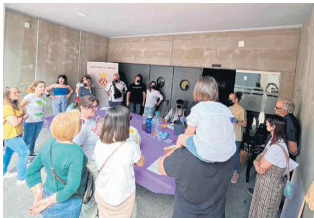
Activitat d'elaboració de sabó ecològic.

El regidor de l'Ajuntament de Corbera que s'estrena en esta legislatura en la gestió municipal, amb més imaginació que recursos econòmics, des de fa un any està programant el cicle ambiental anomenat ECorbera. Més que un joc enginyós de paraules, aquesta iniciativa ja porta més d'una decena