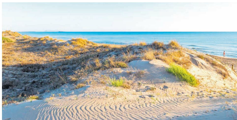
Les platges de Guardamar de la Safor (sup.) i Oliva (inf.); alcaldes.