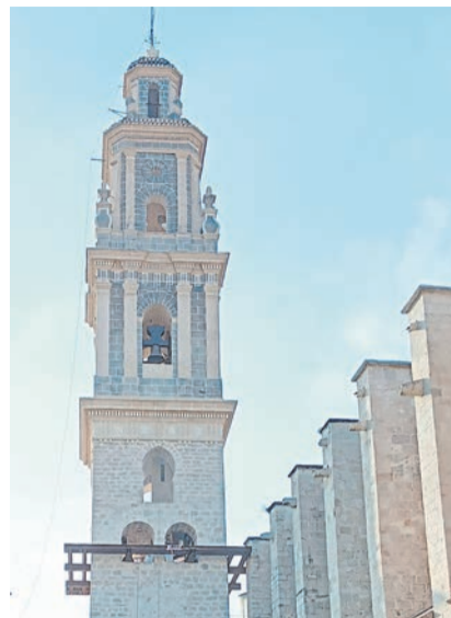
El campanar.

Com han explicat des del Museu Arqueològic de Gandia, la intervenció al