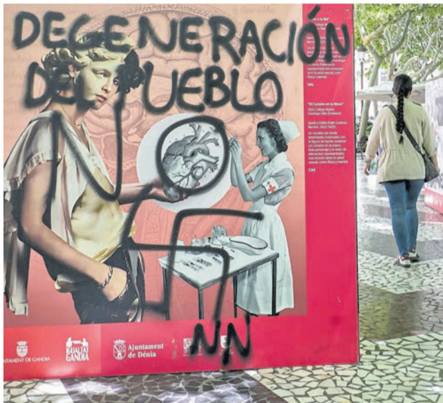
L'exposició de Gandia vanalitzada amb pintura negra.

■ VANDALITZEN AMB PINTURA NEGRA UNA EXPOSICIÓ LGTBI+ AMB ESVÀSTIQUES I INSULTS COM "PUTERS"