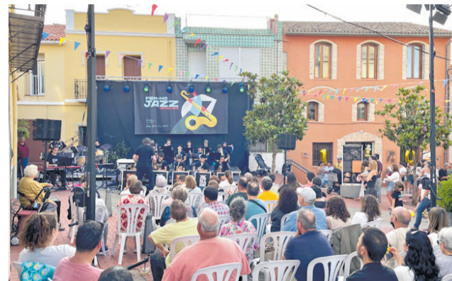
Un instant de la celebració. / EPDA