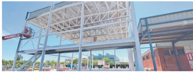
De dalt a baix: Alfadalí, conservatori i Gregori.

Els treballs al Conservatori Professional de Música Josep Climent consisteixen en la construcció d'un nou aulari i l'adequació de les instal·lacions. El projecte té un pressupost total de 1.379.396,82 euros, dels quals, a hores d'ara, ja s'han executat 381.874,86 euros.