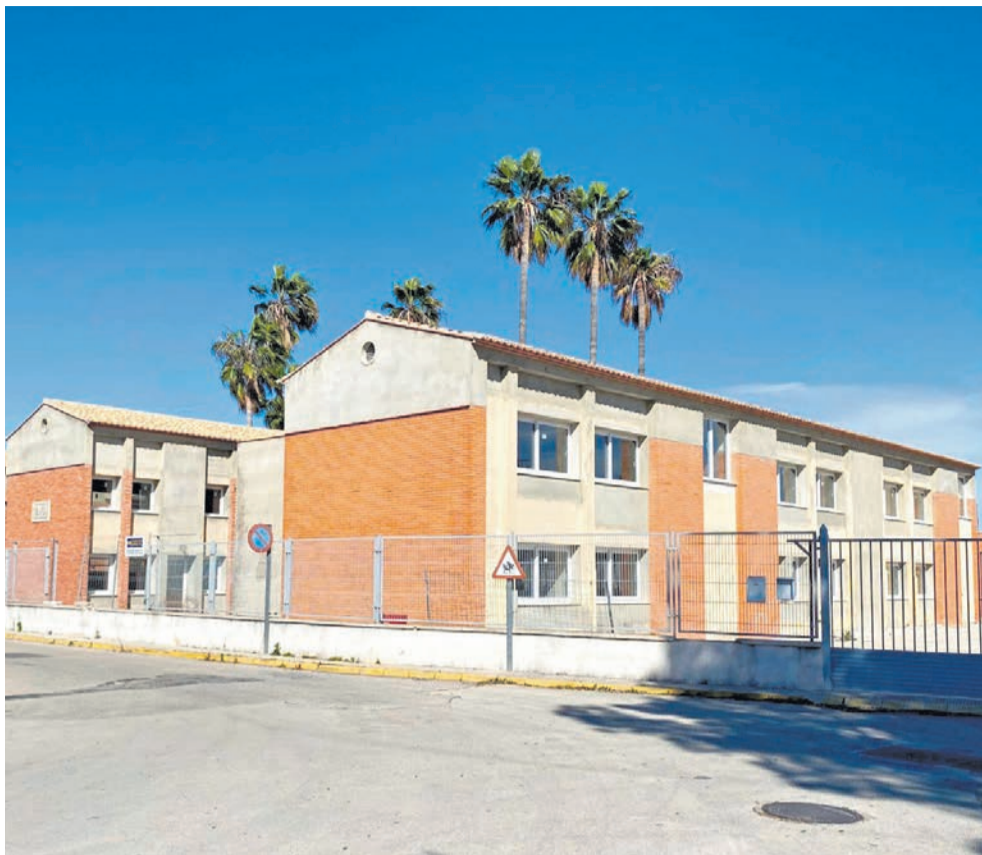
Exterior i interior de les Escoles Velles d'Alfauir.