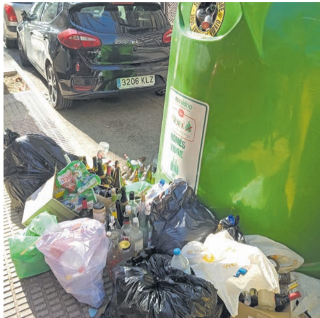
Contenedor desbordat en un carrer de Cullera.

En un comunicat contundent, el PP local assegura que els contenidors porten diversos dies sense buidar-se, especialment a les zones de major trànsit turístic, i critica que això es produïska en ple cap de setmana d'alta ocupació, quan més caldria reforçar els serveis de neteja. "Ens trobem en un dels períodes amb més presència de visitants a la ciutat i, lluny d'oferir una imatge neta i cuidada, Cullera presenta carrers bruts, contenidors desbordats i una falta total de