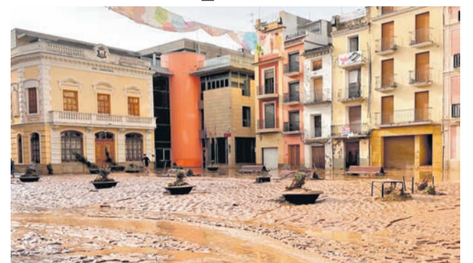
La plaza de Algemesí después de la dana.

El estudio subraya que desde la dana la oferta de viviendas en venta ha descendido en promedio un 31,3 %, intensificando la presión sobre el mercado. El precio medio de venta se sitúa en 171.428 euros, con un aumento medio del 18,8 % en los municipios afectados.