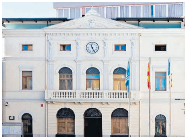
Façana de l'ajuntament de Tavernes.