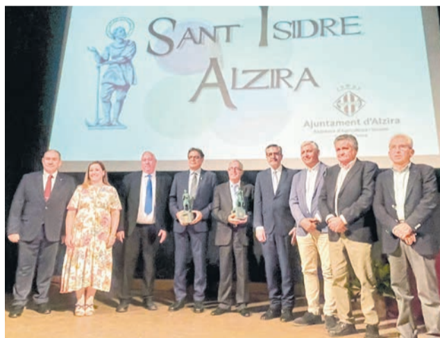
Autoridades, homenajeados y festeros el día de la celebración de San Isidro en Alzira.

donde se ofició una misa en memoria de todos los agricultores alzireños fallecidos. La ceremonia religiosa tuvo lugar en el altar de Sant Bernat, que acoge las imágenes de los santos Abdón y Se-