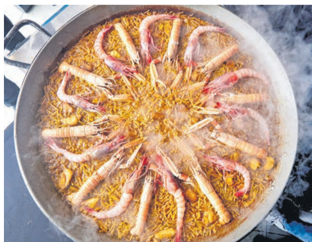
Diversos instantes del día de la presentación de la cincuentena edición del concurso.

to de nuestra historia y de nuestra forma de acoger; una forma de acoger en la calidad, la innovación y la excelencia que aplicamos