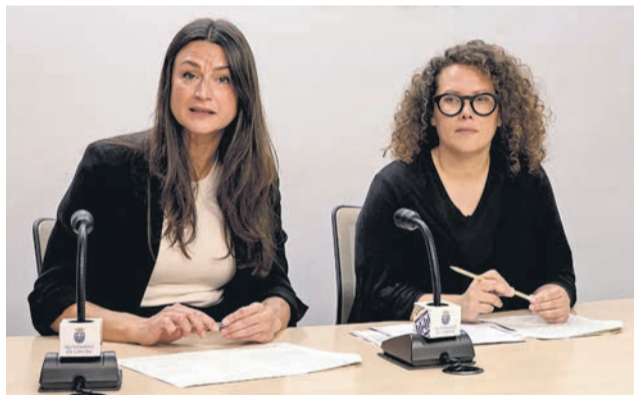
Regidores en la presentació de la campanya.