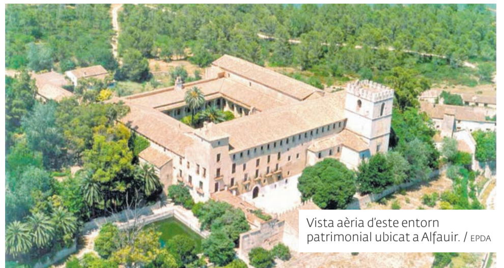
Vista aèria d'este entorn patrimonial ubicat a Alfauir. / EPDA