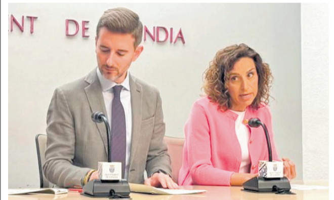
Vicent Sol. / EPDA