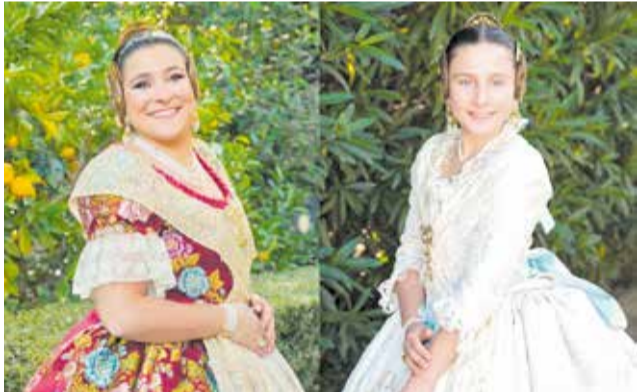
Les representants de l'any que ve.