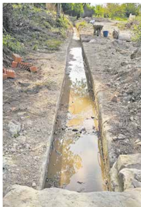
Uno de sus espacios naturales más emblemáticos: el Chorrero de la Garita.