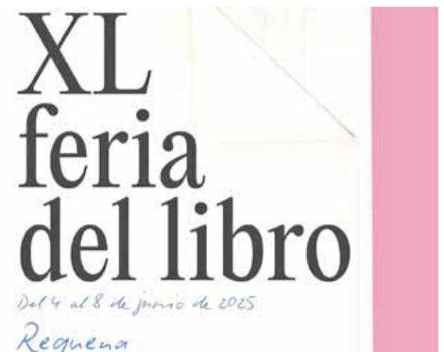
Cartel de la XL Feria del Libro de Requena.