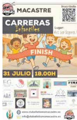
Cartel de la carrera.

Como novedad este año, la organización ha incluido trofeos para los tres primeros clasificados de cada categoría, cuyo reglamento puede consultarse en la página web oficial del Club de Atletismo de Macastre. Además, todos los participantes que crucen la línea de meta recibirán su medalla finisher, en reconocimiento a su esfuerzo y dedicación.