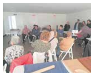
Participants. / EPDA