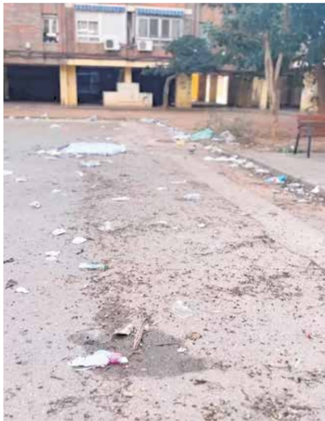
Brutícia en el barri de Baladre.

Catalán ha denunciat que “l'abandó que pateix Bala-