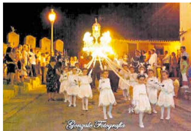
Processó de la Verge del Fonament.