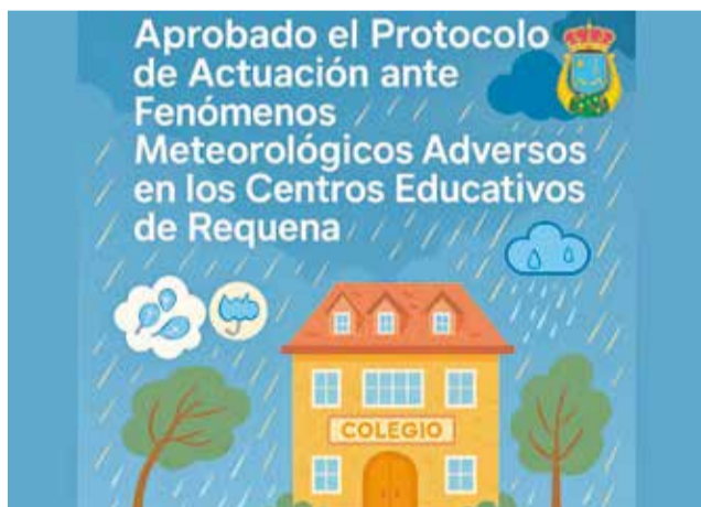
Cartel del nuevo protocolo de Requena.

Este documento de actuación recoge procedimientos concretos para cada tipo de fenómeno y adapta las respuestas a las características específicas de cada centro educativo. También establece protocolos de comunicación coordinada entre el consistorio, los colegios e institutos, y las fami-