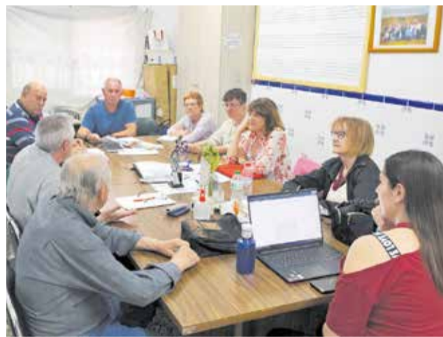
Reunió de Compromís amb veïns de La Forja. / EPDA

Entre les principals preocupacions exposades per l'associació, destaca la dificultat d'accés a una vivenda digna i l'oposició a la reforma urbanística impulsada pel govern local, que preveu la construcció de 1.870 vivendes en torres al barri de Churruca, Ferroland i Els Metalls, fet que suposaria una saturació poblacional.