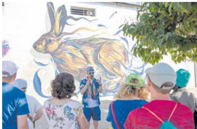
Uno de los murales de Graffitea Cheste.