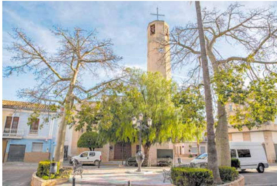
Plaça Major de Casinos.

En l'àmbit musical es distingiran noms com Agustín