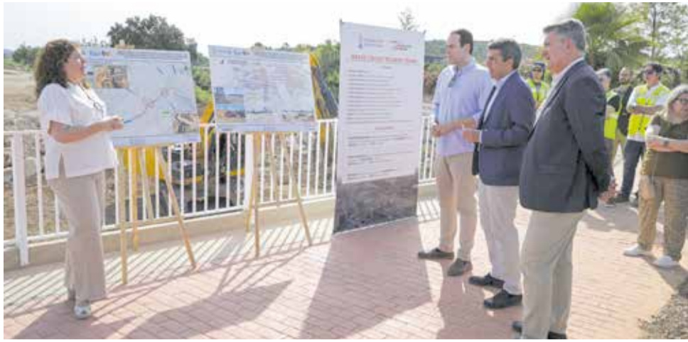
Un momento durante la presentación de la inversión en Cheste.