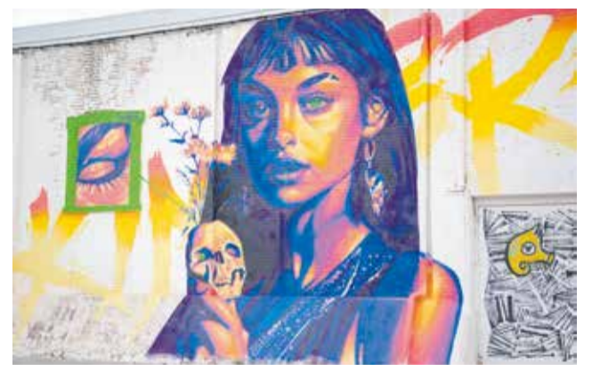
Arte de Graffitea Cheste.

ciones de esta edición, fuera del festival, así como un mural en defensa de la infancia Palestina, a iniciativa de UNRWA, a cargo de La Nena Wapa. También se ha celebrado una nueva edición de Feminist Art, con mujeres que han intervenido un muro creando obras de reivindicación feminista.