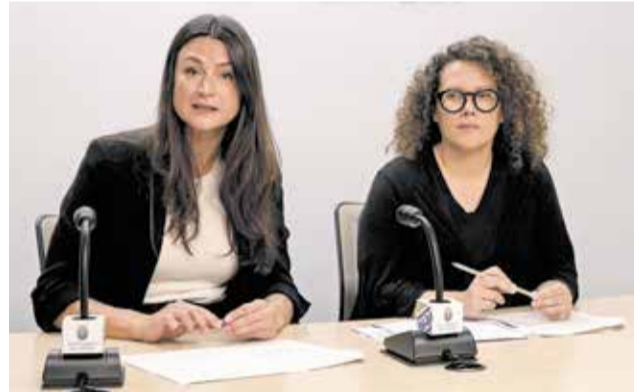
Regidores en la presentació de la campanya.