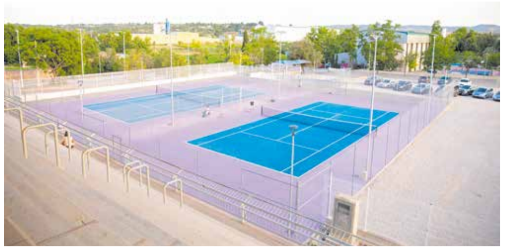
Las nuevas pistas de tenis municipales.