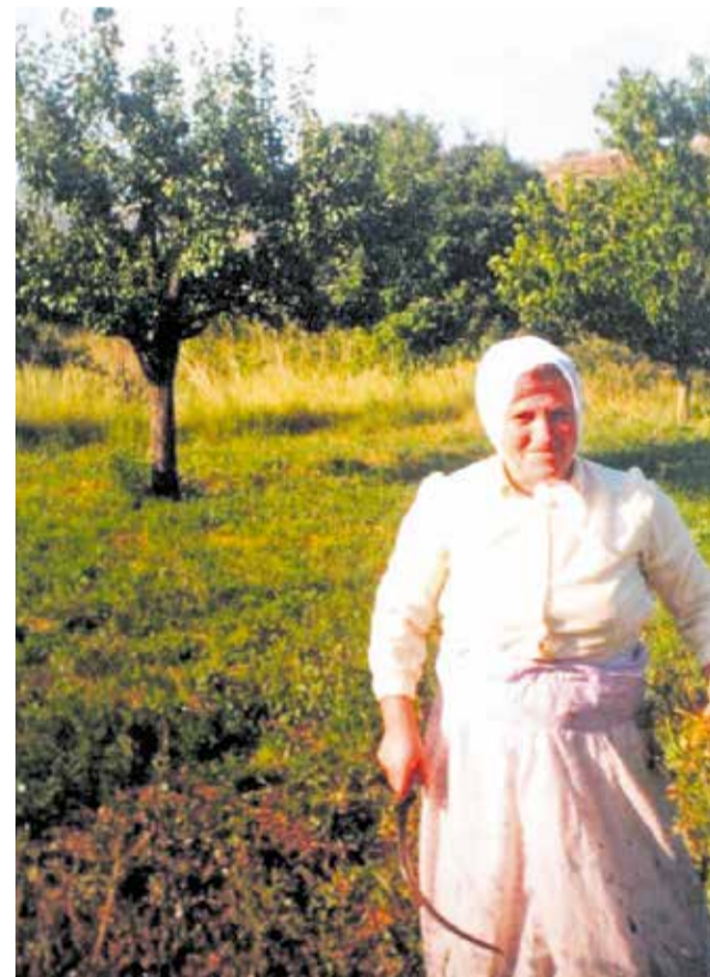
Diferentes oficios perdidos del interior valenciano.

mundo que ya no los necesitaba. No hubo despedidas. Solo silencio. Como si todo ese saber no mereciera ni la cortesía del recuerdo. Como si el que sabía encantar un cántaro no tuviera nada que decir frente a quienes vinieron a explicarle qué era el mundo rural.