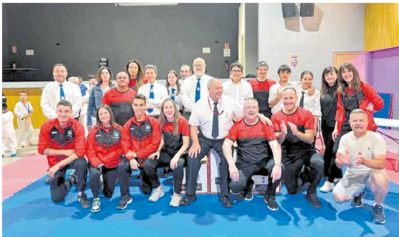
Integrantes del Club Yoshitaka durante el evento celebrado en Camporrobles.

A lo largo de las distintas categorías, los participantes demostraron su evolución técnica y su compromiso con los valores del karate, en una