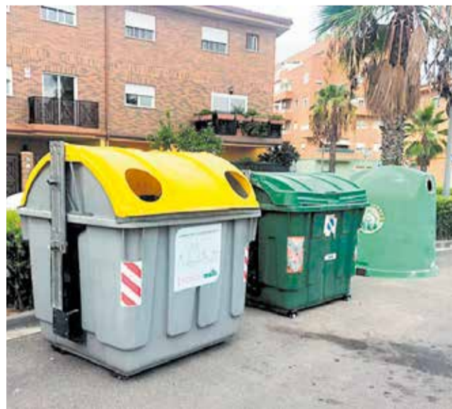
Contenidors de fem al Port de Sagunt.

El portaveu, Eduardo Márquez, ha qualificat este increment com “un autèntic despropòsit”, sobretot tenint en compte que l'Ajuntament de Sagunt presenta comptes sanejats, amb un superàvit de 420.000 euros l'any 2024 i un romanent de tresoreria de més de 2,8 milions d'euros. “És incomprensible que, amb estes xifres, el govern municipal vulga carregar més de