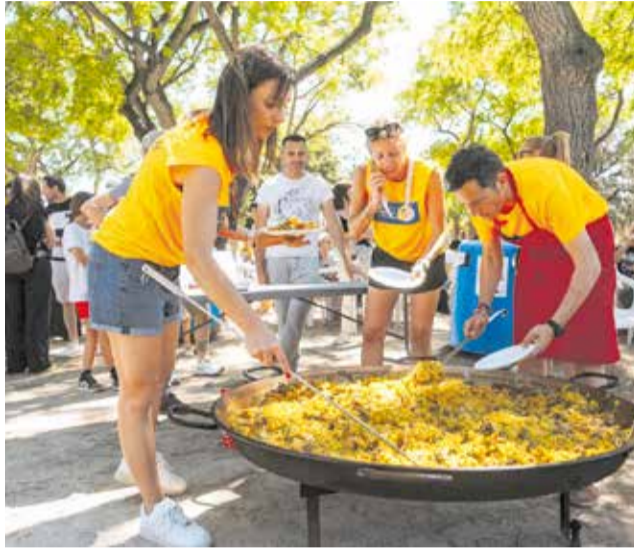
Una de les activitats a Canet del cap de setmana.

L'alcalde, Pere Antoni, destacava la importància d'esta data per a la localitat: "Comptàvem amb la renovació de la