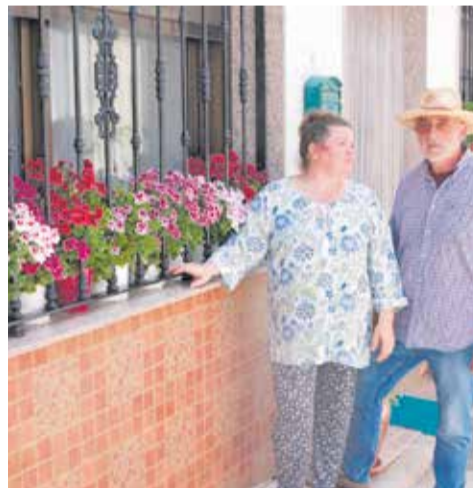
Diferentes casas decoradas para el concurso 'Poneos Bonicas'.

coran, sino que aportan vida, color y encanto. Especial mención ha recibido la aldea de Casas de Moya, cuyo esfuerzo colectivo ha sido calificado como "digno de admiración" por el nivel de cuidado y embellecimiento.