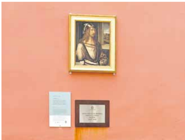
'Autorretrato', de l'artista Durero.

La instal·lació arriba en un moment clau per a Algemesí, que encara treballa per recu-