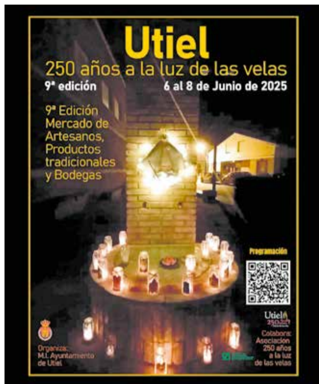
Cartel de 'Utiel, 250 años a la luz de las velas'.