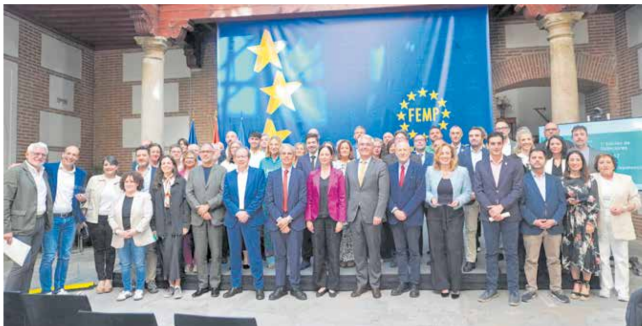
Diferentes momentos durante la gala celebrada en la sede de la FEMP en Madrid.

sidente del Consejo de Transparencia y Buen Gobierno, el presidente de la Agencia Española de Protección de Datos y el presidente de la Autoridad Independiente de Protección del Informante, así como la Secretaria de Estado de Función Pública.