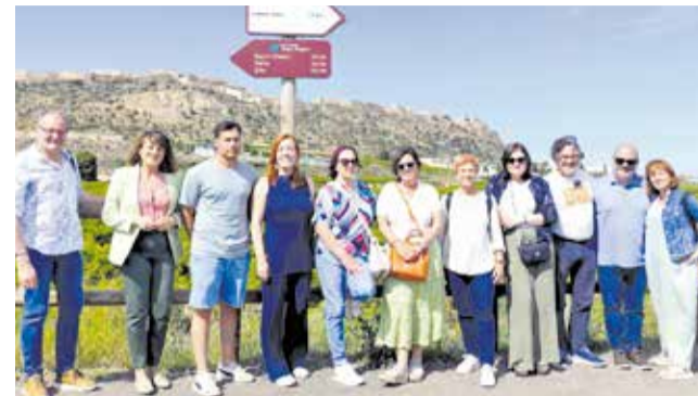
Representants en l'itinerari de la Via Verda.

Este recorregut ha posat en valor esta antiga infraestructura ferroviària convertida en un espai natural que connecta municipis i ofereix