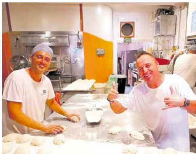
El premi de caràcter local és per al Forn Regina.

Tal com es fa constar a l'expedient municipal, l'Ajuntament de Benissanó atorga el premi de caràcter local al Forn Regina i reconeix expressament les quatre generacions que s'han dedicat a treballar en l'elaboració de pa i dolços artesanals. Durant estes quatre generacions, han mantingut les portes obertes de manera ininterrompuda, oferint un producte fruit de l'experiència transmesa de generació en generació que fonamenta el seu èxit en la confiança i en la proximitat, creant vincles que van més enllà d'allò que considerem "només" un comerç. En definitiva, este és el premi a un