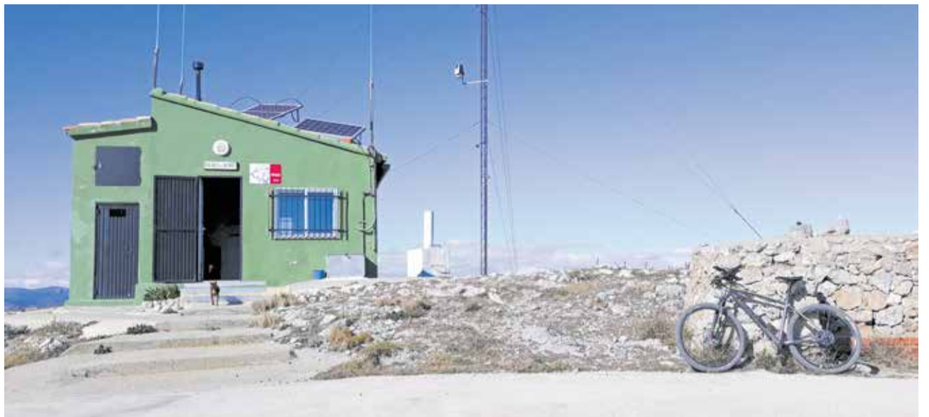
El entorno natural de Montmayor, en Altura.

tal de l'Horta Sud, que parte de Monte Levante y recorre más de seis kilómetros por la Serra Perenxisa, donde se puede disfrutar de algo de paz y donde los perros pueden estar sin correa en algunas zonas.