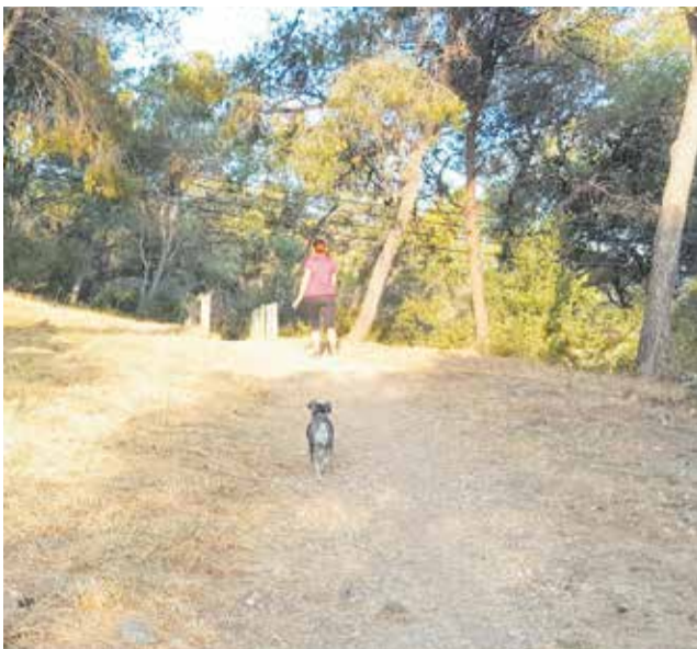
Un perro pasea por el sendero de El Vedat de Torrent.