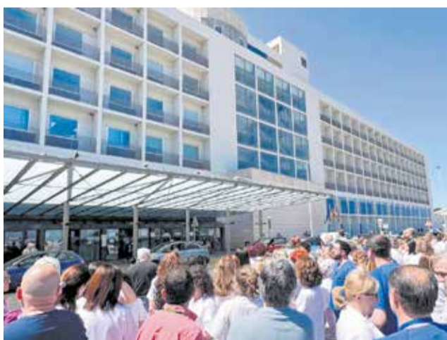
Professionals de l'Hospital de la Ribera.

El Comitè d'Empresa del personal laboral subrogat del departament ha fet una crida a la mobilització davant el que qualifica de "maltractament institucional" per part de la Conselleria de Sanitat. Segons denuncien, després de set anys des que la Generalitat assumira la gestió directa de l'Hospital de la Ribera, no sols no s'han equiparat les seues condicions amb les del personal estatutari, sinó que han empitjorat.