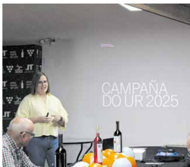
Diferentes momentos durante la presentación de la nueva campaña de la DO Utiel-Requena.

bito local. La campaña promueve la expansión nacional e internacional de la marca, proyectando los vinos de la DO como una opción sólida, auténtica y competitiva en cualquier mercado. El mensaje es claro: lo local puede ser también universal.