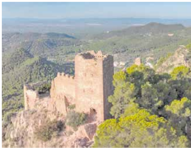
Castillo de Serra.