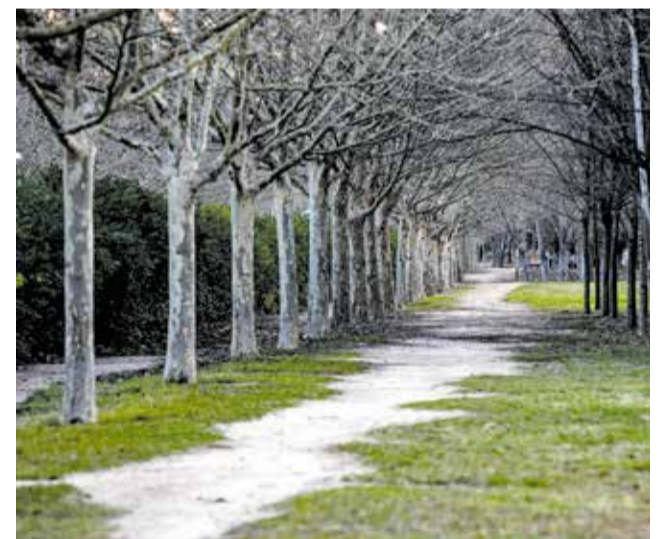
El parque de San Vicent en Llíria.