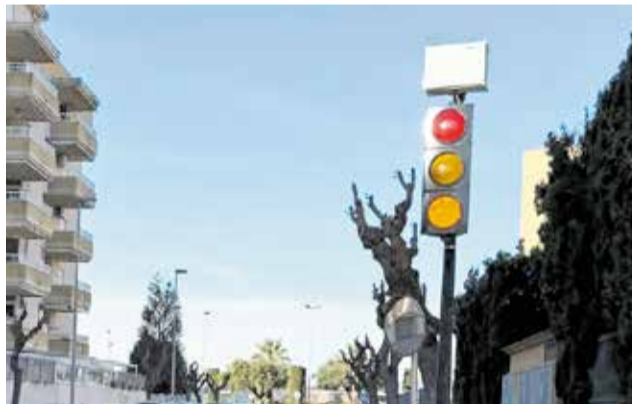
El semàfor foto-roig de Canet.