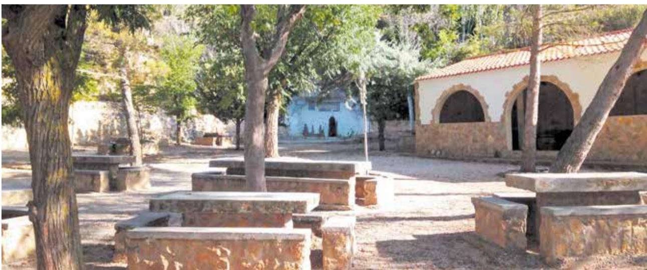
Un merendero para poder descansar con las mascotas en el Molón.

El festival contará con una zona de esparcimiento habilitada, áreas de hidratación y sombra para los animales, y un espacio reservado para adopciones, donde se facilitará el contacto entre familias y animales en busca de un hogar.