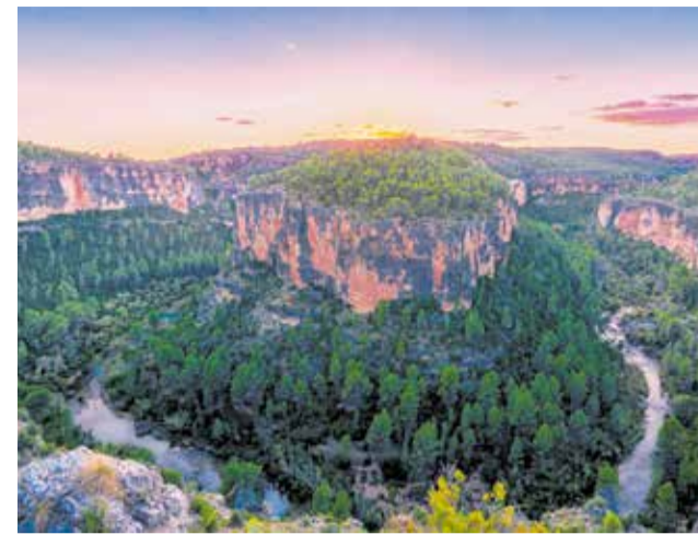
Parque Natural de las Hoces del Cabriel.