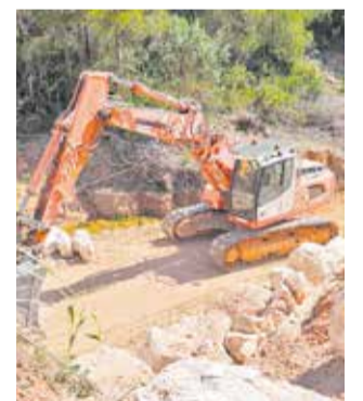
Trabajos en Chera.

Paralelamente, en los terrenos adquiridos recientemente por el Ayuntamiento en la zona recreativa del Embal-