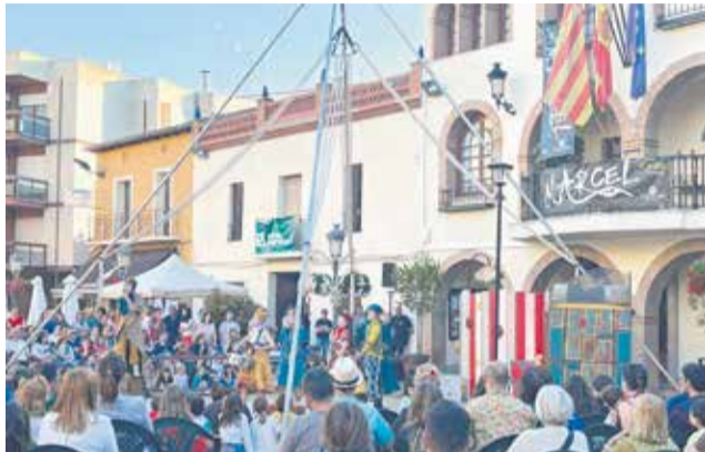
Un dels espectacles de la IX MARCEL de l'Eliana.

Com era habitual, la mostra s'inicià el divendres 9 amb la secció Off i el debut de Dansart l'Eliana, una entitat dedicada a la dansa en totes les seues formes, que presentà l'espectacle 'Un viatge en el temps'. La vesprada es completà amb les actuacions de les companyies locals Aplae (El hechizo del revés) i Teatreliana (Talento en la plaza).