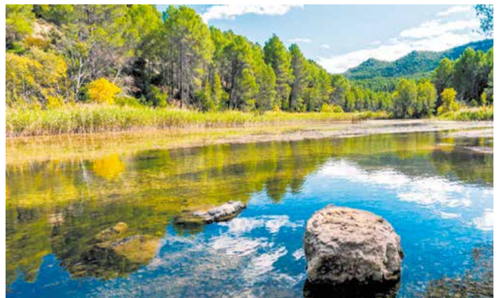
Diferentes instantáneas del municipio de Villargordo del Cabriel.