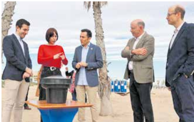
Visita de la ministra de Ciència fa uns mesos.