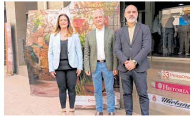
Un momento durante la jornada.