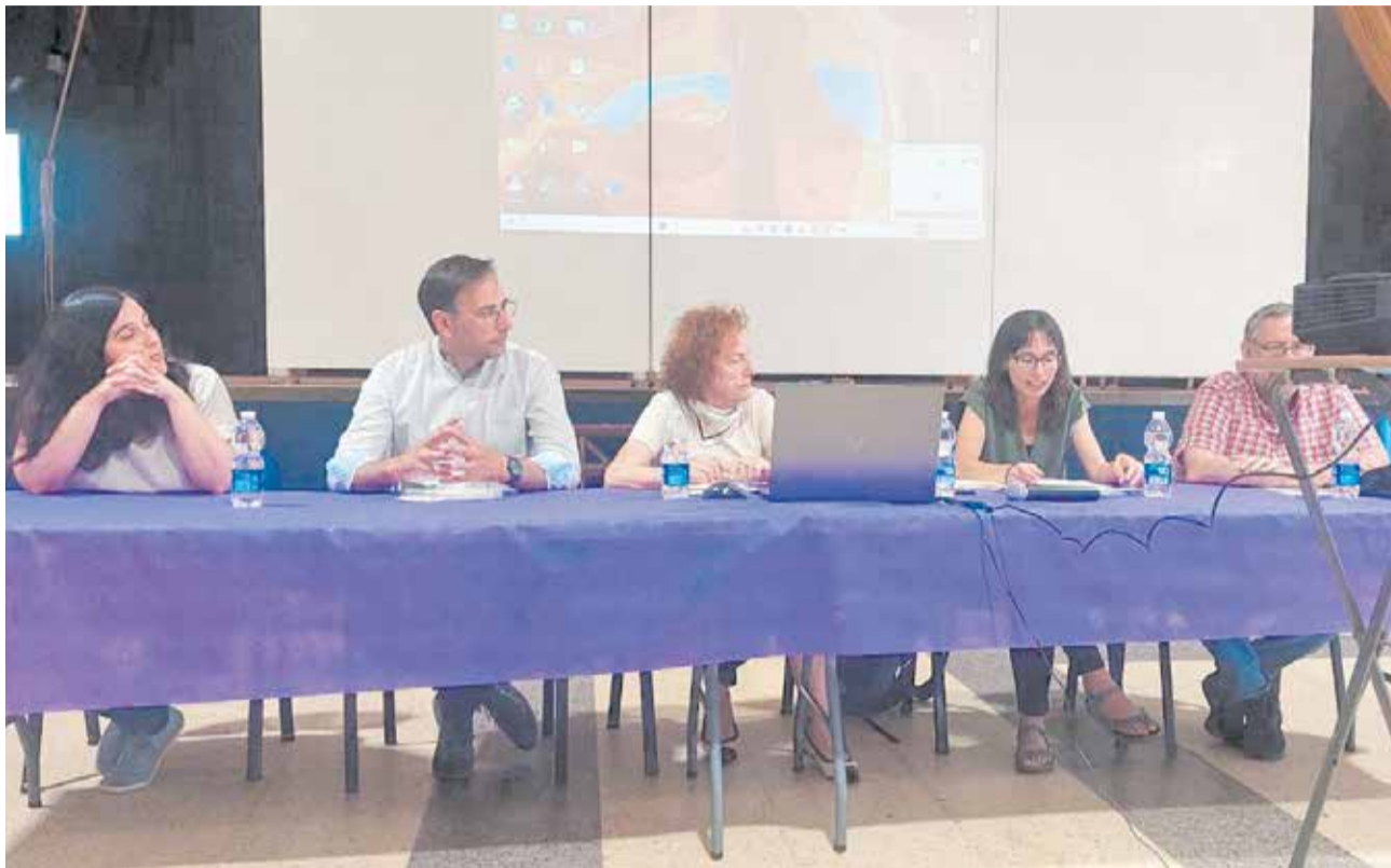
Un momento durante una de las ponencias del seminario.

El seminario abordó el papel del silvopastoralismo –el uso controlado de rebaños de