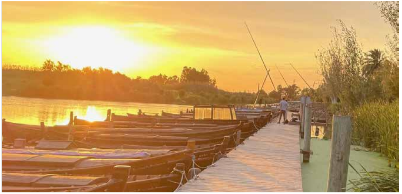
Un capvespre en l'embarcador del Port de Catarroja.

Capvespres més urbans, davant edificis emblemàtics, com la Ciutat de les Arts i les Ciències, també sorprenen a València. El complex arquitectònic dissenyat per Santiago Calatrava oferix un ambient futurista. Al capvespre, les cridaneres estructures s'il·luminen amb tons daurats i rosats, que es reflecti-