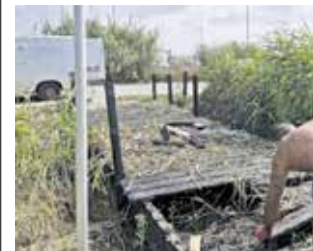
Els treballs a la zona. / EPDA