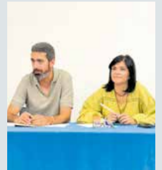
La gestora en Moncada.