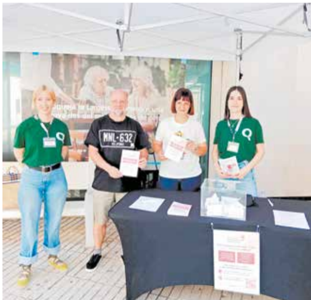
L'estand per arrecplegar les propostes.

Poden presentar propostes totes les persones físiques, empadronades o no a Albuixech, així com qualsevol associació o entitat pú-