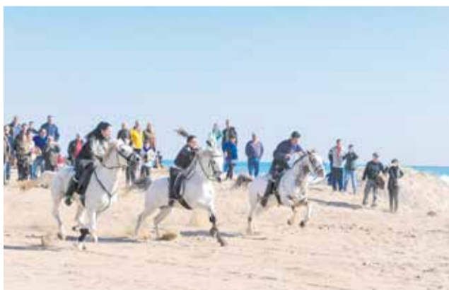
La carrera de l'any passat.

La "Carrera de Joies" és una competició equestre centenària, vinculada històricament a les festes patronals de Sant Antoni Abat, patró dels animals. La seua singularitat rau en el fet que els genets munten sense cadira i competeixen per la "joia", un mocador de seda de colors sobre una corona de llorer que an-