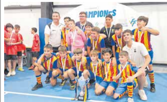
Els components de l'equip guanyador.