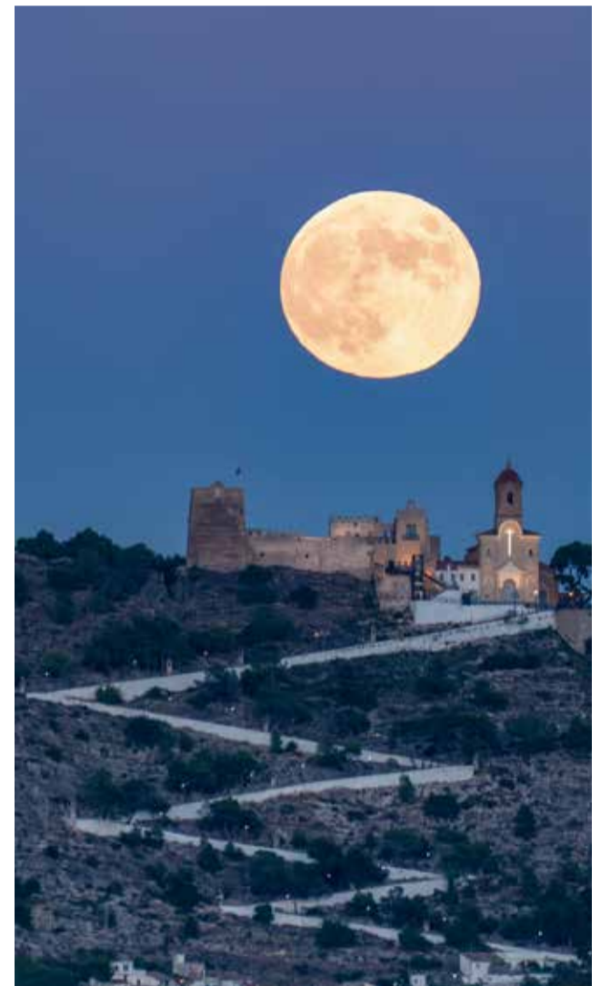
La lluna sobre el Castell de Cullera.

poble i d'una rica gastronomia. Però si vols viure al màxim les meravelles de la naturalesa, la millor opció és perdre's pel Parc Natural Hoces del Cabriel. Este tresor natural és un espai protegit de més de 31.000 hectàrees. Un lloc especial i únic gràcies a la seua flora, fauna, paisatge i característiques geològiques. Fer una passejada per este benvolgut paisatge d'interior et permetrà sentir la naturalesa en primera persona i admirar la bellesa, la pau i els increïbles capvespres que desprén este meravellós destí.