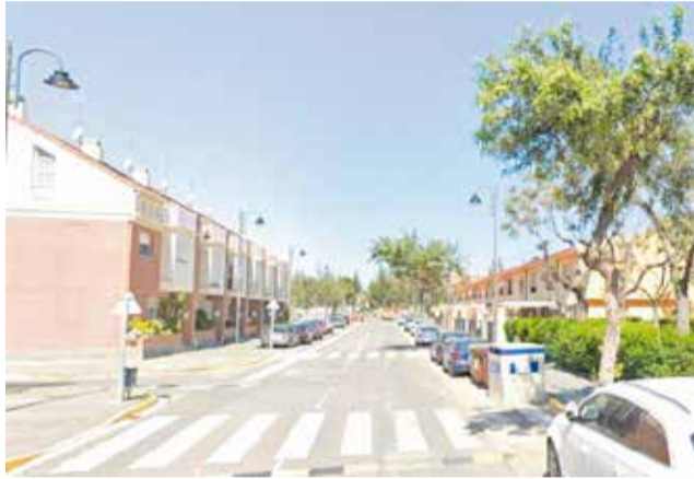
El veïnat de les vivendes okupades a Museros.

Els residents pròxims als 14 unifamiliars okupats en el carrer Pintor Sorolla de Museros des de desembre de 2023, denunciaven fa uns pocs dies la situació que viuen diàriament, que ha arribat a un punt crític amb els últims esdeveniments, amb un incen-