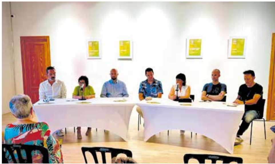
La presentació de Juliol Musical a Majors54, amb la regidora i participants.

Castellano recordar que des dels seus inicis, "les prioritats del cycle han sigut difondre i intentar arrelar la cultura musical a tota la ciutadania, sense exclusió, gra-