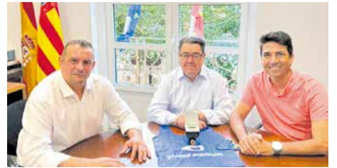
L'acte d'entrega del comptador.