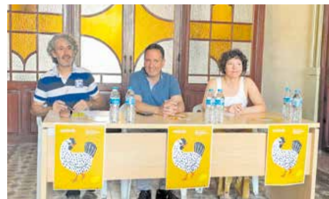
La presentació de la mostra.