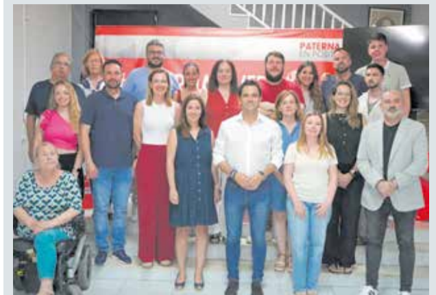
Sagredo y la nueva ejecutiva municipal.

■ SAGREDO, FRAN LÓPEZ I CHAVARRÍA HAN SIDO REELEGIDOS COMO SECRETARIOS GENERALES