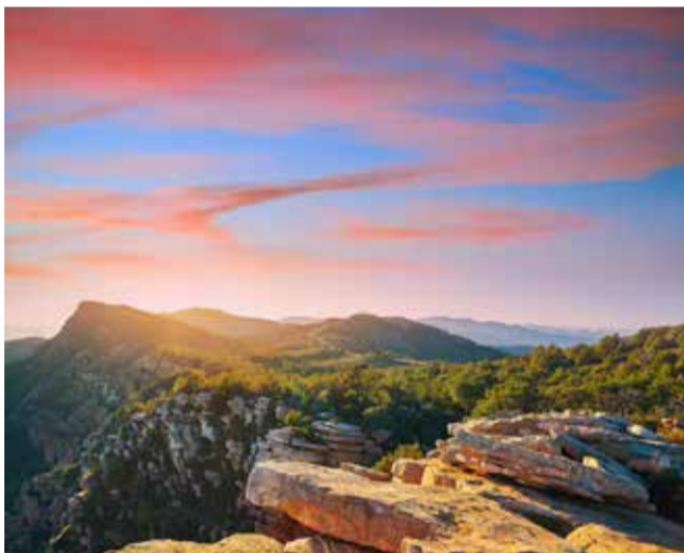
La posta de sol dalt del Garbí.

xen en els llacs artificials circumdants.