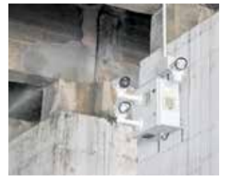
Cámara en Burjassot.