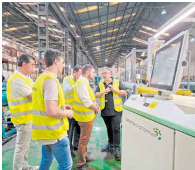
La visita de les autoritats locals a la fàbrica.

Isoltubex, dedicada a la fabricació de components per a la conducció d'aigua i gas, compta actualment amb una plantilla de 100 treballadors a la Pobla de Farnals. Després de la seua recent adquisició per part del grup alemany Ostendorf Kunststoffe, l'empresa planeja ampliar la seua capacitat productiva i logística, amb l'objectiu de