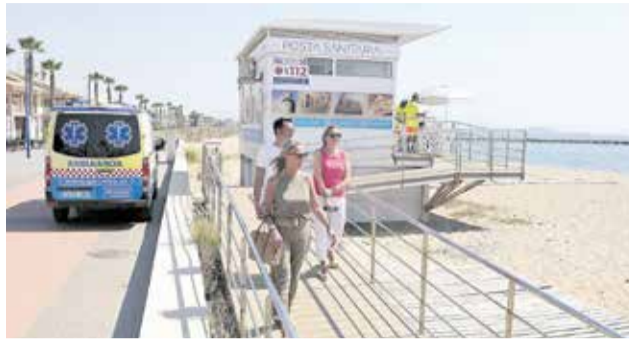
La ambulancia en la posta sanitaria.

tacan que este refuerzo de la Conselleria de Sanidad supone un paso importante para garantizar la seguridad y el