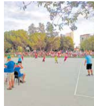
Un partit de l'any passat.

Cada equip podrà inscriure fins a 10 jugadors i haurà d'abonar una quota de 95 euros. Les inscripcions podran realitzar-se de mane-