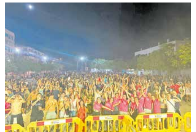
Uno de los actos de las fiestas del año pasado.

En el plano deportivo, está prevista una nueva edición del Trofeo de Pilota Tio Pena, una de las citas tradicionales más emblemáticas del calendario festivo. Este torneo, que