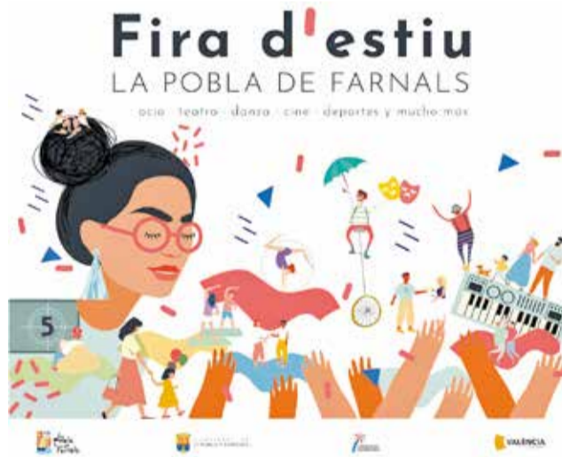
El cartell anunciador.

Les festes en honor a la Verge del Carme tindran lloc del 10 al 16 de juliol, organitzades per la Clavaria. Hi haurà sopar popular, música, paelles