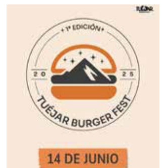
Cartel del festival.

La programación arrancará a las 19:00 horas con la actuación del grupo La Pedrogil. Una hora después, a las 20:00 horas, se abrirán oficialmente los foodtrucks, donde se podrán degustar hamburguesas artesanas elaboradas por las carnicerías del pueblo, un auténtico homenaje a la carne local y al talento de los productores tujanés.