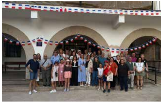
Recepción a la delegación francesa.

La jornada del viernes estuvo dedicada a conocer los re-