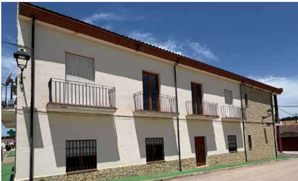
Espacio que albergará el Punto de Atención Diurna para personas mayores.

Benagéber dispone de 922.956 euros del Pla Obert d'Inversions, 88.072 más que en los planes de la pasada legislatura. "Este plan es mucho más ágil, flexible y abierto; es importante que se pueda planificar para toda la legislatura", ha recalado. A la inversión del Pla Obert hay que