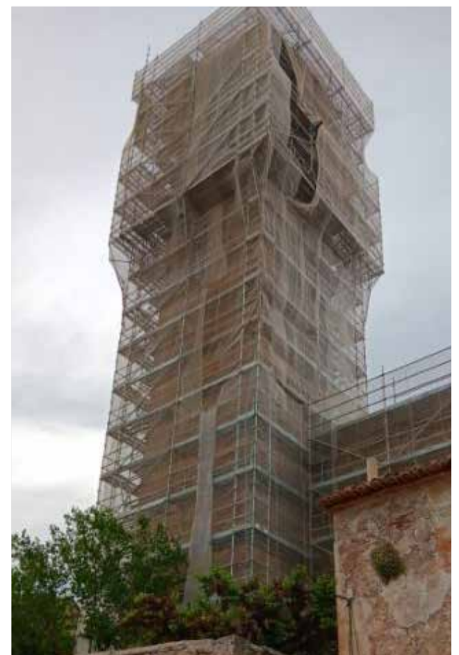
Trabajos en el campanario de Andilla.

Con esta actuación, Andilla reafirma su compromiso con la conservación de su legado histórico y cultural, al tiempo que mejora la seguridad y la puesta en valor de uno de los símbolos más representativos del municipio.