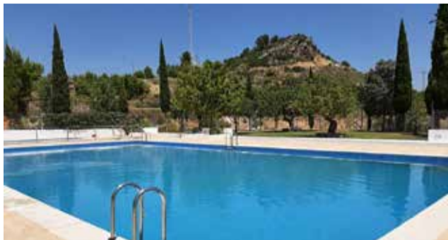
Piscina de Losa del Obispo.

Durante las últimas semanas, el Ayuntamiento ha llevado a cabo una serie de actuaciones de renovación y embellecimiento, apostando por un espacio más accesible, cómodo y sostenible. Entre las mejoras más destacadas se encuentra la renovación completa del césped en las zonas de descanso, así como la plantación de nuevos árboles que permitirán aumentar significativamente las zonas de sombra natural, mejorando la experiencia de los usuarios en los días más calurosos.