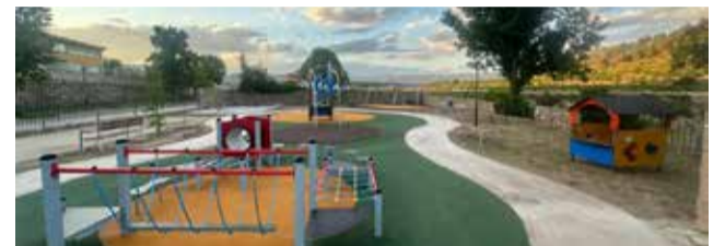
Nuevo parque Don Valeriano de Alpuente.

El nuevo espacio ha sido diseñado eliminando barreras físicas y favoreciendo la autonomía y la participación. Entre sus elementos destacan las excavadoras de juego, una casita accesible, mesas de picnic adaptadas, juegos de mesa integrados y un columpio de cesta, todo ello dispuesto sobre pavimentos lisos y zonas amplias para facilitar el acceso de personas con movilidad reducida o carritos.