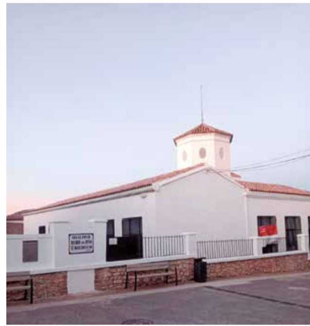
El colegio de Higueruelas tras su renovación integral.

Otro de los logros más notables de la legislatura es el avance en la lucha contra la despoblación. Higueruelas ha