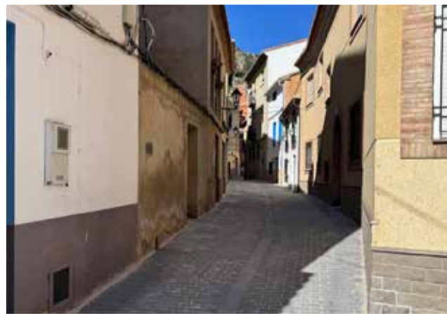
Nuevo adoquinado en las calles de Tuéjar.

Otra de las mejoras ha sido la instalación de nuevas cajas eléctricas tipo esquema 10, preparadas para soterrar el