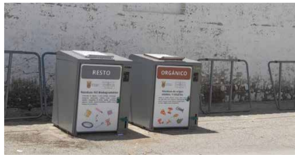
Isla de reciclaje en el municipio de Alcublas.

El nuevo modelo ha supuesto la reducción de contenedores convencionales en la vía pública, una de las medidas más visibles y criticadas. "Hemos ampliado los contenedores de