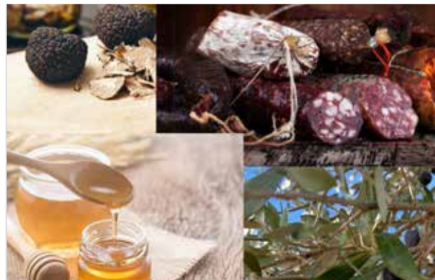
Productos de la RBAT.

Una iniciativa que pone en valor los productos de kilómetro cero y el trabajo artesano, contribuyendo al desarrollo económico sostenible del territorio declarado Reserva de la Biosfera por la UNESCO.