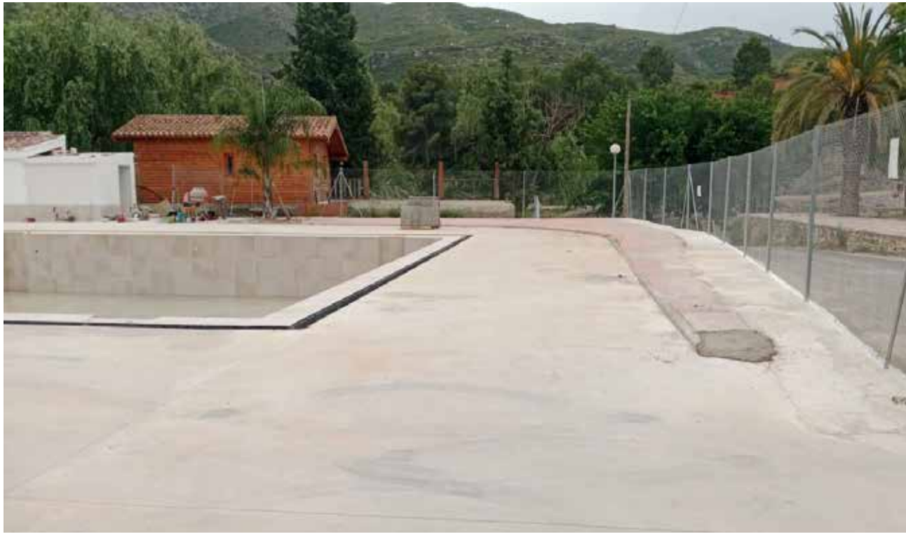
Estado de las obras de la piscina municipal de Bugarra.

Entre las actuaciones más relevantes se encuentra la reparación del sistema de depuración de agua, la renovación de componentes eléctricos y la sustitución de partes del alcatado que presentaban deterioro. Asimismo, se está reconstruyendo la