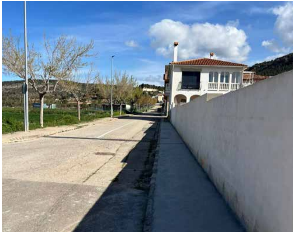
Una calle en la zona de la Tabla mateo de Titaguas.

Todas las actuaciones están siendo ejecutadas bajo un