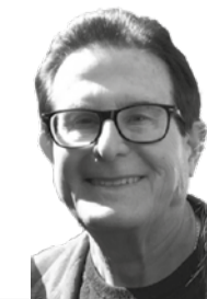
Francisco Camps Muñoz

Garaballa luce su ambiente, su gentío ... a la virgen, le acompañan jotas airosas, se envuelve el aire de aroma de las rosas, volverá otro año más, con fe y con brío.