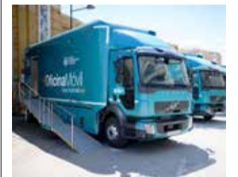
Oficina móvil.

Alcublas mantiene el servicio bancario con una oficina móvil de Cajamar