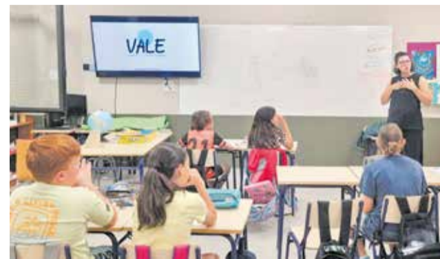
Alumnat del col·legi Serra Calderona de Gilet.