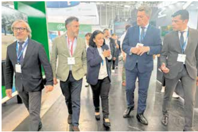
Una delegació autonòmica a Múnic.