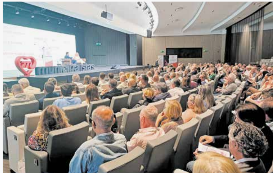
Enuentro de la Unión Municipalista en Madrid.

"La dana ha puesto de manifiesto la incapacidad de los grandes partidos para centrarse en el bien de la gente, plegados a sus estrategias políticas. Desde el