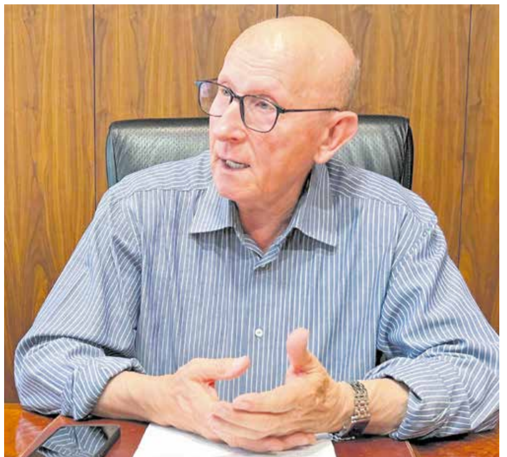
El presidente de la entidad durante la conversación con El Periódico de Aquí. / EPDA

► Voy a seguir reivindicando como el primer día. Continuaré insistiendo y pegaré muchos martillazos, como un buen escultor a su obra. Desde luego, si continuo es porque cuento con un equipo amplio, comprometido y con capacidad, que permite repartir las tareas y estar presentes donde se pueda defender el campo valenciano.