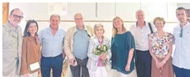
Visita de la filla i la neta de Rodrigo a Quartell.

Lorca en el Molí Nou a les 23h. La cita del dissabte 7 de juny serà en el Vaig moldre convertit en un Tablao flamenco. La cita d'este cap de setmana tanca el diumenge 8 de juny en Molí Nou amb la presentació de «La Calderona». La proposta conclourà el primer cap de setmana de juliol amb el con-