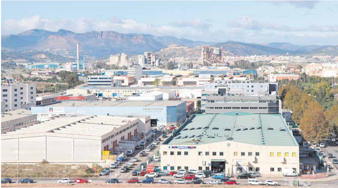
Vista del polígon industrial d'Inguinsa.