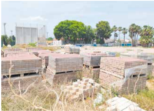
Zona on es construirà la pista coberta.

El projecte contempla la cobertura de la pista actual per a permetre la pràctica d'esport sota sostre i la instal·lació de plaques solars fotovoltaïques amb capacitat de generar 100 kW. "Així contribuïm a protegir el medi ambient amb