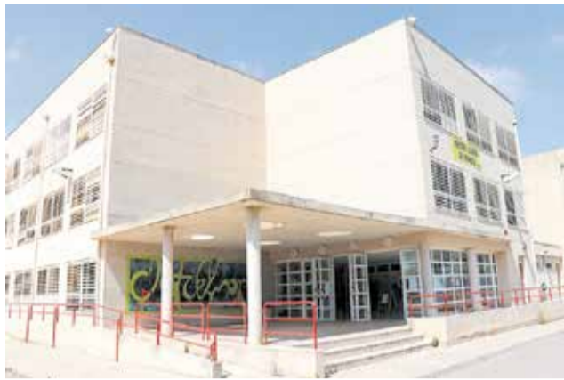
IES Clot del Moro, a Sagunt.