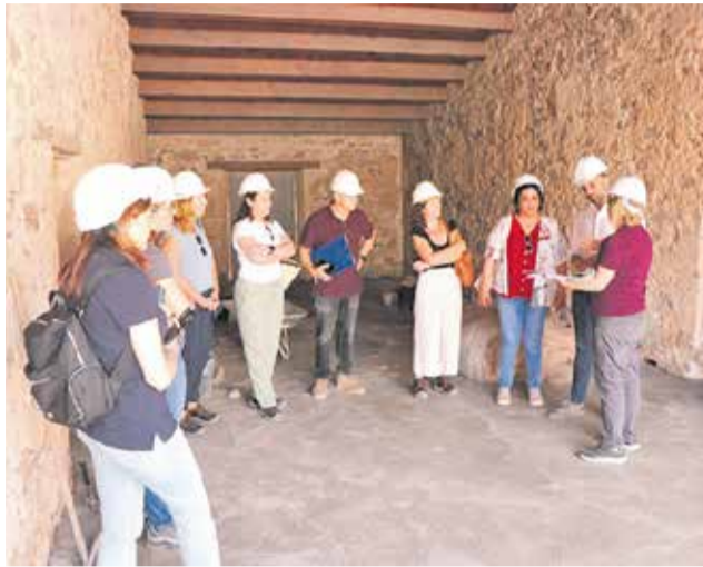
Visita tècnica al Grau Vell fa uns dies.

Les actuacions pretenen posar en valor el patrimoni marítim i portuari de Sagunt, convertint el Grau Vell en un pol d'atracció cultural i turística sostenible. L'actuació està liderada pel departament de Patrimoni de l'Ajuntament i busca integrar els recursos històrics dins d'un circuit per als viants que connecte el conjunt amb l'entorn marítim, tot conservant i difonent la riquesa cultural de la zona.