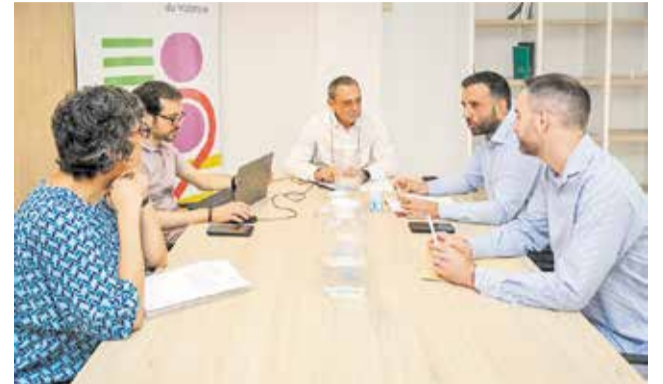
Un instant de la reunió.

Segons ha informat el consistori, des de l'entrada en vigor del servei s'han registrat més de 250 queixes ciutadanes, principalment per la falta de freqüències, massificació i supressió de trajectes sense previ avís. "No és admissible que hi haja hores sense autobús o que la gent es quede en