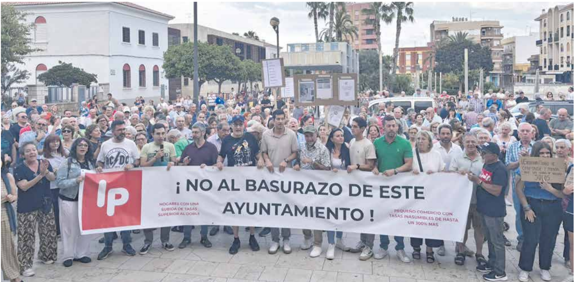
Concentración en el Port de Sagunt contra la subida de la tasa de la basura el pasado 3 de junio.

EL PLENO MUNICIPAL ACUERDA POR UNANIMIDAD SOLUCIONAR LA SUBIDA DEL 114%, MANTENER EL SERVICIO 100% PÚBLICO Y REDUCIR LA SUBCONTRATACIÓN