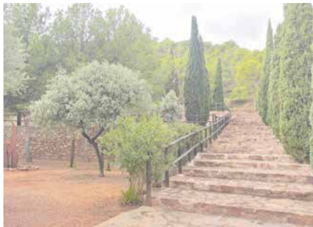
Espai verd a Faura.

Entre les mesures aplicades destaca l'ús de tècniques