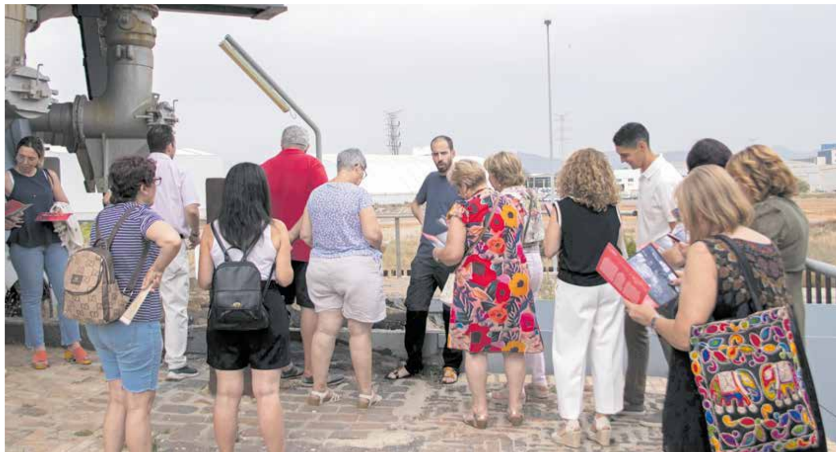
Parte del público asistente a la visita al Horno Alto número 2, ubicado en el Port de Sagunt.

Durante la visita, Jiménez contextualizó el origen de la siderurgia y su impacto sobre el desarrollo económico