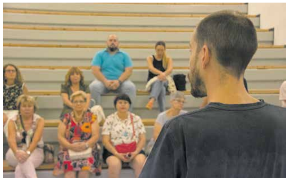
Público asistente a la mesa de ponencias (sup.) y guía en el Horno Alto (inf.).