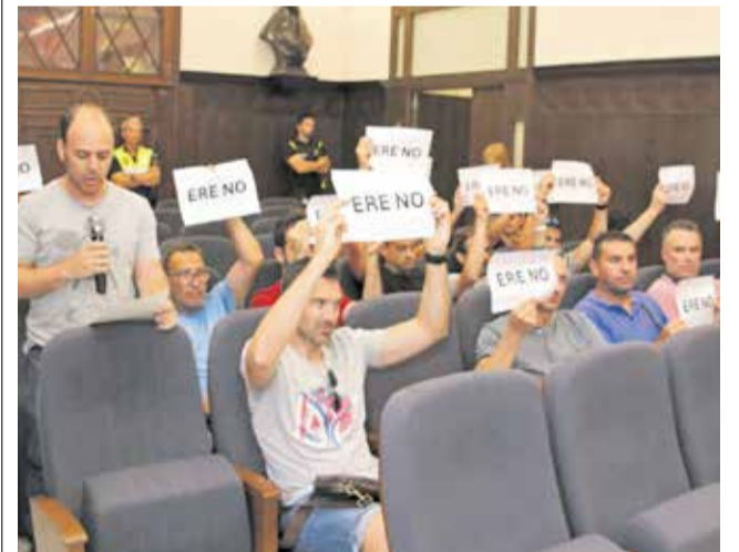
Alguns treballadors, en el ple municipal.

Finalment, el consistori demana als governs estatal i autonòmic que impulsen inversions i projectes industrials que asseguren ocupació de qualitat i un model productiu sostenible.