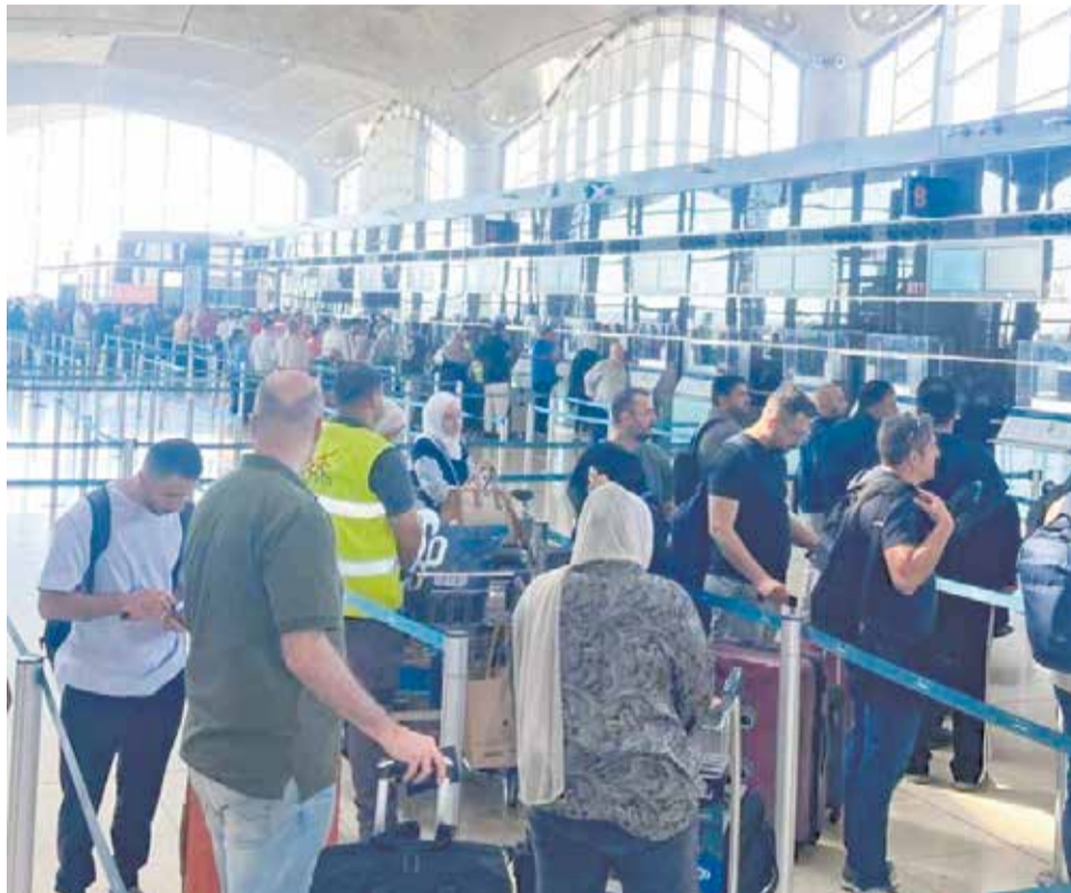
Viatgers en les finestres de l'aeroport d'Ammán, a Jordània, el passat dissabte.

Davant l'escalada del conflicte aeri en la zona i la cancel·lació del vol previst per al diumenge, els viatgers es varen desplaçar dissabte al aeroport d'Ammán, on es varen trobar amb una situació de caos: llargues cues, només dues finestretes operatives i poques opcions de tornar a Europa. Les úniques alternatives que se'ls oferien eren vols caríssims a ciutats com Milà, sense garanties de no ser anul·lats també.