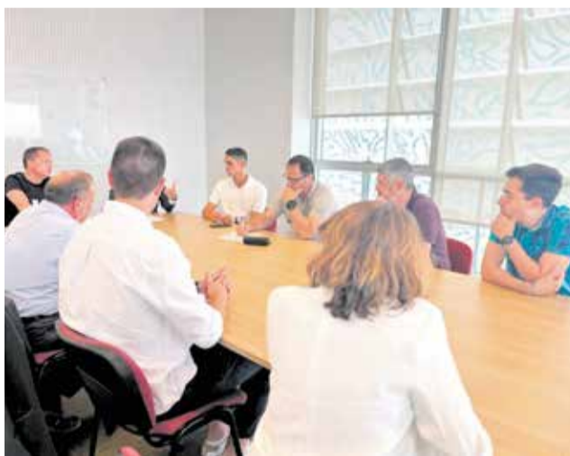
Un instant de la reunió de fa uns dies.

El Partit Popular i Iniciativa Portaña denuncien que la Generalitat ha enviat ja dos requeriments formals a l'Ajuntament per a sol·licitar la documentació dels expedients urbanístics, imprescindible per a la seva anàlisi