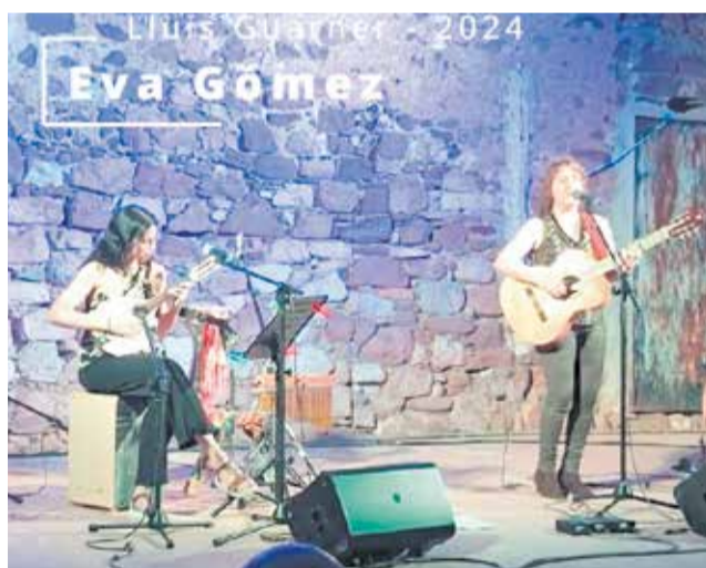
Una activitat musical a Benifairó.

L'actuació marcà l'inici d'un programa que s'allargarà fins al 4 de juliol amb tres nits més de música en directe i entrada gratuïta. El pròxim divendres 20 de juny, serà el torn de Tabalet Covers, que oferiran un concert en format acústic amb versions íntimes de clàssics del pop-rock valencià. El 27 de juny, el ci-