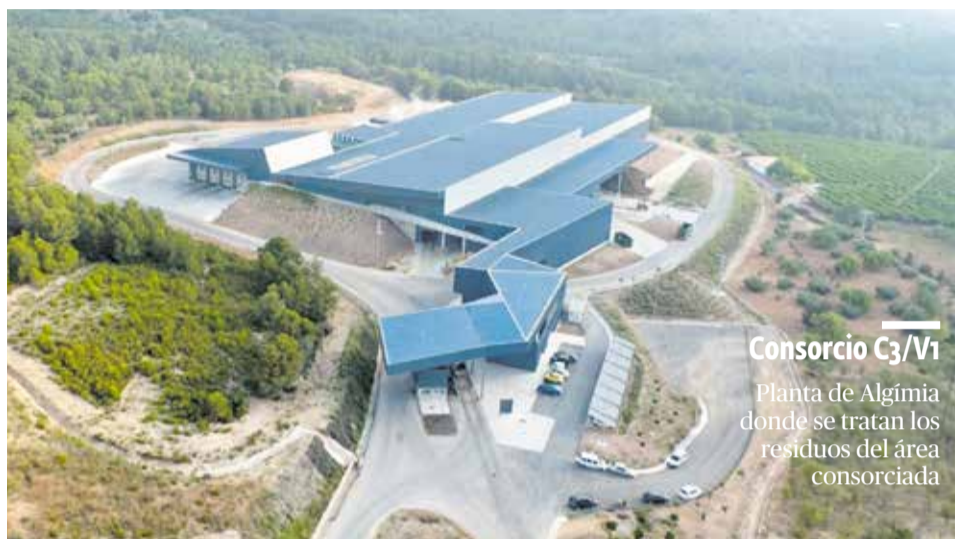
Consortio C3/V1 Planta de Algimia donde se tratan los residuos del área consorciada

El Consorcio Palancia Belcaire reivindica una estrategia basada en la reducción, reutilización y reciclaje y en la aplicación de tecnologías avanzadas. El modelo consorciado demuestra que es posible alcanzar un equilibrio entre eficiencia técnica y responsabilidad medioambiental.