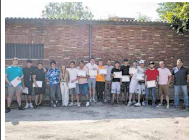
Graduación del curso 2024/25.