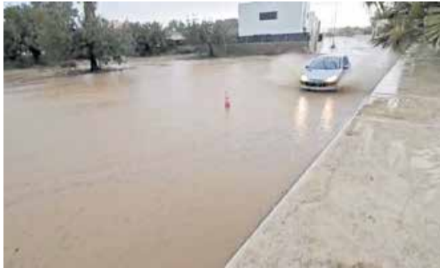
Inundaciones en una calle de San Antonio.

El proyecto, que será financiado a través de subvenciones de la administración provincial, dará respuesta a una de las demandas más persistentes del vecindario. Y es que, en muchos puntos del municipio, el agua de lluvia discurre libremente por las calles, sin una red eficaz que la recoja y la canalice. Esto provoca acumulaciones en zonas bajas, sobrecarga en el alcantarillado y problemas de acceso para los vecinos.