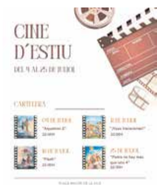
Cartel del programa.

La programación arrancó el 4 de julio con la película de superhéroes "Aquaman 2". El viernes día 11 será el turno del film "Vaya vacaciones", una comedia española para todos los públicos. La cartelera continúa el día 18 con "Flash", una película estadounidense de acción y ciencia ficción. El ciclo finalizará el día 25 con "Padre no hay más que uno 4", una película familiar dirigida por Santiago Segura.