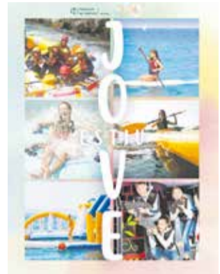
Cartel del programa.

Entre las propuestas hay también una salida al parque acuático Aquarama en Benicassim y al Aquapark de Playamonte (Navarrés), paddle