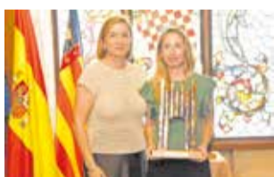
Lliurament dels premis.

Sala Noble del castell, un espai, que els veïns ompliren de gom a gom com a prova de reconeixement i estima cap als premiats.