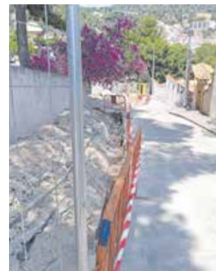
Obres a Serra.

L'obra s'emmarca dins d'un conjunt més ampli d'intervencions que l'Ajuntament ha posat en marxa els darrers mesos. En-