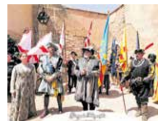
Recreació històrica.

L'acte més multitudinari va tindre lloc el dissabte de vesprada amb la recreació de la Batalla de Pavia, on el públic assistent va poder rememorar aquella batalla amb els dos exercits formats amb cavalleria, vestimenta i armament de l'època, com ara, piques, arcabussos i canons que sonaren pel parc que envolta el castell.