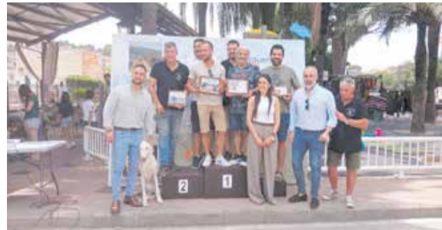
Primera edición de la Feria Taurina de Julio.