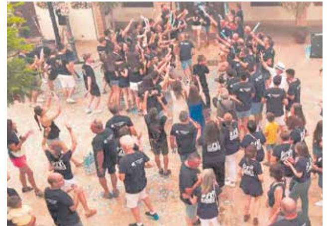
Pregó de les Festes Majors de l'Eliana.

De nou en la programació no faltaran la pólvora i el foc