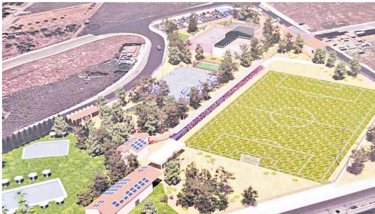
Proyecto de mejora del polideportivo de Loriguilla.

El proyecto contempla intervenciones en las instalaciones existentes, así como la incorporación de nuevos equipamientos como nue-