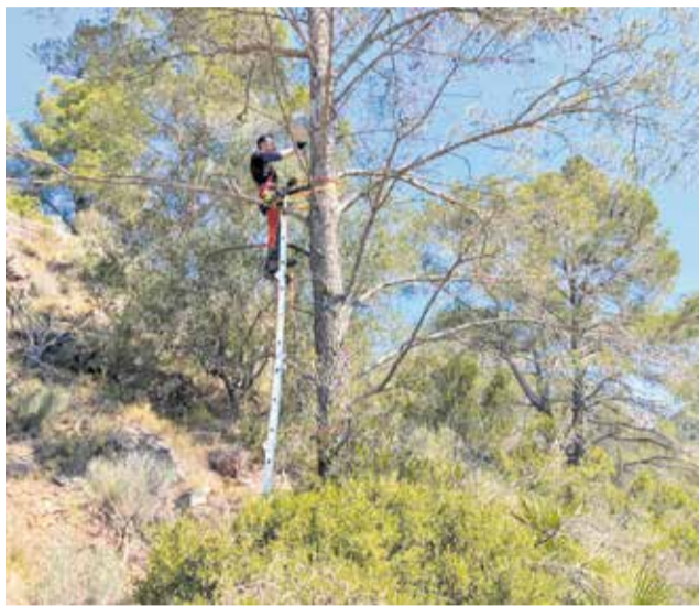
Instal·lació de sensors a Serra.

Estos sensors de tecnologia avançada monitoritzen en temps real variables meteorològiques com la humitat relativa, la direcció i velocitat del vent, i són capaços d'emetre alertes immediates (via SMS i correu electrònic) quan detecten un incendi. Durant l'evolució del foc, el sistema mostra informació en temps real sobre la grandària, la direcció i la