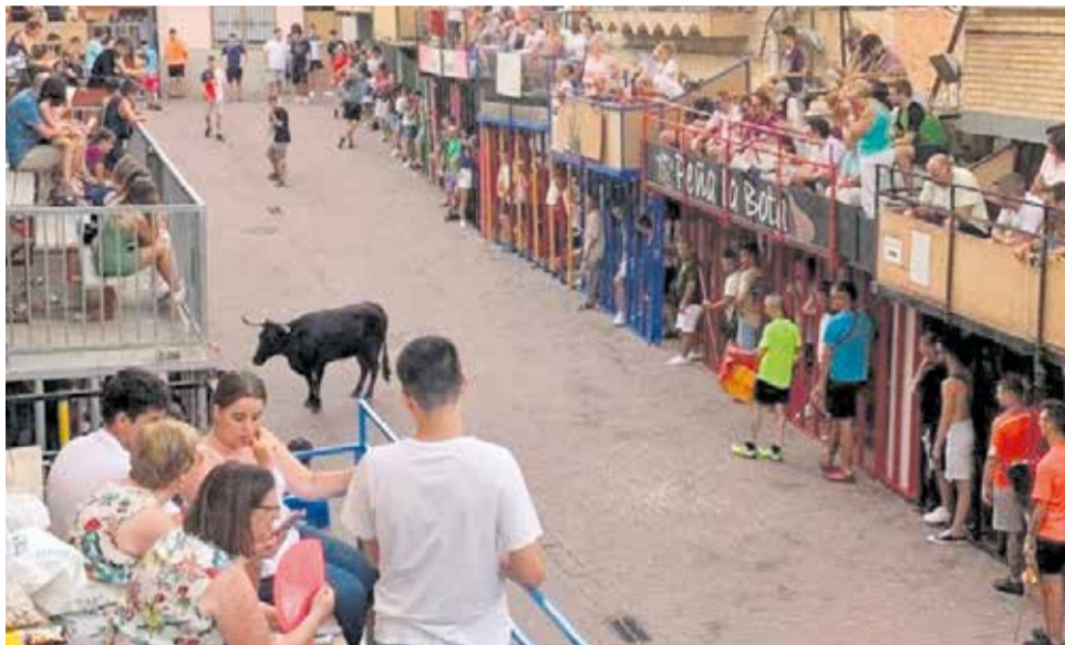
Imagen de archivo de los tradicionales actos taurinos de julio en Gátova.

Los festejos contarán con toros de las ganaderías Hnos. Benet (de Altura) y Fernando y Dani Machancoses (de Cheste y Picassent), y con la Cuadrilla de Emboladores de Altura. La programación incorpora actos tan significativos como el desfile de peñas y recogida de la llave, los tradicionales encierros y las emboladas noctur-