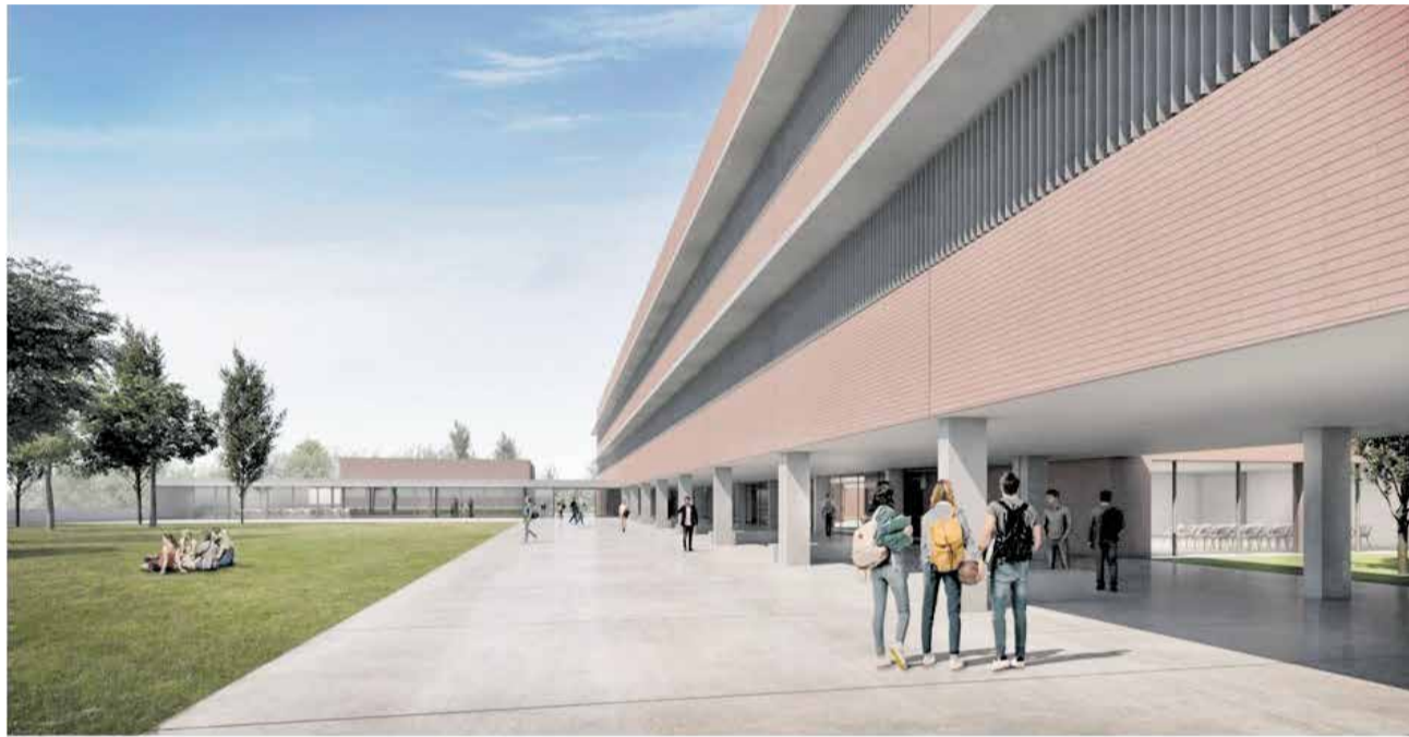
Recreación del proyecto del nuevo IES núm. 2 de la Pobla de Vallbona.

Entre las principales actuaciones destaca la resolución definitiva de la delegación de competencias con el aumento presupuestario por parte de la Generalitat Valenciana del IES núm.2 que permitirá comenzar los trámites administrativos para la construcción del centro, un proyecto estratégico que supondrá una inversión de casi 15 millones de euros y cuya licitación se pre-