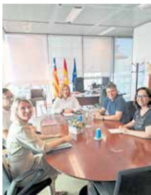
Trobada a la Conselleria.

La trobada, que va tindre lloc a la Ciutat Administrativa 9 d'Octubre de València, va donar continuïtat a la que es va produir el passat 21 de març, i va servir per a dialogar sobre aspectes relatius a la fase en la qual es troba actualment, centrada en l'expropiació i l'adquisició de terrenys prèvies al començament de les obres. Així mateix, la directora general va transmetre al primer edil la voluntat de la Conselleria de Medi Ambient, Infraestructu-