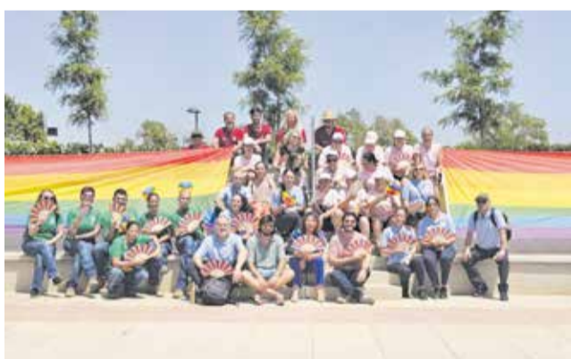
Día del Orgullo LGTBIQ+ en Loriguilla.