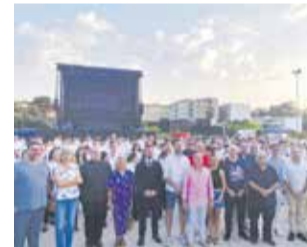
Encuentro comarcal.

Náquera acoge el Encuentro de Bandas de Música