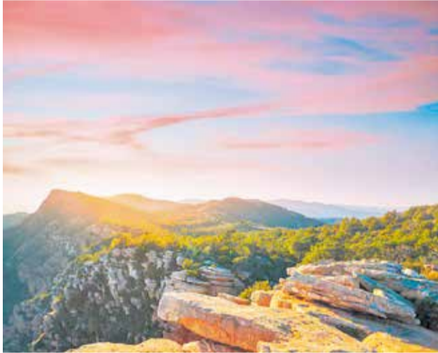
La posta de sol dalt del Garbí.

xen en els llacs artificials circumdants.