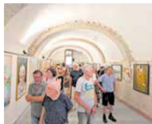
Inauguració. / EPDA