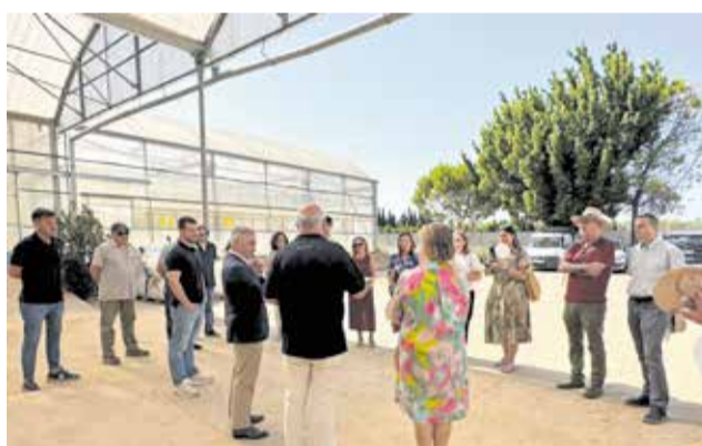
Jornada técnica en Intersemillas.