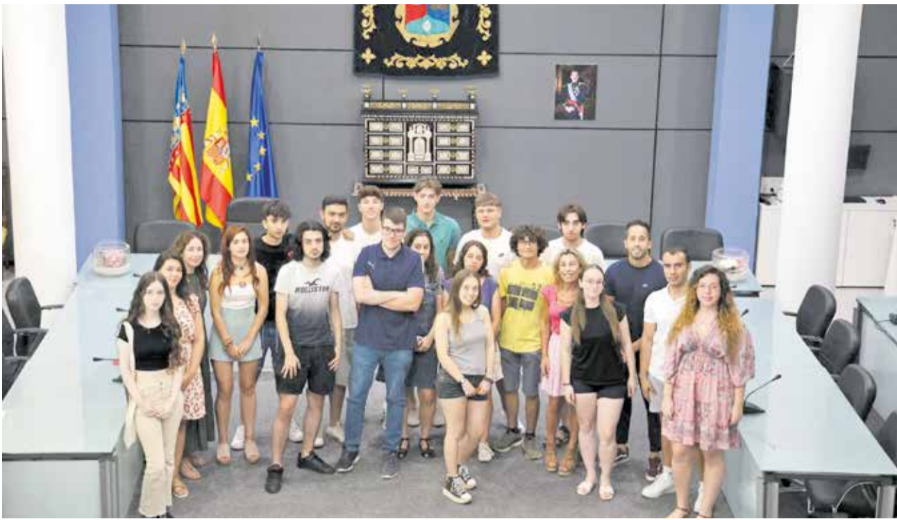
Acto de bienvenida a los jóvenes del programa 'Benaguasil te beca'.