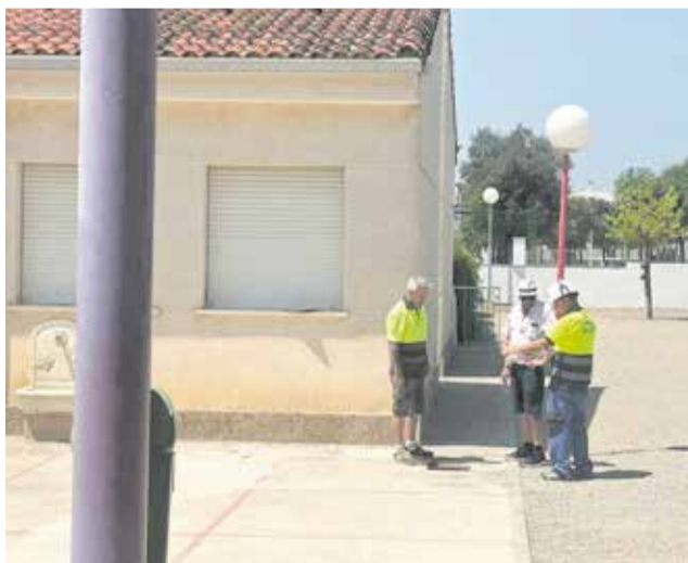
Inicio de las obras en el colegio de Marines.