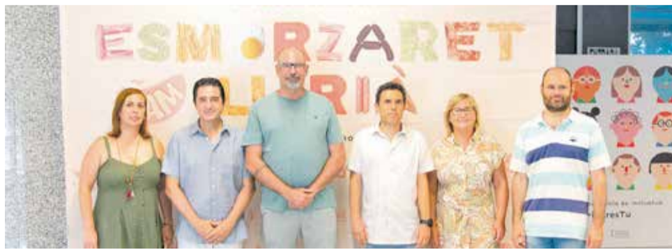
Presentació de 'L'Esmorzaret Llírià'.

riode, els locals oferiran als seus clients entrepans especials, plens de creativitat i innovació, elaborats amb productes tradicionals i artesans adquirits en els comerços d'alimentació de Llíria. D'esta