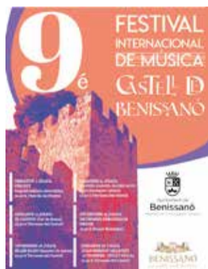
Cartel del FIM.

La programació d'enguany és molt variada. El públic que assistisca als concerts podrà gaudir d'un magnífic cor de veus blanques, un quartet de saxos format exclusivament per