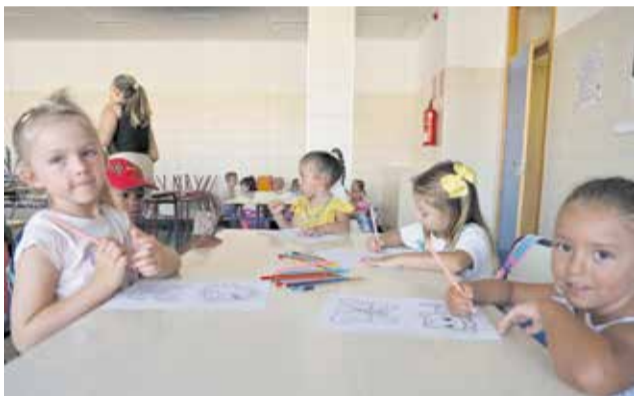
Actividades del campus de verano de Benaguasil.

Entre las actividades del campus de verano, que combinan aprendizaje, diversión y valores, destacan juegos tradicionales, animación, baile, talleres de cocina saludable, gymkanas, así como actividades en la piscina.