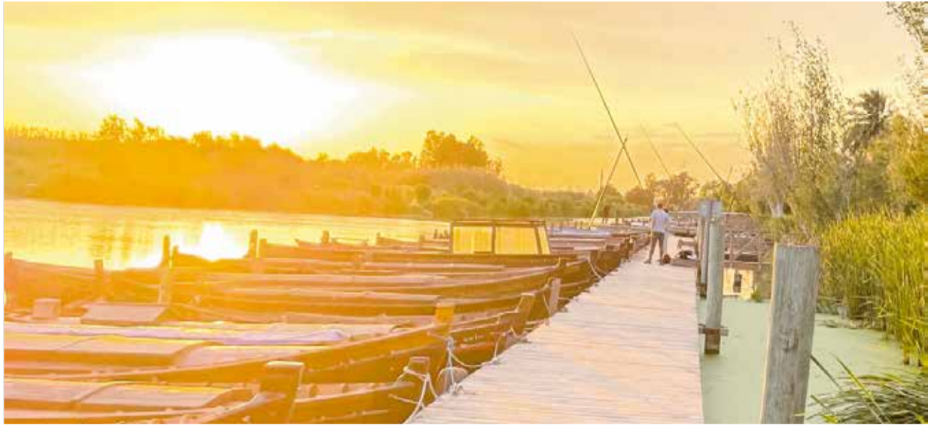
Un capvespre en l'embarcador del Port de Catarroja.

Capvespres més urbans, davant edificis emblemàtics, com la Ciutat de les Arts i les Ciències, també sorprenden a València. El complex arquitectònic dissenyat per Santiago Calatrava oferix un ambient futurista. Al capvespre, les cridaneres estructures s'il·luminen amb tons daurats i rosats, que es reflecti-