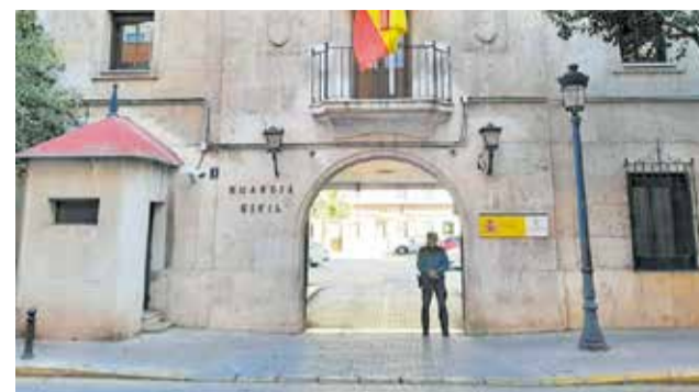
Comandancia de la Guardia Civil.

chos, conocido en la localidad de Bétera por multitud de antecedentes similares, y se procedió a su detención.