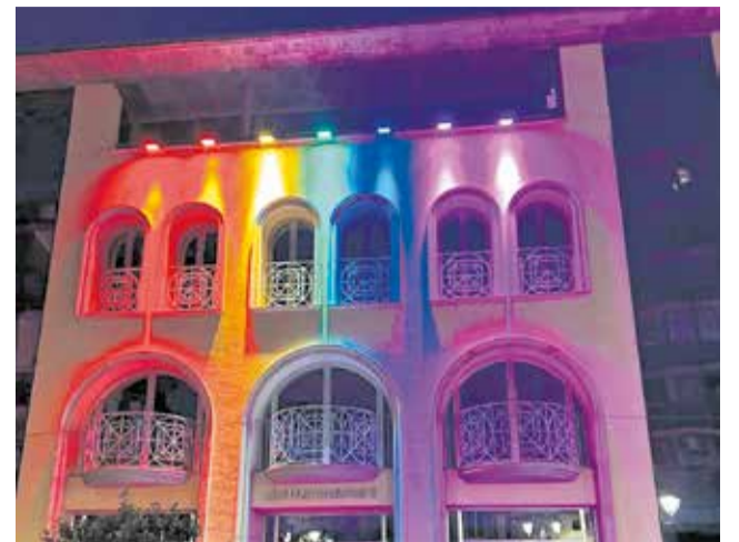
Fachada del edificio consistorial de Benaguasil.