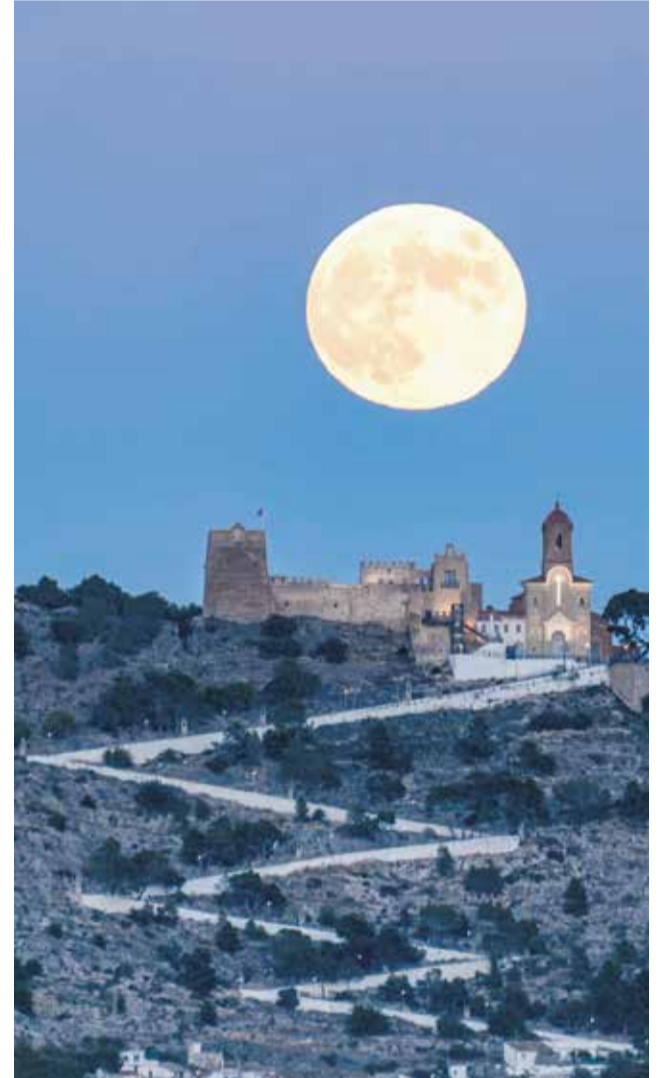
La lluna sobre el Castell de Cullera.

poble i d'una rica gastronomia. Però si vols viure al màxim les meravelles de la naturalesa, la millor opció és perdre's pel Parc Natural Hoces del Cabriel. Este tresor natural és un espai protegit de més de 31.000 hectàrees. Un lloc especial i únic gràcies a la seua flora, fauna, paisatge i característiques geològiques. Fer una passejada per este benvolgut paisatge d'interior et permetrà sentir la naturalesa en primera persona i admirar la bellesa, la pau i els increïbles capvespres que desprén este meravellós destí.