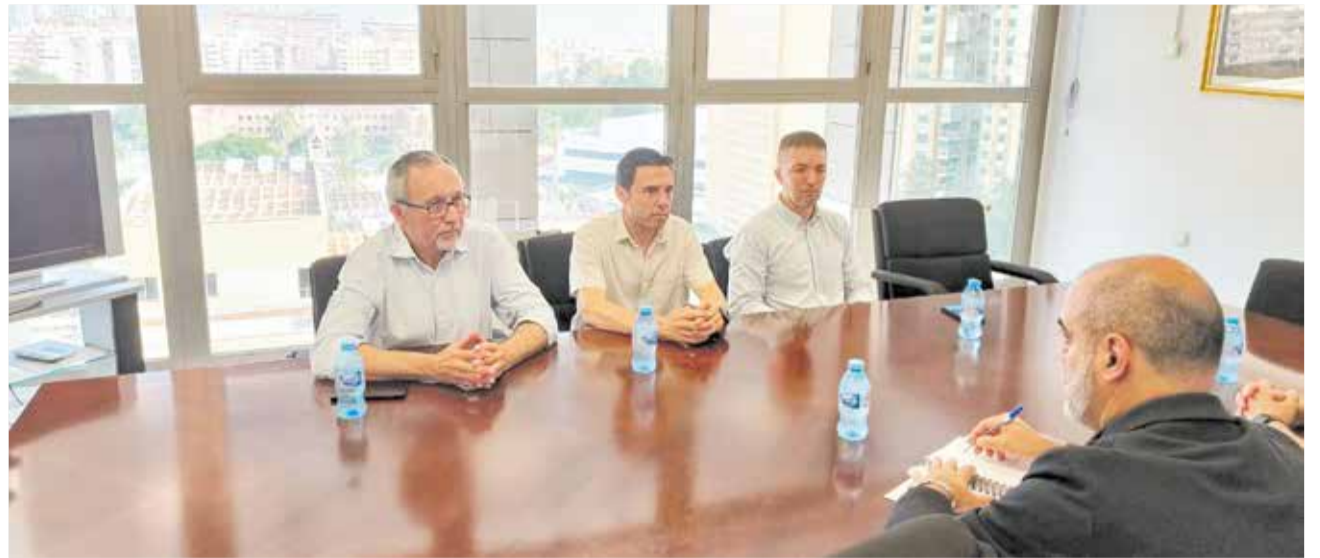
Reunió en la subdelegació del Govern d'Espanya a València.

Finalment, en la reunió també es va parlar d'augmentar la freqüència del servei d'expedició del DNI i del pas-