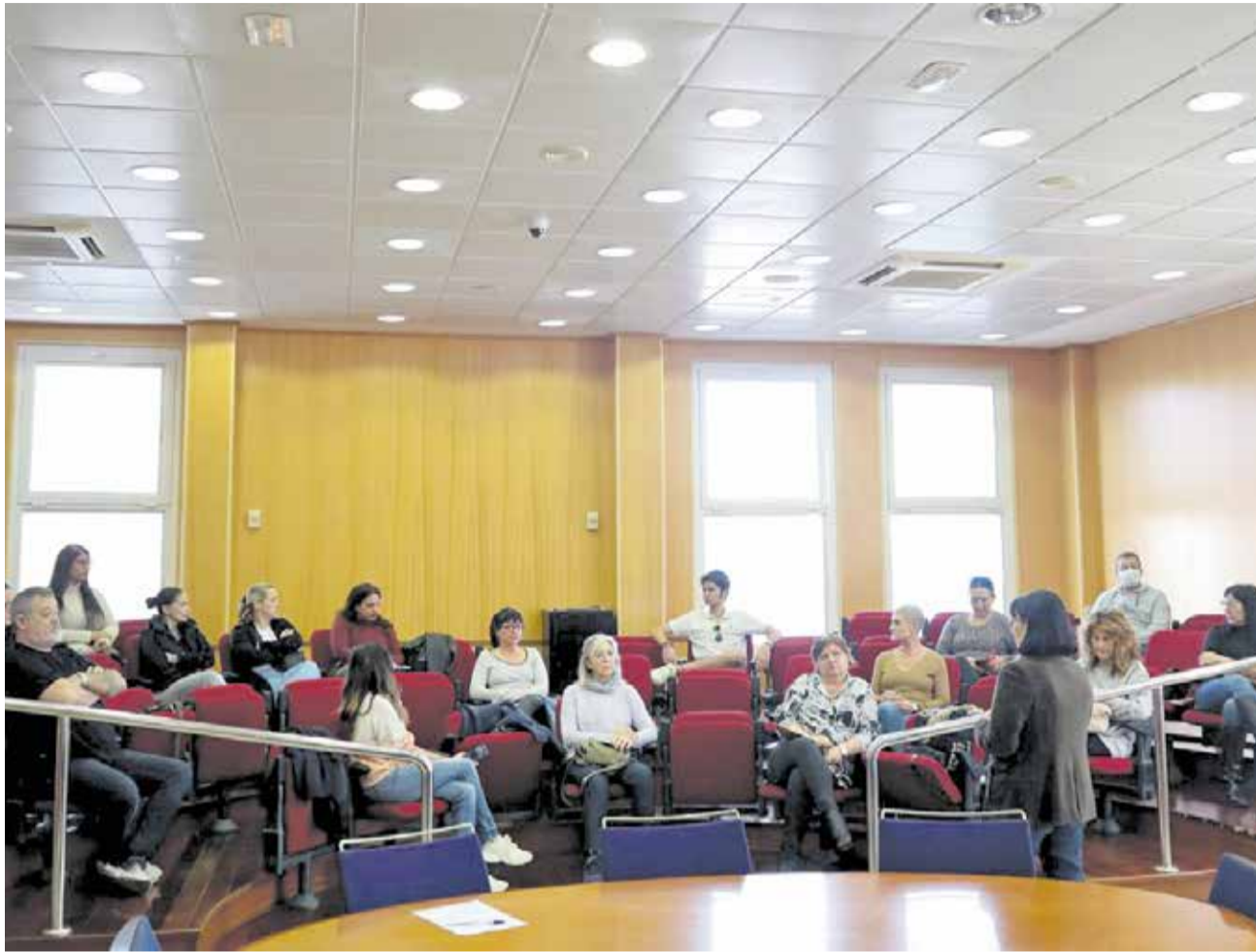
Plan de Empleo en el salón de plenos del Ayuntamiento de San Antonio de Benagéber.