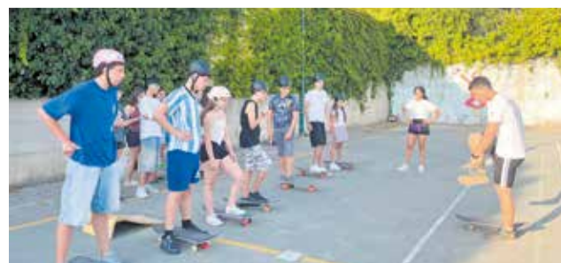
Recibimiento y actividades de los jóvenes de Benaguasil en Guardistallo.

ticas, culturales, deportivas y de ocio.