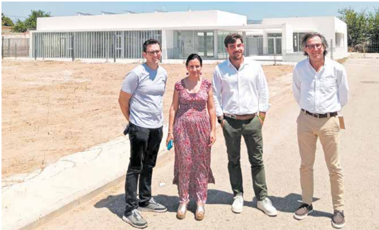
Autoritats a les instal·lacions del centre de dia de Casinos després de la reunió.

Per part seua, la Conselleria va manifestar el seu compromís ferm amb el projecte, assegurant que concertarà les 60 places disponibles i procedirà