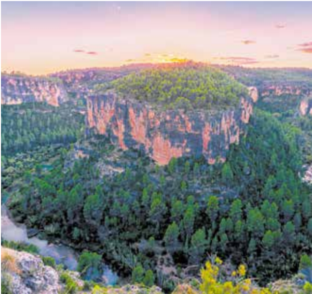
El sol es posa darrere de les Hoces del Cabriel.

na, oferint una experiència visual que combina naturalesa i tranquil·litat. Una opció ideal per als qui busquen desconnectar a pocs quilòmetres de la ciutat de València.