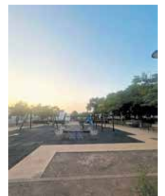
Parque del Real.

Será el momento de descubrir las mejoras de accesibilidad, nuevas zonas de sombra, nuevos juegos infantiles y nuevos accesos directos desde la calle. Se trata de un encuentro abierto a la ciudadanía que