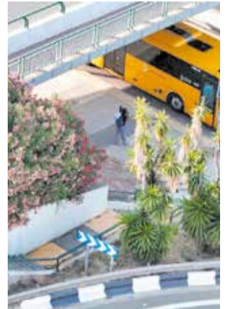
Parada de bus.