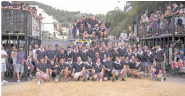
Primera edición de la Feria Taurina de Julio.