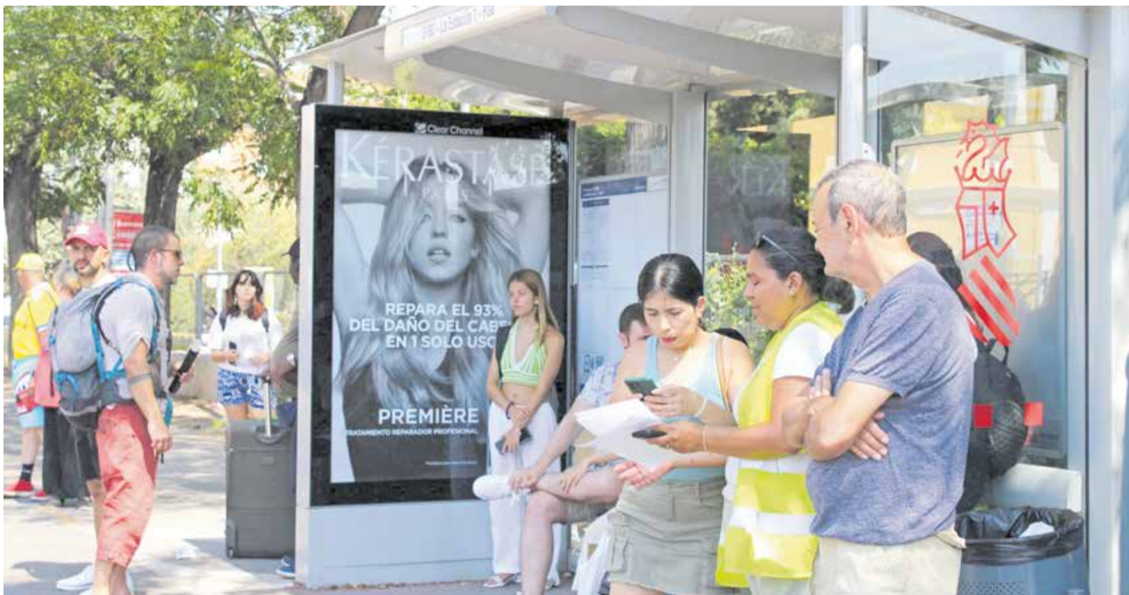
Pasajeros esperan al autobús bajo las marquesinas de la parada de Bétera.

UN SERVICIO DE AUTOBÚS SUSTITUYE EL TRAYECTO ENTRE LAS PARADAS DE BÉTERA Y MASIES HASTA EL 31 DE AGOSTO