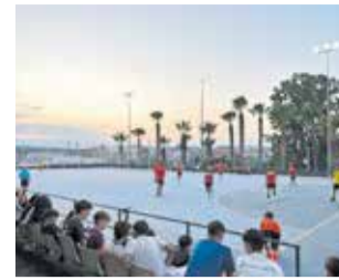
Torneo deportivo.

Arranca la Campaña Deportiva de Verano 2025