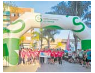
Run Cáncer 2025.

Vilamarxant se llena de solidaridad en la Run Cáncer 2025