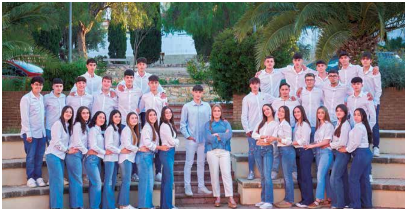
Filles de Maria y Lluïsos de Benaguasil 2025.

Los bous al carrer ocupan un espacio central desde el