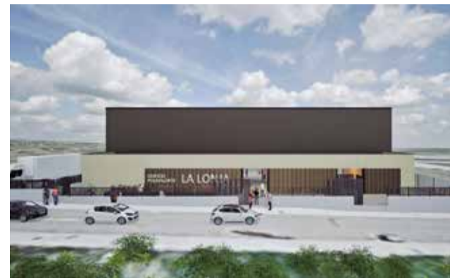
Recreación del edificio polivalente de Loriguilla.