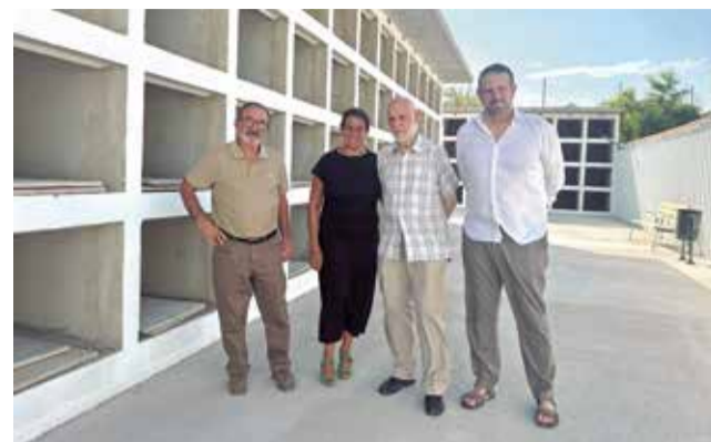
Visita a la recepción de las obras.