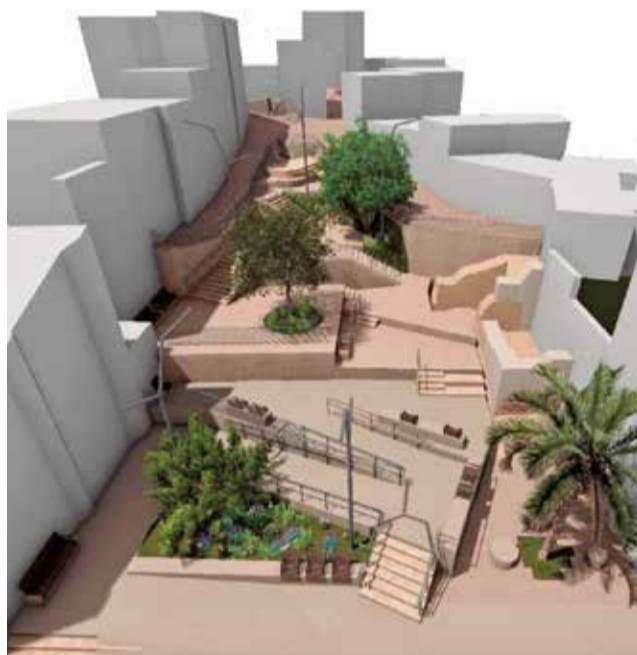
Recreació de l'actuació al solar del carrer del Remei de Lliria.