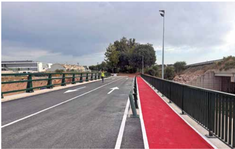
Puente sobre el barranco del Pozalet en Loriguilla.

Además, el Ayuntamiento ya ha confirmado que las me-