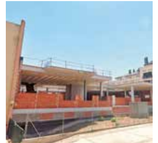
Estado de las obras.

El acuerdo plenario se trasladará, a continuación, a la Dirección General de Administración Local para refrendar el reajuste de las anualidades aprobadas por el pleno del Ayuntamiento de Riba-roja de Túria con el objetivo principal de finalizar las obras del centro polivalente de la localidad. De esta forma, con el acuerdo plenario se cumple un trámite previsto en el convenio entre la administración local y la Generalitat.