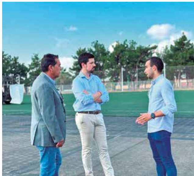
Visita a los trabajos de renovación del césped en el campo de fútbol del Mas de Tous de la Poba.

Con una inversión de más de 200.000 euros procedente del Pla Obert d'Inversions de la Diputació de València 2024-2027, el proyecto contempla la instalación de un nuevo césped artificial de última generación, la susti-