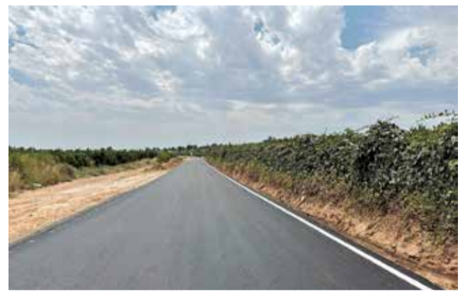
Camino de Lliria repavimentado.

El objetivo, comenta García, es "garantizar que los accesos, tanto a urbanizaciones como a los campos de producción agrícola de la zona estén en buenas condiciones, así como dotar de mayor amplitud a la vía para que el cruce entre vehículos sea más sencillo en ambas direcciones", concluye el edil.