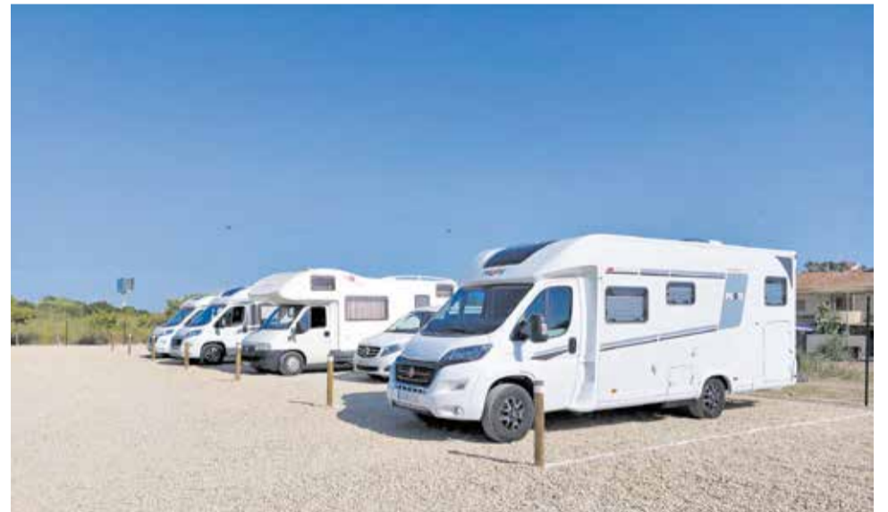
L'àrea d'aparcament de vehicles de La Pobla de Farnals.