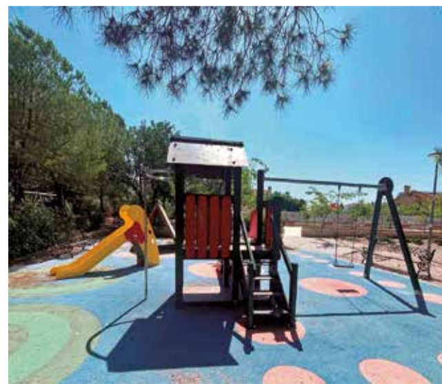
Parque infantil en San Antonio de Benagéber.

parques no pueden seguir en el estado en el que nos los encontramos. Esta actuación es un compromiso firme con la seguridad y el bienestar de nuestras familias, especialmente de los más pequeños y de nuestros mayores". "Con este plan de choque, damos el primer paso para devolver a nuestros vecinos espacios dignos, seguros y pensados para el disfrute de toda la localidad", ha afirmado la primera edil.