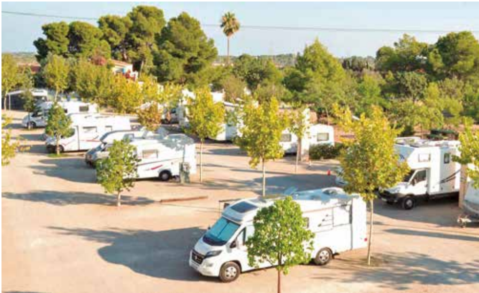
Caravanes estacionades al Valencia Camper Park de Bétera.