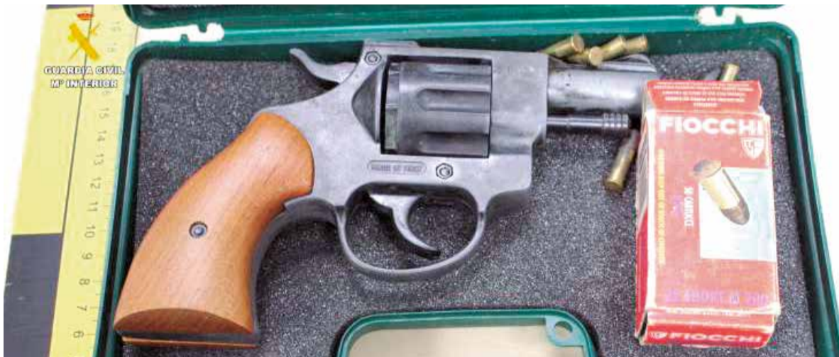
Dos de las armas incautadas en el domicilio del detenido en Lliria.

Añadió que su pareja la mantenía bajo control constante, encerrándola con llave cuando se ausentaba, y le impedía cualquier contacto con el exterior, privándola de acceso a internet o teléfono móvil.