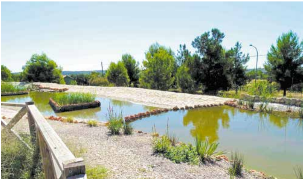
L'entorn natural de la zona ubicada en Cheste.

Molt pròxim, trobem una àgora en el qual es duen a terme diferents activitats culturals i esportives. Així mateix, repartits per tot el parc podem trobar berenadors i fins i tot, pròxim a l'estany, un espai amb taules inclusives. A més, compta amb pàrquing en l'entrada.