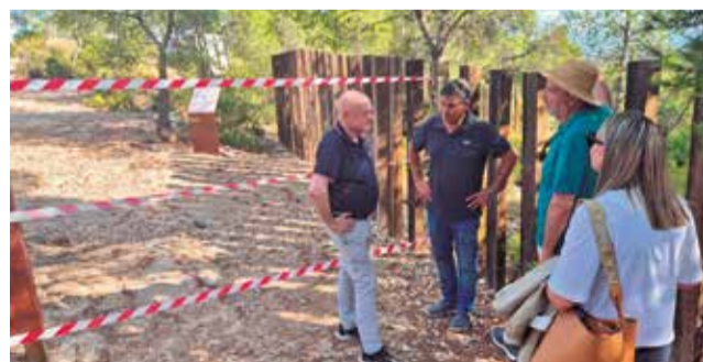
Visita d'avaluació dels desperfectes.

fectes produïts i tant el diputat com el personal del Museu van expressar la seua voluntat d'analitzar tot l'ocorregut per a poder dur a terme els següents passos en el procés de recupera-