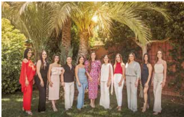
Reina de las fiestas y su Corte de Honor.

También habrá espacio para el arte en la calle con el festival NaquerArt, que llenará la Plaza Padre Manuel Navarro de espectáculos familiares y propuestas escénicas los días 28