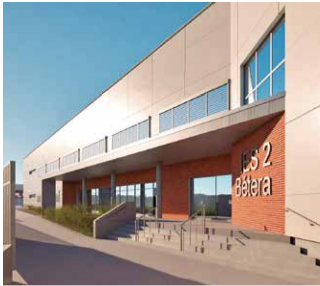
Recreación en 3D del IES número 2 de Bétera.

Un complejo que, según la alcaldesa de Bétera, Elia Verdevío, "proyectará a Bétera como referente en materia educativa. Gracias a unas instalaciones muy ne-