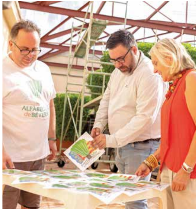
Presentació de la campanya 'La força d'un gran poble: pobles germans' de Bétera.

“Enguany, com no podia ser d'una altra manera, Bétera estarà present en estos municipis i farem este lliurament a estos pobles de la nostra màxima insígnia, del nostre símbol per excel·lència. Este reparti-