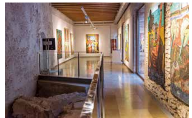
Espai d'Art Contemporani El Castell.