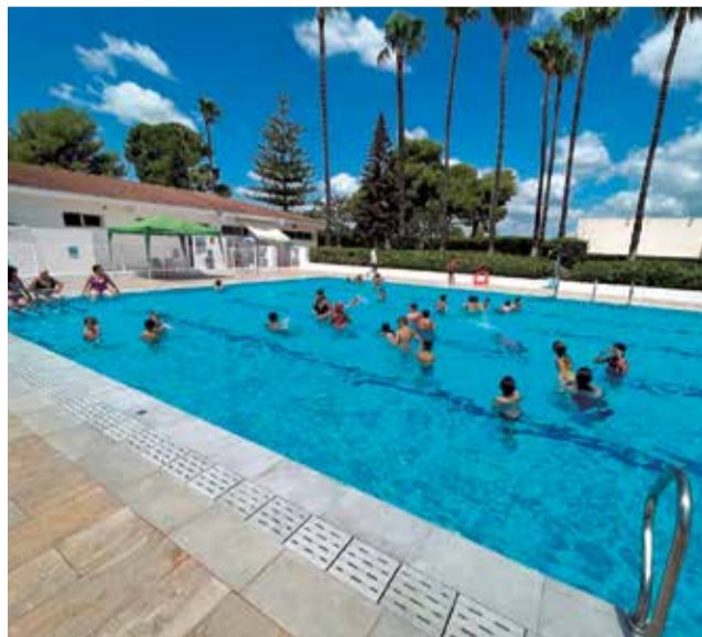
Nuevos nichos en el cementerio de Marines.

Además, también se están realizando trabajos de cimentación para futura colocación de nichos y repavimentación del sector ampliado del cementerio municipal. La obra la está ejecutando la empresa SUBIELA S.L.