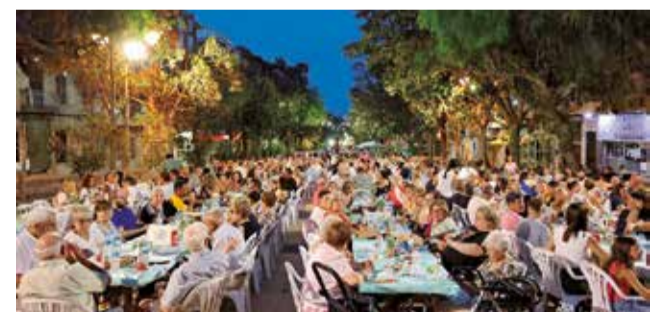
Cena solidaria contra el cáncer en Benaguasil.

arena a la causa. En este sentido la presidenta de la Junta local Contra el Cáncer de Benaguasil mostró su gratitud "por la respuesta que recibimos de tantas personas que un año más se han unido para apoyar la lucha contra el cáncer, bien asistiendo al evento, participando a través de fila 0, colaborando