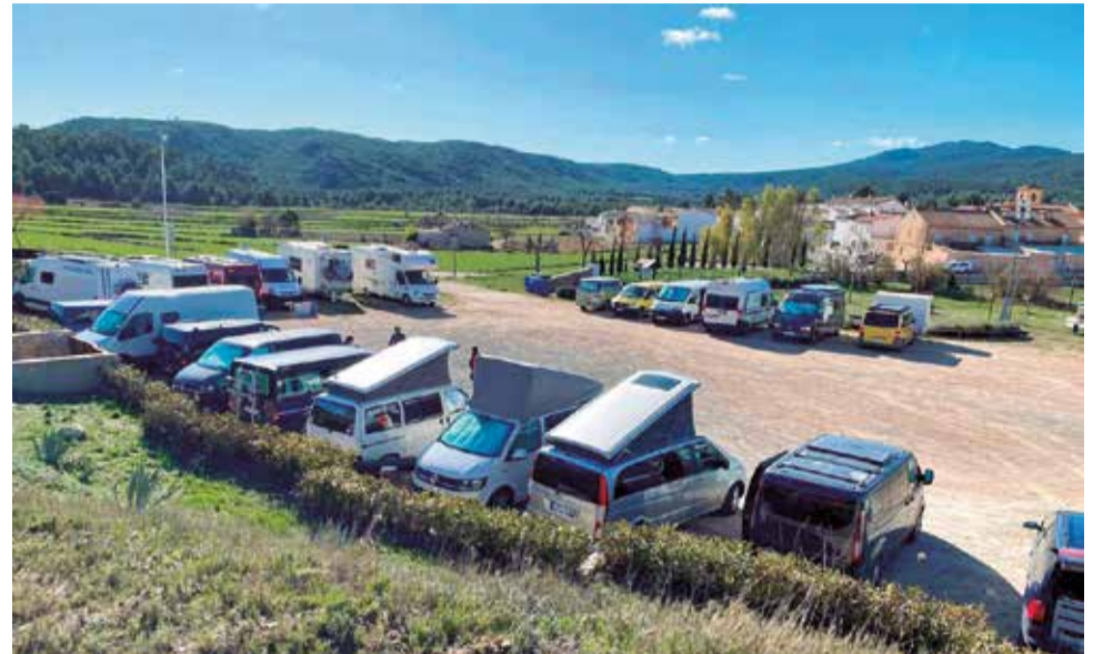
Àrea de Nieva en Benagéber.

L'Alt Palància s'està consolidant com un destí ideal per als viatgers en caravana que busquen paisatges tranquils, cultura i bona infraestructura. Diversos municipis han adaptat espais per a facilitar esta forma de turisme sos-