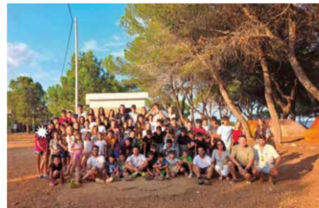
Visita del equipo de gobierno a Alcossebre.

Durante la visita al campamento, el equipo municipal pudo comprobar de primera mano la calidad de las ac-