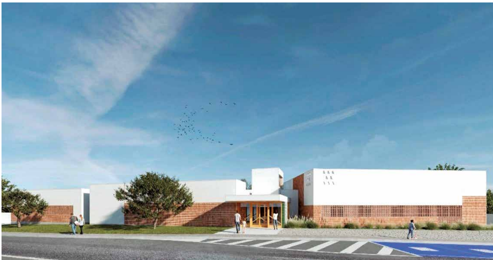
Proyecto del nuevo centro de día de la Pobla de Vallbona.

EL INCREMENTO PERMITIRÁ MEJORAR LA ATENCIÓN A LA DEPENDENCIA O PONER EN FUNCIONAMIENTO EL CENTRO DE DÍA