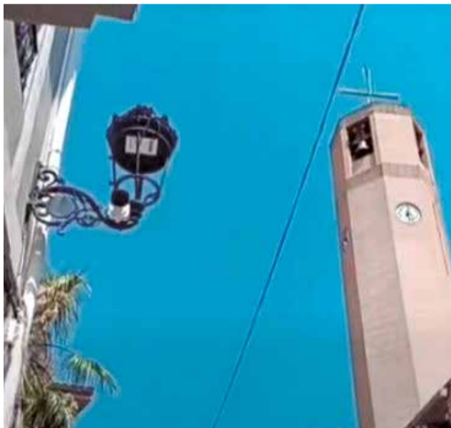
Càmera de seguretat instal·lada a Casinos.