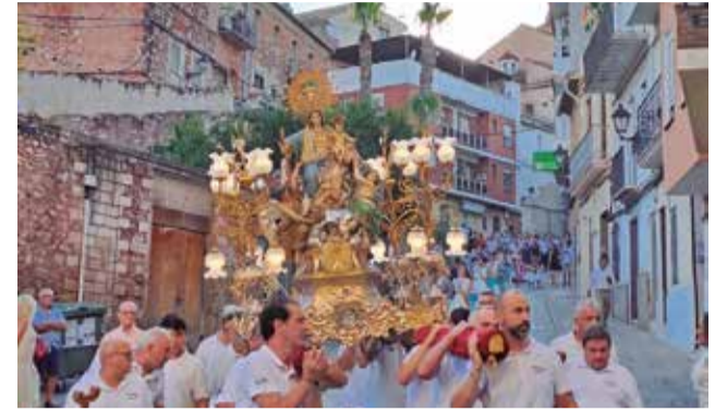
Ofrena a la Mare de Déu dels Àngels a Serra. / EPDA

Els dies centrals de les festes, l'1 i 2 d'agost, Serra es va vestir de gala per celebrar les festivitats de Sant Josep i la Mare de Déu dels Àngels. El programa inclou cercaviles,