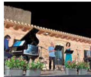
Concert a Olocau.

Pel que fa al Cicle de Concerts de la Casa de la Senyoria (organitzat per la Regidoria de Cultura i finançat amb una subvenció del Servei d'Assistència i Recursos Culturals de l'Àrea de Cultura de la Diputació de València en el seu programa SARC als Pobles), enguany ha celebrat la seua 25a edició. A causa de