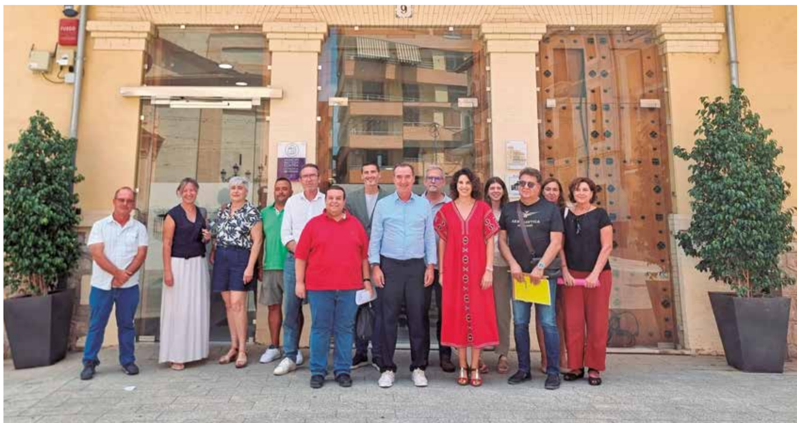
27ª Asamblea General de la Asociación de Municipios Vinculados al Parque Natural del Túria.