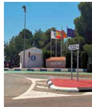
Urbanització. / EPDA

Amb esta actuació, els vials i zones verdes esdevenen de titularitat pública, un requisit indispensable per a la futura execució del sistema de clavegueram i la posterior recepció oficial de la