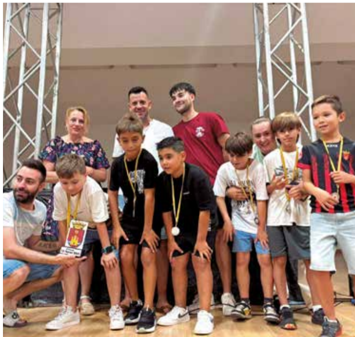
Varios instantes durante la XXV Semana Deportiva de Domeño.

El domingo 27 fue el turno de los más jóvenes con la '12H