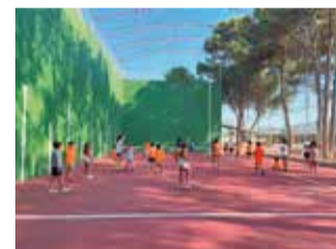
Escuela de verano.

bles del Ministerio de Igualdad y fieles a su compromiso de ayudar a las familias del municipio a conciliar su vida familiar y laboral.