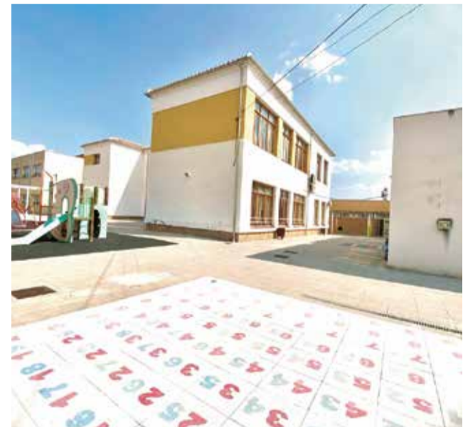
CEIP La Pau de Casinos. / EPDA

L'ajuntament ha donat a conèixer estes xifres, per a explicar a les famílies que estes ac-