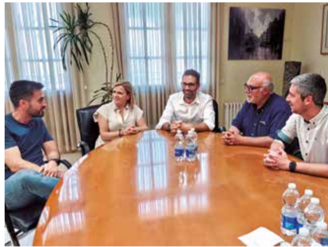
Un momento durante la reunión.

El conjunto de actuaciones en Requena suma una inversión prevista superior a los 33 millones de euros, distribuidos en tres ejes fundamentales: Más de 5,2 mi-