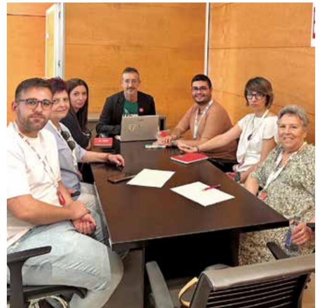
Un momento durante una reunión.

► Sí, tengo muy buena relación con ella, por todos es sabido y he de agradecerle que siempre que la hemos necesitado en Utiel ha estado presente. Considero que ella es la mejor opción para la alcaldía de Valencia actualmente. Trabajo en la Diputación de Valencia con lo cual estoy también bastante en la capital durante la semana y no es la misma que era hace unos años desde luego. Valencia se ha convertido en