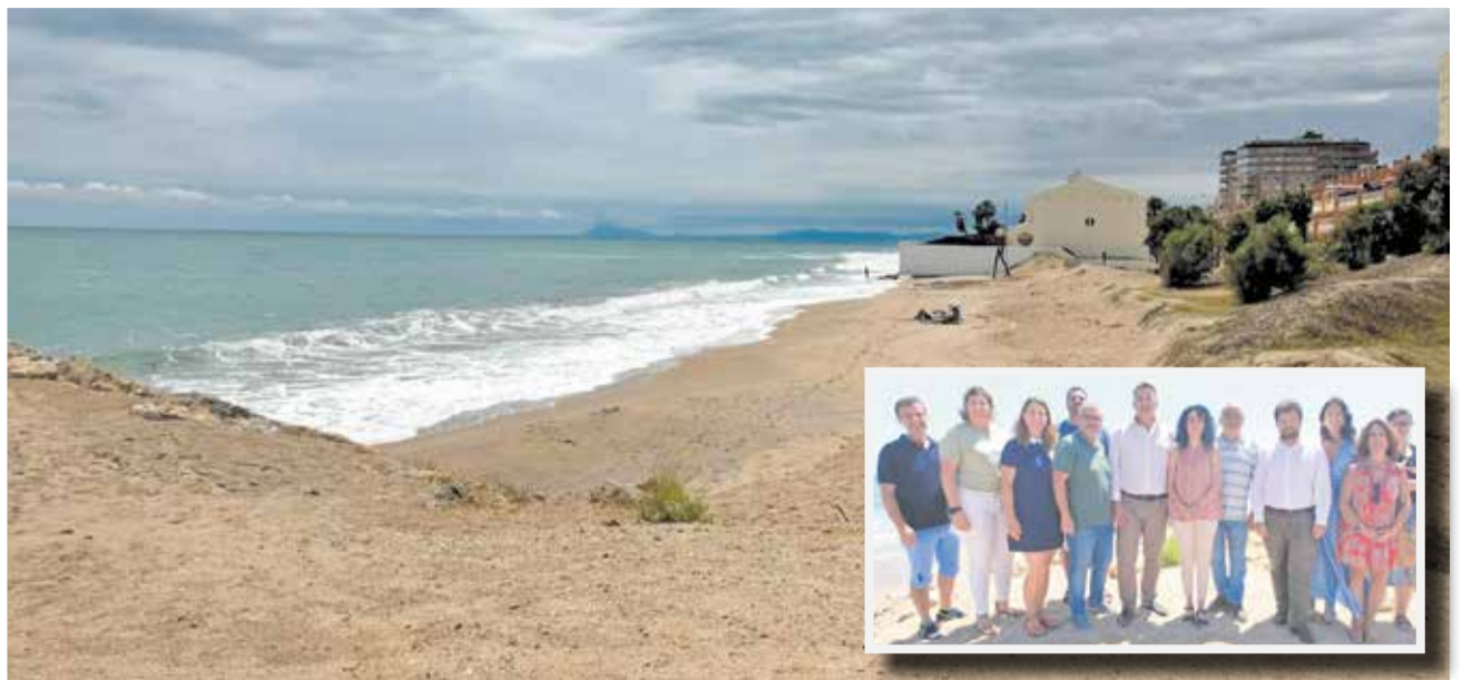
La platja de Tavernes de la Vall d'igna i la visita del conseller Martínez Mus.

Martínez Mus també va explicar que fins a principis de maig, la normativa ambiental només permetia utilitzar 23.000 m 3 d'arena, en considerar que els materials superaven lleugerament el límit del 5% de material fi. No obstant això, després de diverses gestions, la Conselleria ha aconseguit l'autorització per reutilitzar quasi la totalitat dels sediments dragats.