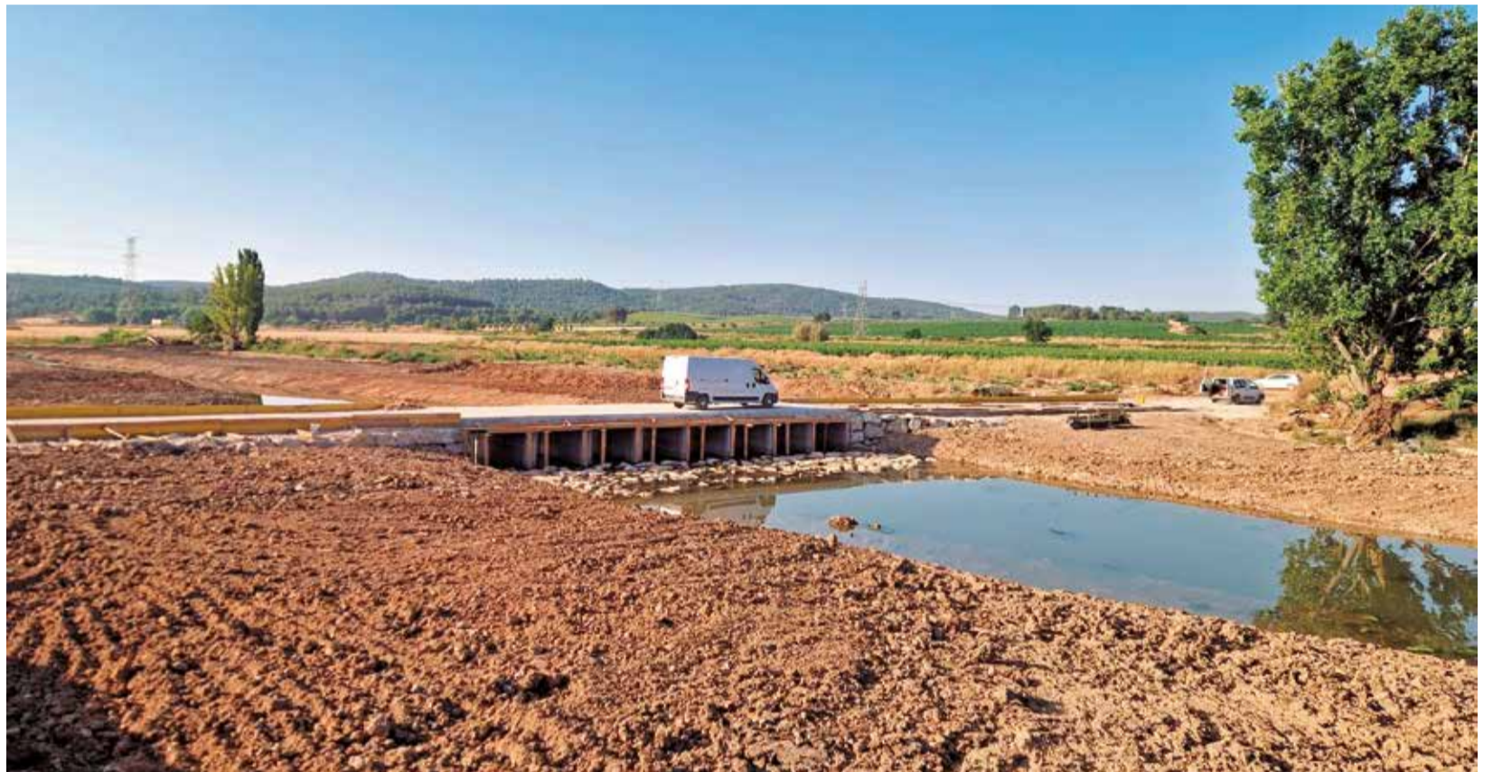
Paso de San Blas abierto al tráfico.

Desde el Ayuntamiento se ha agradecido la comprensión vecinal durante el tiempo que han durado las obras, destacando que este tipo de intervenciones no solo restablecen servicios afectados, sino que permiten modernizar infraestructuras clave para la movilidad urbana.