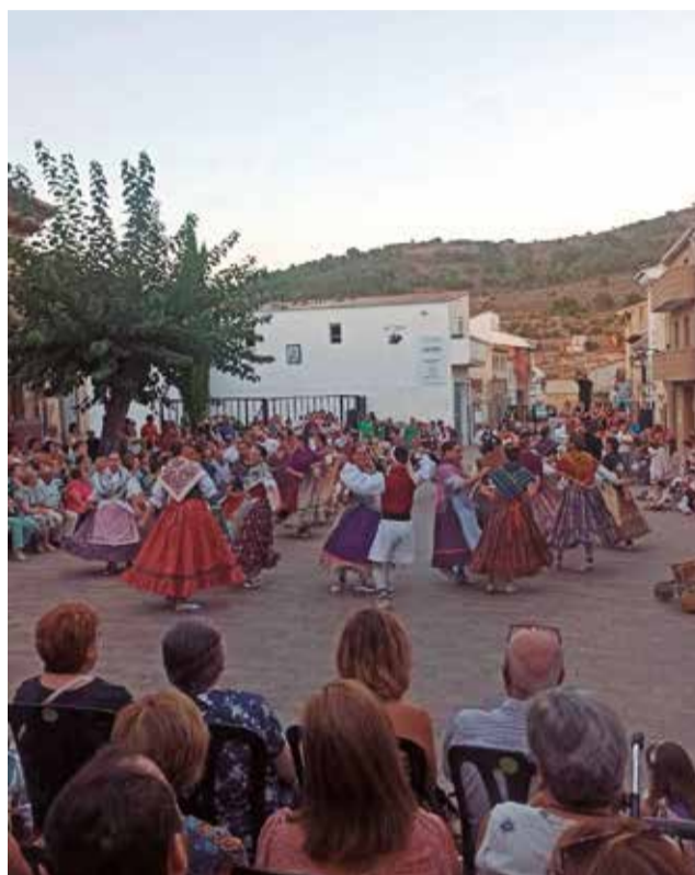
Bailes tradicionales en las fiestas de Alcublas.

Por ejemplo, respecto a la recogida de basuras, el primer edil señala que en verano su Ayuntamiento dobla los turnos para mantener el municipio en perfectas con-