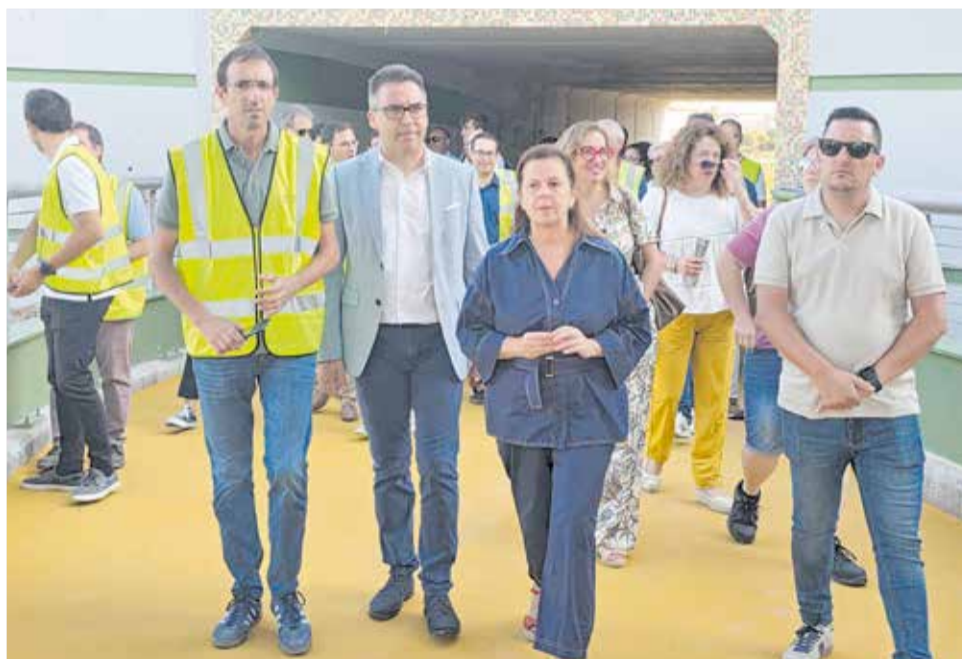
Autoritats i tècnics el dia de la inauguració de la nova infraestructura.

L'acte d'inauguració ha tingut lloc este mes de juliol i va comptar amb la presència de la diputada de Carreteres i vicepresidenta de la Diputació, Reme Mazzolari, així com diversos alcaldes i alcaldesses de municipis de la comarca. Mazzolari va posar en valor el caràcter transformador de