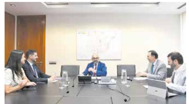
Reunió entre responsables.

El projecte ja va superar al gener un dels principals requisits ambientals, amb l'autorització de la Declaració d'Impacte Ambiental per part