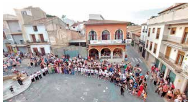
Diferentes momentos durante el pregón las fiestas patronales de Godolleta. / EPDA