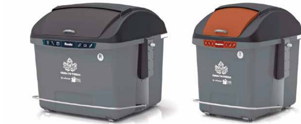
Los renovados contenedores de la Mancomunidad del Interior Tierra del Vino.

Aunque en algunas zonas ha cambiado la distribución de los contenedores actuales, la capacidad total del sistema de recogida es la