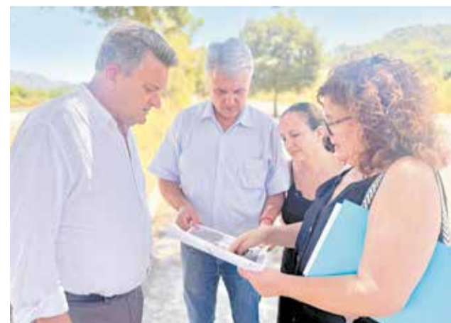
El conseller i l'alcalde varen visitar el lloc.

S'ubicarà al límit entre els termes d'Alzira i Carcaixent i és una de les interseccions més perilloses de la comarca, afectant tant a vehicles com a vianants. La rotonda tindrà un diàmetre de quasi 50 metres i facilitarà l'accés a serveis clau com urbanitzacions, centres educatius, instal·lacions sanitàries i explotacions agrícoles tant d'Alzira com de Carcaixent. A més, comptarà amb