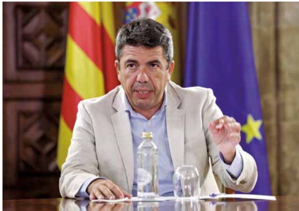
Carlos Mazón en una foto de archivo.

Mazón ha hecho estas declaraciones a preguntas de los periodistas en Elche, donde, junto con el alcalde de la ciudad, Pablo Ruz, ha visitado la exposición sobre la obra del pintor Eusebio Sempere con la que se reabre el