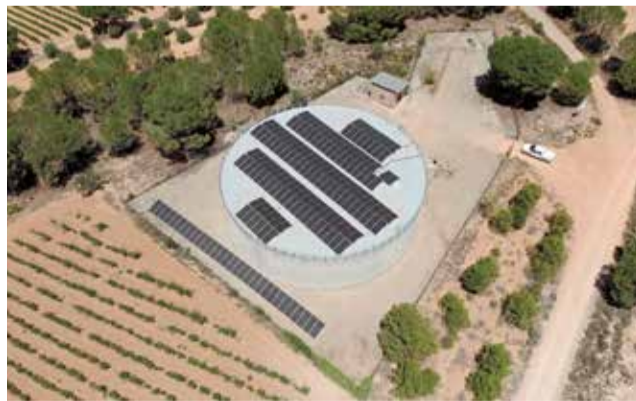
Depósito de Cañada Palletas de Requena.

El depósito de agua de Cañada Palletas, una instalación clave para el abastecimiento en Requena y las pedanías de La Vega, ha sido completamente renovado tras los daños sufridos por la DANA de octubre de 2024. La intervención, que ha supuesto una inversión de 98.000 euros financiada por el Ministerio de Política Territorial, ha devuelto la plena operatividad a esta infraestructura esencial y ha mejorado signi-