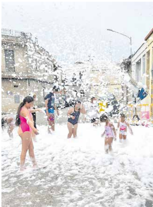
Diversos instants de les festes de barri a Carcaixent.

L'Ajuntament, a través de la Regidoria de Barris, ha volgut donar un impuls especial a estes celebracions amb una proposta d'oci gratuïta, pensada per a tota la família i amb una especial atenció al públic infantil. Activitats com el cinema d'estiu, la festa de l'espuma, els unflables infantils o els espectacles a l'aire lliure han omplit places i carrers de rialles, jocs i ambient festiu. Les jornades han servit no sols per a l'entreteniment, sinó també per afavorir el re-