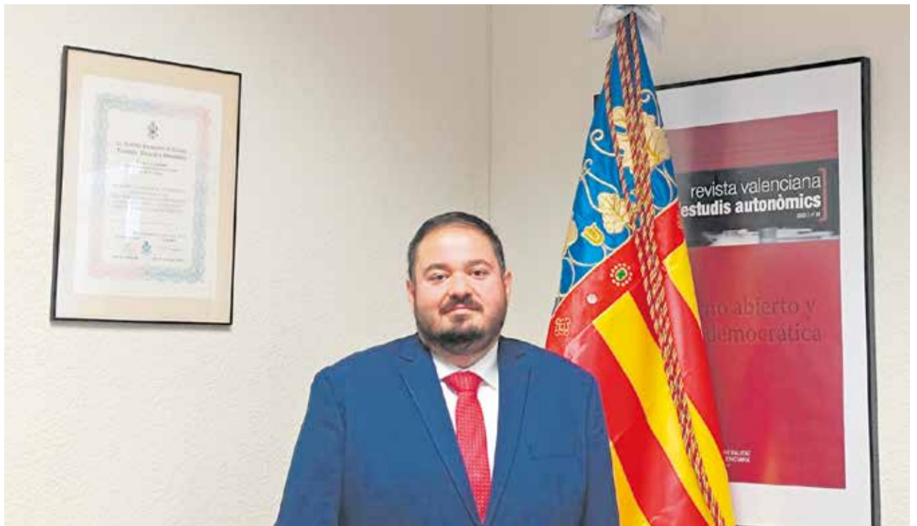
El director general coordina la acción de los centros de Valencia en el exterior.

► Realizamos un exhaustivo control de compatibilidad y de supervisar denuncias que puedan llegar por conflictos de intereses, tanto a cargos públicos como a altos funcionarios. Además, contamos con Regia, el registro de grupos de interés, para detectar si alguien trabaja con empresas, una medida