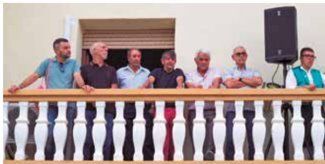
Diferentes momentos durante el pregón en Chera.