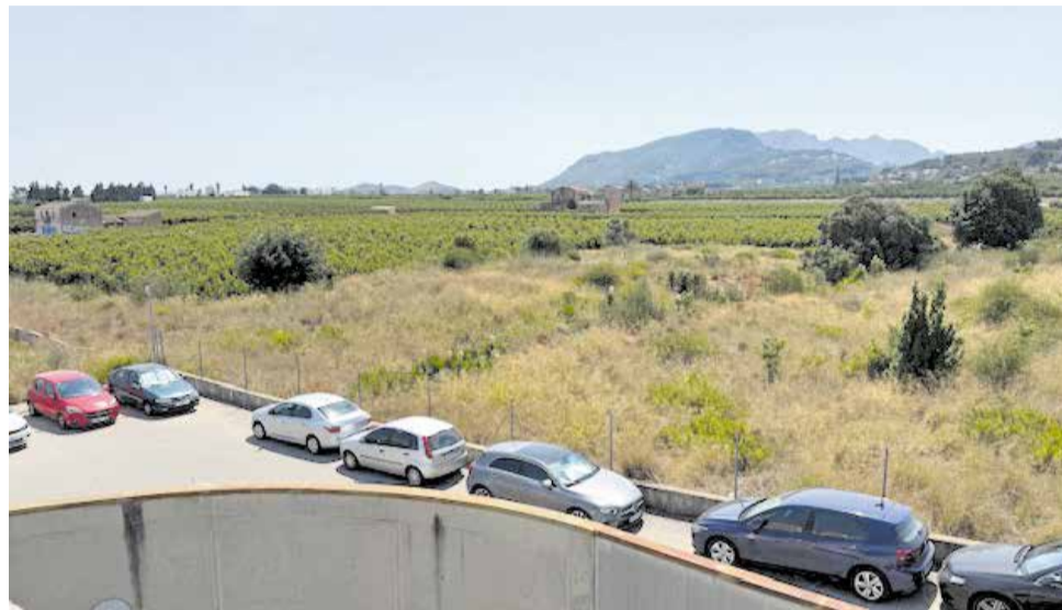
Aparcament de l'Hospital Universitari de la Ribera.

L'Ajuntament d'Alzira ha mantingut en els últims mesos diverses reunions amb la gerència del Departament de Salut de la Ribera, la Conselleria de Sanitat i la Diputació de València. En estes trobades, s'ha reclamat no només la construcció del nou aparcament, sinó també la millora integral dels accessos al recinte hospitalari. Domínguez ha reclamat una actuació coordinada i global que contemple, d'una banda, l'establiment d'una línia regular de trans-