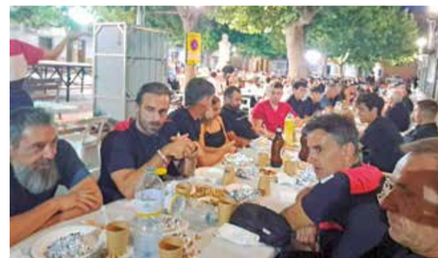
Diferentes momentos durante el pregón de las Fiestas de Macastre.

acontecida el pasado mes de octubre. En este caso, representados por un colectivo que se ha especializado en actuaciones en zonas afectadas por catástrofes naturales. Es justo y muy necesario reconocer a quienes no dudaron en jugarse literalmente la vida sin pedir nada a cambio y con el único propósito de ayudar a los afectados”, señaló el alcal-