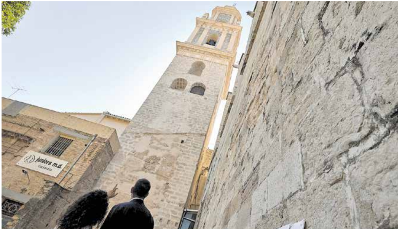
L'exterior del campanar de la Col·legiata de Gandia.