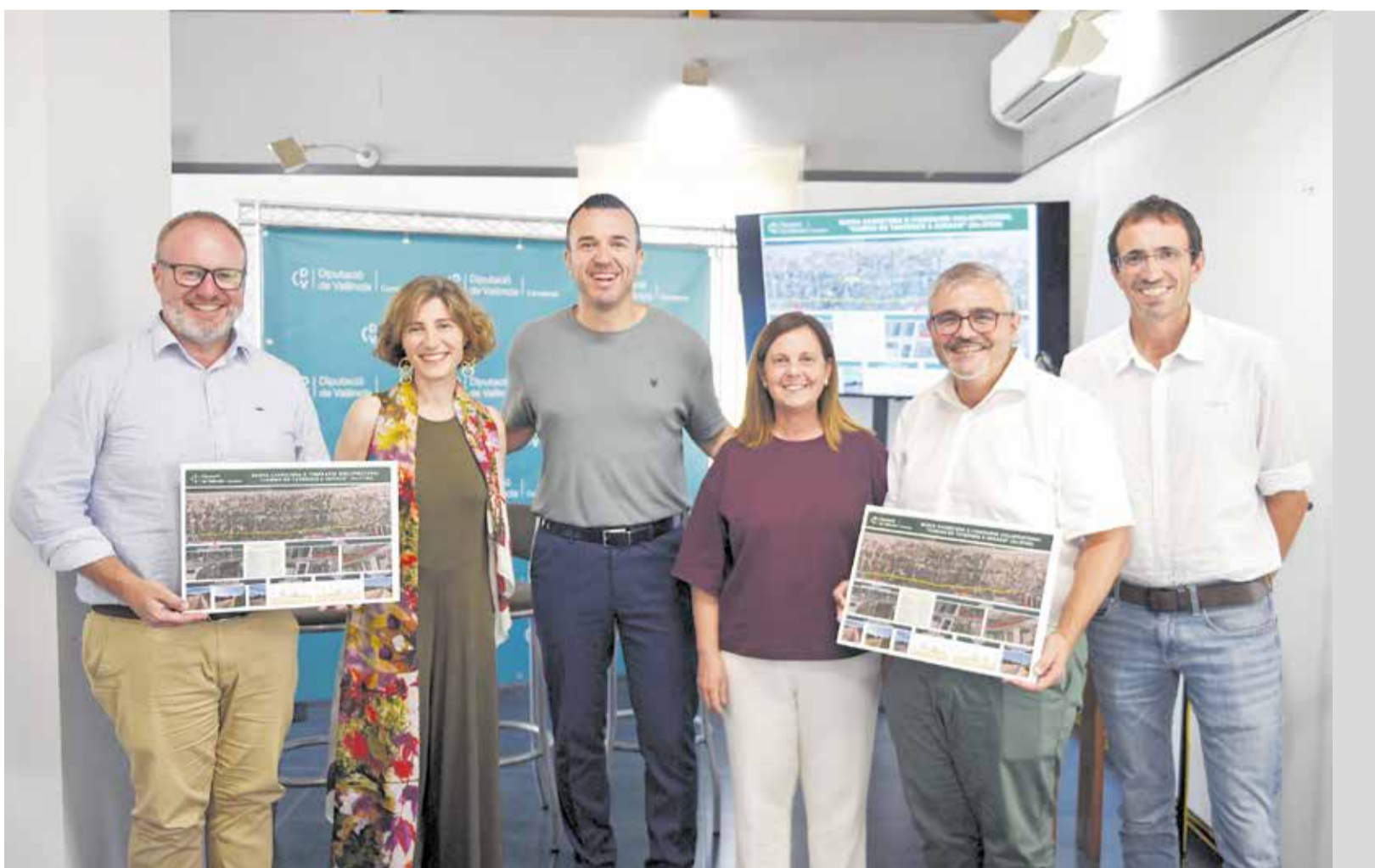
Autoritats provincials i municipals durant la presentació del projecte este mes de juliol.

El tram de 4,4 km unirà la CV-603 de Tavernes amb la CV-605 de Xeraco i completarà la connexió litoral