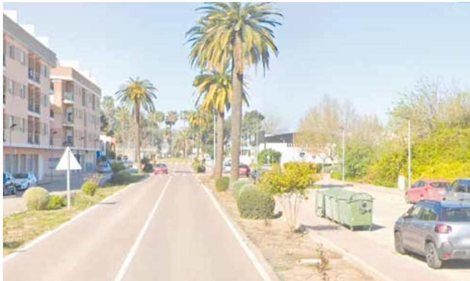
La CV-515, al seu pas pel centre d'Albalat de la Ribera.

També es contempla la restitució del pas de vianants cap al cementeri i l'adequació de les canalitza-