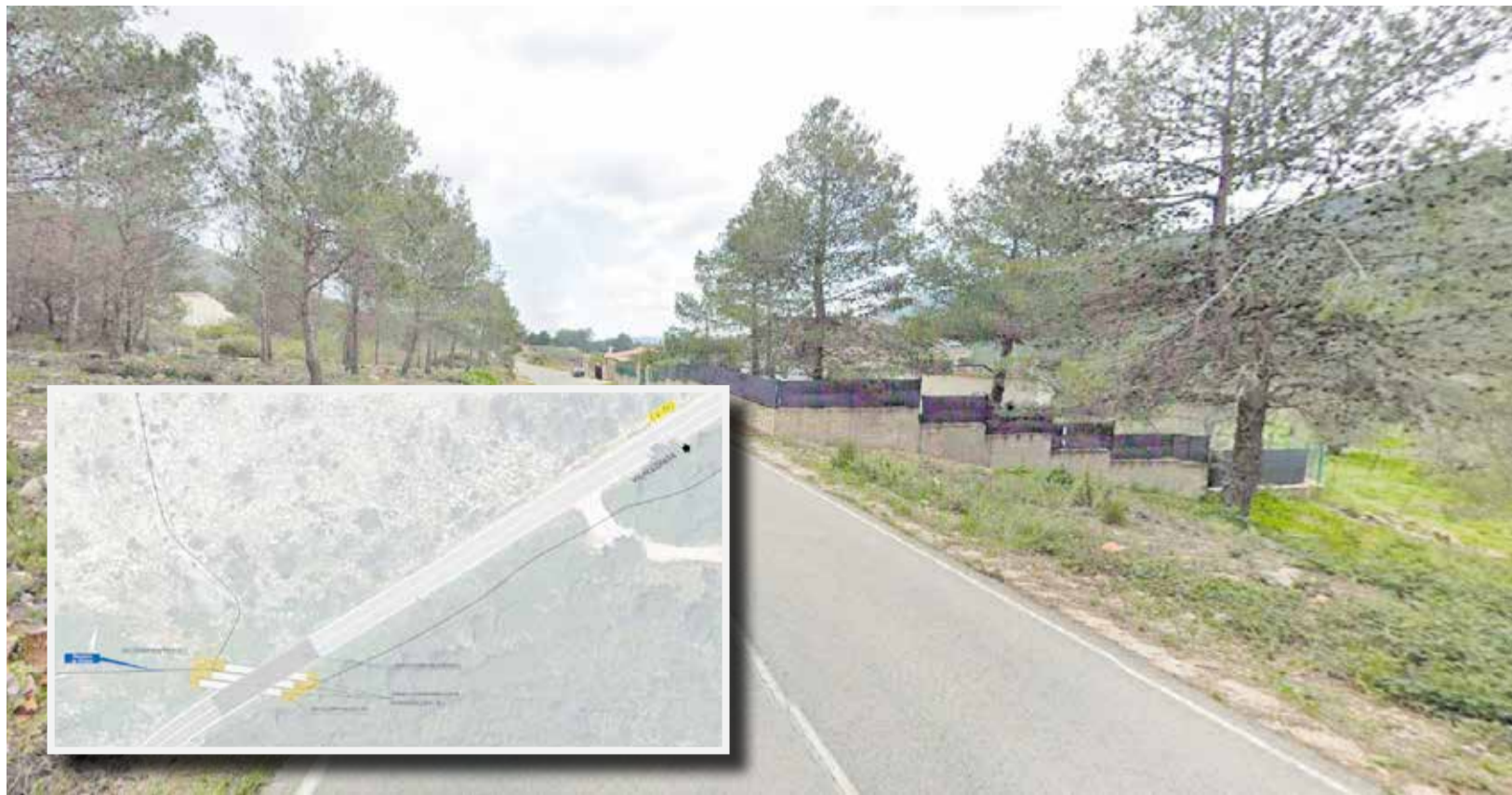
Un tram de la carretera afectada i la intervenció que acomet estos mesos la Generalitat.

■ L'AJUNTAMENT DE VILALLONGA ADVERTIX DEL "RISC D'AÏLLAMENT" EN CAS D'INCENDI DE LA ZONA DE LA LLACUNA I CRITICA LA "FALTA DE PREVISIÓ" EN L'EXECUCIÓ D'UNES OBRES EN LA CARRETERA QUE CONNECTA AMB LA VALL DE LA GALLINERA