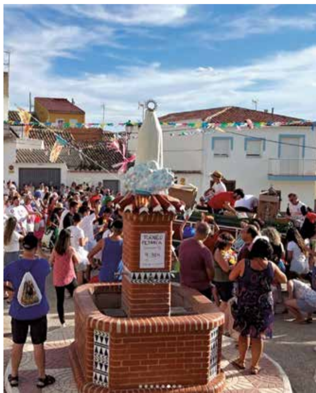
Fiestas de Casas de Moya (Venta del Moro).

Sin embargo, hay una estación y sobre todo un mes en el año que la tendencia se revierte. Agosto y el verano devuelve a muchas de las personas que emigraron y a sus descendientes a sus lugares de origen. Durante su estancia, el pueblo recobra vida. La gente ocupa las calles para tomar el fresco, los niños llenan las plazas y los parques y los bares rebosan de clientes y comandas. La celebración de las fiestas patronales, las verbenas, los primeros amores y excesos de alcohol, las tardes de fútbol, frontón y bicicleta, los esperados reencuentros... En definitiva, momentos que hacen que volver al pueblo en agosto sea una excelente opción para desconectar y