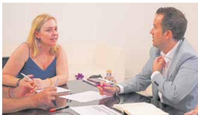
La reunió entre la vicepresidenta i l'alcalde.

Carratalá va recordar que l'obra va començar en 2009, després d'haver-se impulsat en 2006 amb una inversió inicial d'1 milió d'euros de fons municipals. No obstant això, la crisi econòmica va obligar a aturar els treballs tan sols dos anys després, deixant una estructura de formigó de més de 2.500 m 2 totalment inacabada. "No podem permetre que esta infraestructura con-