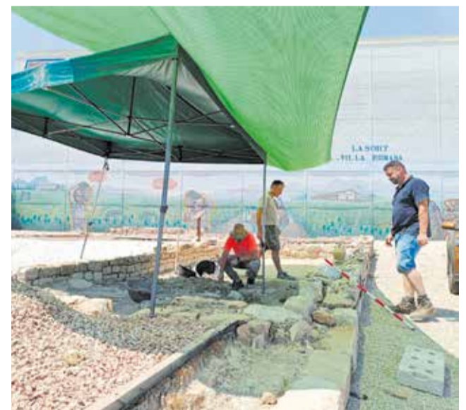
Excavacions en el jaciment.

Els directores de les excavacions són doctorands de la Universitat d'Alacant especialitzats en el paisatge antic de la Safor. A més de l'excavació pròpiament dita, els treballs inclouen anàlisis geofísics, estudis de laboratori i la incorporació de noves troballes al discurs museogràfic del jaciment. Es preveu que les zones que ara es posaran al descobert puguen ser integrades en l'itinerari visitable amb nous panells informatius i materials divulgatius.