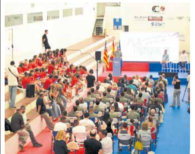
Presentació del pla.

Carlet i Guadassuar complixen amb els requisits per rebre el màxim de l'ajuda contemplada en el pla. Amb estes actuacions es pretén garantir que els trinquets continuen sent espais vius on xiquetes i xiquetes puguen créixer amb els valors de la pilota.