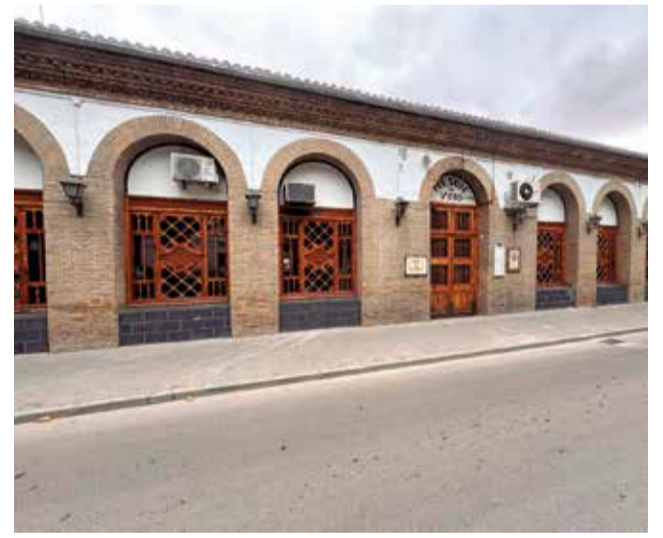
Mesón del Vino.

Desde el Ayuntamiento se destaca la importancia de esta actuación, el Mesón del Vino ha sido durante décadas