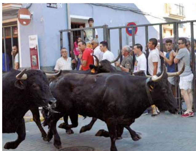
Fotos de archivo de las Fiestas y Toros de Ayora de ediciones pasadas.

Los más pequeños podrán disfrutar desde las 11:00 h de las colchonetas en la Lonja, un espacio lúdico donde la diver-