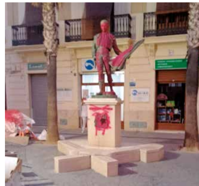
Escultura de Enrique Ponce.

La corporación municipal del Ayuntamiento de Chiva ha condenado los hechos y ha manifestado su rechazo a cualquier acción que atente contra el patrimonio público del municipio. Desde el consistorio se ha calificado lo ocurrido como “totalmente incomprensible, injustificable y despreciable”, incidiendo en que este tipo de actos afectan a la convivencia ciudadana y a la dignidad de las personas.