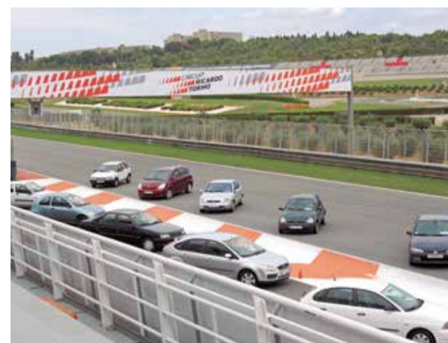
Diferentes momentos durante la entrega de los vehículos a las familias afectadas.