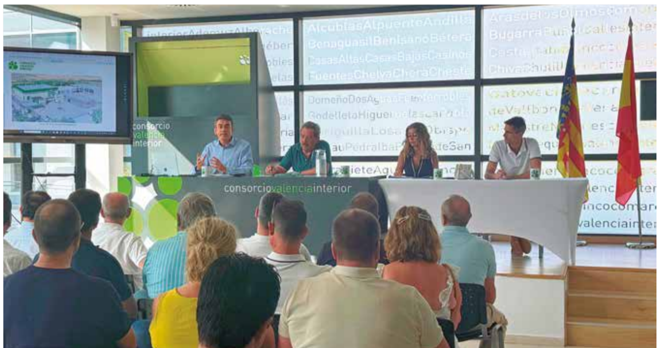
Asamblea del Consorcio Valencia Interior celebrada el pasado 22 de julio.

pasado martes 22 de julio, se escucharon las inquietudes de varios municipios, entre ellos Cheste, respecto al servicio de recogida de envases ligeros. En respuesta, la presidencia del consorcio se comprometió públicamente a estudiar posibles modificaciones del sistema actual, dimensionándolo adecuadamente y proponiendo mejoras específicas en rutas, frecuencias y operativa, con el objetivo de optimizar el