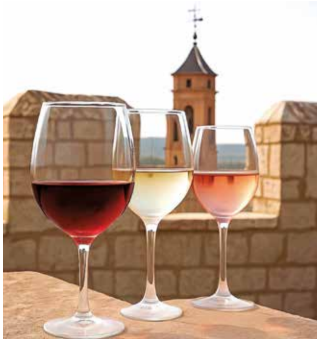
Instantáneas de Requena.

sentar un proyecto sólido y ambicioso que cuente con el respaldo del sector vitivinícola local –instituciones, bodegas, viticultores, asociaciones y entidades del ámbito del vino– y que posicione a Requena como epicentro del vino a nivel nacional durante todo el año 2026, con una completa programación de acciones de pro-