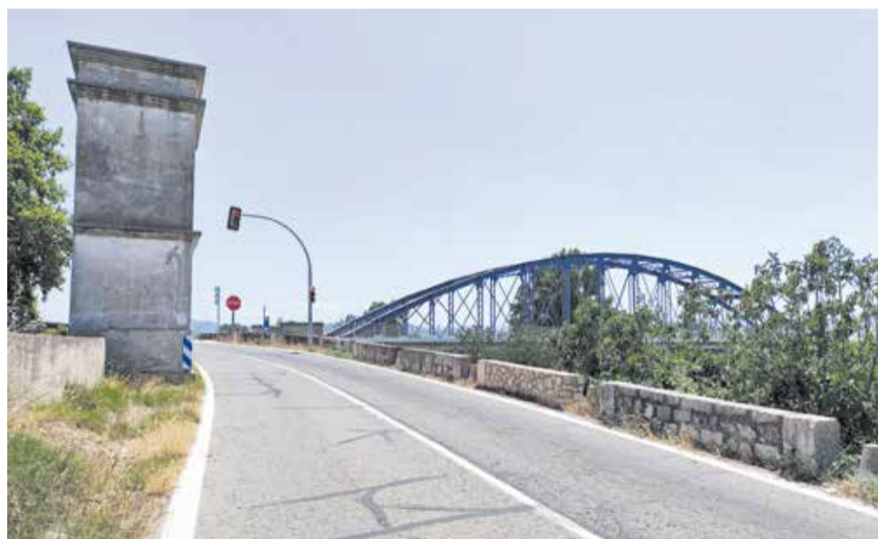
La carretera de Gavarda.

La proposta contempla una infraestructura adaptada al terreny i a les condicions del traçat actual, dividida en trams segons les característiques físiques del terreny. Inclourà elements com una passarel·la metàl·lica de 37 metres, que s'ancorarà al mur de maçoneria ja existent i que permetrà salvar un dels punts