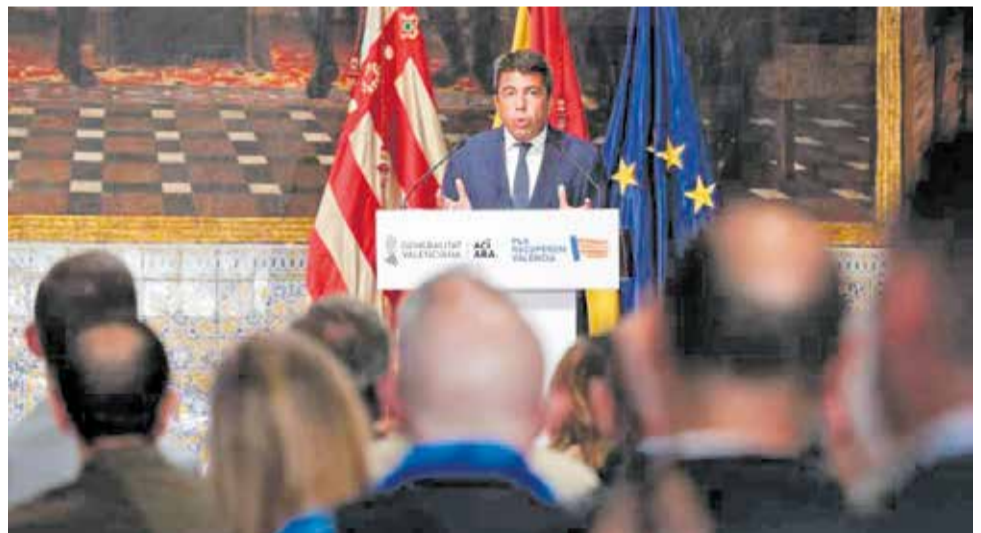
Carlos Mazón en la presentación del Plan Endavant.

Mazón anunció que promoverá la creación de una empresa pública mixta Generalitat-Estado para impulsar la ejecución de infraestructuras hidráulicas, y la creación de una agencia estatal del agua con sede en la Comunidad Valenciana; y dentro de las competencias autonómicas impulsar la construcción de vivienda a través de una empresa mixta Generalitat-sector privado, y crear una comisión parlamentaria permanente en Les Corts para seguimiento y control del Plan Endavant.