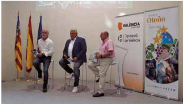
Presentación de la edición anterior. / EPDA

La edición anterior, que se desarrolló entre septiembre y diciembre de 2024, ofreció un formato itinerante con cinco eventos emblemáticos: el Plum & Blues en Tuéjar en torno al jazz, el libro y la gastronomía; las Jornadas de la Mujer Rural en Aras de los Olmos, con degustaciones como la tradicional olla serrana reinterpretada por chefs locales; el I Certamen de Caravaning en Benagéber; la mística Noche de las Hachas en Titaguas; y la III Feria de la Trufa en Chelva, donde la gas-