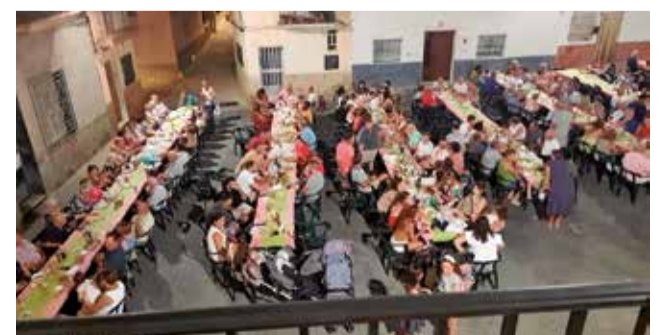
Diferentes actos de las fiestas de 2024.