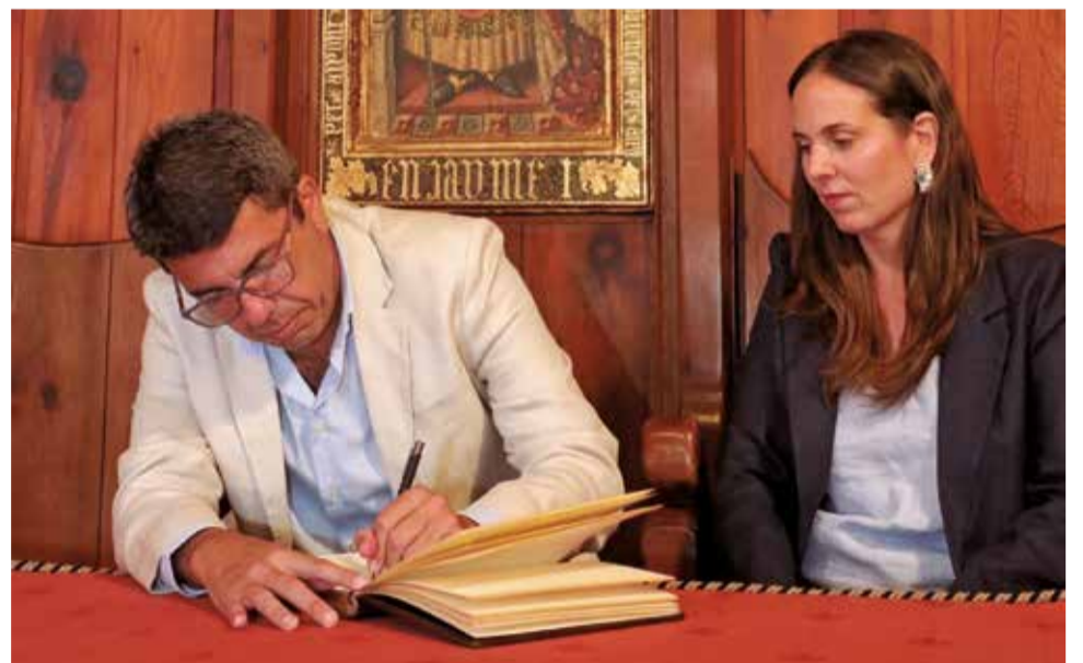
El president Carlos Mazón firma en el Libro de Oro de Alpuente.

La Comisión Interdepartamental reunida en Alpuente acordó la elaboración de un Plan Integral de Reto Demográfico, con el objetivo de coordinar la acción de las diferentes administraciones.