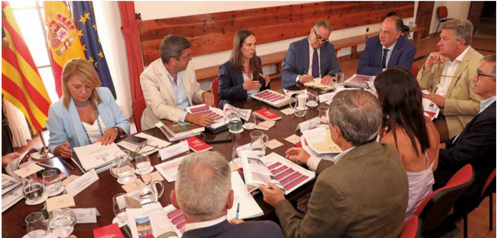
Un instante durante la Comisión Interdepartamental contra el Despoblamiento y por la Equidad Territorial en Alpuente.

Así, la visita se centró en una de las principales problemáticas que enfrentan las comarcas del interior valenciano, como es La Serranía: el reto demográfico. En esta línea, Mazón subrayó que la lucha contra la despoblación es una política transversal del Consell en la que cada departamento "ejecuta sus acciones en materia de discriminación positiva en favor de estos municipios".