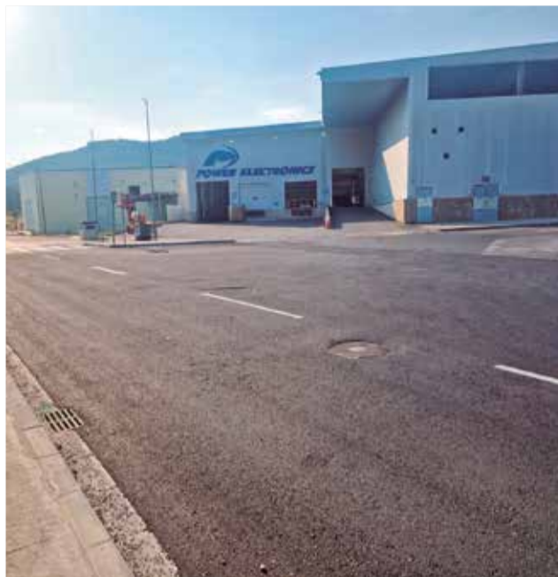
Mejoras en el polígono industrial.

Por un lado, con cargo al Plan Eólico de la Comunitat Valenciana (PECV) del Instituto Valenciano de Competitividad Empresarial (IVACE), se ha ejecutado una obra de 116.876,22 euros para la pavimentación y adecuación de tres calles del municipio. En la calle Antonia González, los trabajos han incluido la creación y renovación de aceras, mejora del sistema de alcantarillado y recogida de aguas pluviales, ade-