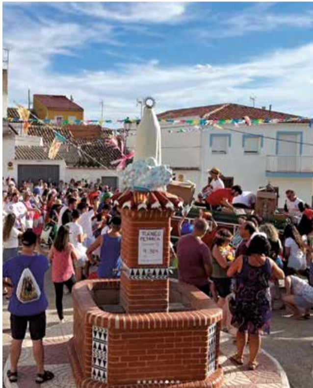
Fiestas de Casas de Moya (Venta del Moro).

Sin embargo, hay una estación y sobre todo un mes en el año que la tendencia se revierte. Agosto y el verano devuelve a muchas de las personas que emigraron y a sus descendientes a sus lugares de origen. Durante su estancia, el pueblo recobra vida. La gente ocupa las calles para tomar el fresco, los niños llenan las plazas y los parques y los bares rebosan de clientes y comandas. La celebración de las fiestas patronales, las verbenas, los primeros amores y excesos de alcohol, las tardes de fútbol, frontón y bicicleta, los esperados reencuentros... En definitiva, momentos que hacen que volver al pueblo en agosto sea una excelente opción para desconectar y ale-