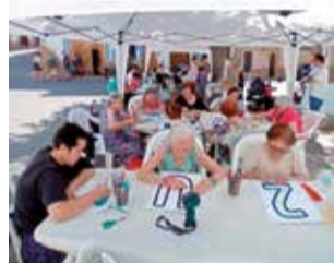
Actividad. / EPDA