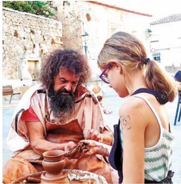
Varias actividades durante las IV Jornadas Íberas de Andilla, celebradas el 26 y 27 de julio.

El sábado arrancó con una exposición de piezas íberas en el Local Social, seguida de talleres infantiles sobre armamento y