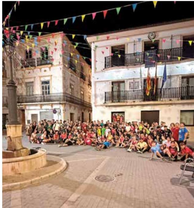
Diferentes actos del primer fin de semana de las fiestas de verano de Pedralba.

El acto concluyó con el pregón de fiestas, a cargo de los Festeros de Verano 2023-2025