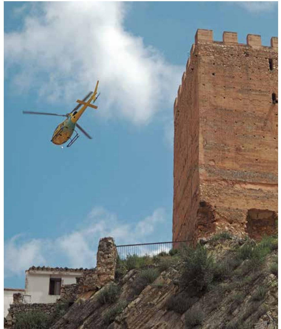
El programa 'Volando voy' de Jesús Calleja visitó Sot de Chera.

Todavía la mayor parte del río Sot necesita ser limpiado tanto de los peligrosos restos de la dana como de vertidos que no han podido ser todavía canalizados por los colectores. Paciencia y volveremos.