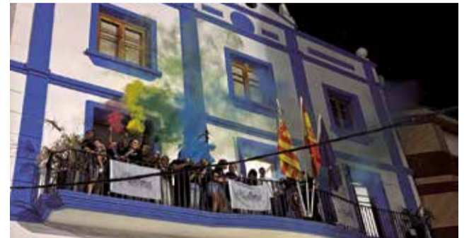
Pregón de las fiestas 2025 de Tuéjar.

El 9 de agosto comenzará con la misa en honor a San Cristóbal y un desfile de vehículos engalanados. Ya por la noche, el color y la alegría del carnaval darán paso a la actuación de la orquesta TOKYO.