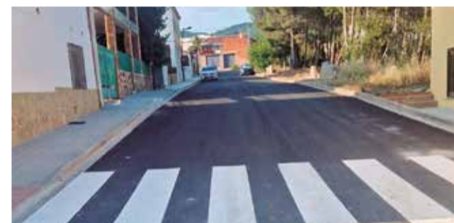
Trabajos en diferentes calles del casco urbano.

do, dentro de las líneas de actuación para la mejora de infraestructuras industriales en municipios en riesgo de despoblación.