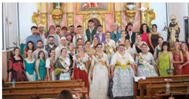
Diferentes actos de las fiestas de Losa del Obispo.