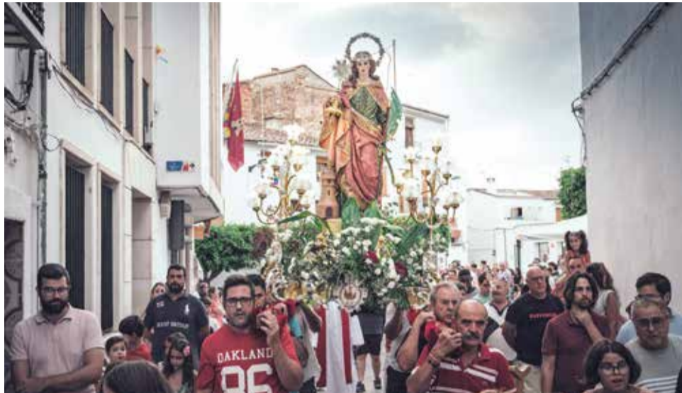
Traslado de Santa Bárbara en Chulilla.

Las celebraciones continuarán durante toda la semana con un calendario de actividades tan diverso como participativo. El lunes 11, tras la misa en honor a Nuestra Señora de los Ángeles y la masclèt, los vecinos podrán disfrutar por la tarde del espectáculo infantil Funny Up Jump en la Plaza del Lobo, seguido por la procesión, una cena en la plaza y una marcadiscomóvil con sorpresas.