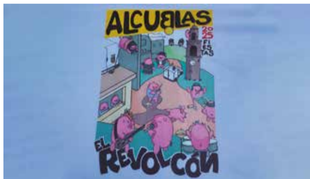
Imagen de las fiestas 2025 de Alcublas.

Durante toda la semana, los vecinos y visitantes podrán disfrutar de una agenda variada que incluye tardes taurinas los días 16 (sábado),