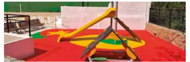
Campo Arriba (arriba) y Baldozar (abajo).

una importante inversión de 40.000 euros, que ha permitido además mejorar su accesibilidad, haciendo del espacio un lugar más inclusivo y funcional para todos los vecinos.