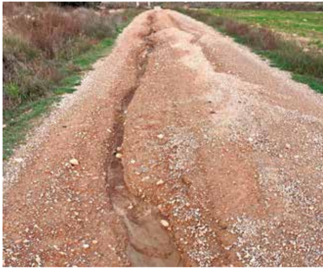
Uno de los caminos afectados en Titaguas.

Debido a la orografía del municipio y la presencia de varios barrancos que recogen agua de zonas altas –tanto del propio término como de municipios vecinos como Alpuente y Aras de los Olmos–, las lluvias generaron un fuerte arrastre de agua y sedimentos hacia las zonas más bajas, especialmente en la planicie