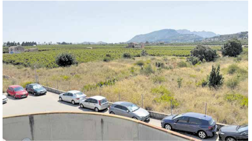
Aparcament de l'Hospital Universitari de la Ribera.