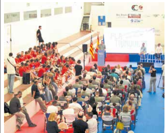
Presentació del pla.

Carlet i Guadassuar complixen amb els requisits per rebre el màxim de l'ajuda contemplada en el pla. Amb estes actuacions es pretén garantir que els trinquets continuen sent espais vius on xiquets i xiquetes puguen créixer amb els valors de la pilota.