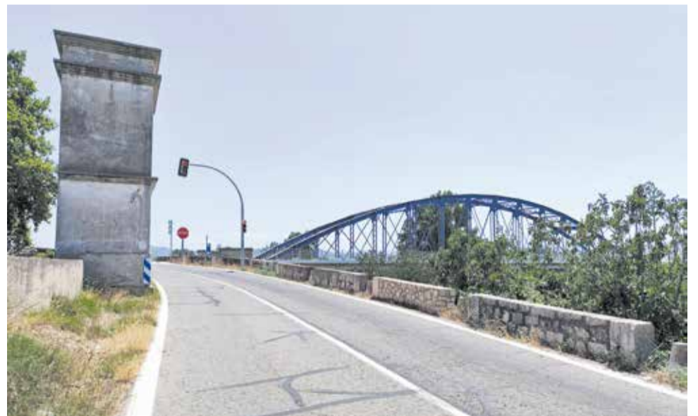
La carretera de Gavarda.

La proposta contempla una infraestructura adaptada al terreny i a les condicions del traçat actual, dividida en trams segons les característiques físiques del terreny. Inclourà elements com una passarel·la metàl·lica de 37 metres, que s'ancorarà al mur de maçoneria ja existent i que permetrà salvar un dels punts