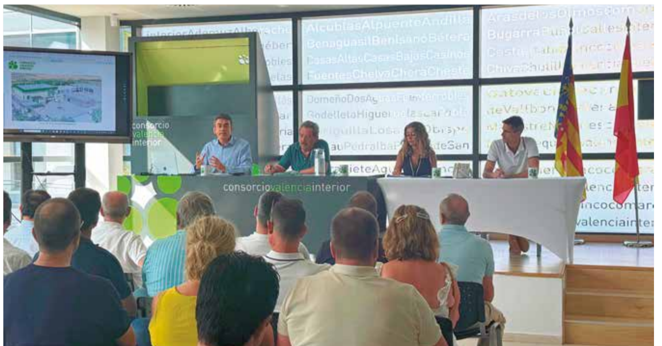
Asamblea del Consorcio Valencia Interior celebrada el pasado 22 de julio.

pasado martes 22 de julio, se escucharon las inquietudes de varios municipios, entre ellos Cheste, respecto al servicio de recogida de envases ligeros. En respuesta, la presidencia del consorcio se comprometió públicamente a estudiar posibles modificaciones del sistema actual, dimensionándolo adecuadamente y proponiendo mejoras específicas en rutas, frecuencias y operativa, con el objetivo de optimizar el