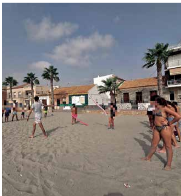
Diferentes actividades del campamento en Los Alcázares.

Durante toda una semana las niñas y niños se han hospedado en un centro vacacional cercano al mar