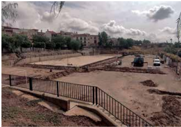
Inicio de las obras en el polideportivo de Losa.

El proyecto, con un presupuesto total de 288.347,60 euros financiado a través del programa de la Diputación