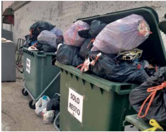
Islas de contenedores este verano en Alcublas.