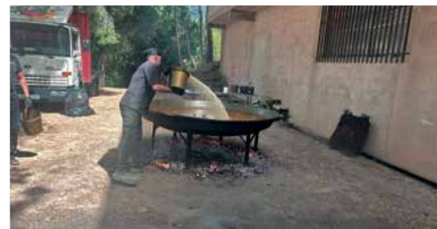
Diferentes actos de las fiestas de Higueruelas.