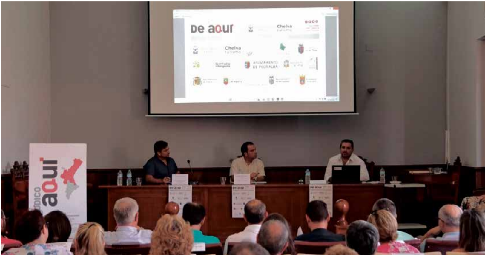
El municipio de Chelva fue el anfitrión de la primera edición de las Jornadas de Turismo de La Serranía en 2024.

LA CITA, ORGANIZADA POR EL GRUPO EL PERIÓDICO DE AQUÍ, PONDRÁ LA DANA Y LA SOSTENIBILIDAD EN EL CENTRO