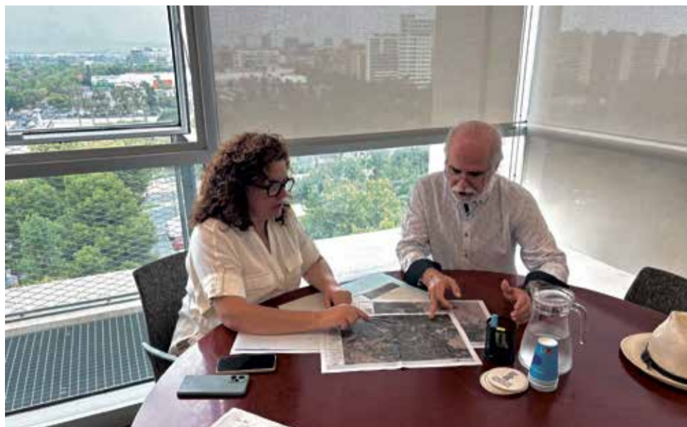
La directora general de Infraestructuras y el alcalde de Benagéber.

Martínez reconoció que actualmente no existen recursos suficientes para afrontar toda la inversión. Por este motivo, la Conselleria ha optado por iniciar las actuaciones más urgentes a