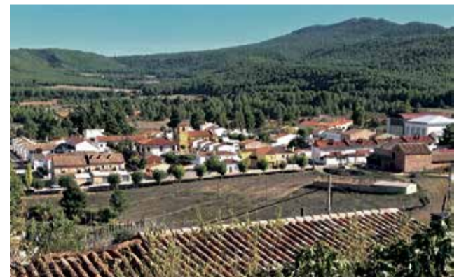
Vista de Benagéber.