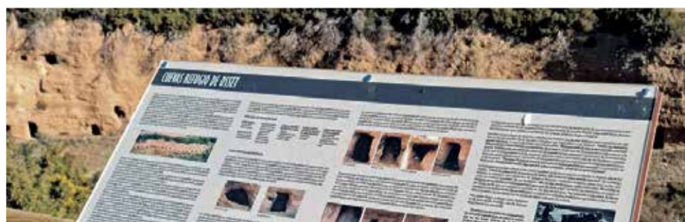
Cuevas Refugio en la aldea de Osset, en Andilla.

por los propios vecinos de Andilla y sus aldeas.