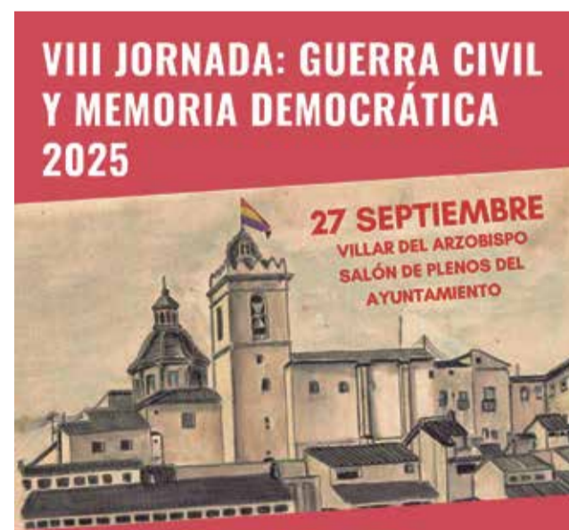
Cartel de la jornada.

La VIII Jornada dará comienzo a las 10:00 horas, en el Salón de Plenos del Ayuntamiento de Villar del Arzobispo (Plaza de la Iglesia), con la apertura a cargo de las autoridades y la asociación VIMEDE, dando paso a un total de cinco comunicaciones de expertos que