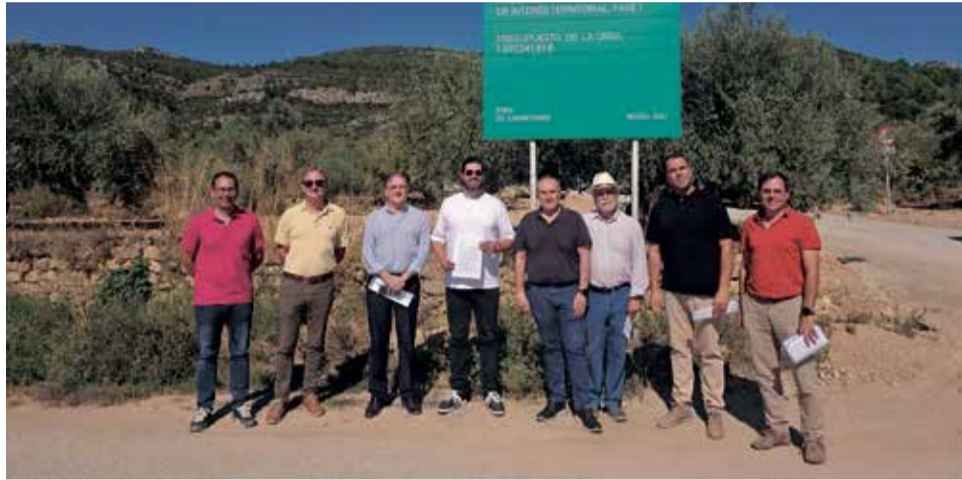
Autoridades en la recepción de las obras.

Además, la también vicepresidenta segunda de la Diputación ha destacado el valor añadido que tienen para la prevención y extinción de incendios, al atravesar una amplia zona forestal de gran valor ambiental y facilitar el trabajo de los equipos de emergencias en caso de in-