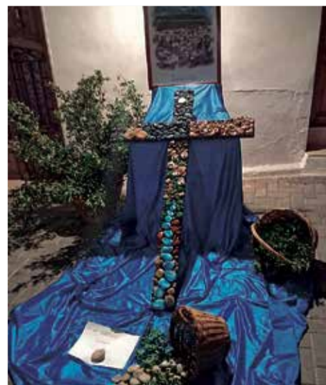
Fiesta de las Cruces de Chulilla.