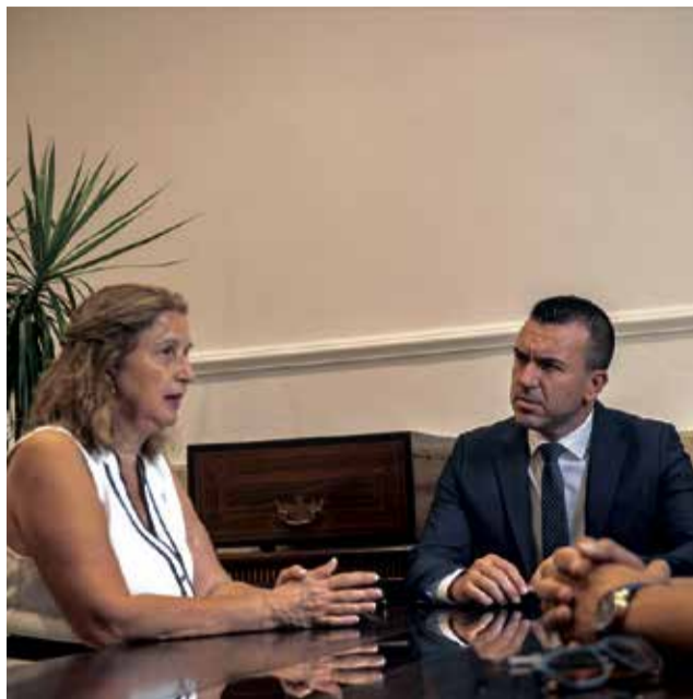
Varios instantes durante la reunión en la Diputación de Valencia.

Por otra parte, está previsto habilitar un nuevo almacén municipal ya que la dana inundó los que había y hay que cambiarlo de ubica-