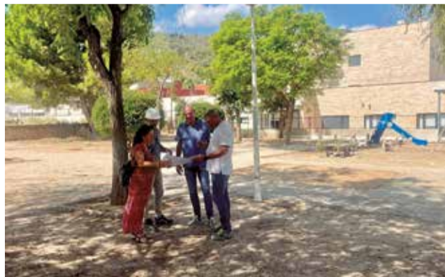
Parc del carrer Miguel Hernández.

Els treballs es van posar en marxa el dilluns 15 de setembre, després de la signatura de l'acta d'inici per part dels responsables de l'alcaldia, la direcció d'obra i l'empresa adjudicatària. La primera jornada va consistir en el desmuntatge del vell parc i el condicionament de l'espai, amb un termini d'execució previst de 13 setmanes. Tant l'alcalde, Mentxu Bala-