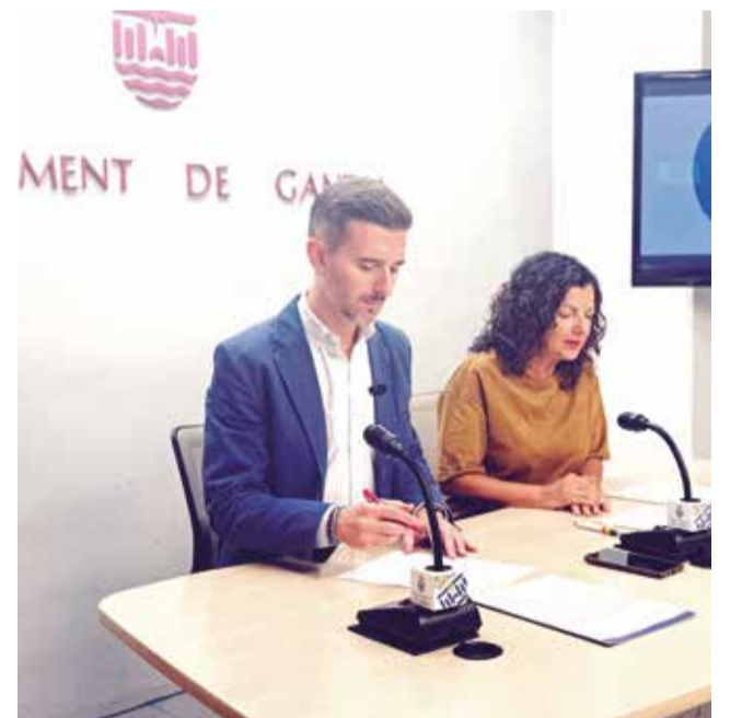
Un momento durante la rueda de prensa.

Además, Soler advirtió que “el gobierno de Prieto es el primero en la historia de Gandia que está favoreciendo la privatización de la escolaridad y recortando en servicios públicos empeorando la vida de las familias”.