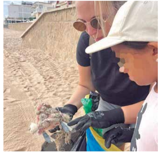
Recollida de residus a Piles.

Al llarg de la jornada es van recollir més de sis quilos de residus, entre plàstic, vidre i matèria orgànica, en un exercici col·lectiu que posa de manifest la necessitat de reduir l'impacte dels abocaments humans sobre el nostre entorn natural. Des de l'Ajuntament de Piles es