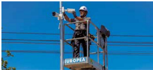
Un operari instal·lant les noves càmeres.

El sistema estarà connectat a una central de vigilància que únicament podrà ser consultada per les Forces i Cossos de Seguretat de l'Estat en cas que existisca una denúncia, garantint d'esta manera la privacitat de