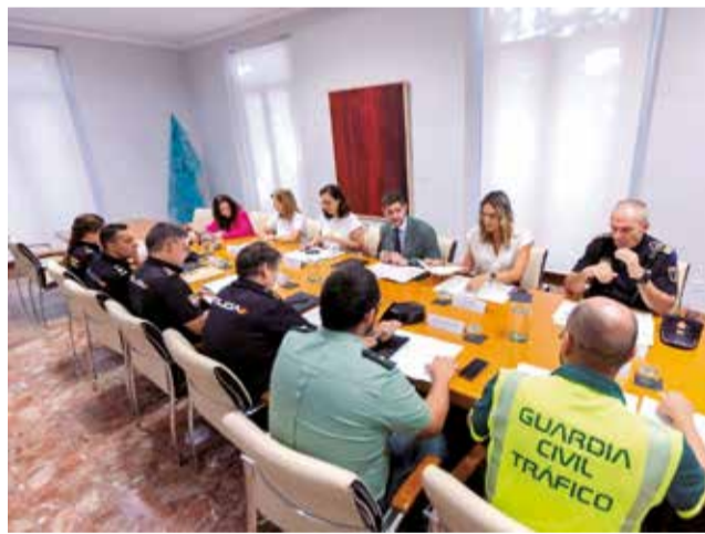
Un moment durant la Junta Local de Seguretat.