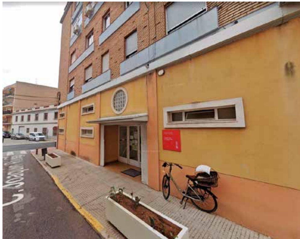
Consultori auxiliar de Sant Francesc d'Oliva.

"És una molt mala notícia, fruit d'una molt mala gestió municipal. El que hui es tira per la borda és el resultat de molts anys d'abandó per part dels governs del PSOE, Com-