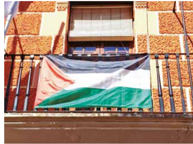
Bandera de Palestina al balcó de l'Ajuntament.

L'Ajuntament de Fortaleny ha fet públic un comunicat en què expressa la seua solidaritat amb el poble palestí davant el genocidi que està patint, amb desenes de milers de víctimes –moltes d'elles xiquets– i més d'un milió de persones desplaçades de les seues cases. El consistori ha destacat que, "com no podia ser d'altra manera", vol sumar-se a les veus que reclamen pau i justícia davant la greu situació humanitària que travessa Palestina. Com a gest simbòlic de suport, durant les pròximes setmanes es penjarà la bandera palestina al balcó de l'Ajuntament de Fortaleny, amb la voluntat de fer visible este compromís i sensibilitzar la ciutadania sobre la magni-