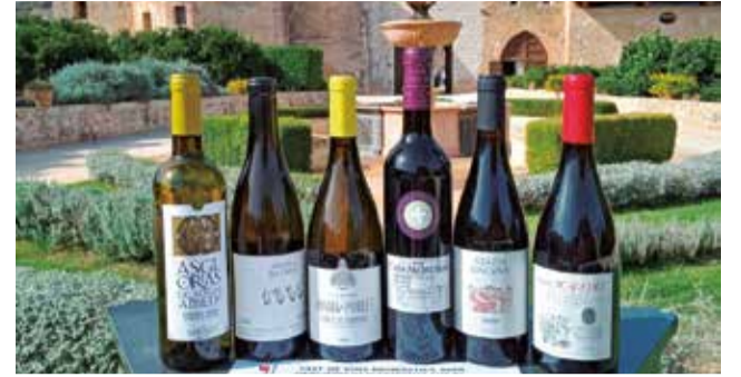
Encontre de Gastronomia Monàstica. / EPDA

d'enquadració artesanal, etc. a més de visites guiades i altres activitats que completen l'oferta turística.