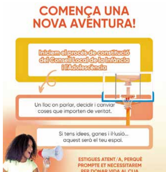
Cartell del CLIA de Palma de Gandia.

Al llarg de les pròximes setmanes, es duran a terme diverses accions per tal de donar a conèixer el projecte i