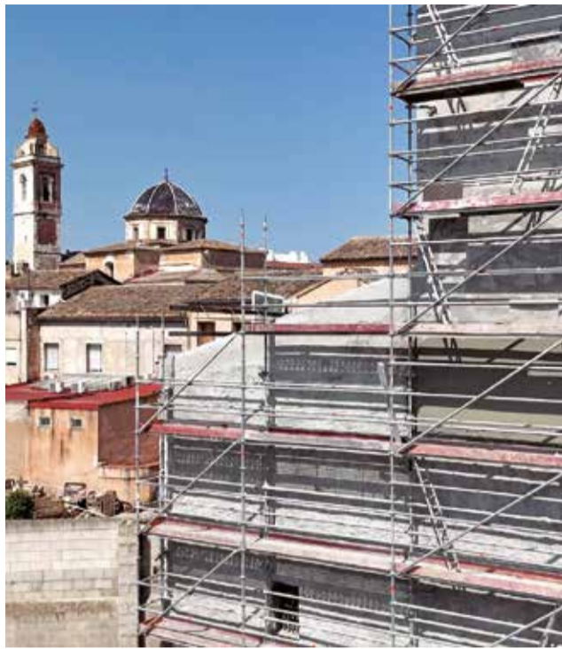
Obres del Convent dels Àngels d'Alberic.

El projecte compta amb una subvenció provinent de Fons Europeus d'1.105.681'70 euros, sent l'import de l'adjudicació