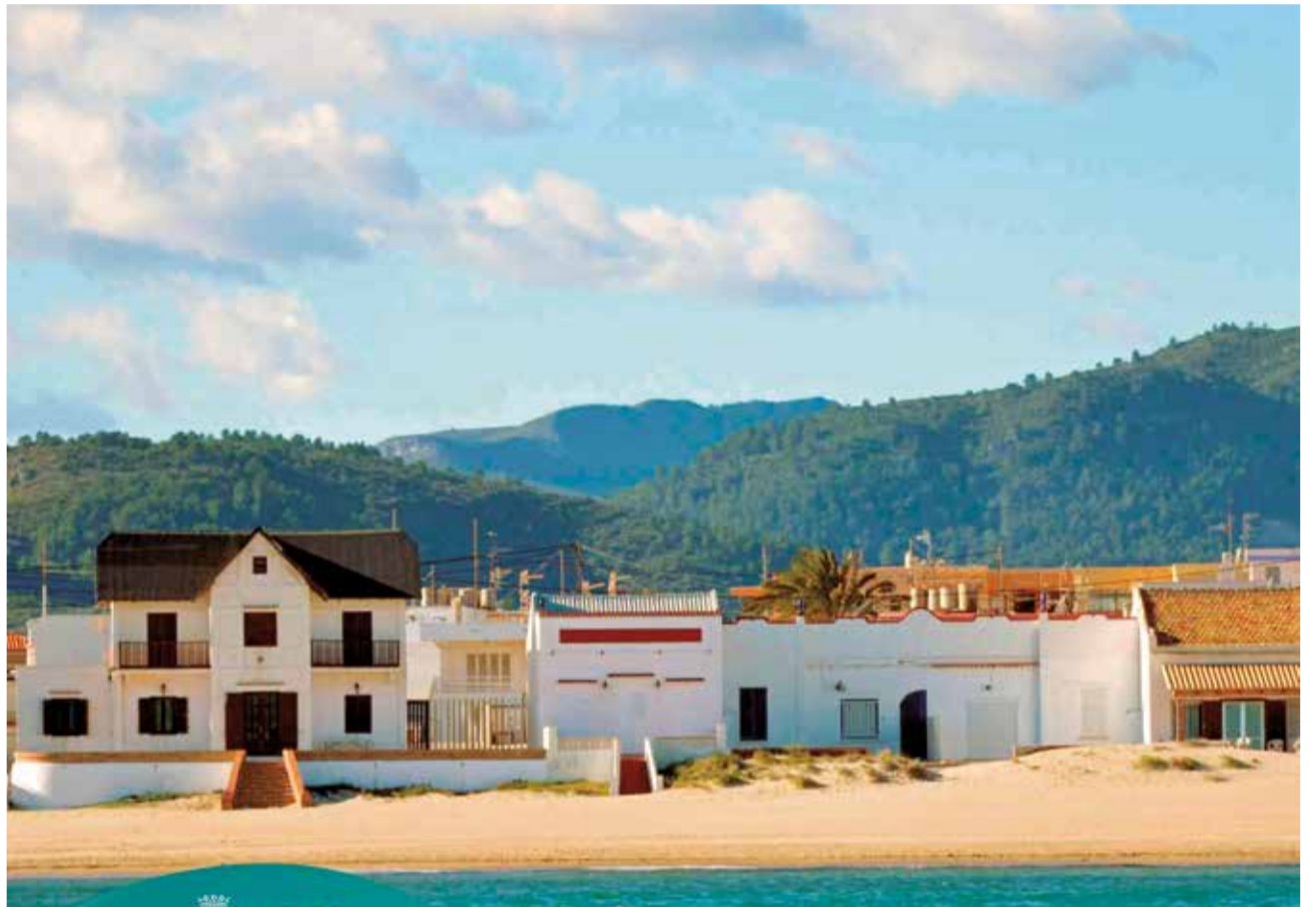
Les Cases del Muntanyar i de la Mitja Galta d'Oliva.

La Llei de Costes valenciana reconeix esta figura de protecció per als assentaments tradicionals del li-