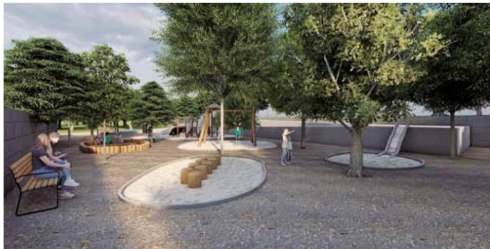
La millora de l'espai verd del Parc dels Somnis de Miramar.

Es posarà en marxa un dels projectes més esperats pels veïns i veïnes: la millora de l'espai verd del Parc dels Somnis, que es transformarà