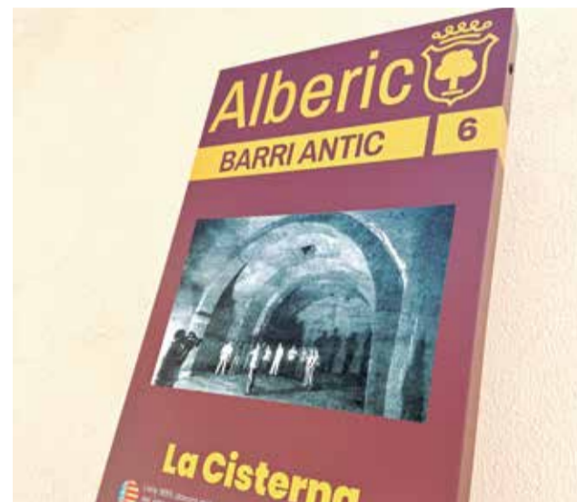
Cartell del barri antic d'Alberic.

investigació i redacció dels textos de Sara Portero. Estos tòtems no únicament són per a la gent que ens visite, ja que moltes i molts dels veïns d'Alberic som conscients de la importància d'alguns punts del nostre poble, però desconeguem la història que s'amaga darrere d'ells. Ara, caminant pel carrer i escanejant un codi amb el nostre telèfon, podem endinsar-nos en la història d'Alberic".