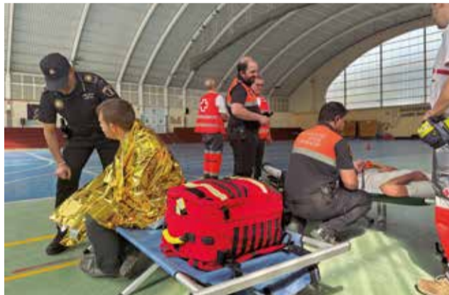
Diferents moments durant el simulacre.

de risc d'inundació i als càmpings que romangueren en les seues instal·lacions, en trobar-se en zona segura. Paral·lelament, es va informar les famílies mitjançant xarxes socials perquè evitaren desplaçaments innecessaris pels menors.