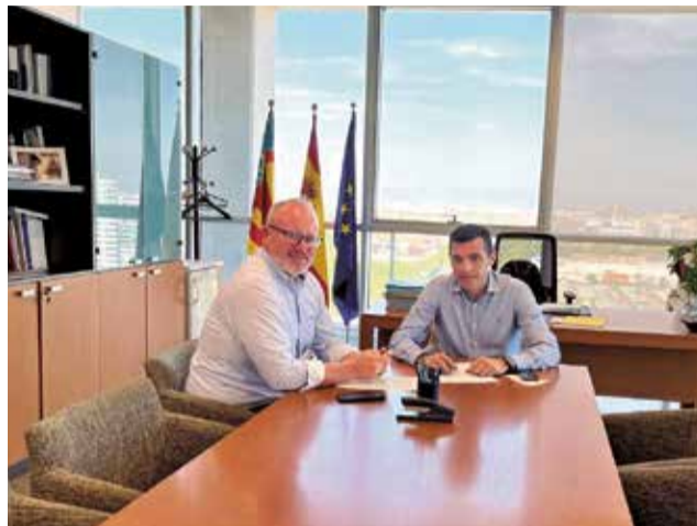
Un moment durant la reunió.

La trobada suposa, segons fonts municipals, "un pas endavant per a garantir un desenvolupament urbanístic ordenat, responsable i adaptat a les necessitats reals del poble". Mascarell ha remarcat la importància d'aquestes gestions, que permetran consolidar un model