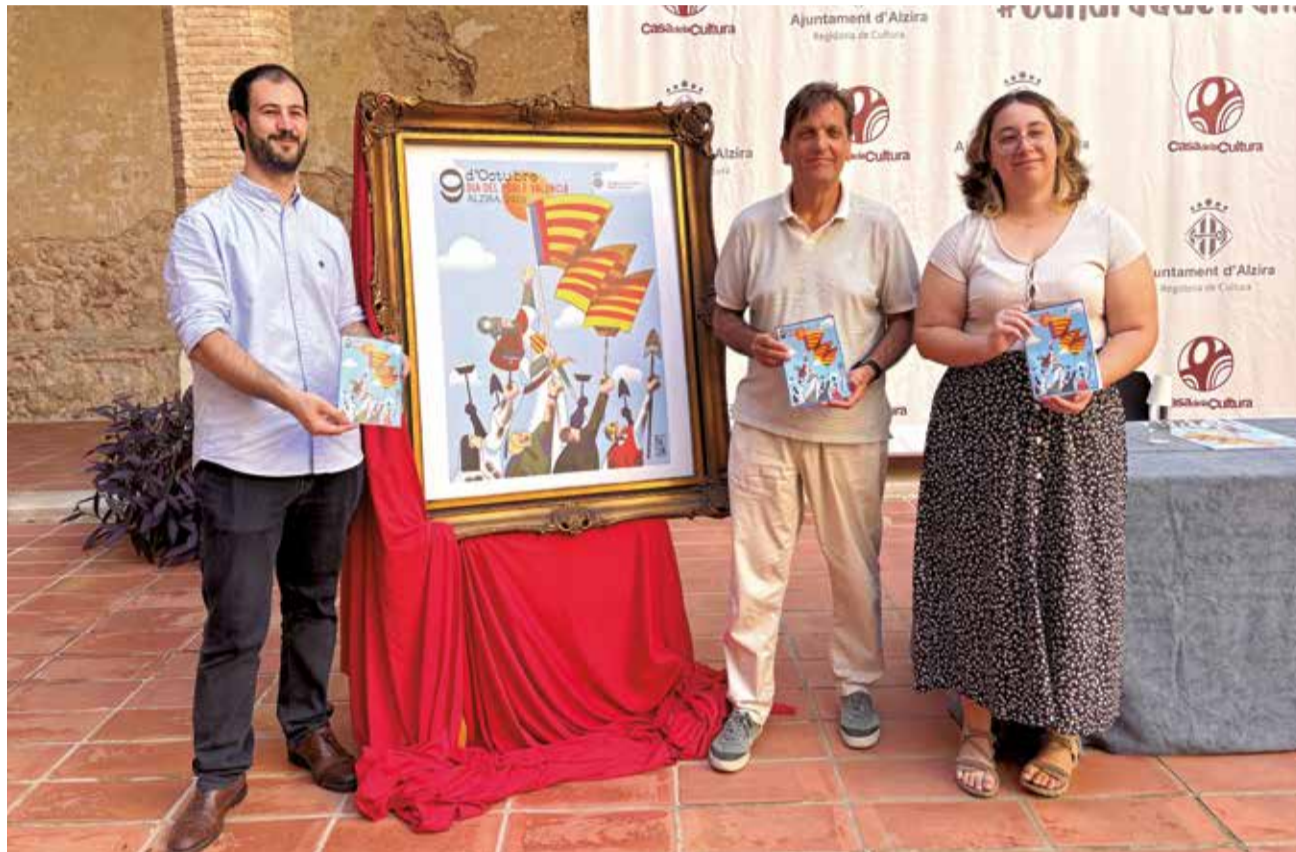
Presentació del cartell del 9 d'Octubre d'Alzira.

La il·lustradora del cartell, Flora Gálvez, ha explicat les claus de la seua obra, inspirada en els símbols identitaris de la ciutat, com és la senyera i el principal motiu del car-