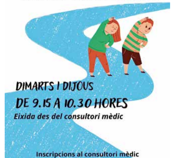
Cartell de "Xeraco Camina".

vincles comunitaris. Les inscripcions per a participar-hi es poden realitzar al consultori mèdic de Xeraco. "És una gran oportunitat per cuidar-nos i