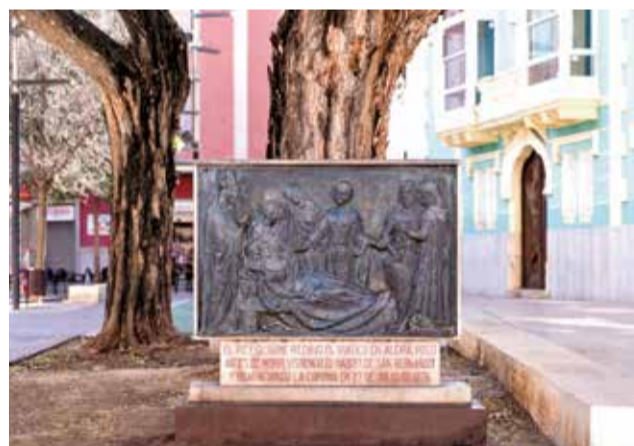
Plaça de la Constitució d'Alzira.

pacífica a la musulmana Al-Jazira, sense vessament de sang, el 30 de desembre de 1242, la vespra de Sant Silvestre. Esta incorporació d'Alzira a l'acabat de crear Regne de València marcà l'inici d'un període de creixement, consolidació institucional i prosperitat que ha deixat una empremta inesborrable en la memòria col·lectiva alzirenya.