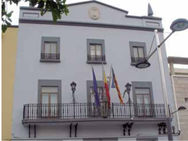
Ajuntament de Piles. / EPDA

S'adequarà la pàgina web per a assegurar que compleix amb els principis de claredat, bona estructura i un accés senzill a la normativa de transparència. A més, es crearà un espai específic dins de la web dedicat a la promoció i aclariment dels tràmits