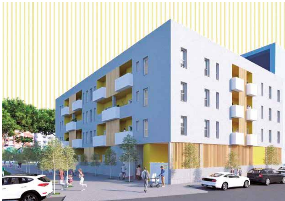
Maqueta de las viviendas de protección oficial de Gandia.

la Comunitat Valenciana impulsado por la Generalitat, cuyo eje estratégico es la movilización del suelo público disponible, autonómico y municipal, para construir 10.000 viviendas de protección pública en esta legislatura. En el caso concreto de Gandia, el solar sobre el que se edificará es titularidad de