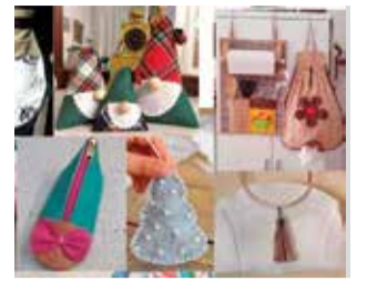
Cartell del taller. / EPDA