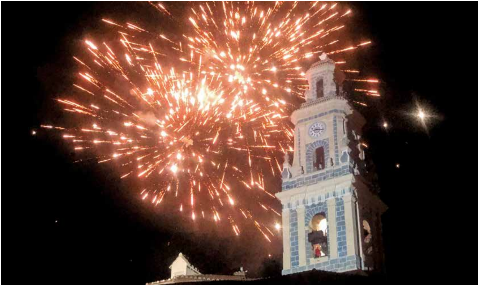
Restauració del campanar de la Col·legiata de Gandia.

■ "ÉS UN SÍMBOL QUE FORMA PART DE LA NOSTRA MEMÒRIA COL·LECTIVA", VA INDICAR L'ALCALDE JOSÉ MANUEL PRIETO