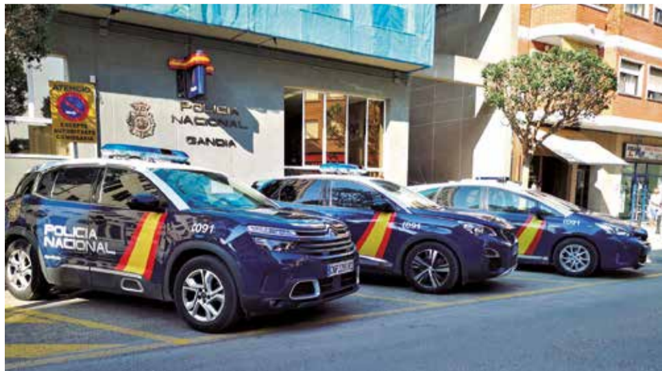
Policia Nacional de Gandia.

L'ara detinguda va denunciar davant la Policia Nacional que buscava un pis de lloguer i després de visitar un, va formalitzar amb el supòsit propietari un contracte d'arrendament del mateix