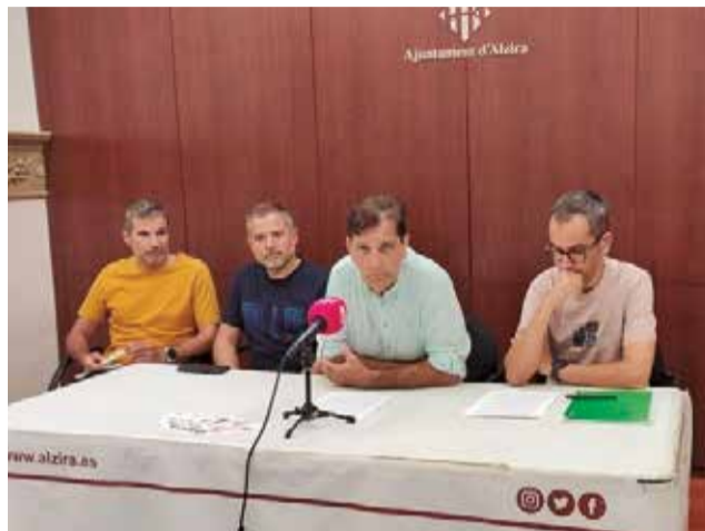
Un moment durant la roda de premsa.

Planificació i preparació davant d'emergències, creació i manteniment d'infraestructures preventives, millora de la capacitat de resposta enfront d'emergències, formació ciutadana en la consciència