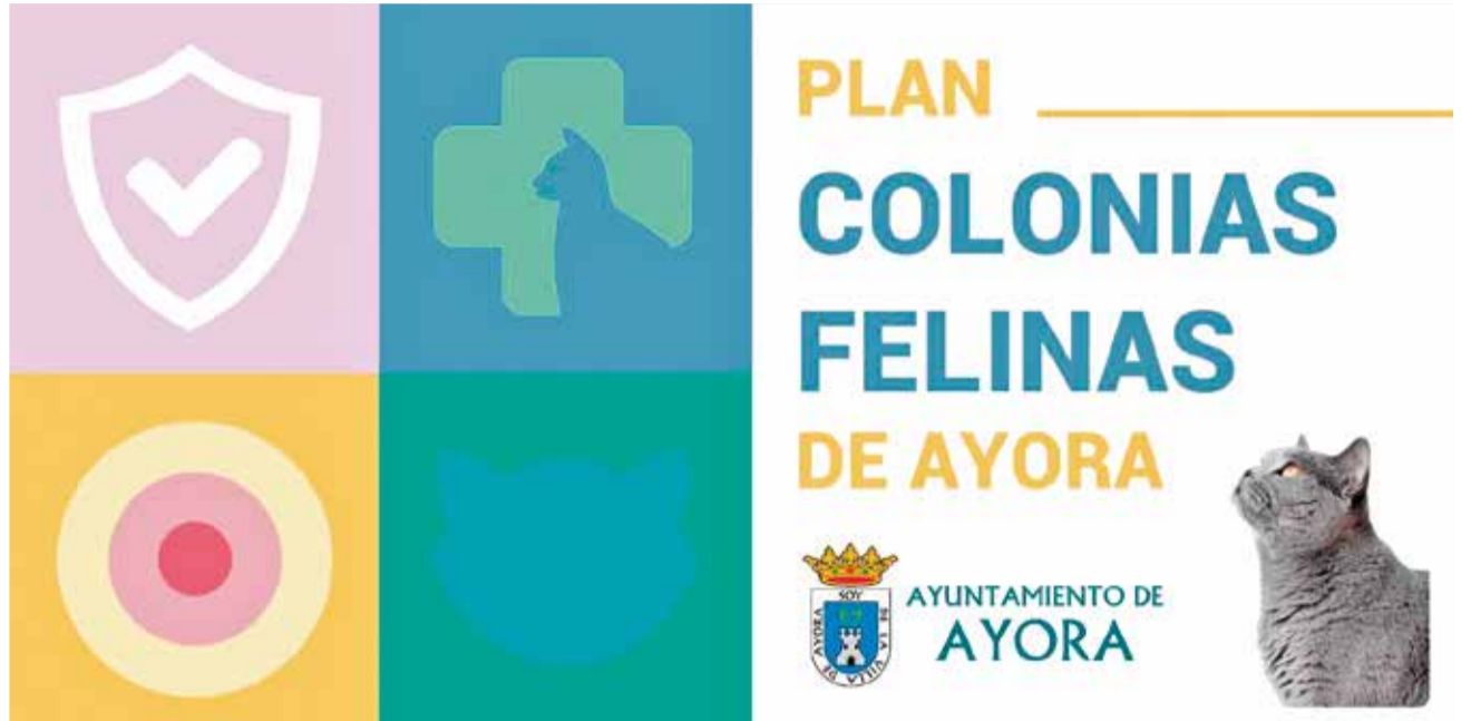
Cartel de la campaña del Plan de Colonias Felinas de Ayora.

Una de las primeras medidas ha sido la colocación de cinco gateras en puntos estratégicos con elevado número de gatos: Ermita del Ángel, Ermita San José, Los Calderones, el Ecoparque y San Benito. Estas casetas servirán como refugio para los