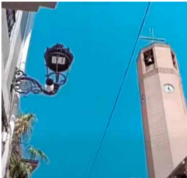
Càmera de seguretat instal·lada a Casinos.