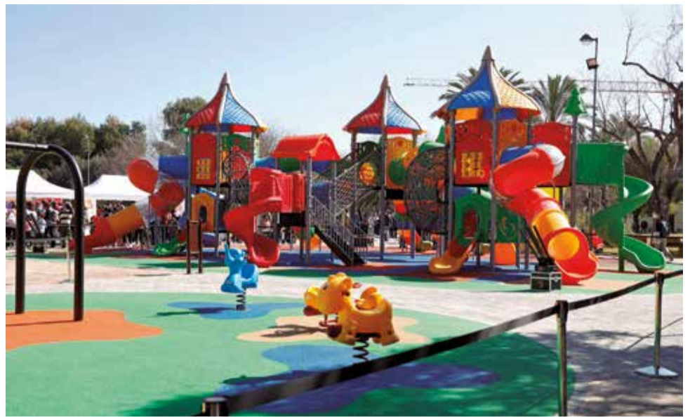
Parque de La Canaleta en Mislata.

El Parque de la Plaza Marina Española de Alzira es uno de los espacios favoritos para los más pequeños. Este rincón, uno de los más frecuentados por las familias de la ciudad, ofrece un entorno muy seguro, colorido y acogedor para que puedan disfrutar de sus jue-