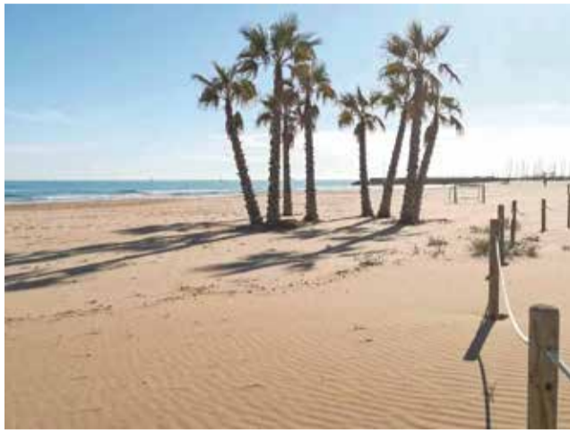
La platja de Canet.

Segons el diputat de Turisme, Pedro Cuesta, "esta línia d'ajudes servix per a compensar l'esforç econòmic que realitzen estos ajuntaments deri-