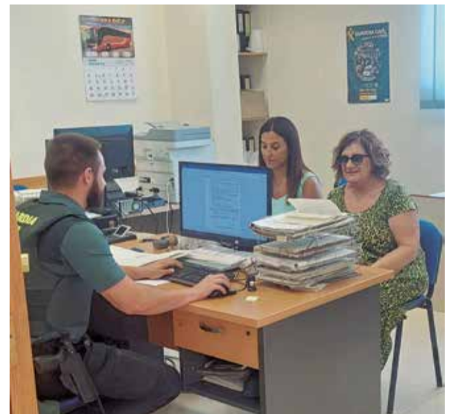
La alcaldesa en la Guardia Civil de Utiel.

La investigación continúa abierta y el Ayuntamiento ha asegurado que irá informando puntualmente de cualquier avance significativo.