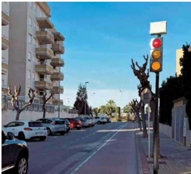
El semàfor 'foto-roig' de Canet.