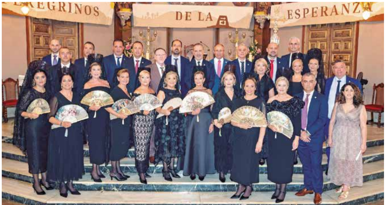
Les Clavariesses de la Verge de l'Assumpció en l'església.

Els esports populars i les activitats infantils han tingut també un pes destacat en la programació, amb curses, tallers, inflables i cavalcades que han fet les delícies de menuts i majors. Així mateix, les entitats culturals i musicals del poble –com l'Orfeó d'Aldaia, la Banda Simfònica i la Unió Musical– han tingut un paper protagonista amb diverses actuacions que han posat el toc emotiu i solemne a les celebracions.