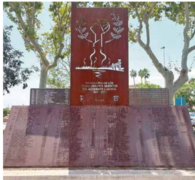
El monument als morts en AHM.

Cal esmentar que, malgrat l'actual diferència de color de les noves plaques incorporades, estes estan fabricades amb el mateix material que la resta de plaques del monument. I després del procés natural d'oxidació quedaran totalment integrades des d'un punt de vista estètic i cromàtic en el monument a les persones mortes a la Fàbrica.