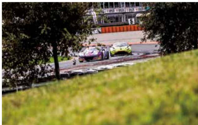
Circuit Ricardo Tormo.

El plan ha sido validado por el recientemente constituido Comité de Sostenibilidad, compuesto por personal del Circuit y especialistas externos, que será responsable de su implementación, seguimiento y evaluación. Este comité elaborará una memoria anual que recogerá los impactos, riesgos y oportunidades