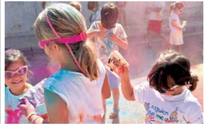
Una activitat de l'Escola d'Estiu de Gilet. / EPDA