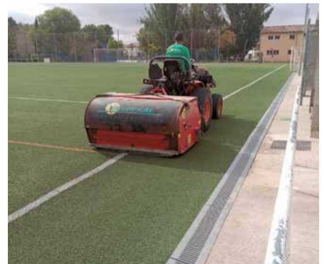
Trabajos en el campo de fútbol municipal.

ción y nivelación de la zona afectada, así como en la reposición del césped dañado, con el objetivo de devolver al campo sus condiciones adecuadas. Con estas actuaciones, la concejalía de deportes reafirma su compromiso con el cuidado y la mejora continua de las instalaciones deportivas municipales, garantizando su buen estado para el uso y disfrute de la ciudadanía.