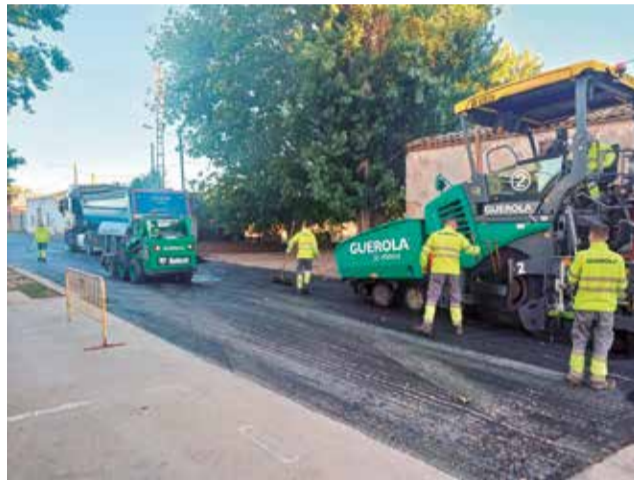
El camino de 'Los Lavaderos'.

cunetas y arceles, poda con pértiga, desbroce manual, formación de cuneta con motoniveladora y limpieza final con minipala y barredora.