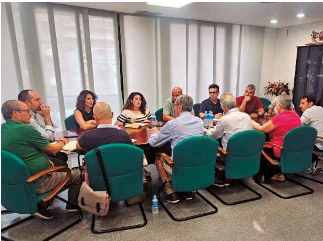
Els alcaldes i alcaldesses en la reunió amb la CHJ.

Ara el full de ruta segueix avant a l'espera que l'òrgan mediambiental de l'Estat referende la proposta, i així, previsiblement al setembre, sotmetre a exposició pública el projecte tècnic i les expropiacions de terrenys. De la mateixa manera, pròximament els tècnics de la Confederació Hidrogràfica del Xúquer i el CEDEX realitzaran reunions informatives presencials amb els veïns i veïnes de les zones afectades per a explicar el projecte, que podria eixir a licitació a la fi de 2025.