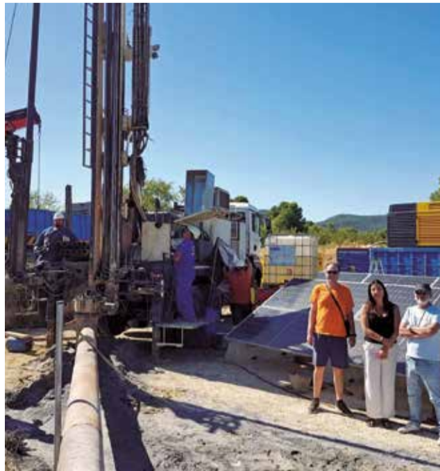
Diferentes instantáneas del nuevo pozo de Caudete de las Fuentes.

Según explicó el equipo técnico encargado del proyecto: "La perforación ya ha llegado a captar material acuífero con cantidad de