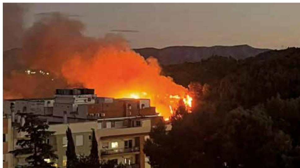
Diferentes instantáneas durante el incendio forestal en Buñol la pasada noche del miércoles 10 de septiembre.

El fuego apareció a última hora de la tarde del miércoles 10 de septiembre, en una zona próxima a viviendas, en el paraje conocido como El Ciprés, donde el viento favoreció que las llamas avanzaran con rapidez, complicando las labores de extinción. Lo tarde que comenzó el fuego hizo que los medios aéreos ha-