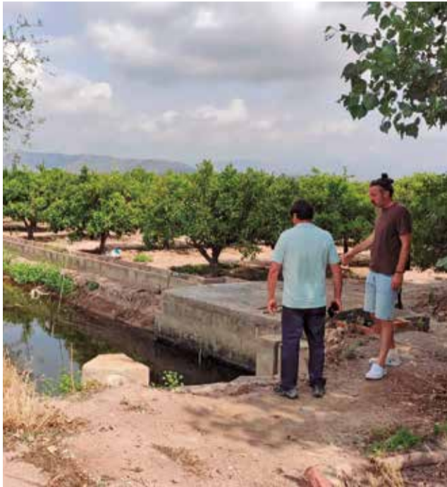
Un tram del camí de l'Assagador de Quartell.

Un dels punts clau serà la recuperació del camí de l'Assagador, fortament afectat per la tempesta del passat