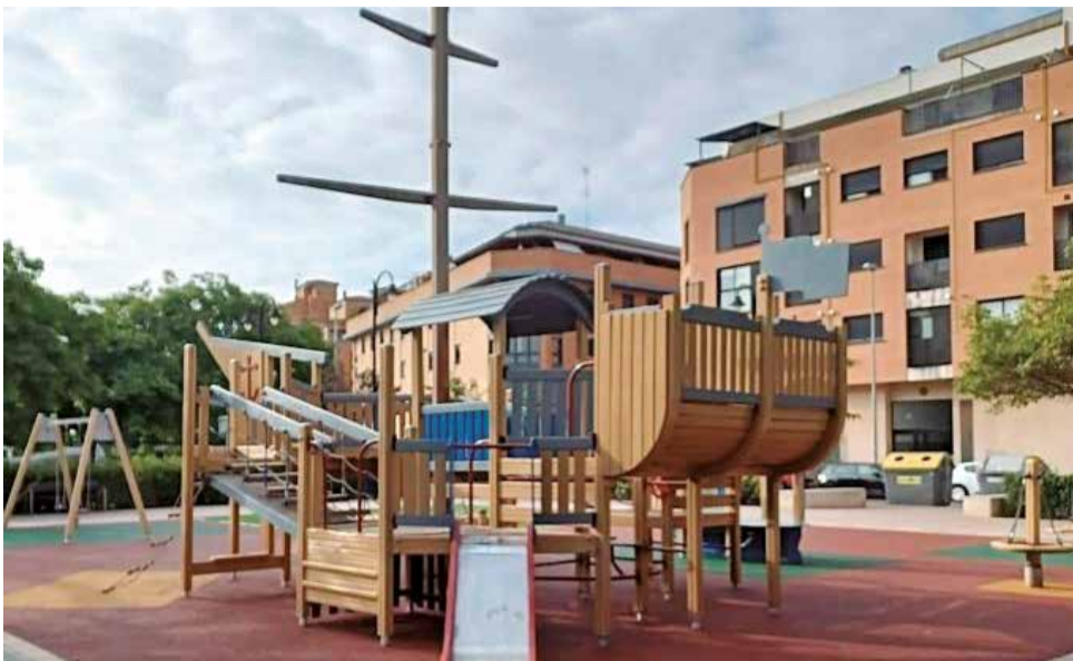
Parque de la Plaza Marina Española de Alzira, con forma de barco.

de la infancia más extenso de la ciudad que se estrenó en 2023, y que supuso un cambio en el paisaje del parque y un nuevo reclamo de ocio para los centenares de familias que pasean por estos espacios a diario. Los juegos ocupan casi 500 metros cuadrados, con capacidad para más de un centenar de niños y niñas, y cuenta con zonas diferenciadas por edades.