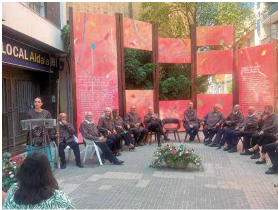
L'acte de constitució ordinària del Tribunal del Comuner del Rollet de Gràcia.

Així mateix, la consellera ha recordat que un altre dels reptes als quals s'enfronta la justícia ordinària és la descongestió dels òrgans judicials i la reducció de la litigiositat, "i ací podem trobar