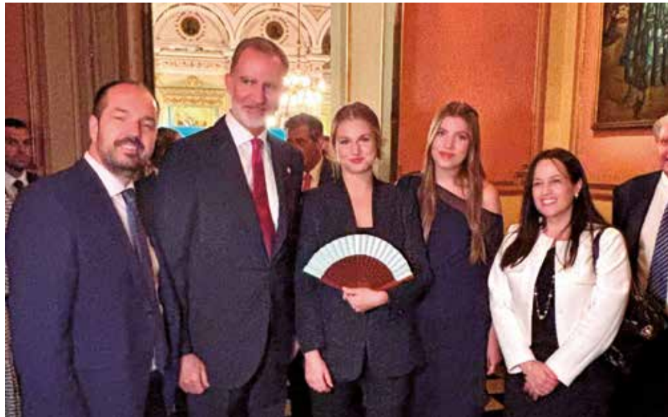
L'alcalde d'Aldaia, Guillermo Luján, entrega el palmito.

Luján va aprofitar eixe instant per a entregar un palmito artesà d'Aldaia a la Princesa Leonor per a "agrair el seu suport i el seu compromís de seguir implicats en la reconstrucció dels nostres municipis", com va explicar.