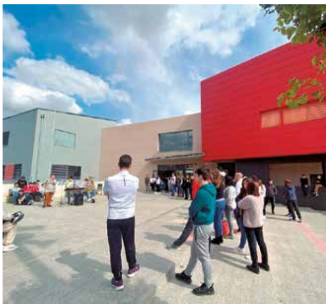
IES Ricardo Marín de Cheste. / EPDA

La cifra de alumnado matriculado por centros es de 170, en el CEIP Vicente Blasco Ibáñez; 170, en el Francisco Giner de los Ríos; 199, en el CEIP Ana Lluch, y 294, en el colegio San José de la Montaña, contando con el alumnado de Secundaria de este centro concertado.