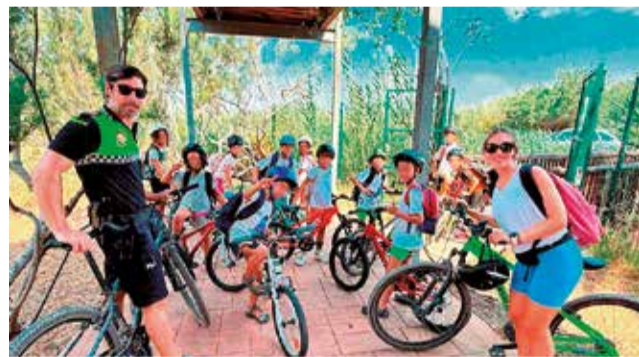
Una de les classes fa unes setmanes.

El projecte es va desenvolupar entre l'octubre de 2024 i el juliol de 2025 i ha inclòs propostes didàctiques adaptades a cada edat, com ara Aprenent sobre rodes per als