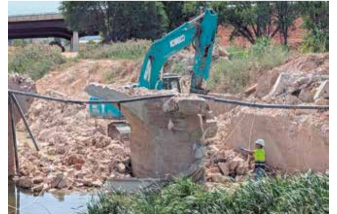
Puente sobre el río Magro en Utiel.

El nuevo tablero de vigas prefabricadas es homogéneo