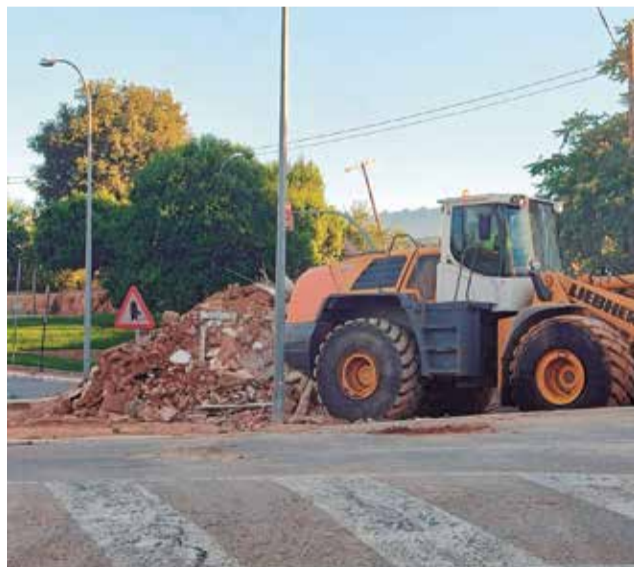
Viviendas derruidas.

Una actuación dirigida a reconstruir y reurbanizar una zona altamente afectada por la DANA que además se convierte en una de las arterias