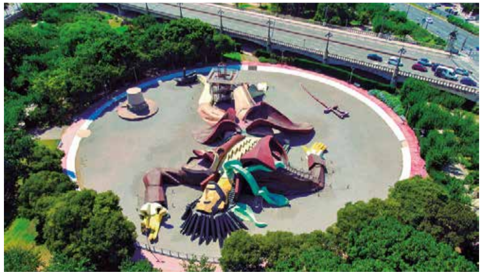
El Parque Gulliver de Valencia se encuentra en el cauce del Río Túria.