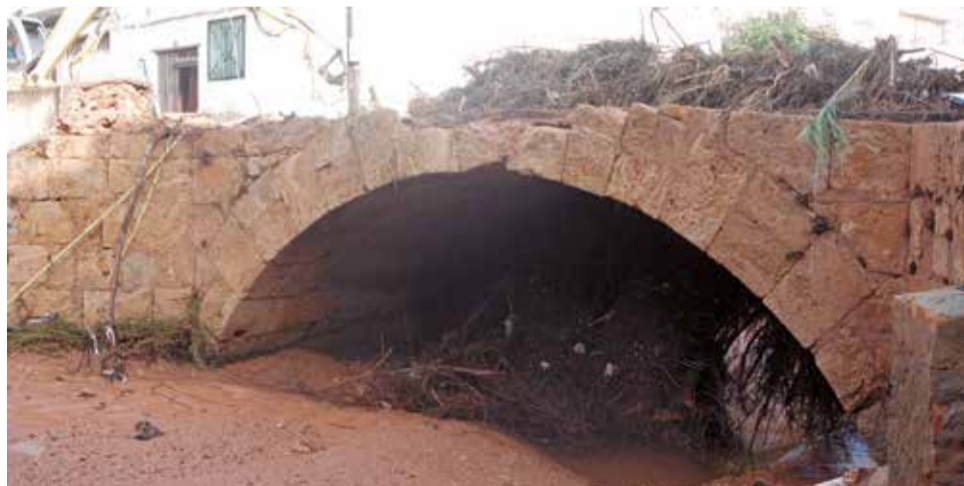
El puente afectado tras la dana de octubre de 2024.

El plan de actuación incluye la retirada de los restos del puente colapsado, la reposición de la conducción de agua potable, la estabilización de los taludes y la construcción de un nuevo estribo con cimentación pilotada. También se prevé la instalación de un tablero de vigas prefabricadas y muros de protección con escollera, todo ello orientado a reforzar la seguridad y garantizar la durabilidad de la infraestructura frente a po-