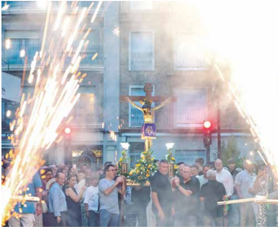
La Pujà del Crist de les Necessitats.

No hi han faltat cites clàssiques del calendari festiu