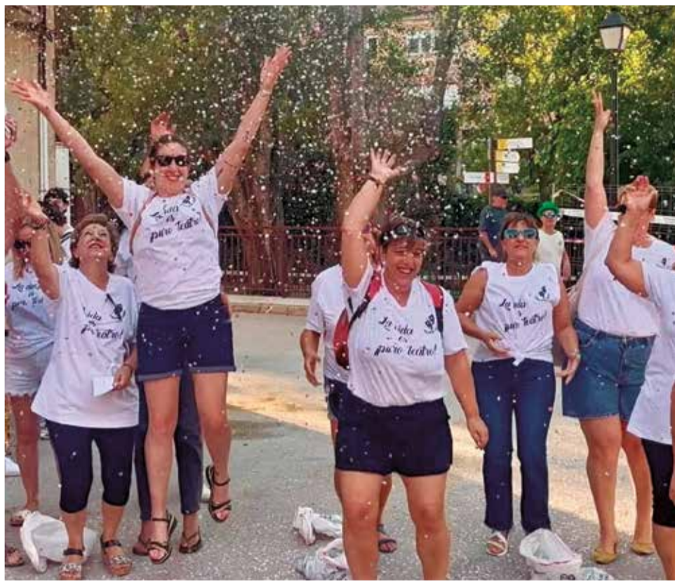
Chera celebra su primera Semana Cultural.

El programa arrancará el jueves 9 de octubre con dos