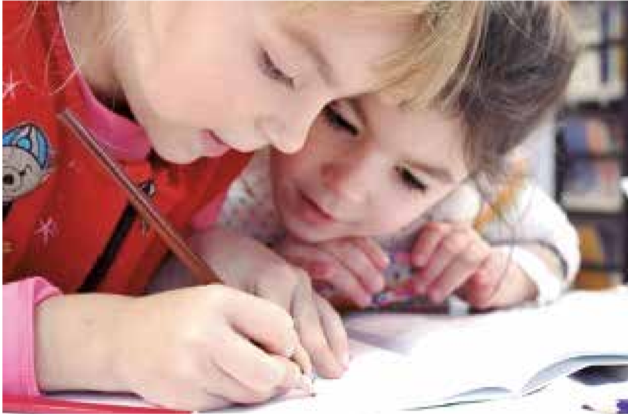
El Ayuntamiento abre cursos oficiales, atención psicológica y un Espacio Joven.

Con el objetivo de ofrecer oportunidades de aprendizaje y de ocio saludable, el Consistorio ha promovido diversas actividades que refuerzan el compromiso con los jóvenes del municipio. Entre las acciones más destacadas, se encuentra la apertura del curso oficial de Monitor de Tiempo Libre, que se desarrollará hasta diciembre en horario de sábados (mañana y tarde) y de forma gratuita para los participantes. Este título oficial cuenta con la supervisión del IVAJ y permitirá a los alumnos adquirir competencias profesio-