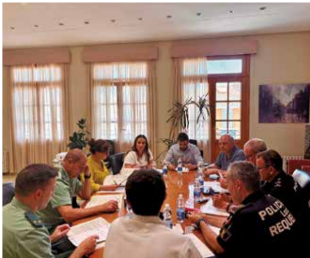
Un momento durante la Junta de Seguridad.

Además, se abordó la planificación de seguridad para la Feria y Fiesta de la Vendimia, uno de los eventos más concurridos del calendario local, donde se intensifican los dispositivos preventivos para asegurar un desarrollo seguro y sin incidencias. El