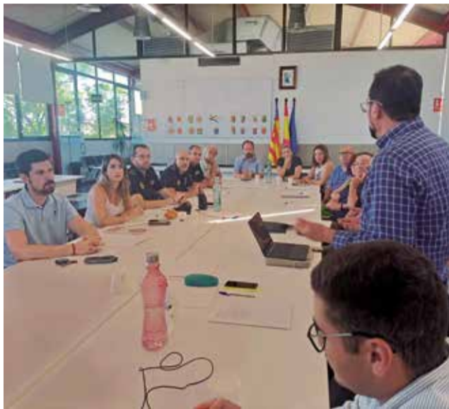
Primera reunió del projecte ALAIRE-Uspace.

Es tracta d'un projecte que busca impulsar el desenvolupament