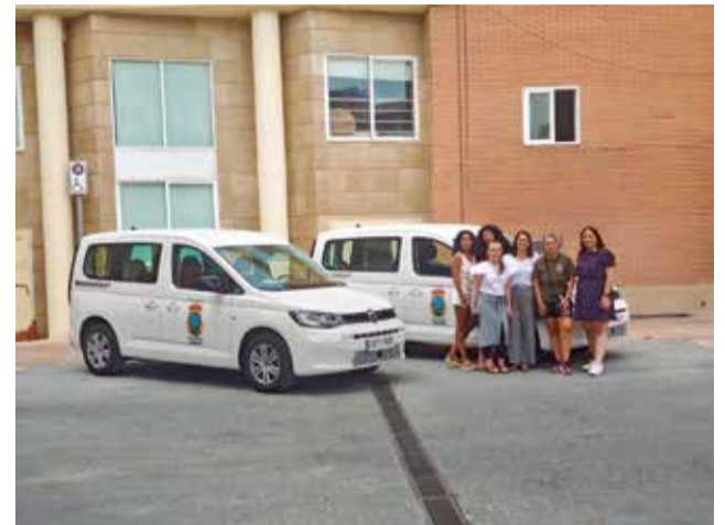
Las nuevas furgonetas del consistorio.

"Queremos que quienes cuidan a los demás lo hagan en las mejores condiciones posibles y que quienes reciben la atención dispongan de un servicio cercano, profesional y de calidad. Mejorar las herramientas de trabajo repercute directamente en el bienestar de las personas usuarias y en la calidad