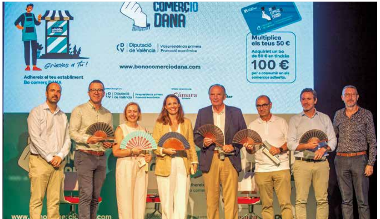
Un momento durante la presentación de los Bonos Comercio.

Las cifras son desoladoras, con 3.000 comercios valencianos que siguen cerrados a consecuencia de la dana, de los cuales una tercera parte está en riesgo de no volver a abrir, según previsiones de la Unió Gremial y Confecomerc. Esto afectaría a miles de puestos de trabajo, según la estimación de Cámara Valencia, que colabora junto a Caixa Popular en la iniciativa financiada por la Diputación. "Un pueblo sin comercio local es un pueblo sin vida. El comercio no es solo economía, también es convivencia; y cuando uno de estos establecimientos ba-