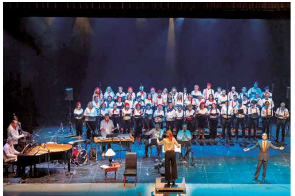
L'actuació de l'Orfeó d'Aldaia.