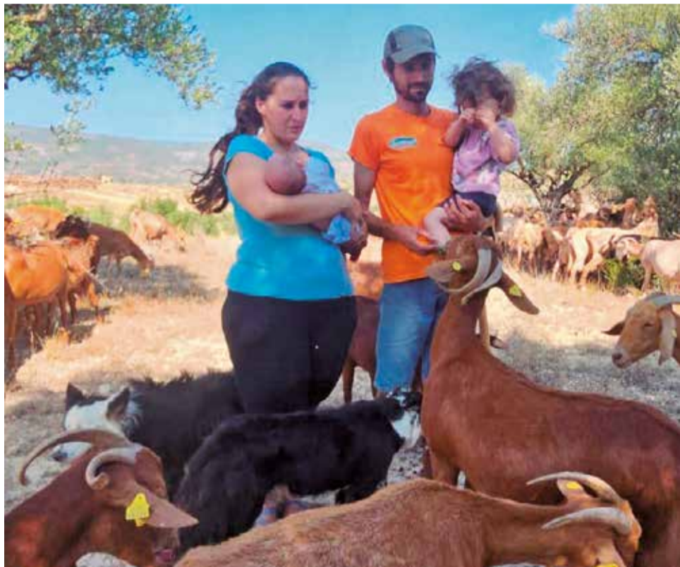
Las dos familias con sus recién nacidos.