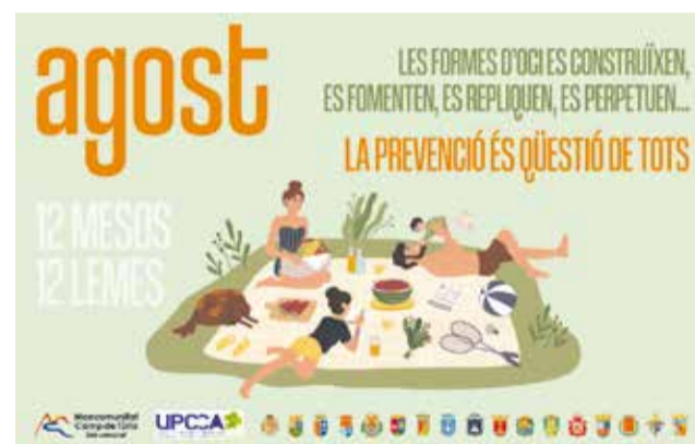
Cartell de la campanya d'agost.

Un oci distint és possible, i és a les nostres mans fomentar-lo.