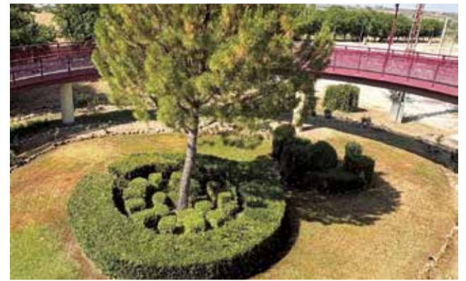
Zonas verdes de Requena.