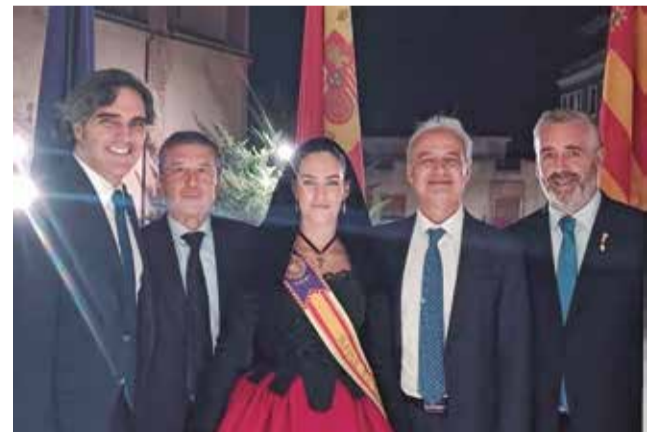
Un momento tras el pregón de Utiel.

El redactor y locutor de Radio MARCA ensalzó cualidades de "utielanía" como la hospitalidad, la nobleza y la tenacidad, hizo referencia a la difícil etapa