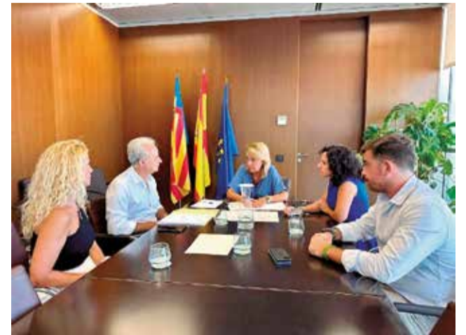
Un momento durante la reunión.

Utiel fue uno de los municipios que sufrió las consecuencias de la dana del pasado 29 de octubre y, en la actualidad, los trabajos de construcción siguen su curso para hacer realidad la