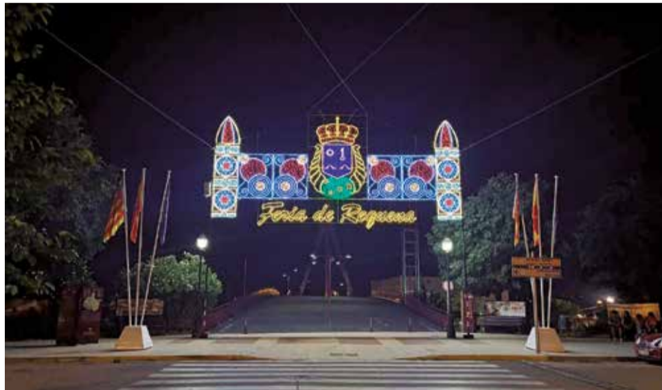
Nueva iluminación de la Feria de Requena.