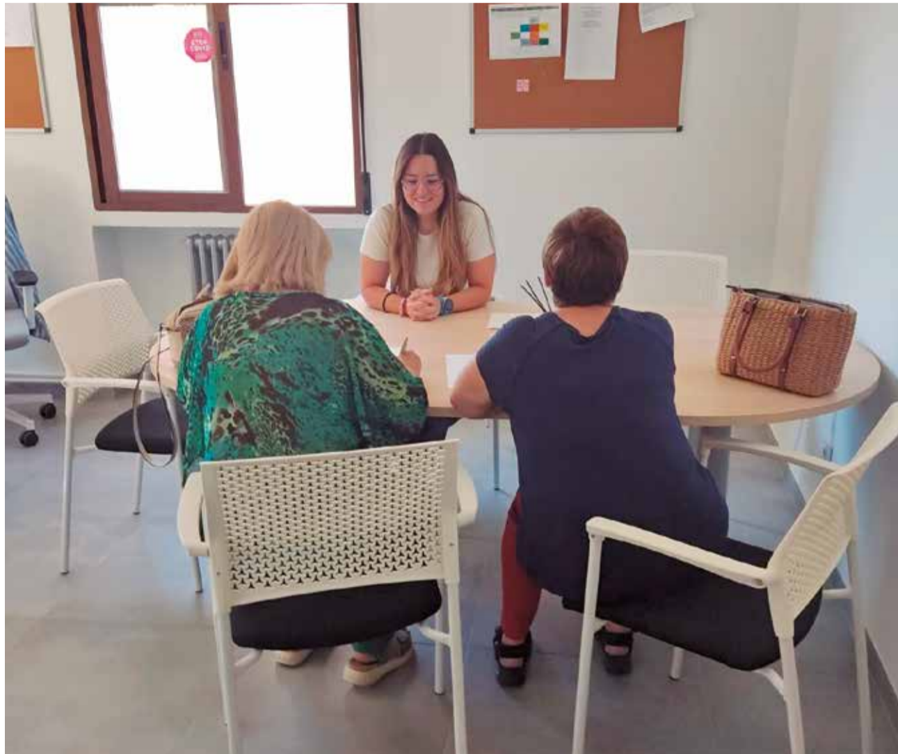
Un momento durante una consulta con la educadora ambiental de la Mancomunidad del Interior.

Solo es la responsable del contenedor gris. Otras entidades se encargan del resto de las fracciones. El Consorcio Valencia Interior es quien recoge y gestiona el contenedor amarillo (fracción envases ligeros), el azul (papel y cartón) y los ecoparques móviles y fijos. El iglú verde, el