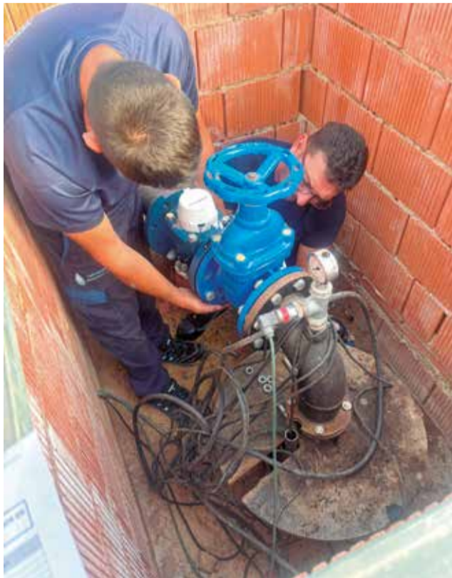
Cambio de contadores.

Según establece la legislación vigente, concretamente el artículo 55.4 del Texto Refundido de la Ley de Aguas (TRLA), todos los titulares de concesiones administrativas de aguas –o quienes tengan derecho a su uso privativo– están obligados a contar con sistemas de medición adecuados. Estos dispositivos deberán cumplir con el control metrológico y los requisitos técnicos que fija el Real Decreto 244/2016 y la Orden ICT/155/2020, garantizando