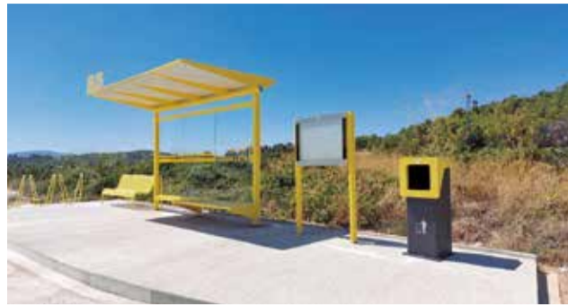
Una de las marquesinas instaladas.

de se podrá tener un acceso rápido a una guía telefónica de interés, tanto de teléfonos de emergencia como de comercios o servicios del término, que se irá actualizando en función de las necesidades."Desde el área