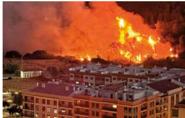
Durante el incendio del pasado 10 de septiembre.