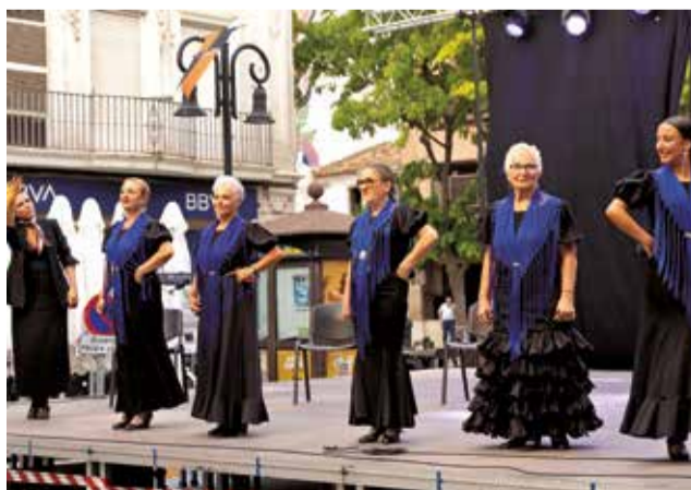
xxx. / EPDA