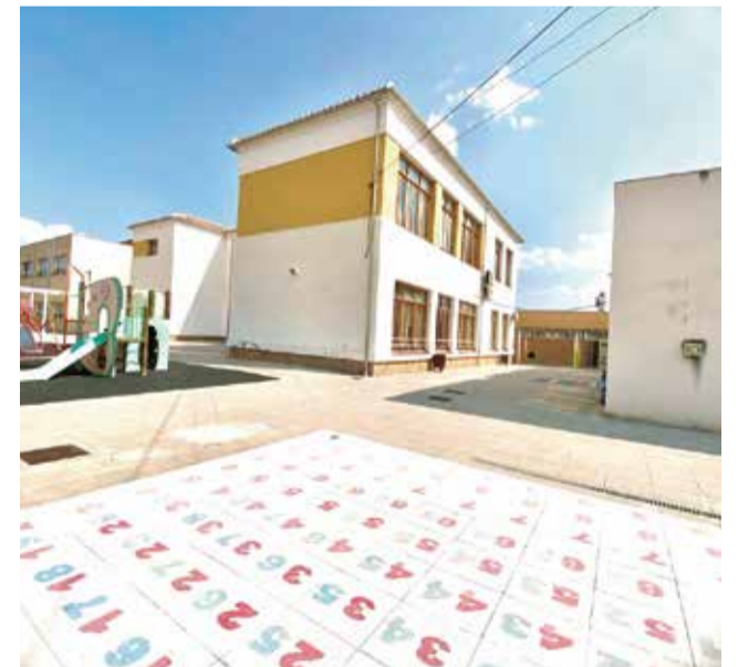
CEIP La Pau de Casinos.

L'ajuntament ha donat a conèixer estes xifres, per a explicar a les famílies que estes ac-