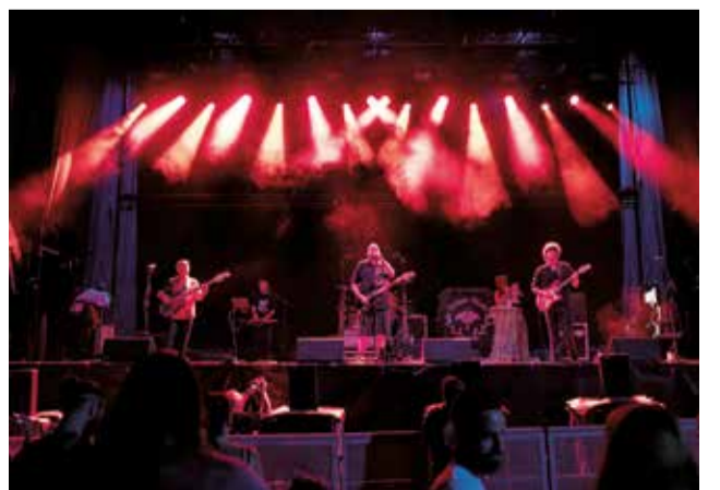
Un grup actua en el Cinturó Jove.