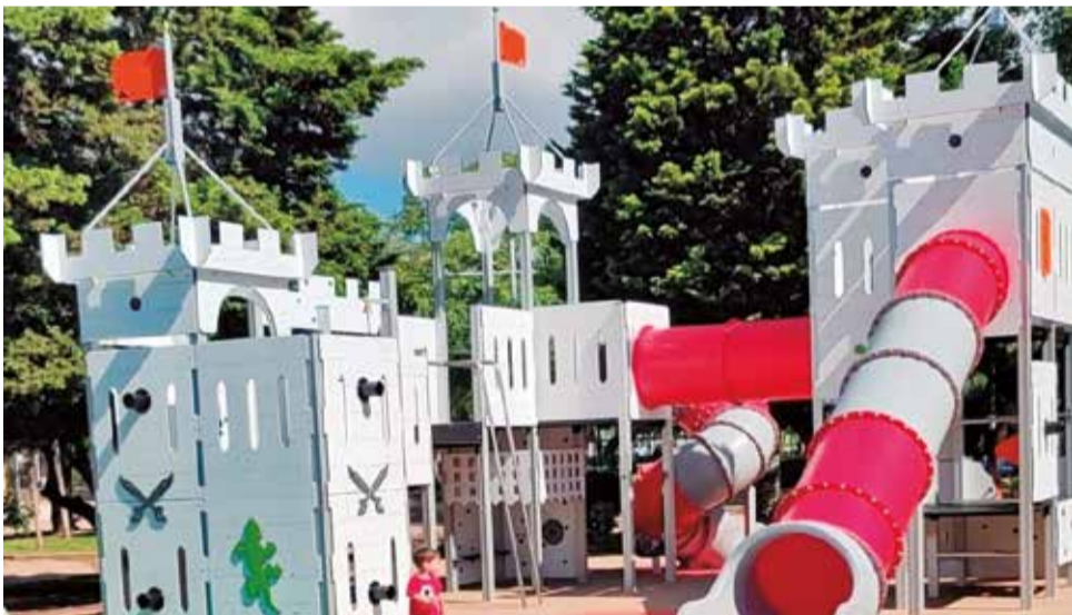
Parque infantil de Canet d'en Berenguer.

derna estructura con tobogán tubular de grandes dimensiones y redes elásticas que convierten este espacio en un parque multifuncional muy atractivo tanto para ambos públicos. Se trata de un concepto diferente de parque que conjuga vertiente lúdica y deportiva y que se integra a la perfección en el recinto del Polideportivo. Además del elemento principal, se proyecta un suelo de caucho de cerca de 400 m 2 en el que se integran otros juegos complementarios destinados a diferentes edades, como columpios y balancines.