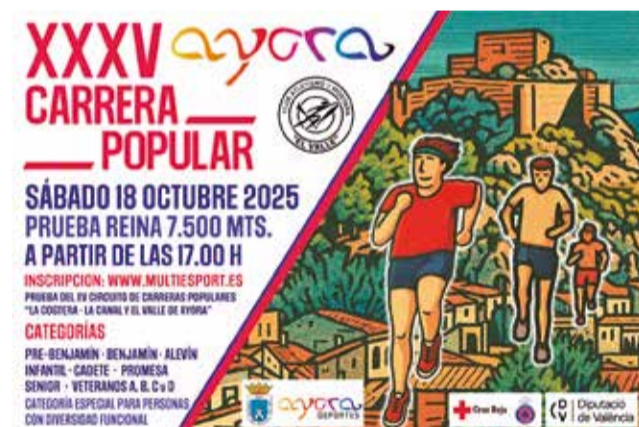
Cartel de la XXXV Carrera Popular de Ayora.

Las inscripciones para la prueba absoluta tienen un coste de 5 euros si se realizan a través de la web multiesport.es hasta el 16 de octubre a las 23:59 horas, mientras que el mismo día de la carrera el precio ascenderá a 6 euros. Para el resto de categorías, la participación será gratuita y podrá formalizarse