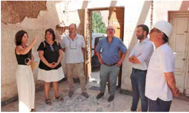
Visita a les obres.