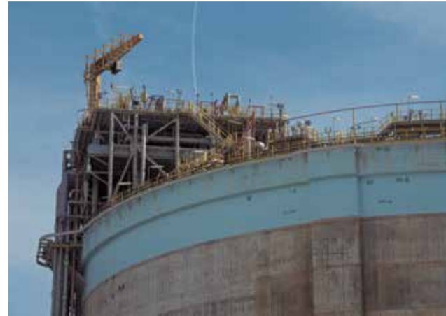
La planta de Saggas.

El biometà, que s'introdueix en altres punts de la xarxa gasista, és identificat a través d'un sistema de traçabilitat reconegut que permet garantir l'origen renovable del bioGNL carregat a Sagunt. Per a fer-ho possible, Saggas ha obtingut la certificació ISCC EU (International Sus-