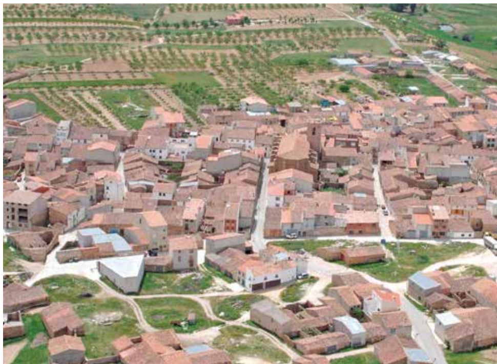
Vista aérea del municipio de La Yesa.

El PP logró en las elecciones de 2023 cuatro de los cinco concejales del Consistorio, pero dos dimisiones durante la legislatura han alterado la composición del pleno. Y es que al ser un municipio pequeño, las actas de concejal se reparten no por la Ley D'Hondt sino por el mé-