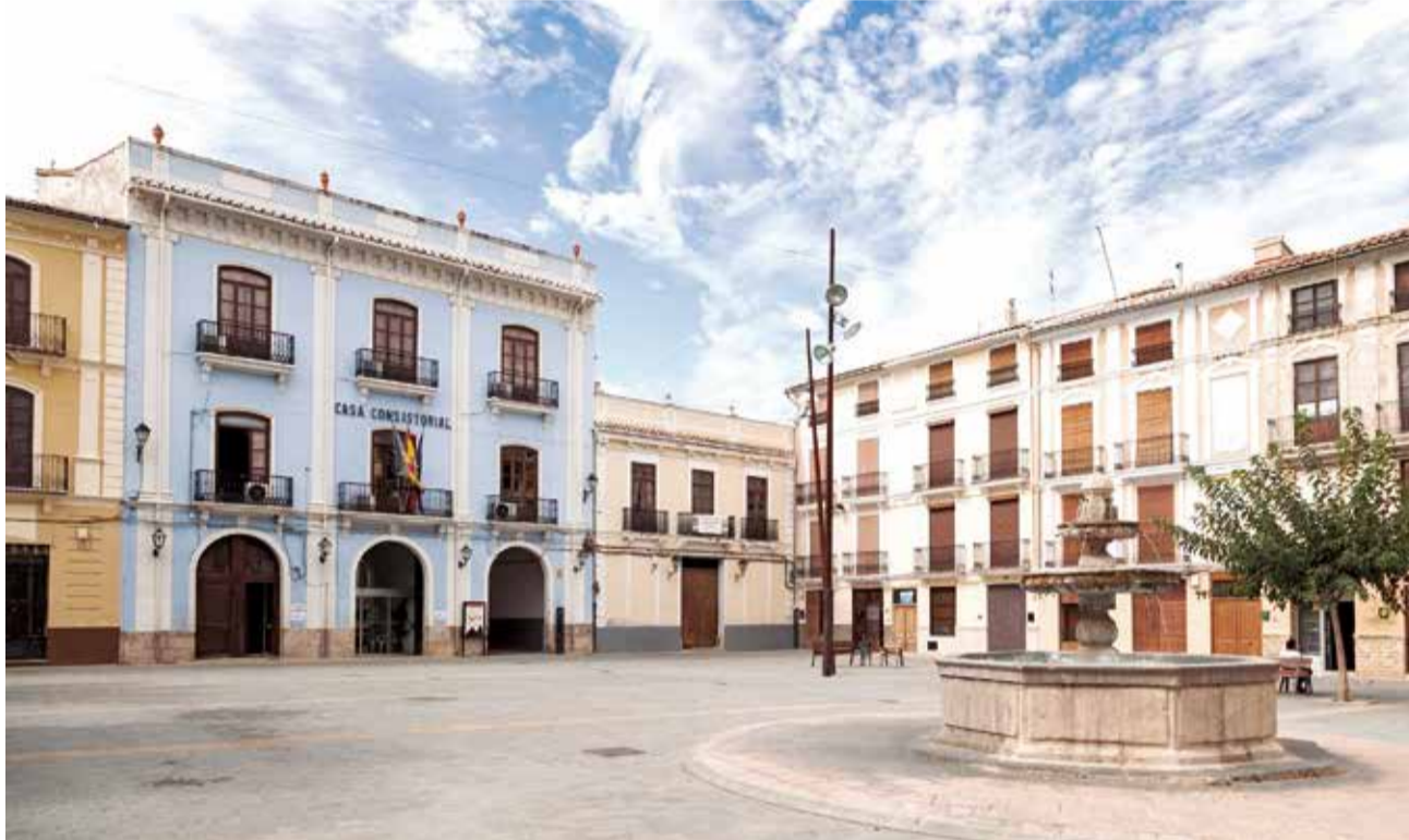
Casa Consistorial de Chelva en la Plaza Mayor del municipio.

El consistorio ha subrayado su compromiso con la transparencia y la colaboración total con las au-