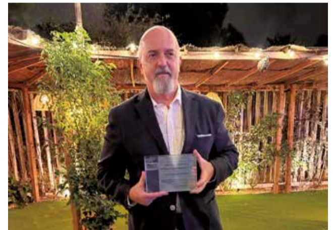
Recogida de la mención honorífica.

Finalmente y como conclusión de estas deliberaciones, el Jurado acuerda de manera unánime que el Plan General de Alpuente es el trabajo de urbanismo merecedor de la Mención Honorífica de la Agrupación de Arquitectos Urbanistas de la Comunidad Valenciana de 2025.