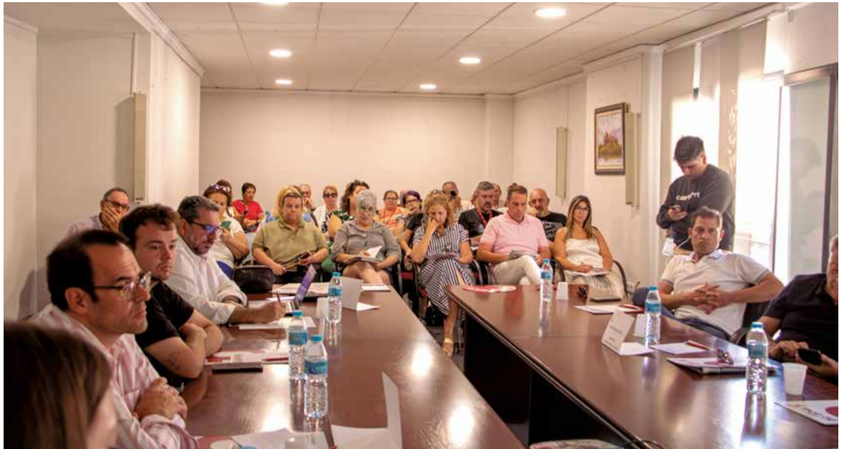
Un instante durante las ponencias de las II Jornadas de Turismo de La Serranía en el salón de plenos del ayuntamiento de Bugarra.

Tras un coffee break ofrecido por el Ayuntamiento, dio comienzo la ronda de ponencias, que contó con una activa participación del público asistentes entre exposicio-