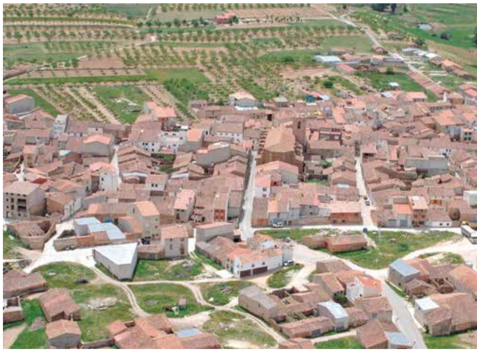
Vista aérea del municipio de La Yesa.

El PP logró en las elecciones de 2023 cuatro de los cinco concejales del Consistorio, pero dos dimisiones durante la legislatura han alterado la composición del pleno. Y es que al ser un municipio pequeño, las actas de concejal se reparten no por la Ley D'Hondt sino por el méto-