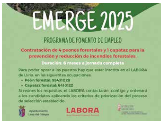
Cartel de la iniciativa.

El programa EMERGE forma parte de las ayudas que la Generalitat destina a las entidades locales de la Comuni-