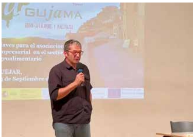
Diferentes intervenciones durante las jornadas en el auditorio de Tuéjar.