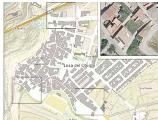
Modificación puntual del PGOU de Losa.

Esta modificación puntual supone un paso importante dentro de la planificación urbanística de Losa del Obispo, ya que permitirá ajustar y ac-