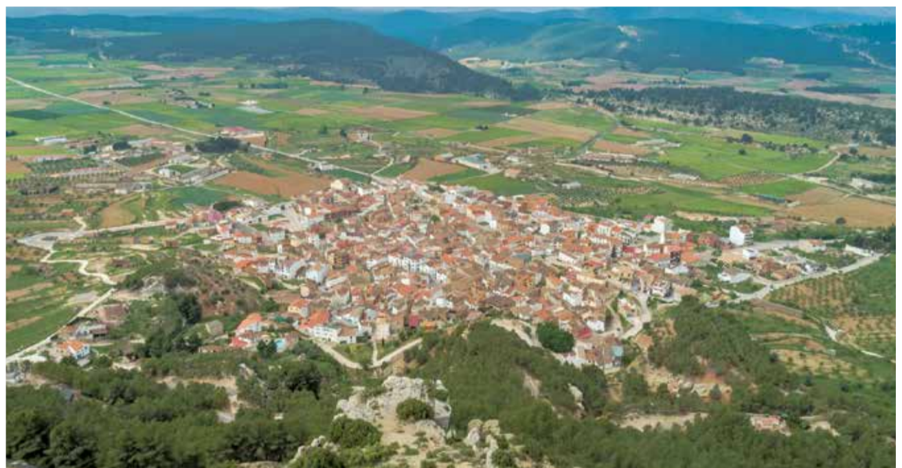
Vista aérea del municipio de Titaguas.

Al finalizar, la charanga La Bombilla pondrá el toque más desenfadado