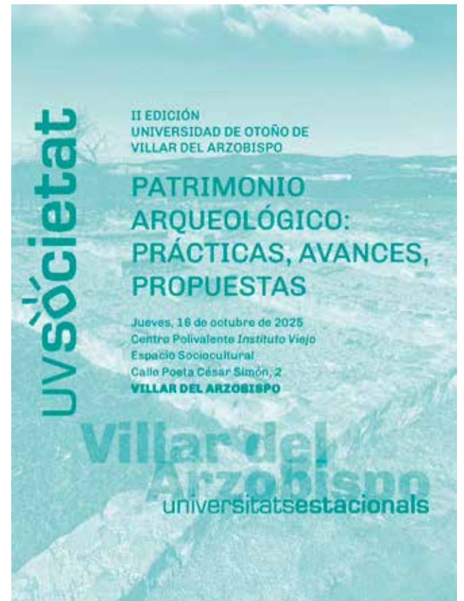
Cartel de la II Universidad Estacional de Villar.

Entre las ponencias destacan la relación entre sociedad y arqueología, el papel de las mujeres en la antigua Pompeya o el legado del investigador Vicente Llatas Burgos en la comarca