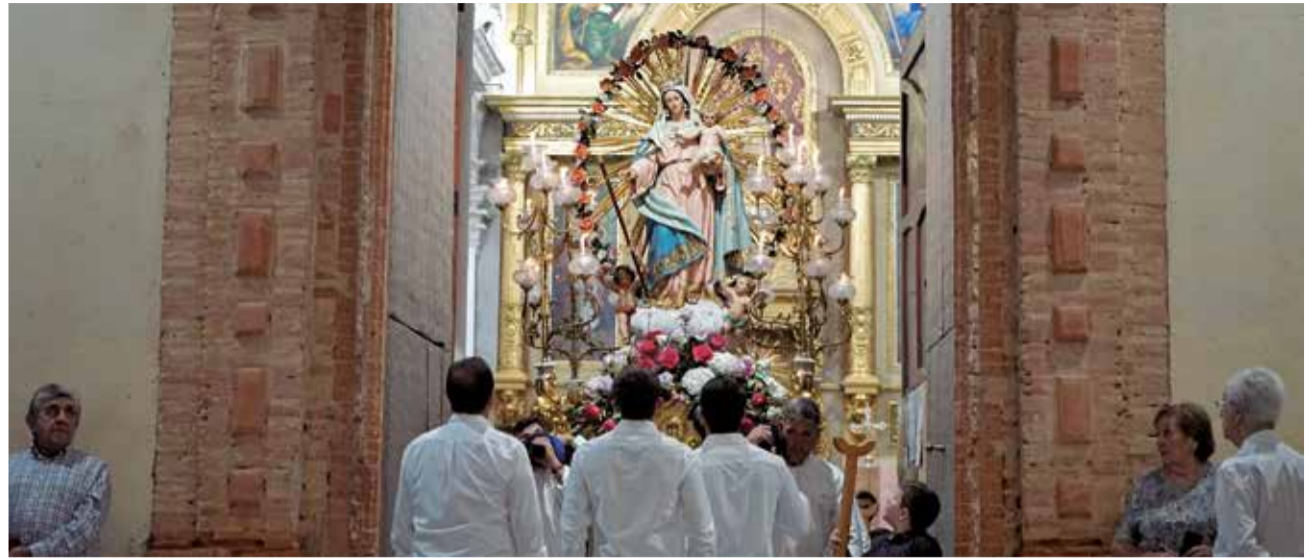
Procesión en honor a la Virgen del Rosario en Bugarra.

Por la tarde, a las 17:00 horas, tendrá lugar la Hora Santa y confesiones, preparando espiritualmente a los fieles para el fin de semana grande.