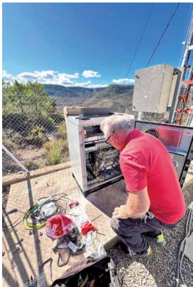
Instalación de la conexión 5G en Casas Bajas.

La actuación forma parte del Programa de Universalización de Infraestructuras Digitales para la Cohesión (UNICO-5G Redes), una iniciativa financiada por la Unión Europea mediante los fondos NextGenerationEU. Este programa tiene como objetivo extender la red 5G a las zonas rurales y menos pobladas, ga-