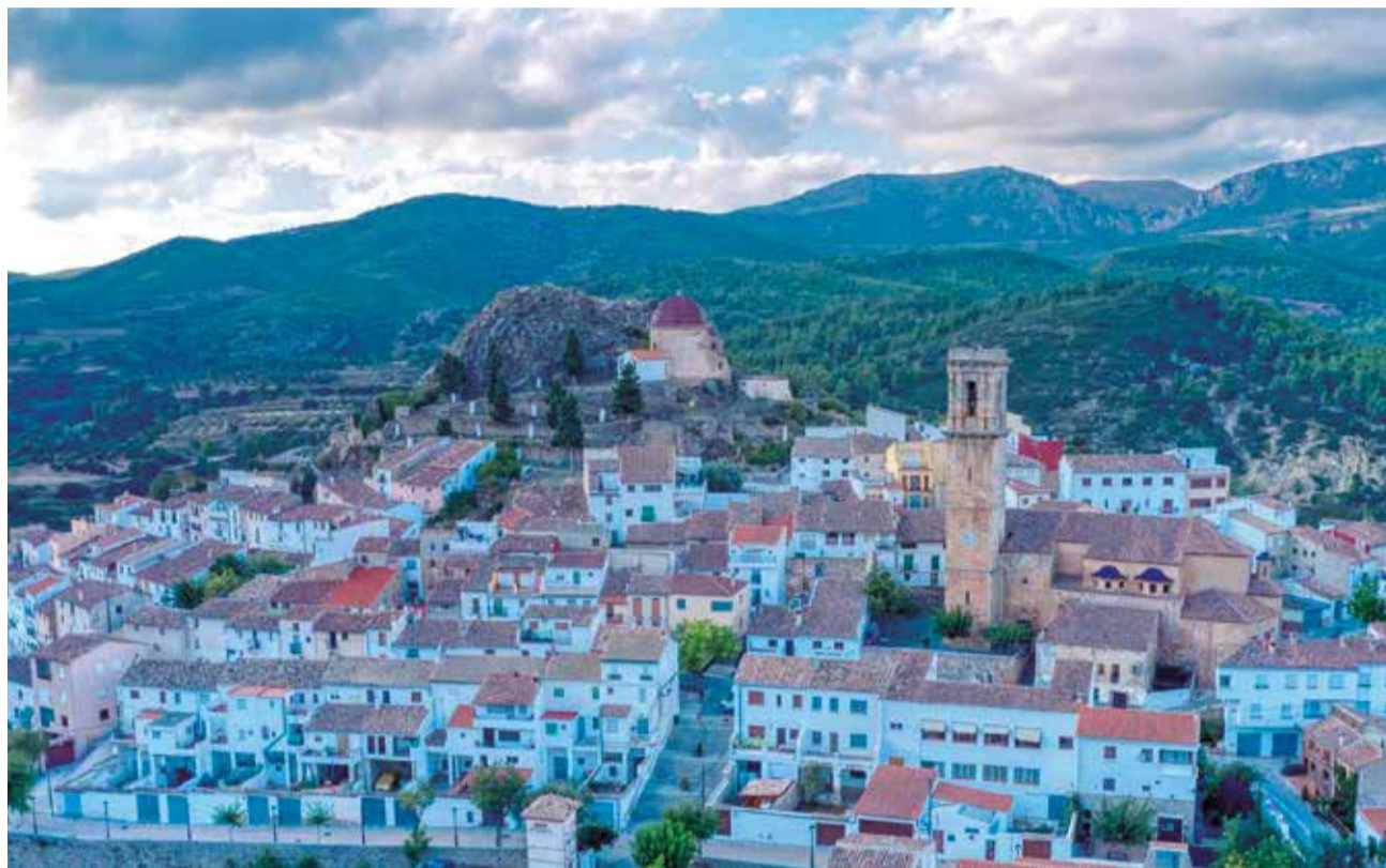
Vista del municipio de Andilla y sus montes.

Las personas seleccionadas realizarán tareas relaciona-