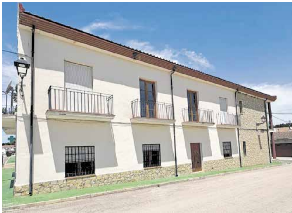
Edificio donde se ubicará el Punto de Atención Diurna para Personas Mayores.

Además de esta infraestructura social, el Ayuntamiento de Benagéber apro-