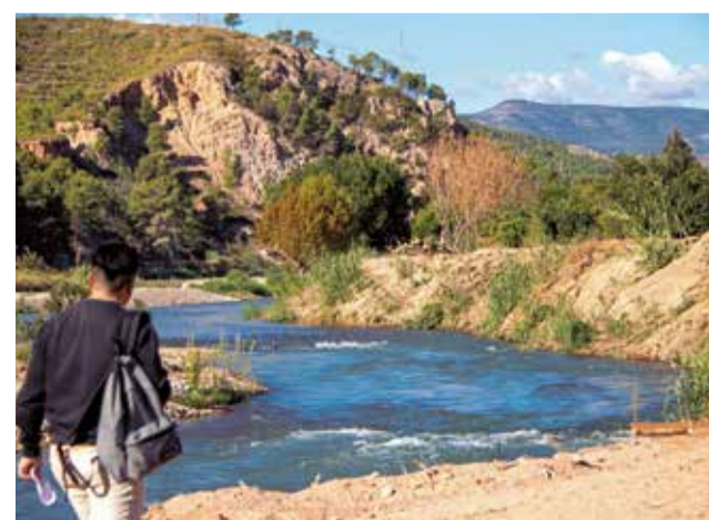
Varios instantes durante la visita guiada a la playa fluvial de Bugarra.