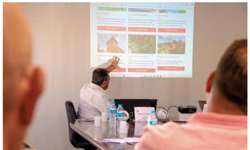
Diferentes instantes durante las II Jornadas de Turismo de La Serranía.