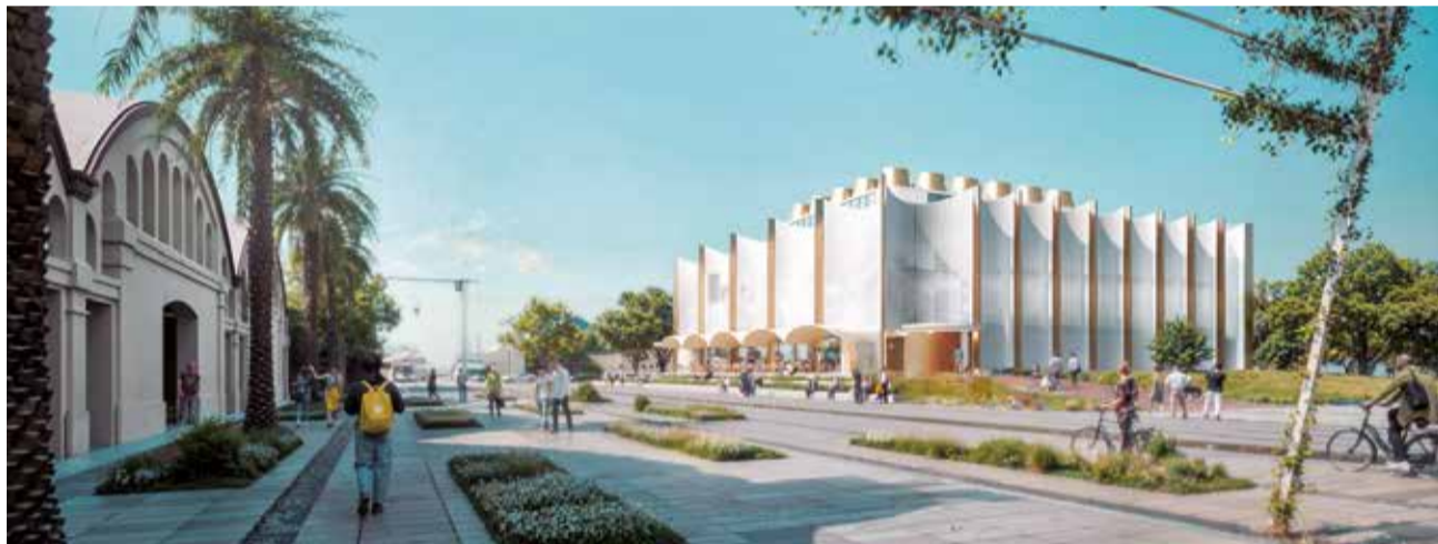
Imatges virtuals de com seria el Centre d'Investigació en Tecnologia per a les Ciències del Mar.

té talent, i fomenta un ecosistema innovador que situarà Gandia com a referent en investigació marina", ha afirmat Prieto.