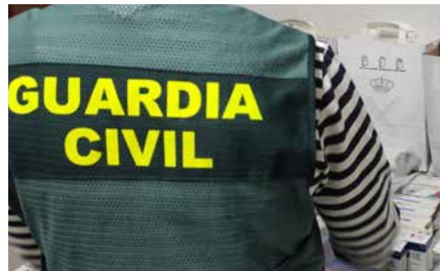
La Guàrdia Civil. / EPDA