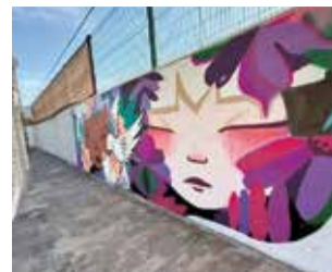
Nou mural.