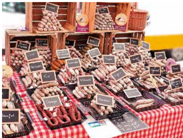
Foto d'arxiu d'un mercat de productes típics.

La fira reunirà food trucks, formatges artesans, cerveses i destil·lats locals, així com productes ecològics i d'alimentació variada. També hi haurà parades dedicades a sabons i cosmètica natural. L'esdeveniment començarà cada dia a les 10.30 hores i busca posar en valor la qualitat i la diversitat del producte valencià.