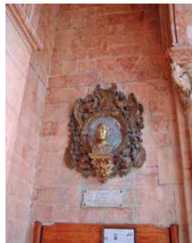
Santuari de Covadonga.

El cas de 1871 resultà significatiu. Gandia celebrava el segon centenari de la canonització del Sant Duc amb molta solemnitat en uns esdeveniments que quedaren escrits per a la posterioritat pel germà del cardenal i notari, Pasqual. La rebuda de la ciutat a Sanz resultà càlida i commovedora. Després de la prèdica l'Ajuntament l'obsequià amb un bàcul de plata en nom de la ciutat realitzat per l'argenter Restituto Raquette, regal pel seu nomenament