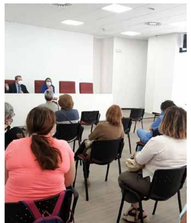
Una reunió de l'empresa EMSPA.

Actualment, EMSPA executa quatre serveis públics essencials: la neteja d'edificis i instal·lacions públiques, el manteniment de les vies públiques i edificis municipals, el servei de conserjeria en el centre municipal de formació de persones adultes i el manteniment de la lampisteria en edificis públics.