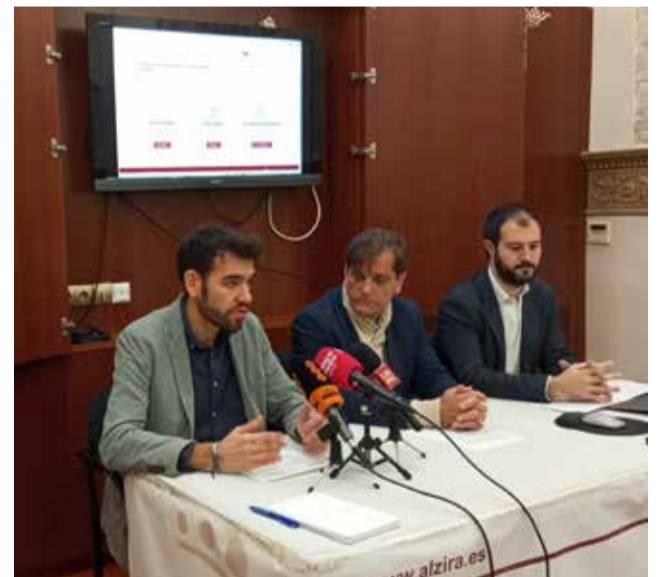
Un moment durant la presentació.

L'apartat Polítiques permet conèixer en què es gasten els recursos i amb quina finalitat i organitzat tant per programes com per subprogrames.