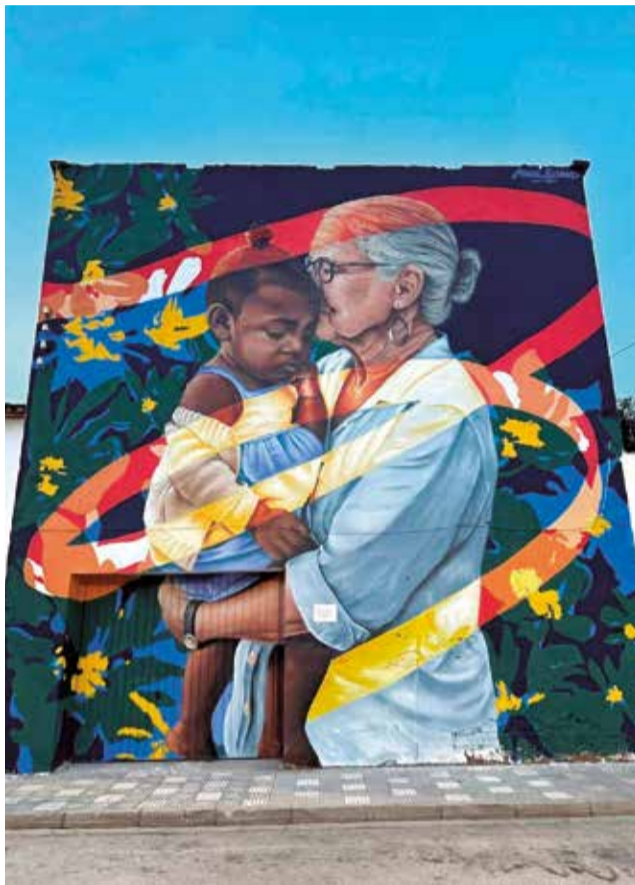
Mural per la Diversitat de Xeraco / EPDA

El Mural per la Diversitat ha tingut com a objectiu principal donar visibilitat a la figura de la dona dins de les dis-