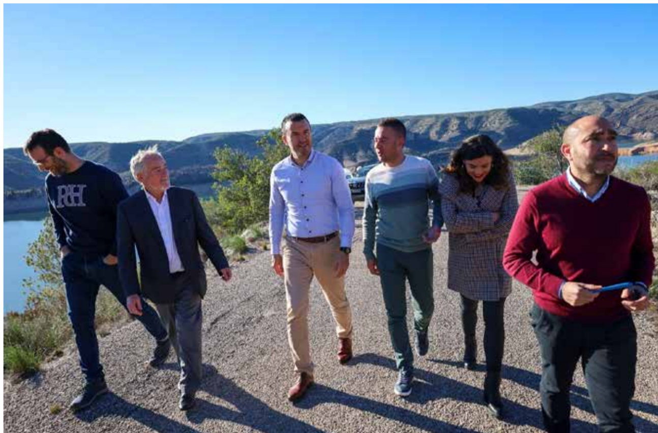
Un momento durante la visita del president de la Diputació, Vicent Mompó.

La Diputación ya ha aprobado diferentes proyectos que el municipio de la Ribera Alta ha presentado para llevar a cabo con esta inversión. Destaca la instalación de cámaras para el control de tráfico en el municipio por un valor de 48.000 euros; la compra de una barredora y de un camión ligero por 100.000 euros; y la instalación de vallas en el polideportivo municipal por 15.000 euros. Además, del