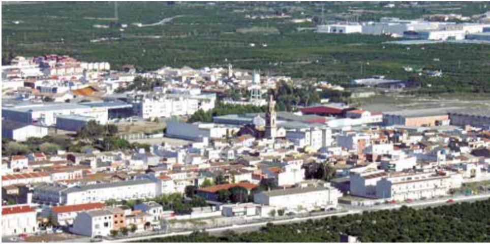
Vista aèria de l'Alqueria de la Comtessa.