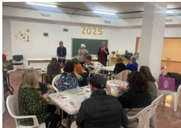
Les diferents accions del 25N a Corbera.