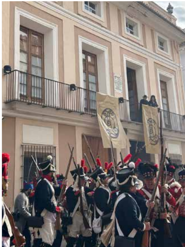
Diferents moments durant la recreació de 'La Marqueseta' de 1813 de Carcaixent.

L'esdeveniment organitzat per la regidoria de Turisme de l'Ajuntament de Carcaixent amb la col·laboració de l'Associació Napoleònica Valenciana i el grup de Catxivatxes, va omplir els carrers de la ciutat d'història, música i ambient d'època durant la jornada. Una desfilada de tropes d'ambdós bàndols va re-