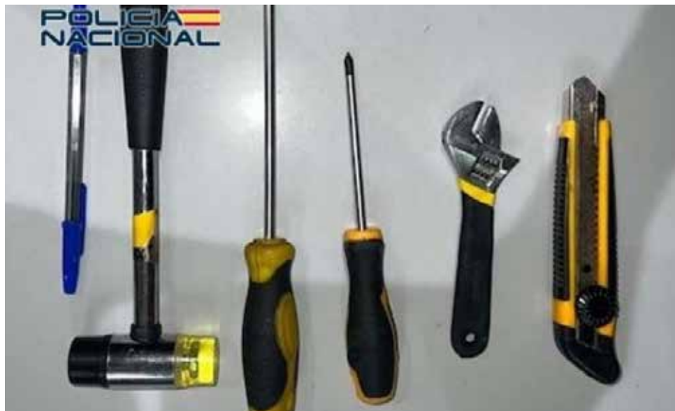
Diverses ferramentes confiscades.

tornavís, un cúter i una clau anglesa. Finalment, i després de les gestions pertinents, els agents van detindre a les tres joves com a presumptes autores d'un delict de robatori amb força. Dos de les detingudes, amb antecedents policials, han passat a disposició judicial, mentre que la menor d'edat va ser entregada a la seua progenitora després de ser sentida en exploració no sense abans ser advertida de l'obligació de compareixer davant l'autoritat judicial quan fora requerida per a això.