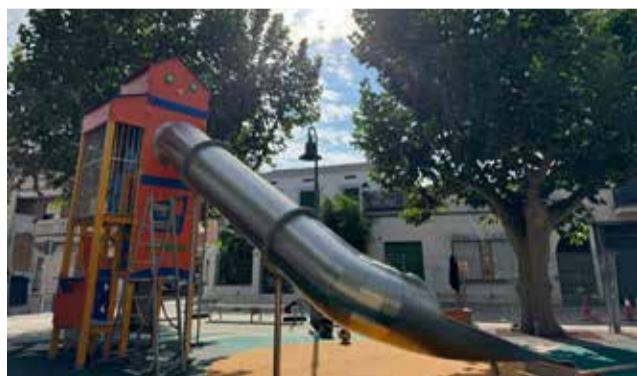
Parc de l'Avinguda Blasco Ibáñez de Carlet.

de Carlet i més de 50.000 € per la Diputació de València. Pròximament, també es renovaran altres dos parcs infantils situats als voltants dels centres educatius d'Infantil i Primària (plaça Joan Fuster i plaça Perfecto García Chornet). En total, les tres actuacions sumen una inversió de 360.000 €.