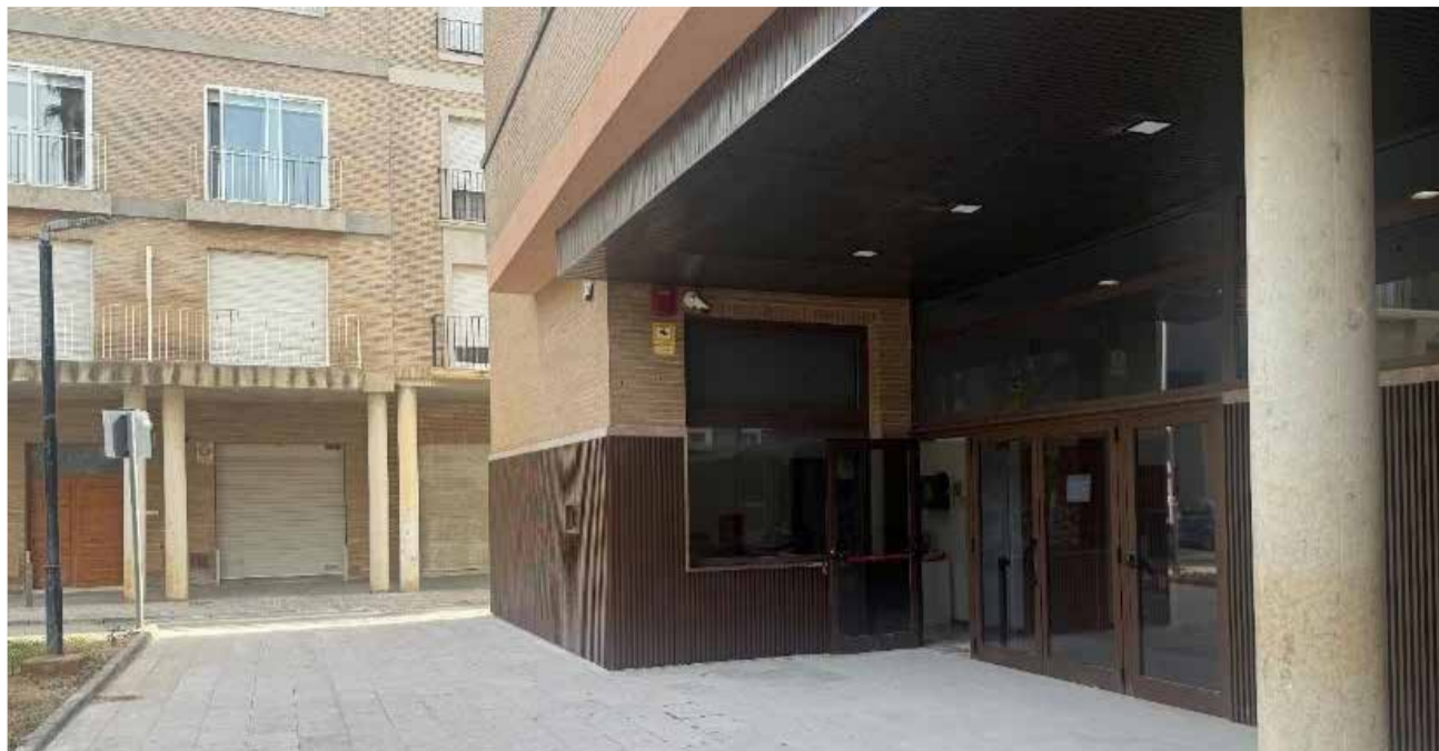
Foto arxiu del Palau de la Justícia de Catarroja.

En una providència de la qual ha informat este dijous el Tribunal Superior de Justícia de la Comunitat Valenciana, la instructora ha ordenat un informe forense que determi-