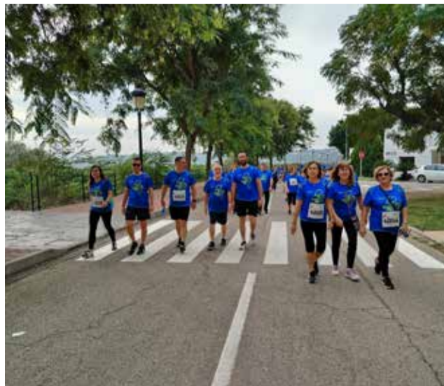
Foto archivo de una Vuelta a Pie en Tous.

Fin de mes cargado de actividades en Tous. Actos que se desarrollarán por campos tan diversos como la promoción del deporte o la solidaridad contra el cáncer. Así, el próximo 30 de noviembre tendrá lugar la vigésima octava edición de la Vuelta a Pie de la localidad, que reunirá, como cada año, a cientos de corredores y corredoras llegados de todos los rincones de la geografía valenciana. La cita se tuvo que anular hace unos meses por la previsión de inclemencias meteorológicas pero ahora seguro que se desarrolla en las mejores condiciones. La