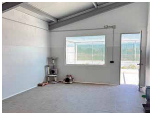
Nou centre d'acollida d'animals.

Este centre és fruit de la col·laboració entre el Consorci de la Ribera, les mancomunitats de la Ribera Alta, la Ribera Baixa i la Safor, i l'Ajuntament de Tavernes de la Valldigna, amb la participació d'un total de 61 localitats de les tres comarques. Les inversions i el funcionament