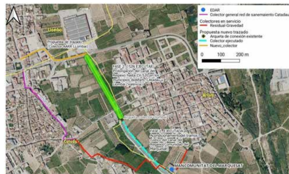
Projecte de desconexió de les aigües de Llobai de la xarxa de Catadau.