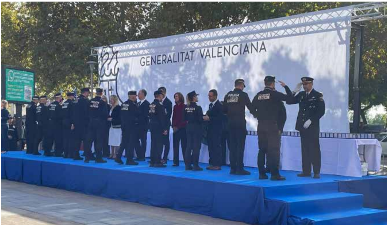
Los policías locales de Alzira reconocidos en la gala celebrada en Xirivella.

sino también su capacidad de respuesta ante situaciones complejas, su vocación de servicio público y su contribución al bienestar de toda la comunidad. Su esfuerzo continuo y su entrega representan un motivo de satisfacción para nuestra ciudad y un referente de excelencia para el resto de compañeros y compañeras. Las felicitaciones y condecoraciones han sido las siguientes: