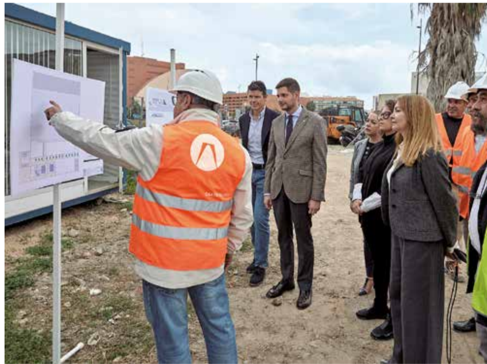
Un moment durant la visita a les obres.