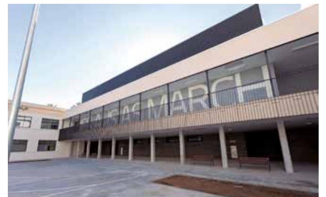
L'Institut Ausiàs March. / AJUNTAMENT DE GANDIA

La primera autoritat municipal ha detallat que durant les vacances de Nadal es procedirà al trasllat de tota la comunitat educativa, ja que s'espera que a final d'aquesta mateixa setmana l'IES Ausiàs March ja dispose del subministrament de llum necessari.