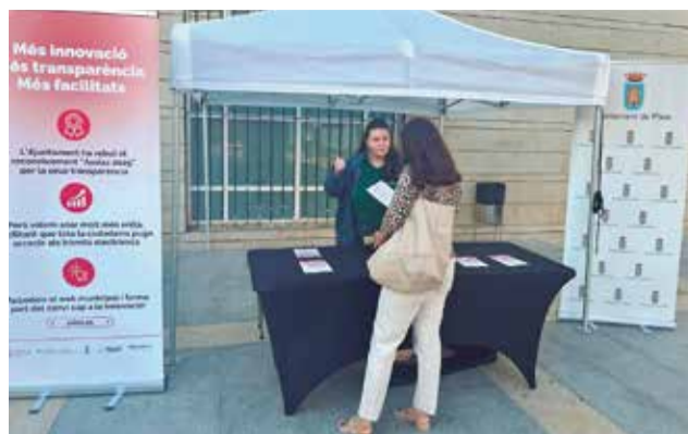
Punt d'informació a Piles.