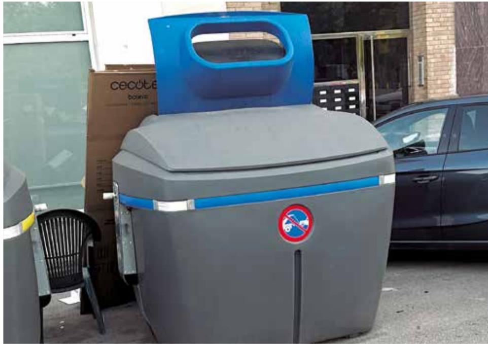
Contenedores abiertos en Oliva.

inédita en ningún otro municipio de España: contenedores con las bocas permanentemente abiertas, dejando escapar los malos olores y dando una sensación de abandono total cuando se supone que se ha pagado más por disponer del fallido sistema de bocas con trampilla que disponen. Y todo ello por culpa de una decisión personal de la alcaldesa, que se fue hasta Galicia a escoger unos contenedores que ni cumplen con el con-