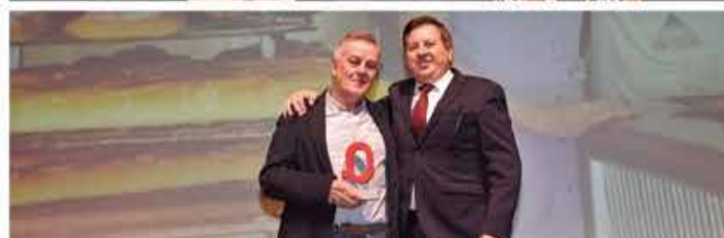
TOTA UNA VIDA: Forn El Fornet de Guadassuar