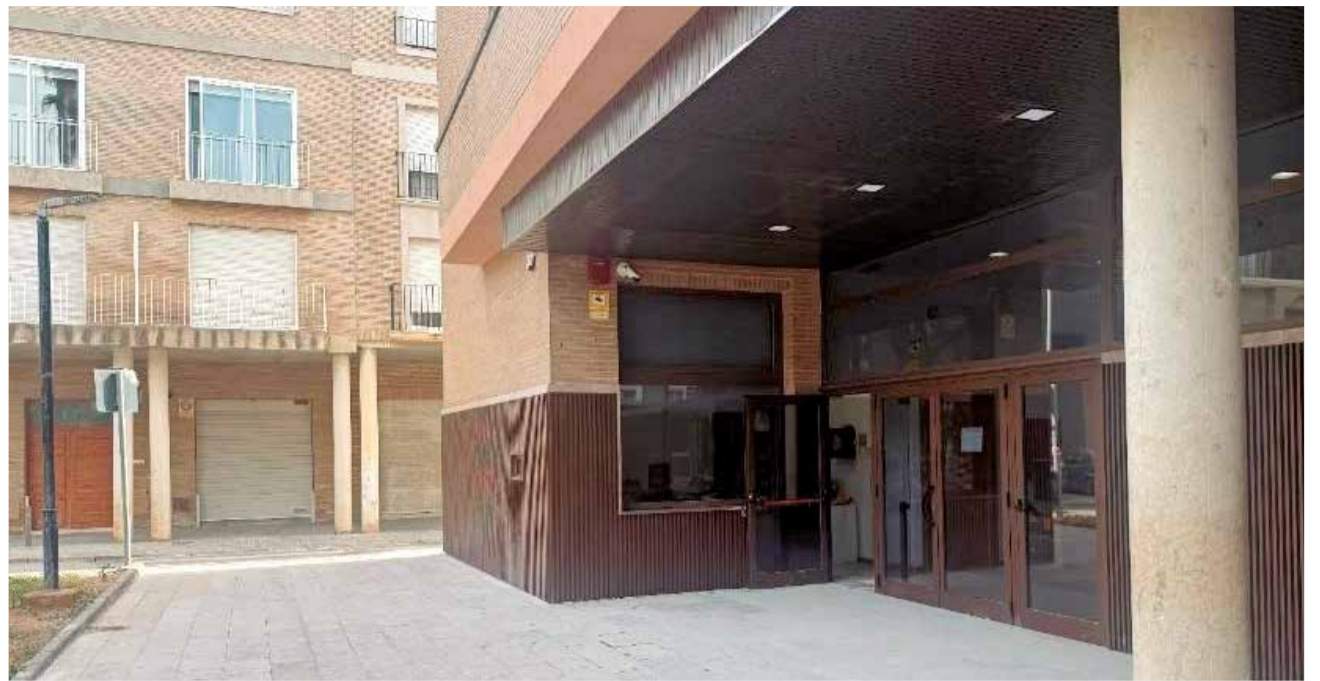
Foto arxiu del Palau de la Justícia de Catarroja.

En una providència de la qual ha informat este dijous el Tribunal Superior de Justícia de la Comunitat Valenciana, la instructora ha ordenat un informe forense que de-