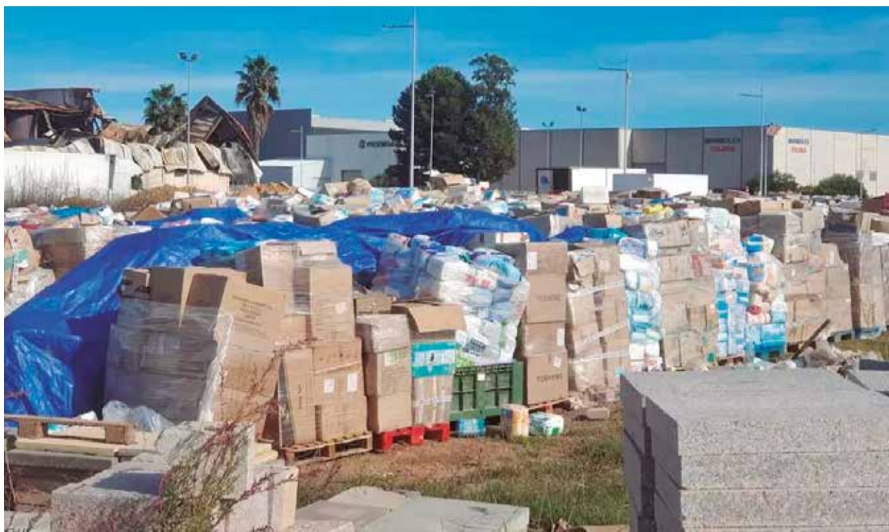
Las toneladas de enseres almacenados en un hangar municipal / PSPV-ALGEMESÍ

Desde los primeros días tras la catástrofe muchos ciudadanos donaron víveres y otros bienes básicos con la convicción de que irían directamente a quienes habían sufrido la catástrofe de la riada, que provocó graves daños en la localidad. Sin embargo, esas donaciones, ya emba-