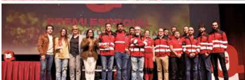
ESPECIAL: Mancomunitat de la Ribera Alta i ACIF