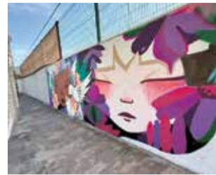
Nou mural.