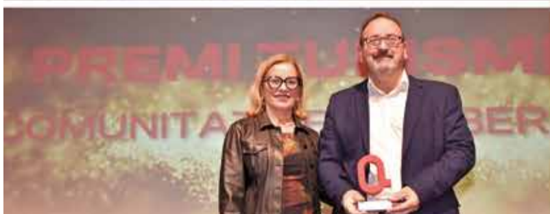
TURISME: Mancomunitat de la Ribera Baixa