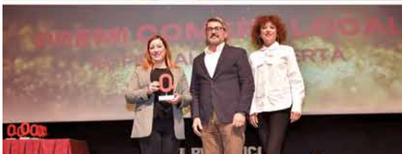
COMERÇ LOCAL: XV Fira Alzira Oberta