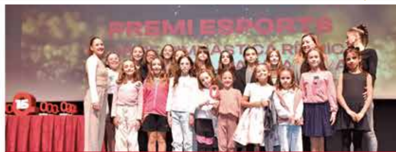
ESPORTS: Club de Gimnàstica Rítmica La Murta Ciutat d'Alzira