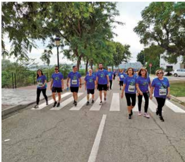
Foto archivo de una Vuelta a Pie en Tous.

Fin de mes cargado de actividades en Tous. Actos que se desarrollarán por campos tan diversos como la promoción del deporte o la solidaridad contra el cáncer. Así, el próximo 30 de noviembre tendrá lugar la vigésimo octava edición de la Vuelta a Pie de la localidad, que reunirá, como cada año, a cientos de corredores y corredoras llegados de todos los rincones de la geografía valenciana. La cita se tuvo que anular hace unos meses por la previsión de inclemencias meteorológicas pero ahora seguro que se desarrolla en las mejores condiciones. La