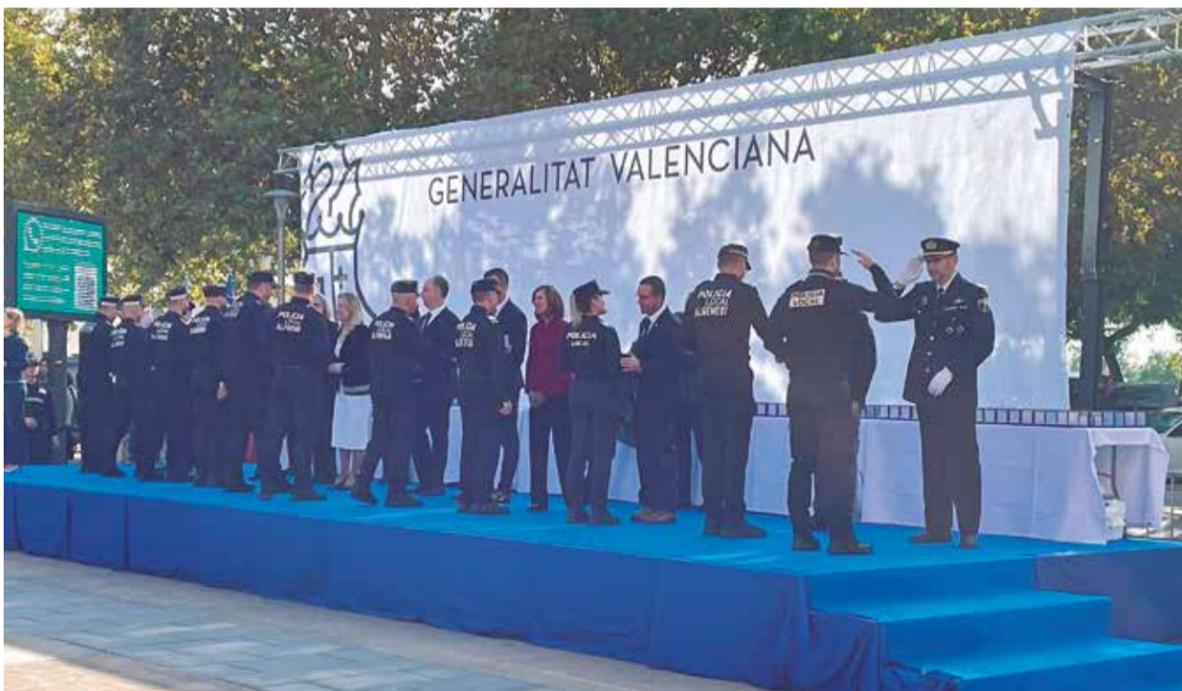
Los policías locales de Alzira reconocidos en la gala celebrada en Xirivella.

sino también su capacidad de respuesta ante situaciones complejas, su vocación de servicio público y su contribución al bienestar de toda la comunidad. Su esfuerzo continuo y su entrega representan un motivo de satisfacción para nuestra ciudad y un referente de excelencia para el resto de compañeros y compañeras. Las felicitaciones y condecoraciones han sido las siguientes: