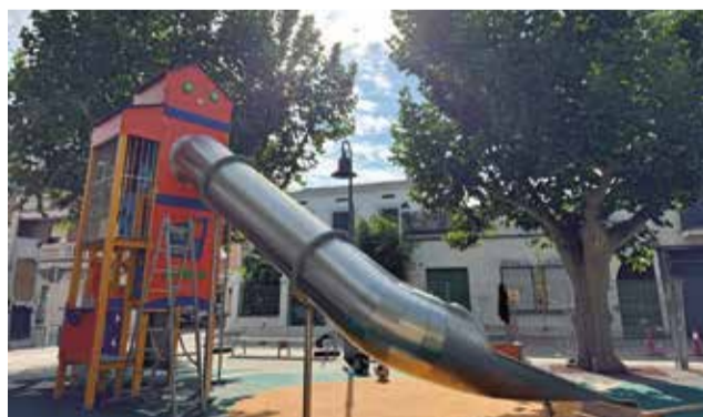
Parc de l'Avinguda Blasco Ibáñez de Carlet.

de Carlet i més de 50.000 € per la Diputació de València. Pròximament, també es renovaran altres dos parcs infantils situats als voltants dels centres educatius d'Infantil i Primària (plaça Joan Fuster i plaça Perfecto García Chornet). En total, les tres actuacions sumen una inversió de 360.000 €.