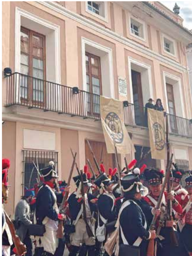
Diferents moments durant la recreació de 'La Marqueseta' de 1813 de Carcaixent.

L'esdeveniment organitzat per la regidoria de Turisme de l'Ajuntament de Carcaixent amb la col·laboració de l'Associació Napoleònica Valenciana i el grup de Catxivatxes, va omplir els carrers de la ciutat d'història, música i ambient d'època durant la jornada. Una desfilada de tropes d'ambdós bàndols va