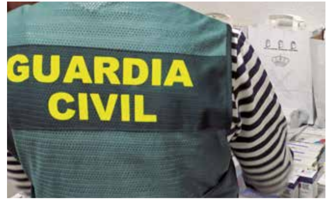
La Guàrdia Civil.