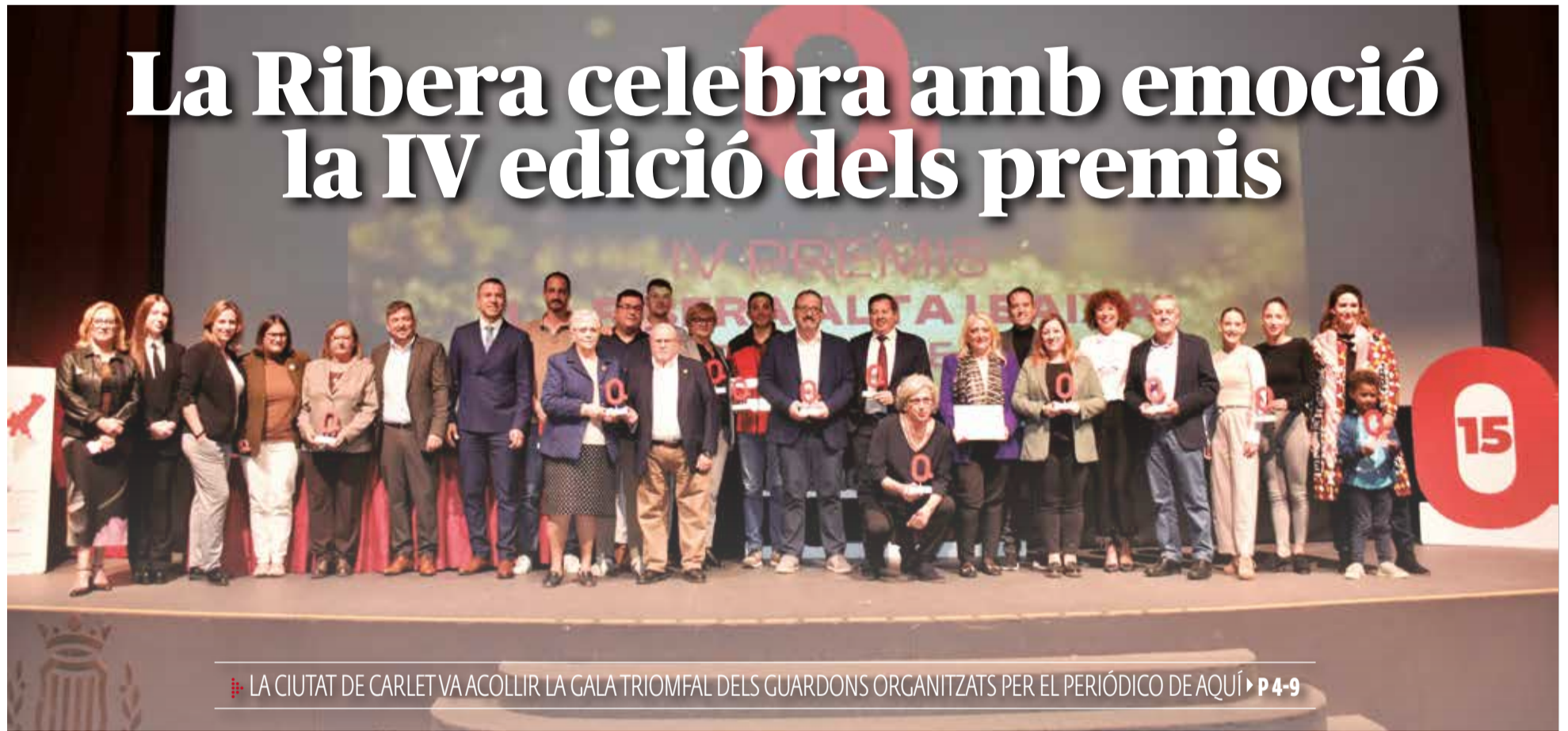
LA CIUTAT DE CARLET VA ACOLLIR LA GALA TRIOMFAL DELS GUARDONS ORGANITZATS PER EL PERIÓDICO DE AQUÍ ▶ P4-9