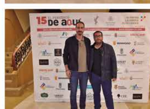
Instantànies del photocall amb els diferents premiats i premiades en la gala de Carlet.