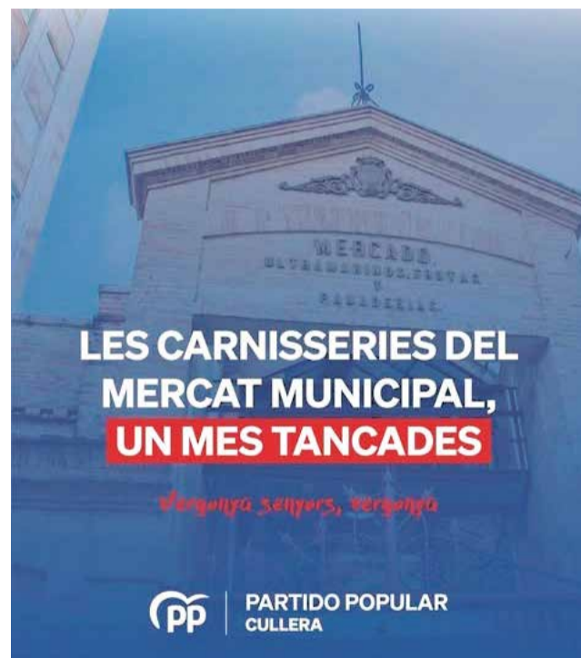
Cartel publicado por la formación popular.

Desde el PP lamentan que, “mientras los vecinos sufren las consecuencias de una mala gestión, el alcalde esté más pendiente del teléfono móvil y de las redes sociales que de resolver los