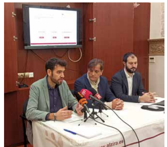
Un moment durant la presentació.

L'apartat Polítiques permet conèixer en què es gasten els recursos i amb quina finalitat i organitzat tant per programes com per subprogrames.