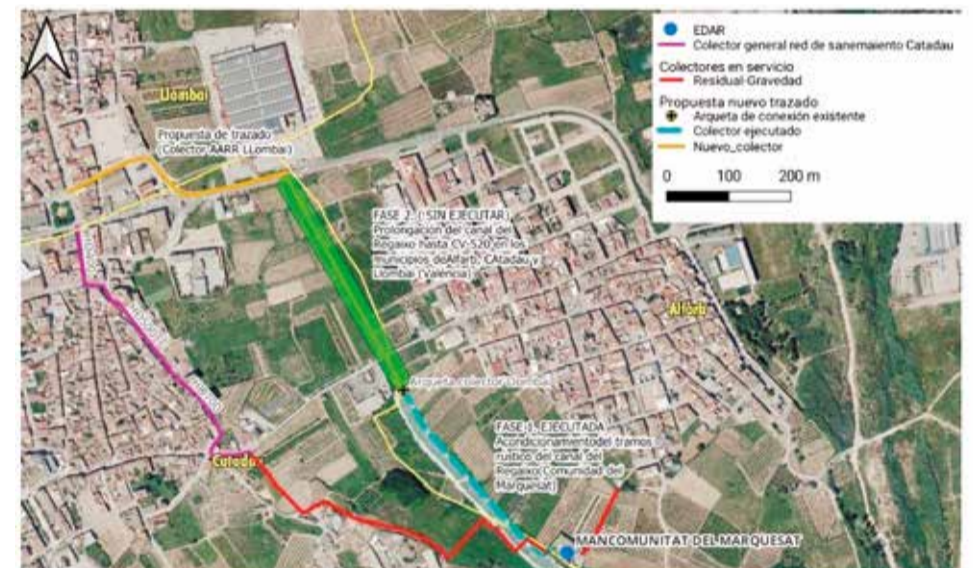
Projecte de desconexió de les aigües de Llobai de la xarxa de Catadau.