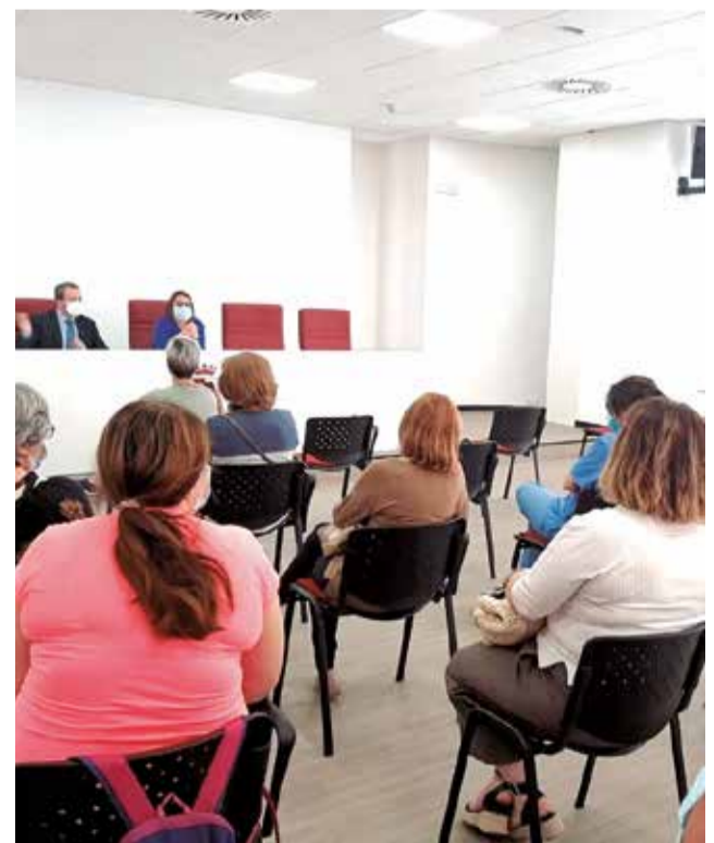
Una reunió de l'empresa EMSPA.

Actualment, EMSPA executa quatre serveis públics essencials: la neteja d'edificis i instal·lacions públiques, el manteniment de les vies públiques i edificis municipals, el servei de conserjeria en el centre municipal de formació de persones adultes i el manteniment de la lampisteria en edificis públics.