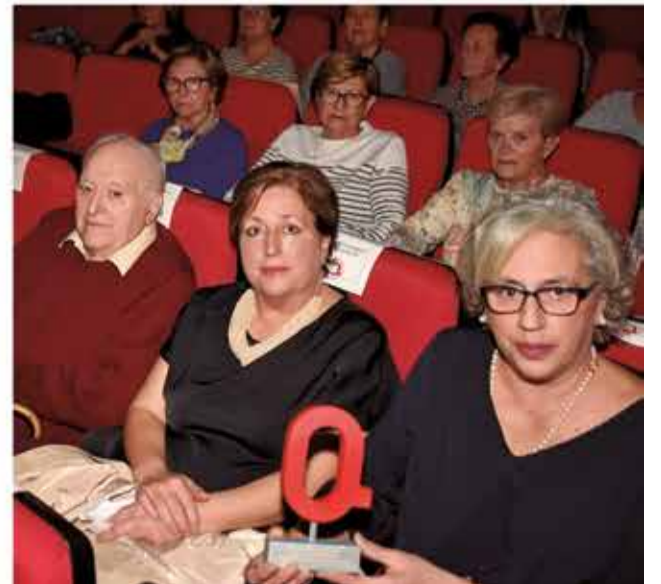
Tots els premis i premiades en la gala de Carlet.