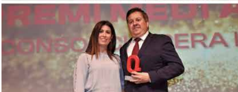
MEDI AMBIENT: Consorci Ribera i Vallidigna