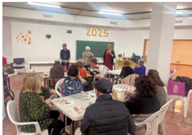
Les diferents accions del 25N a Corbera.