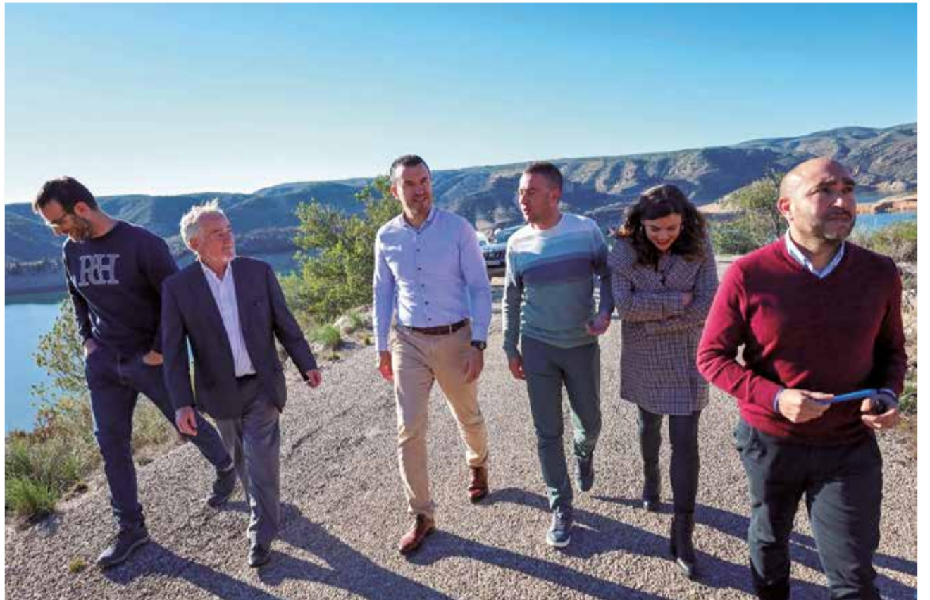
Un momento durante la visita del president de la Diputació, Vicent Mompó.

La Diputación ya ha aprobado diferentes proyectos que el municipio de la Ribera Alta ha presentado para llevar a cabo con esta inversión. Destaca la instalación de cámaras para el control de tráfico en el municipio por un valor de 48.000 euros; la compra de una barredora y de un camión ligero por 100.000 euros; y la instalación de vallas en el polideportivo municipal por 15.000 euros. Además, del