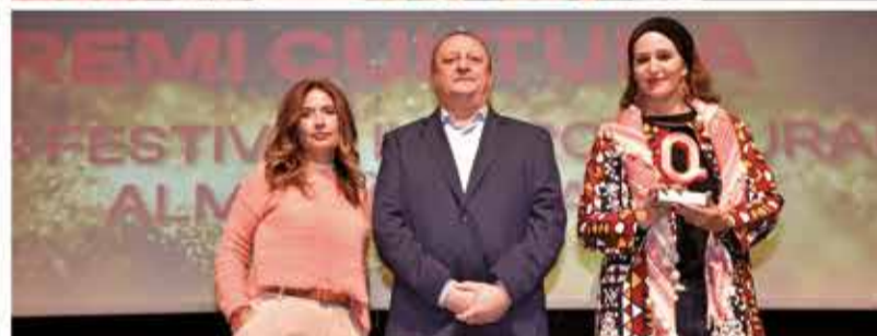
CULTURA: Primer Festival Intercultural Almus'Àfrica