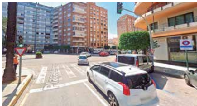
Un dels carrers d'Alzira.

on la seguretat viària, la sostenibilitat i el respecte pels vianants són prioritaris. Segons l'equip de govern, "el nostre objectiu és adaptar la ciutat a una nova realitat de mobilitat més respectuosa amb les persones i el medi ambient. Els semàfors tenen una funció en punts concrets però, en altres, poden substituir-se per passos elevats, rotondes o senyalit-