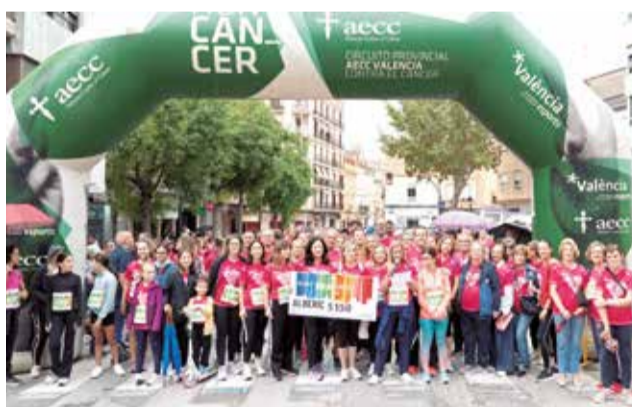
Recaptació de la Run Càncer d'Alberic.