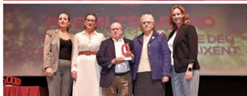
TRADICIÓ: La Troballa de la Mare de Déu d'Aigües Vives de Carcaixent