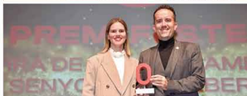
FESTES: Fira de l'Alliberament Senyorial d'Alberic