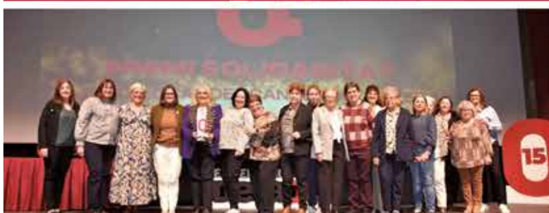
SOLIDARITAT: Junta Local del Càncer de Carlet