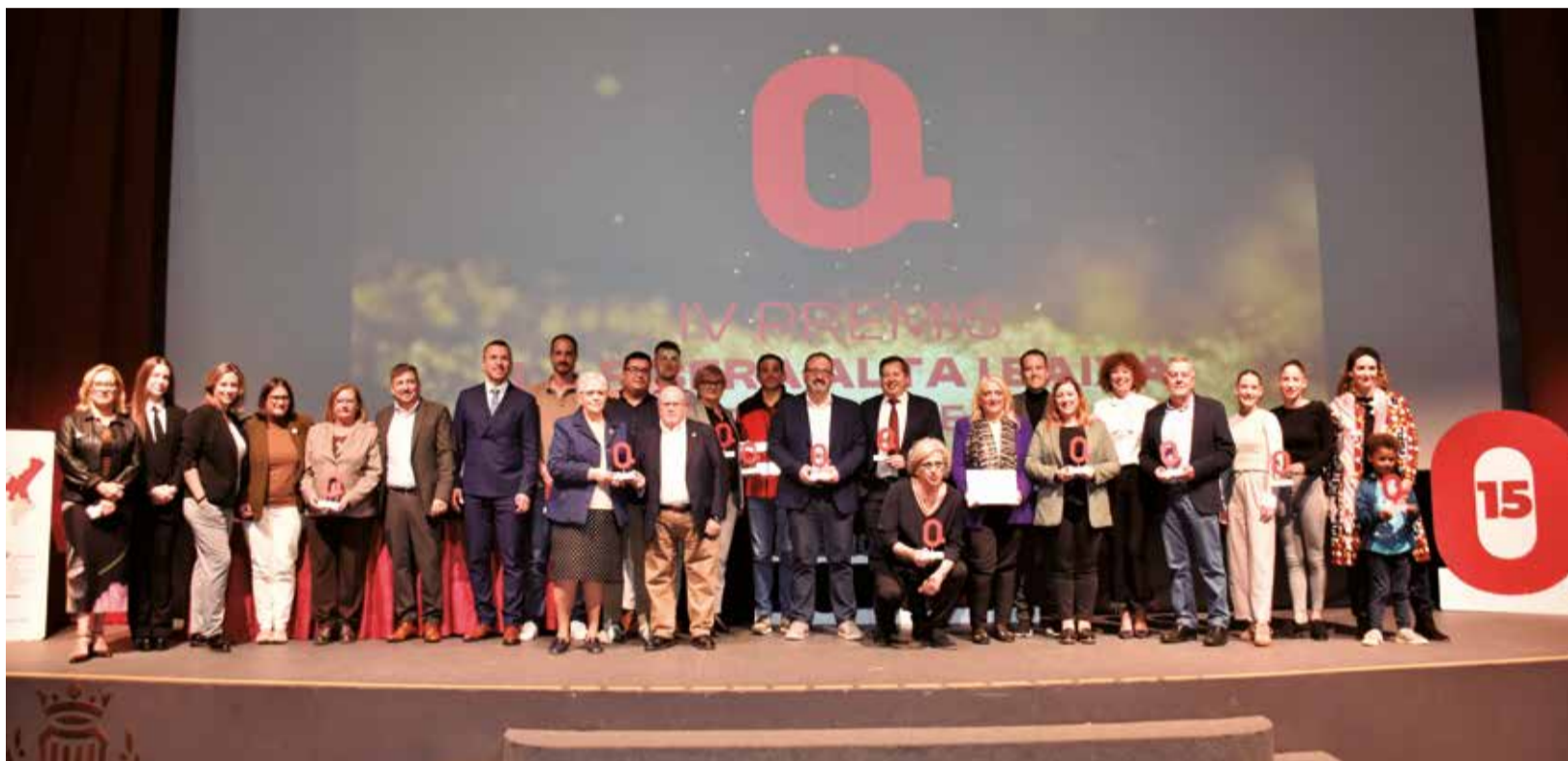
Instantània de tots els premiats després de la gala en el Teatre Giner de Carlet.

■ MÉS DE 300 PERSONES VAN ASSISTIR A LA CITA CELEBRADA AL TEATRE GINER DE CARLET EN UNA GALA PLENA D'EMOCIONS