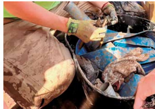
El projecte europeu RISE Resilient Communities.

Este projecte equiparà a educadors, líders comunitaris i organitzacions amb ferramentes per anticipar-se,