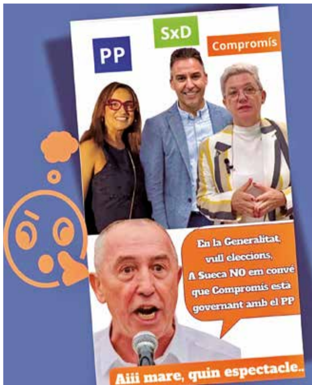
Cartel compartido por la “GentxSueca”.

Sin embargo, la petición ha generado controversia dentro y fuera del ámbito político,