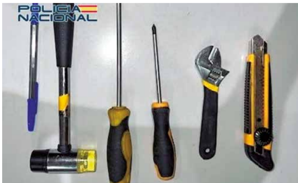
Diverses ferramentes confiscades.

tornavís, un cúter i una clau anglesa. Finalment, i després de les gestions pertinents, els agents van detindre a les tres joves com a presumptes autores d'un delict de robatori amb força. Dos de les detingudes, amb antecedents policials, han passat a disposició judicial, mentres que la menor d'edat va ser entregada a la seua progenitora després de ser sentida en exploració no sense abans ser advertida de l'obligació de compareixer davant l'autoritat judicial quan fora requerida per a això.