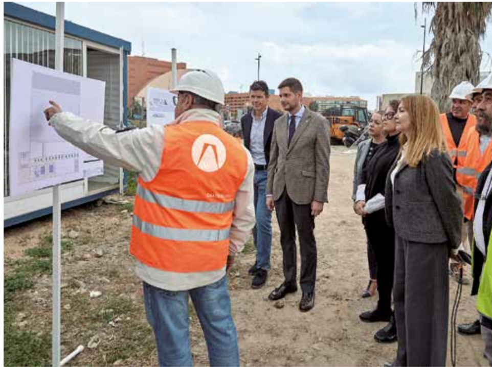
Un moment durant la visita a les obres.