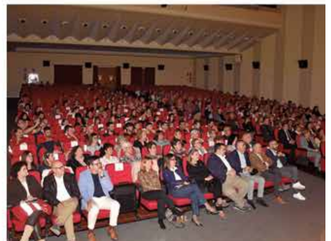
Instantànies durant la gala en el Teatre Giner de Carlet.