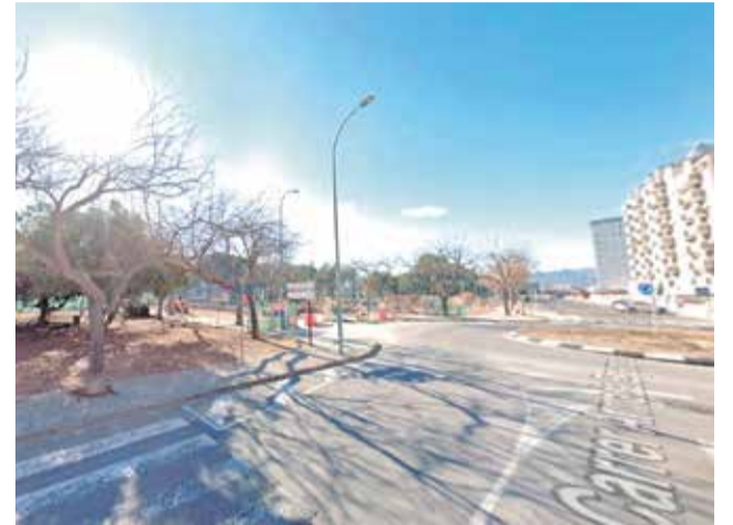
Carrer l'Horta, Rioja i Armada Espanyola.

Prieto ha recordat que el nou hotel comptarà amb 11 plantes més terrassa i que el ple municipal iniciarà demà la fase urbanística, sotmetent el Pla de Reforma Interior (PRI) a 45 dies hàbils